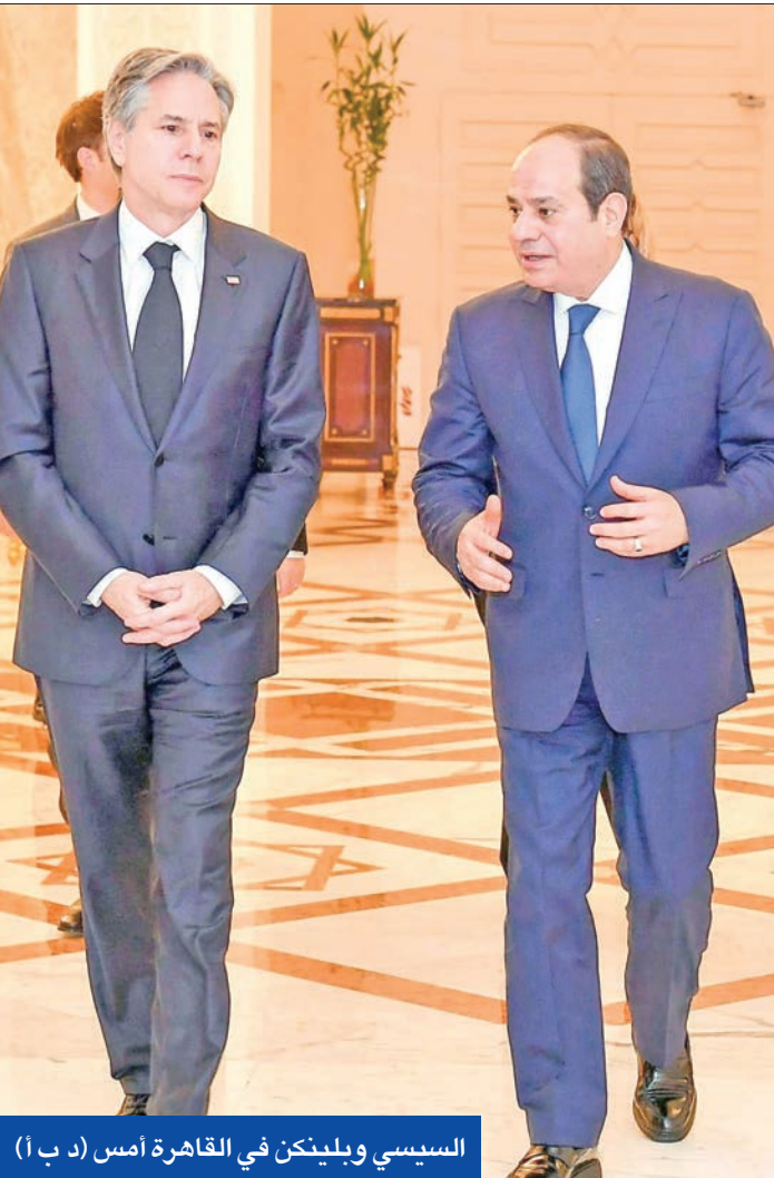
السيسي وبلينكن في القاهرة أمس

الدور الأميركي للاضطلاع بدور مؤثر لحلحلة تلك الأزمة. من ناحية، قال بليكن إن أزمة المناخ فرصة عظيمة لخلق الوظائف للمصريين، لكنها تؤكد أيضاً ضرورة إيجاد حل دبلوماسي سريع لازمة سد النهضة. وتابع: «سمعنا من الرئيس السيسي، أن قضية سد النهضة أمر وجودي لمصر، ونحن ندعم أي حل يراعي مصالح جميع الأطراف، والحياة المعيشية للمصريين والسودانيين والإثيوبيين». وتطرقت المباحثات إلى الوضع في ليبيا والسودان، إذ قال وزير الخارجية المصري، إن بلاده تعمل على تخفيف أزمة ليبيا، وشدد على أن إجراء انتخابات في هذا العام هو الطريق الوحيد للتوصل إلى حل للأزمة، عبر تمكين الشعب الليبي من اختيار قياداته، وكشف عن مناقشة الأوضاع في السودان، ودعم العملية السياسية فيه للتحول الديمقراطي. وعن ملف حقوق الإنسان، قال بليكن إنه «فيما يتعلق بحقوق الإنسان خاصة في القضايا الفردية فقد أثرتها في السابق كما أثرتها اليوم، ونحن نريد تحقيق تقدم في هذا الملف بشكل دائم، وأؤكد أن مصر حققت تقدماً في مجال الحريات الدينية وحقوق المرأة والحوار الوطني». وأضاف: «نحننا حقوق الإنسان وهو أمر نناقشه مع دول أخرى ونرحب بالخطوات المهمة لمصر لحماية الحرية الدينية وحقوق المرأة، ونرحب بعقد الحوار السياسي وإعادة تفعيل اللجنة الرئاسية، ونناقش تحقيق تقدم في مجال حقوق الإنسان وإطلاق السجناء السياسيين، والتأكد من قدرة المصريين على التعبير عن آرائهم دون عواقب».