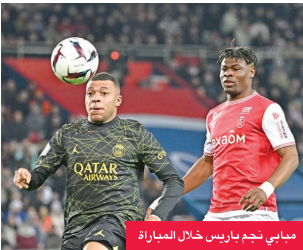
مبابي نجم باريس خلال المباراة

فشل باريس سان جرمان في استغلال تعثر ملاحقه لنس، وسار على خطاه عندما سقط بفخ التعادل في الأنفاس الأخيرة أمام ضيفه رينس 1-1، في مباراة أكملها نادي العاصمة بعشرة لاعبين، في ختام منافسات المرحلة العشرين من الدوري الفرنسي لكرة القدم، الأحد. وعقّد الضيوف الأمور على أصحاب الأرض، الذين استعصى عليهم مرمى رينس، إلا من هدف سجله البرازيلي نيمار (51).