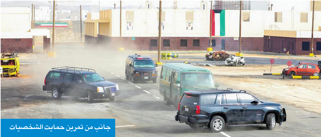
جانب من تمرين حماية الشخصيات

وتخلل سيناريو تمرين أسد الجزيرة 5 عدة فرضيات تدريبية للتعامل مع فض أحداث شغب، وحماية الشخصيات، وعزل وتطويق واقتحام مبنى وتطهيره، والكشف عن متفجرات والتخلص منها، كما شمل تدريبات عملية على كيفية التعامل مع حوادث السيارات وتجمعات المياه وإنقاذ العالقين، وتسرب غاز داخل منشأة، وتعاملت فرق إطفاء الحرس الوطني مع فرضية حدوث حريق، إضافة إلى تنفيذ رمايات دقيقة من أوضاع ثابتة ومتحركة.