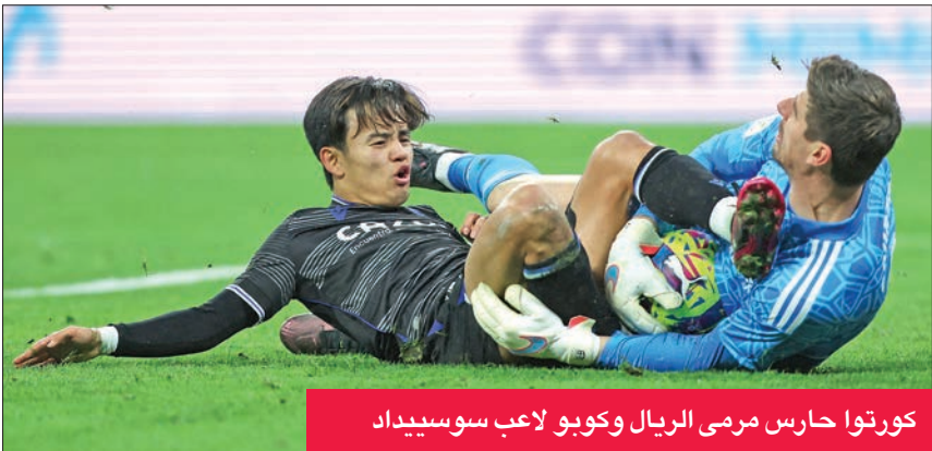
كورتوا حارس مرمى الريال وكوبو لاعب سوسبيداد

وحول دور الخائني الفرنسي أنطوان غريزمان، وقاد الفريق كوكي ريسوركسيون، داخل المستطيل الأخضر في الفوز على أوساسونا، أوضح: «هما