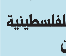
عبد الكريم الكندري

الكندري يسأل عن صفقة «الدرون» تقدم النائب د. عبد الكريم الكندري بسؤال إلى وزير الدفاع، قال في مقدمته: في ظل ظروف استقالة وزير الدفاع، وعدم وجود رئيس الأركان ونائبيه، وعدم وجود امر القوة الجوية بالأصالة، بزم التعاقد المباشر بحجم هذا المشروع الضخم والسحاس «الطائرة من دون طيار المسيّرة» (الدرون). وقال الكندري في سؤاله: ما أسماء الشركات التي وجهت لها دعوة للمشاركة؟، وهل تم التدرج في إعلان المشروع وأخذ الموافقات؟ وهل تم إجراء المناقصة العامة على مرحلة واحدة بعرضين: مالي وفني؟ أم سبقتها إجراءات التاهل المسبق حسب قانون المناقصات مادة 15؟ وعليه، هل تم الإعلان عن التاهل المسبق؟ إذا كانت الإجابة بالإيجاب، يرجى تزويدنا بنسخة منه، ومراسلات الشركات، ومخصر اجتماع لجنة الدفاع الأعلى في مناقشة الموضوع والموافقة عليه.