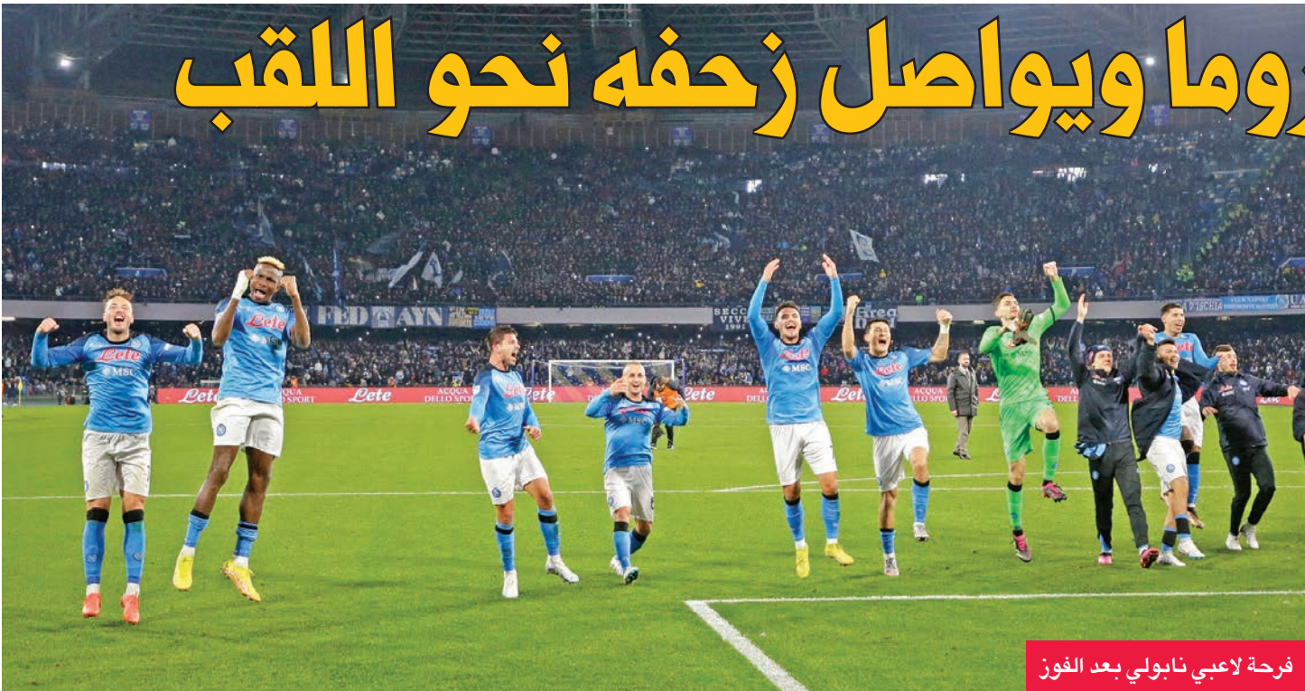
فرحة لاعبي نابولي بعد الفوز

حسم جيوفاني سيميوني فوز فريقه نابولي 2-1 على أرضه أمام روما، أمس الأول، ليقطع خطوة أخرى نحو التتويج بلقب دوري الدرجة الأولى الإيطالي لكرة القدم.