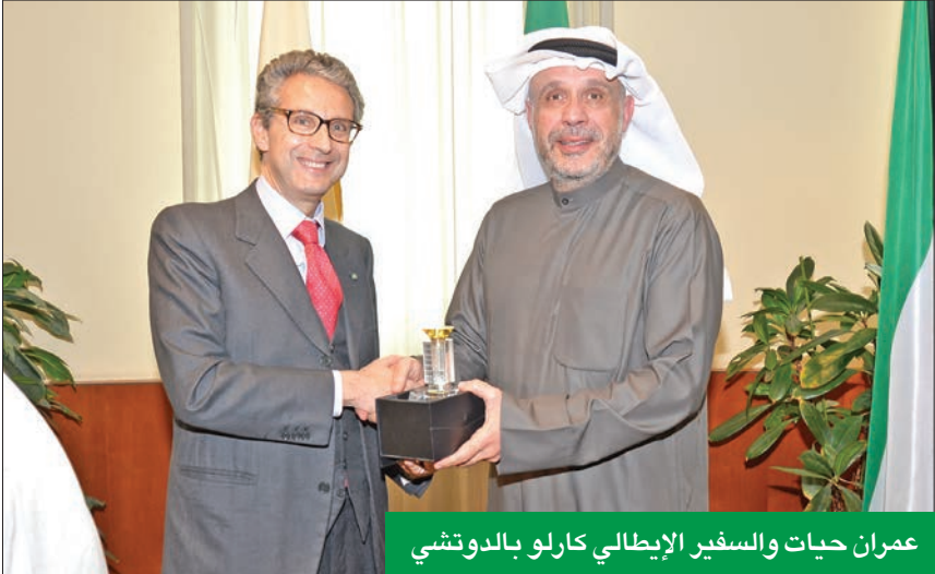
عمران حيايت والسفير الإيطالي كارلو بالدوتشي

بيئة الأعمال والاستثمار في قطاع النفط والغاز في إيطاليا. وأكد أن هناك مجالاً لتوسيع العلاقات الاقتصادية الثنائية من خلال الاستفادة من جميع العناصر المتاحة في كلا البلدين، حيث تتمتع إيطاليا بقطاعات صناعية عدة مثل صناعة السيارات والآلات الثقيلة والصناعات الهندسية والملابس والأزياء، والصناعات الغذائية والسياحة، وقطاع النفط والغاز، مغرباً عن أملة في أن تسهم هذه الاجتماعات في إقامة شركات إستراتيجية. من جانبه، أكد السفير بالدوتشي، قوة العلاقات التجارية بين البلدين، معتبراً