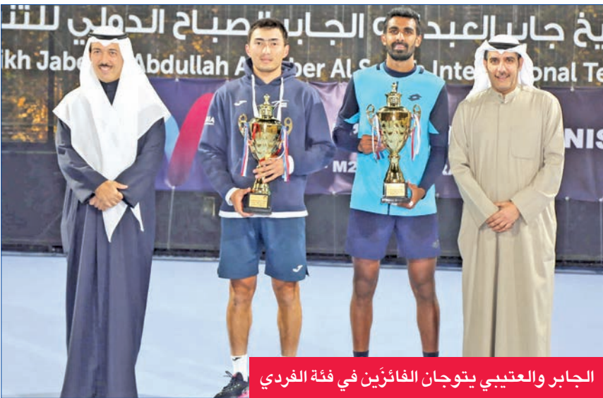
الجابر والعتيبي يتوجان الفائزين في فئة الفردي

اختتمت أمس الأول بطولة الكويت الدولية للتنس للرجال (M25 ALZAHRA) على ملاعب الاتحاد الكويتي للتنس بمجمع الشيخ جابر عبدالله الدولي للتنس، برعاية وحضور رئيس الاتحادين الكويتي والعربي للتنس الشيخ أحمد الجابر، ومشاركة 41 لاعباً من 19 دولة.