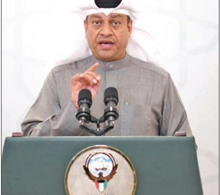
المطر متحدثاً خلال مؤتمره

السنة السابقة بعد تشكيل الحكومة؟ إذا كانت الإجابة بالإيجاب، فيرجى بيان توضيحي لكل الشواغر التي سُدت، وأسماء المتظلمين على قرارات سد الشواغر. وقال في سؤال آخر لوزير التجارة: نُشر مقال في جريدة «الجريدة» تضمن «أن تطور المجتمعات والدولة بتجديد مؤسساتها من خلال رفدها بدماء شبابية طموحة تحدث الفرق والتغيير والتطور، والدول المتقدمة تسعى إلى الاستفادة من طاقات شبابها وتمكينهم من المناصب القيادية، أما الدول المتأخرة فهي غالباً هزلة من الداخل يجلس على رأس المؤسسات فيها قياديون يتم اختيارهم عادة وفق محسوبيات، وهو الأمر الذي يهذل الطموح لدى فئة الشباب، والنتيجة الوحيدة لهذه التعيينات هي أن النهج الحكومي ثابت من حيث سوء الإدارة وعدم الحرص على تقدم الكويت، وجرها من أزمة إلى أخرى، وتكريس الفشل وتعميمه بدل الخروج منه». وعلى ضوء ذلك طلب تزويده بأسماء كل مجالس الإدارات التابعة لوزارة التجارة والصناعة والجهات التابعة لكم وأعضائها، والسيرة الذاتية لكل عضو، وشروط الاختيار -إذا وجد- حسب التخصص. وطلب تزويده بجميع الشواغر للمناصب القيادية