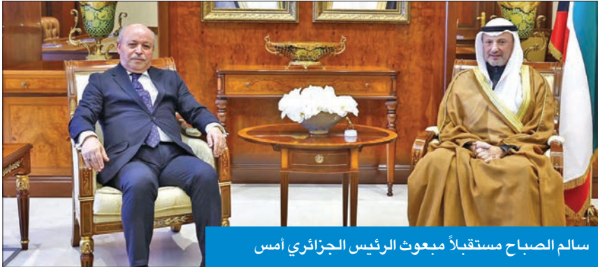
سالم الصباح مستقبلاً مبعوث الرئيس الجزائري أمس

تسلم وزير الخارجية سالم الصباح رسالة خطية موجهة إلى صاحب السمو أمير البلاد الشيخ نواف الأحمد من رئيس الجمهورية الجزائرية عبدالمجيد تبون، تتصل بالعلاقات الثنائية الوثيقة التي تربط البلدين الشقيقين، وسبل تعزيزها في كل المجالات، إضافة إلى القضايا محل الاهتمام المشترك، ومنها مخرجات القمة العربية التي عقدت في الجزائر. جاء ذلك خلال استقبال وزير الخارجية مبعوث الرئيس الجزائري المدير العام للاتصال والإعلام والتوثيق والناطق الرسمي لوزارة الشؤون الخارجية بالجمهورية الجزائرية السفير عبدالحamid عبدواي، أمس، بمناسبة زيارته الرسمية للكويت. كما تم خلال اللقاء بحث أطر تعزيز التعاون الثنائي