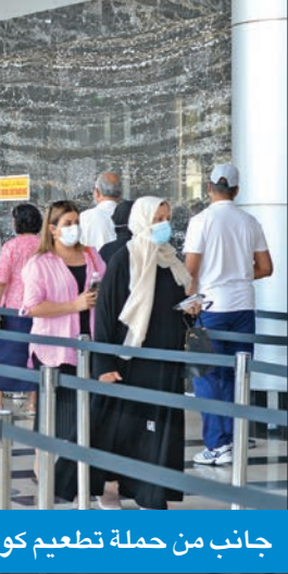
جانب من حملة تطعيم كورونا

مطلعة أن هذه الجرعة ستكون اختيارية، مبينة أنها تتكون من لقاح مزدوج يعالج كلا من فيروس «كوفيد 19» ومتحور أوميكرون الأحدث. وأضافت أن اللقاح المحدث هو مزيج من سلالتين، تعرف أيضاً باسم الجرعات «ثنائية التكافؤ»، ويحتوي على كل من تركيبة اللقاح الأصلية والحماية ضد المتحور الأصلي أوميكرون، مشيرة إلى أن هذا اللقاح المُحسّن يوفر حماية