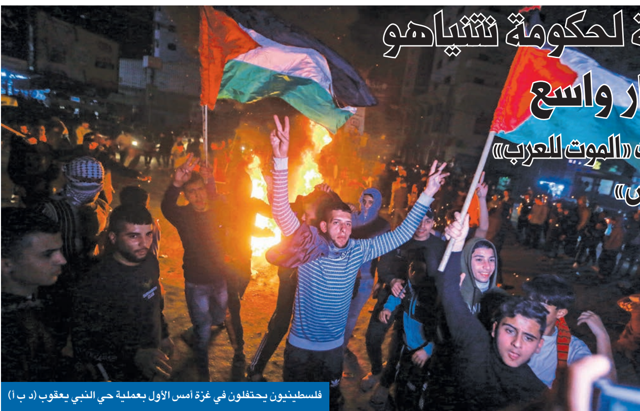
فلسطينيون يحتفلون في غزة أمس الأول بعملية حي النبي يعقوب