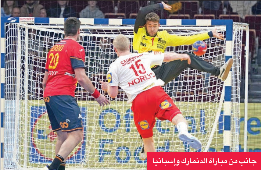
جانب من مباراة الدنمارك وإسبانيا

لمعانة اللقب الغائب عن خزائنه منذ نسخة 25 التي استضافها عام 2017 في مباراة من المتوقع أن تكون صعبة على الطرفين لتقارب مستواهما وطموحهما المشترك في حسم اللقب.