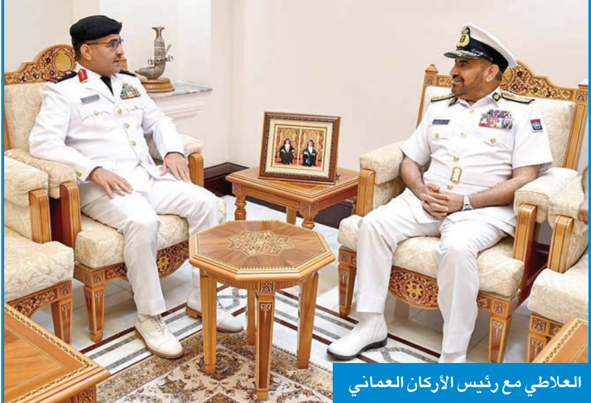
العلاطي مع رئيس الأركان العماني

القوات البحرية السلطانية العمانية، اللواء الركن البحري سيف الرحبي، وشهدت اللقاءات تبادل الأحاديث الودية وبحث أهم المواضيع ذات الاهتمام المشترك، وسبل تعزيز أوجه التعاون العسكري بين البلدين الشقيقين. وزار أمر القوة البحرية ووزير الدفاع الوطني والكلية التقنية العسكرية، وأشاد بما شاهده خلال الزيارة من مستوى عال من المهنية والتدريب الحديث.