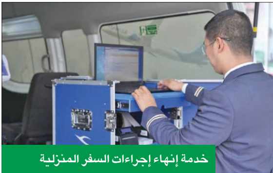
خدمة إنهاء إجراءات السفر المنزلية

أكثر لعملائها الكرام، حيث تقوم الشركة دورياً بإطلاق قوائم رحلات الطائرة الأزرق حول العالم، كما تسعى بشكل دؤوب إلى اختيار واعداد قوائم تتناسب مع كل أذواق الشرائح من ركابها الأعزاء بإشراف وأيدي أشر الطهاة من الكوادر الوطنية.