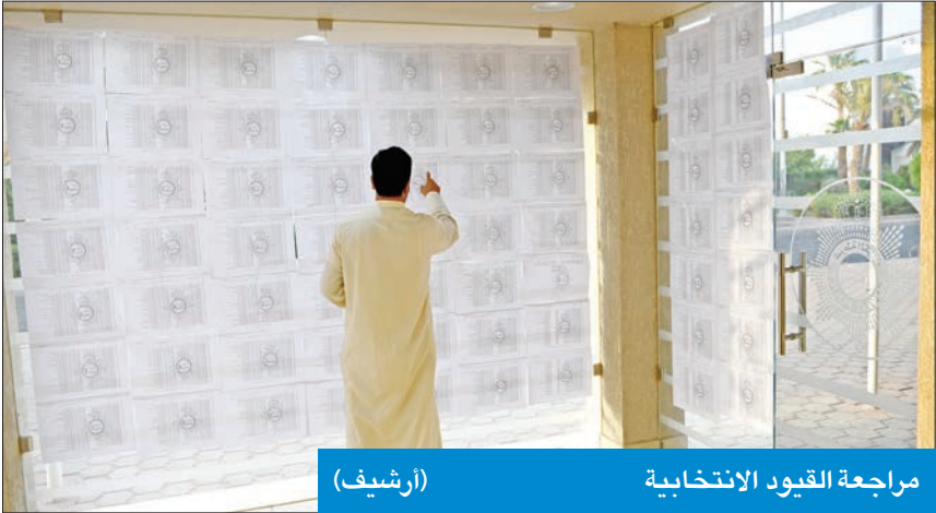
مراجعة القيود الانتخابية (أرشيف)