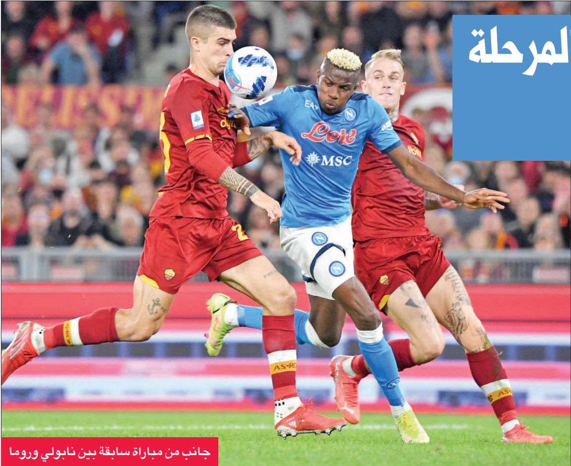
جانب من مباراة سابقة بين نابولي وروما

كشفت تقارير صحافية في بلجيكا، أن دومينيكو تيديسكو يعد من بين أهم المرشحين لتولي تدريب المنتخب البلجيكي لكرة القدم. جاء ذلك وفقاً لما ذكرته صحيفة هت لاست نيوز، التي أوضحت أن المدرب السابق لنادي لايبزيغ الألماني نال إعجاب فريق العمل المكون من أربعة أشخاص والمنوط به البحث عن خليفة للمدرب روبرتو مارتينين. وتابعت الصحيفة أن كل الدلائل تشير إلى تعيين فرانك فيركاوترين (66 عاماً) مديراً جديدا للشؤون التقنية للمنتخب وجمع خبرته مع تيديسكو (37 عاماً).