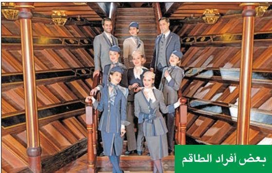
بعض أفراد الطاقم