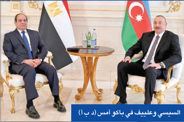
السيبي وعلييف في باكو أمس