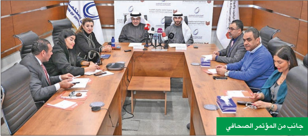
جانب من المؤتمر الصحفي

وبيّن أن ثمرة التعاون مع اتحاد الشركات الاستثمارية سينتج عنه الإعلان عن منتدى اقتصادي قانوني دولي، وسيكون بمنزلة «غلوبال ديوان العالمية» ومقرها فرنسا، بالشراكة مع اتحاد الشركات الاستثمارية وغرفة