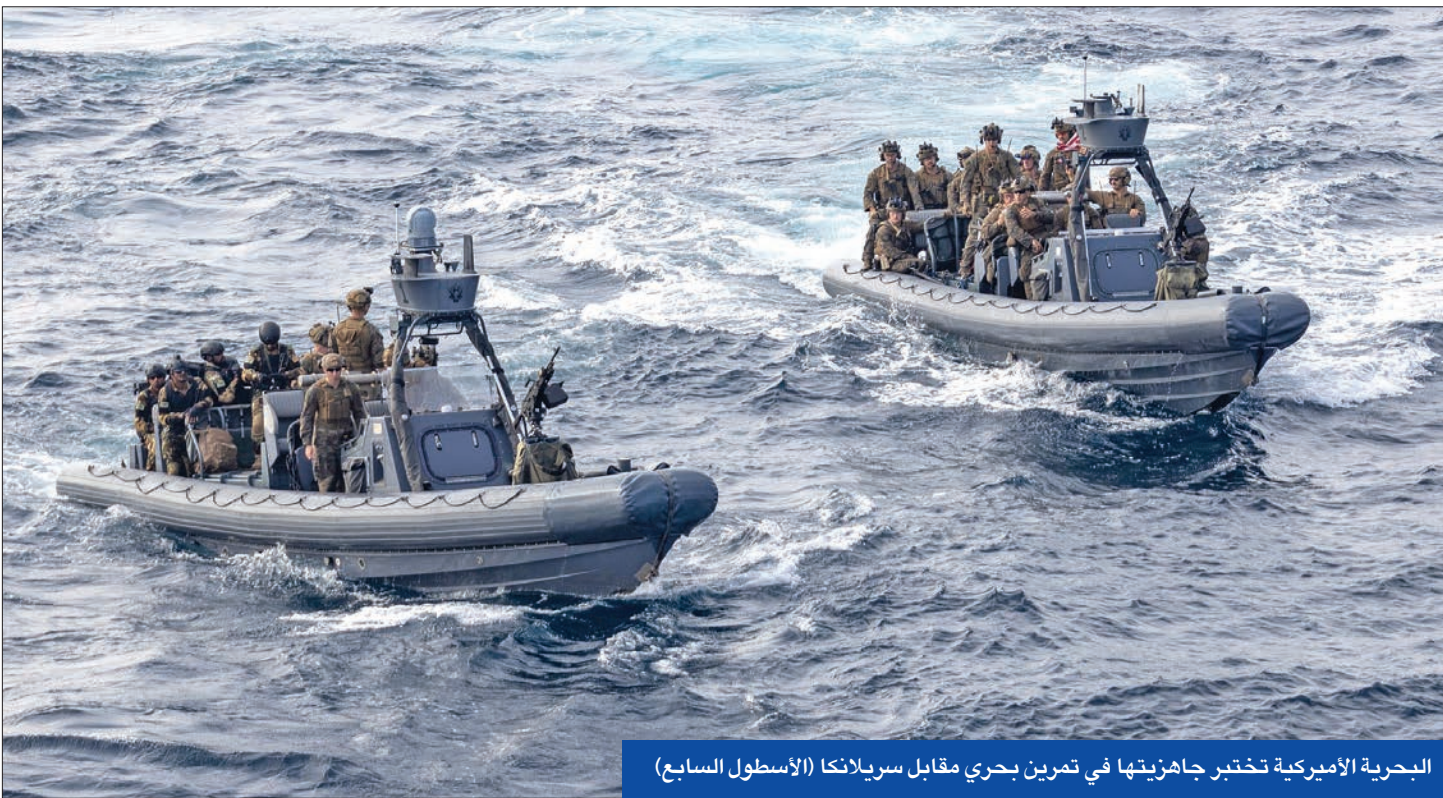
البحرية الأميركية تختبر جاهزيتها في تمرين بحري مقابل سريلانكا (الأسطول السابع)

الجيش الأميركي ليس جاهزاً لمواجهة «التنين الآسيوي»... وحرب أوكرانيا أفرغت مخازن ذخائره