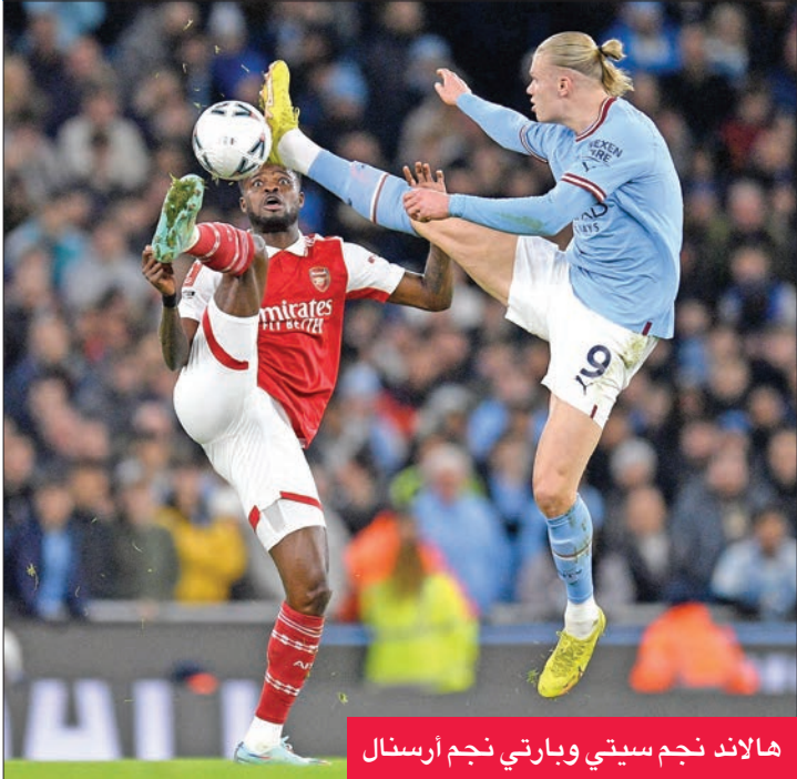
هالاند نجم سيتي وبارتي نجم أرسنال

وتلقى سيتي ضربة موجعة بإصابة قلب دفاعه جون ستونز.