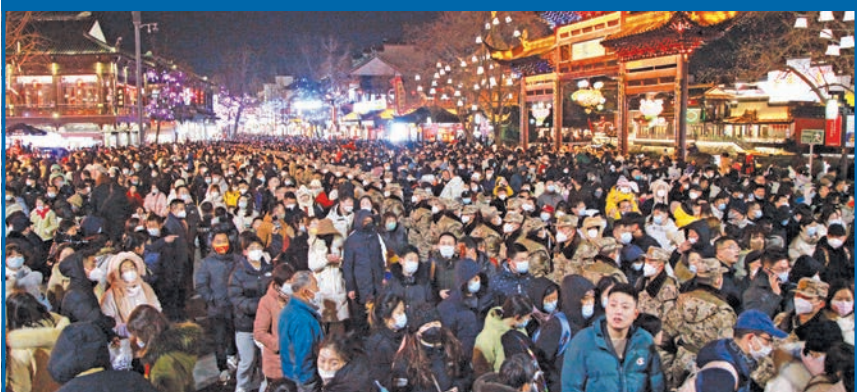
صينيون يحتفلون برأس السنة الصينية في نانجينغ قبل أيام (ا ف ب) 17+

جنرال أميركي يرجح حرباً مع الصين في 2025