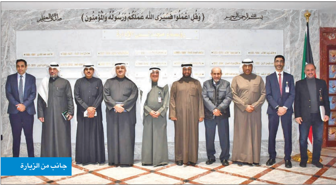
جانب من الزيارة

في مجال آخر، بحث وزير الصحة أوجه التعاون الصحي المشترك في علاج الكثير من أمراض تخصصات الأطفال، وأهمها علاجات سرطان الأطفال، مع وفد من مستشفى غريت أورموند ستريت البريطاني، والذي يعد جزءاً من منظمة الخدمات الصحية الوطنية بالمملكة المتحدة.