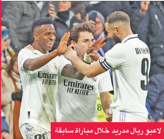
لاعبو ريال مدريد خلال مباراة سابقة

في ملعب السادار أمام أوساسونا. ويدخل أتلتيكو المواجهة بمعنويات مهزوزة، بعدما ودّع بطولة كأس ملك إسبانيا بخسارته أمام ريال مدريد 2-3.