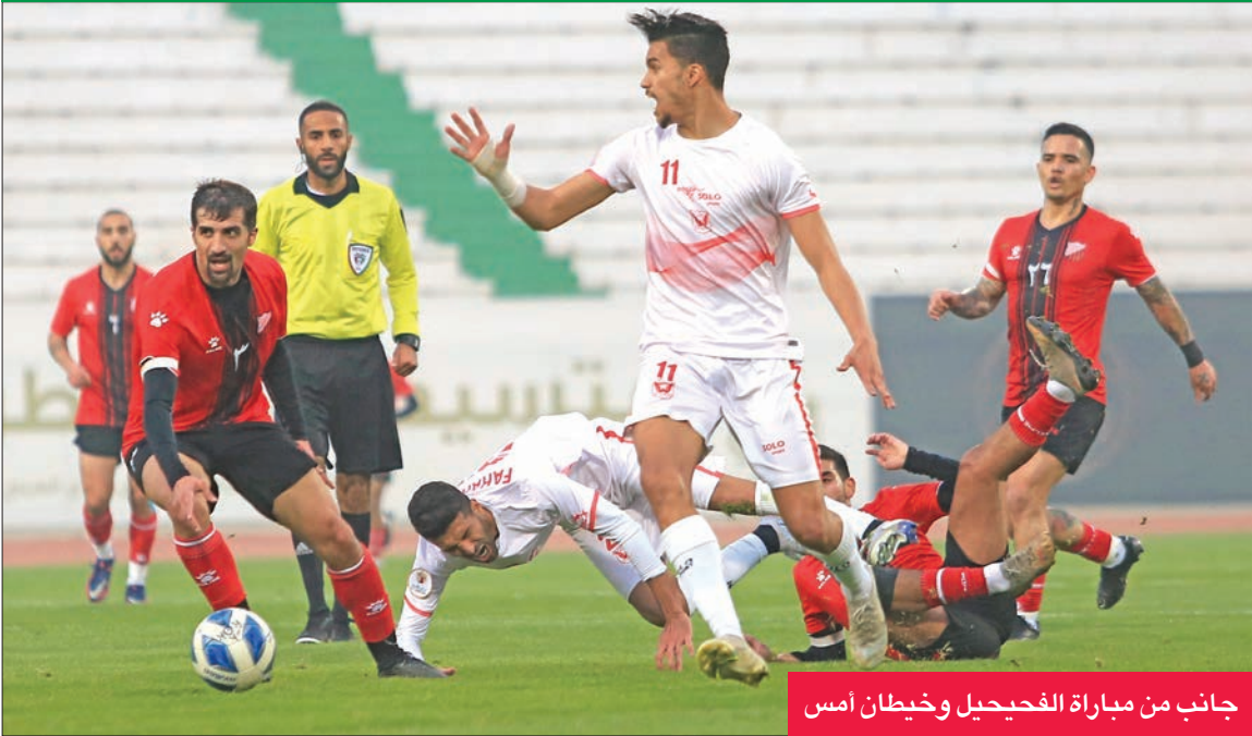
جانب من مباراة الفحيحيل وخيطان أمس