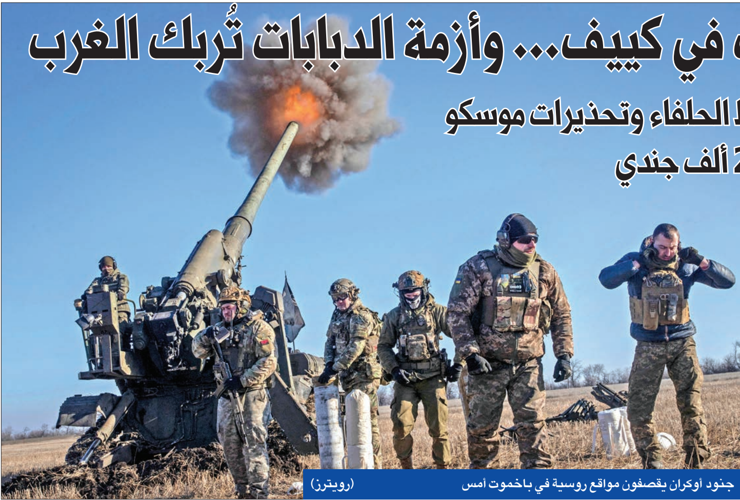
جنود أوكران يقصفون مواقع روسية في باخموت أمس

شهدت كيف حملة إقالات واستقالات واسعة في مؤشر على توتر سياسي داخلي كان مكتوماً منذ بدء الغزو الروسي، في حين لا تزال قضية إرسال دبابات إلى أوكرانيا تُربك الحلفاء، في وقت تجد برلين نفسها في هذه الأزمة عالقاً بين ضغوط الحلفاء الغربيين وتحذيرات موسكو.