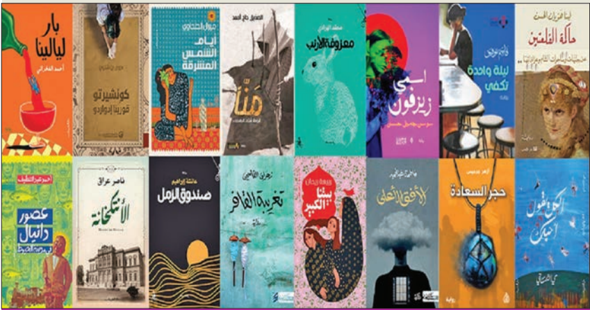
أغلفة الأعمال المرشحة

مدينة الخيوط» لأحمد عبد الطيف من مصر عن «دار العين»، 13 - «الانتكاسة» لناصر عراق من مصر عن «دار الشروق»، 14 - «بار ليالينا» لأحمد الفخراي من مصر عن «دار الشروق»، 15 - «تغريبة القافر» لزهرا القاسمي من عمان عن «دار رشم»، 16 - «معزوفة الأرنب» لمحمد الهادي من المغرب عن «منشورات المتوسط»،