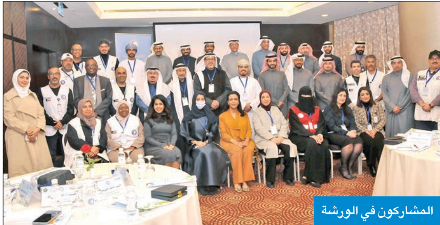
المشاركون في الورشة

الحساوي: ظاهرة لها سليات بالغة الخطورة على كل أشكال الحياة