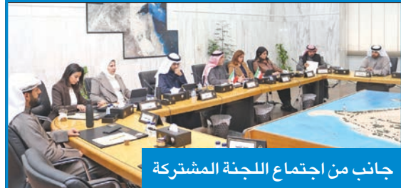
جانب من اجتماع اللجنة المشتركة