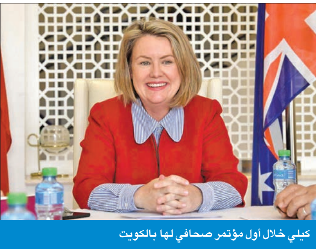
كلي خلال أول مؤتمر صحفي لها بالكويت

أستراليا والكويت، على المستويين الحكومي والوزاري، لافتة إلى أنه «مع اقترابنا من الذكرى الـ 50 لتأسيس العلاقات الثنائية بين أستراليا والكويت، والتي سنحتفل بها عام 2024، فإن المزيد من الاجتماعات الشخصية سيساعد في تعزيز الفرص الموجودة بالفعل لبناء العلاقات بين بلدينا».