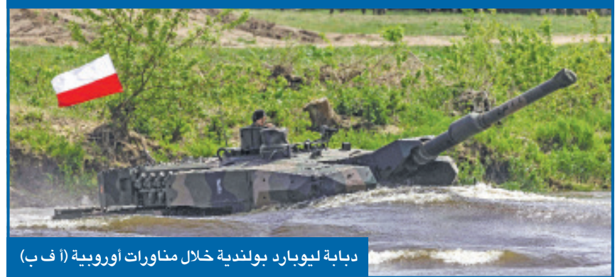
دبابة ليوبارد بولندية خلال مناورات أوروبية