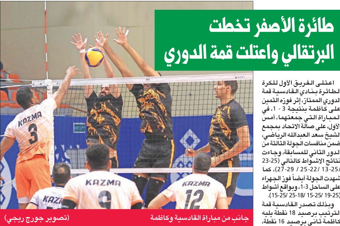
جانب من مباراة القادسية وكازمة

سبيدا وجوانط الصد الثنائية واستمر ذلك في الشوط الرابع، لكن عدم الانضباط الدفاعي وكثرة الأخطاء في النقاط الأخيرة منح القادسية الفوز بالشوط والقاء.