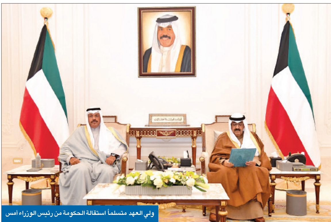
ولي العهد متسلماً استقالة الحكومة من رئيس الوزراء أمس

عالية الخالد: على أحمد النواف إذا أعيد تكليفه اختيار فريق مُلم بمشاكل الكويت