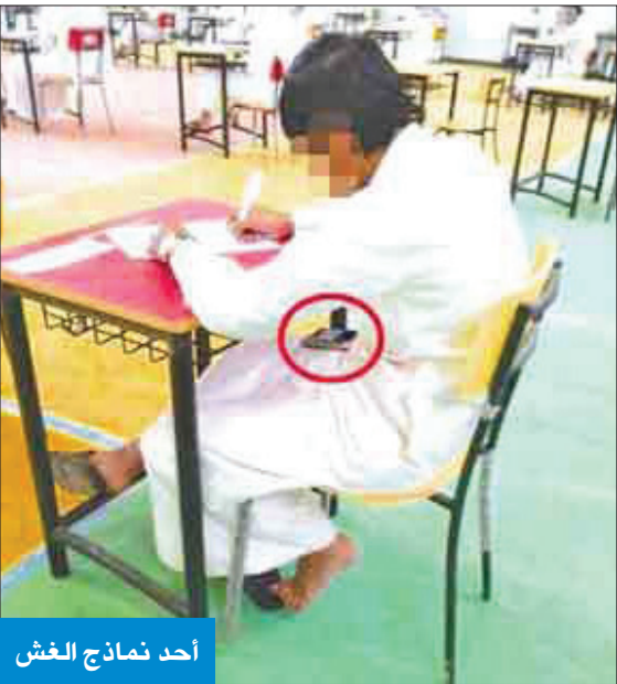
أحد نماذج الغش

وأكد الحمود لـ «الجريدة» أن الطلبة الذين وردت أسمائهم أو أرقام هواتفهم في «قروبات الغش» التي ضُبطت أخيراً يمكن مساءلتهم قانوناً عن جرم الغش، مشيراً إلى أن الغش لا يسقط بالتقادم، وبالتالي، فإن من تمّ التيقن من ممارسته الغش حتى في سنوات ماضية يمكن وقال إن الجهات المختصة يمكنها محاسبة الطلبة وفق