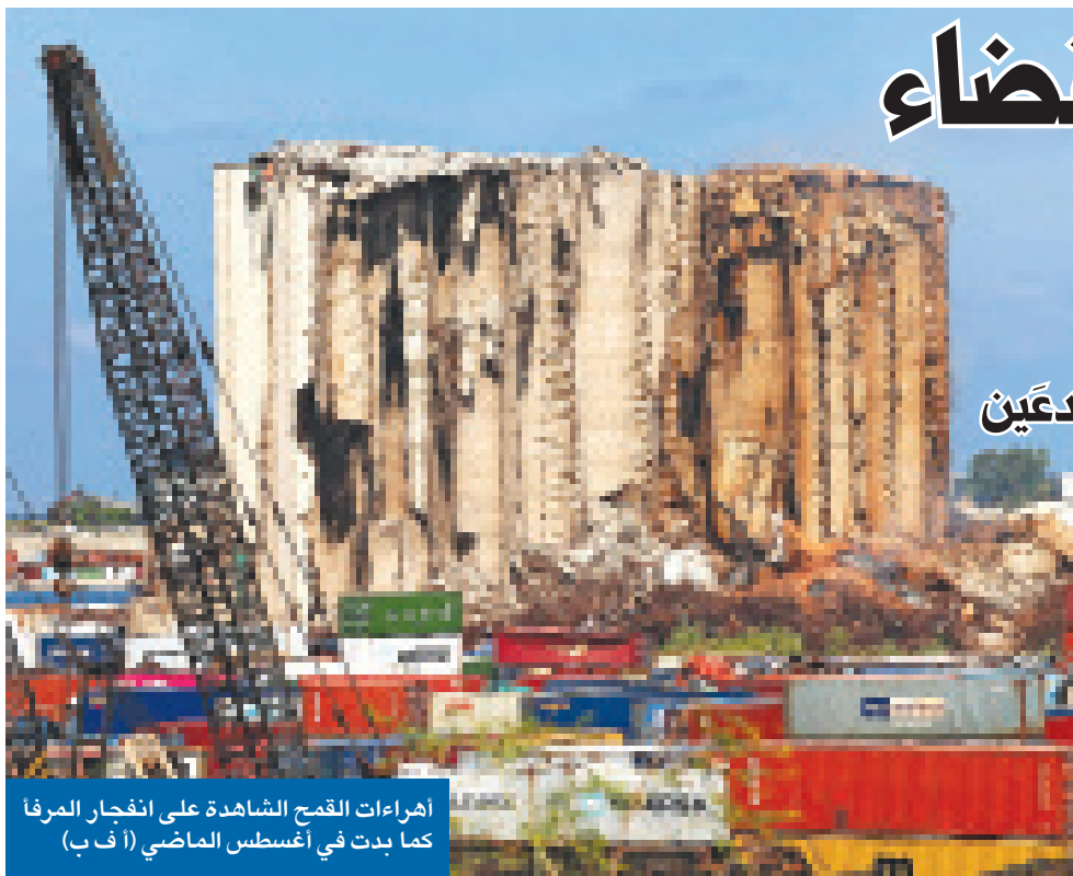
أهراءات القمح الشاهدة على انفجار المرفأ كما بدت في أغسطس الماضي

علمت «الجزيرة»، من مصادرها، أن وزارة الخارجية خاطبت وزارة الشؤون الاجتماعية رسمياً وطلبت إليها تجهيز ردود وأفية على استفسارات اللجنة الدولية لحقوق الإنسان، الخاصة بمنظمات المجتمع المدني المشهورة في الكويت، قبل حلول 30 الجاري. ووفقاً للمصادر، ستضفن «الخارجية» ردود «الشؤون» في تقرير الكويت الدوري الرابع الخاص بتقييمها وفق بنود العهد الدولي للحقوق المدنية والسياسية للجنة، موضحة أن «الخارجية» شددت على «الشؤون» بضرورة تقديم معلومات وافية حول عدد طلبات ترخيص الجمعيات الجديدة التي وردت إليها، وإجمالي ما رُفض منها، أو لم يبت فيه خلال الفترة المشمولة بالتقرير. 03