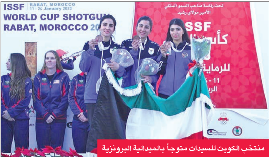
منتخب الكويت للسيدات متوجاً بالميدالية البرونزية

على صعيد العالم، وهي درجة هدف فريقه الأول، بعدما عاد للمباريات بعد غياب طويل بسبب الإيقاف.