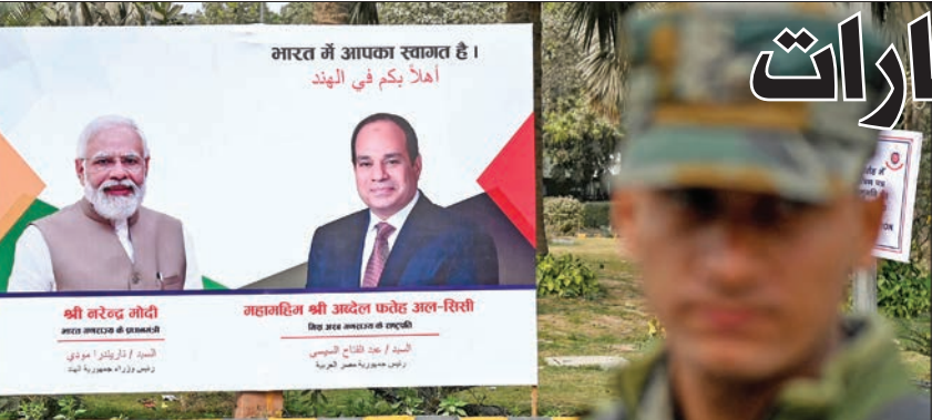
صورة للسياسي ورئيس حكومة الهند ناريندرا مودي في نيودلهي

وفي هذا السياق، تتجه مصر وروسيا إلى إقرار أليات جديدة للتبادل التجاري تسمح باستخدام العملات الوطنية في المعاملات التجارية المشتركة بعيداً عن هيمنة الدولار، في خطوة تعزز المساعي المصرية لتخفيف الضغط عن الدولار الشحيح في السوق المصري، ويسمح لها بتوفير بند رئيس من الواردات، إذ تعد مصر أكبر دولة مستوردة للقمح الروسي، الذي يشكل نحو 50 بالمئة من وارداتها من القمح. ويعول الجانب الروسي على مثل هذه الخطوات في ظل العقوبات الغربية بسبب الحرب الروسية- الأوكرانية. وقالت نائبة رئيسة الحكومة الروسية فيكتوريا