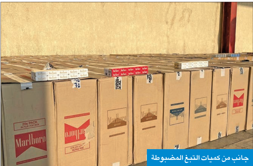
جانب من كميات التبغ المضبوطة

الأواني، وكل كرتونة تحتوي على 50 كرز سجائر، بما يساوي 38.401 كرز متنوعة.