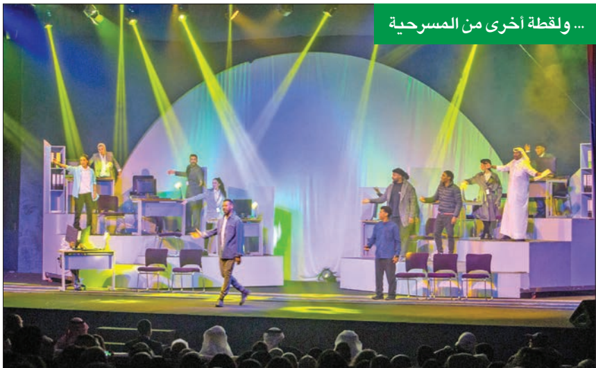
... ولقطة أخرى من المسرحية