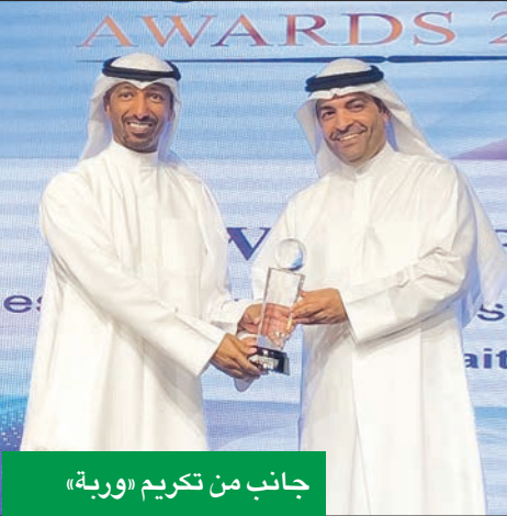
جانب من تكريم «وربة»

أبرزها «الخردة»، وهي طريقة لتحويل جميع الإفلاس المتوافرة في حسابك يومياً بشكل مباشر، إضافة إلى التحويل الآلي، وخيارات التعبئة وعدة طرق أخرى.