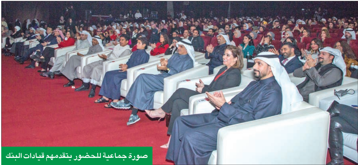
صورة جماعية للحضور يتقدمهم قيادات البنك

البنك أعلن الفائز بـ 1.5 مليون دينار عقب العرض الأول لمسرحية «تم الإيداع»