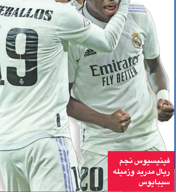
فينيسوس نجم ريال مدريد وزميله سيبايوس

وبخلاف ريال، يمر برشلونة بمرحلة رابعة من ناحية النتائج، إذ بعد فوزه بكأس السوبر عقب أداء رائع من لوبيز وسيطه الشاب غافي ومهاجمه الجديد الهولندي روبرت ليفاندوفسكي، سحق أتلتيكو سبتة من الدرجة الثالثة بخماسية نظيفة في ثمن نهائي الكأس.