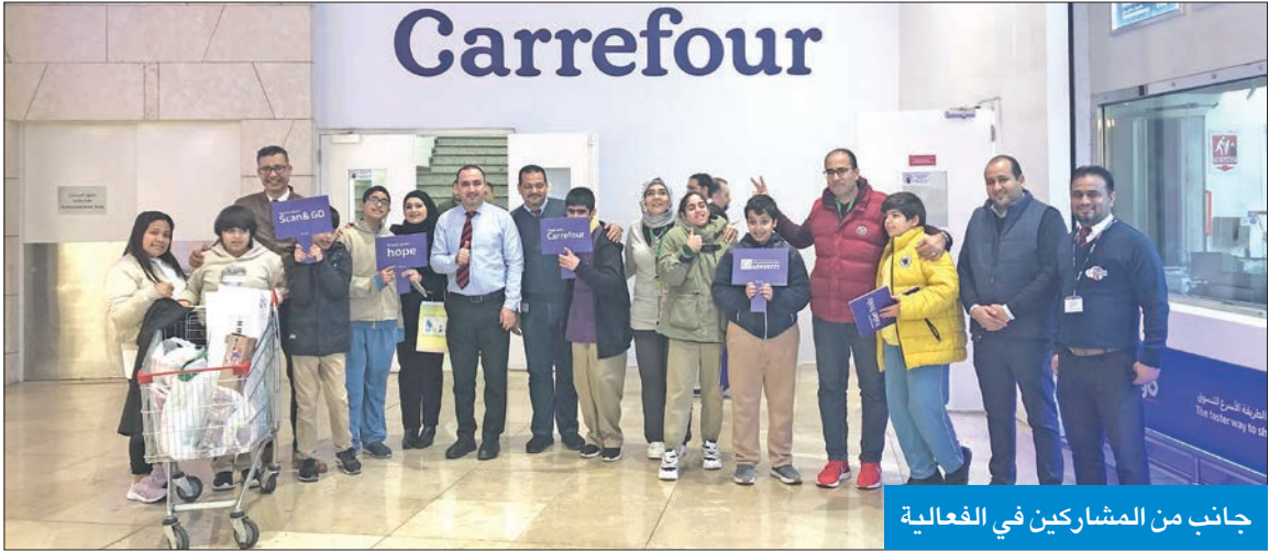
جانب من المشاركين في الفعالية

استضافت «كارفور» التي تملكها وتديرها شركة ماجد الفطيم في الكويت، طلاب مدرسة «هوب» من ذوي الاحتياجات الخاصة، يوم الخميس 19 يناير في «يوم المتدرب»، عبر دعوتهم لزيارة فروعها، والمشاركة في فعالية تهدف إلى بناء وصقل مهاراتهم وتعزيز الثقة بالنفس. يهدف «يوم المتدرب»، الذي استضافته «كارفور» بفرعها في «مول 360»، إلى تأكيد التزامها بالمواهب والتنوع. وساهم البرنامج الفريد من نوعه في تعزيز معرفة المشاركين بقطاع البيع بالتجزئة، والفرص المهنية والمهارات اللازمة لتحقيق النجاح. وقال جان عبدالساتر، رئيس العمليات التجارية والتشغيلية في «كارفور الكويت»، لدى «ماجد الفطيم للتجزئة»: «تبدأ مسيرة تحقيق رفاهية المجتمعات من خلال الاعتناء وورعاية كل فرد، وهذه الحقيقة تشكل مصدر إلهام لنا في عملنا اليومي في كارفور. لقد أظهر طلاب مدرسة هوب أداء متميزاً، الأمر الذي يشكل دالة واضحة على أنه رغم التحديات التي قد نواجهها، فإن لكل منا دوراً مهماً يلعبه في المجتمع. أشكر مدرسة هوب على تعاونها، إضافة إلى الزملاء في كارفور، الذين عبّروا عن شغفنا في العمل ونهجنا الشامل في