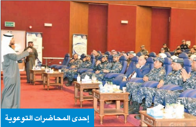
إحدى المحاضرات التوعوية

اختتم الأسبوع التوعوي للوقاية من المخدرات، الذي أقيم في معسكر قوات الأمن الخاصة برعاية الوكيل المساعد لقطاع الأمن الخاص والمؤسسات الإصلاحية، اللواء عبدالله سفاح الملا، من 15 إلى 19 الجاري. وتضمن الأسبوع التوعوي محاضرات تثقيفية وإرشادية عن خطورة المخدرات والمؤثرات العقلية والمواد المستحذثة وأسباب التعاطي والآثار السلبية الناجمة عن التعاطي على الفرد والمجتمع. ويأتي هذا الأسبوع تنفيذاً لتوجيهات مجلس الوزراء والقيادة العليا لوزارة الداخلية بإطلاق حملات توعية مستمرة عن مكافحة المواد المخدرة وتحسين أفراد المجتمع وشبابه من هذه الآفة المدمرة.