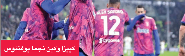
كيززا وكين نجما يوفنتوس

باراتشي، الآن في توتنهام الإنكليزي، 30 شهراً، بعد أدلة جديدة من محاكمة جنائية منفصلة في الشؤون المالية للنادي. وفي بقية مباريات اليوم يلعب روما مع سبليتسا، وسمبدوريا مع أودينزي، ومونزا مع ساسولو.