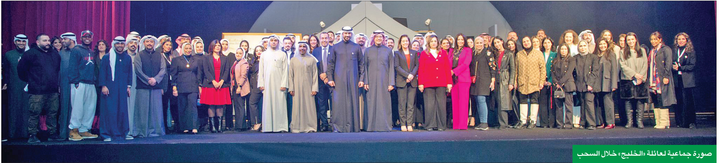
صورة جماعية لعائلة «الخليج» خلال السحب

لعملاء الدانة الحاليين من عام 2021 (من 1 يناير إلى 31 ديسمبر 2021) إلى سحوبات عام 2022، وفقاً للشروط والأحكام. كما يوفر حساب مليونير الدانة العديد من الخدمات المتميزة لعملائه منها خدمة «بطاقة الدانة للإيداع الحصري» التي تمنح عملاء الدانة حرية إيداع النقود في أي وقت يناسبهم، إضافة إلى خدمة «الحاسبة» المتاحة عبر موقع البنك الإلكتروني وتطبيق الهواتف الذكية، والتي تمكن عملاء الدانة من احتساب فرصهم للفوز في سحوبات الدانة الشهرية وربيع السنوية والسنوية. وللمشاركة في سحوبات الدانة ربع السنوية والسنوية المقبلة هذا العام، يتعين على العملاء الاحتفاظ بالرصيد المطلوب. ويمكن للعملاء زيارة أحد فروع بنك الخليج، أو التحويل المباشر عن طريق الخدمة المصرفية عبر الإنترنت، كذلك بإمكان العملاء استخدام خدمة الـ «واتس أب» على الرقم 1805805 للاستفسار والتواصل الفوري مع ممثلي بنك الخليج، أو الاتصال بمركز خدمة العملاء على نفس الرقم للحصول على المساعدة. ويمكنهم أيضاً زيارة الموقع الإلكتروني لمعرفة المزيد عن الحساب وعن الفائزين.