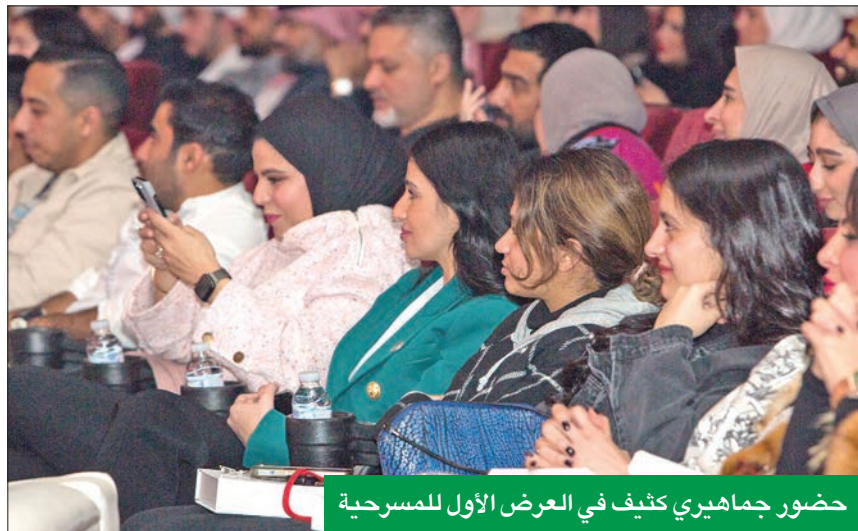
حضور جماهيري كثيف في العرض الأول للمسرحية

حرصاً على اكتمال الصورة، وترسيخاً لعادة التوفير في المجتمع، تم توزيع حصصاً على كراسي الحضور الذين تجاوز عددهم 600 شخص في العرض الأول لتشجيع الأطفال على بدء التوفير تحت شعار «رحلة التوفير تبدأ بدينار».