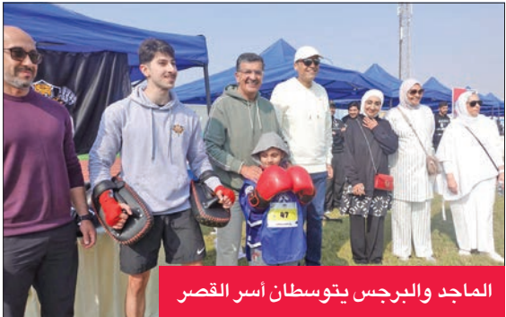
الماجد والبرجس يتوسطان أسر القصر

نظمت إدارة الهيئة العامة لشؤون القصر أمس السبت يوماً رياضياً بمشاركة المشمولين برعايتها وأسرهـم، وذلك في مضمار أحمد سليمان الرشدان لألعاب القوى بمنطقة كیفان، تحت رعاية وحضور وزير العدل وزير الأوقاف والشؤون الإسلامية وزير الدولة لشؤون تعزيز النزاهة رئيس مجلس إدارة الهيئة عبدالعزیز الماجد.