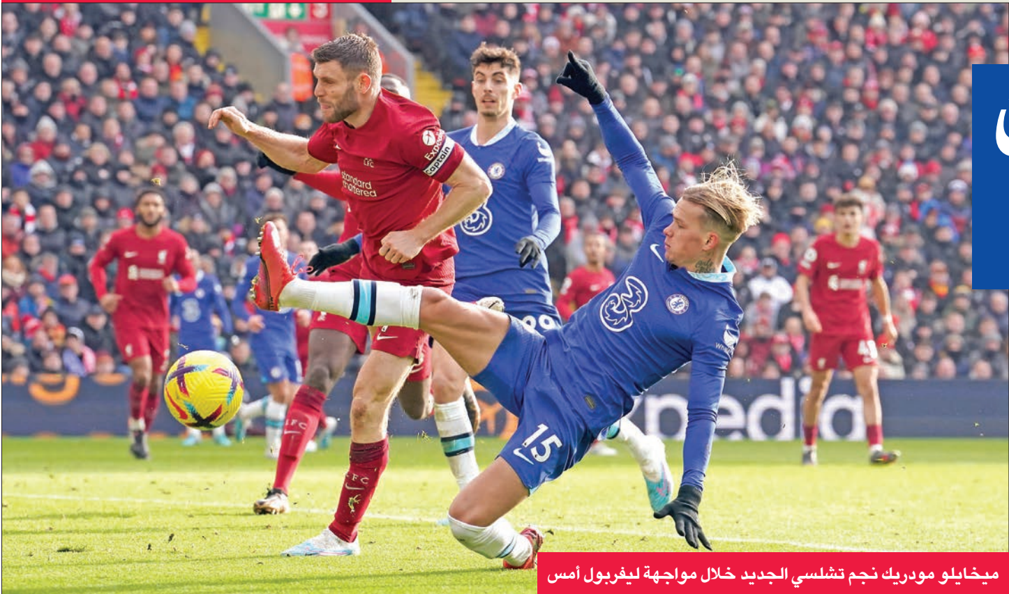
ميخائيل مودريك نجم تشلسي الجديد خلال مواجهة ليفربول أمس