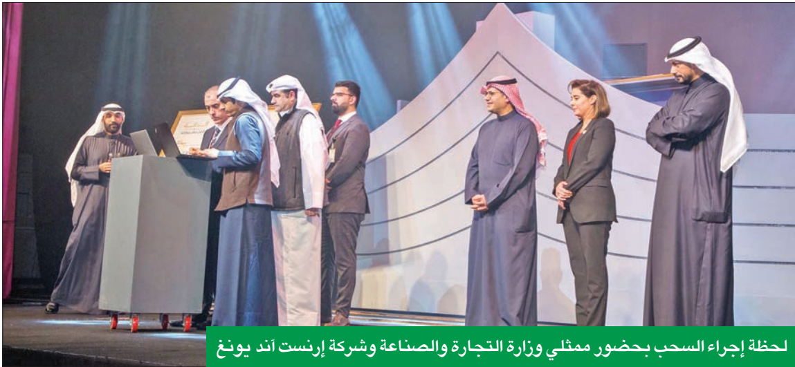
لحظة إجراء السحب بحضور ممثلي وزارة التجارة والصناعة وشركة إرنست أند يونغ

عن المعتاد في إعلان مليونير الدانة، الأمر الذي يعكس حرص البنك على ترسيخ مبادئ الاستدامة في المجتمع، ومواكبة توجهات بنك الكويت المركزي، وكذلك حرصه على بناء علاقات متينة مع العملاء على مدى أكثر من 60 عاماً.