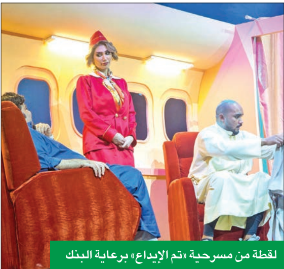
لحظة من مسرحية «تم الإيداع» برعاية البنك

تدور أحداث مسرحية «تم الإيداع» في قالب كوميدي هادف، يعزز أهمية الادخار والتوفير، من خلال شخصية شاب نجح في ادخار مبلغ من المال ويبحث عن الطريقة المثلى لادخاره. وبعد دخوله في عدة تجارب ومغامرات تبدأ من الكويت وصولاً إلى الهند وبينها رحلة في طائرة خاصة، يجد ضالته في إيداع مدخراته في حساب يحافظ له على أمواله، ويمنحه فرصة ليكون «مليونيراً» وربما «مليونيراً ونص».