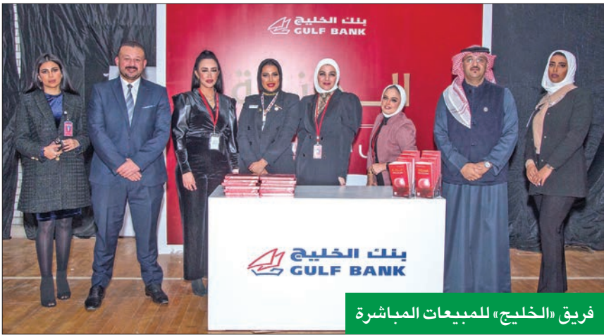
فريق «الخليج» للمبيعات المباشرة