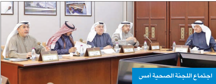
اجتماع اللجنة الصحية أمس

وسوف يرفع القانون إلى مجلس الأمة لإقراره في أقرب جلسة مقبلة. وأشار شمس إلى أن اجتماع اليوم (أمس) تم بحضور وزير الصحة ووكيل الوزارة والوكيل المساعد ومدير مكتب الوزير.