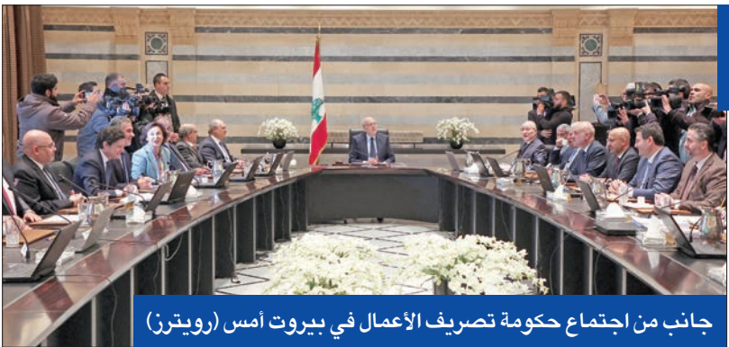
جانب من اجتماع حكومة تصريف الأعمال في بيروت أمس

للذهاب إلى تسوية رئاسية، والثانية أنه في حال استمر الفراغ فإن الحزب لا يريد أن يتحمل مسؤولية الفراغ أو التعطيل، وبالتالي هو يجد نفسه مضطراً لتفسير الأمور من خلال جلسات حكومة تصريف الأعمال بانتظار أن تحين لحظة