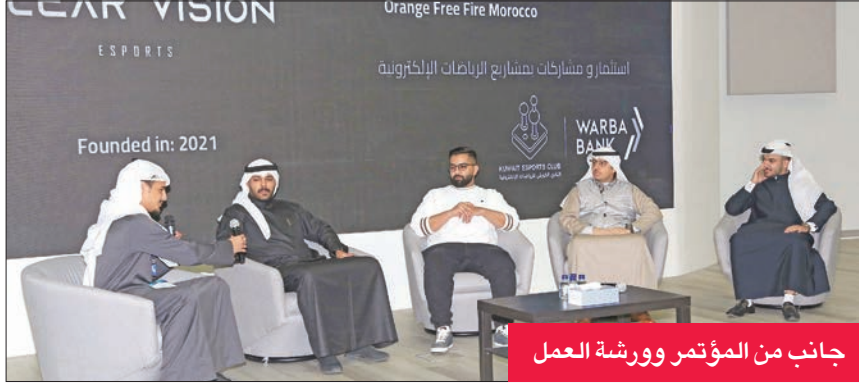
جانب من المؤتمر وورشة العمل