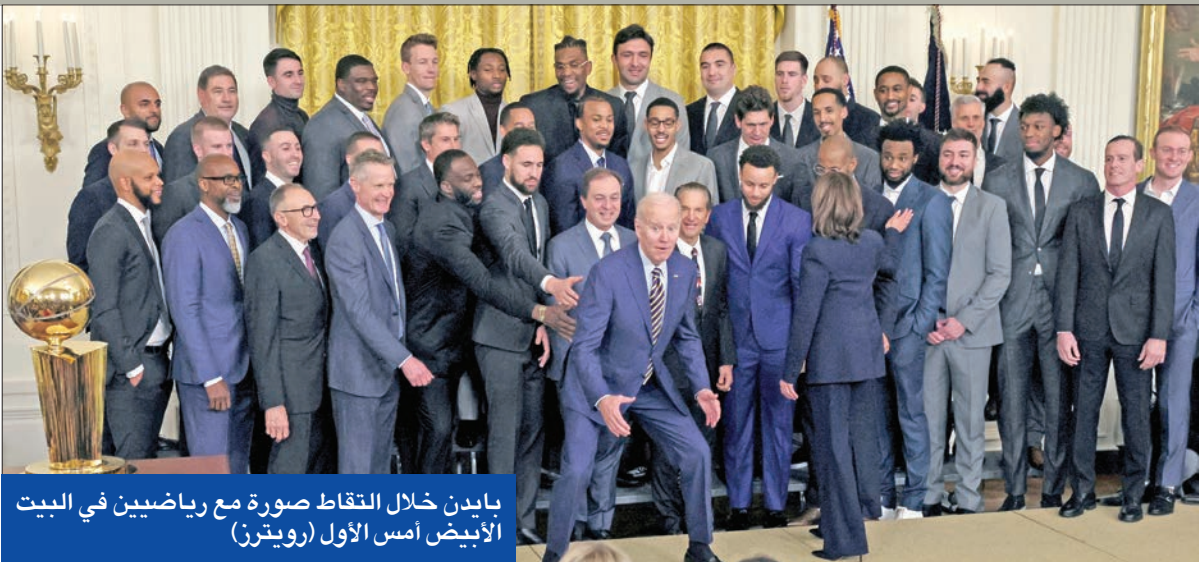
بايدن خلال التقاط صورة مع رياضيين في البيت الأبيض أمس الأول

التي عثر عليها لدى بايدن، تماماً كما فعل في القضية نفسها التي يواجهها ترامب، وذلك لتبديد الشكوك بوجود ازدواجية