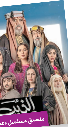
ملصق مسلسل «عين الذيب»

الله يرحم اللي انتقل إلى رحمته، ويحفظ الموجدوين... ويحفظكم. والثاني نشر من خلاله صورة من كواليس مسلسل «عش الزوجية»، وكتب: «عش الزوجية... عام 1993، مسلسل حبته جداً. التصوير