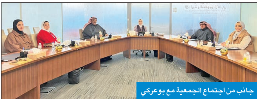
جانب من اجتماع الجمعية مع بوعركي