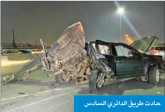
حادث طريق الدائري السادس

الحادث عبارة عن اصطدام مركبة مواطن، يبدو أنه كان قد فقد السيطرة عليها، بمركبة مواطنة كانت متوقفة أمام قسم تطبيق السيدات في المنفذ.