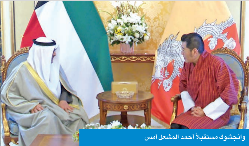
وانجشوك مستقبلاً أحمد المشعل أمس

استقبل الملك جيمغي وانجشوك، ملك بوتان الصديقة، أمس، رئيس جهاز متابعة الأداء الحكومي، الشيخ أحمد المشعل، وذلك في مقر إقامته بقصر بيان.