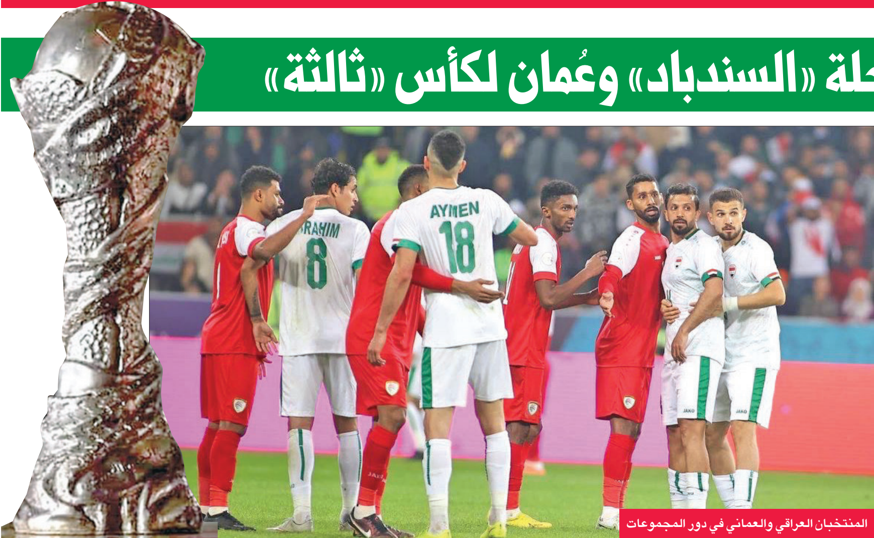
المنتخبان العراقي والعُماني في دور المجموعات

يلتقي اليوم منتخبا العراق وعُمان لكرة القدم في السابعة مساءً بنهائي بطولة «خليجي 25»، التي تستضيفها البصرة.