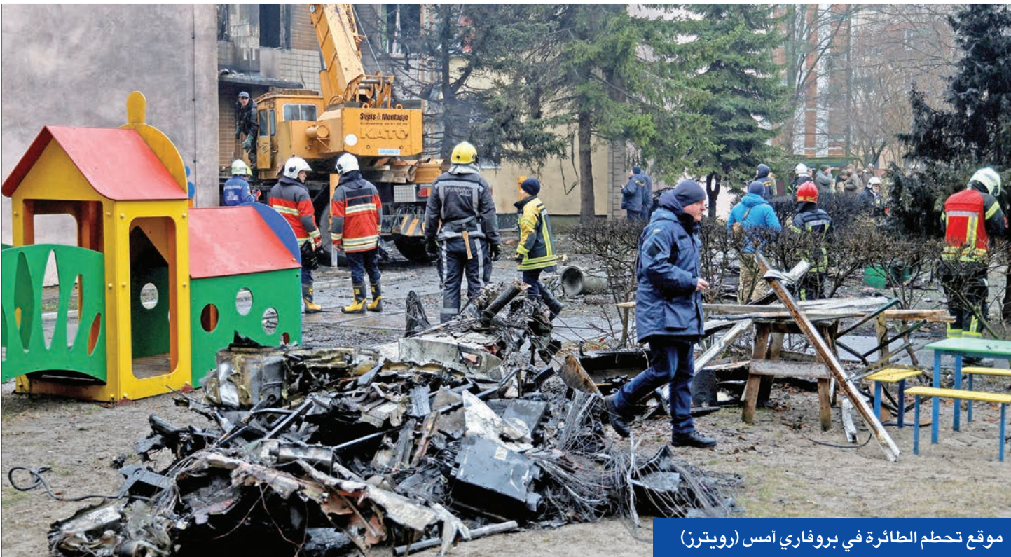
موقع تحطم الطائرة في بروفاري أمس

● كيسنجر يؤيد ضم كييف إلى «الناتو» ويدعو لمنح روسيا فرصة للعودة إلى النظام الدولي