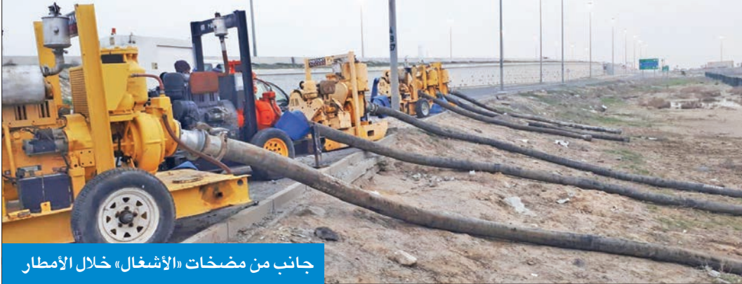
جانب من مضخات «الأشغال» خلال الأمطار