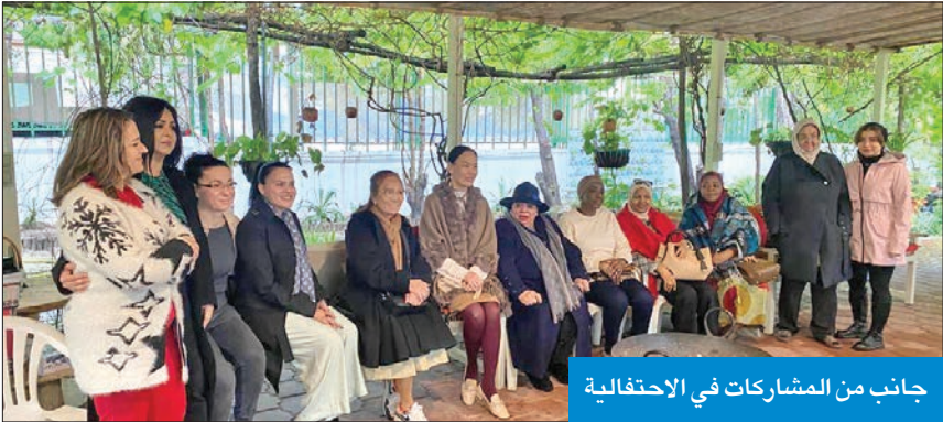
جانب من المشاركات في الاحتفالية

نظمها فريق تطوير التطوعي من نساء منطقة الشامية