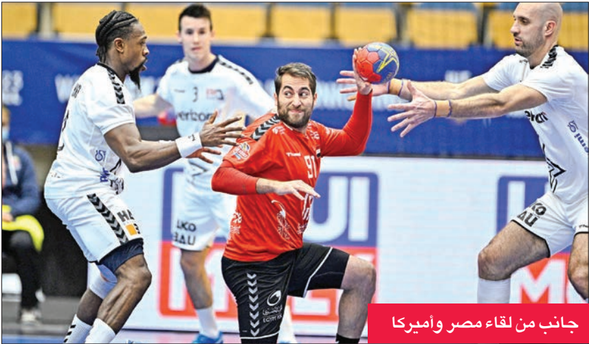
جانب من لقاء مصر وأميركا

«كرواتيا والمغرب وأميركا» إلى تحقيق بداية قوية في الدور الرئيسي الذي صعد إليه وفي جعبته 4 نقاط التي حققها أمام المنتخبات المتاهلة معه من مجموعته في الدور الأول فقط، وذلك على حساب نظيره البلجيكي الذي صعد ثالثاً من مجموعته الثامنة وبدون رصيد، ويطمح كذلك في التصدي لقوة وطموح الفراعنة على أمل الاستمرار في البطولة إلى أقصى مدى.