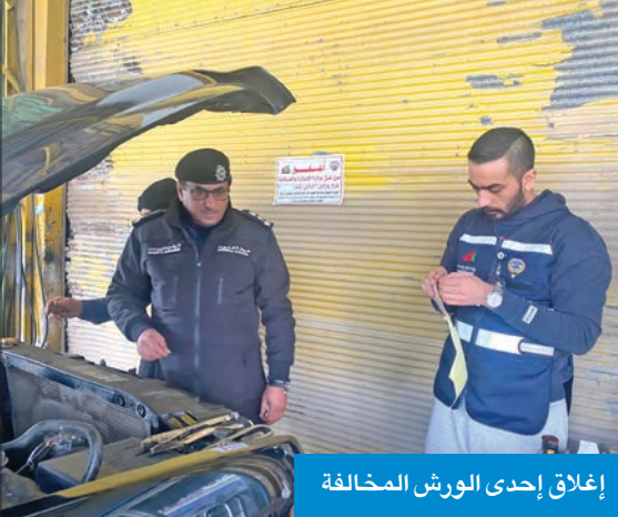
إغلاق إحدى الورش المخالفة

وفي التفاصيل، قال ضابط قسم العلاقات العامة والإعلام بالإدارة العامة للمرور، الرائد عبدالله بوحسن، إن الحملات الأمنية المرورية التي أشرف عليها ميدانياً المدير العام للإدارة العامة للمرور، اللواء يوسف الخدة، ومساعد له للشؤون الفنية، العميد محمد العدواني، أسفرت عن تحرير 3126 مخالفة مرور، منها 180 مخالفة تم رصداهن عن طريق الرادار الخاص بالسرعات العالية على الطرق الدائرية والسريعة، والذي تم