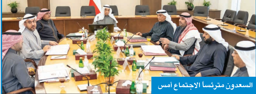
السعدون مترئساً الاجتماع امس