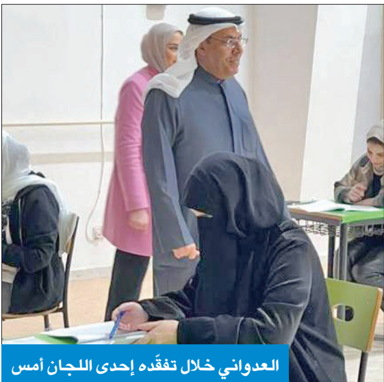
العدواني خلال تفقّده إحدى اللجان أمس

المعملية التعليمية ومحاربة الظواهر السلبية، مما يضمن تحقيق العدل والمساواة بين الطلاب، وحصول كل منهم على حقه، تطبيقاً لسياسة تكافؤ الفرص. وبيّن أن الوزارة تسعى لتحقيق تعليم ذي جودة ونوعية عالية لجميع فئات المجتمع من أجل بناء رأس المال البشري القادر على المشاركة في تنمية الوطن، معرباً عن تمنياته بالتوفيق والنجاح لجميع أبناء الطلبة والطالبات مع نهاية الاختبارات للفصل الدراسي الأول لعام 2022/2023، وأن يحققوا أعلى مراتب التفوق والتميز.