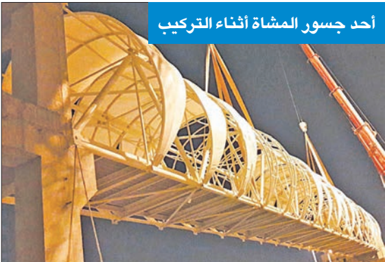
أحد جسور المشاة أثناء التركيب