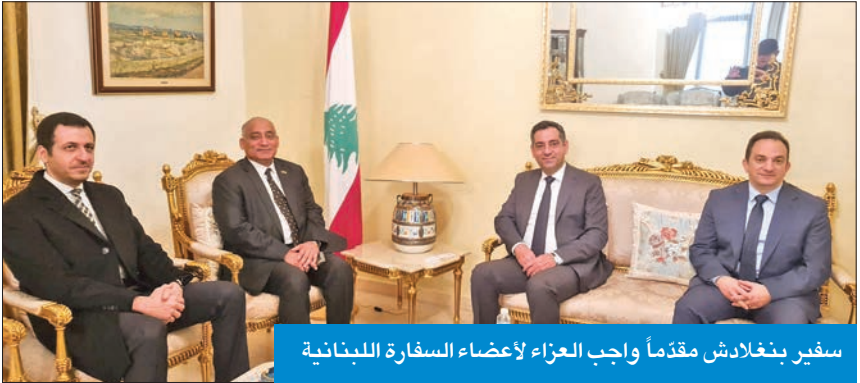
سفير بنغلادش مقدماً واجب العزاء لأعضاء السفارة اللبنانية

له الأمير الشيخ صباح الأحمد، طيب الله ثراه، الذي ترأس حينها اللجنة السداسية التي أفضت إلى اتفاق الطائف المذكور، مع الأشقاء العرب من الأردن والإمارات والسودان وتونس والجزائر، وبمباركة الدول العربية الشقيقة، وعلى رأسها السعودية، وبطبيعة الحال ما عودتنا عليه الكويت بدعمها المتواصل لشقيقها لبنان». يُذكر أن الحسيني كان من أوائل من دانوا الغزو العراقي الغاشم، وقال حينها إن «الغزو العراقي الذي تعرضت له الكويت عام 1990 خرق كل قواعد العلاقات العربية - العربية»، مضيفاً أن «سابقة غزو دولة كبرى لدولة صغرى هي سابقة خطيرة جداً، ونحن نعاني أيضاً هذا الأمر، فاربضاً لا تزال محتلّة من قبل العدو الإسرائيلي».