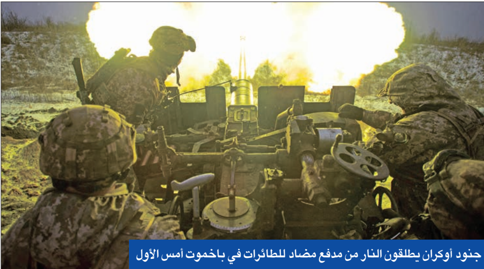
جنود أوكران يطلقون النار من مدفع مضاد للطائرات في باخموت أمس الأول

وتم التشديد على أن آخر موعد للتسجيل في مبادرة «تيسير استيراد سيارات المصريين بالخارج»، وسداد قيمة الوديعة المقررة، وفقاً لأحكام القانون، هو 14 مارس المقبل، وأشار المركز إلى أن عدد المتقدمين للاستفادة من القانون وصل إلى أكثر من 35 ألف حساب، وهو رقم لا يعد مرتفعاً إذا أخذنا في الاعتبار وجود من 10 إلى 15 مليون مصري خارج البلاد، ويحق لهم الاستفادة من القانون. وأرجع مصدر مطلع سبب عدم تمديد العمل بالقانون إلى ضعف الإقبال، فضلاً عن عدم مساواتها المصريين في الخليج بالمصريين