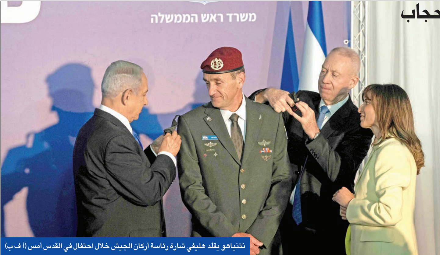
نتنياهو هو يقلد هليفي شارة رئاسة أركان الجيش خلال احتفال في القدس أمس (أ ف ب)

التي أسقطتها القوات الإيرانية فوق طهران يناير 2020، في بيان لها، الاحتجاجات الإيرانية المرتقبة في ستراسبورغ الفرنسية، لمطالبة الاتحاد الأوروبي بإدراج «الحرس الثوري» كمنظمة إرهابية. في السياق، انتقد علي جنتي، وهو وزير الإرشاد الأسبق ونجل رئيس مجلس صيانة الدستور المنتشدد، آية الله أحمد جنتي، سياسة النظام الإيراني في التعاطي مع فرض الحجاب القسري بالقوة. وقال: «نوصلوا أخيراً إلى نقطة أوقفوا عندها دورية الإرشاد، شرطة الإداب، واليوم تتعرض المحجبات للضغط والإذلال أكثر من غير المحجبات، أنا لا أفهم إطلاقاً من أين استخرجوا من الإسلام أنه على الحكومة فرض ارتداء الحجاب؟».