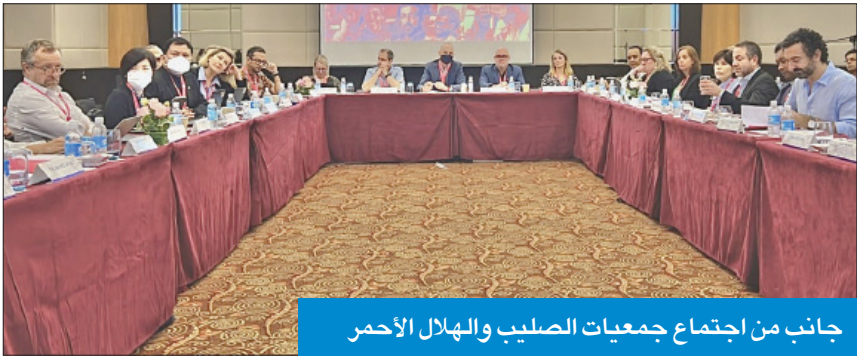
جانب من اجتماع جمعيات الصليب والهلال الأحمر

وتطرق الحساوي إلى دور الكويت الإنساني في دعم الدول الأكثر حاجة واستمرارها بتقديم المساعدات للشعوب المحتاجة، حيث تحتل موقع الريادة في خريطة العمل الإنساني العالمي، مشيراً إلى دور «الهلال الأحمر» الإنساني الممتد إلى أكثر من 105 دول حول العالم منذ إنشاء الجمعية عام 1966.