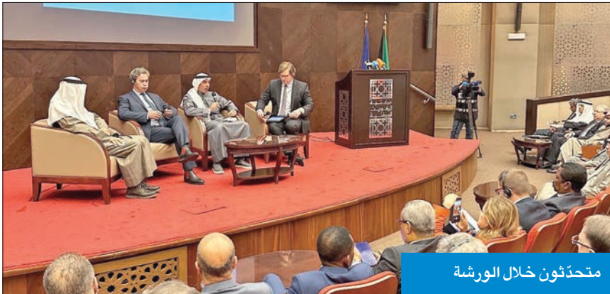
متحدّثون خلال الورشة

التي هذه التحديات معا. وأوضح القائم بأعمال بعثة الاتحاد الأوروبي أن «شراكة الاتحاد الأوروبي مع الكويت ترتكز في مجال الأمن ومكافحة الإرهاب على 3 ركائز هي مكافحة تمويل الإرهاب وغسل الأموال، وفي هذا المجال، يسعدني أن أعلن أن الاتحاد الأوروبي يقترح مساعدة فنية، وسنعمل مع أصدقائنا في الكويت على تصميم برنامج يناسب احتياجات الكويت على أفضل وجه».