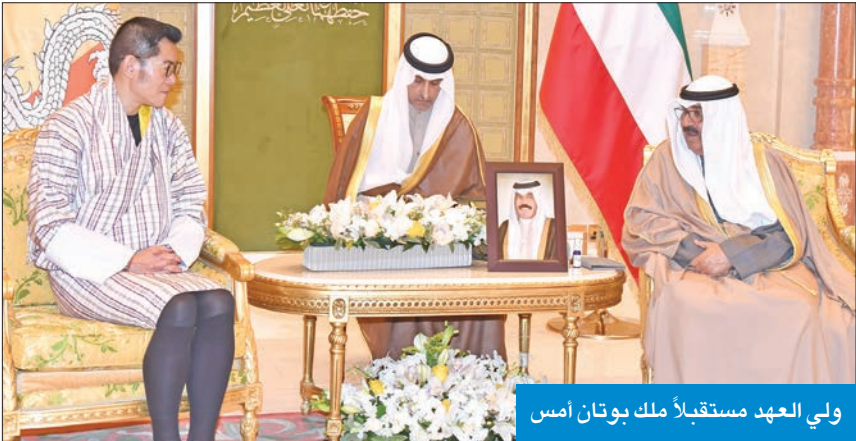
ولي العهد مستقبلاً ملك بوتان أمس

الإسلامية للعلوم الطبية، بمناسبة زيارتهم للبلاد للمشاركة بأعمال المؤتمر الـ 13 للمنظمة المنعقدة برعاية سمو ولي العهد والذي يختتم اليوم. حضر اللقاء وزير الصحة د. أحمد العوضي، ومدير مكتب سمو ولي العهد الفريق متقاعد جمال الذياب. وفي مجال آخر، بعث سمو ولي العهد ببرقية تعزية إلى رئيسة نيبال الصديقة بيديبا بهانداري، ضمنها سموه خالص تعازيه وصادق مواساته بضحايا تحطم طائرة الركاب النيبالية في مقاطعة بوكار وسط نيبال، راجيا سموه لذوي هذا الحادث الأليم جميل الصبر.