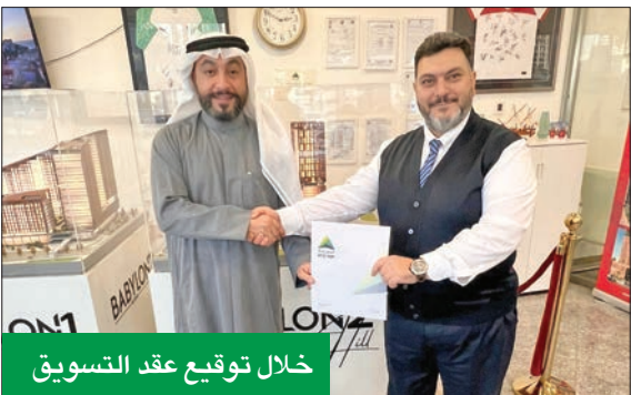
خلال توقيع عقد التسويق