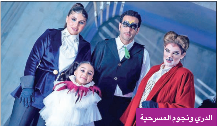
الدري ونجوم المسرحية