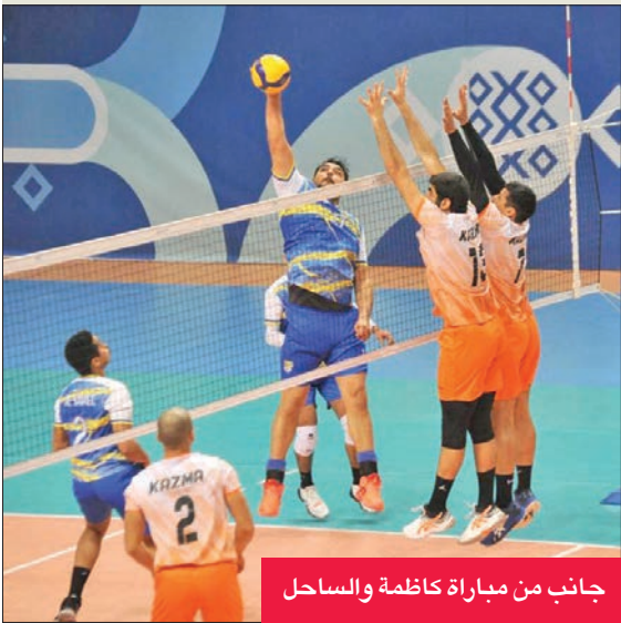
جانب من مباراة كازمة والساحل

بـ 8 نقاط يليه برقان في المركز السادس بـ 5 نقاط والساحل في المركز السابع والأخير بدون رصيد.