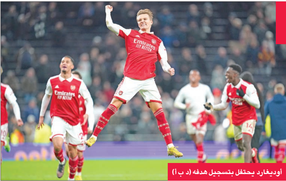
أوديجارد يحتفل بتسجيل هدفه (د ب أ)

واستعاد نيوكاسل يونايتد المركز الثالث من مانشستر يونايتد بفوز