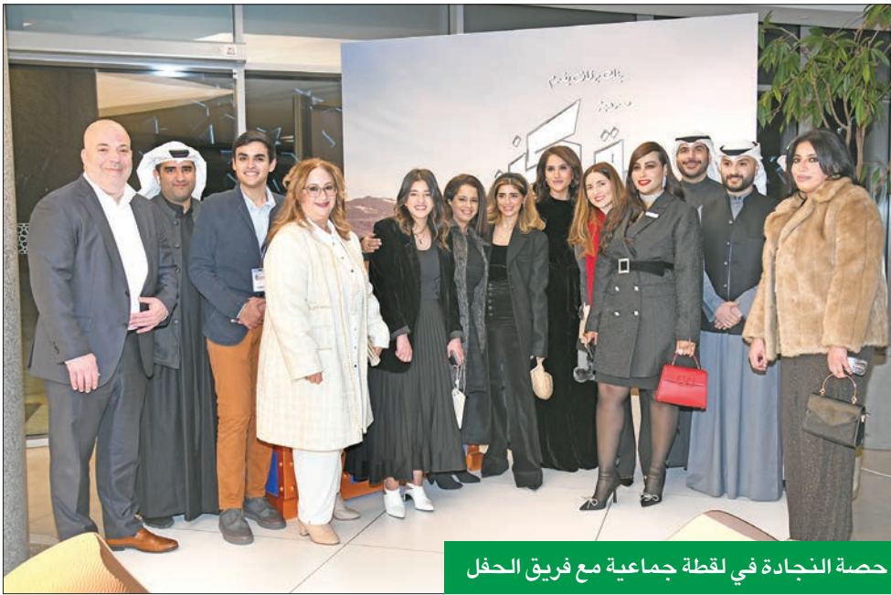
حصة النجادة في لقطة جماعية مع فريق الحفل

«العوضي: «نتقدم من بنك برقان بالشكر الكبير لمنحنا هذه الفرصة المميزة التي أتاحت لنا التحليل في عالم الإبداع من دون قيود أو حدود. وإلى جانب العراقة والأصالة، دائماً كان الابتكار والتجديد من المبادئ الأساسية التي تنعكس في شخصية البنك، وعلى هذا الأساس كان لا بد من البحث عن مقاربة تحقق التوازن بين المبدعين التراجي والإبداعي بصورة جديدة كلياً، تتماشى مع الديناميكيات الحديثة للتسويق العصري».