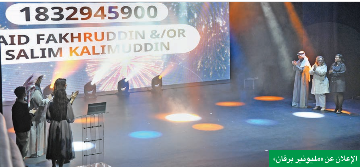
الإعلان عن «مليونير برقان»