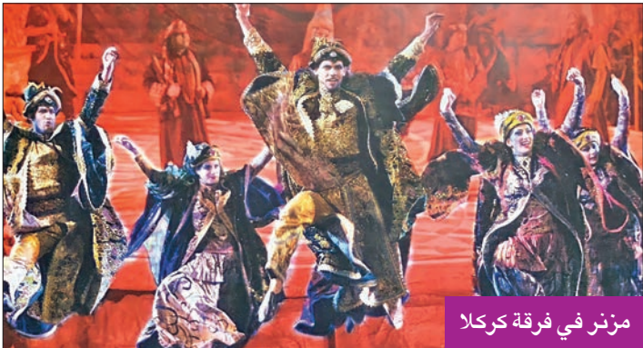
مزنر في فرقة كركلا

رسالة «لويك»، بأن ينقل ذوو الاختصاص خبراتهم إلى الشباب الطموح.