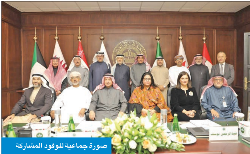
صورة جماعية للوفود المشاركة

مجلس الأمناء ناقش الإجراءات التطويرية للجامعة