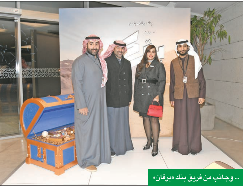
... وجانب من فريق بنك «برقان»