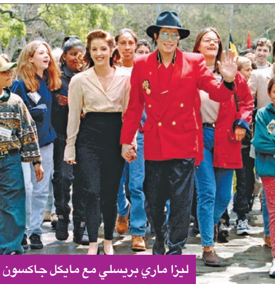
ليزا ماري بريسلي مع مايكل جاكسون

نيكولاس كيج، وهو من كبار الممجرين بوالدها، في عام 2002، وتقدم كيج بطلب الطلاق بعد أربعة أشهر، وكان زواجها الرابع من عازف الجيتار والمنتج الموسيقي مايكل لوكوود قبل طلاقهما عام 2021. (رويترز)