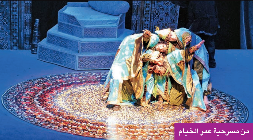
من مسرحية عمر الخيام

- أي إنسان يريد أن يكسر القواعد يخرج عن المألوف يتوجب عليه أن يمتلك المعرفة الكافية والذكاء، وأن يعرف بشكل دقيق ما هو الخروج عن المألوف، وهذا يعكس خبرتي في مجال الأزياء.