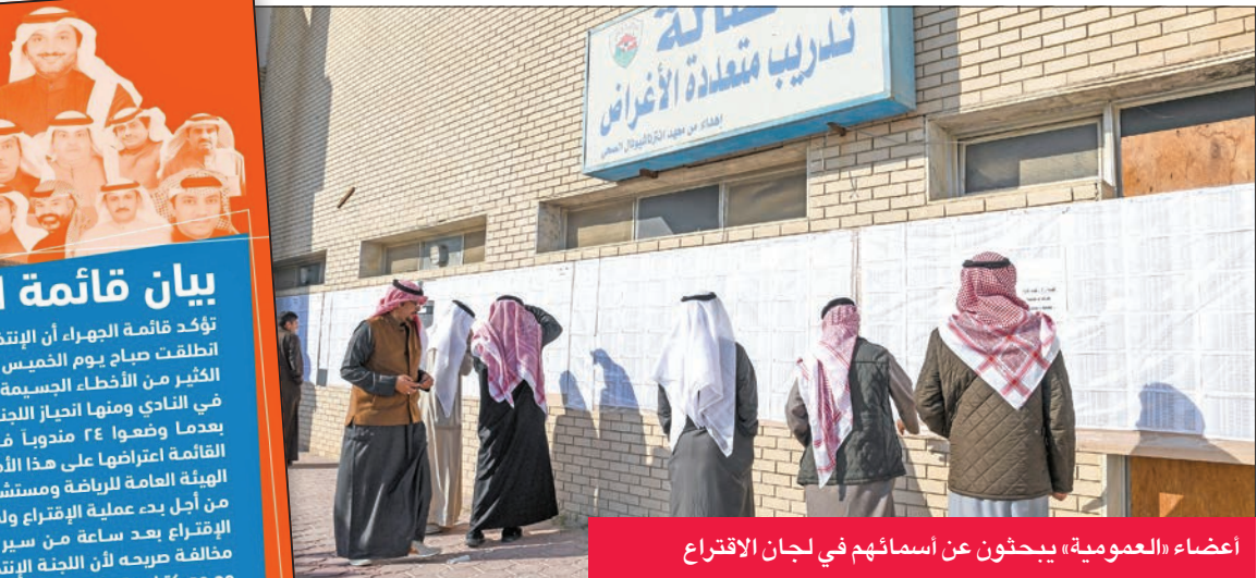
أعضاء «العمومية» يبحثون عن إسمائهم في لجان الاقتراع

وشدد على أن ثقته كبيرة جداً في لاعبي الأزرق، موضحاً أنهم قادرون على تحقيق الأفضل في الاستحقاقات المقبلة. وكان رئيس الوزراء العراقي محمد السوداني قد أقام أدبة عشاء على شرف وفد الاتحادات الخليجية، بحضور الشاهين.