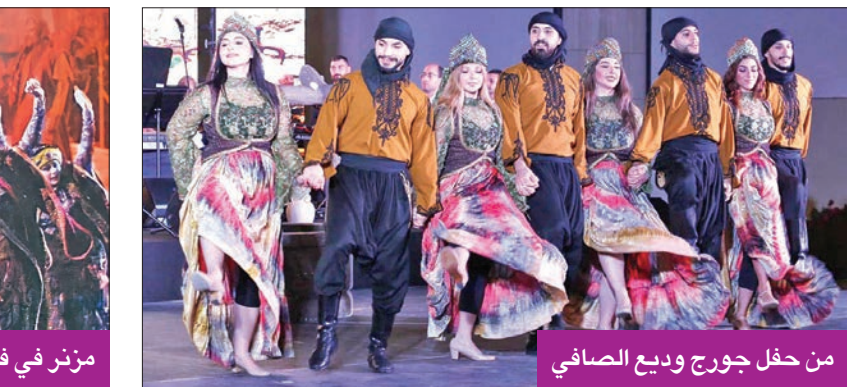
من حفل جورج وديع الصافي

بدأ المخرج اللبناني إبراهيم مزنر رحلته الفنية مع فرقة كركلا العالمية، والتي اكتسب من خلالها الخبرة الفنية مدة 12 سنة، مشاركاً بأعمال نالت إعجاباً جماهيرياً، عبر مهرجانات وعروض مسرحية عالمية في أكثر من 50 مسرحاً حول العالم، منها: أصدقاء، وحلم ليلة شرق، والأندلس المجد الضائع، وألف ليلة وليلة، وبليلة قمر.