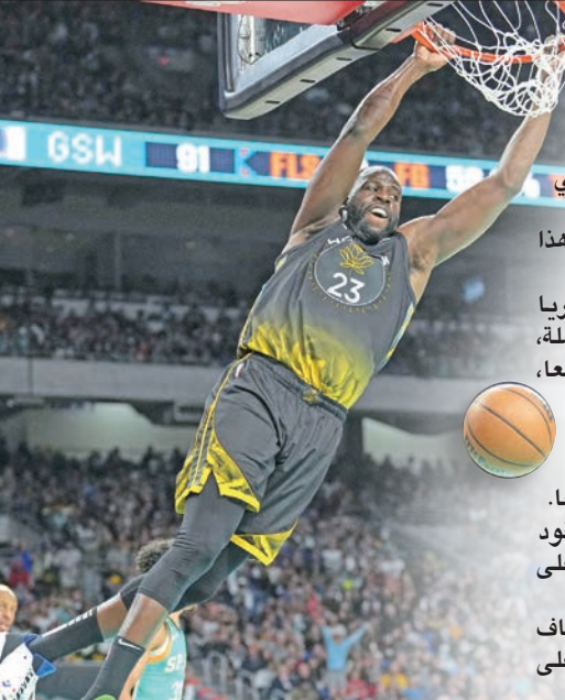
غرين نجم غولدن ستايت يسجل في سلة سبيرز

استعاد فريق غولدن ستايت ووريوز نغمة الانتصارات بعد ثلاث هزائم متتالية، وتغلب على سان أنتونيو سبيرز 144-113 مساء الجمعة، ضمن منافسات دوري كرة السلة الأميركي للمحترفين.