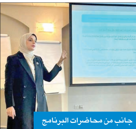
جانب من محاضرات البرنامج

ومنظمات المجتمع المدني في مكافحة الفساد، إضافة إلى تسليط الضوء على استراتيجيات الكويت لتعزيز النزاهة ومكافحة الفساد 2019 - 2024، وتعزيز ومكافحة الفساد والمشاركة مع الدول والمنظمات الإقليمية والدولية في مجالات مكافحة الفساد. كما تطرقت الهيئة، خلال المحاضرات التي قدّمها مجموعة من المختصين بالهيئة، إلى نظام الكشف عن الزمة المالية للمشمولين بالقانون، إضافة إلى التعرف على جرائم الفساد التي ذكرها قانون إنشاء الهيئة وحماية المبلغين عن الفساد.