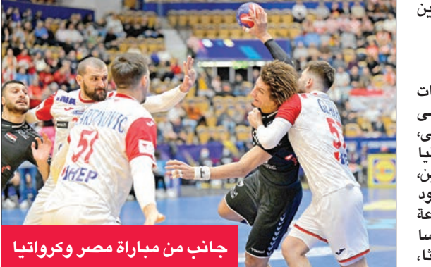
جانب من مباراة مصر وكرواتيا

ضمن الجولة الثانية، حيث يلقي في الشامسة مساء منتخبات بلجيكا مع تونس، والمانيا مع صربيا، ومصر مع المغرب، ومقدونيا مع هولندا، وفي العاشرة والنصف مساء تلعب الدنمارك مع الجرين، وكرواتيا مع اميركا، والنرويج مع الأرجنتينين، وقطر مع الجزائر.