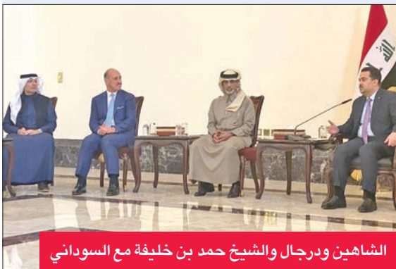
الشاهين ورجال والشيوخ حمد بن خليفة مع السوداني

أشاد رئيس اتحاد كرة القدم عبدالله الشاهين، بالمستوى الذي قدمه الأزرق في بطولة «خليجي 25»، مضيفاً أن المنتخب خرج من منافسات التأهل للدور نصف النهائي في الجولة الأخيرة، بعد أن صبت نتيجة المواجهات المباشرة في مصلحة المنتخب القطري. وقال الشاهين، في تصريح لوسائل الإعلام: «فخور باللاعبين والمنتخب، خصوصاً أن الفترة التي تم تجهيز المنتخب فيها وضخ دماء جديدة له قصيرة، وعلى جميع دعمهم في الفترة المقبلة، للارتقاء بالمستوى».