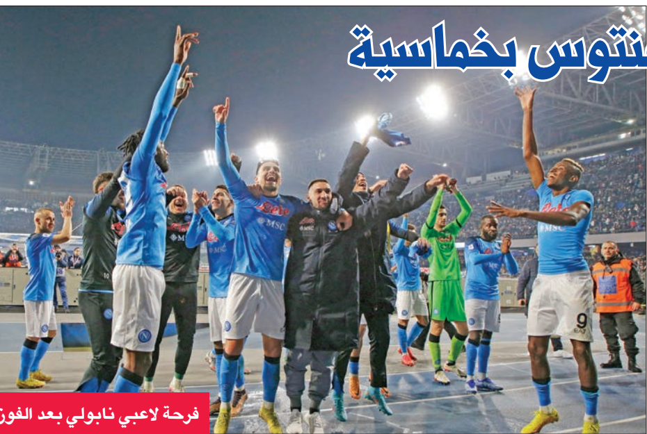
فرحة لاعبي نابولي بعد الفوز

القميص، إنهم يستحقون لعب هذا النوع من المباريات وقد حققوا ذلك بالطريقة الصحيحة». وتستكمل مباريات المرحلة اليوم بلقاءات ساسولو أمام لاتسيو، وأودينيزي مع بولونيا، وتورينو أمام سبيتسيا، وأتالانتا أمام ساليرنيتانا، وروما أمام فيورنتينا.