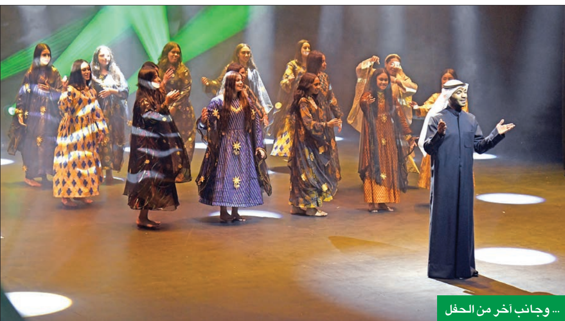
... وجانب آخر من الحفل