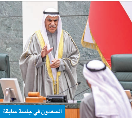
السعدون في جلسة سابقة

جاء الاقتراح بقانون الذي قدمه رئيس مجلس الأمة أحمد السعدون بتعديل قانون إعادة تحديد الدوائر الانتخابية لعضوية مجلس الأمة، والذي تضمن العودة إلى نظام الأربعة أصوات، مختلفاً كلياً عن النظام السابق في 4 نقاط رئيسية. الاقتراح بقانون الذي تمت إحالته إلى لجنة شؤون الداخلية والدفاع البرلمانية، وحصلت «الجريدة» على نسخة منه، نص على أن يدلي كل ناخب بصوته في الدائرة الانتخابية المقيد فيها، ويكون له الحق في التصويت لعدد لا يزيد على أربعة مرشحين، على أن يكون من بينهم مرشح واحد على الأقل من الدائرة الانتخابية المقيد فيها الناخب، ويجوز أن يدلي بصوته لعدد لا يزيد على ثلاثة مرشحين في دائرة أو في دوائر غير المقيد فيها الناخب. وبموجبه، يتم إعلان فوز أول 50 مرشحاً في الانتخابات العامة وأول عدد مطلوب انتخابه من المرشحين في الانتخابات التكميلية، الذين حصلوا على أكبر عدد من الأصوات الصحيحة التي أعطيت، وهو ما يعني أنه لن يكون هناك 10 من كل دائرة كما هي الحال حالياً بل سيكون أكثر 50 مرشحاً حصلوا على أصوات انتخابية من الدوائر الخمس.