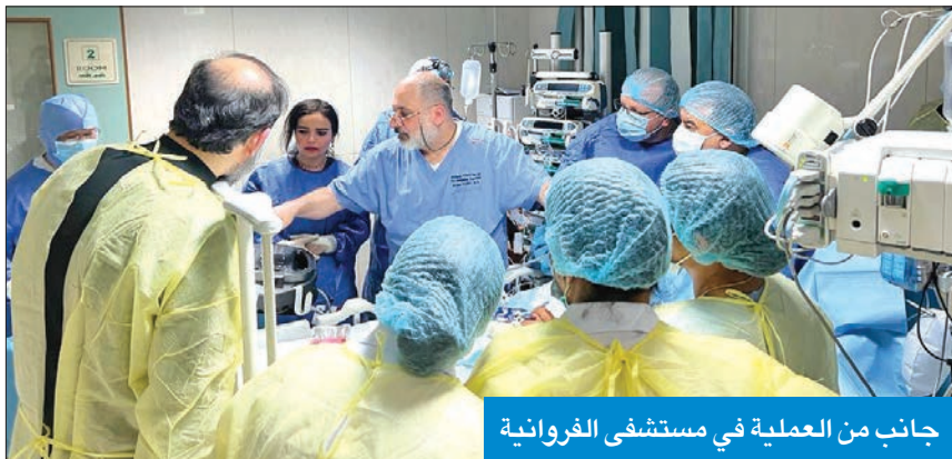
جانب من العملية في مستشفى الفروانية

وقال الحاج إن العملية تضمنت إجراء الأكسجة الغشائية بالتنظير الخارجي (إيكمو)، حيث بضع الدم خارج الجسم إلى جهاز رئوي قلبي صناعي، والذي يعمل