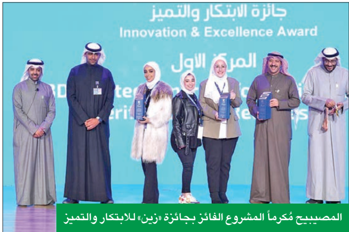
المصبيح مُكرماً المشروع الفائز بجائزة «زين» للابتكار والتميز

ويرسم ملامح القطاعات المهمة نحو ازدهار الدولة، كما يفتح آفاقاً جديدة لم يسبق لها مثيل نحو مستقبل هندسي صحي ومستدام. وشترك في المعرض العديد من المشاريع من جميع الأقسام العلمية في الكلية، ومئات الطلاب والطالبات، الذين استعرضوا من خلاله مشاريعهم الهندسية الواعدة أمام الزائرين، كما قامت جائزة «زين» السنوية للابتكار والتميز بتسليط الضوء على المشاريع الطلابية الأكثر تميزاً وابتكاراً عاماً بعد عام، وفق مجموعة من المعايير التي تضعها وتشرّف عليها كلية الهندسة والبرول. وتُكرّس «زين» المزيد من الجهود والمبادرات التي تُعزز من تطوير العملية التعليمية بالدولة وفي جميع المجالات، إذ لن تُدخّر جهداً لتسخير إمكانياتها المادية والبشرية لتعزيز الروابط مع الجهات والمؤسسات التي تعنى بالتعليم وتطويره، سواء المؤسسات التعليمية أو الأندية والاتحادات الطلابية، إلى جانب دعم المشاريع والمبادرات التي تسهم بشكل فعال في مجالات التنمية البشرية عموماً.