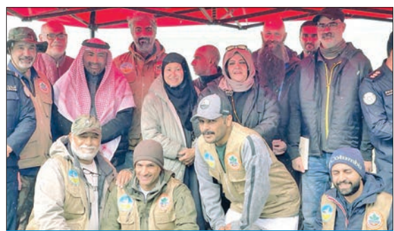
العقاب والقائم بالأميري مع الحضور