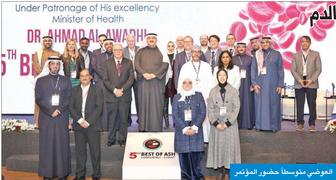
العوضي متوسطاً حضور المؤتمر

عبر وزير الصحة، د. أحمد العوضي، عن اعتزازه بما تحقق من مؤشرات إيجابية بحياة المرضى وصحتهم، والتي تعكس اهتمام «الصحة» وحرصها على تقديم الرعاية الصحية الوقائية والعلاجية والتأهيلية للمرضى بالجودة المطلوبة. جاء ذلك خلال افتتاح