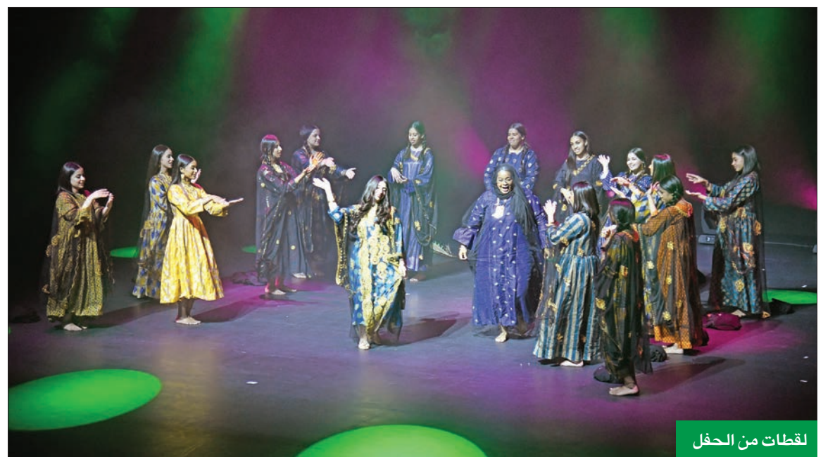
لقطات من الحفل