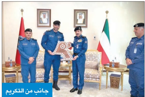
جانب من التكريم

كرم رئيس قوة الإطفاء العام الفريق خالد المكرد، ونائب الرئيس لقطاع مكافحة اللواء جمال البليهيص، أمس الأول، اللجنة المنظمة والقائمين على تمرين شامل «8» من منتسبي القوة.