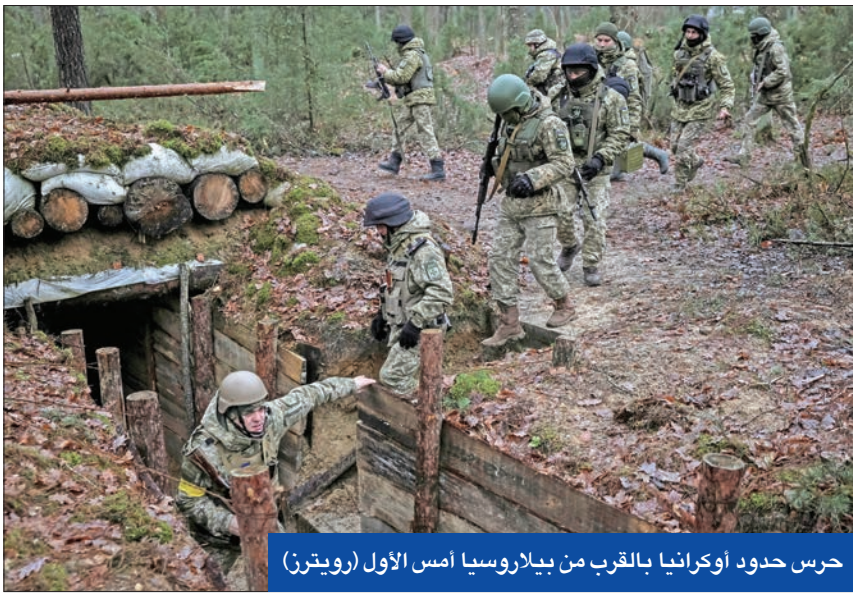
حرس حدود أوكرانيا بالقرب من بيلاروسيا أمس الأول

وكذلك يجمع الخبراء على أن هذا القرار مؤشر على تسريع العملية الروسية، فالحديث عن هجوم جديد جار منذ أشهر فيما لا تستبعد فرضية تعبئة جديدة، بعد تعبئة أولى في سبتمبر حشدت قرابة 300 ألف رجل. ويؤكد الخبير العسكري الروسي المستقل الكسندر خروميتشخين أنّه «من الواضح أن هذا التعديل يعني أن هناك خطاً لتوسيع نطاق المعارك»، بهدف ضمان السيطرة الفعالة على المناطق الأربعة التي ضمتها روسيا من جانب واحد.