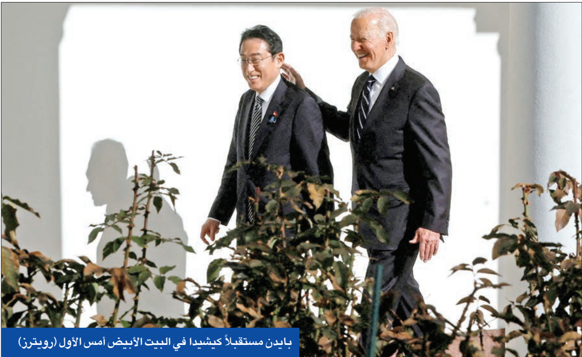
بايدن مستقبلاً كيشيدا في البيت الأبيض أمس الأول

في واشنطن أمس الأول، على تقوية الحلف بين البلدين، مع الوضع بعين الاعتبار التوجهات الصينية الرامية إلى الهيمنة بشكل متزايد. وأصدر كيشيدا وبايدن بعد القمة بياناً مشتركاً أشارا فيه إلى أنشطة الصين وكوريا الشمالية في منطقة المحيطين الهندي والهادئ، وكذلك الغزو الروسي لأوكرانيا.