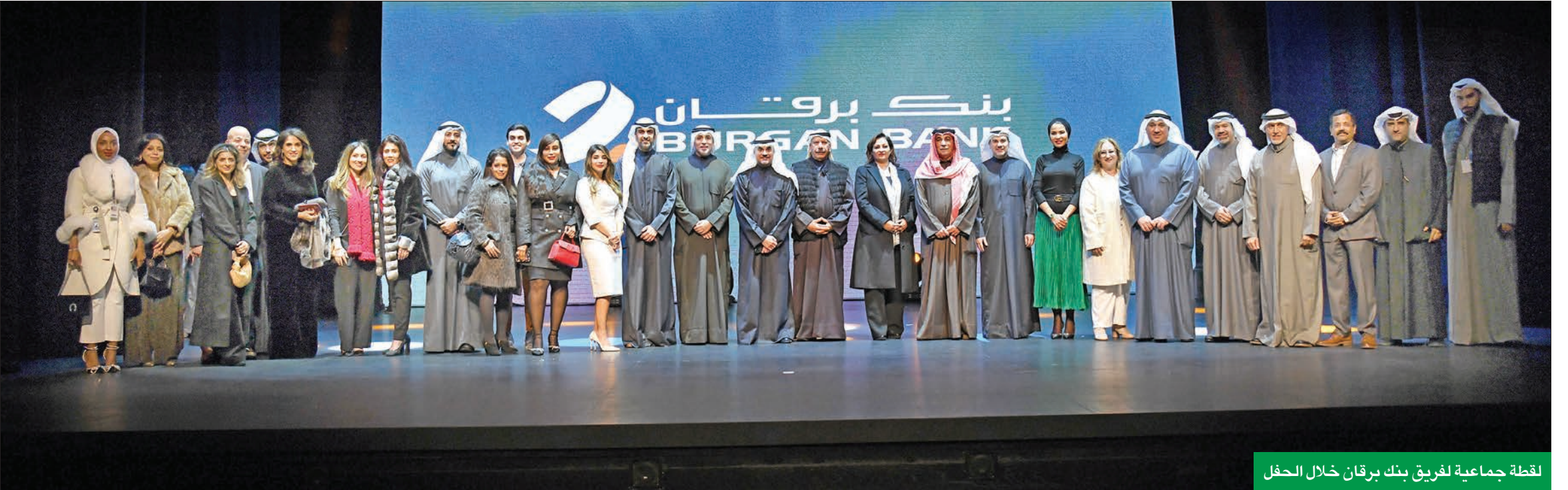
لقطة جماعية لفريق بنك برقان خلال الحفل