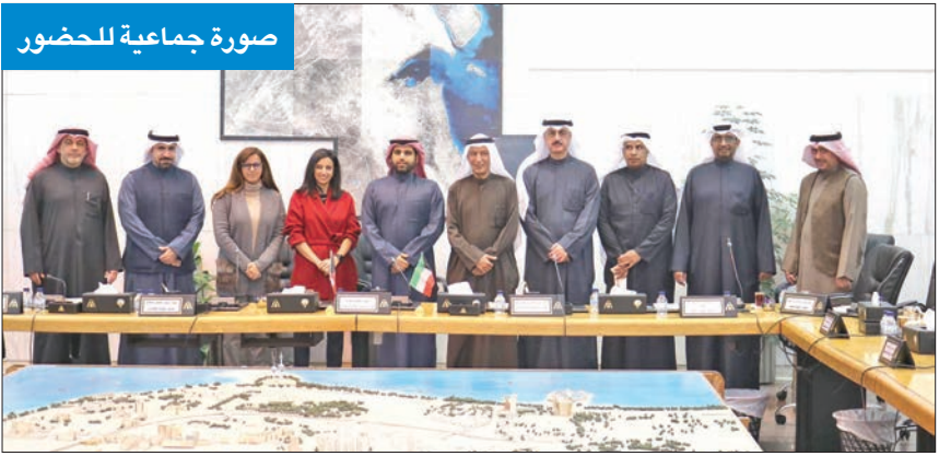
صورة جماعية للحضور

النقل الكويتية تدعو إلى التفاؤل، خاصة مع الازدحامات المرورية والتوسع العمراني والكثافة السكانية، موضحاً أن جزءاً من المشكلة المرورية هو النقل العام، وليس الحل فقط فتح خطوط جديدة للنقل العام، بل تشجيع الناس على التنقل بها.