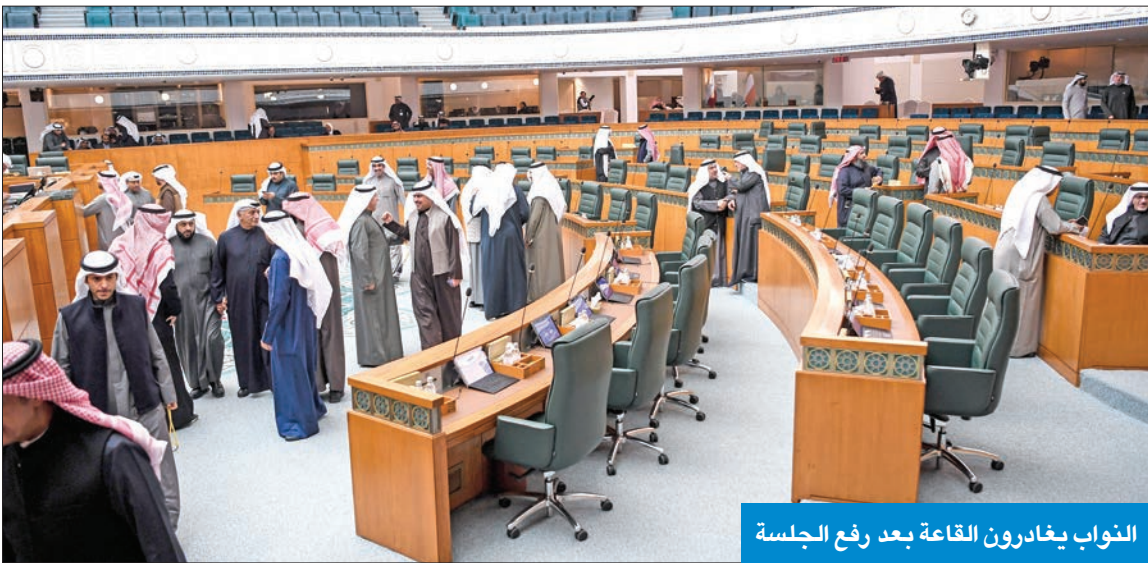
النواب يغادرون القاعة بعد رفع الجلسة

موقفنا سببه عدم تمكيننا من استكمال رأينا الدستوري والمالي في تقارير اللجان مجلس الوزراء