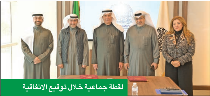
لقطة جماعية خلال توقيع الاتفاقية

التي تعرض عليهم وفق تخصصاتهم، فقام نظام التحكيم في الغرفة واكتسب شهرة من سمعة هؤلاء، وتطبيقهم لمبادئ العدالة والإنصاف التي تربوا عليها واتصفوا بها، وتجاوبوا مع تطورات الاقتصاد الكويتي ومستجداته، وتوسع علاقاتها الدولية وتعددها، وأقر مجلس إدارة الغرفة تطوير نظام التوفيق والتحكيم التجاري بإنشاء مركز الكويت للتحكيم التجاري - كمركز غير ربحي - والموافقة على نظامه الأساسي بمرسلة التي عقدت في 12/20 /1999، وقد آتت هذه الخطوة كتطوير لنظام تسوية المنازعات باعترابه مؤسسة تابعة للغرفة. وقال الشايع إن الاتفاقية تأتي تنويعاً لجهود الطرفين والإجماعات والمناقشات المهددة للخروج بافضل المقترحات التي تحقق الهدف من الاتفاقية وتستثمر إمكانات الطرفين، مؤكداً أن غرفة التجارة، ممثلة بمركز الكويت للتحكيم التجاري، تسعى دوماً لإقامة جسور التعاون مع الجهات المعنية والمسؤولة، بهدف تبادل الخبرات، ورفع مستوى الأداء، وتعزيز ونهضة بيئة الاستثمار، وتحقيق الأهداف الوطنية المشتركة.