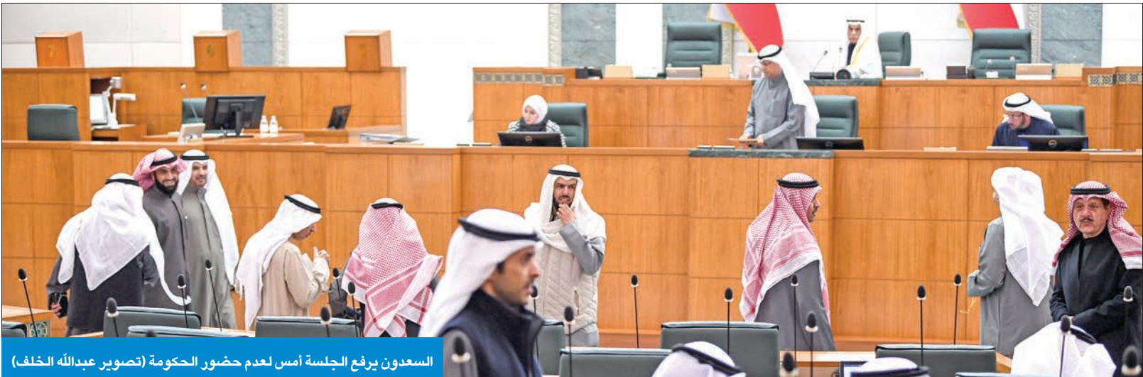
السعدون يرفع الجلسة أمس لعدم حضور الحكومة

غابت عن قاعة عبدالله السالم واجتمعت في قصر السيف... و«التكميلية» طارت