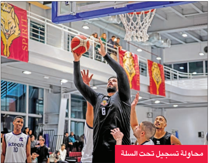
محاولة تسجيل تحت السلة