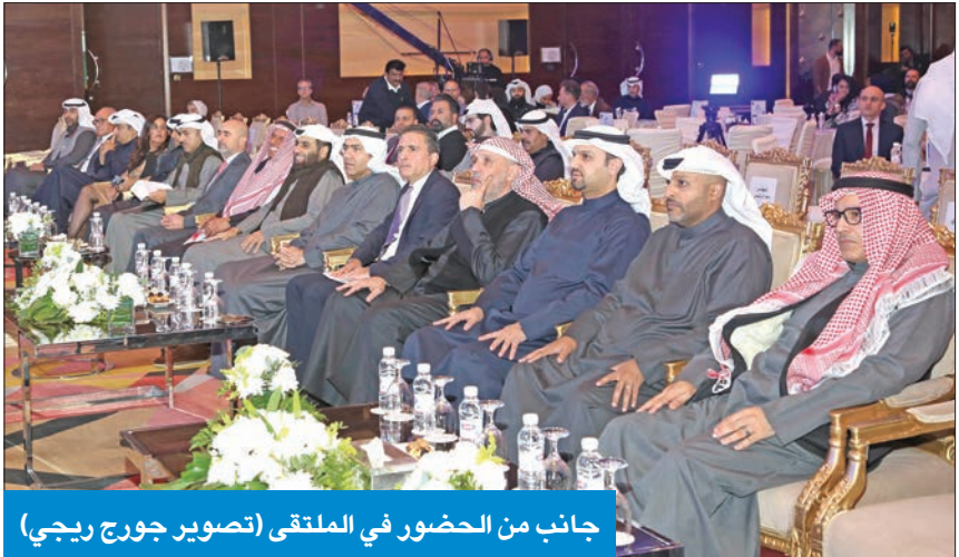
جانب من الحضور في الملتقى

وبين المحيلان أن الشركات الكويتية العقارية رائدة في هذا المجال، ولها سجل حافل من النجاحات بإنجاز مشاريع إسكانية خارج الكويت ودخلها، وهي قادرة، بلا شك، بما تملكه من خبرات وقدرات على توفير حلول إسكانية مبتكرة تراعي البعد الاجتماعي، وتعزز رفاهية المواطنين.