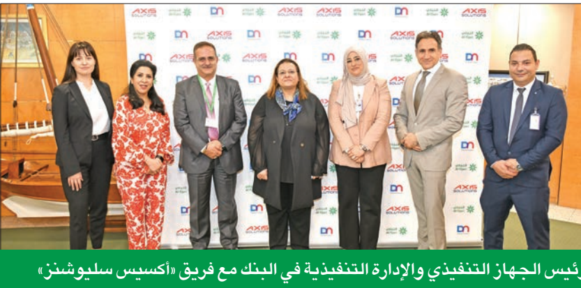
رئيس الجهاز التنفيذي والإدارة التنفيذية في البنك مع فريق «أكسيس سليوشنز»

وعن تفاصيل الخدمات المتطورة التي يمكن الحصول عليها عن طريق أجهزة السحب الآلي الحديثة، أفادت محفوظ أن البنك يسعى إلى تقديم خدمات فتح الحسابات والتسجيل في الخدمات، وإصدار البطاقات والشيكات والمستندات البنكية عبر الإصدار الأحدث من ماكينات ديبولد نيكسдорف Diebold Nixdorf Self-Service Systems