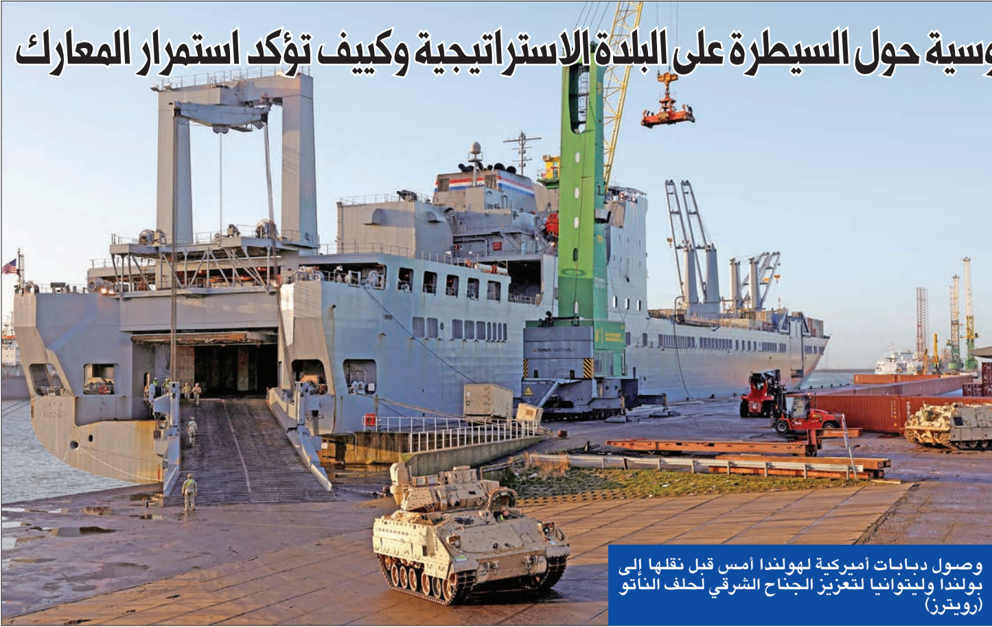
وصول دبابات اميركية لهولندا امس قبل نقلها إلى هولندا ولتتواني لتعزّيز الجناح الشرقي لحلف الناتو

تمكنت ميليشيات «مجموعة فاغنر» الروسية، أمس، من تحقيق تقدم داخل مدينة سوليدار الصغيرة في منطقة دونيتسك شرق أوكرانيا، في حين تكثف القوات الروسية، التي عيّن الرئيس فلاديمير بوتين قائداً جديداً لعملياتها في أوكرانيا، هجماتها في منطقة الدونباس في سياق على ما يبدو مع الإمدادات العسكرية الجديدة، التي التزم الغرب بتقديّمها لأوكرانيا، ومن بينها الدبابات.