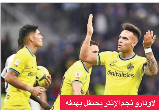
لاوتارو نجم الإنتر يحتفل بهدفه

عاد لاعب الوسط الفرنسي بول بوغبا، الغائب عن مونديال قطر 2022 بسبب الإصابة لخضوعه لجراحة في ركبته مطلع سبتمبر الماضي، إلى تمارين فريقه يوفنتوس الإيطالي للمرة الأولى منذ أكتوبر، بحسب ما أعلن ناديه. ونشر «بيانكونيري» الثلاثاء صورة ومقطع فيديو لحصته التدريبية على موقعه الرسمي، وشوهد اللاعب البالغ من العمر 29 عاماً مع الكرة بين زملائه. وكان بوغبا، بطل العالم 2018، خضع لعملية جراحية في الغضروف المفصلي في أوائل سبتمبر، ثم تعرض لإصابة جديدة أخرت شفاؤه. ولم يلعب بوغبا أي مباراة رسمية منذ 19 أبريل الماضي، عندما كان في صفوف مانشستر يونايتد الإنكليزي. وكان يمضي النفس أن يساعد حركته الضيف الماضي من مانشستر يونايتد وعودته إلى يوفنتوس في إعادة إطلاق مسيرته الاحترافية، لكنه أصيب قبل بداية الموسم مباشرة خلال مباراة ودية في يوليو. وقرر بداية الأمر عدم الخضوع لجراحة، بهدف المشاركة