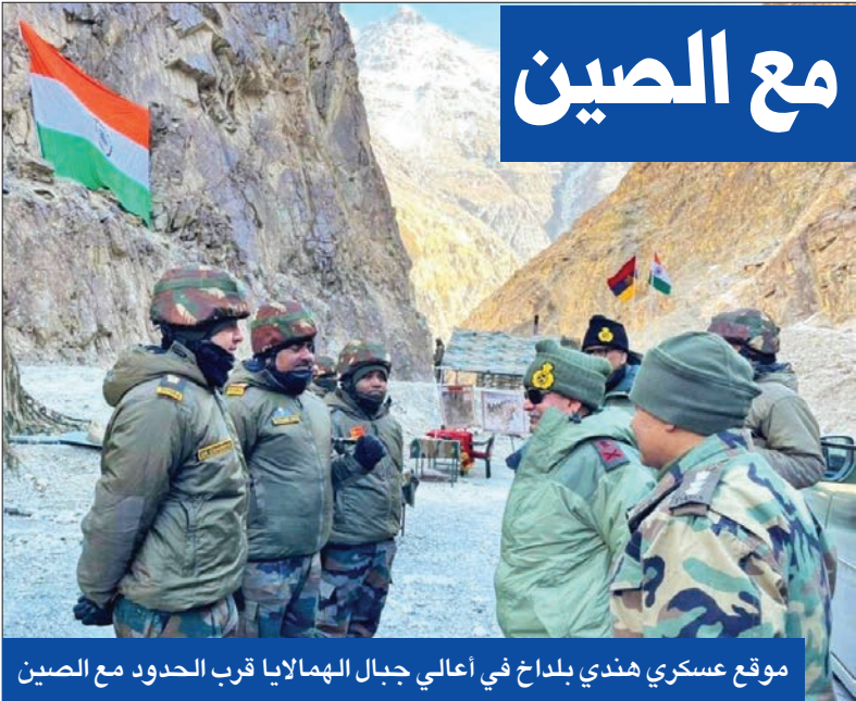
موقع عسكري هندي بلдах في اعالي جبال الهمالايا قرب الحدود مع الصين

3 سنوات حفلت بتغيرات كثيرة، دخل لبنان في حقبة السلام وإلى حقبة من التحولات السياسية الداخلية على وقع الوصاية السورية. ورفض الحسيني طوال حياته الكشف عن أسرار ومحاضر اتفاق الطائف، ولطالما كان يقول: «نشرها يكاد يتسبب في حرب أهلية ثانية». وفي عام 1992 تخلى عن رئاسة المجلس النيابي، أما في 2008 قدم استقالته من العمل البرلماني احتجاجاً على الية السلطة في مقاربة الاستحقاقات