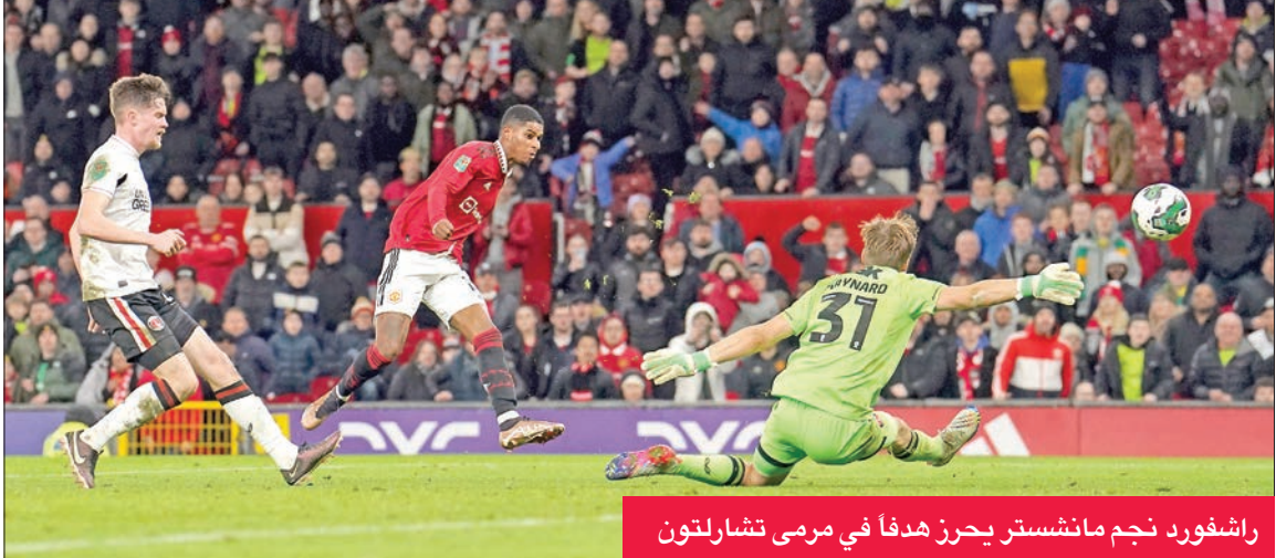
راشفورد نجم مانشستر يحرز هدفاً في مرمى تشارلتون

يحقق الاتحاد الإنكليزي لكرة القدم في مباراة كأس الاتحاد بين أوكسفورد يونايتد وأرسنال، التي فاز بها الغائز بنتيجة (3-0)، بسبب «أنماط مشبوهة متعلقة بالمراهنات». وفقاً للصحافة الإنكليزية، يتركز الاهتمام على البطاقة الصفراء التي تلقاها لاعب أوكسفورد يونائند.