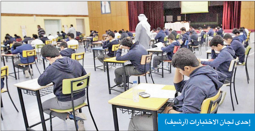
إحدى لجان الاختبارات (أرشيف)

«قروبات الغش» تطلب من مشتركها تصوير الاختبارات لتزويدهم بالحل