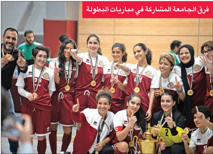
فرق الجامعة المشاركة في مباريات البطولة

شاركت فرق الجامعة الأميركية بالكويت في بطولة رابطة ألعاب القوى الجامعية UAAK لعام 2022-2023، حيث حققت الفوز في عدد من المباريات التي أقيمت على مدار ثلاثة أشهر، وفاز فريق كرة الصالات للسيدات بالمركز الأول، كما حصل فريق كرة السلة للرجال على المركز الثاني، بينما حل فريق كرة القدم للرجال في المركز الثالث.