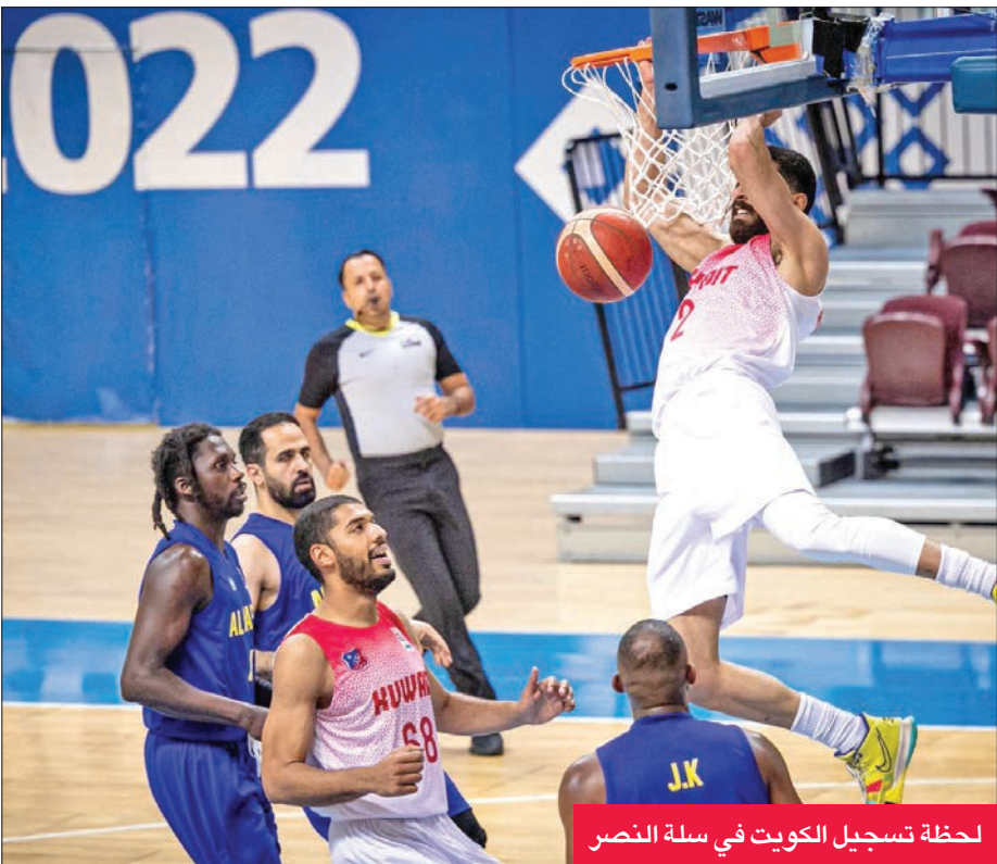
لحظة تسجيل الكويت في سلة النصر

وتبادل الفريقان التسجيل في الربع الثالث، مع استمرار أفضلية الأبيض في التسجيل من الداخل والخارج، الأمر الذي منحه التفوق مع نهاية هذا الربع 62-74، وترجم الكويت أفضليته في النهاية ليخرج فائزاً بنتيجة 83-106.