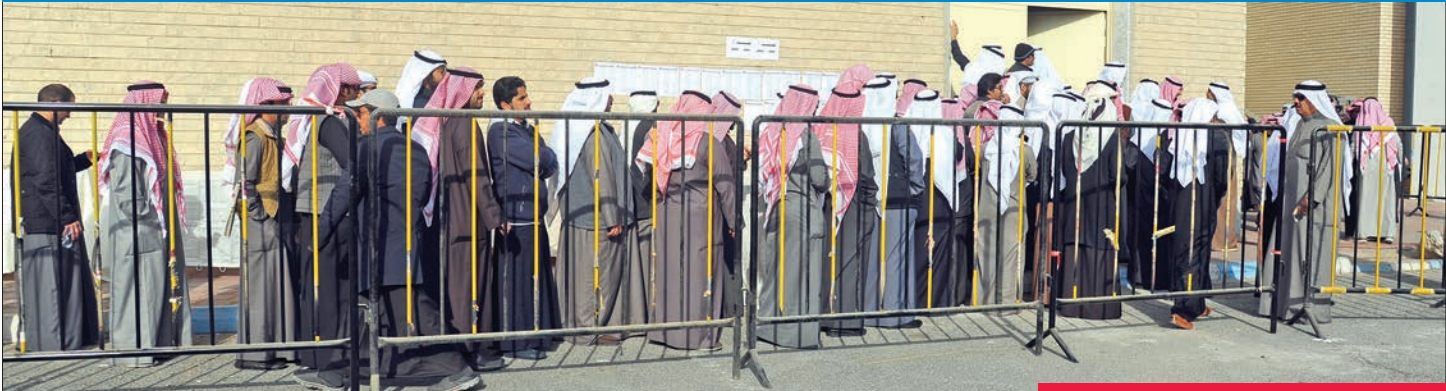
طوابير الناخبين في انتخابات سابقة