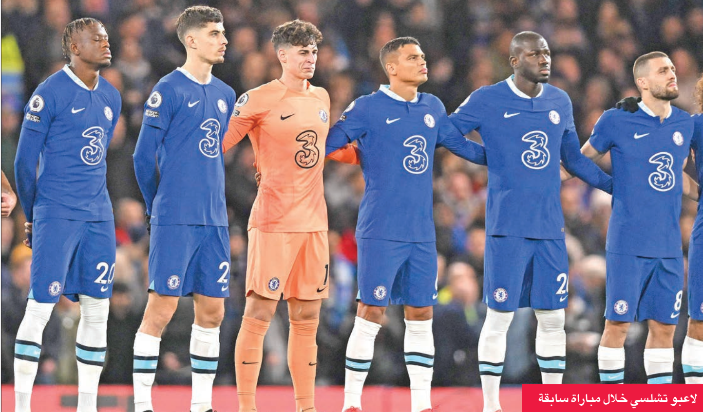
لاعبو تشلسي خلال مباراة سابقة

أكد مهاجم فالنسيا، الأوروغواي إيديسون كافاني، أنه إذا تمت معاقبته من قبل لجنبة الانضباط في «فيفا» لضربه شاشة حكم الفيديو المساعد (فار) في نهاية مواجهة غانا التي انتهت بإقصاء منتخب بلاده من مونديال قطر 2022، حيث طالب الفريق بركلتي جزاء، فإنه ينبغي وضع حكم تلك المباراة، الألماني دانيال سيبرت «في السجن». وفي مقابلة نشرتها إذاعة كاتينا سير الإسبانية، يوم الثلاثاء، قال كافاني: «إذا عاقبوني على ضرب شاشة (الفار) لإصاأنا من كأس العالم، فليهم وضع الحكم في السجن، لأنها أخطاء لا يمكن أن ترتكب في ظل وجود (الفار) وكل هذه الكاميرات وكل هؤلاء الحكام الذين يقفون خلفها».