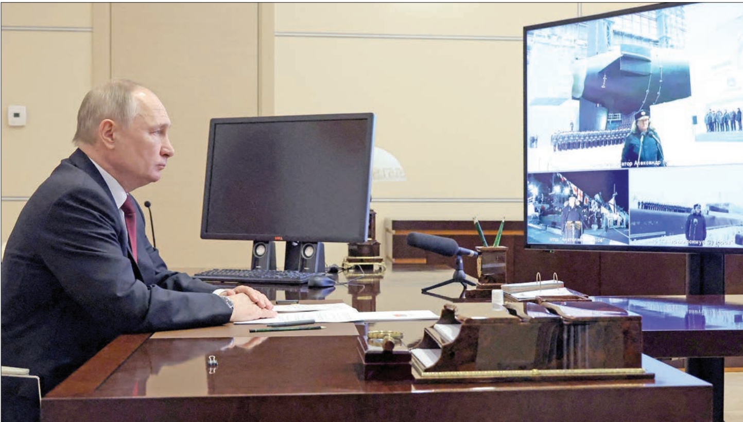
بوتين يشهد مراسم رفع الرايات البحرية من مقر إقامته خارج موسكو أمس

شدد وزير الخارجية التركي مولود جاووش أوغلو على أنه «لن نسمح لليونان بالتوسع ولو ميلا واحداً في المياه الإقليمية ببحر إيجة». وحذر جاووش اليونان «من الانجرار خلف المغامرات والجري وراء عنتريات زائفة»، قائلاً: «فالتحدي لن تكون أبداً جيدة لكم» وادعت صحيفة يونانية الأحد أن الحكومة ستسعد لتوسيع مياهها الإقليمية إلى 12 ميلاً جنوب وغرب جزيرة كريت، اعتباراً من مارس المقبل.