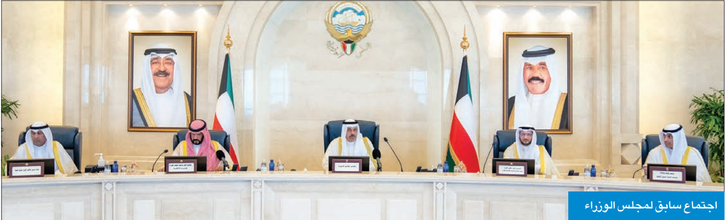
اجتماع سابق لمجلس الوزراء

بشأن حقوق الأشخاص ذوي الإعاقة والمحال إلى المجلس بالمرسوم رقم 213 لسنة 2019 بتاريخ 2019/8/21.