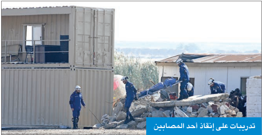
تدريبات على إنقاذ أحد المصابين