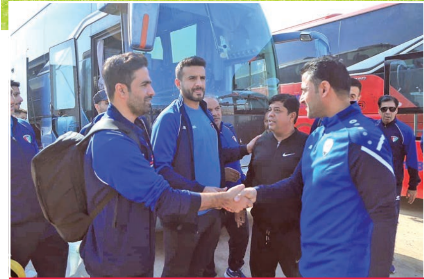
وصول وفد منتخب الكويت ظهر أمس الخميس إلى البصرة عبر منفذ سفوان الحدودي