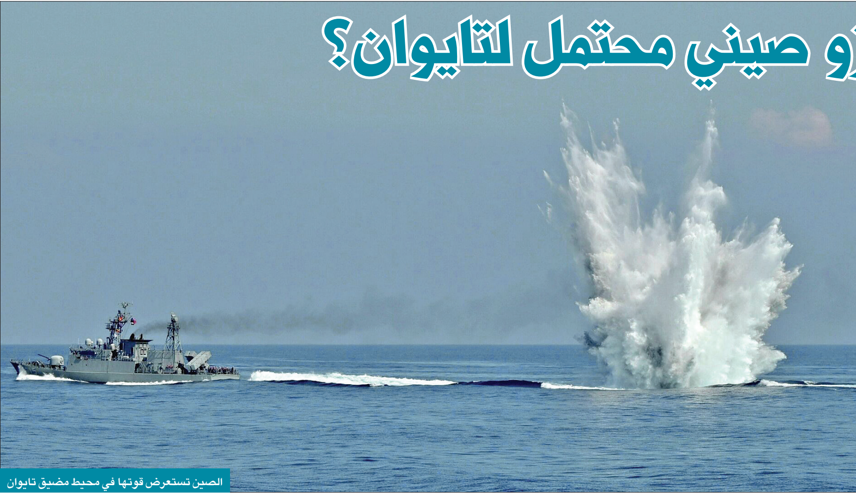
الصين تستعرض قوتها في محيط مضيق تايوان

من وجهة نظره، وتفضّل بكين أن تستسلم الحكومة التايوانية كي تمتنع واشنطن عن التدخل، لكن تسانغ يتوقع أن تعزز تايوان دفاعها وتحارب بكل قوتها، كما تفعل أي ديموقراطية حيوية في هذه الظروف. براي تسانغ، يهدف خطاب بكين إلى إقناع الناس بأن تحركاتها تتعلق بتوحيد الصين مع أنها ترتبط فعلياً بهدف أكبر حجماً: إفلاس الاستراتيجية الأميركية في منطقة المحيطين الهندي والهادئ، وتحويل تايوان إلى معقل لتوسيع الهيمنة الصينية في المحيط الهادئ. أخيراً، يقول تسانغ إن السيطرة على تايوان هي خطوة أساسية من «الحلم بتجديد الوطن».