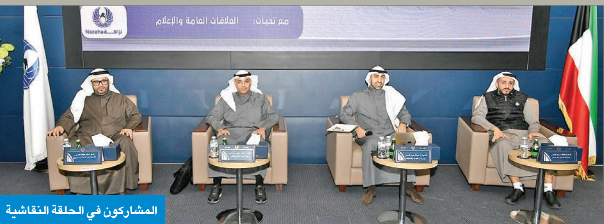
المشاركون في الحلقة النقاشية

يمكن جذب المستثمر الأجنبي إلا عند وجود بيئة مالية صالحة ومتوافقة مع المعايير والقوانين الدولية، مضافاً أن هذه الحلقة النقاشية تأتي استكمالاً لتفكير المبادرات الواردة في استراتيجية الكويت لتعزيز النزاهة ومكافحة الفساد وخصوصاً في محور القطاع الخاص. وأشار إلى أن القطاع الخاص هو أحد طرقي المعادلة في مكافحة الفساد، سواء كان محفزاً أو ضحية للفساد، مبيناً أن الحلقة النقاشية تتضمن مراجعة الأطر القانونية لدور مراقب الحسابات ومدى مواكبتها للتجارب والممارسات الدولية الناجحة.