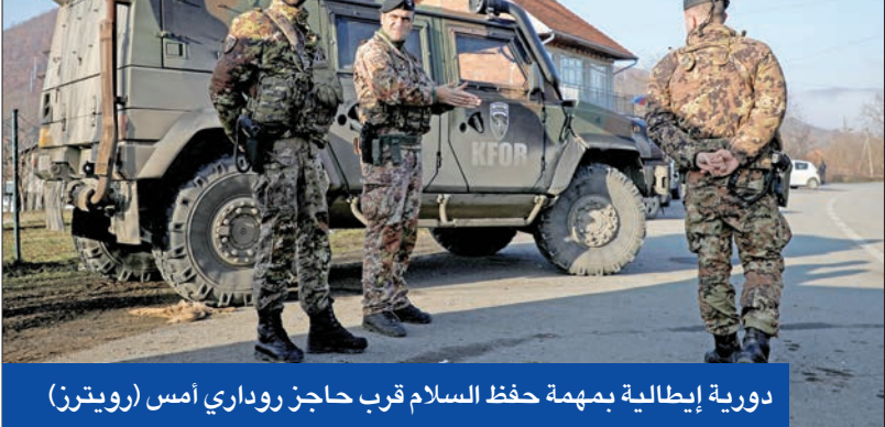
دورية إيطالية بمهمة حفظ السلام قرب حاجز روداري أمس

بيلاروسيا تعلن إسقاط صاروخ «إس-300» أوكراني