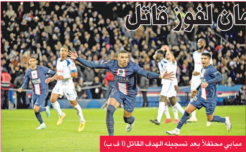
مبابي محتفلاً بعد تسجيله الهدف القاتل

لاحتساب ركلة جزاء ترجمها هدف موندrial قطر بنجاح (6+90).