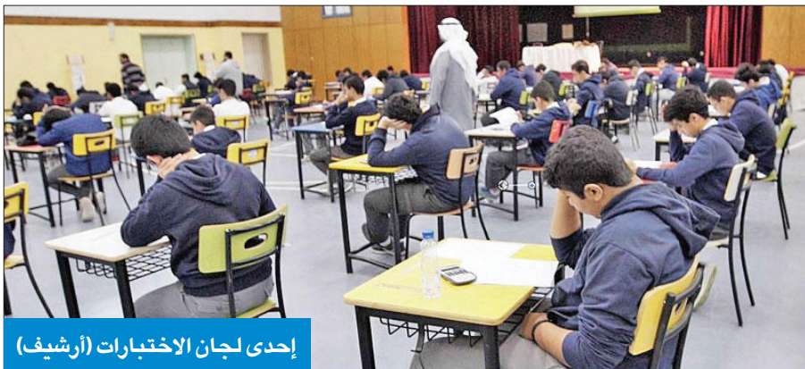
إحدى لجان الاختبارات (أرشيف)

10 ملايين دينار «بدل شاشة» لـ 45 ألف معلم عن سنة «كورونا» تُصرف في يناير