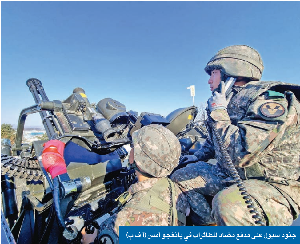
جنود سيول على مدفع مضاد للطائرات في يانغجو (ا ف ب)

وحل كيم في تقريره، الذي قدّم في اليوم الثاني من اجتماع عام للجنة المركزية للحزب الحاكم أمس الأول، «الوضع الجديد القابل للتحدي الذي