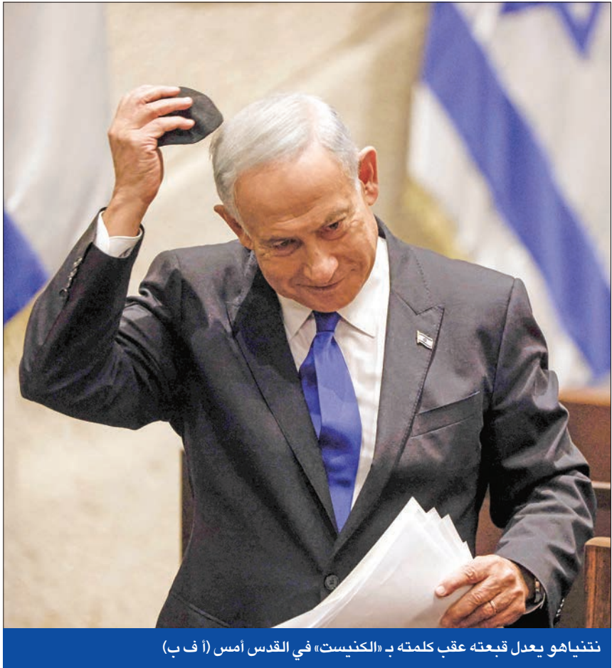
ننتياهو يعدل قبعته عقب كلمته بـ «الكنيست» في القدس أمس

وجرت مراسم تسليم وتسلم سريعة من وزير الوزراء المنتهي ولايته، والذي أصبح زعيماً للمعارضة، يائير لابيد، إلى ننتياهو الذي تمكن من تشكيل الائتلاف الحكومي بعد خامس انتخابات تشريعية تجري خلال خمس سنوات. وتشكلت الحكومة المثيرة للجدل والتي