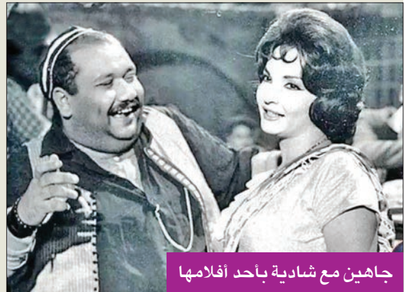
جاهين مع شادية بأحد أفلامها

والطين»، و«رباعيات صلاح جاهين»، كما تجري طباعة باقي الأعمال التي نُفذت في كتب منفردة.