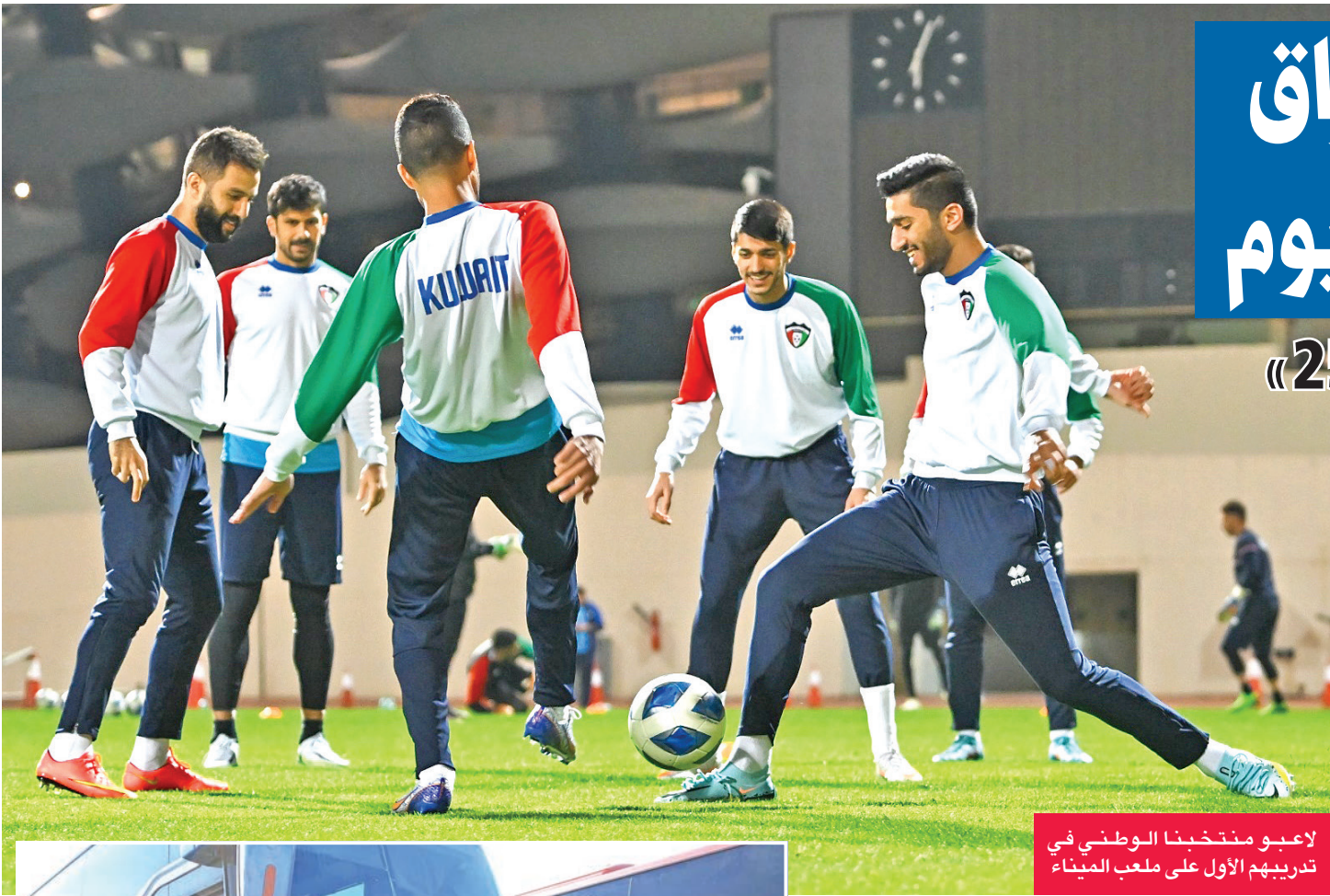
لاعبو منتخبنا الوطني في تدريبهم الأول على ملعب الميناء