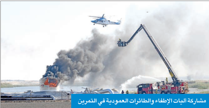
مشاركة آليات الإطفاء والطائرات العمودية في التمرين