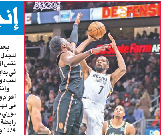
دورانت يحاول التسجيل خلال المباراة

وبفوزه بفارق نقطة على أتلانتا هوكس الأربعاء (108 - 109)، سجل نتس انتصاره العاشر