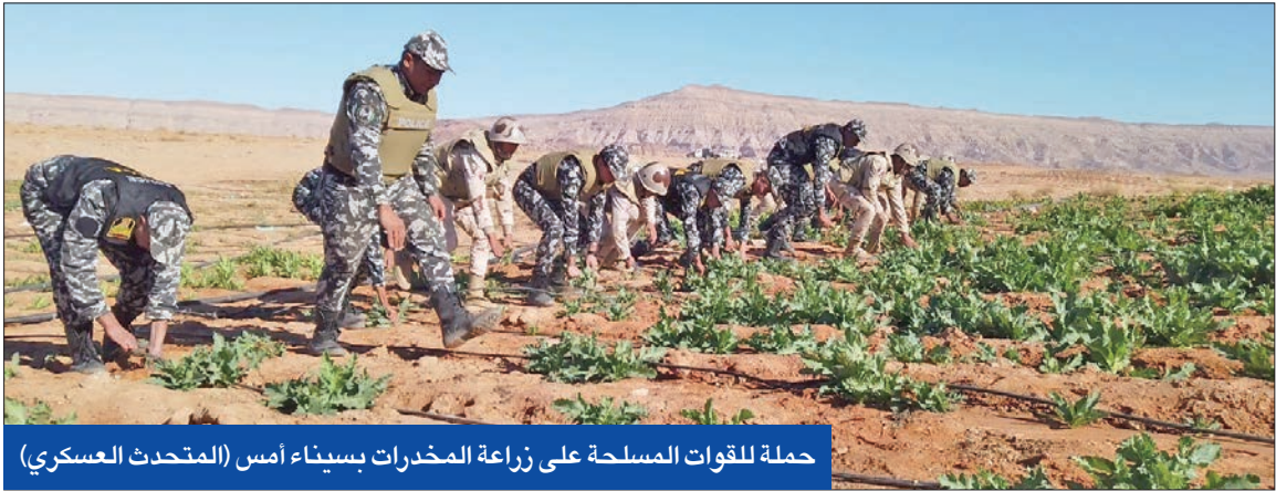
حملة للقوات المسلحة على زراعة المخدرات بسيناء أمس (المتحدث العسكري)

وسط تحذيرات من استغلال روسيا النزاع ضد الاتحاد الأوروبي، بدأ صرب كوسوفو، أمس، تفكيك الحواجز التي نصبوها على الحدود حسب لقطات بثها التلفزيون الحكومي الصربي.