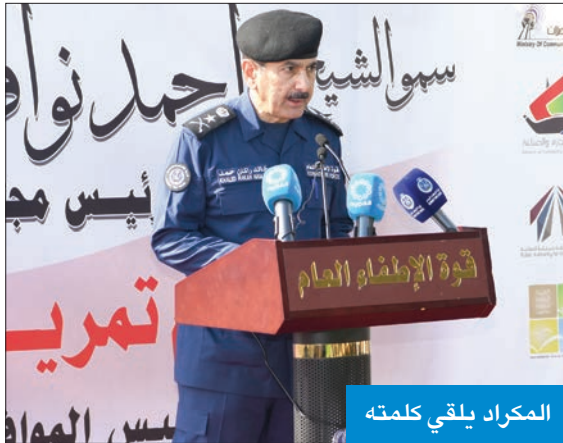
المكراد يلقي كلمته