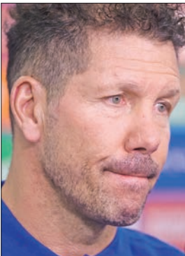
دييغو سيميووني (إف)