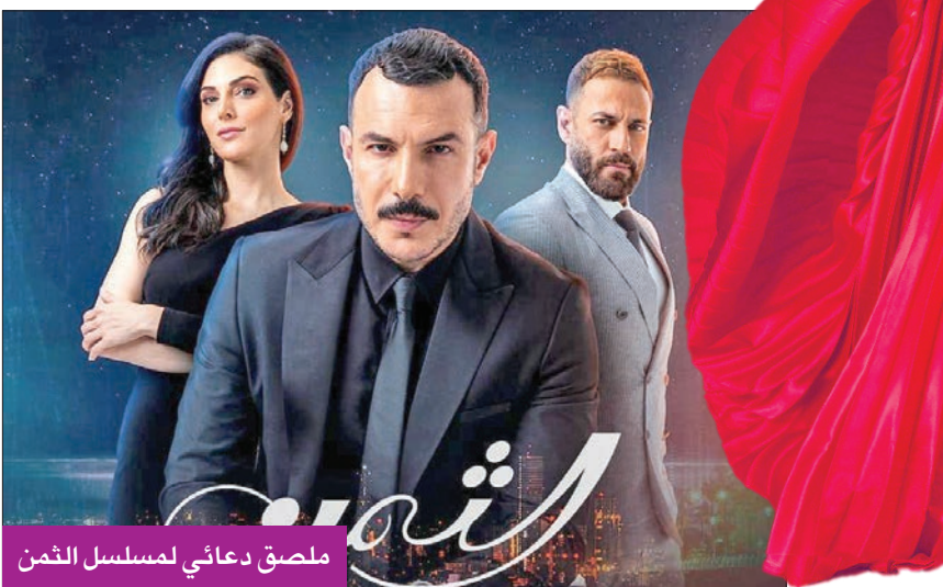
ملصق دعائي لمسلسل الثمن