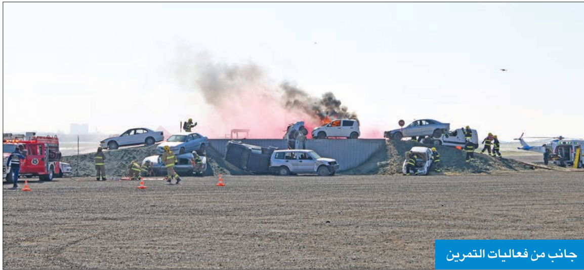
جانب من فعاليات التمرين

في التعامل واحتواء أي حادث أو كارثة سواء طبيعية أو بشرية.