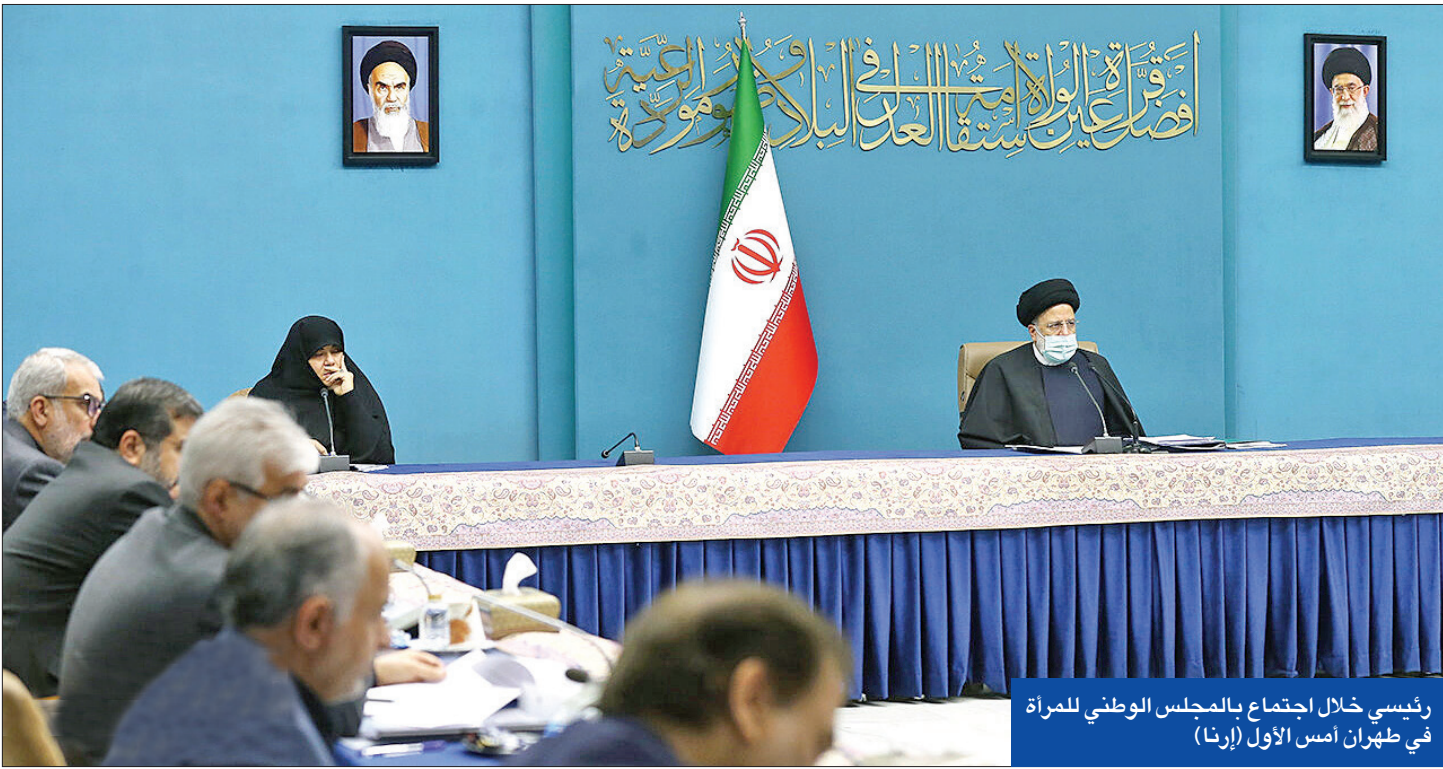
رئيسي خلال اجتماع بالمجلس الوطني للمرأة في طهران أمس الأول (إرنا)

روحاني يتهمه بالفشل ويتوقع ثورة نسائية ونجاد يحمله مسؤولية الاضطرابات وخاتمي يتوقع نهاية النظام