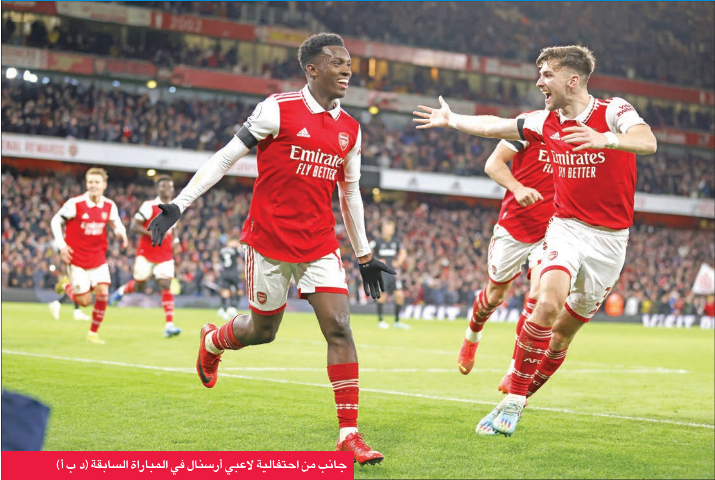
جانب من احتفالية لاعبي أرسنال في المباراة السابقة (د ب أ)