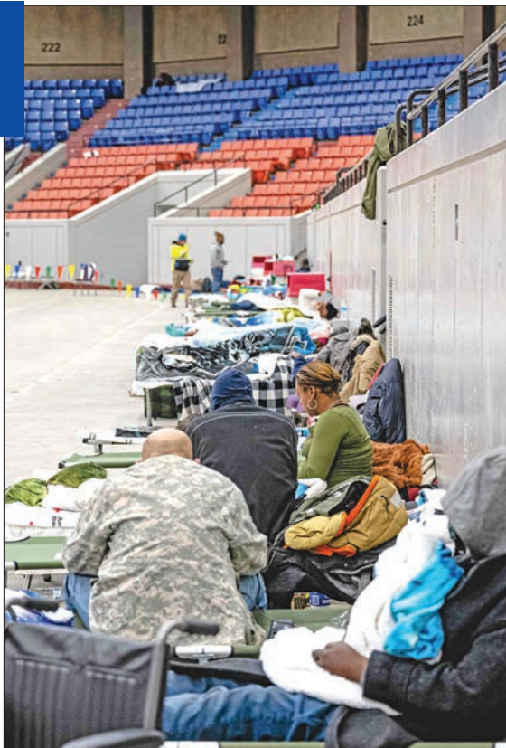
مشردون بماوى للطوارئ في صالة رياضية بكنتاكي أمس الأول

وقال الرئيس التنفيذي لمقاطعة إري مارك بولونكارن: «ما زال هناك على الأرجح مئات الأشخاص العالقين داخل مركباتهم وتم