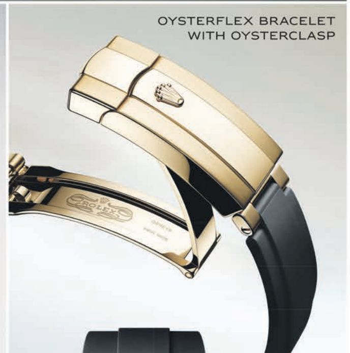
OYSTERFLEX BRACELET WITH OYSTERCLASP