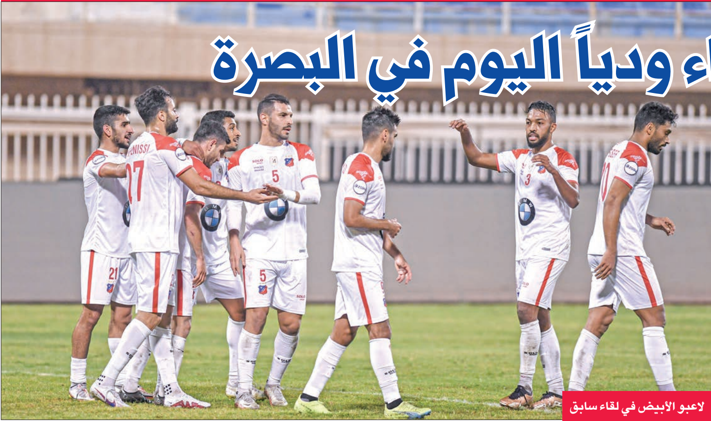
لاعبو الأبيض في لقاء سابق