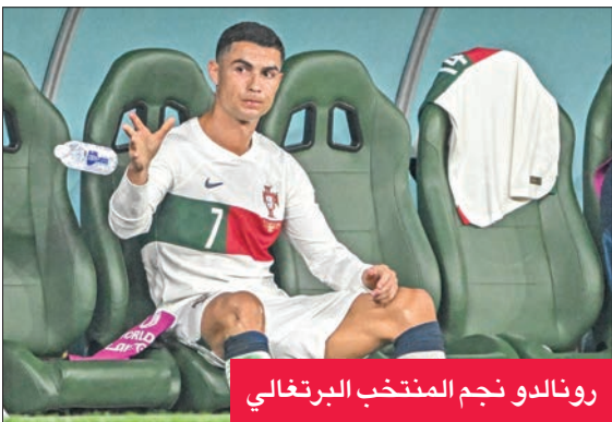
رونالدو نجم المنتخب البرتغالي

وذكر الموقع الإسباني في تقريره أن «رواية مستقبل رونالدو على وشك الوصول إلى فصلها الأخير، حيث اقترب من الانضمام لنادي النصر السعودي» وأوضح الموقع وفقاً لمصادر وصفاً بالمقربة، أن «رونالدو سيحضر اليوم في مباراة الكلاسيكو بين النصر والهلال، كضيف شرف بارز لمملي ناديه المقبل».