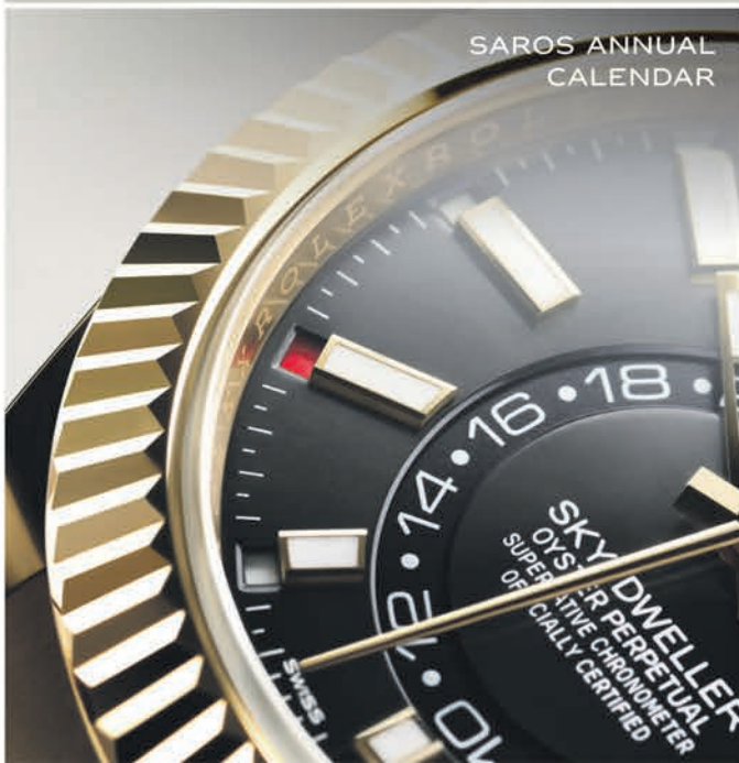
SAROS ANNUAL CALENDAR