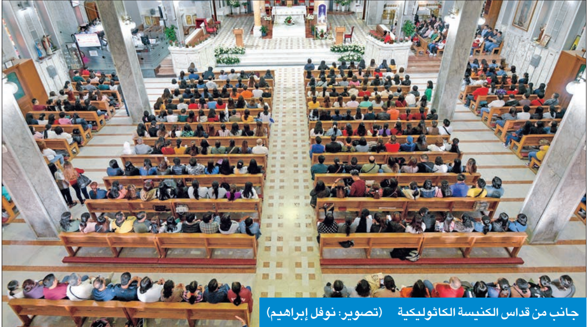
جانب من قداس الكنيسة الكاثوليكية