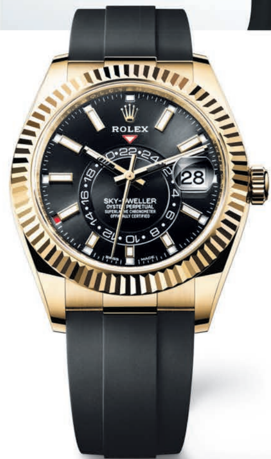
OYSTER PERPETUAL SKY-DWELLER