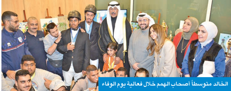
الخالد متوسطاً أصحاب الهمم خلال فعالية يوم الوفاء

ديسمبر حافل بالفعاليات التوعوية والرياضية والاجتماعية الخاصة بذوي الإعاقة، مشيدة بتنظيم المحافظة ليوم الوفاء لذوي الإعاقة ونجاحها في دعم هذه الفئة، وزيادة الوعي بأهمية إدماجهم في الحياة الاجتماعية، التي تعتبر جزءاً من حقوقهم المجتمعية.