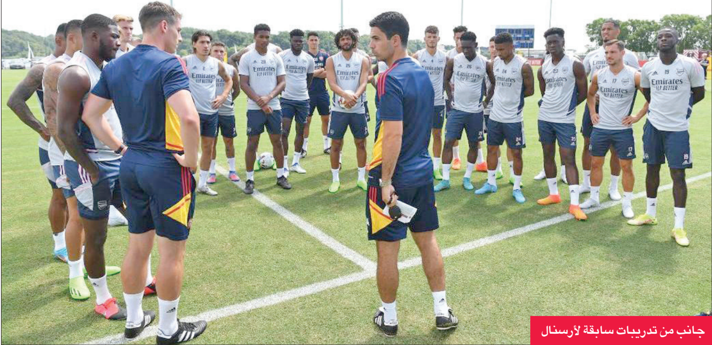
جانب من تدريبات سابقة لأرسنال

فجوة بيننا وبين المراكز الأولى بجدول الترتيب... لكننا نعتبر أنفسنا في لحظة القتال، وهذا يعني أن علينا المطاردة، وهو ما سنفعله» وأضاف «أرست علامات جيدة أمام مانشستر سيتي في مواجهة الماضية، ولم أكن سعيداً بكل شيء، لم تعجبني هجمائنا المرتدة... كل اللاعبين الذين عادوا من كأس العالم أصبحوا جاهزين، وهذا مهم» وفي باقي المباريات بلتقي إيفرتون مع وولفرهامبتون، وساونثامبتون مع برايتون، وكريستال بالاس مع فولهام.