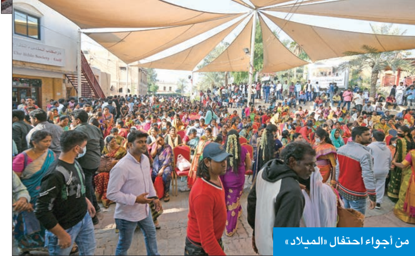
من أجواء احتفال «الميلاد»

الذكرى تتجدد كل عام، حيث يحتفل بها المسيحيون بكل طوائفهم، تخليداً لذكرى ميلاد السيد المسيح الذي جاء ليعلن لجميع بني البشر محبته، ولكي يخلصهم من الخطيئة ويعطيهم الحياة الأبدية. كما احتفلت الكنيسة الكاثوليكية بعيد الميلاد وأقيم قداس بالمناسبة تخللته عظات دينية عن معاني الميلاد. وقد شهدت المناطق والطرق المحيطة بالكنائس ازدحاماً كبيراً، فيما اتخذت القوى الأمنية تدابير لتسهيل وصول المؤمنين وتيسير حركة المرور.