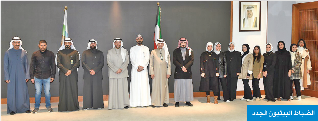
الضباط البيئيون الجدد

المخالفة، وتحال إلى فريق مختص للنظر فيها، والتأكد من الإجراءات التي قام بها الضباط البيئي وحال كان هناك أي قصير أو خطأ يتم التعامل معه وفق الإجراءات القانونية المتبعة، حيث إن أي خطأ إجرائي يضعف الجهود المبذولة، لافتاً إلى أهمية التأكد من الإجراءات المعمول بها في متابعة البلاغات والشكاوى وإتمام تسجيل المخالفات وفق المواد القانونية الواردة في قانون هيئة البيئة.