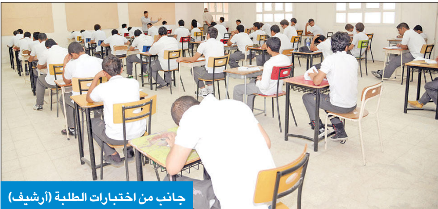
جانب من اختبارات الطلبة (أرشيف)

الاجتبارات للوضع التعليمي في المدارس وتقليص أيام الدراسة نتيجة بعض الظروف التي حصلت وأثرت على تحصيلهم العلمي