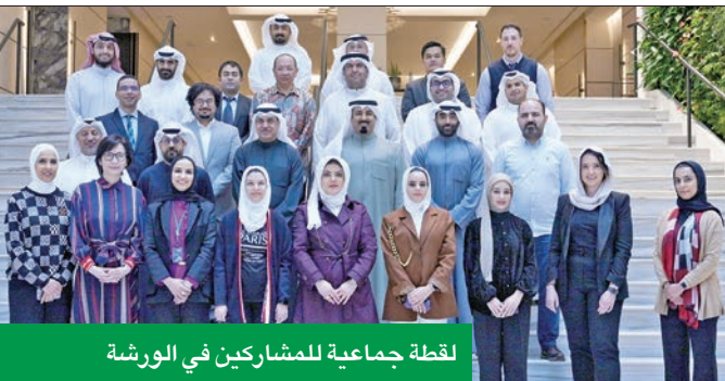
لقطة جماعية للمشاركين في الورشة