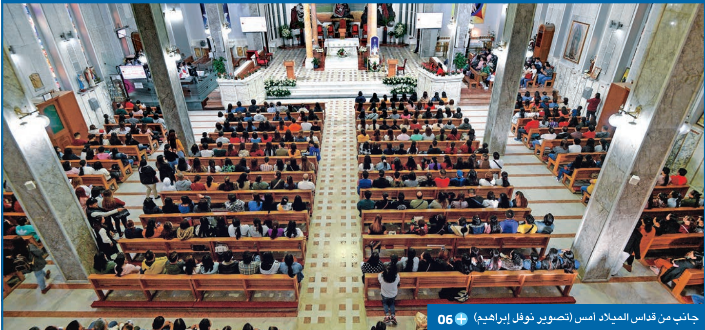
جانب من قداس الميلاد أمس +06