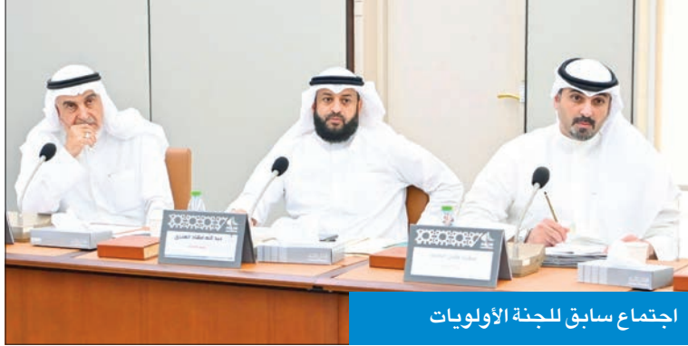
اجتماع سابق للجنة الأولويات

بعبارة «الخدم الخصوصيين»، وعبارة «عامل منزلي خصوصي» بعبارة «خادم خصوصي»، حيثما ورد في النص عليهم في القوانين ذات الصلة، على أن يتم العمل بهذا القانون ابتداء من تاريخ نشره في الجريدة الرسمية.