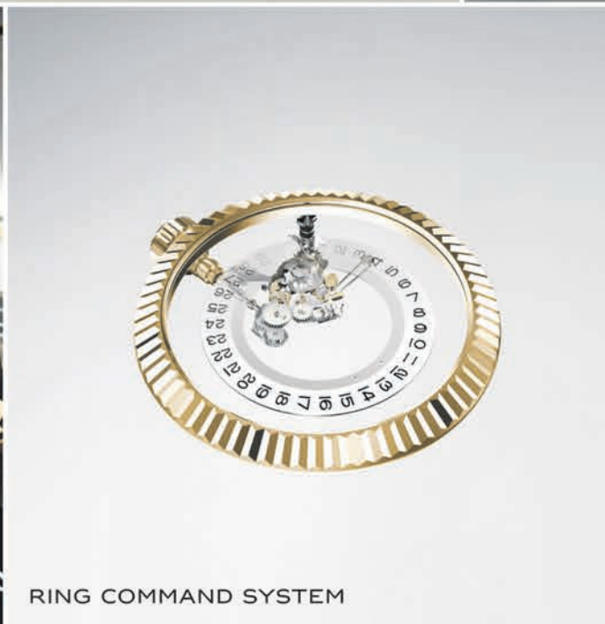
RING COMMAND SYSTEM