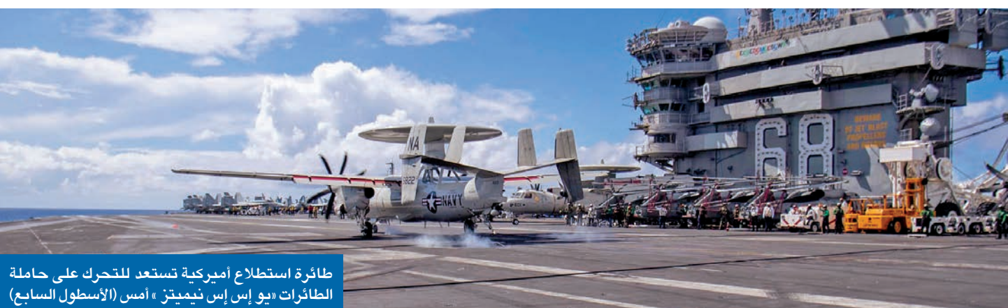
طائرة استطلاع أميركية تستعد للتحرك على حاملة الطائرات «يو إس إس نيميتز» أمس (الأسطول السابع)

حرب أوكرانيا، ذكر وانغ أن روسيا والصين عمقتا علاقات حسن الجوار والصداقة، وأصبح التعاون الاستراتيجي الشامل بينهما «أكثر نضجاً وثباتاً». والقي الوزير باللوم على الولايات المتحدة في تدهور العلاقات، وقال إن الصين «رفضت رفضاً قاطعاً سياستها 02 <<