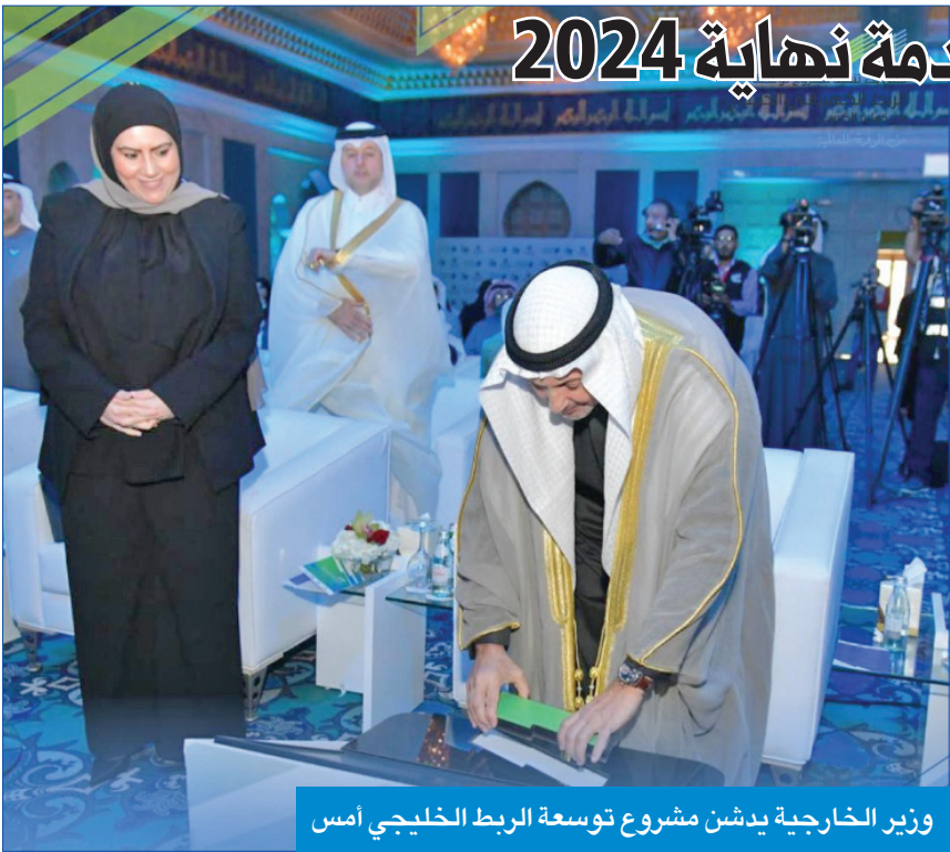
وزير الخارجية ي دشّن مشروع توسعة الربط الخليجي امس

بتكلفة 270 مليون دولار لضمان استدامة أمن الطاقة... وبدء الخدمة نهاية 2024