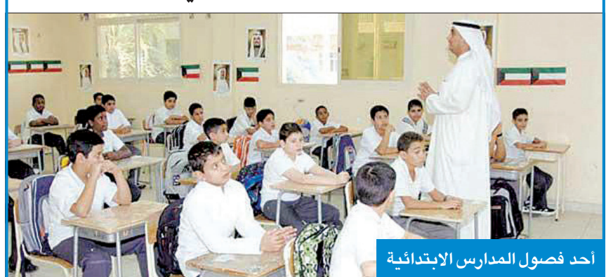
أحد فصول المدارس الابتدائية

الشهادات الأسبوع المقبل ومشروع بـ «الأحمدي» لتقوية الطلاب