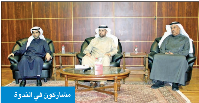
مشاركون في الندوة