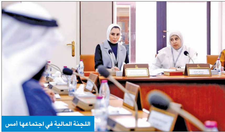
اللجنة المالية في اجتماعها أمس

نافذاً حول العفو لكن الإطالة والتعطيل قتلا الفرحة في نفوس الأسر الكويتية. وأضاف هاييف: في ظل التعاون بين الحكومة والمجلس يجب ألا تغفل الحكومة ملفات وقضايا عالقة منذ حكومات سابقة ولا تزال موجودة وتسببت في أزمات سياسية، ولا بد أن تكون ضمن أجندة الحل، وطلب معالجة القروض وقانون الانتخاب والمفوضية العليا للانتخابات حق لها، وقبول الطلب بعدم الانفعال كما كان يحصل مع حكومات سابقة.