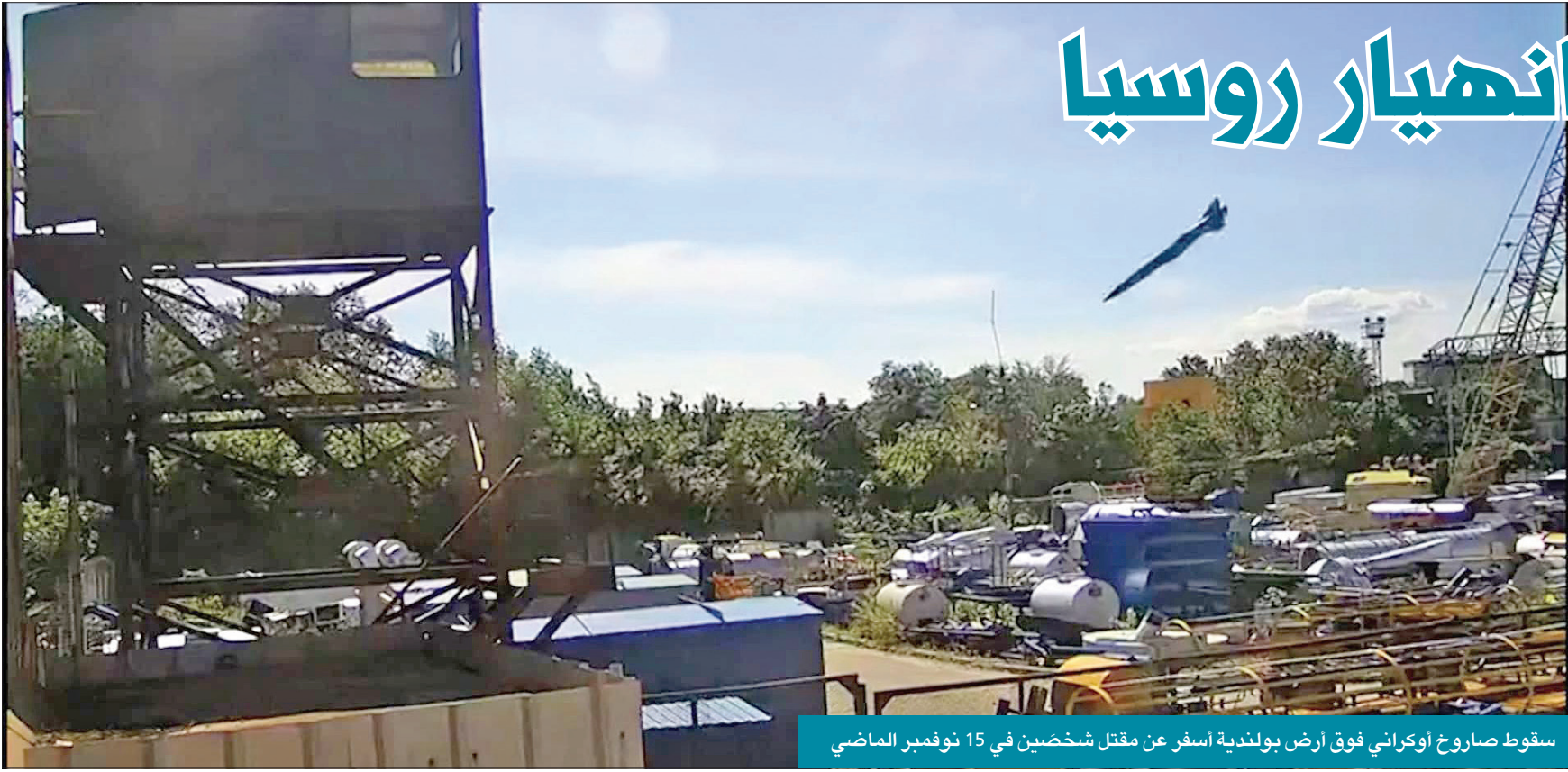
سقوط صاروخ اوكرايني فوق ارض بولندية اسفر عن مقتل شخصين في 15 نوفمبر الماضي

حول ارتباط توسع الناتو بتنامي عدائية روسيا، لكن يدرك جيران روسيا جيداً أن الناتو ليس مسؤولاً عن الإمبريالية الروسية العدوانية القائمة منذ قرون، أي قبل نشوء الحلف بكثير، وتبين أصلاً أن توسع الناتو كان أنجح وسيلة لاحتواء موسكو، ولا مفر من أن تتراجع روسيا حين تردعها جهة أقوى منها. في النهاية، قد تكون شجاعة الأوكرانيين وتصميمهم على الدفاع عن استقلالهم فرصة تاريخية للولايات المتحدة وأوروبا لتوجيه ضربة حاسمة ضد الإمبريالية الروسية القوية الغربية الكبرى تتردد حتى الآن في دعم هذا التوجه، وتحظى أوكرانيا بدعم قوي من دول البلطيق وبولندا، وهي تَصير على أهمية محاربة روسيا وعزلها ومعاقبتها إلى الاستفراق، لكنها شجعت روسي وتُدفع تعويضات عن أضرار الحرب، وتسلم الروس المتهمين بارتكاب جرائم حرب لمحاكمتهم. ستكون هذه العملية طويلة وشاقة، وهي تتطلب تغييراً في منطق التفكير الغربي، لكنها مقاربة ضرورية لتصحيح أخطاء الماضي في طريقة التعامل مع العدوان الروسي، وفي نهاية المطاف، ستكون أوكرانيا الحرة، والديموقراطية، والأمنة على حدودها، والمندمجة بالكامل مع المجتمع العابر لآتلانتيك، أفضل فرصة ممكنة لإحداث تحول عميق داخل روسيا، إنها النتيجة الحقة لسلام حقيقية يوماً في علاقات روسيا مع جيرانها.