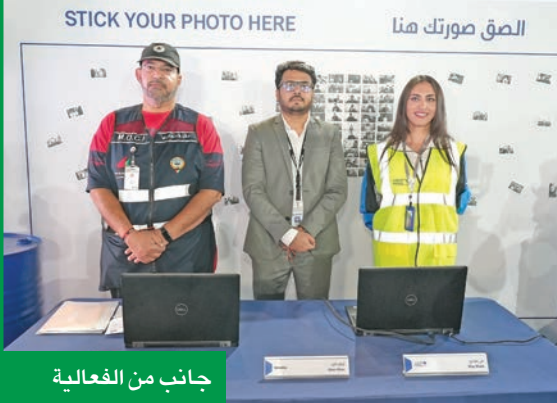
جانب من الفعالية