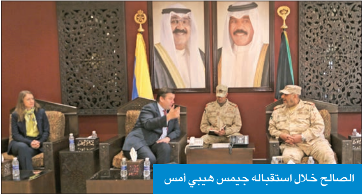
الصالح خلال استقباله جيمس هيبى أمس

استقبل رئيس الأركان العامة للجيش الفريق الركن خالد الصالح، في ديوان رئاسة الأركان، صباح أمس، وزير القوات المسلحة البريطانية وعضو البرلمان جيمس هيبى، ترافقه سفيرة المملكة المتحدة لدى البلاد بليندا لويس.