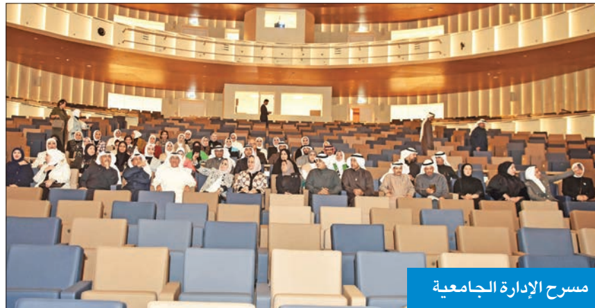
مسرح الإدارة الجامعية

الصرح الجامعي جميل وعلى ملايين الأمتار المربعة في مدينة جامعية تحتوي على جميع الكليات، وإضافة إلى ذلك تضم مباني ثقافية وتعليمية وترفيهية، وفي المستقبل ستضم مدارس نموذجية تابعة لكلية التربية، ومباني رياضية، وسيكون هناك تعاون مع وزارة الصحة وبقية وزارات الدولة، مشيرة إلى أنها