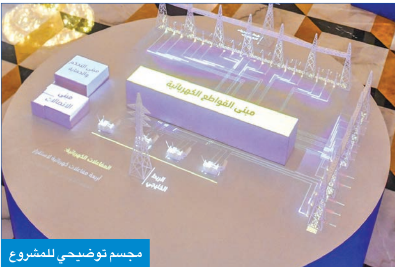
مجسم توضيحي للمشروع