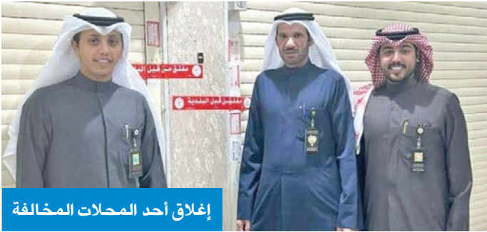
إغلاق أحد المحلات المخالفة

تمكن رجال الإدارة العامة للمباحث الجنائية ممثلة بإدارة حماية الآداب العامة والاتجار بالأشخاص من ضبط فتاتين تنتميان إلى إحدى الشبكات الدولية المختصة بالأعمال المنافية للأداب مقابل مبالغ مالية. وقالت إدارة «المباحث الجنائية» أنه بعد التحريات والتدقيق من قبل رجال مباحث الآداب اتضح أن المتهمتين دخلتا البلاد بسمة دخول سياحية بهدف ممارسة الأعمال المنافية بمقابل مادي. وأضافت الإدارة أن رجال المباحث أحوالوا المتهمتين