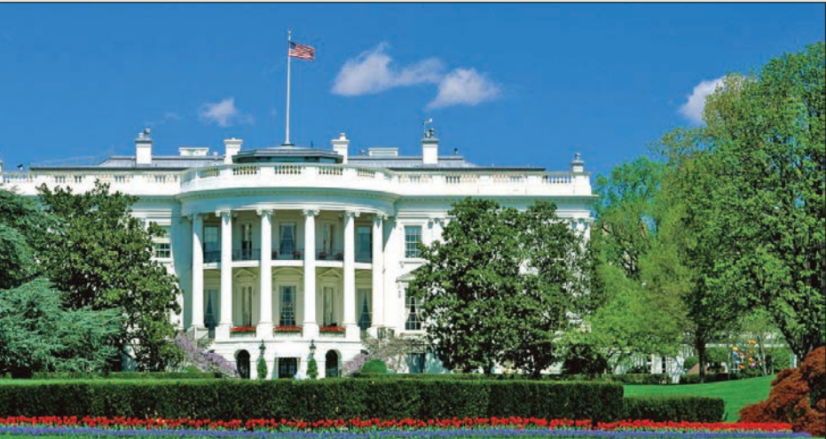
في 12 نوفمبر الماضي نشر البيت الأبيض أحدث نسخة من استراتيجية الأمن القومي في عهد الرئيس الأمريكي جو بايدن الذي يظهر في الإطار

على تطوير تصاميم جديدة للأسلحة بدل الانكفاء بتحديث أنظمة التسلح القائمة، وتستطيع الولايات المتحدة أن تنفذ هذه المهمة بمساعدة الحواسيب الفائقة ومن دون انتهاك قرار تعليق التجارب النووية، لكنها قد توجّع الرغبة في زيادة هذا النوع من الاختبارات في دول نووية أخرى، مما يؤدي إلى إضعاف القيمة المعيارية لمنظمة معاهدة الحظر الشامل للتجارب النووية. على صعيد آخر، زادت استراتيجية إدارة بايدن الجديدة التركيز على مفهوم الردع المتكامل الذي يتجاوز حدود الردع التقليدي والنووي، فوفق أحدث نسخة من استراتيجية الأمن القومي، يجب أن يندمج نظام الردع مع مختلف القطاعات، بما في ذلك المجالات العسكرية وغير العسكرية، لكن يُفترض أن يشمل أيضاً مختلف المناطق وبتجاوز الصراعات ونطاق التحالفات والشركات الأمريكية، فمن جهة، يزيد هذا التوجه خطر الاشتباكات، لكنه يشير من جهة أخرى إلى رسم خطوط أكثر وضوحاً للمعارك، فتتراجع