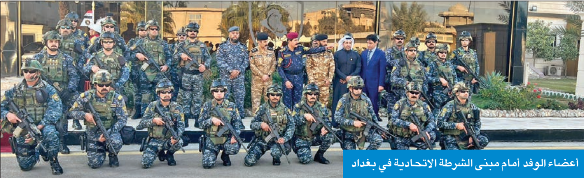
أعضاء الوفد أمام مبنى الشرطة الاتحادية في بغداد