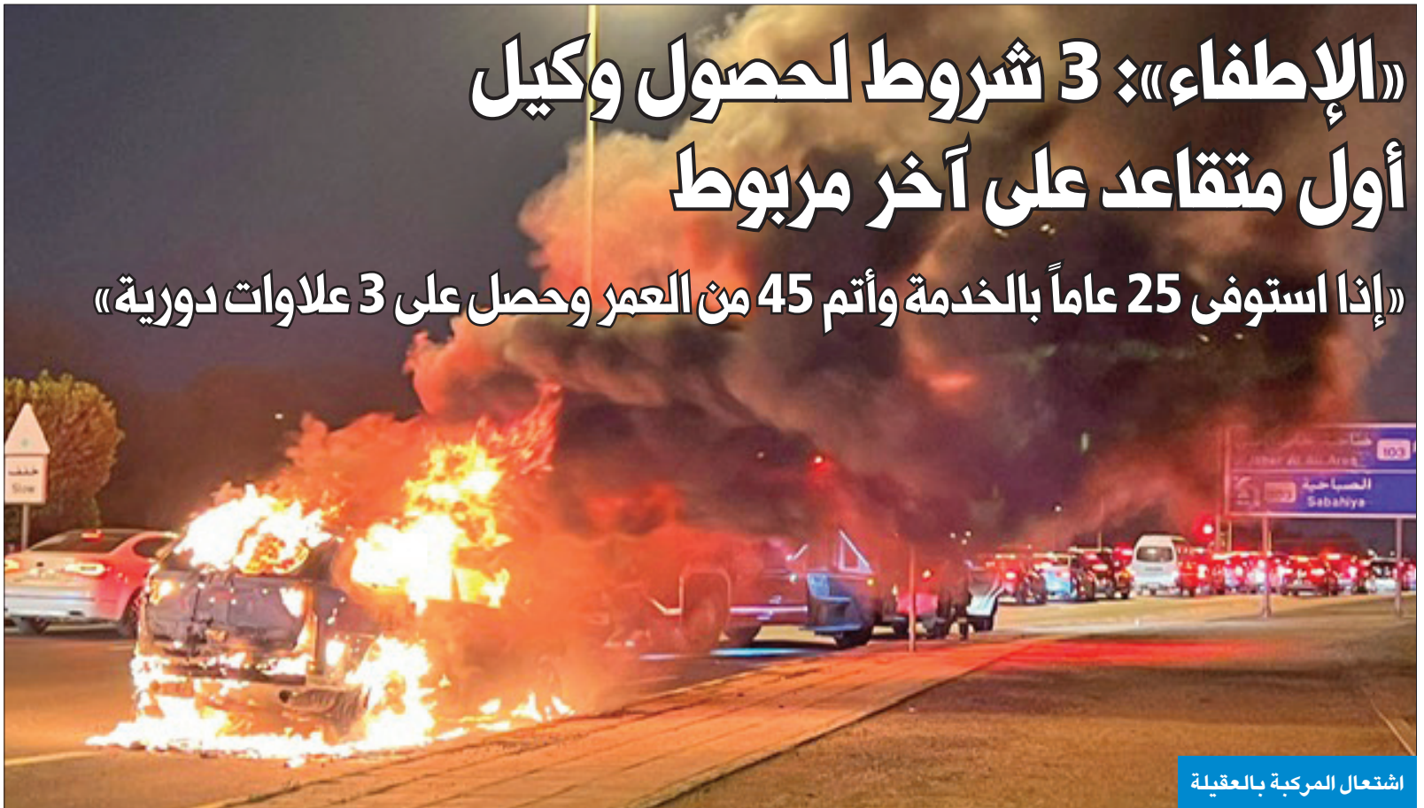
اشتعال المركبة بالعقيلة

بدأت وزارة الكهرباء والماء، أمس، صرف مبالغ بيع الإجازات لموظفيها المستحقين وفق الآلية التي تم تحديدها للصرف من المبالغ المرصودة لهذا الشأن. وقالت مصادر مطلعة إنه تم البدء بالموظفين المستحقين ممن يبلغون 60 عاماً وما فوق، وهم قلة في الوزارة، بهدف الانتهاء من الشرائح المختلفة المستحقة التي تستوفي الشروط الواجبة. ولفتت المصادر إلى أن هناك آليات مختلفة للصرف الأولى فيما يتعلق بشرحية السن، كما أن هناك الموظفين الجدد أصحاب الرواتب المنخفضة وكذلك الموظفين بالأقدمية.