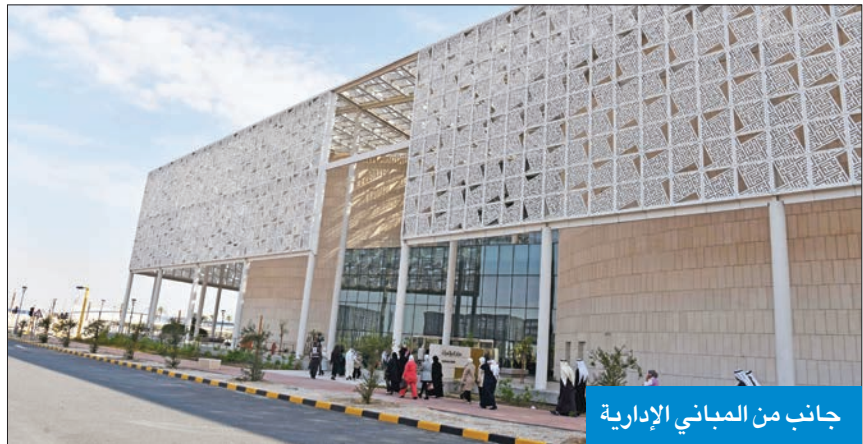
جانب من المباني الإدارية

تشكيل فريق مع جامعة عبدالله السالم لتنظيم وترتيب تسليم المباني القديمة