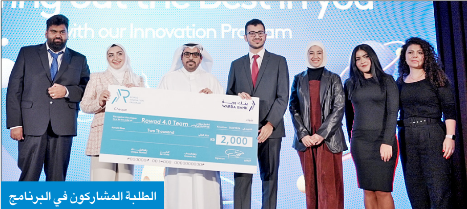
الطلبة المشاركون في البرنامج

وتأتي هذه المشاركة لتعكس اهتمام الجامعة بتشجيع طلبتها وتطوير مهاراتهم، إذ توفر لهم فرصة تطبيق معارفهم في القطاع المصرفي الحيوي، الأمر الذي يضمن تأهيل الطلبة للانخراط في سوق العمل بعد التخرج.