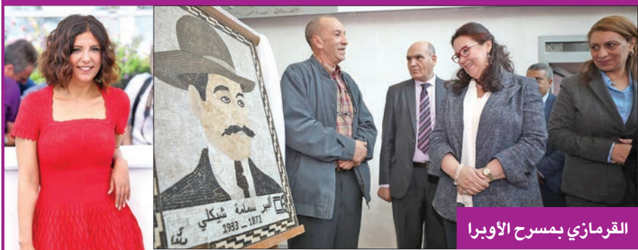
القرماني بمسرح الأوبرا

شارك في العديد من الأبحاث العلمية التي قام بها الأطلس منذ عملها به، وشاركت في كتاب الأبحاث لمهرجان الاسماعيلية الدولي للفنون الشعبية عامي 1995 و2010 وتعمل بالأطلس حتى الآن. وصدرت لها مجموعات شعرية عدة، منها: «اعترافات عاشقة قروية»، و«العشق تيمية جنوبية»، و«تفاصيل ضد... تفاصيل مع»، و«أيام للموتى»، و«تاريخ النعامة»، و«عدسات لاصقة لعبور نهر»، و«قبل هروب أنجلينا جولي»، و«بهية اسم للبقاء».