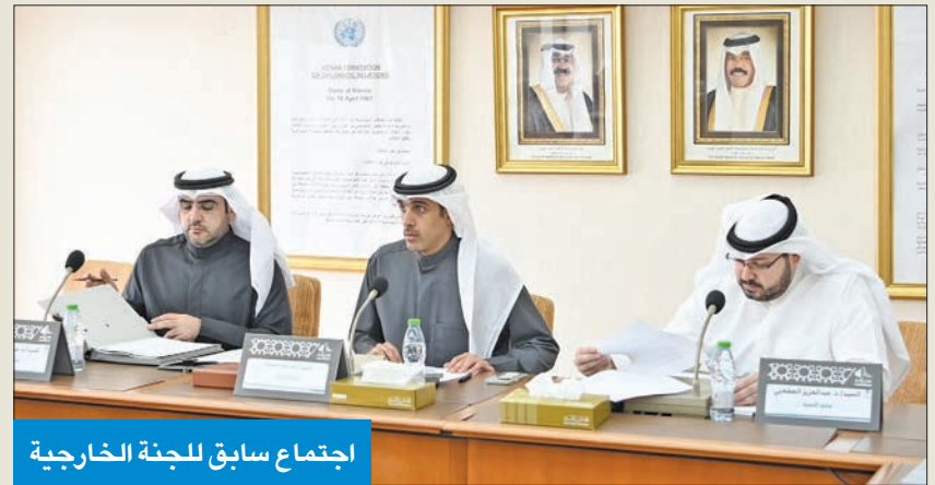
اجتماع سابق للجنة الخارجية

وذكرت أن على الحكومة اتخاذ كل الوسائل اللازمة لحماية المبنى ومنع اقتحامه أو الإضرار به مادياً أو الإخلال بأمنه أو الحط من كرامته، على ألا تستعمل مباني المكتب في أغراض تتنافى مع صلاحياته وأهدافه، لافتة إلى أن محفوظات ووثائق المركز لها حرمة بصفة عامة، ويحق للمكتب أن يرفع شعاره في المكان المخصص لذلك، والأشخاص المسموح لهم بالدخول والمواصلات التي تستخدمها للتفتيش أو الحجز أو الاستيلاء أو ما مثل ذلك من الإجراءات الجبرية.