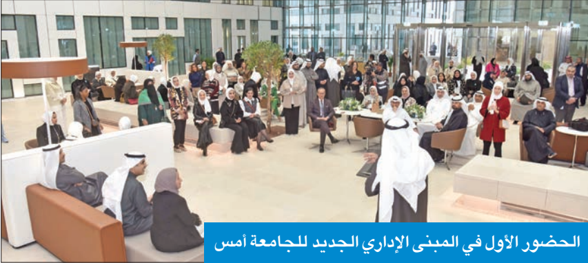
الحضور الأول في المبنى الإداري الجديد للجامعة أمس

الإدارة الجامعة إلى مبناها الجديد في مدينة صباح السالم الجامعية، مستذكراً بدايات «مشروع الشذادية» عام 2001، وكان حينها من ضمن الفريق الأول لإدارة الجامعة للتنفيذ والتخطيط لهذا المشروع. وأضاف الرشيد: مع الأسف، كان هناك من يراهن على أن جامعة الكويت لن تستطيع إنجاز المشروع، وستفشل، ولكن اليوم عندما نرى تلك المباني المتميزة بمدينة صباح السالم الجامعية نقول «الحمد لله، لم تفشل الجامعة، بل حققت ولا تزال تحقق إنجازاً عظيماً». وأوضح أن آخر ما تم إنجازه في المشروع هو مجمع المباني الإدارية لجامعة الكويت، الذي يتكون من 6 أجزاء أساسية، تم تسليمها على 3 مراحل، مبنياً أن هذا النشاط يأتي ضمن استراتيجية الجامعة بتفعيل الخطط الإعلامية في الانتقال، وتعزيز الاستفادة من مرافق الدولة بعد التسلم، حتى نستطيع تحقيق الاستراتيجية الخاصة بالتعليم العالي، وإخلاء الأساكين لجامعات حكومية أخرى، حفاظاً على المال العام.