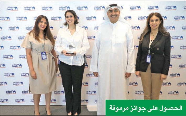
الحصول على جوائز مرموقة

ويهدف استبيان «صوتك يهمننا» إلى تحديد المجالات والجوانب التي على «الوطني» تقييمها وتطويرها، لنضاهي المعايير العالمية في كبرى البنوك والمؤسسات الرائدة في هذا المجال.