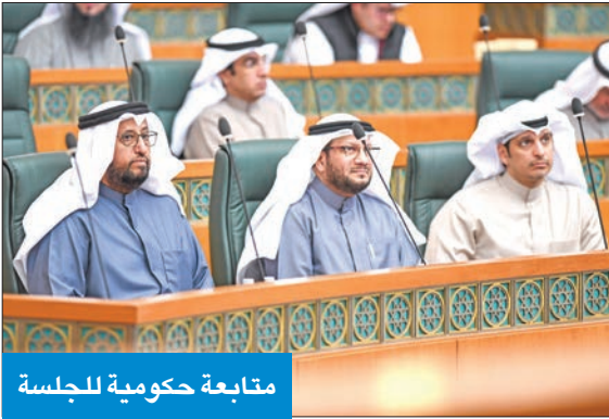
متابعة حكومية للجلسة

سكنون متناسقة مع القانون. وكان الكندري قال: «لا أتق بالحكومة في إنجاز الحلول الإسكانية، ونشكر اللجنة الإسكانية لإنجاز هذا القانون المهم، لكن هناك عدة استفسارات مهمة على اللجنة الإجابة عنها، فمثلاً المادة 10 من القانون لم تحدد سعر القسيمة، فمن الذي يحدد هذا السعر للوحدة؟ علينا ألا نترك الحل على الغارب للحكومة لإنجاز اللائحة التنفيذية للقانون».