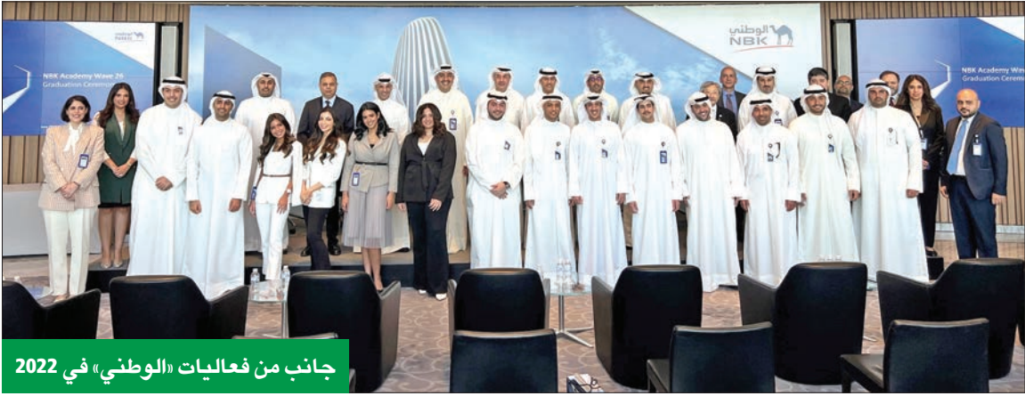
جانب من فعاليات «الوطني» في 2022

البنك استثمر 1.2 مليون دينار خلال العام في برامج تدريب بالتعاون مع أعرق الجامعات والمعاهد حول العالم