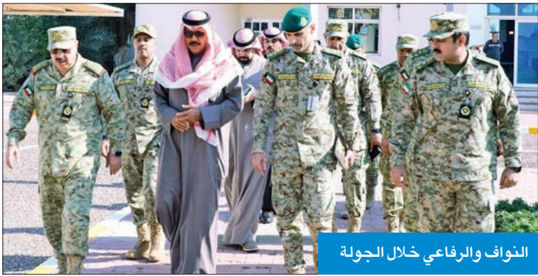
النواف والرفاعي خلال الجولة

تفقد نائب رئيس الحرس الوطني الشيخ فيصل النواف نادي ضباط الحرس الوطني، وكان في استقباله وكيل الحرس الوطني الفريق الركن هاشم الرفاعي وكبار القادة. واستمع النواف إلى إيجاز من إدارة المشاريع الهندسية عن مشروع مرسى البخوت في نادي الضباط، وأطلع على مراحل إنجازه، وإمكانات المرسى في خدمة الأنشطة البحرية للأعضاء، كما تفقد بقية المرافق، مؤكداً أن النادي يعد متنفساً للضباط وأسراًهم لممارسة مختلف الأنشطة الرياضية والثقافية، ويعزز الترابط الاجتماعي.