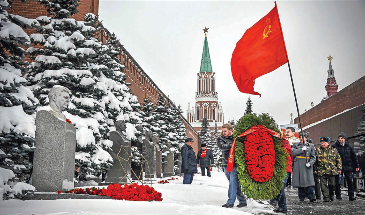
مناصرو الحزب الشيوعي الروسي يزورون ضريح ستالين على سور الكرملين بمناسبة ذكرى ميلاد الزعيم السوفياتي الراحل أمس

في أول زيارة معلنة للخارج منذ الغزو الروسي في 24 فبراير الماضي، فاجأ الرئيس الأوكراني فولوديمير زيلينسكي الجميع بالسفر إلى الولايات المتحدة، أمس، للاجتماع مع نظيره الأميركي جو بايدن، وإلقاء خطاب أمام الكونغرس. وبعد 300 يوم من الغزو الروسي، كتب زيلينسكي، في منشور على «تويتر» بالترزامن مع بيان للبيت الأبيض، أنه في طريقه إلى العاصمة الأميركية لعقد محادثات مع بايدن لتعزيز قدرات أوكرانيا على الصمود والدفاع، ومطالبة مجلسي النواب والشيوخ في الكابيتول بمنحه المزيد من الأسلحة، وإجراء عدد من الاجتماعات مع كبار مستشاري الأمن القومي في البيت الأبيض.