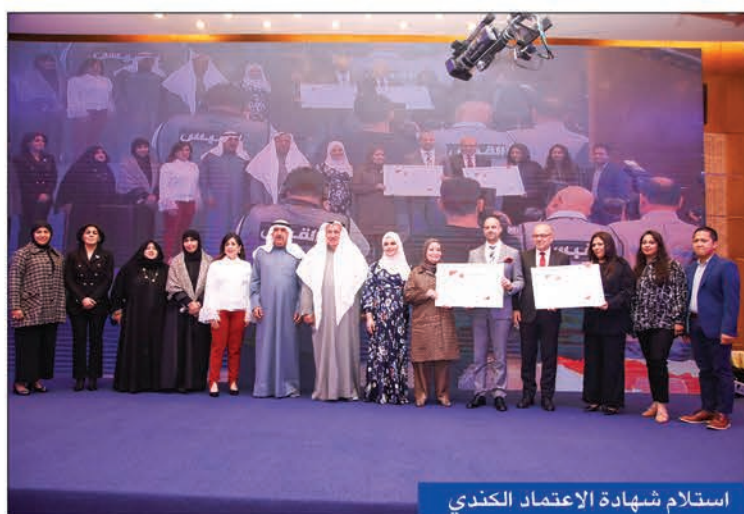
استلام شهادة الاعتماد الكندي

وأضاف نصر الله أن مستشفى دار الشفاء يمتلك رؤية وأعدة شاملة ومتكاملة للمستقبل عبر تنفيذ مجموعة من التوسعات التي ستسهم وبشكل كبير في تعزيز قدراته، لافتاً إلى أن تلك التوسعات الجديدة تأتي لتلبية الاحتياجات المتزايدة للمراجعين والعمل على تطوير الخدمات الصحية التي يحرص «دار الشفاء» على تطبيقها، وأشار إلى أن المستشفى قام، على المدى القصير، بمضاعفة الحجم الكمي، حيث أصبح لدى المستشفى 230 سريراً بزيادة 100 سرير عن المستوى السابق، وأصبحت لديه خدمات طبية كثيرة ومتنوعة «وطمحنا أن يصبح المستشفى صرحاً يغني المريض في الكويت عن السفر للخارج وهو ما نقوم بالتخطيط له على المدى البعيد».