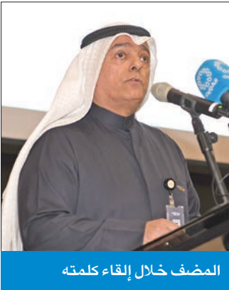
المضف خلال إلقاء كلمته

وأضاف المضف: «مضت سنوات والمجتمع الكويتي يتحول تدريجياً ويمضي بخطى ثابتة نحو التحول التكنولوجي والرقمي في شتى مجالات