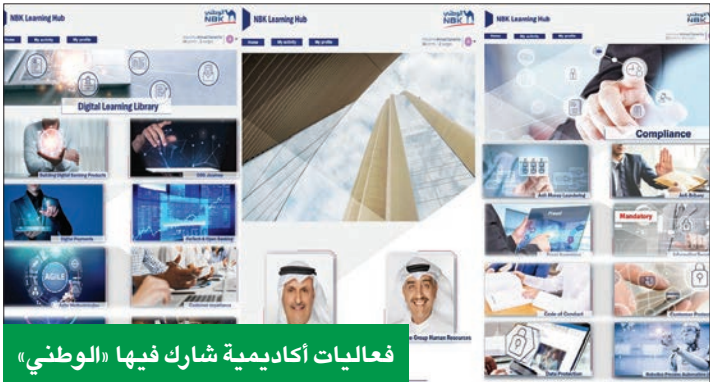
فعاليات أكاديمية شارك فيها «الوطني»

المعمل، وأساليب ابتكار منهجيات مرنة للعمل، وكذلك برامج مخصصة لريادة الأعمال. كما تم إثراء تجربة الموظفين في التعلم عبر منصة الوطني التعليمية NBK Learning Hub، التي تساعد على توفير عملية التعلم بمفهوم أشمل وأوسع، وبما يتماشى مع معايير الوصول الحديثة، مع توافره بلغات وأشكال متعددة، بجانب المكتبة الرقمية للمنصة، والتي تم إثرائها بالتعاون مع CrossKnowledge العالمية المتخصصة في المحتوى التدريبي، والذي يتم إعداده من قبل أعضاء في هيئة تدريسية لجامعات، مثل ستانفورد، وهارفارد، وإنسياد و IE Business School.