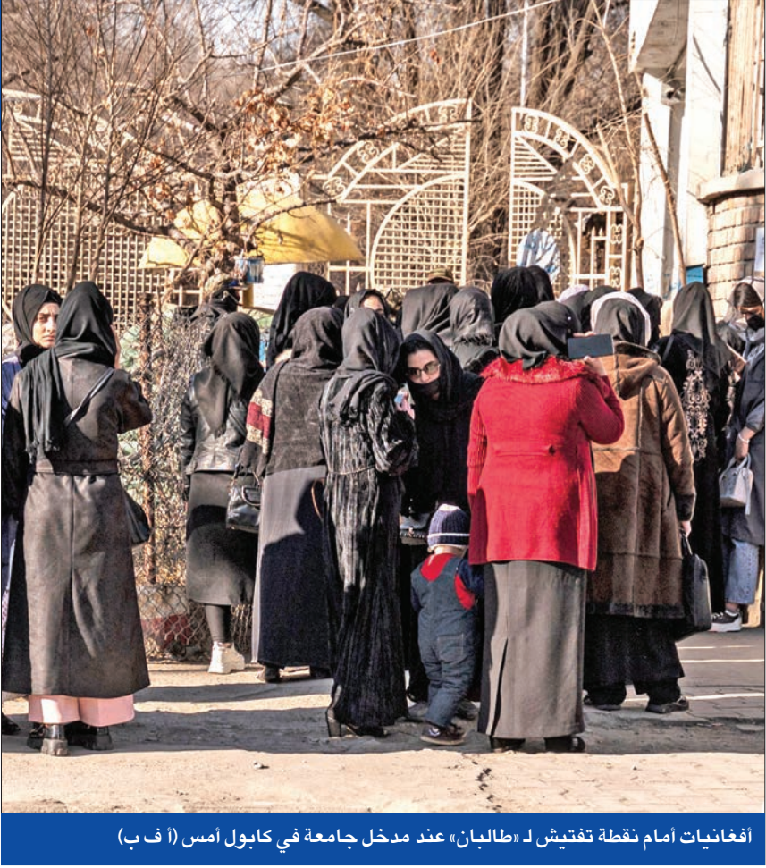
أفغانيات أمام نقطة تفتيش لـ «طالبان» عند مدخل جامعة في كابول أمس

منعت حكومة حركة «طالبان» الأفغانية، الفتيات والنساء من الالتحاق بالجامعات بمختلف أنحاء البلاد وفرضت الأمر تحت تهديد السلاح في بعض الأماكن، مما أثار غضباً داخلياً وموجة إدانات دولية وإسلامية وعربية واسعة لخطوتها التي تمثل ضربة أخرى لحقوق نصف سكان أفغانستان. وقال وزير التعليم العالي لدى «طالبان»، ندا محمد نديم في بيان ليل الثلاثاء، الأربعاء، «طبقاً لقرار مجلس الوزراء، لدينا جميعاً تعليمات بالتنفيذ الفوري للقرار المذكور، لوقف تعليم الفتيات حتى إشعار آخر». وأضاف «تأكدوا من تنفيذ القرار». ولم يهدر المسلحون الكثير من الوقت لضمان الامتثال للمرسوم. وذكرت إحدى الطالبات بجامعة كاردان الخاصة، في كابول، أنه يتم السماح للطلاب بالدخول وأنهم صوبوا البنادق نحونا وطلبوا منا أن نعود إلى المنزل». وأضافت أن «الأمم المتبقي الأخير ضاع» مشيرة إلى أنه يتم إعادة البلاد إلى تسعينيات القرن الماضي وهذا ما كان يخشاه الجميع. وبنتطبيق الخطوة المتشددة لم يعد أمام الأفغانيات إلا تلقي التعليم بالمرحلة الابتدائية، بعد أن تم حظر التعليم الثانوي عليهن منذ سيطرة الحركة المتشددة على السلطة في أغسطس 2021، عقب انسحاب القوات الأميركية من كابول. في غضون ذلك، حثت الحكومة الباكستانية «طالبان»