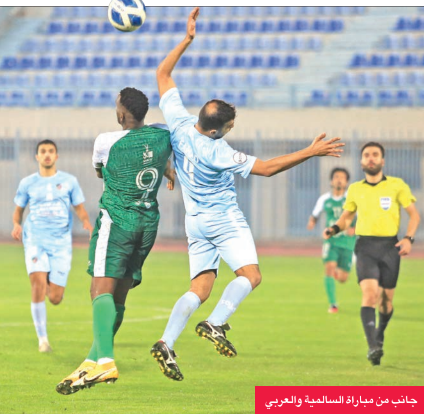
جانب من مباراة السالمية والعربي