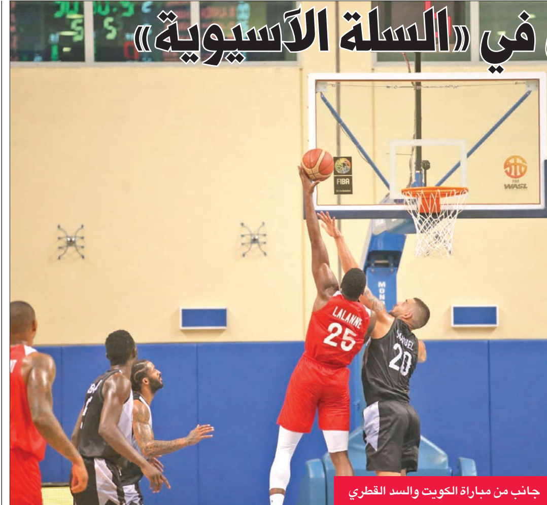
جانب من مباراة الكويت والسد القطري