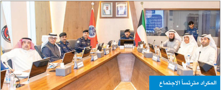
المكراد مترأساً الاجتماع

بالإنابة الشيخ طلال الخالد، لاتخاذ ما يلزم لتطبيق هذه التوصيات بين الجهات الحكومية المعنية لتفادي تكرار حوادث الغرق في الشواطئ. وأكد الفريق المكراد، خلال الاجتماع، ضرورة العمل بروح الفريق الواحد لحماية الأرواح مع أهمية تعاون المواطنين والمقيمين وتقديهم باشتراطات الأمن والسلامة.