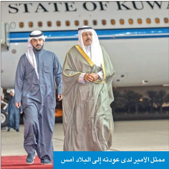
ممثل الأمير لدى عودته إلى البلاد أمس

عاد ممثل صاحب السمو أمير البلاد الشيخ نواف الأحمد، سمو الشيخ أحمد نواف الأحمد رئيس مجلس الوزراء، والوفد المرافق له، إلى البلاد ليل أمس الأول، بعد ترؤسه وفد دولة الكويت المشارك في مؤتمر بغداد للتعاون والشراكة، الذي عقد في المملكة الأردنية الهاشمية الشقيقة.