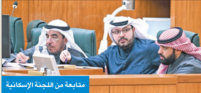
متابعة من اللجنة الإسكانية

والتزم إحدى مواد القانون المؤسسة العامة للرعاية السكنية - بمقتضى أحكام القانون - بإنشاء شركات مساهمة عامة تختلف نسبة التملك فيها ومواعيد اكتمالها وفق طبيعة المشروع، ووفق دراسات الجدوى الاقتصادية وشركات خاضعة للقانون رقم 116 لسنة 2014 بشأن الشراكة بين القطاعين العام والخاص يكون نظامها الأساسي متوافقاً مع أحكام الشريعة الإسلامية لإنشاء مدينة سكنية متكاملة أو منطقة سكنية أو أكثر على الأراضي المخصصة للمؤسسة لتشغيلها وفق أفضل الممارسات العالمية في مجال التنمية العمرانية للمدن والمناطق الذكية المستدامة والمعايير البيئية الحديثة، وتسلم إليها بموجب عقد بينها وبين المؤسسة.