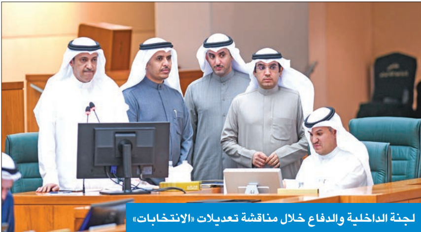
لجنة الداخلية والدفاع خلال مناقشة تعديلات «الانتخابات»