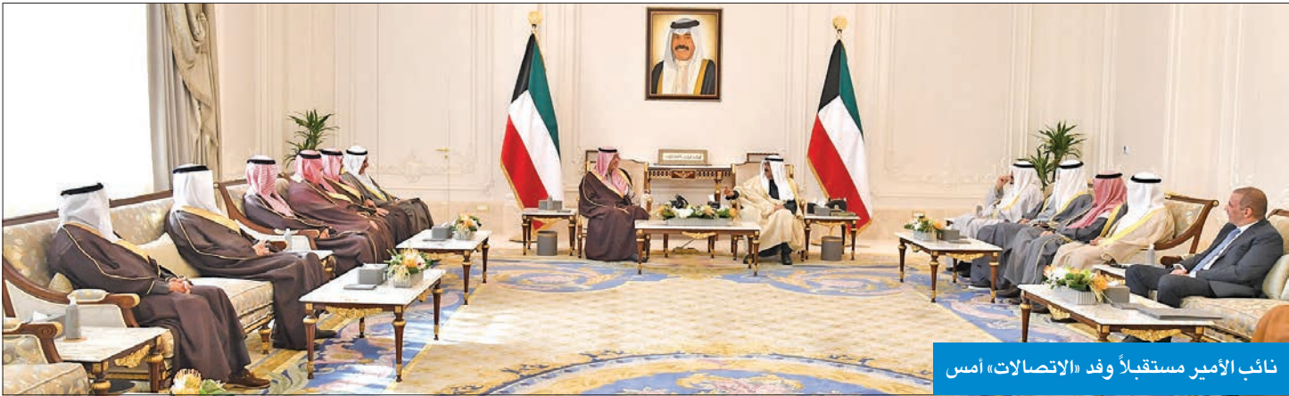
نائب الأمير مستقبلاً وفد «الاتصالات» أمس

استقبل سمو نائب الأمير وولي العهد الشيخ مشعل الأحمد، بقصر بيان أمس، رئيس مجلس إدارة شركة الاتصالات السعودية الأمير محمد بن خالد العبدالله