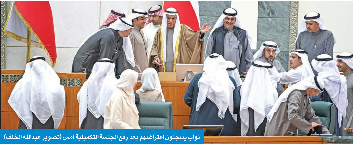
نواب يسجلون اعتراضهم بعد رفع الجلسة التكميلية أمس