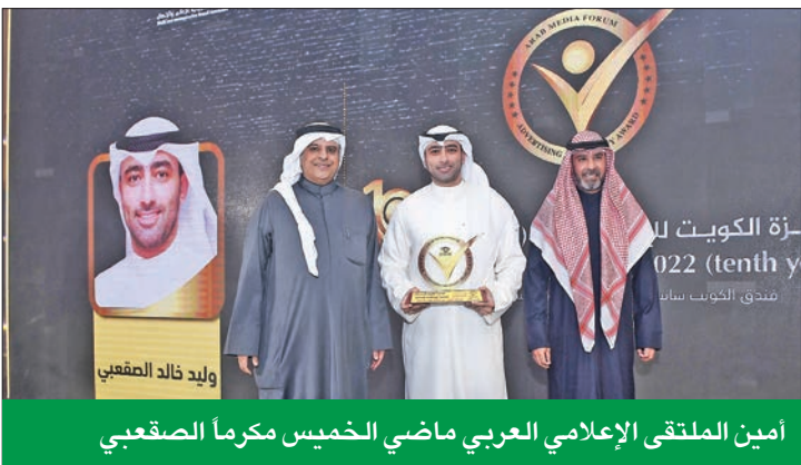
أمين الملتقى الإعلامي العربي ماضي الخميس مكرماً الصقعي