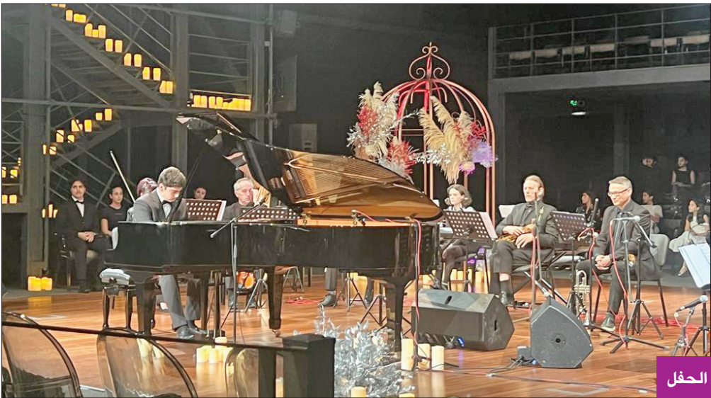
من أجواء الحفل