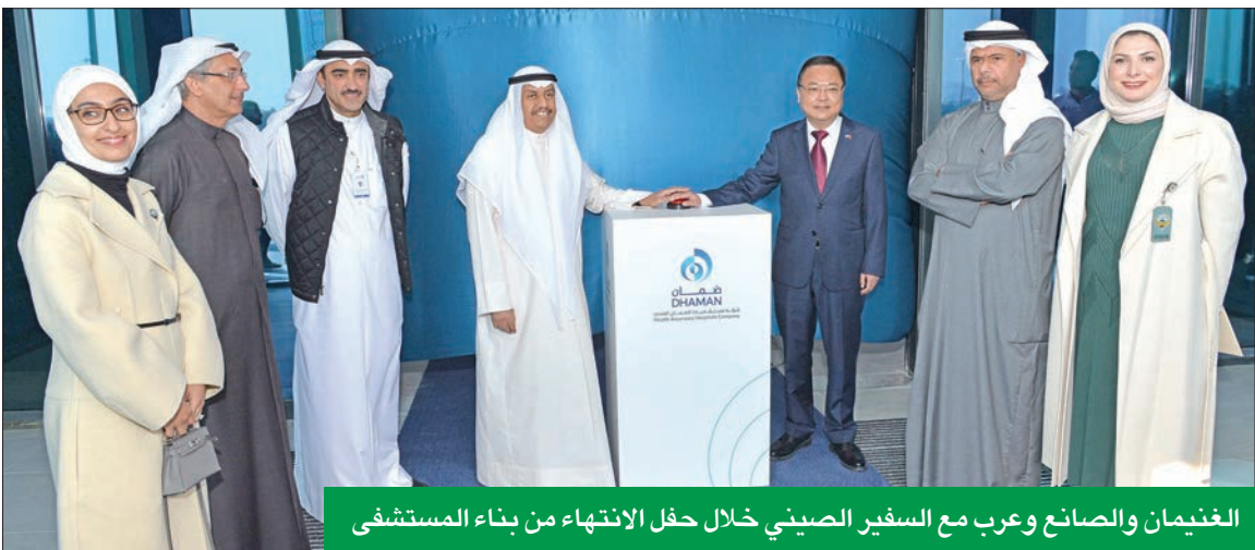
الغنيان والصانع وعرب مع السفير الصيني خلال حفل الانتهاء من بناء المستشفى