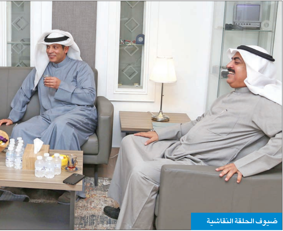
ضيوف الحلقة النقاشية

وأضاف: «أود أن أنبه أيضاً إلى أن القرابة من الدرجة الرابعة كانت من محظورات التعامل، والدرجة الثانية ببساطة شديدة، أنه إذا كان عندي قرار ومحل هذا القرار ابن العم فهو غير داخل معنا لأن أبناء الدرجة الأولى هم الأبناء والزوجة والعلاقات المباشرة، أما أبناء العم فقد طلعنا من منطقة التجريم، ولكن في الكويت تواجهنا مشكلتين، إحداهما الخوف من التوسع لأن علاقتنا الاجتماعية متجذرة، والثانية أن ذلك سيخرجنا عن الضابط الدولي والذي يتكلم عن مرحلة أو درجة رابعة، وهي مسألة تستحق الانتباه، وهناك مسألة أخرى وهي النسبة المؤثرة والتي قررها المشرع بـ 5 في المثة لكن الملاحظة المهمة أن هذه النسبة لم تأت على مجموع الأصل المطلوب منه الإفصاح وأقربائه بل تأتي على أحد أطرافه، بمعنى أنه إذا عندي مثلاً 2.5 في المثة وزوجتي أو أحد أبنائي عنده 3 في المثة فقد تجاوزنا الخمسة ولكنها لا تحسب لأنه يجب أن يكون أحدهم وهو الفرد ذاته أو أحد الأقرباء حتى يكون الفرد تحت طائلة المخالفة لفلسفة القانون وفكرته، ولذلك فإن هذه النسبة (الـ 5 في المثة) محل نظر كبير