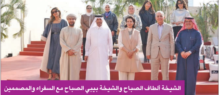
الشيخة أطاف الصباح والشيخة ببيبي الصباح مع السفراء والمصممين