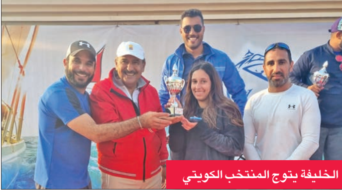
الخليفة يتوج المنتخب الكويتي

الوفد أحمد الفيلكاوي، فيما شملت البطولة 10 سباقات أقيمت على امتداد ثلاثة أيام.