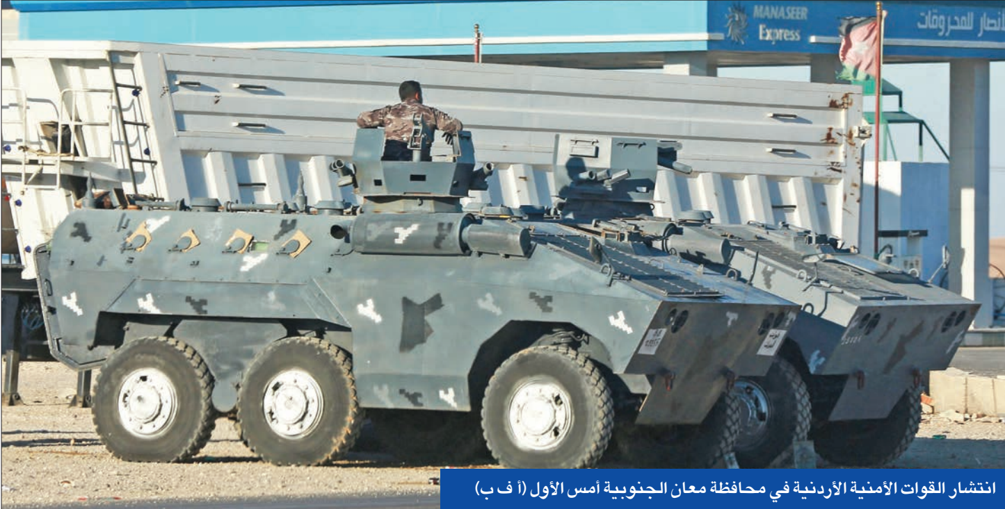
انتشار القوات الامنية الاردنية في محافظة معان الجنوبية أمس الأول