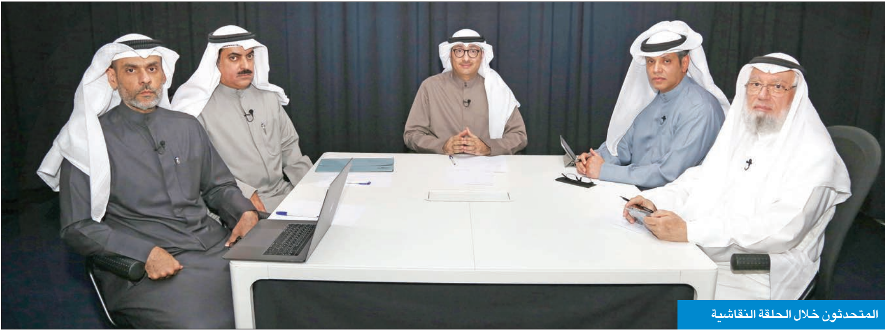
المحتدئون خلال الحلقة النقاشية

خبراء قانونيون أكدوا لـ الجريدة . ضرورة إخضاع القانون لمزيد من المراجعات لتجنب إلغائه من «الدستورية»