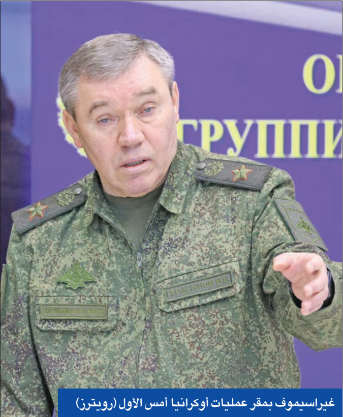
غيراسيموف بمقر عمليات أوكرانيا أمس الأول

أن تربط عملية السلام الأوكرانيا بحلف شمال الأطلسي. خيار التزام الحياذ لم يعد له مغزى، مبيّناً أنه اقترح في مايو وفقاً لإطلاق النار تسحب روسيا بموجبها إلى الخطوط الأمامية التي كانت عليها قبل بدء غزوها لأوكرانيا في 24 فبراير، لكن شبه جزيرة واقترح كيسنجر (99 عاماً) إجراء استفتاء تحت إشراف دولي للبت في أمر الأراضي التي أعلنت روسيا ضمها في حالة ما إذا ثبت استحالة العودة إلى المشهد الذي كانت عليه الأوضاع عام 2014، وحذر من أن الرغبة في أن تبدو روسيا كدولة «عاجزة»، أو حتى السعي إلى تفكيكها، قد تتسبب في انفجار في أوكرانيا. واوكرانيا أو أي دولة غربية تأييداً لأي من الفصتين. وتابع: «إن تفكيك روسيا أو تدمير قدرتها على (ممارسة) السياسة الاستراتيجية يمكن أن يحول أراضيهما، التي تضم 11 منطقة زمنية، إلى فراغ متنازع عليه، وقد تقرر مجتمعاتها المتنافسة تسوية نزاعاتها بالعنف، وقد تسعى دول أخرى إلى زيادة مطالبها بالقوة، وستتضاعف كل هذه المخاطر بسبب وجود الآلاف من الأسلحة النووية التي تجعل روسيا واحدة من أكبر قوتين نوويتين في العالم». وفي تصريحات صادمة، وصف البابا فرنسيس النزاع في أوكرانيا بأنه حرب عالمية، ولن ينتهي في المستقبل القريب.