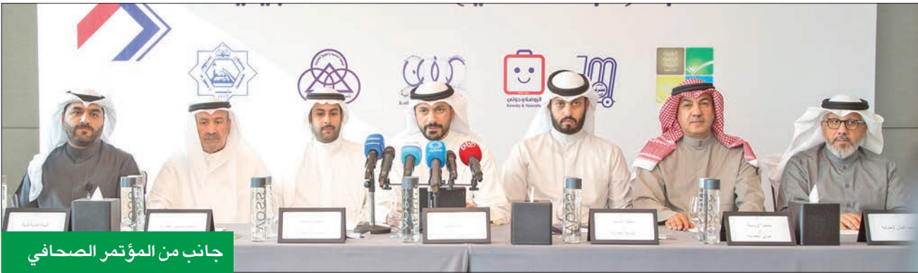
جانب من المؤتمر الصحفي