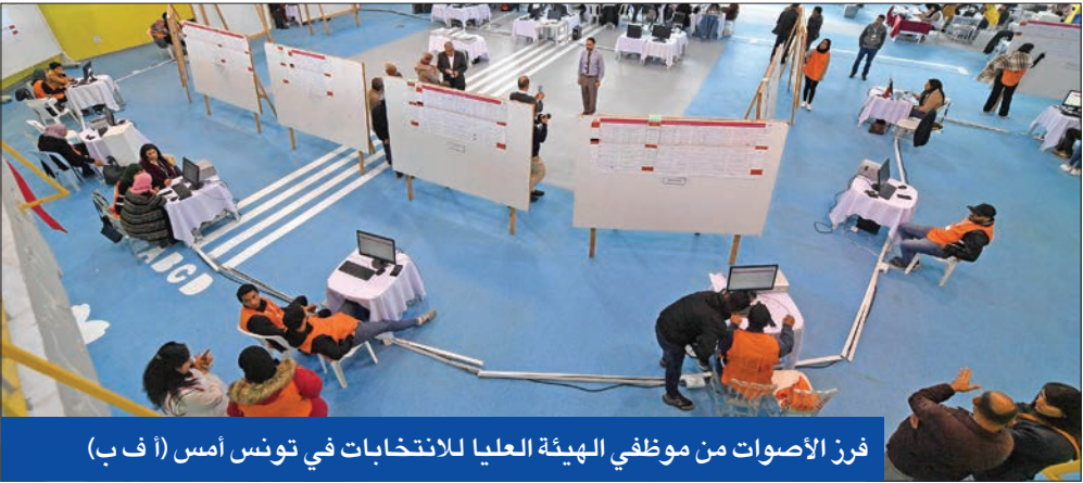
فرز الأصوات من موظفي الهيئة العليا للانتخابات في تونس أمس

دعت أطراف متنوعة من المعارضة التونسية إلى انتخابات رئاسية مبكرة، بعد امتناع أكثر من 90 في المئة من الناخبين عن المشاركة في الانتخابات التشريعية، التي جرت أمس، وتعد الأولى بعد تعديلات دستورية قام بها الرئيس قيس سعيد. وجاءت نسبة الإقبال الأولية التي وصلت إلى 8.8% أقل من معدل التضخم الذي يبلغ 9.8%، مما يسلط الضوء على الضغوط الاقتصادية التي تسببت في خيبة أمل العديد من التونسيين من السياسة وغضبهم من القيادات. وطالبت زعيمة حزب «الدستور الحر» عيبر موسى بإعلان شعور منصب الرئيس والدعوة لانتخابات رئاسية مبكرة، مبينة أن «أكثر من 90% قالوا نرفض الاعتراف بمشروع» سعيد.