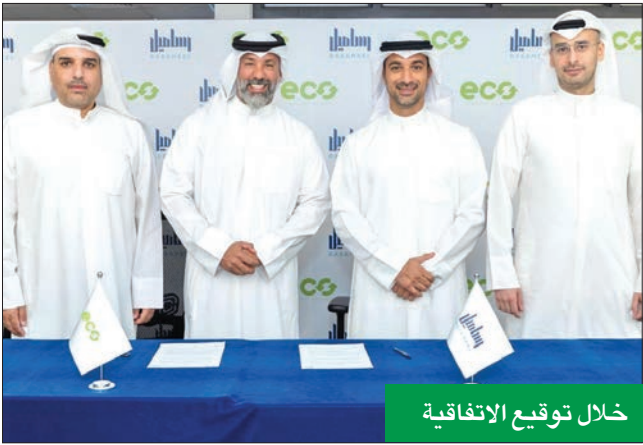
خلال توقيع الاتفاقية

الشركات البيئية، والتعرف على مشاريعها، ووضع دراسة جدوى حول الفرص التي توفرها، والدخول في استثمارات فيها، بما يساعد على تحقيق المصلحة المشتركة بين الطرفين.