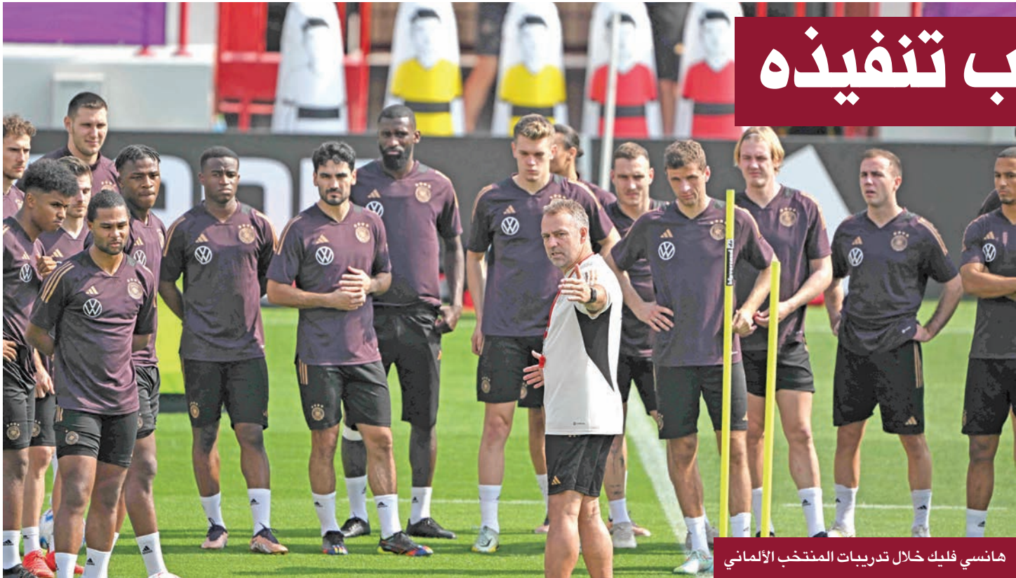
هانسي فليك خلال تدريبات المنتخب الألماني

يريد المدير الفني للمنتخب الألماني لكرة القدم، هانسي فليك، من لاعبيه أن يبذلوا أقصى جهد لهم لتحسين أدائهم الدفاعي وكفاءتهم الهجومية من أجل استعادة ثقة الجماهير مرة أخرى من خلال تحقيق نتائج إيجابية بعد الخروج للمرة الثانية على التوالي من دور المجموعات ببطولة كأس العالم. وقال فليك، في مقابلة مع وكالة الأنباء الألمانية بمقر الاتحاد الألماني لكرة القدم في فرانكفورت: «لدينا التزام يجب تنفيذه». وأضاف: «علينا أن نولد الحماس مرة أخرى. نريد أن نظهر كرة قدم جذابة كفريق، نريد أن نظهر للجماهير مدى إمكاناتنا، نريد أن نقدم كل شيء، نريد أن نلعب لألمانيا، نحن فخورون بهذا، ونطلع لبطولة اسم أوروبا التي نستضيفها ألمانيا عام 2024». وأضاف: «يجب أن تقدم أقصى ما عندك لكي تقدم أفضل أداء لديك في كل مباراة، هذه هي مهمتنا، وبعد ذلك نأمل أن تساندنا الجماهير. نحن أيضا مقتنعون بهذا». وخسر المنتخب الألماني 1 - 2 أمام اليابان وتعادل 1 - 1 مع المنتخب الإسباني، ثم فاز على كوستاريكا 4 - 2، بعد أن كان متأخرا 1 - 2، لكن هذه النتائج لم تكن كافية لعبور بطل العالم