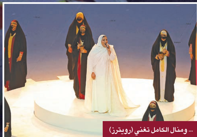
... ومنال الكامل تغني