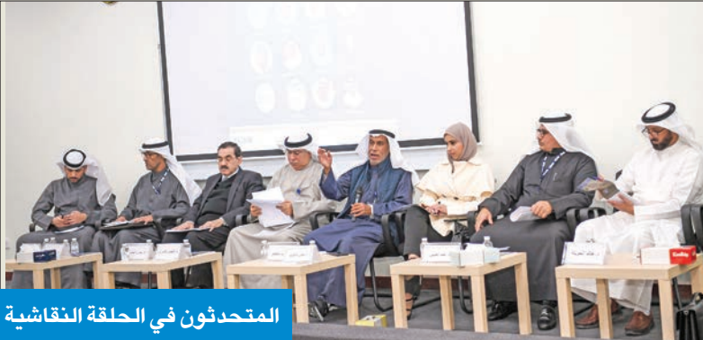
المتحدثون في الحلقة النقاشية

وتابع، كما ينبغي تبني النسخة الثانية لإكمال المقاعد ولا يتج من نقل نسبته أكثر من 1 إلى 2 في المئة من الأصوات اللازمة للنجاح، لافتا إلى أن المآخذ على اقتراح قانون المفوضية العليا منها أن سلطتها ليست كاملة على العملية الانتخابية، حيث تشاركها هيئة المعلومات المدنية في قيود الناخبين، إضافة إلى عدم سلامة تكوينها بالكامل من قضاة على رأس أعمالهم القضائية (عدم التفرغ)، فضلا عن اغفال العناصر السياسية ونزوي الخبرة من عضويتها.