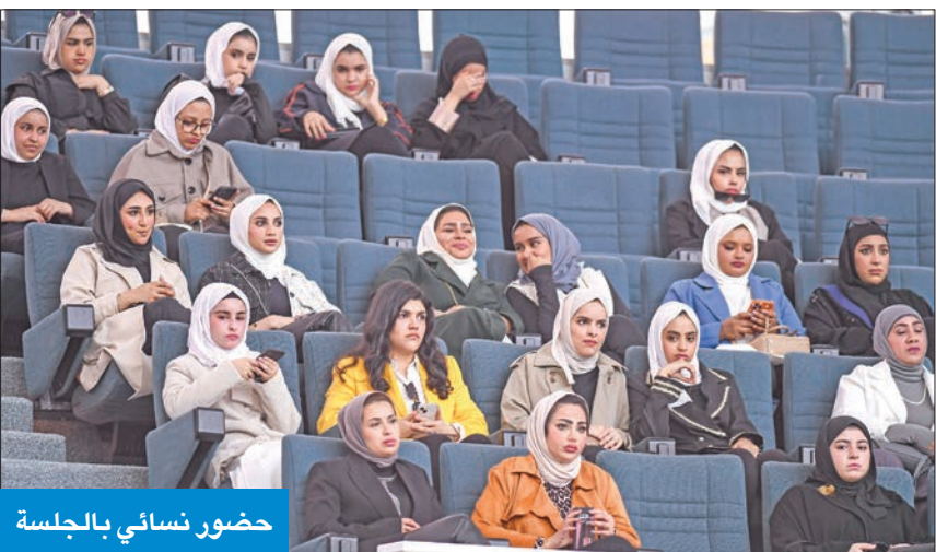
حضور نسائي بالجلسة