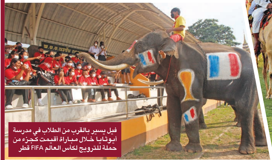
فيل يسير بالقرب من الطلاب في مدرسة أيونايا خلال مباراة أقيمت كجزء من حملة للترويج لكأس العالم FIFA قطر