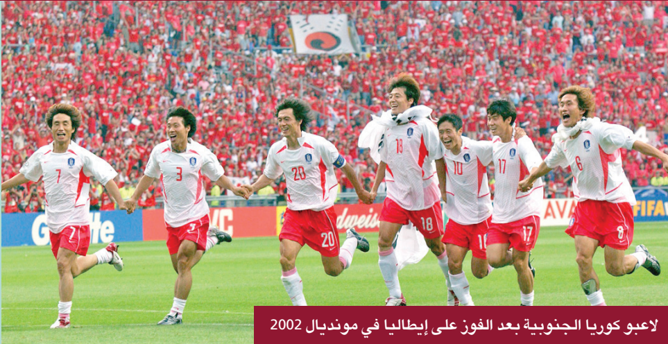
لاعبو كوريا الجنوبية بعد الفوز على إيطاليا في مونديال 2002

ولم تضيّع الشركات أي وقت في لصق هذه الحملة على مجموعة من المنتجات، وبيعت الأكواب مقابل 1600 بيسوس (9 دولارات)، والقمصان مقابل 2900، والقمصان مقابل 3900.