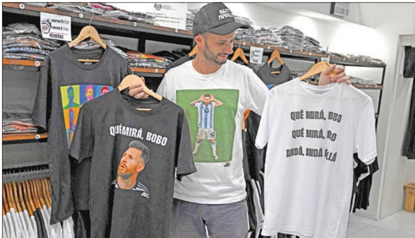
أحد الباعة يعرض قمصاناً بصورة ميسي مكتوباً عليها «إلى ماذا تنظر أيها الأحق؟»

وقال مصمّم الملابس توني مولفيسي (31 عاماً) «صنعنا القمصان على الفور. انتشرت هذه العبارة بشكل كبير، لأنه في فترات أخرى (من مسيرته)، كان ميسي هادئاً وخافئاً. لكن الناس أرادوا منه أن يكون لديه القليل من خشونة ديبغو (مارادونا)».