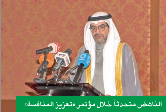
الناهض يتحدث خلال مؤتمر «تعزيز المنافسة»

وقال إن الكويت تتمتع بكل المقومات الأساسية للانطلاق نحو تحقيق رؤية «كويت جديدة 2035»، وتوفير فرص الاستثمار والتنمية مثل الموقع