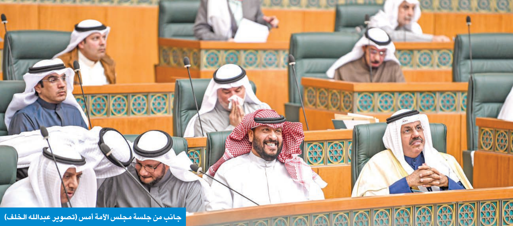
جانب من جلسة مجلس الأمة أمس

في جلسته العادية أمس، أقر مجلس الأمة قانون تعارض المصالح في المداولة الأولى. ووجهت لجنة الشؤون التشريعية الدعوة لأعضائها لاجتماع عاجل يعقد على هامش جلسة اليوم لمناقشة الملاحظات؛ تمهيداً لعرضه وإقراره بالمداولة الثانية في جلسة اليوم. إن أمكن ذلك، في وقت أقر المجلس بالمداولتين إضافة شريحة ربات البيوت لتأمين «عافية»، مع حصول المجلس على وعد من وزير المالية بتقديم تصور نهاية الشهر الجاري حول رفع الحد الأدنى للمعاشات التقاعدية. وفي نهاية الجلسة التي شهدت في بدايتها اتخاذ حزمة قرارات أغلبها تكليفات للجان بالتحقيقات في سرقة الأبحاث العلمية، وانسحاب مستشفى فرنسي، وإزمة نقص الأدوية، قدمت الحكومة عرضاً مرئياً لبرنامج عملها للسنوات 2022/ 2026 والذي استهلته بكلمة لرئيس مجلس الوزراء سمو الشيخ أحمد نواف الأحمد. أكد فيها أن برنامج العمل يحقق تطلعات المواطنين ويتلمس احتياجاتهم. وأحال المجلس البرنامج إلى لجنة الشؤون المالية والاقتصادية البرلمانية على أن تدعو من تراه من المختصين لمناقشته وإعداد تقريرها بشأنه.