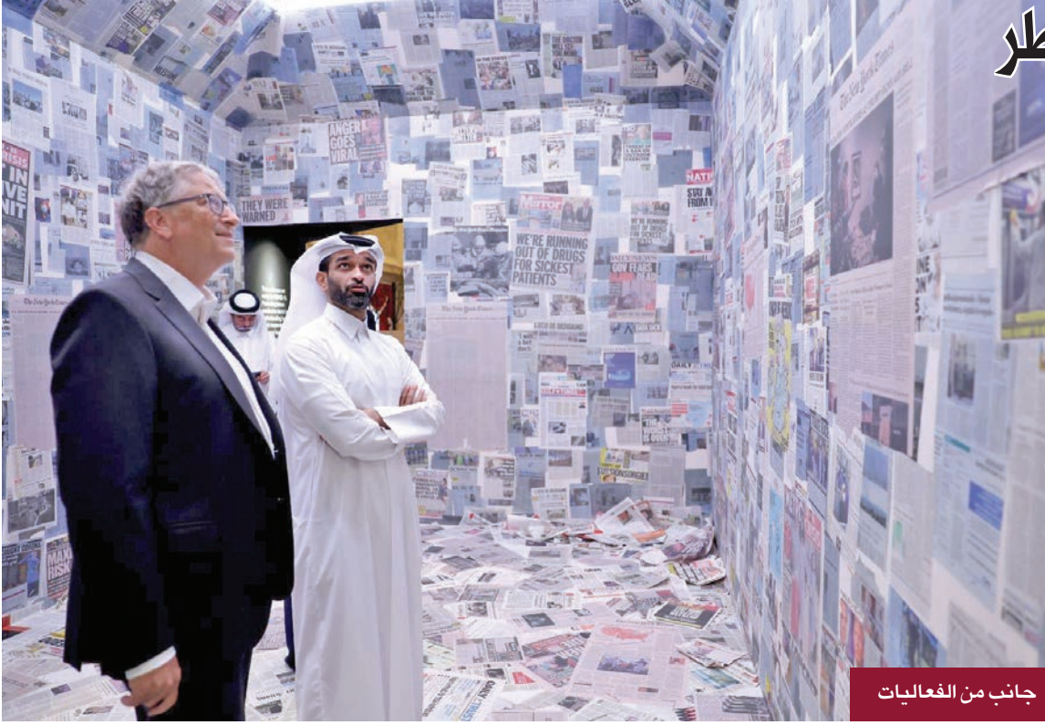
جانب من الفعاليات

المشجعون من جميع أنحاء العالم للاحتفال برياضة تعشقها جميعاً، تحت مظلة اللعبة الأكثر شعبية في العالم على أرض قطر.