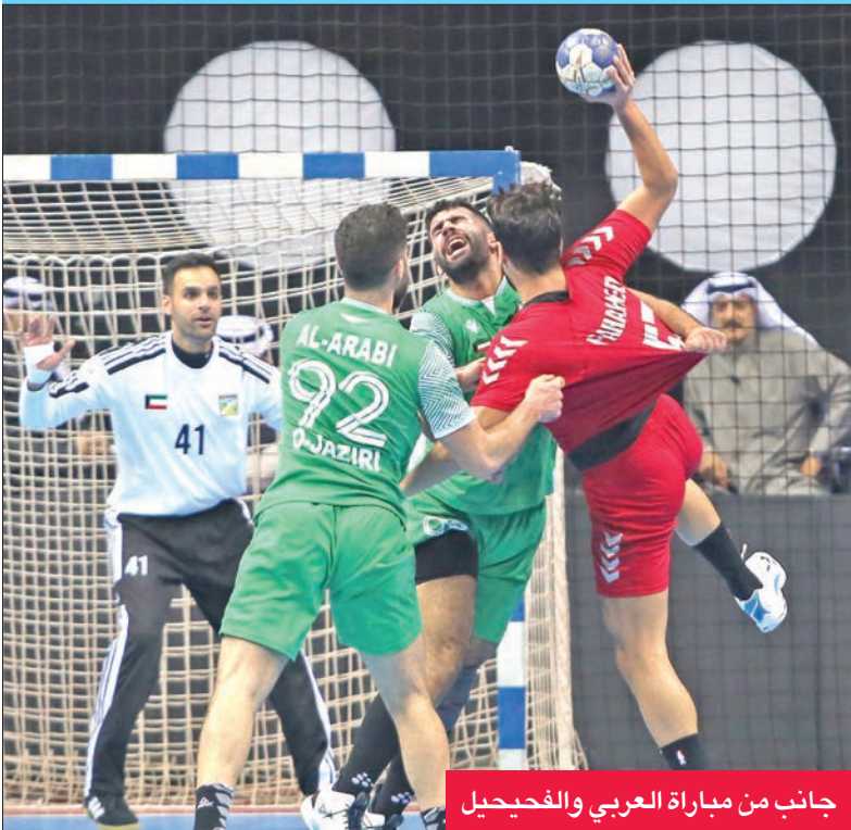
جانب من مباراة العربي والفحيحيل

حقق فريق السالمية لكرة اليد فوزاً مستحقاً على اليرموك بنتيجة 31-26، في المباراة التي جمعت الفريقين، أمس الأول، على صالة الاتحاد بمجمع الشيخ سعد العبدالله الرياضي، ضمن الجولة التاسعة «ختام القسم الأول» من الدوري الممتاز لكرة اليد. وفي مباراة أخرى جرت أمس الأول ضمن المرحلة ذاتها، فاز العربي على نظيره الفحيحيل بنتيجة 23-19، كما تغلب الصليبيخات على كاظمة بنتيجة 32-29. بهذه النتائج، رفع «السماوي» رصيده إلى 14 نقطة في المركز الثالث، متاخراً بفارق الأهداف خلف الكويت، الثاني بنفس الرصيد، بلية العربي في المركز الرابع بـ 9 نقاط، وارتقى الصليبيخات للمركز الخامس بـ 8 نقاط، فيما ظل الفحيحيل بـ 7 نقاط في المركز السابع، وتجمد رصيد كاظمة عند 5 نقاط في المركز الثامن، واليرموك في المركز التاسع قبل الأخير بـ 4 نقاط.