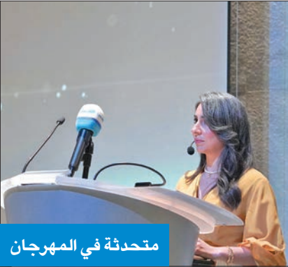
متحدثة في المهرجان

الفائزين في أربع فئات متميزة، هي: أفضل فيلم عربي قصير، وأفضل تصوير سينمائي، وأفضل مخرج، وأفضل فيلم محلي. وتعد مجال صناعة الأفلام في الكويت والمنطقة مجالا متنوعا وجذابا، مع وجود العديد من الفنانين الموهوبين، من مخرجين ومنتجين وممثلين وغيرهم، ما يشكل المشهد السينمائي الإقليمي. واستضافت الجامعة الأميركية الدولية، بدعم من الخبرة ديماء الأنصاري، رئيسة لجنة التحكيم، وشركة «عرض في الكويت»، المهرجان، الأمر الذي رشّح الكويت مركزاً إقليمياً للإبداع.