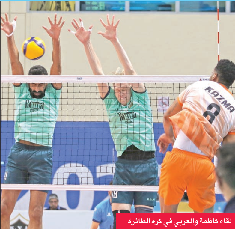
لقاء كاظمة والعربي في كرة الطائرة