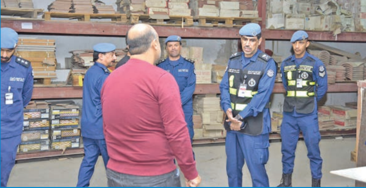
الواء فهد وقوة التفتيش داخل أحد المخازن المخالفة

نفذت فرق التفتيش التابعة لقطاع الوقاية بقوة الإطفاء العام، صباح أمس، حملة تفتيش بإشراف ميداني من نائب الرئيس لقطاع الوقاية اللواء خالد فهد في منطقة الشويخ الصناعية، للتحقق من اشتراطات السلامة والوقاية من الحريق. وقالت إدارة العلاقات العامة والإعلام بـ «الإطفاء»، في بيان، أمس، إن الحملة أسفرت عن إغلاق 29 منشأة حرفية لم يلتزم أصحابها بالاشتراطات الوقائية، بعد أن تم إخطارهم سابقاً بالشروط المطلوبة ولم يتم تنفيذها.