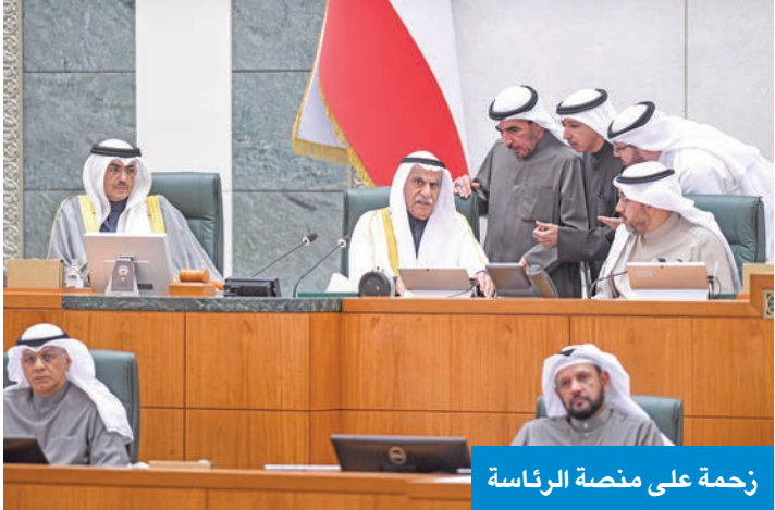
زخمة على منصة الرئاسة