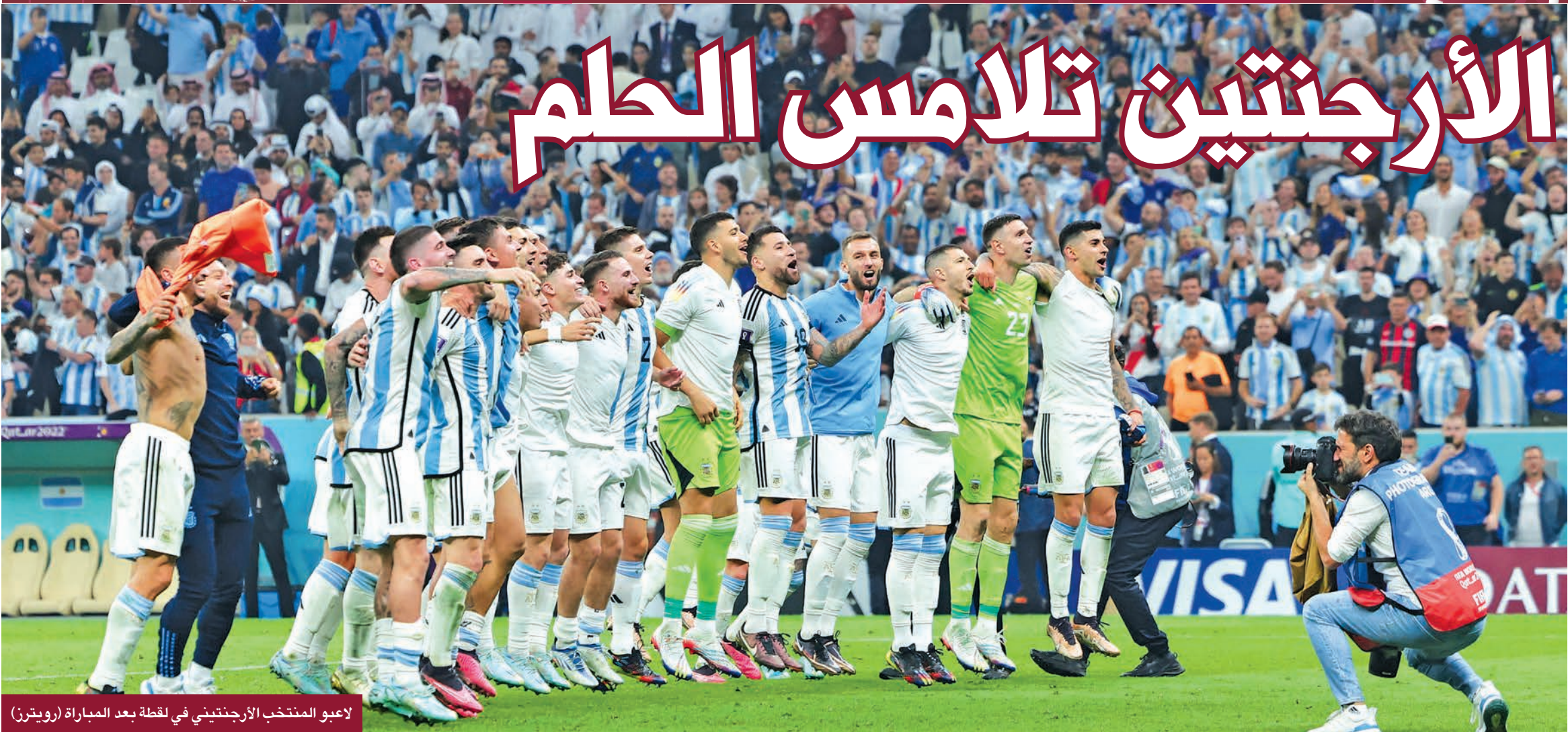
لاعبو المنتخب الأرجنتيني في لحظة بعد المباراة

الأرجنتيني في تسجيل الهدف الثالث، بعد مجهود أكثر من رائع من ميسي الذي تسلم الكرة من الجهة اليمنى ليطلق بها نحو منطقة الجزاء وسط رقابة لصيقة من غفاريبول مدافع كرواتيا، لكنه نجح في مرأوغته ودخل منطقة الجزاء ولعب كرة عرضية زاحفة للأغاريين الذي أسكنها في الشباك بسهولة. وسدد ميسلاف أورسيتش مهاجم المنتخب الكرواتي كرة من الجهة اليمنى لمرمي مارتينيز، محاولاً خداع الأخير، إلا أن كرتة مرت إلى جوار القائم الأيسر وفي الدقيقة 78 وفي الدقيقة 82 سدد اليكسيس ماك ليستر لاعب المنتخب الأرجنتيني كرة زاحفة، لكنها مرت إلى جوار القائم الأيسر للحارس ليفاكوفيتش. واسمك الحارس مارتينيز بتسديدة قوية من لوفرو ماير لاعب منتخب كرواتيا، حيث سد الأخير كرة قوية من خارج منطقة الجزاء في الدقيقة 88. ولم تشهد باقي دقائق الشوط الثاني أي جديد، ليطلق الحكم صافرة نهاية المباراة بفوز الأرجنتين على كرواتيا 0-3.