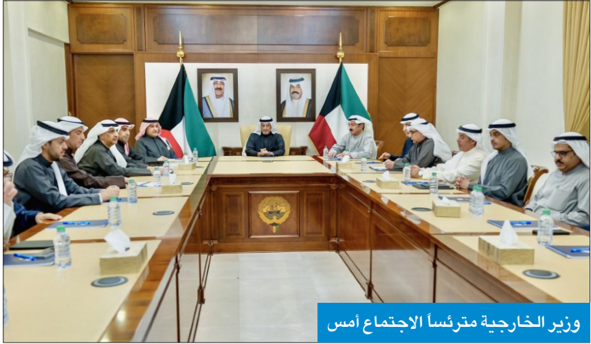
وزير الخارجية مترئسا الاجتماع أمس

أثنى السفير البحريني لدى البلاد صلاح المالكي على العلاقات الكويتية - البحرينية التي وصفها بالمتتميزة والمتطورة على الدوام. وقال المالكي، خلال احتفال سفارة البحرين بعيد المملكة الوطني، وسط حضور دبلوماسي وشعبي كبير يقدّمه وزير الخارجية الشيخ سالم الصباح: «نحن ملتزمون بالتوجيهات السامية بالتعاون البناء مع الدول الشقيقة والصديقة، وخصوصاً الكويت التي تربطنا معها علاقات متجذرة في عمق التاريخ، في إطار من القربى وصلته الدم ووشائج التواصل والمصير المشترك». وأضاف: «الإحتفاء بالمناسبات الوطنية المجيدة يُعيد للذكرى سنوات زاخرة بالإنجازات التنموية الرائدة والنهضة العصرية الشاملة ومظاهر الريادة والتفوق التي أنجزتها مملكة البحرين بروى حكيمة ونظرة ثاقبة من الملك حمد بن عيسى لمتطلبات