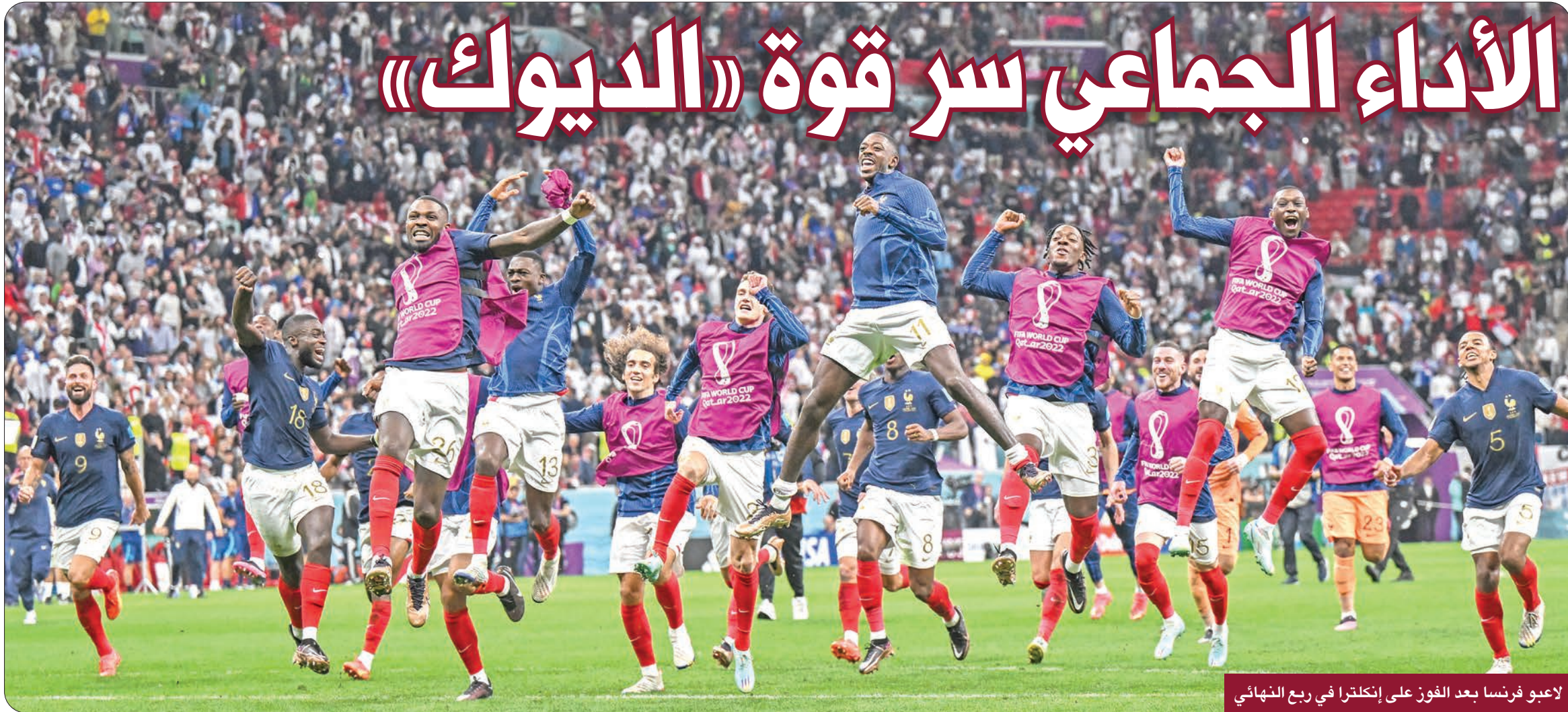
لاعبو فرنسا بعد الفوز على إنجلترا في ربع النهائي