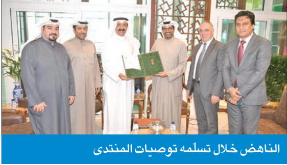
الناهض خلال تسلمه توصيات المنتدى

أعرب نائب رئيس اتحاد المكاتب الهندسية والدور الاستشارية م. مازن الصانع عن اعتزاز الاتحاد بدعم وزير التجارة والصناعة وزير الدولة لشؤون الاتصالات وتكنولوجيا المعلومات مازن الناهض، ورعايته لمنتدى الحكومة الإلكترونية التاسع، الذي نظمه الاتحاد مؤخراً برعايته وحضوره، مضيفاً أن المنتدى قدم 4 توصيات رئيسية ترسم مساراً واضحاً لاستكمال جهود الدولة لتطوير العمل الحكومي الإلكتروني في المسارات الإدارية