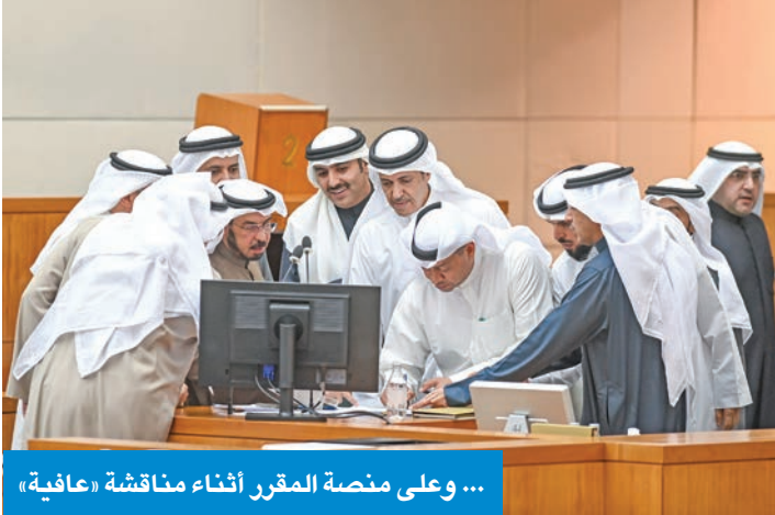
... وعلى منصة المقرر أثناء مناقشة «عافية»