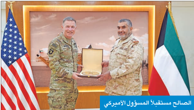
الصالح مستقبلاً المسؤول الأميركي

استقبل رئيس الأركان العامة للجيش الفريق الركن خالد الصالح مساء أمس الأول رئيس أركان القوات البرية الأميركية الفريق أول جيمس ماكوفيل والوفد المرافق له بمناسبة زيارته الرسمية للبلاد. وتم خلال اللقاء تبادل الأحاديث الودية وبحث أهم المواضيع ذات الاهتمام المشترك، وأشاد الصالح بعمق العلاقات بين البلدين، وتطلع الجانبين الدائم إلى تعزيز وترسيخ أواصر التعاون العسكري المشترك. حضر اللقاء عدد من كبار قادة الجيش.