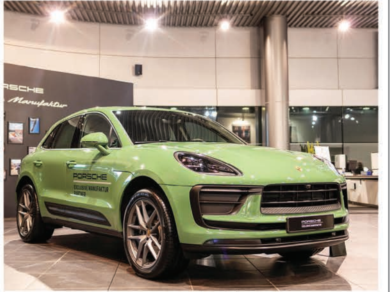
بورشه مكان باللون الحصري - أوراتيوم أخضر