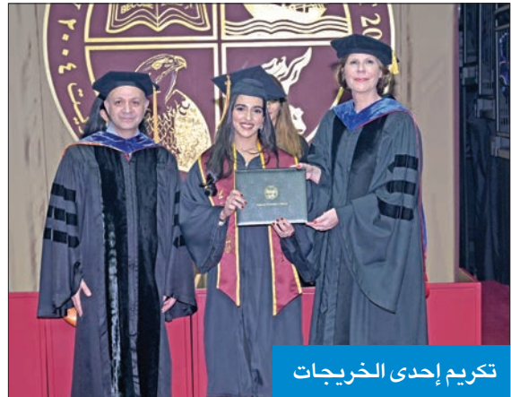
تكريم إحدى الخريجات