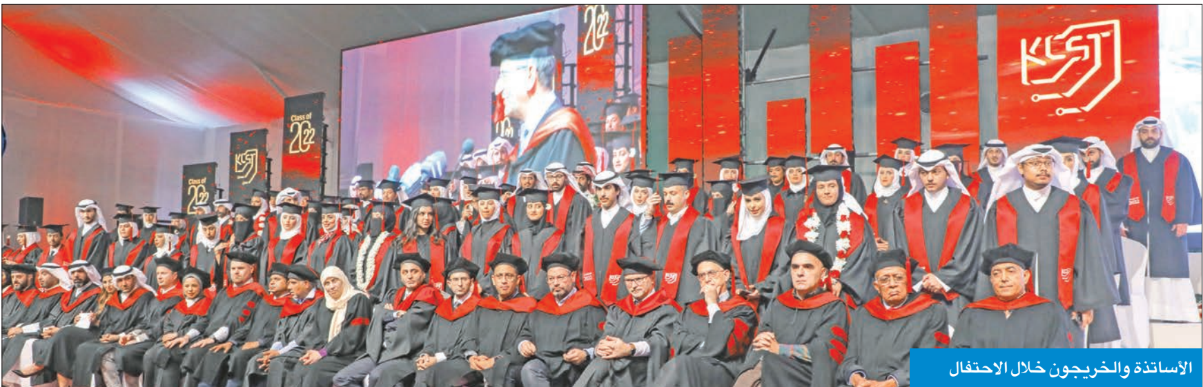
الأستاذة والخريجون خلال الاحتفال