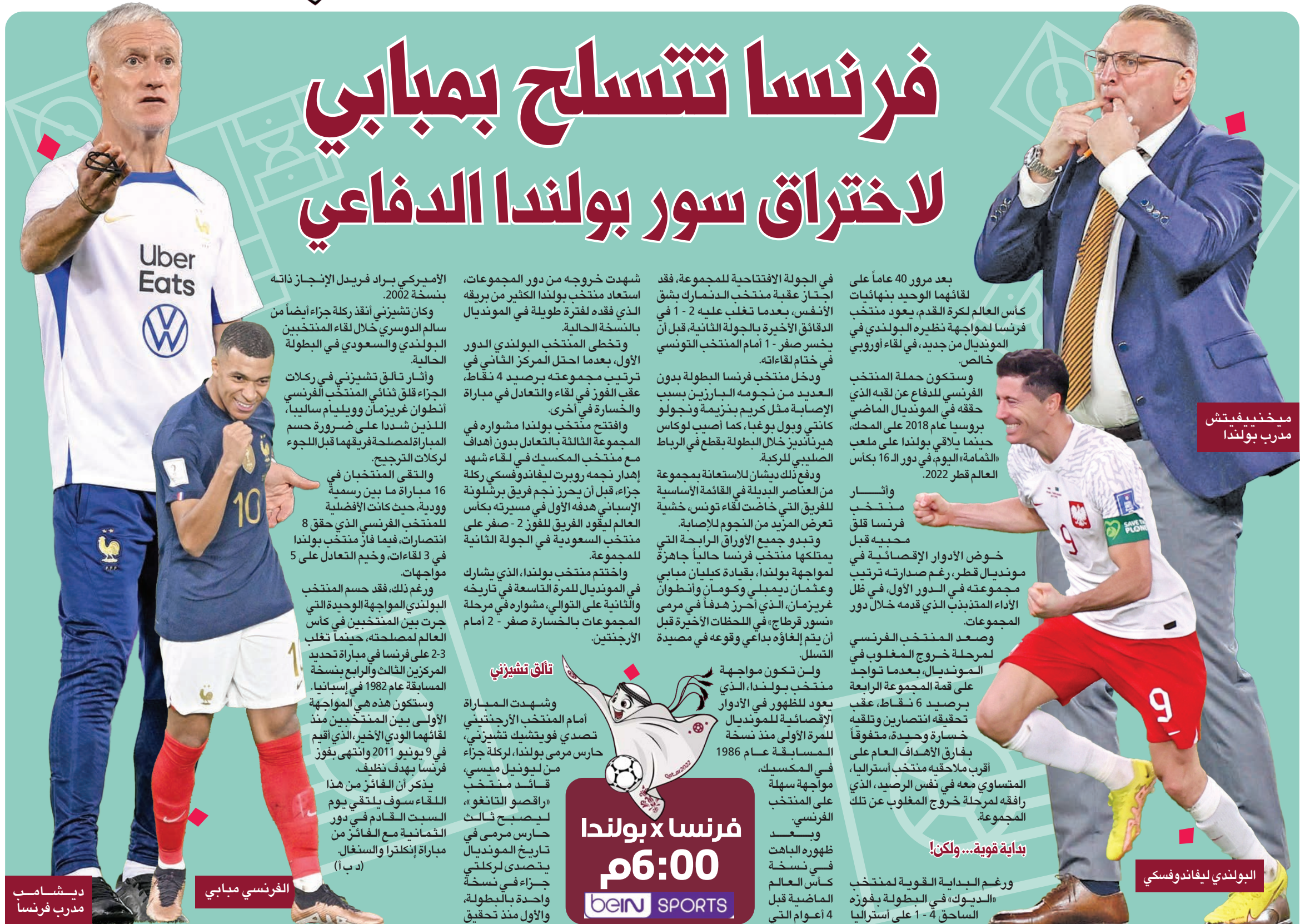
مختبر فيفتش مدرب بولندا