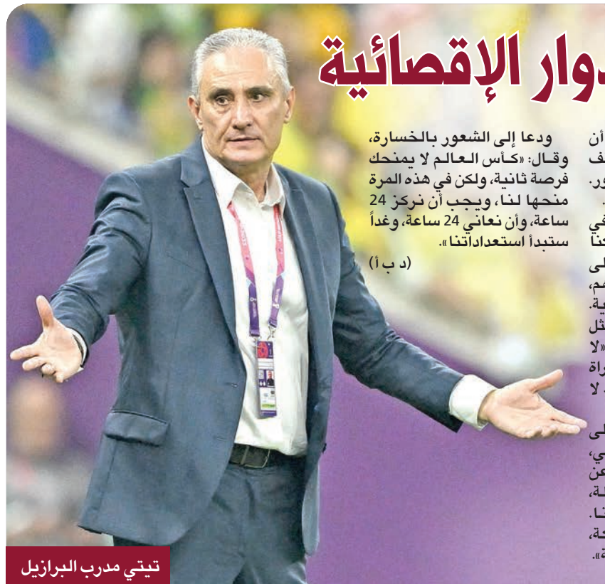
تيتي مدرب البرازيل

كان جيسوس يشعر بالفعل بالآلم قبل انطلاق منافسات كأس العالم، ويحتاج إلى شهر للتعافي، وهذا أكثر من كافٍ ليغيّب عما تبقى من مباريات في البطولة بقطر. وربما يحتاج اليكس تيليس إلى جراحة بعدما ترك ملعب مباراة أمس الأول الجمعة، وهو يعاني بعد اصطدامه بأحد لاعبي الفريق المنافس.