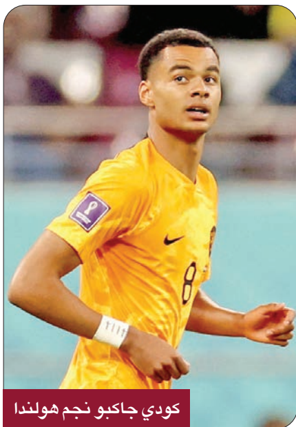
كودي جاكبو نجم هولندا