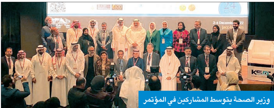
وزير الصحة يتوسط المشاركين في المؤتمر

أكد العتيبي أن المؤتمر يستضيف نخبة من الأطباء العالميين المتخصصين في الأمراض الجلدية وطب التجميل، كما يضم ورش عمل يتم من خلالها تدريب الأطباء العاملين في القطاع الحكومي والأهلي وأطباء البورد