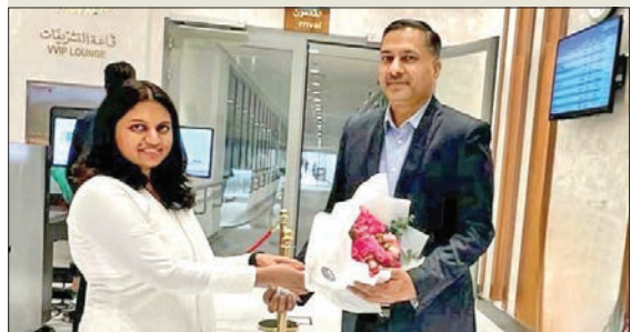
القائمة بأعمال السفير سميثا باتيل مستقبلة سويكا في المطار

وصل سفير الهند الجديد لدى الكويت د. أدارش سويكا، إلى البلاد، على أن يتولى مهامه قريباً. وقبل انتقاله إلى الكويت، عمل سويكا في دكا نائباً لرئيس البعثة، كما شغل منصب سكرتير أول في وزارة الشؤون الخارجية الهندية، وعمل مديراً في قسم الأمم المتحدة بوزارة الشؤون الخارجية. يذكر أن سويكا يحل مكان سيبي جورج، الذي كان قد أنهى مهمته في أكتوبر الماضي، وتسلم منصبه الجديد سفيرا لبلاد في اليابان.