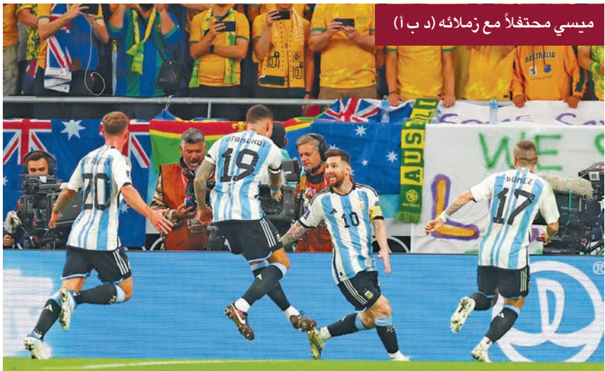
ميسي محتفلاً مع زملائه