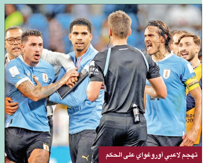
تهجم لاعبي أوروغواي على الحكم

سيطرت حالة من الغضب على لاعبي منتخب أوروغواي، بعد إقصائهم من مونديال قطر 2022، على الرغم من تحقيقهم الفوز على غانا 2 - صفر، في ختام مباريات دور المجموعات واحتل أوروغواي المركز الثالث برصيد 4 نقاط، بالتساوي مع كوريا الجنوبية (الخالت) بالنقاط وأيضاً بفارق الأهداف، لكن الأخير تأهل لأنه سجل أهدافاً أكثر. ونهجم عدد من لاعبي أوروغواي على حكم المباراة دانييل سيبيرت بطريقة همجية، كما أن المهاجم ايدنسون كافاني شوهد وهو يحطم شاشة «var» أثناء مغادرته أرض الملعب في تصرف غير أخلاقي إطلاقاً من جهته، ادعى الأوروغواياني