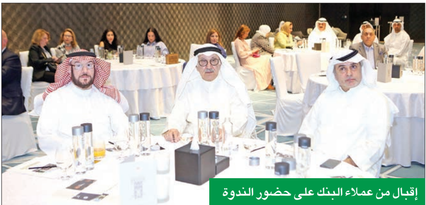
إقبال من عملاء البنك على حضور الندوة

في إطار جهوده المتواصلة لنشر وتطوير المعارف المالية والمصرفية لعملائه، بهدف تعزيز قدرتهم على اتخاذ القرارات المالية والاستثمارية وفقاً لأسس صحيحة ومدروسة، نظم البنك الأهلي المتحد ندوة في 6 نوفمبر الماضي، بفندق الفورسيزون - الكويت، لتقديم لمحة عامة عن تحديات السوق الرئيسي للعقارات السكنية في مدينة لندن. وتعد هذه الندوة جزءاً من جهود «المتحد» لتقديم عملائه بأحدث تطورات السوق في وسط لندن، وإبقائهم على اطلاع على آخر المستجدات التي تحدث للسوق العقاري في لندن، وكل ما يخص الضرائب العقارية هناك. استهدفت الندوة شريحة