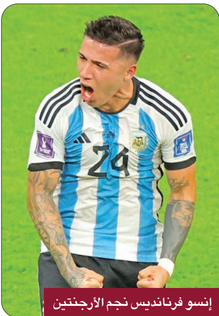
إنسو فرنانديس نجم الأرجنتين