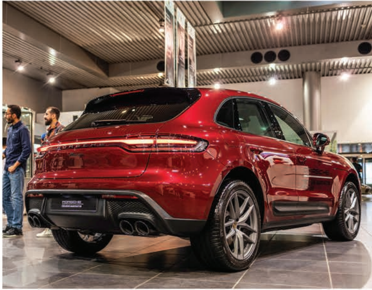
بورشه مكان باللون الحصري - أحمر أرينا ميتاليك