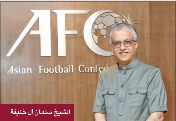
الشيخ سلمان آل خليفة

المستمر لممثلي القارة الصفراء في المحفل العالمي الكبير. وأعرب عن خالص تمنياته باستمرار النجاح والتألق لمنتخبات أستراليا واليابان، وكوريا الجنوبية، التي حققت إنجازاً تاريخياً من خلال تاهل 3 منتخبات آسيوية إلى دور الـ 16