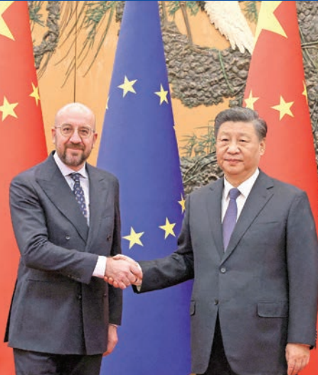
الرئيس الصيني مستقبلاً شارل ميشال في بكين قبل يومين

ويضيف كروبيسي، مؤسس ورئيس معهد يوركتاون للدفاع، نائب وكيل وزارة البحرية الأميركية الأسبق، في تقرير نشرته مجلة ناشونال انترست الأميركية، أن تصريحات رئيس وزراء بريطانيا السابق، بوريس