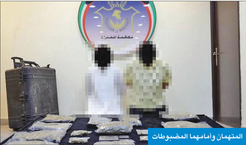
المتهمان وأمامهما المضبوطات

المواطن، وأنهما يعملان على ترويجهما منذ فترة، بعد أن نجحا عقد صفقة مع المتهم عبر أحد مصادره السرية على شراء كمية من «الماريغوانا». وذكر أنهم تمكنوا من ضبط المتهم متلبساً أثناء عملية التسليم والتسليم، وأحالوه إلى مكتب التحقيق، واعترف بأنه يخفي المخدرات في شقة شريكه