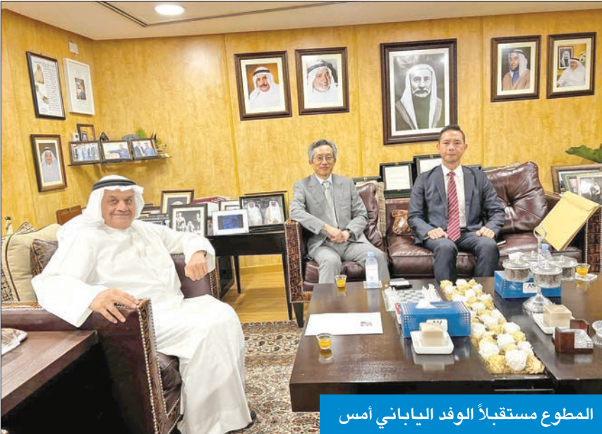
المطوع مستقبلاً الوفد الياباني أمس

شركات تجارية في مختلف القطاعات التي تعمل بها، منها قطاع الأدوية والمستحضرات الصيدلانية».