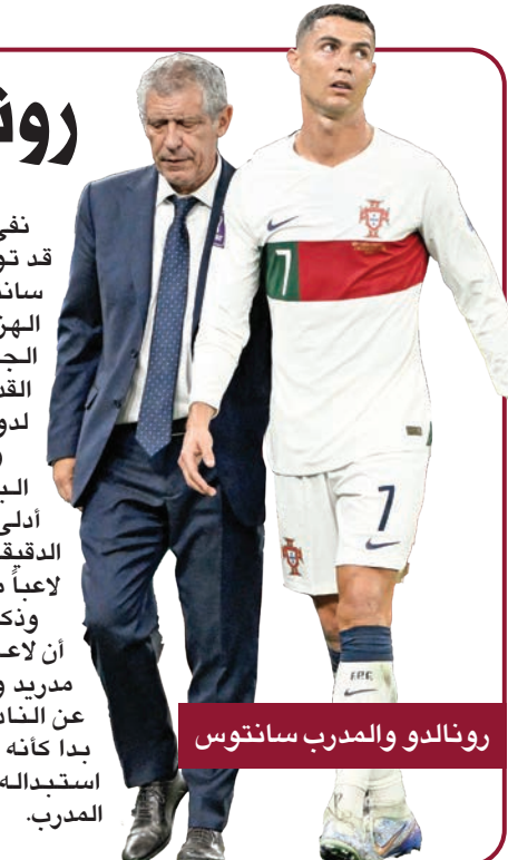
رونالدو والمدرّب سانتوس

وقال رونالدو، قائد منتخب البرتغال، إن التعليقات التي أدلى بها لدى مغادرته الملعب في الدقيقة 65، كانت تستهدف في الواقع لاعباً من كوريا الجنوبية. وكررت وسائل إعلام برتغالية أن لاعب مانشستر يونايتد وريال مدريد ويوفنتوس السابق، الذي رحل عن النادي الإنكليزي الشهر الماضي، بدا كأنه يتحدث سانتوس بسبب قرار استبداله مستخدماً لغة بذخية تجاه المدرب.