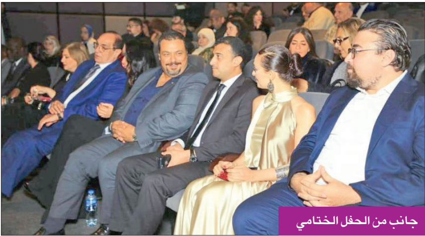
جانب من الحفل الختامي

ولادة الفكرة حتى اكتمال العمل وإخراجه. كما استعرضت أسباب الاختلاف بين الأعمال الفنية التي تعود إلى طريقة الجمع بين مكونات وعناصر العمل السينمائي والخط بينها، وأهمية اختيار الإطار المقدم