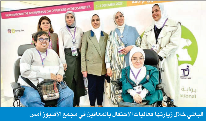
البغلي خلال زيارتها فعاليات الاحتفال بالمعاقين في مجمع الأفنيون امس

وأوضحت المصادر أن فريق تنفيذ قواعد وضوابط استحقاق