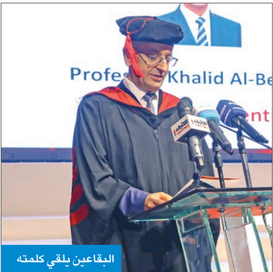
البقاعين يلقي كلمته

الدفعة الثالثة من خريجي الكلية ضمت 233 طالباً وطالبة من مختلف الاختصاصات