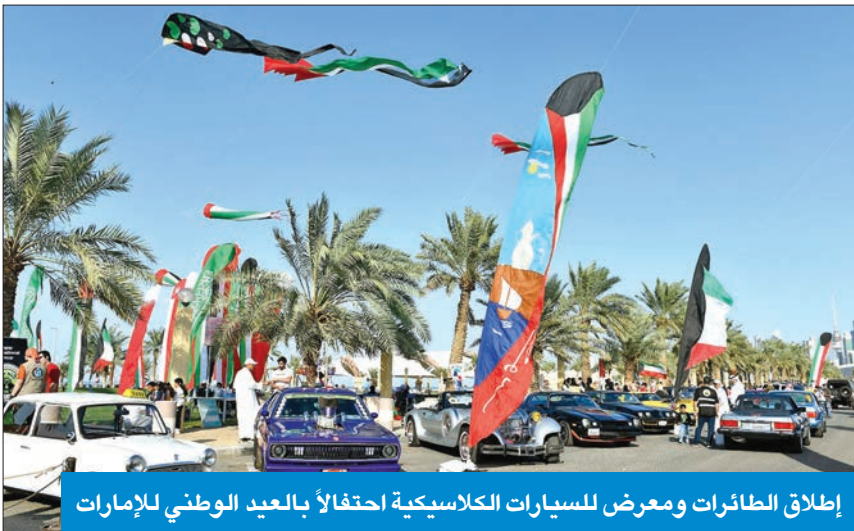
إطلاق الطائرات ومعرض للسيارات الكلاسيكية احتفالاً بالعيد الوطني للإمارات

على امتدادواجهة البحرية، مروراً بإبراج الكويت، تبدو طائرات ورقية بأشكال وتصميمات واللوان شتى تسبح في الأجواء، وكلما اتجهنا نحو شاطئ الوطنية «الشويخ» اقتربت الصورة أكثر لتظهر مجسمات وتصميمات تلف السماء هناك، وسط متابعة وتفاعل واضح من الجمهور، كنوع من مشاركة الانشقاق في الإمارات في الذكرى الـ 51 لليوم الوطني.