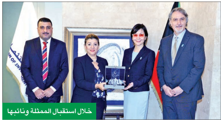
خلال استقبال الممثلة ونائبها

منتجات استثمارية خضراء أو رضاء مستدامة وحقيقية، لمساعدة الشركات وكل المهتمين على فهم وتطبيق متطلبات الجهات الرقابية في هذا الخصوص، وكذلك لتعزيز العمل بمفهوم الاستدامة لدى قطاع الاستثمار وفقا لأفضل الممارسات العالمية، وبما يحقق الربحية المطلوبة لهذه الشركات، ولما لهذه المبادرات الخضراء من أثر إيجابي كبير في الحفاظ على البيئة، ومساهمة فاعلة في تحقيق خطة التنمية المستدامة الوطنية 2035.