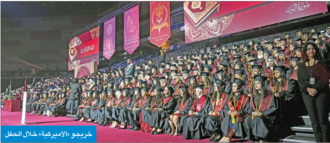
خريجو «الأميركية» خلال الحفل

احتفلت الجامعة الأميركية في الكويت بتخريج كوكبة من خريجي دفعة عام 2022، وذلك يوم الاثنين الماضي في «ذا أرينا كويت بمجمع 360»، بحضور مؤسسة ورئيسة مجلس أمناء الجامعة، الشبخة دانة ناصر الصباح، وأعضاء مجلس أمناء الجامعة، إضافة إلى عدد من الدبلوماسيين وكبار الشخصيات وعائلات الخريجين. ومنحت الجامعة في الاحتفالية درجة البكالوريوس لـ 510 خريجين، منهم 185 من كلية الآداب والعلوم، و131 من كلية إدارة الأعمال والاقتصاد، و194 خريجاً من كلية الهندسة والعلوم التطبيقية، من بين دفعة عام 2022، حصل 8 منهم على تقدير امتياز مع مرتبة الشرف، و25 حصلوا على مرتبة الشرف العليا و40 تخرجوا بمرتبة الشرف. وألقت رئيسة الجامعة، د. روضة عواد، كلمة للطلبة