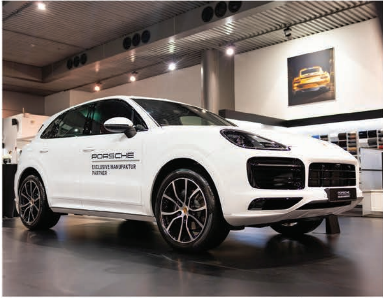
بورشه كاين بلون أبيض كارارا الالام