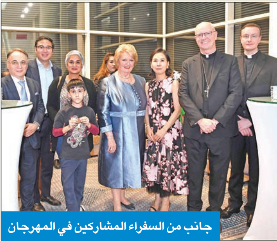
جانب من السفراء المشاركين في المهرجان

إقبال كثيف على مهرجان مأكولات الشارع الكوري 2022