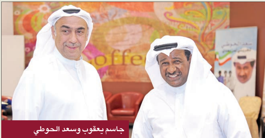
جاسم يعقوب وسعد الحوطي

منتخب الكويت السابق جاسم يعقوب الملقب بـ «المرعب»، إن دولة قطر لم تدخر جهداً في تسخير كل الإمكانيات لإنجاح هذا