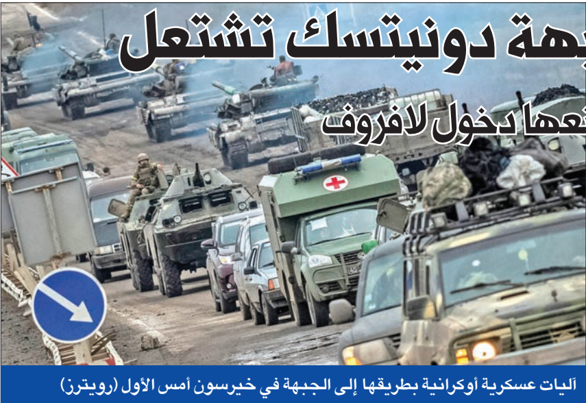
ليات عسكرية اوكرانية بطريقها إلى الجبهة في خيرسون أمس الاول

ومع تواصل المفاوضات الشاقة، بين الدول الصناعية الغنية الأطراف المسورة، والدول الفقيرة التي ترغب في الحصول على تعويضات لمواجهة أضرار التغير المناخي، خاصة بعد السيول غير المسبوقة التي ضربت باكستان وبنجيريا، أكد مصدر أوروبي لوكالة فرانس برس التوصل إلى اتفاق حول مسألة «الخصائر والأضرار» المناخية التي تكبدتها الدول النامية. وأوضح المصدر أن الخطوة، التي تعد نصف توافق، تنص على إنشاء صندوق خاص مكرس للخصائر والأضرار، بوجه الأموال إلى أكثر الدول ضعفاً إزاء التغير المناخي على أن يتم مناقشة آلية عمله بالقامة المقبلة.