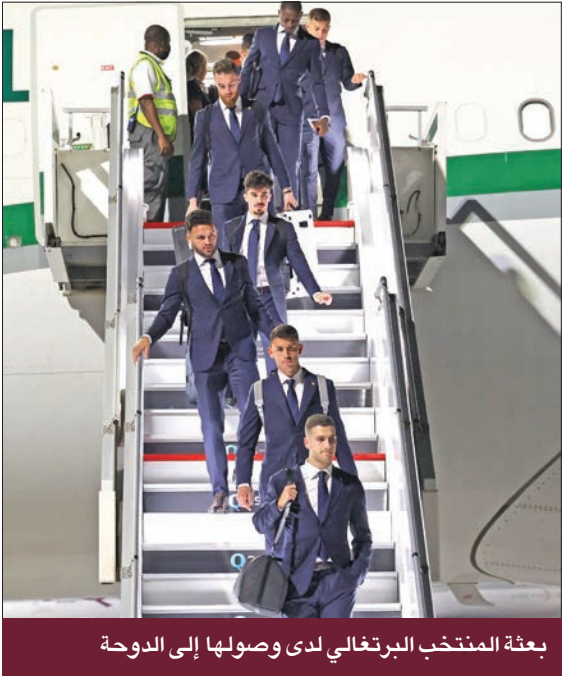
بعثة المنتخب البرتغالي لدى وصولها إلى الدوحة

ومدربه الهولندي إريك تن هاغ. وحلّت البرتغال في الدوحة قطر الخميس ضد غانا، ضمن المجموعة الثامنة، التي تضم الأوروغواي (يلتقيها في 28 نوفمبر) وكوريا الجنوبية (يلتقيها في 2 ديسمبر).