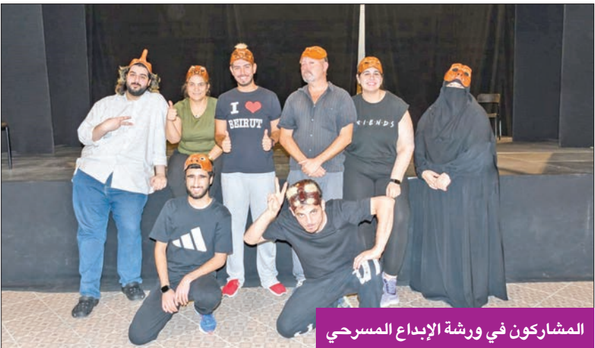
المشاركون في ورشة الإبداع المسرحي

وتواصل «لابا» تنفيذ ورشها الثلاث الباقية من ورشة «الأداء