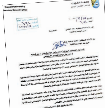
صورة ضوئية للكتاب الموجه من الأمين العام إلى مدير الجامعة