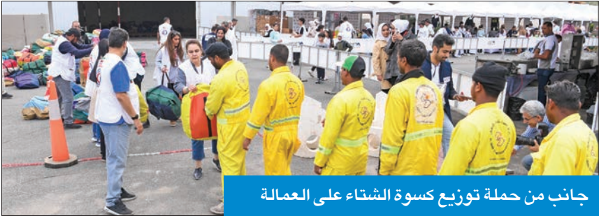
جانب من حملة توزيع كسوة الشتاء على العمالة

وأضافت البرجس أن عدد المستفيدين من هذه الحملة يقدر بـ 5 آلاف عامل، مشيرة إلى أن هذه