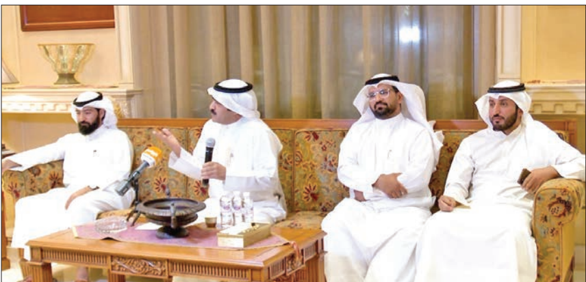
المشاركون في الأمسية

تشارك الفنانة سهير المرشدي في بطولة مسلسل «ضرب نار» مع ياسمين عبدالعزيز، وهو العمل المقرر عرضه في رمضان المقبل على الشاشات. وتعود المرشدي بعد غياب عن الدراما في فترات الأخيرة من خلال المسلسل، إذ وقعت التعاقد بالفعل مع الشركة المنتجة، استعداداً لبداية التصوير خلال الأيام المقبلة. وستقدم سهير أحد الأدوار المتميزة في الأحداث، التي سيكون لها تأثير بالأحداث التي تجمع بين ياسمين عبدالعزيز وزوجها الذي يشاركها في البطولة أحمد العوضي، علماً بأن مخرج العمل مصطفى فكري سيبدأ تصويره خلال التحضير للجلسات خلال الأسبوع المقبل، بالترزامن مع انتهاء السيناريست ناصر عبدالرحمن من كتابة حلقات العمل.