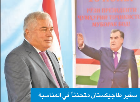
سفير طاجيكستان متحدثاً في المناسبة