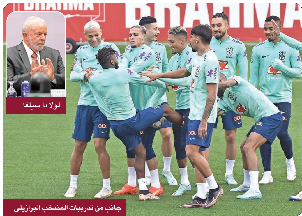
لولا دا سيلفا

اعتبر الرئيس البرازيلي المنتخب لويس إيناسيو لولا دا سيلفا، أن الوقت غير موات للحكم على اختيار قطر لتنظيم بطولة كأس العالم لكرة القدم التي تبدأ اليوم.