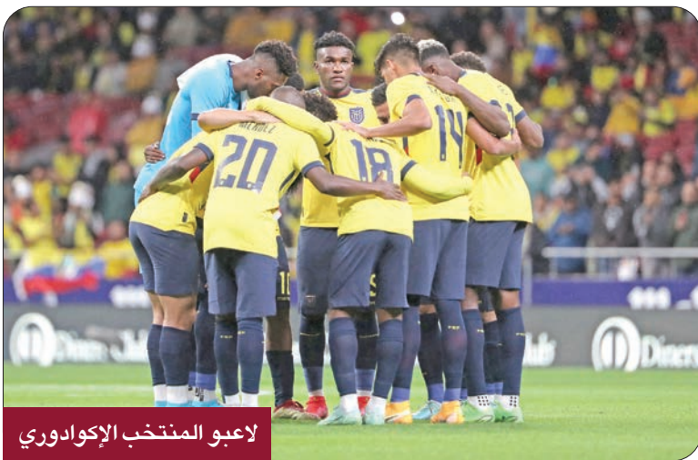
لاعبو المنتخب الإكوادوري