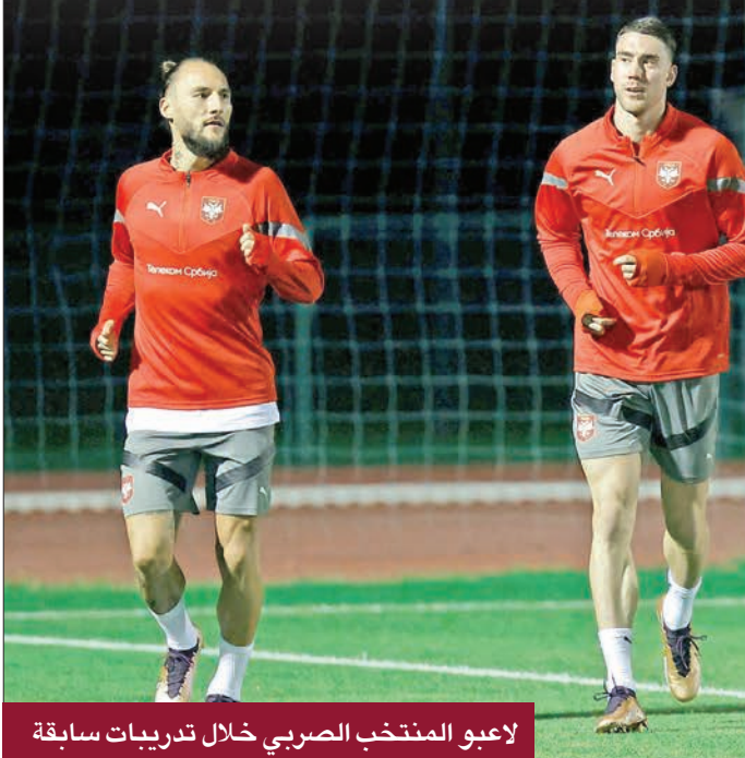
لاعبو المنتخب الصربي خلال تدريبات سابقة

أنهت صربيا تحضيراتها لنهائيات كأس العالم التي تستضيفها قطر من اليوم حتى 18 أكتوبر، بفوز ودي كبير على مضيفتها البحرين 5-1 أمس الأول. وبعدما أنهت الشوط الأول متعادلة بهدف لدوشان تاديتش (8) مقابل هدف لعبدالله يوسف هلال (15) من ركلة جزاء، زج المدرب دراغان ستوكوفيتش في بداية الشوط الثاني بمهاجم يوفنتوس الإيطالي دوشان فلاهوفيتش الذي غاب عن المباريات الأخيرة لعملاق تورينو بسبب الإصابة. وسرعان ما ترك مهاجم فيورنتينا الإيطالي السابق أثراً بتمريره كرة هدف التقدم لتاديتش (50) الذي رد الجميل بعد ثوان، مانحاً فلاهوفيتش فرصة تسجيل الهدف الثالث للمنتخب الصربي (51). وبقيت النتيجة على حالها حتى الدقيقة 87 حين أضاف فيليب دجوريتشيتش، بديل تاديتش، الهدف الرابع بكرة رأسية بتمريرة من فيليب ملادينوفيتش (87)، قبل أن يلعب فلاهوفيتش دور الممرر مجدداً في الهدف الخامس الذي سجله لوكا يوفيتش (89). وتبدأ صربيا مشاورها في المونديال القطري الخميس بمواجهة من العيار الثقيل ضد البرازيل بطلة العالم خمس مرات، ضمن المجموعة السابعة التي تضم سويسرا والكاميرون.