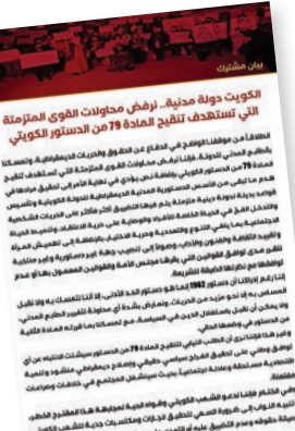
صورة ضوئية لبيان الجمعيات

«تنقيح المادة 79 من الدستور يستهدف تأسيس قواعد بديلة لدولة دينية مترممة»