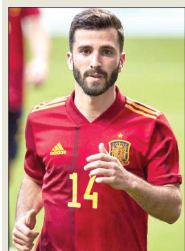
خوسيه لويس غايا

مدافع فالنسيا على وداع حار من زملائه الـ 25 في المنتخب بين عناق ورسائل دعم وتصفيق حاد. وأكد قائد الفريق سيرجيو بوسكيتس للاعب «كلمات قليلة فقط قد تزيل عنك الشعور بتركنا والذهاب والتغيب عن المونديال بعد كل ما تكبدناه خلال النصفيات». وأضاف بوسكيتس «شكلنا مجموعة رائعة وسنفقد كثيرا داخل الملعب وخارجه. سيكون ذلك دافعا للبقية كي نكافح من أجل تحقيق شيء، ستكون معنا رغم رحيلك وسنفعلها من أجلك». ورد غايا بتمني الأفضل والتوفيق لزملائه قائلا «كل التوفيق. نحن منتخب رائع وأنا حزين جدا لعدم الاستمرار معكم لأنني كنت متحمسا جدا هنا».