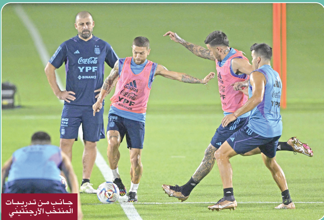
جانب من تدريبات المنتخب الأرجنتيني

في إطار الجولة الأولى من دور المجموعات، ضمن مجموعة تضم أيضا المكسيك وبولندا. (إفي)