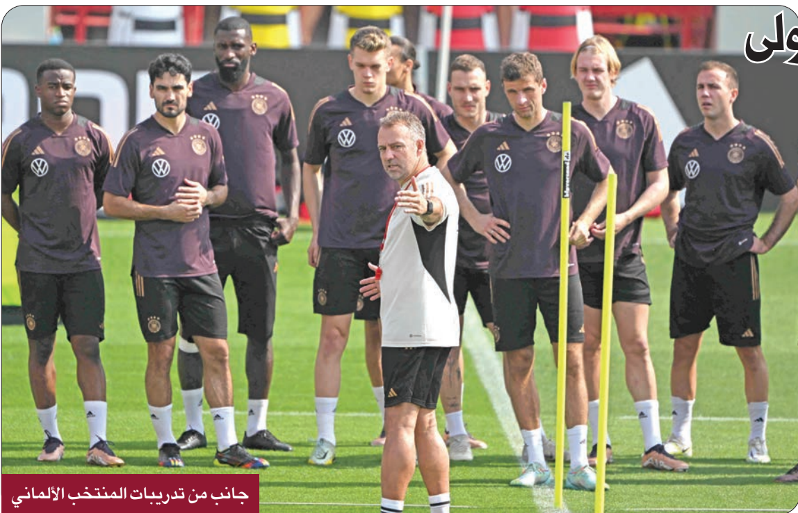
جانب من تدريبات المنتخب الألماني