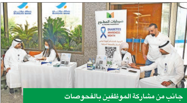
جانب من مشاركة الموظفين بالفحوصات

والفعال للصحة الجسدية والعقلية والاجتماعية لموظفيه، وباعتباره مؤسسة مالية مسؤولة اجتماعياً تتناسق أعمالها مع فلسفتها الإنسانية (أنت دافعا)، يواصل برقان لعب دور قوي في تعزيز ثقافة الصحة والوقاية في المجتمع كله، ويعمل بانتظام على الوصول إلى جميع مكونات المجتمع العامة من خلال مبادرات مؤثرة بمناسبة الأيام العالمية للتوعية بمختلف المسائل المتعلقة بالصحة العامة من خلال مسابقات مؤثرة تعزز رفع مستوى الوعي والتغيير الإيجابي.