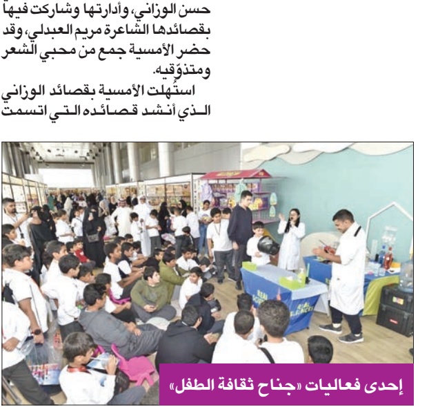
إحدى فعاليات «جناح ثقافة الطفل»

استهلّت الأمسية بقصائد الوزاني الذي أنشد قصائده التي اتسمت