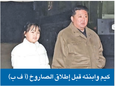
كيم وابنته قبل إطلاق الصاروخ

في أجواء من التوتر المتصاعد، أشرف الزعيم الكوري الشمالي كيم جونج أون على إطلاق صاروخ «الوحش» هواسونغ - 17 الباليستي العابرة للقارات برفقة ابنته التي قدمها للعالم للمرة الأولى، مؤكداً أنه سيستخدم القنبلة الذرية في حال حصول هجوم نووي ضد بلاده.