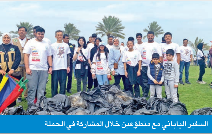
السفير الياباني مع متطوعين خلال المشاركة في الحملة

وستؤدي العناية بكوكبنا إلى تحسين جودة الحياة بالمستقبل».