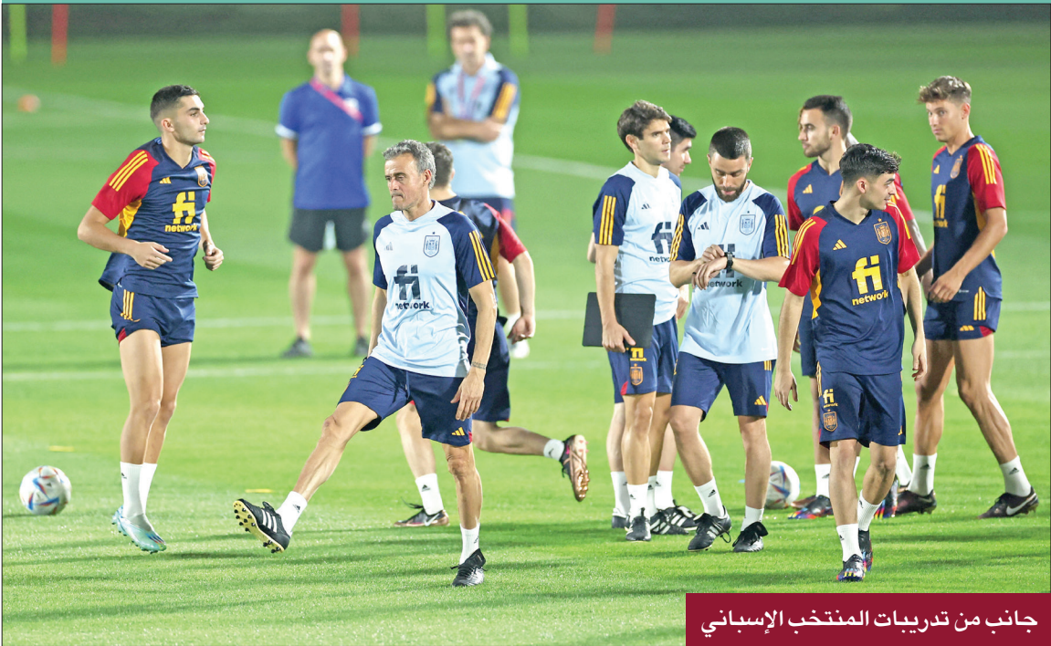
جانب من تدريبات المنتخب الإسباني

كانت الحصة التدريبية الثانية للمنتخب الإسباني في معسكره الأساسي بالدوحة، بجامعة قطر، تجربة ساخنة للمدير الفني للمنتخب لويس إنريكي، تحت درجة حرارة تقترب من 30، مع شعور أكبر بالحرارة بسبب رطوبة بلغت نسبتها 57%، في الوقت الذي عاد ماركو أسينسيو للمشاركة في المران الجماعي، بينما ينتظر الفريق وصول أليخاندرو بالدي إلى المعسكر. وتدريب منتخب إسبانيا بدأ من 10:30 صباحا بالتوقيت القطري، وسط شعور بدرجات الحرارة المرتفعة في الدوحة، وهو يعد المنتخب الوحيد، بجانب هولندا، الذي تدرب الجمعة الساعة 11:00 صباحا في ملعب بجوار منتخب لاروخا، الذي تدرب في ظل درجات حرارة مرتفعة لن يشعر بها في مباريات المونديال، نظرا لأن الملاعب مزودة بنظام تبريد في أحدث طراز.