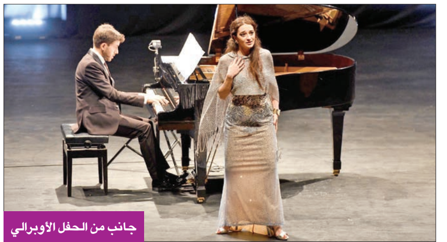
جانب من الحفل الأوبرالي

وأضاف: «تم إنشاء المعهد بإيطاليا في يوليو 1889، وتوجد له فروع في المنطقة العربية خصوصاً مصر، ومن أهم أهدافه: إتاحة اللغة الإيطالية والأدب الإيطالي والثقافة الإيطالية على نطاق كبير في أنحاء مختلفة في العالم للصغار ولكل محبي إيطاليا».