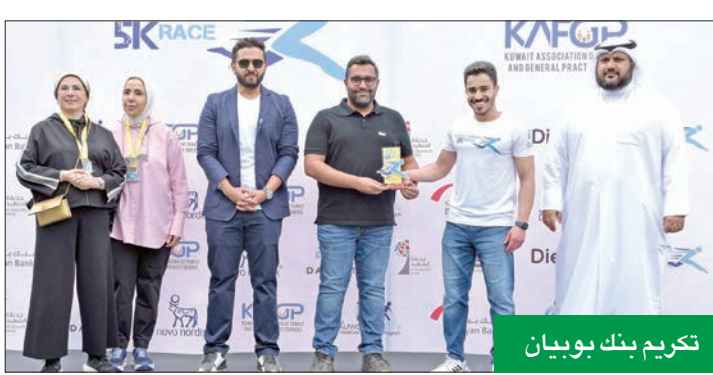
تكريم بنك بوبيان

تلبية مسابقات رياضية مختلفة، بمشاركة أكثر من 300 شخص من الطواقم الطبية في الكويت وطلبة مركز