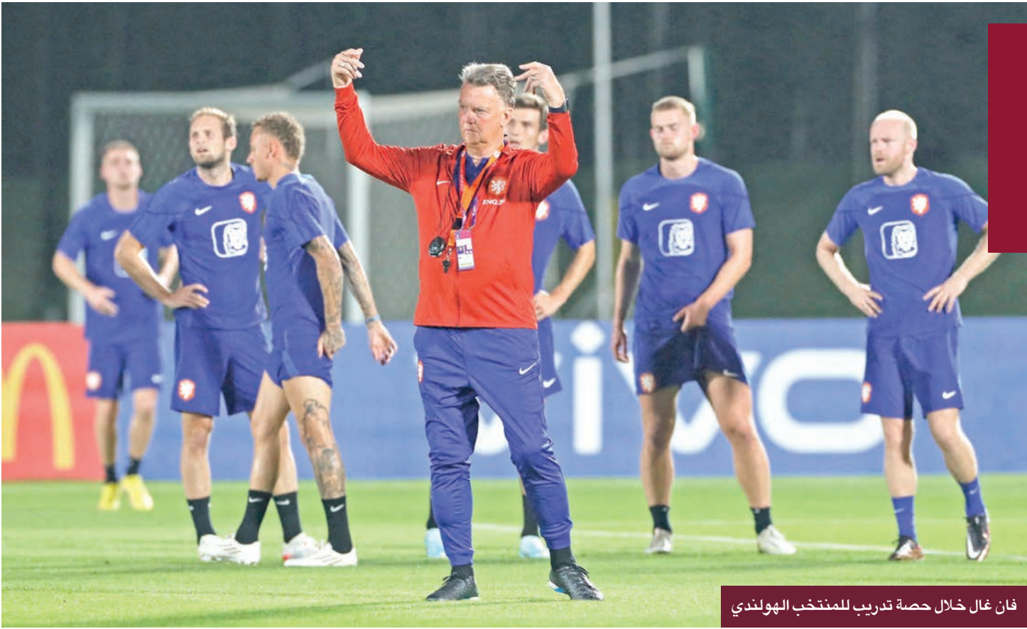
فان غال خلال حصة تدريب للمنتخب الهولندي

من سيكون حارساً لمرمي المنتخب الهولندي لكرة القدم في مونديال قطر، اختار المدرب لويس فان خال استبعاد أكثر حراس مرمي «البرتغالي» خبرة، ياسبر سيليسن، في رهان جديد للمدرب المخضرم. لعب حراس المرمي الثلاثة في التشكيلة الرسمية الهولندية 8 مباريات دولية، أي أقل بثمانية مرات من سيليسن (33 عاماً)، (63 مباراة دولية)، الذي «انفجر بغضب» عندما علم بعدم استدعائه، وفقاً لوسائل الإعلام المحلية. أمام السنغال في الجولة الأولى من منافسات المجموعة الأولى، غداً، من المرجح أن يكون اختيار فان خال بين حارس مرمي فينورد جاستن بيلو (24 عاماً)، وصاحب 6 مباريات دولية، لكنه لم يخض أي واحدة في 2022، ومخضرم أياكس أمستردام ريمكو باسفير (39 عاماً) وصاحب مباراتين دوليتين فقط، خاضهما في سبتمبر الماضي مكافأة على