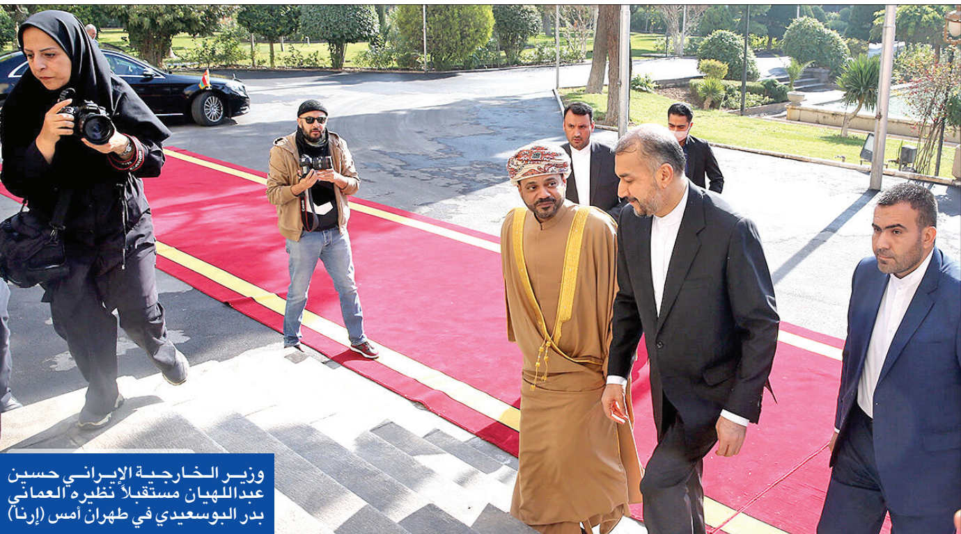
وزير الخارجية الإيراني حسين عبد الهان مستقبلاً نظيره العماني بدر البوسعيدي في طهران أمس (إرنا)

التي تستمر 5 أيام مستشار الأمن القومي الأمريكي، جيك سوليفان. في غضون ذلك، أعلن قائد القيادة الوسطى (سنتكوم)، مايكل كوربلا، أن قوة مختصة بالانظمة غير المأهولة الضربات طالت منطقة تابعة لمحافظة حمص لأول مرة. وتحدث «المرصد» عن سقوط قتلى من ميليشيات موالية لإيران في القصف الإسرائيلي، الذي انطلق من فوق البحر المتوسط من اتجاه بانباس، ودُمر مخازن أسلحة وذخيرة في ريف منطقة مصياف بحماة ومواقع أخرى في الريف الحبيش الإسرائيلي، أفيد كوخافي، إلى الولايات المتحدة، في ثاني زيارة يقوم بها إلى واشنطن، لمناقشة القضايا المتعلقة بالتحديات الأمنية في المنطقة، وعلى رأسها «التهديد الإيراني». ومن المقرر أن يلتقي كوخافي خلال زيارته