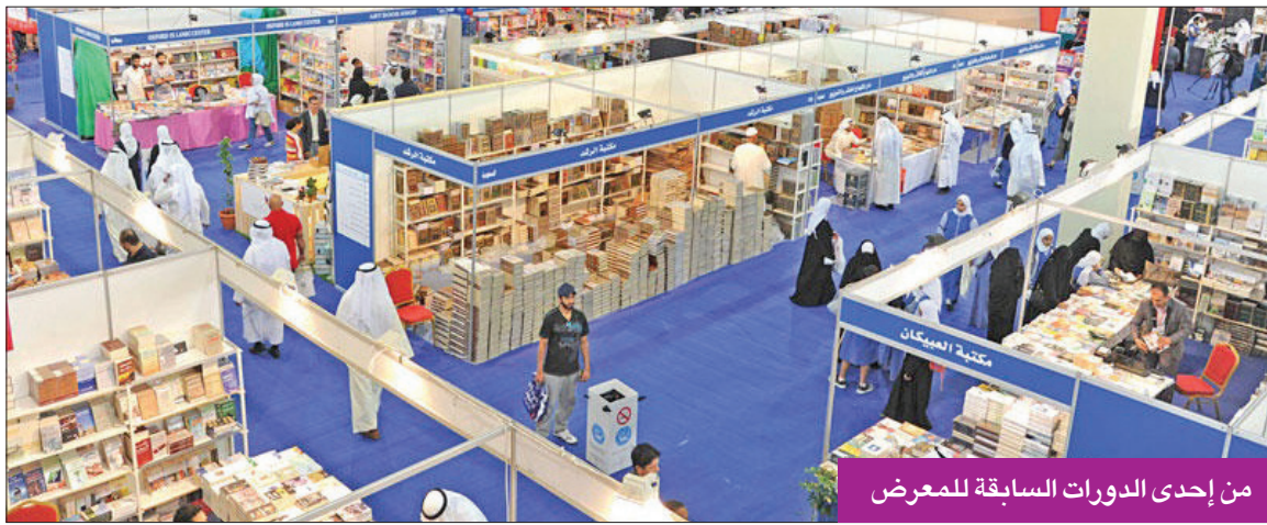
من إحدى الدورات السابقة للمعرض

وأضاف: «نتمنى أن يكون معرضاً داعماً للناشرين، خاصة بعد الخوف بسبب جائحة كورونا، وقد تسببت في تعريض الناشرين لآزمات كبيرة، والناشر الكويتي يحتاج إلى دعم من الدولة لاستمرارية النشاط الثقافي والفكري والتنويري للكتاب».