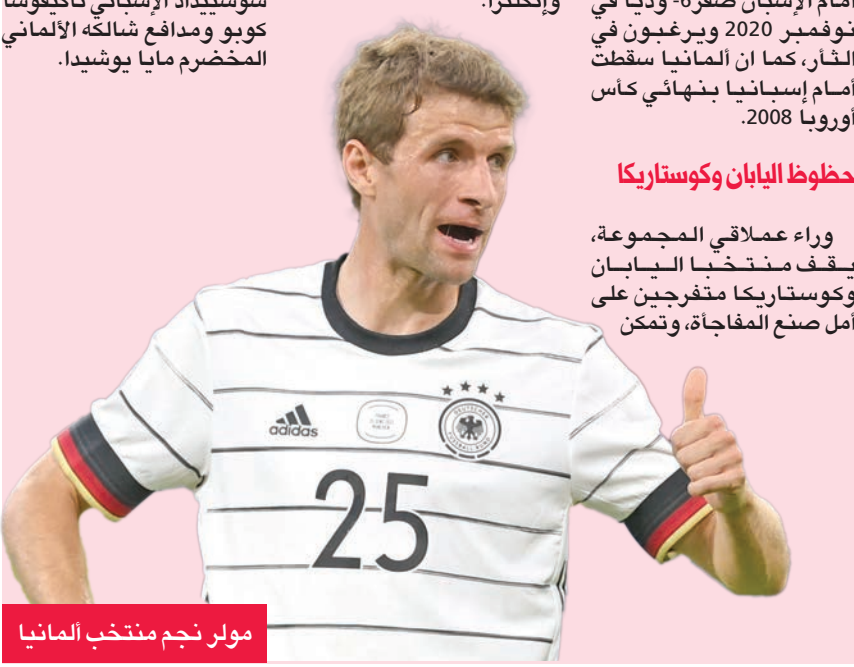
مولر نجم منتخب ألمانيا

جهتها، لم تنجح اليابان في تخطي الدور الثاني في مشاركاتها الست بدءاً من مونديال 1998، وهي تعوّل على تاكومي مينامينو مهاجم موناكو الفرنسي ومدافع أرسنال الإنكليزي تاكههيرو تومياسو، بالإضافة إلى جناح ريال سوسيداد الإسباني تافيغوسا كويو ومدافع شالكه الألماني المخضرم مايا يوشيدا.