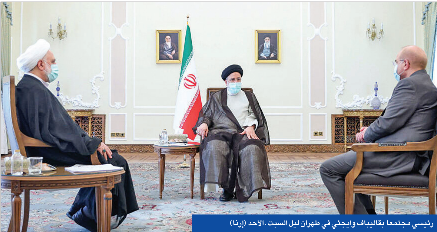
رئيسي مجتمعاً بقالبياف واجنئي في طهران ليل السبت. الأحد (إرنا)

في خضم اتهامات غربية لها بالتورط في الحرب الروسية - الأوكرانية وتواصل الاحتجاجات الشعبية المطالبة بالتغيير للأسبوع الثامن على التوالي، كشفت السلطات الإيرانية عن صاروخ جديد يطلق عليه «صباد B4»، وأعلنت تحديث منظومة «باور 373» للدفاع الجوي.