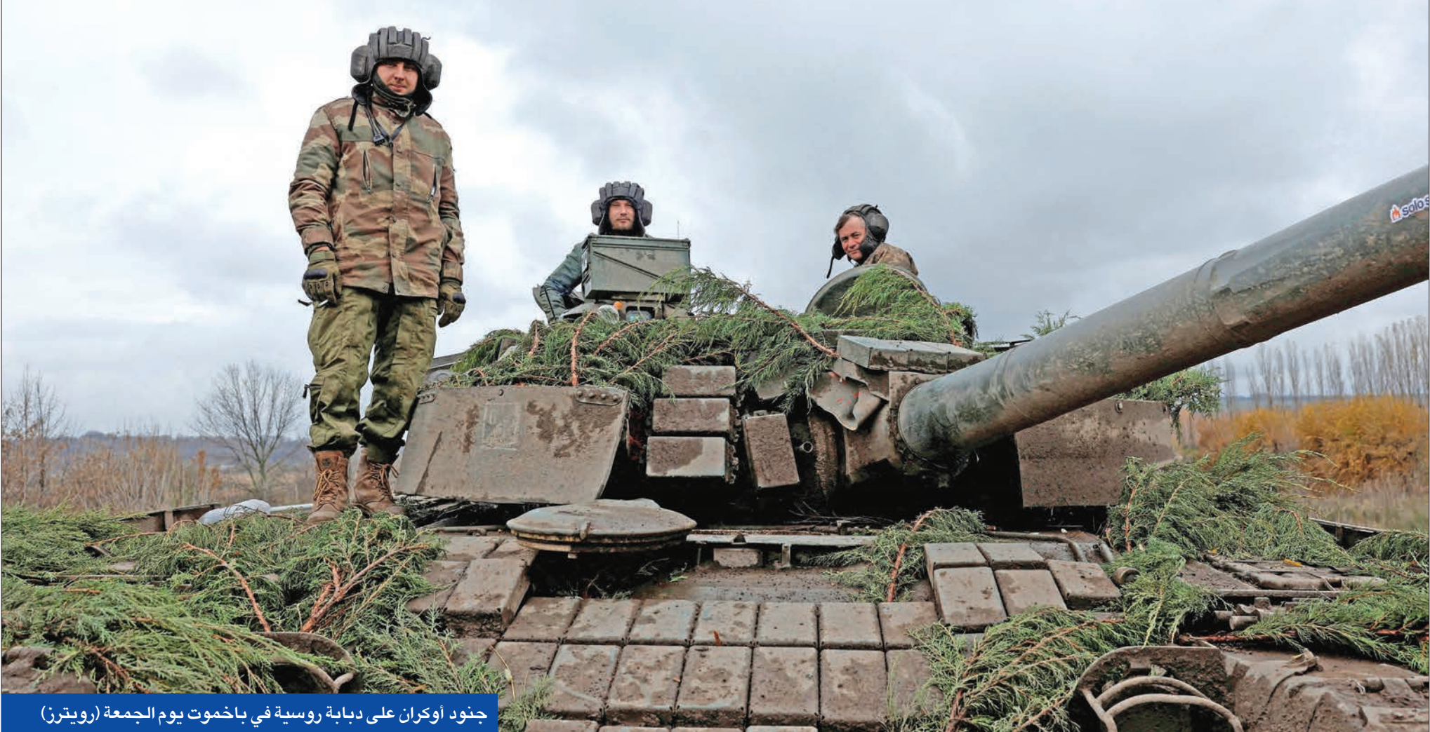
جنود أوكران على دبابة روسية في باخموت يوم الجمعة