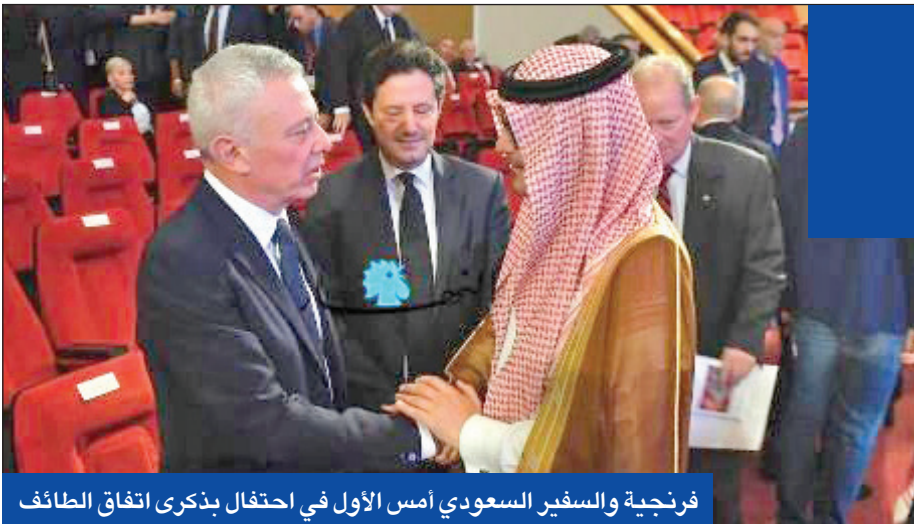
فرنجية والسفير السعودي أمس الأول في احتفال بذكرى اتفاق الطائف

وبينت كنيسة القلب المقدس في عام 1939 على أرض تبرع بها حاكم البلاد في ذلك الوقت، مما وضع البحرين على مسار أن تصبح واحدة من أكثر دول المنطقة ترحيباً بغير المسلمين. وهناك كنيسة كاثوليكية أخرى في البحرين، وهي كاتدرائية حديثة في الأكبر في شبه الجزيرة العربية، وبالمملكة نحو 160 ألف كاثوليكي أغلبهم من العمالة الوافدة. كما يزور الكثير من الكاثوليك الكنيستين من السعودية التي تمنع ممارسة غير المسلمين الشعائر علناً. وقال المدير الرسولي في شمال شبه الجزيرة العربية المطران بول هيندر أن هناك نحو 60 قسا يخدمون ما يقدر بملبوني كاثوليكي في أربع دول في ظروف صعبة، في بعض الأحيان بسبب قيود على بعض دول المنطقة. وندد البابا خلال زيارته التي استمرت أربعة أيام بمنطقة «الكتل المتعارضة» بين الشرق والغرب والتي تجعل العالم في «توازن هش»، مؤكداً إصراره على خيار الحوار كبديل عن «المواجهة».