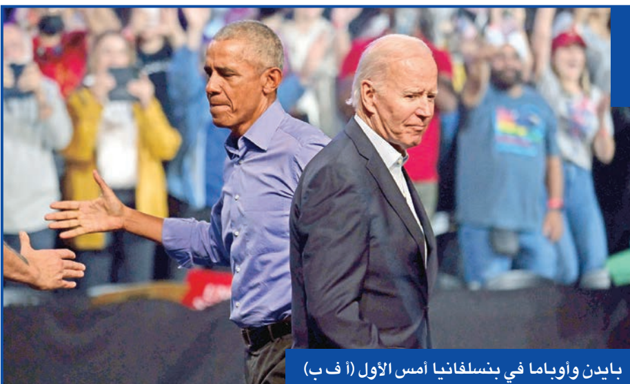
بايدن وأوباما في بنسلفانيا أمس الأول

ولاية بنسلفانيا جون فيتزمان، البالغ طوله أكثر من مترين، وذو الميول التقدمية والمظهر المسترخي، إن يعتمد ارتداء السراويل القصيرة وسترات مع قبعة، وكان عمدة مدينة صغيرة تضرتت بشدة من تراجع النشاط الصناعي. وبعد أن أظهرت استطلاعات الرأي تفوق فيتزمان فترة طويلة، نقلص الفارق لمصلحة المرشح الجمهوري. وظهر جون فيتزمان الذي أصيب بسكتة دماغية في مايو وضعف الصعوبة في إيجاد كلماته خلال المناظرة التلفزيونية مع منافسه. ورأى مايكل كوبرمان (مدرس - 54 عاماً) وارتدى قميصاً أبيض ووضع نظارات شمسية، أن فيتزمان «بدا شجاعاً، ولذلك يستحق الحصول على نقاط». وفي حين اعتبر أن الحنين إلى باراك أوباما في أوجّه، تذكر زيارته إلى فيلادلفيا في 2006 وخطابه «المثير للإعجاب»، الذي يمكن مقارنته بجون إف. كينيدي، ولفت إلى أن انتخاب جو بايدن «كان تصويتاً على عودة الحياة الطبيعية». رصيف أمام مركز لباكوراس للرياضة والترفيه في جامعة تمبل، مكان التجمع. وقارنت الحزب الجمهوري ب«الديكتاتورية». وقالت: «يشيرون إلى الأمور ويقولون ب«الديكتاتورية». وبوبنوسيه في ظل اعلام اميركية كبيرة. وقالت «إنه أمر مخيف لإمرأة هذه الأيام... كنا نأمل أن ذلك أصبح من الماضي»، وإضافة إلى الإجهاد تخشى إلغاء التأمين الصحي، وقالت: «أعمل بدوام كامل، وأريد فقط أن أتمكن من الوصول إلى طبيب». وتدور المعركة الانتخابية الرئيسية في فيلادلفيا مهد الديموقراطية الأميركية منذ القرن الثامن عشر وفي جميع أنحاء ولاية بنسلفانيا، على مقعد في مجلس الشيوخ، سيمتخ الجمهوريين الأغلبية في حال فوز محمد أوز. نجم التلفزيون المدعوم من ترامب. ويعلق الديموقراطيون أمالهم على نائب حاكم