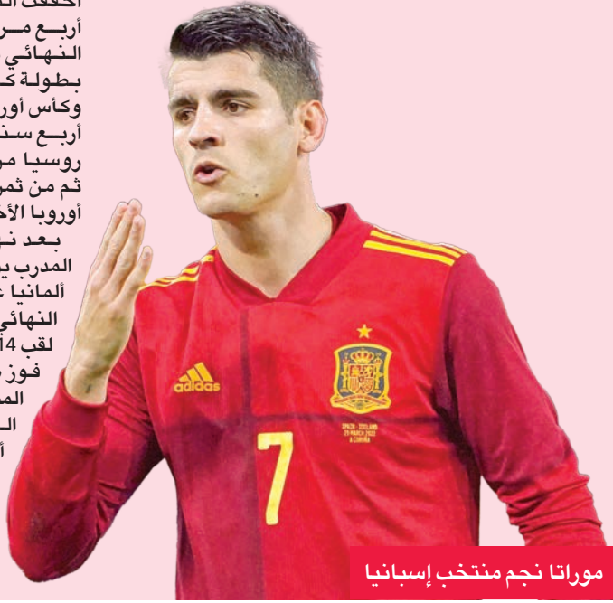
موراتا نجم منتخب إسبانيا

جهتها، لم تنجح اليابان في تخطي الدور الثاني في مشاركاتها الست بدءاً من مونديال 1998، وهي تعوّل على تاكومي مينامينو مهاجم موناكو الفرنسي ومدافع أرسنال الإنكليزي تاكههيرو تومياسو، بالإضافة إلى جناح ريال سوسيداد الإسباني تافيغوسا كويو ومدافع شالكه الألماني المخضرم مايا يوشيدا.