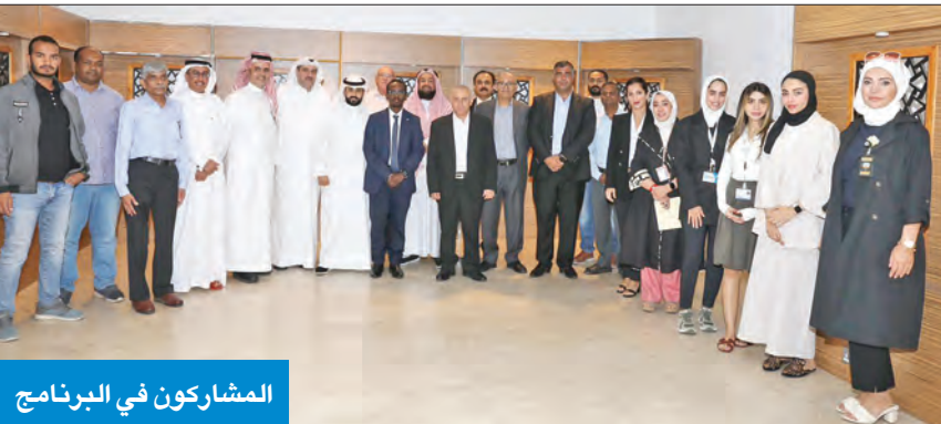
المشاركون في البرنامج

نتائج وتوصيات أحد المشاريع البحثية المهمة التي أنجزها المركز بنجاح بالتعاون مع الوكالة الدولية للطاقة الذرية. بدوره، أعرب المسؤول التقني في الوكالة، د. حامي سعيد، عن تقديره للجهود التي يبذلها معهد الأبحاث، مشيراً إلى أهمية التنسيق القائم بين الوكالة والمعهد لنقل المعارف والعلوم في شتى المجالات إلى الدول الإقليمية المجاورة.