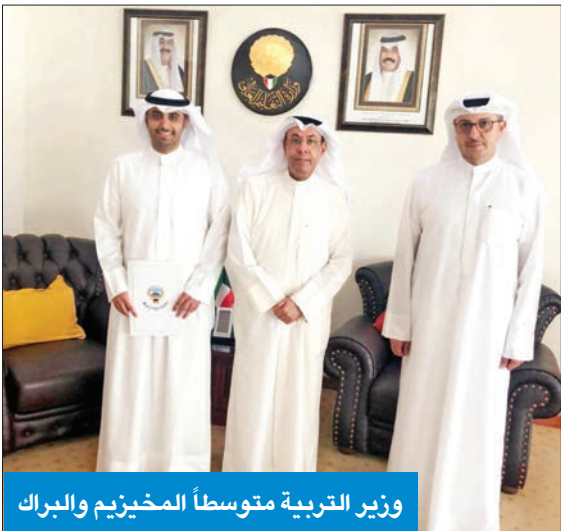
وزير التربية متوسطاً المخيزيم والبراك

الكثير من هذه القضايا إلى المربع الأول. وأضاف أن اللقاء اتسم بالمصداقية والشفافية، وأن الوزير وعد بأن العديد من القضايا ستجد طريقها للحل خلال الفترة المقبلة، خاصة وأن العهد الجديد يتميز بتعاون جهات الدولة المختلفة لحل جميع القضايا العالقة.