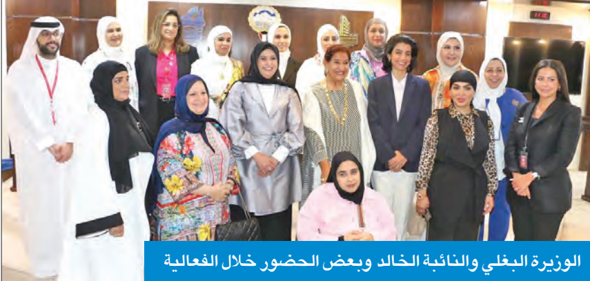
الوزيرة البغلي والنائبة الخالد وبعض الحضور خلال الفعالية

أمير البلاد وسمو ولي عهده الأمين، وستكتب بحروف من نور في سجلات التاريخ لسمو رئيس مجلس الوزراء وحكومة الكويت على تيسيرها مثل تلك المبادرات». وأضاف الشيخ أنه «عندما نضمن حقوق الأشخاص ذوي الإعاقة، فإننا نقرب عالمنا من التمسك بالقيم والمبادئ الأساسية لميثاق الأمم المتحدة، حيث صدقت 180 دولة عضوة على اتفاقية الأشخاص ذوي الإعاقة، وهناك نحو 15 في المئة من سكان العالم أو مليار شخص هم من الأشخاص ذوي الإعاقة، يعيش 80 في المئة من