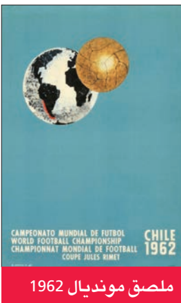
ملصق مونديال 1962