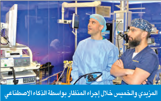
المزیدی والخمیس خلال إجراء المنظار بواسطة الذكاء الاصطناعي