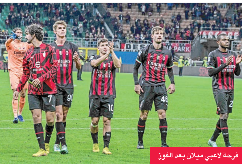
فرحة لاعبي ميلان بعد الفوز

خلق نابولي في الصدارة بفوزه الثمين على ضيفه أتالانتا 2-1، أمس الأول السبت، ضمن منافسات المرحلة الثالثة عشرة من الدوري الإيطالي لكرة القدم. وقلب النادي الجنوبي تأخره بهدف من النيجيري أديمولا لوكمان (19) من ركلة جزاء، إلى فوز بفضل مواطن الأخير فيكتور اوسيمين (23) والبلف الماس من مقدونيا الشمالية (35). وضرب نابولي المتصدر والوحيد الذي لم يخسر حتى الآن في «سيري أ» صفقورين بحجر واحد، فاستعاد نغمة الفوز بعد الخسارة أمام ليفريول الإنكليزي في دوري الأبطال، الثلاثاء، وابتعد بفارق 6 نقاط عن وصيفه الجديد ميلان (35 مقابل 29). وعاد ميلان إلى نغمة الانتصارات بعد خسارته أمام تورينو 2-1 في المرحلة الماضية بفوزه الصعب على سينيسيا 1-2. وبيدين «روسونيري» بفوزه إلى منقذه البديل المخضرم المهاجم الفرنسي أوليفييه جيرو، الذي سجل هدف الفوز في الدقيقة 89، بعدما افتتح التسجيل عبر قائده المدافع الفرنسي تيو هرنانديز (21).