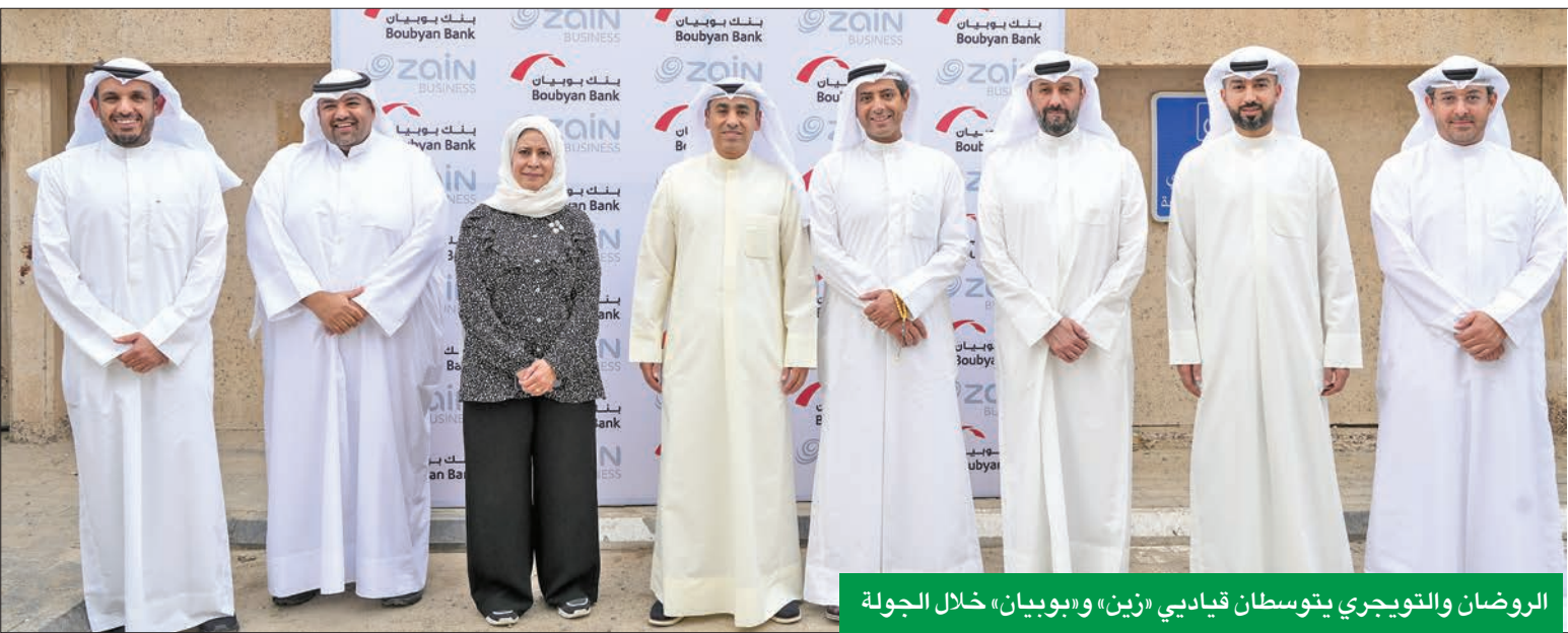
الروضان والتوجيهي يتوسطان قيادي «زين» و«بوبيان» خلال الجولة

بلا انقطاع وذات كفاءة عالية للعملاء. وتم تقسيم مركز زين ببناءً على مجموعة من الأسس والمعايير التي تشمل نوعية الخدمات التي يقدمها مركز البيانات، ومدى جاهزية وحداثة المعدات المستخدمة، وقلة المخاطر، وقلة إمكانية حدوث الأخطاء البشرية، والوقت المنخفض لتوقف النظام (downtime)، وكفاءة التشغيل، وغيرها من المعايير المعتمدة عالمياً. وبعكس حصول «زين» على مثل هذه الاعتمادات العالمية بجهودها في تطبيق سياسات وإجراءات فعالة في جميع عملياتها، والتأكد على أن أنظمتها وعملياتها مطابقة لأفضل المعايير المعتمدة عالمياً، فتطبيقها لهذه المعايير والالتزام الجاد بها يبرز مدى حرصها على تقديم الخدمات الأكثر كفاءة لقطاع الأعمال وتطويرها بالشكل الذي يتلاءم مع استراتيجيتها للتحول الرقمي.