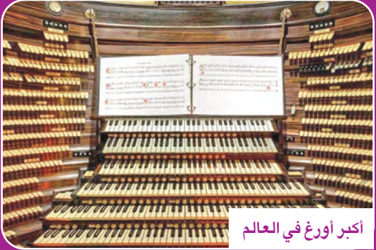
أكبر أورغ في العالم

تصدح معزوفة توكاتا وفوغو» الشهيرة لباخ، لتبهز زوايا احد مسارج آتلاتنتك سيتي الأمريكية. إذ أعيد إلى الحياة «أكبر أورغ في العالم، بنسبة 50 في المئة، حيث أن تكلفة إصلاحه 16 مليون دولار، جرى تأمين 5 ملايين منها.