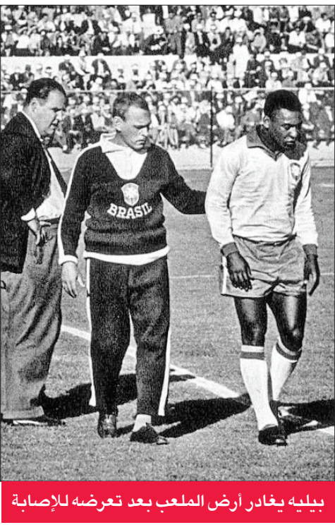
بيليه يغادر أرض الملعب بعد تعرضه للإصابة

دوره حاملا العيب الهجومي، فكان أكثر فاعلية واختراقاً بالإضافة لتسجيله أربعة أهداف بواقع ثنائيتين ضد إنكلترا (1-3) في ربع النهائي وتشيلي (2-4) في نصف النهائي. طرد نجم البطولة ضد تشيلي بعد تسجيل الثنائية، دفع رئيس وزراء البرازيل تانكيدو نيفيش إلى تقديم التماس للجنة تقييد تابعة لفيفا سمحت له خوض النهائي والتتويج. وكان «العصفور الصغير» مع موطنه فافا، أحد ستة لاعبين يسجلون أربعة أهداف ويتصدرون ترتيب الهافين. لكن غاريشا كان أقل لمعانا في النهائي ضد تشيكوسلوفاكيا، فاتحاً باب التسجيل لاماريلدو بديل بيليه، فأنتهى النهائي على سفوح جبال الأنديس برازيليا 3-1. حاول بيليه اللعب لكنه شعر بوجع رهيب في الكتف. ذهب للشاب أماريلدو وقال له «الله منحك موقفي، يجب أن تكون على قدر هذه الثقة». أما فافا، صاحب لقب «الصدر الفولاذي» (بيتو دل أسو) نظراً لصلابته البدنية، فكان الوحيد حتى الآن الذي يسجل في نهائين متتاليين، واحد أربعة لاعبين سجلوا في نهائين مع موطنه بيليه (1958 و 1970)، الألماني بول براينتر (1974 و 1982) والفرنسي زين الدين زيدان (1998 و 2006).