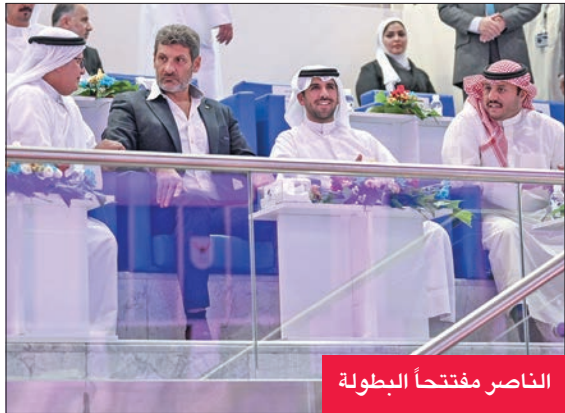
الناصر مفتتحاً البطولة

افتتح رئيس اللجنة الأولمبية الكويتية الشيخ فهد الناصر بطولة غرب آسيا للريشة الطائرة، التي تقام منافساتها على ملاعب اللجنة، بمشاركة منتخبات الكويت والسعودية والإمارات والبحرين وفلسطين والأردن والعراق وسورية ولبنان، وانطلقت فعاليات أمس (السبت)، وسط منافسة قوية بين جميع المنتخبات المشاركة. وحضر حفل الافتتاح نائب رئيس الاتحاد الدولي للعبة جاسم قانصو، ورئيس