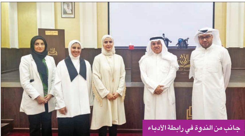
جانب من الندوة في رابطة الأدباء

وفيما يتعلق بإمكانية ترجمة الشعر، ذكرت المخيال: «لا أريد أن أكون حادة، لأن ما يتضمنه الشعر من عواطف