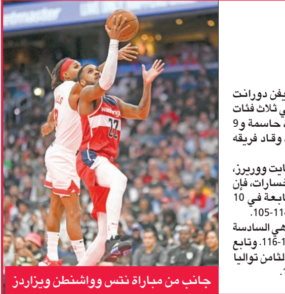
جانب من مباراة نتس وواشنطن ويزاردز

تخطى بروكلين نتس أزمة جدلية وتفق دون نجمه الموقوف كايري إيرفينغ على مضيفه واشنطن ويزاردز 128-86، أمس الأول الجمعة، في دوري كرة السلة الأميركي للمحترفين. وكان نتس أقال مدربه الكندي ستيف ناش الثلاثاء، وأوقف إيرفينغ 5 مباريات على الأقل الجمعة. بعد أسبوع من إثارته جدلا كبيرا عندما شارك منشورا على مواقع التواصل الاجتماعي، تضمن رابطا لفيلم تعرض لانتقادات بسبب معاداته للسامية. وبعد ساعات من إيقافه، اعترف إيرفينغ على «انستغرام»، لكن التبعات تواصلت الجمعة عندما أوقفت شركة نايكي للمستهلكات الرياضية تعاونها مع اللاعب، وألغت إطلاق حذاءه الجديد كايري 8.