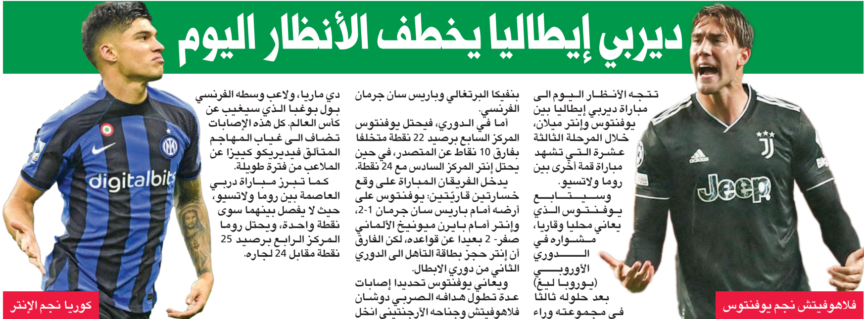
كوريا نجم الإنتر