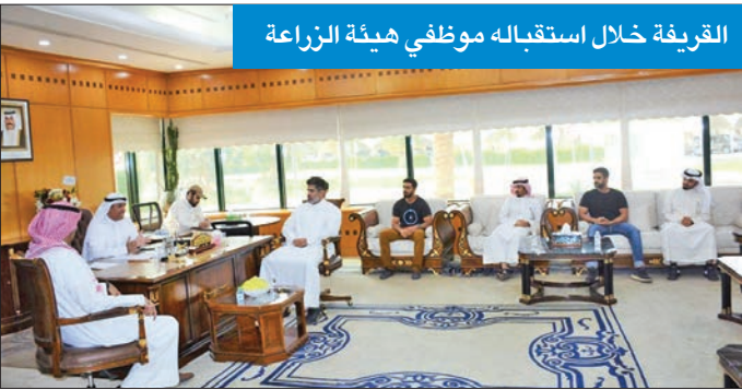
القريفة خلال استقباله موظفي هيئة الزراعة

والقرارات وتطبيق القانون على الجميع، داعياً إلى المزيد من الإنجاز وإنهاء حالة الركود التي تعيشها الهيئة إلى العمل كخلية نحل في جميع القطاعات الزراعية والتجميلية والحيوانية.