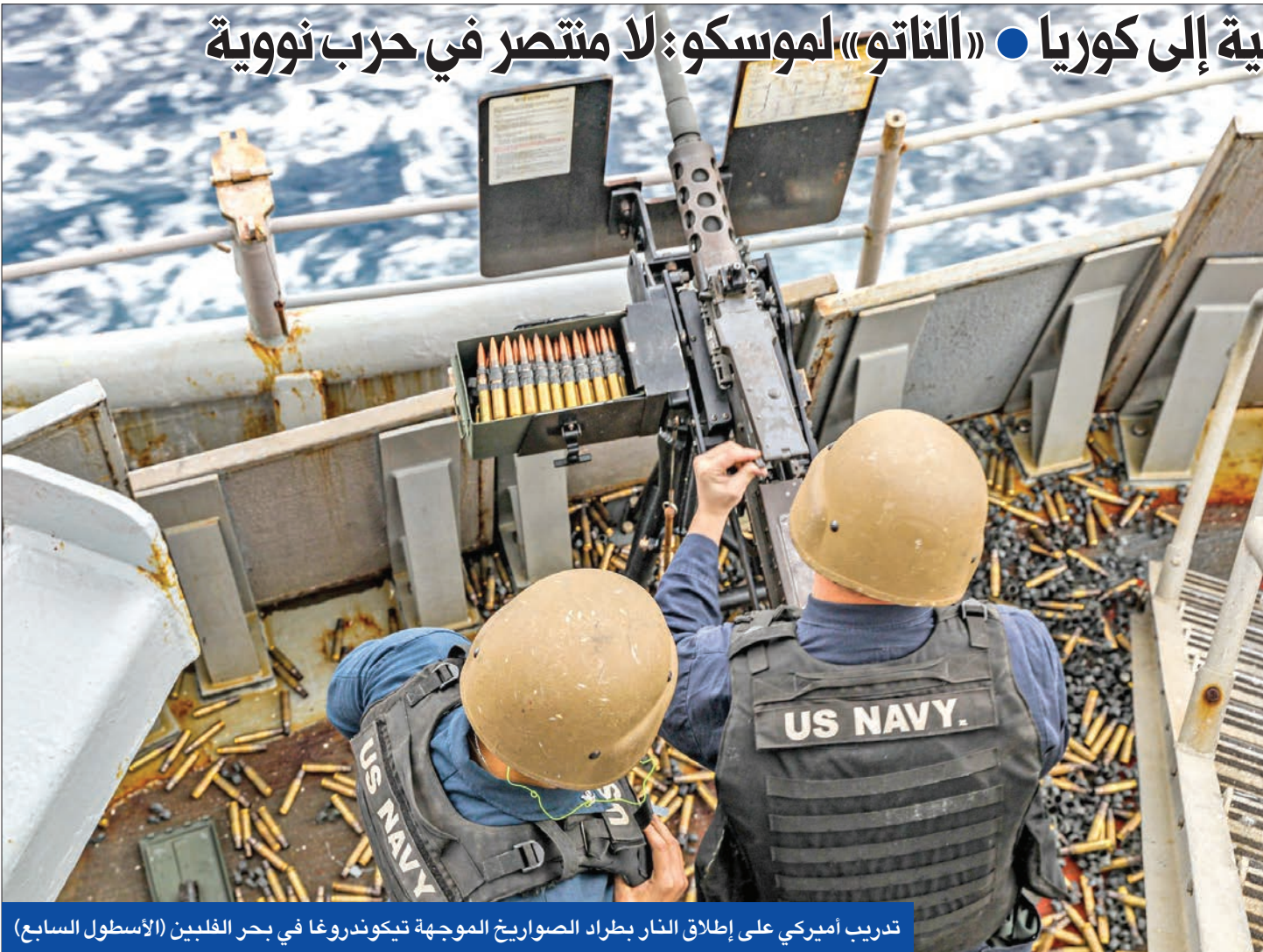
تدريب أميركي على إطلاق النار بطراد الصواريخ الموجهة تيكوندروغا في بحر الفلبين (الأسطول السابع)