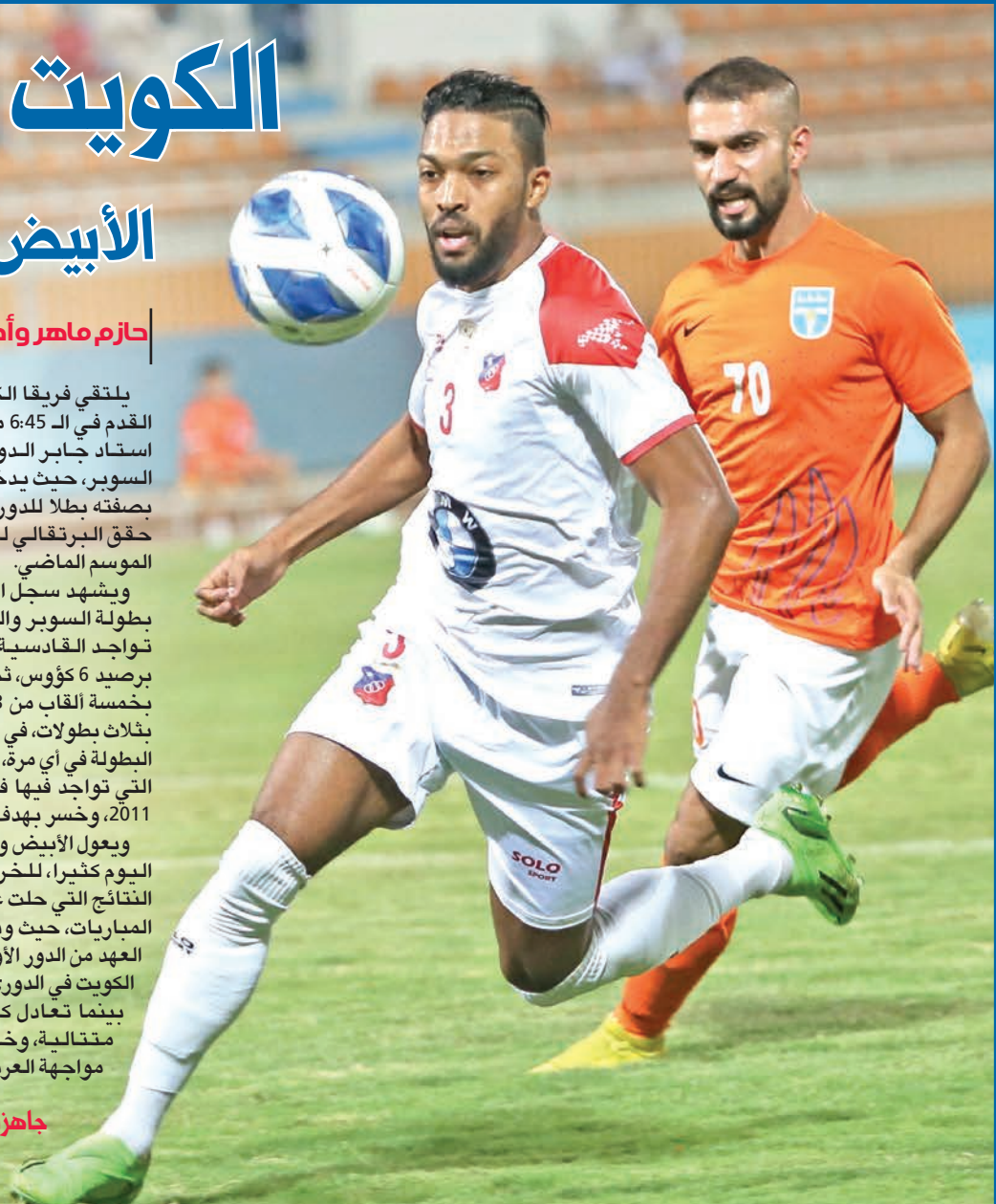
جانب من آخر لقاء بين الفريقين