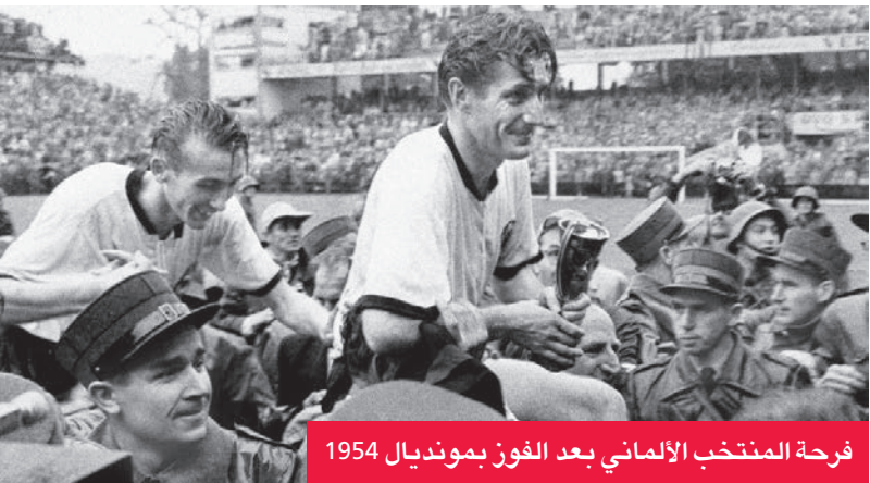
فرحة المنتخب الألماني بعد الفوز بمونديال 1954

تذكر أوتمار الذي تعافى في بريست، حيث هبط الأميركيون في ساحل النورماندي القريب «كان جسدي مليئاً بالشظايا»، وعاد في أواخر 1946، بعد عامين في معسكر أسرى الحرب.