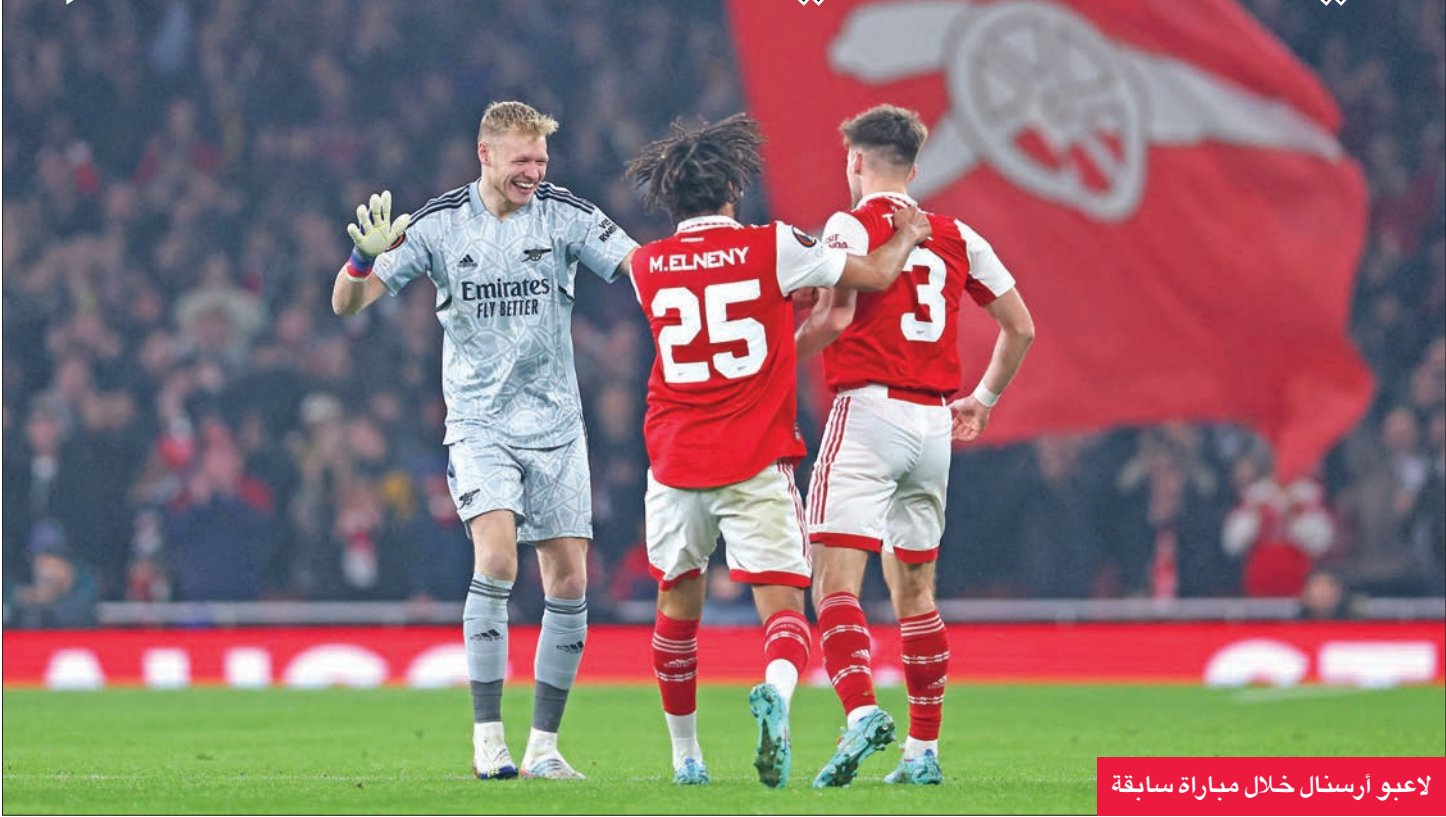
لاعبو أرسنال خلال مباراة سابقة

وكان إيمري الذي خاض تجربة الدوري الإنكليزي مع أرسنال، وقف حائلا ضد إحراز مانشستر يونايتد لقب الدوري الأوروبي (يوروبا ليغ) عام 2021، عندما قاد فريقه السابق فياريال للفوز عليه بركلات الترجيح. يذكر أن الفريقين سيلتقيان أيضا الخميس المقبل في كأس رابطة الأندية الإنكليزية على ملعب «اولد ترافورد».