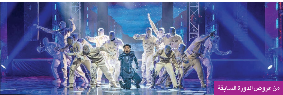
من عروض الدورة السابقة

يذكر أن الدورة الرابعة عشرة لمهرجان أيام الشباب المسرحي عدد جوائزها 13 جائزة والجائزة الكبرى ستحمل اسم فنانة كبيرة سيفصح عن اسمها في اجتماعات مسؤولي الهيئة المقبلة.