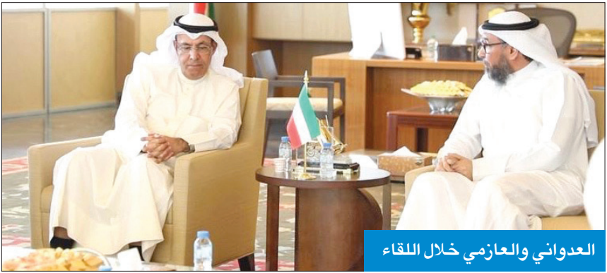
العدواني والغازمي خلال اللقاء

ناقش وزير التربية وزير التعليم والبحث العلمي، د. حمد العدواني، مع رئيس أعضاء جمعية المعلمين عدداً من الملفات التربوية المهمة التي تساهم في دعم المسيرة التعليمية في البلاد.