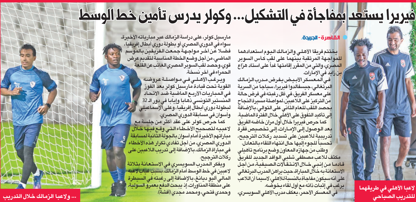
لاعبا الأهلي في طريقهما للتدريب الصباحي

يختتم فريقا الأهلي والزمالك اليوم استعدادهما للمواجهة المرتقبة بينهما على لقب كأس السوبر المصري، والتي من المقرر إقامتها غداً على استاد هزاع بن زايد في الإمارات.