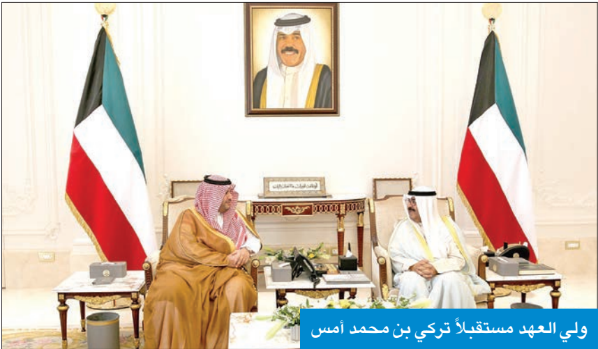
ولي العهد مستقبلاً تركي بن محمد أمس

في الديوان الأميري وديوان سمو ولي العهد. كما استقبل سمو ولي العهد، نائب رئيس مجلس الوزراء وزير النفط، بدر الملا. وأقر الصحة والعافية.