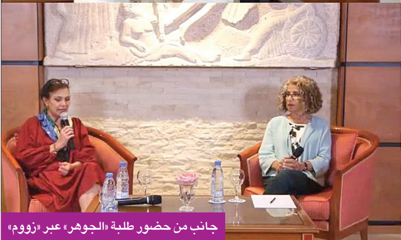
جانب من حضور طلبة «الجوهر» عبر «زووم»