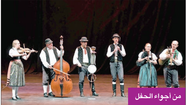
من أجواء الحفل

وفي تصريح للسفير التشيكي ياروسلاف سيرو، عبّر عن عمق العلاقات التشيكية- الكويتية، حيث بدأت منذ استقلال الكويت عام 1961،