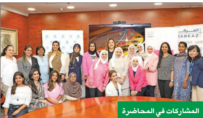
المشاركات في المحاضرة

وعاماً بعد عام، ندرك أهمية زيادة الوعي وتشجيع النساء من جميع الأعمار على تخصيص وقت اللازم لإجراء الفحص. ومن منطلق استفادتي من هذه المحاضرة التوعوية، فأبنتي أقدر الجهود المبذولة لإقامة هذه الفعالية.