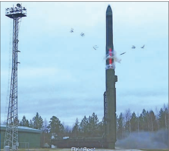
صور وزعتها وزارة الدفاع الروسية لجانب من المناورات الاستراتيجية

الرئيس الروسية تعد العدة «لأشهرس المعارك» في إقليم خيرسون الاستراتيجي في الجنوب. ومدينة خيرسون، عاصمة الإقليم التي تحمل اسمه والتي كان يسكنها قبل الحرب نحو 280 ألف نسمة، هي أكبر مركز حضري لاتزال روسيا تحتفظ به منذ الاستيلاء عليه في وقت مبكر من احتياح أوكرانيا قبل 8 أشهر. وتعمل السلطات التي عينتها روسيا على إجلاء السكان إلى الضفة الشرقية، وأكدت أمس، أن «أكثر من 70 ألف مدني غادروا منازلهم في خيرسون في أسبوع» من ناحيته، حذر وزير الدفاع الأوكراني، اليكسي ريزنيكوف، القوات الروسية، من أن جميع الممرات والجسور الواقعة على نهر دنيبرو باتت ضمن مدى صواريخ «هيمارس» والمدفعية الأوكرانية. وقال: «في حال تحول القتال إلى حرب شوارع، فلن تتمكن القوات الروسية من الانسحاب من خيرسون». ووفقاً لصحيفة «لوفغارو» الفرنسية، فإن كييف وموسكو في سياق مع الزمن قبل أن يعقد الشتاء العمليات العسكرية، إذ يمكن أن تصل درجات الحرارة إلى 30 تحت الصفر، ما يؤثر بشكل خطير على إمكانية المناورات. واعتبرت الصحيفة أن الشتاء «لن يضع حدا للقتال بل سيريد الأمور تعقيداً». وأشارت إلى أن «الجنرال الشتاء» تدخل 4 مرات عبر التاريخ لمصلحة روسيا، ضد المغول أولاً، ثم ضد السويديين والفرنسيين، وأخيراً ضد الألمان، إلا أنه عندما غزا الاتحاد السوفياتي فنلندا في شتاء 1939 - 1940، كان أفضل للبرد من الغزاة وعلى دراية بالتضاريس، حيث تشير التقديرات إلى أن الخسائر السوفيتية وصلت إلى 10 أضعاف الخسائر التي تكبدها الفنلنديون رغم أن فنلندا استسلمت في النهاية. (عواصم وكالات)