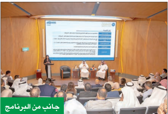
جانب من البرنامج

بعنوان «تطوير آلية المشاركة في الجمعيات العامة للشركات المدرجة»