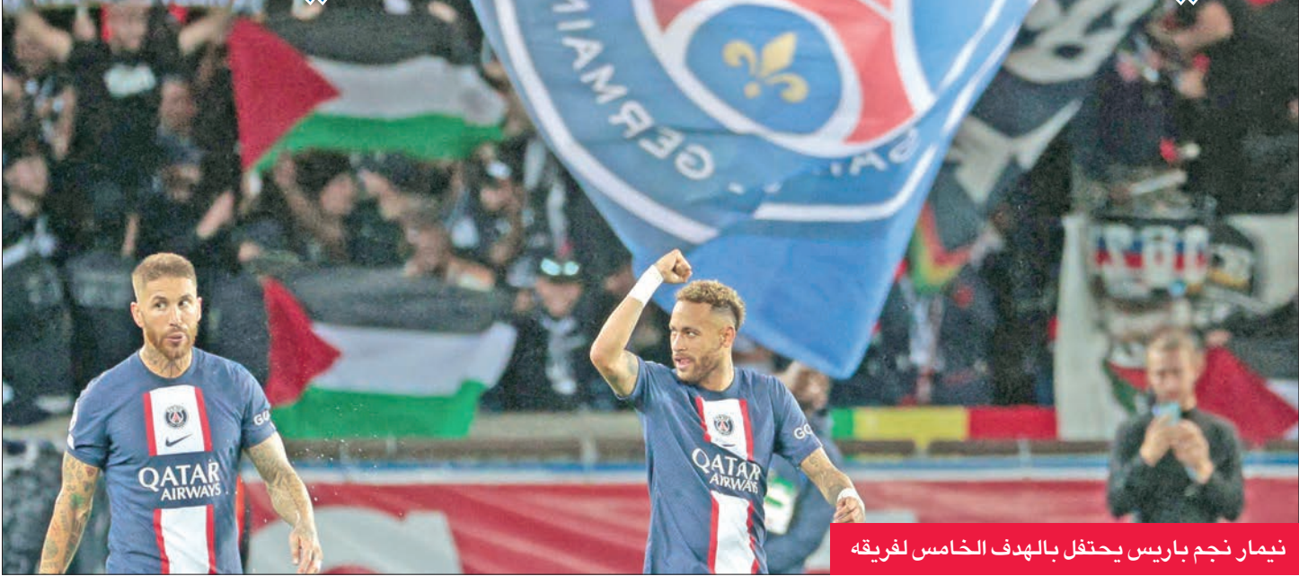
نيمار نجم باريس يحتفل بالهدف الخامس لفرقة

الكرة العالمية، وانتقل هذا الصيف إلى مانشستر سيتي. وبعد الاستراحة، سحب غوارديولا هالاند والبرتغالي جواو كانسيلو، ودفع بسيلفا والمدافع السويسري مانويل أكاني، وتحصل محرز على ركلة الجزاء بنفسه، إثر عرقلة من إيمري تشان، إلا أن الحارس السويسري غريغور كوبيل تصدى لمحاولة (58). هزيمة أولى لريال وفي المجموعة السادسة، أسقط لايبزيغ الألماني ضيفه ريال مدريد الإسباني حامل اللقب 3 - 2، معززاً آماله ببلوغ الدور ثمن النهائي. ورفع لايبزيغ رصيده إلى 9 نقاط بفارق نقطة عن النادي الملكي، الذي ضمن تأهله في