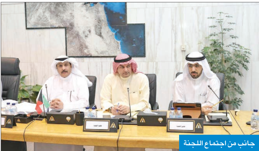
جانب من اجتماع اللجنة