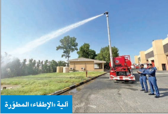
آلية «الإطفاء» المطوّرة