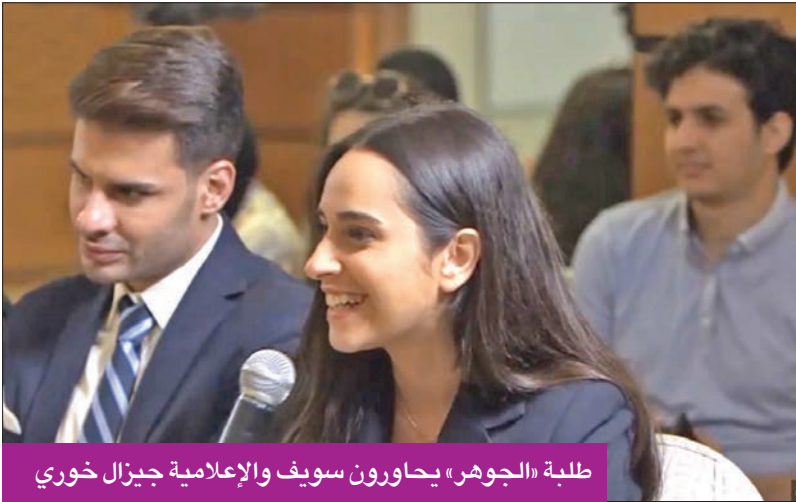
طلبة «الجوهر» يحاورون سوييف والإعلامية جيزال خوري

لنتفق أولاً على أنه لا وجود للعدالة في قضية الناشط السياسي علاء عبدالفتاح