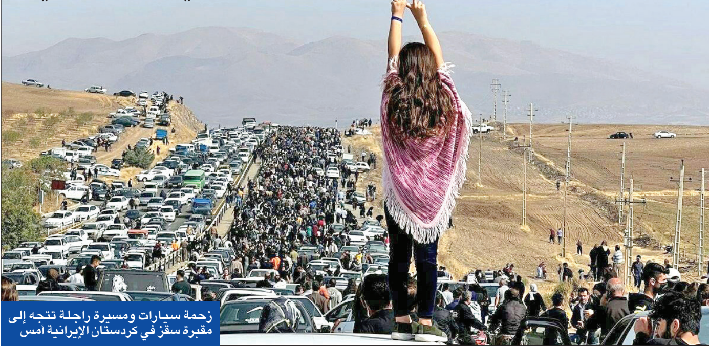
زحمة سيارات ومسيرة راحلة تتجه إلى مقبرة سقز في كردستان الإيرانية أمس

أن رئيسي نفسه رجل دين مناهض للغرب، ولا يؤمن بمجتمع أكثر حرية»، من جهة أخرى، ذكرت تقارير غربية، أن إدارة الرئيس الأميركي جو بايدن ستكشف عن عقوبات جديدة ضد مسؤولي إيران خلال الأيام المقبلة على خلفية قمع الاحتجاجات.