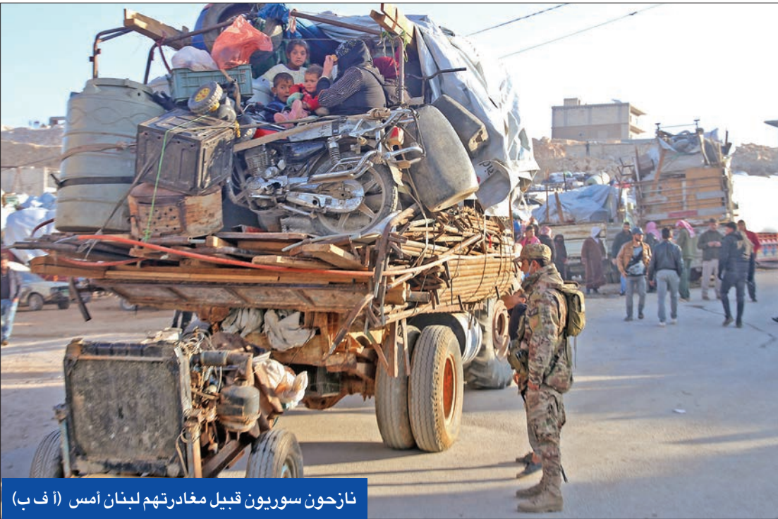
نازحون سوريون قبيل مغادرتهم لبنان أمس

العام للعودة الطوعية الى قراهم ومنزلهم». وأوضح أن «الأسبوع القادم سيشهد قافلة أخرى، ومستمررون بعملية عودة كل النازحين». إلى ذلك، وعشية التوقيع المرتقب للرئيس عون على اتفاقية ترسيم الحدود البحرية مع إسرائيل التي توسّطت فيها واشنطن، أفادت وكالة «رويترز»، بأن حكومة تصريف الأعمال برئاسة نجيب ميقاتي المكلف كذلك تشكيل حكومة جديدة، وافقت على الخنزال من 40 في المئة من حصّة «توتال ائريجي» في كونسورتيوم لاستكشاف الرقعة 9 في المياه البحرية اللبنانية إلى شركة «داجا 215»، المملوكة من شركة «توتال». وكشفت مصادر وزارة الطاقة لقناة «الجديد»، أن حصّة «نوفاتك» الروسية، والتي تبلغ 20 في المئة من حصّة كونسورتيوم استكشاف الرقعة 9، انت إلى لبنان الذي حولها بشكل مؤقت