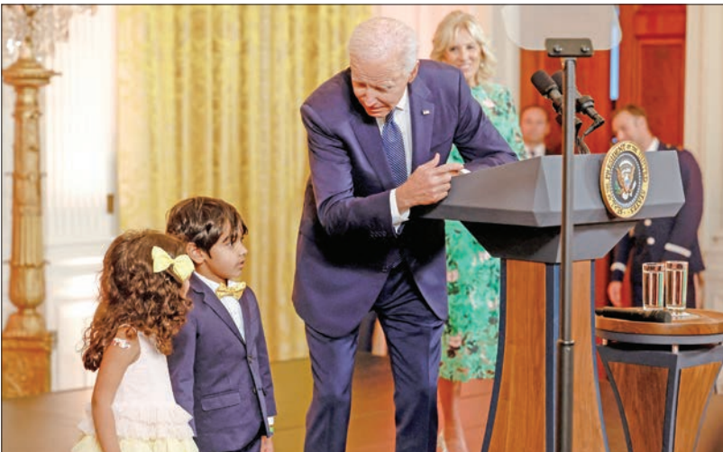
بايدن وزوجته مع طفلين من أصول هندية خلال احتفال بعيد «ديوالي» في البيت الأبيض

وتشهد أيضاً ولايات أريزونا وأوهايو ونيفادا ويسكونسين ونورث كارولينا منافسات شديدة، حيث يناقش المرشحون الديموقراطيون جميعهم مساعدين لدونالد ترامب.