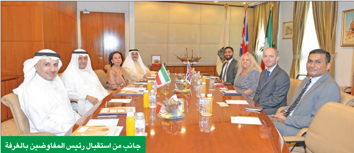
جانب من استقبال رئيس المفاوضين بالغرفة

رئيس المفاوضين أكد خلال استقباله أن الاتفاقية ستفتح آفاقاً جديدة في شتى المجالات