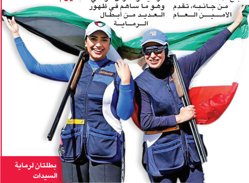
بطلتان لرماية السيدات

التدريبات الرسمية لمسابقتي السكيت والتراب للسيدات تنطلق صباح اليوم