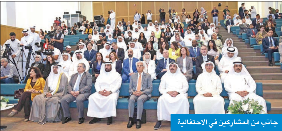
جانب من المشاركين في الاحتفالية

وفيما يخص آخر مستجدات الانتقال إلى بقية المباني، سواء من الكليات أو الإدارة الجامعية في «الشادية»، قال الرومي، إن «الانتقال سيكون في أقرب وقت ممكن حتى تستمر العملية التعليمية، ولن يكون خلال الفصل الدراسي، نظرا لاستمرار الطلبة وأعضاء هيئة التدريس في دراستهم وأعمالهم»، موضحا أن