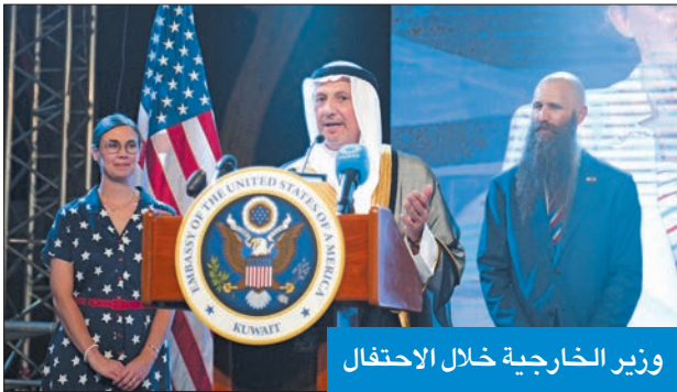
وزير الخارجية خلال الاحتفال

وأضاف: خلال الأوامر القليلة التي قضيتها في الكويت كانت الكويت حليفاً مذهباً، فعندما تعرضت