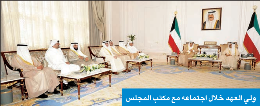
ولي العهد خلال اجتماعه مع مكتب المجلس

شعيب الموبيزري، ورئيس لجنة الأولويات عبدالله فهاد، والأمين العام لمجلس التشريعية والقانونية مهند السابر، ورئيس لجنة الشؤون المالية والاقتصادية