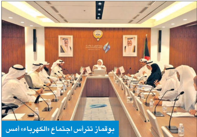
بوقمان تترأس اجتماع «الكهرباء» أمس

وشددت على ضرورة استمرار الإنجاز وتطوير العمل داخل قطاعات الوزارة، لمواصلة مسيرة الإصلاح والإنجاز ودفع عجلة التنمية في البلاد، وحثت جميع