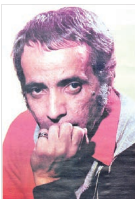
الملحن بليغ حمدي

والفيلم الذي لا يرتبط بالحياة، والمعرض الذي لا يرتبط بالحياة، هذا كله لا يعني شيئا للناس وهذا من حقهم، شيء لا يهمني ولا يخصني، لماذا أذهب وأستمع لشخص يقف كالطاووس وراء الميكروفون! الأفضل الذهاب للفرج على طاووس حقيقي إذا!