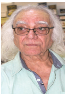
الفنان كوكب حمزة