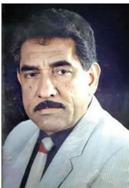
الملحن محمد جواد أموري

● إلقاء الشعر بلا عود أفضل لا سيما أن الذين يحبون سماع الشعر وحده يقولون إن صوتي الجمهوري يساعدني ويكفي.