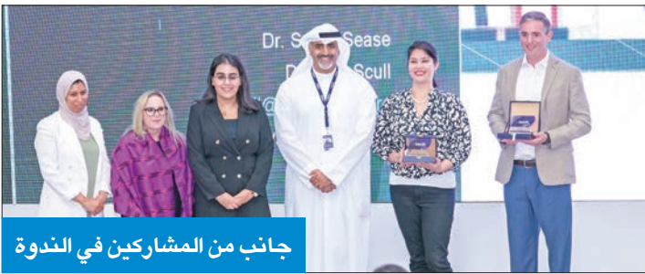
جانب من المشاركين في الندوة

دعم الشراكة مع ktech، إذ تواصل الكلية تعزيز خدماتها لطلاب التعليم العالي، وخاصة في مجال الصحة العقلية، وتنتقل إلى العمل معاً في هذه القضية المهمة، من خلال فرص التبادل الأكاديمي والمهني.