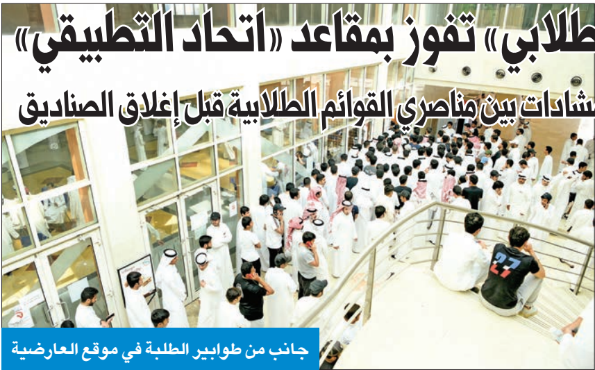
جانب من طوابير الطلبة في موقع العارضية