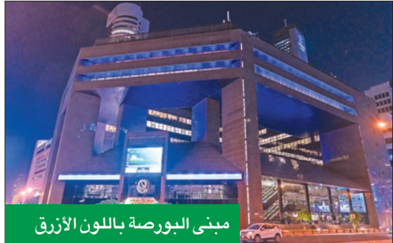
مبنى البورصة باللون الأزرق

منظمات الأمم المتحدة، مثل برنامج الأمم المتحدة الإنمائي، وبرنامج الأمم المتحدة للمرأة، والمفوضية السامية لشؤون اللاجئين، وبرنامج الأمم المتحدة للبيئة». وأضاف السنغوسي: «كما تشجع البورصة الأعمال التطوعية التي تخدم البيئة والمجتمع وتحرص على تبنيها، وتقوم بالشراكة مع برنامج الأمم المتحدة الإنمائي بتنظيم الورش التدريبية للشركات المدرجة ضمن