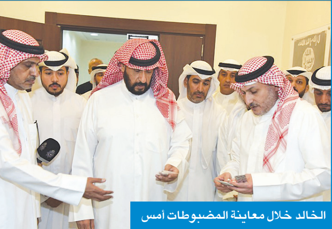
الخالد خلال معاينة المضبوطات أمس

وأعرب الخالد عن شكره وتقديره لرجال الإدارة العامة لمكافحة المخدرات على جهودهم المخلصة في التصدي بكل قوة وحزم لتجارب المواد المخدرة، مشيدا بقدرة رجال الأمن على التصدي لكل أساليب ترويج المواد المخدرة وتوجيه ضربات المستمرة لتجار المخدرات. ووفق بيان لوزارة الداخلية، فإن المخدرات ضبطت مع شخصين بحوزتهما نحو مليون قرص لاريكا و4 كيلوغرامات من المخدرات و386 زجاجة خمر، وكمية من أقراص الكيتاغون ومبالغ مالية حصيلة البيع.