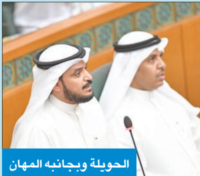
الحويلة وبجانبه المهان

المدينة الطبية في مدينة صباح الاحمد السكنية وتكليف وزارة الصحة بتجهيزها لتقديم الرعاية الصحية لسكان المدينة والمناطق الجنوبية لتعطي دافعا إيجابيا لخدمة أهالي المناطق الجنوبية، حيث إن أهالي المدن الجنوبية بأهم الحاجة لملئ هذه الخدمات المستحقة لهم بسبب معاناتهم من البعد عن المستشفيات والأزحام الذي يشهده مستشفى العبدان الذي يخدم محافظتي الأحدي ومبارك الكبير، وكذلك قلة التخصصات بالمراكز الطبية. وأضاف: ما الإجراءات التي اتخذتها وزارة الصحة للبدء في إنشاء وتجهيز مشروع المدينة الطبية في مدينة صباح الاحمد السكنية منذ صدور القرار حتى تاريخ ورود هذا السؤال؟ وما الموعد المحدد لتنفيذ هذا المشروع وبيان المراحل حتى تاريخ ورود هذا السؤال؟ وما الطاقة الاستيعابية المقدرة لهذا المشروع؟