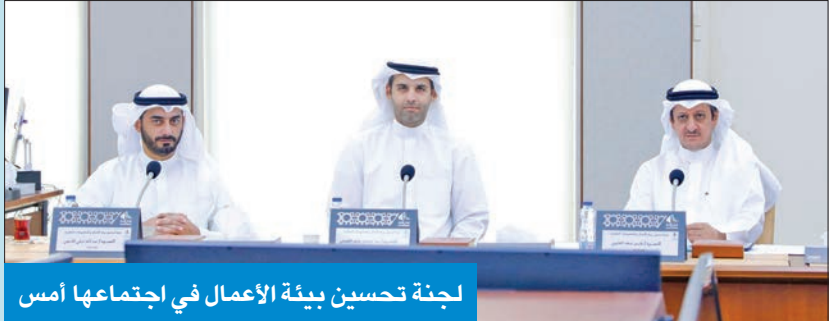
لجنة تحسين بيئة الأعمال في اجتماعها أمس

الصادق، مؤكداً أن سياسة التمكين ستكون سائدة على جميع القوانين التي تتعلّق بهذه المشاريع، لكون أصحاب المشاريع الصغيرة والمتوسطة يحتاجون إلى التمكين أكثر من موضوع التمويل الذي لن يتوقف وسيبقى على استمراريته. وبين أن اللجنة قررت أيضاً دعوة جمعيات النفع العام والمجاميع التطوعية المعنية لإيصال أفكارهم ونقل الهموم التي يعيشون بها يومياً، لافتاً إلى أن جدول أعمال اللجنة سيضم كل القوانين ذات الصلة، بعد أن تأخذ دورتها المستندية، وأن هذه اللجنة أسست حديثاً لأنه في المجلس الماضي لم تكن اللجنة مشكلة. وأضاف: «نحن مضطرون إلى إعادة بناء هذه اللجنة من جديد وإعادة مناقشة القوانين التي تخص المشروعات الصغيرة والمتوسطة».