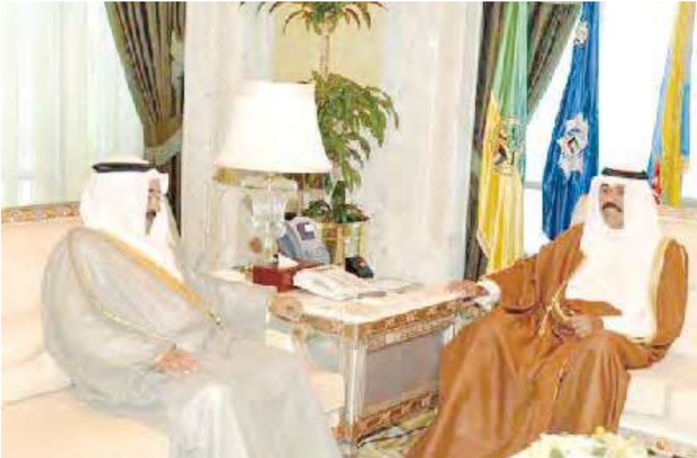
نائب الأمير مستقبلاً سالم الجابر

استقبل سمو نائب الأمير وولي العهد الشيخ نواف الأحمد ديوانه بقصر السيف صباح أمس سفير مملكة هولندا لدى دولة الكويت الدكتور كورنلس فان هوك، وذلك بمناسبة انتهاء مهام عمله كسفير معتمد لبلاد.