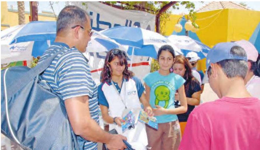
أثناء توزيع مستلزمات السباحة