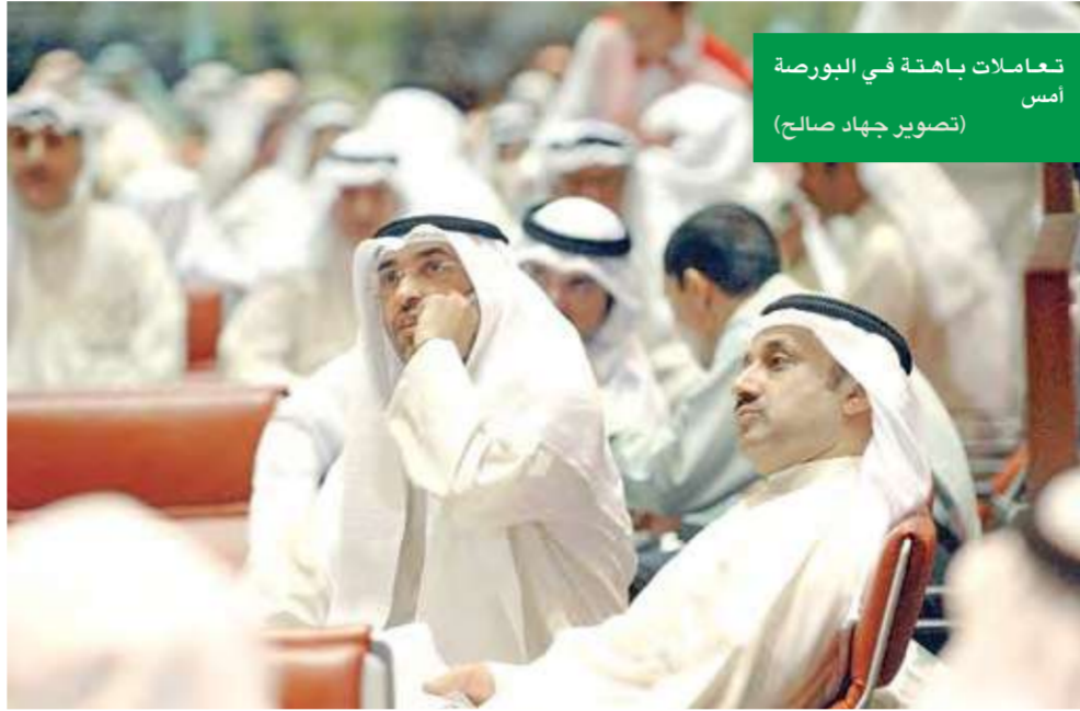
تعاملات باهتة في البورصة أمس

يبدو أن المؤشر لم يعر الأرباح النصفية بالا، إذ هبط إلى مستوى 14971,1 نقطة أمس، كما تراجع «الوزني» 3,98 نقاط ليقل عند مستوى 749,90 نقطة، مع تراجع مؤشرات القيمة والكمية بشكل ملحوظ.