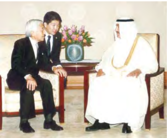
ناصر المحمد خلال لقائه امبراطور اليابان

البلدين، كما استقبل سموه رئيس شركة تويوتا - تشو فورو تاوا. كما عقد سمو الشيخ ناصر لقاء مع رئيس مجلس ادارة الجمعية الكويتية اليابانية كياتشي كوناغا، اذ اتفقا على الحاجة لرفع مستوى العلاقات الثنائية إلى اعلى المستويات.