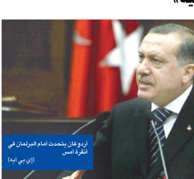
أردوغان يتحدث أمام البرلمان في أنقرة أمس

أكدت دراسة نُشرت أمس، أنه يتعين على الولايات المتحدة تغيير استراتيجيتها لمحاربة تنظيم «القاعدة»، من خلال الاعتماد أقل من ذلك على الجيش، وأكثر على الأجهزة الشرطية والاستخبارات. وأوصت الدراسة التي أجرتها مؤسسة «رائد كوربوريشن»، وهي مركز أبحاث مهم يعمل غالباً لمصلحة الجيش الأميركي، الولايات المتحدة بالتخلي عن مقولة «الحرب على الإرهاب»، وأوضح سيث جونز، كبير المشاركين في الدراسة، أنه «ينبغي اعتبار الإرهابيين مجرمين»، وأضاف: «تحليلنا يظهر أنه لا يوجد أي حل للإرهاب في ساحة المعركة».