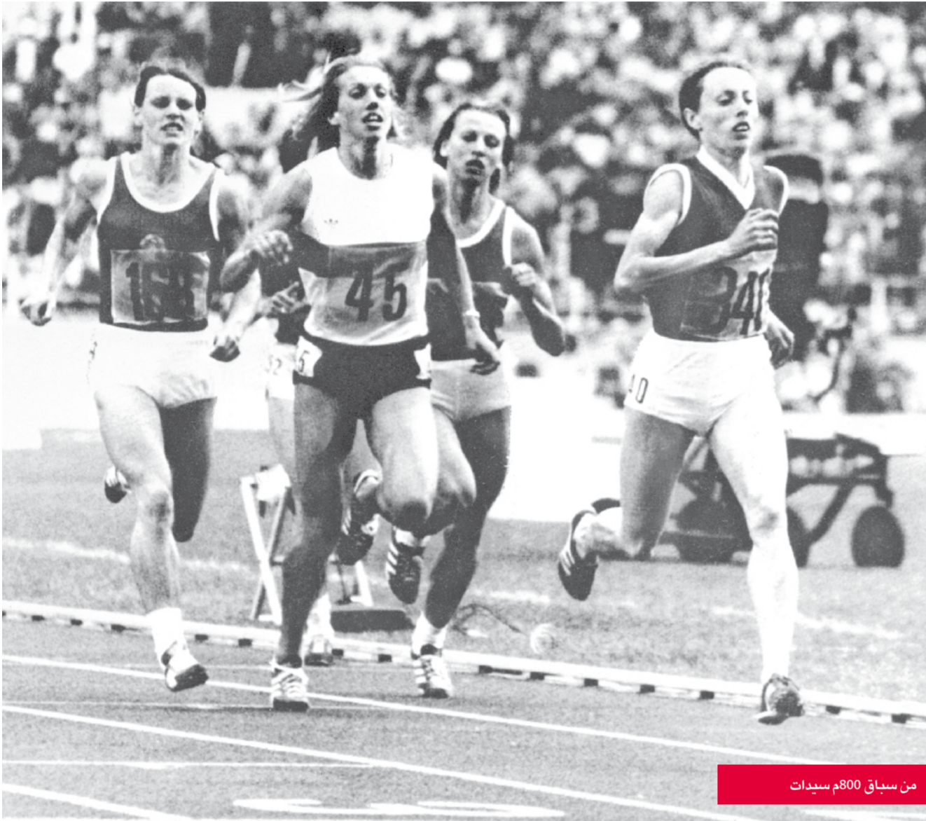
من سباق 800م سيدات

لاونيتشينكو على إنارة جهاز تسجيل النقاط من دون أن يمسه الممارز السوفييتي، فقرر الحكام فحص سلاحه واكتشفوا الجهاز الإضافي، واستبعدوا «البطل الأولمبي» ومنتخب بلاده، وأوقف لاحقاً مدى الحياة من قبل اللجنة الأولمبية الدولية، وفرضت عليه عقوبات شديدة.