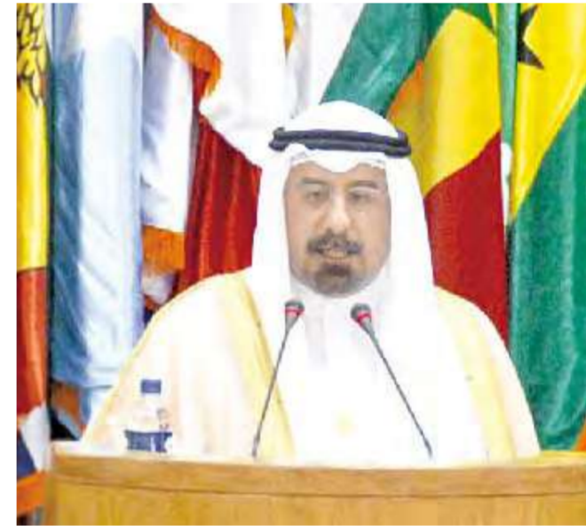
محمد الصباح يلقي كلمة الكويت في مؤتمر عدم الانحياز