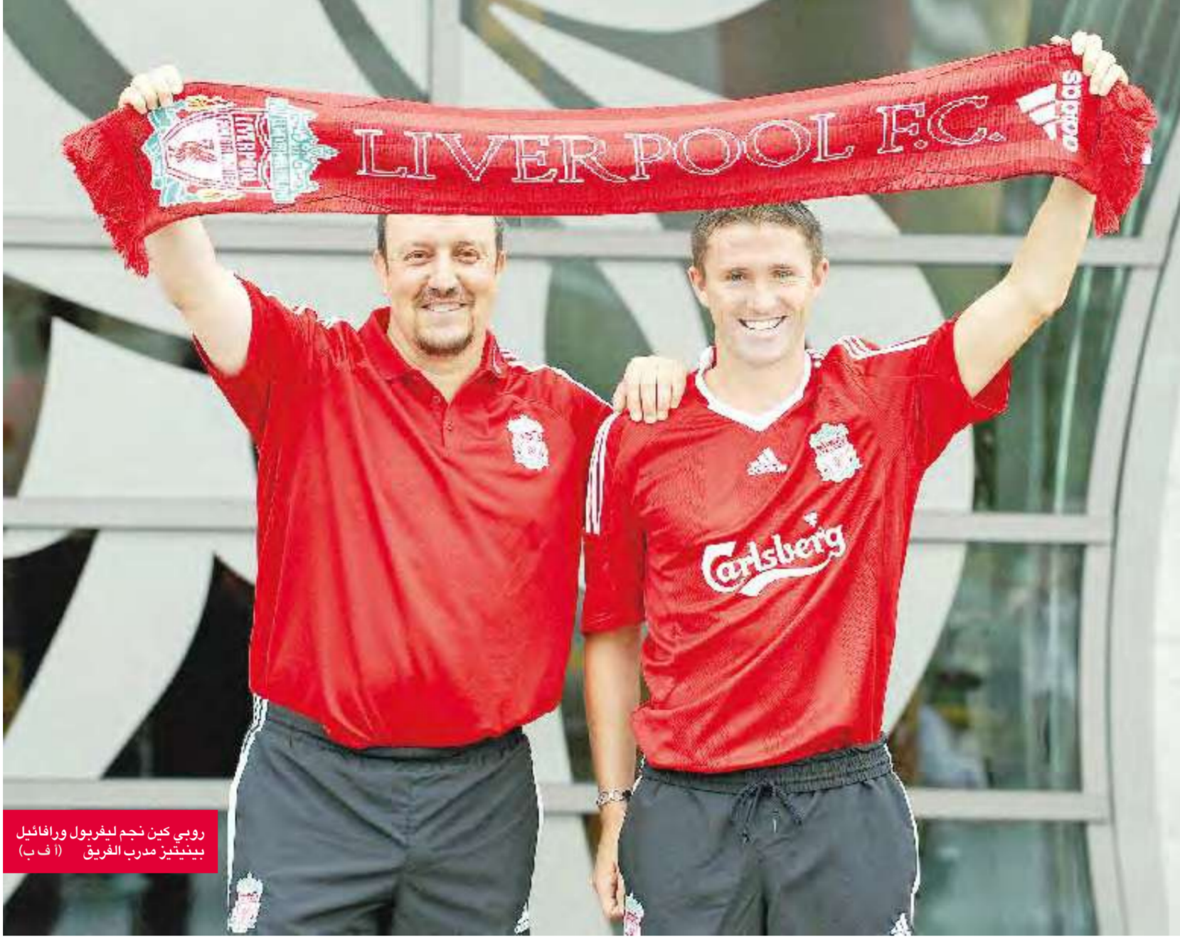
روبي كين نجم ليفربول ورافائيل بينيتيز مدرب الفريق

كان كين (28 عاما) الذي قدم موسما مميزا مع توتنهام (15