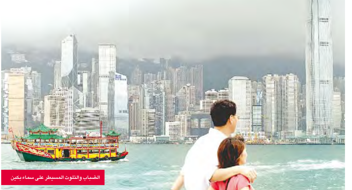
الضباب والتلوث الميسيطر على سماء بكين