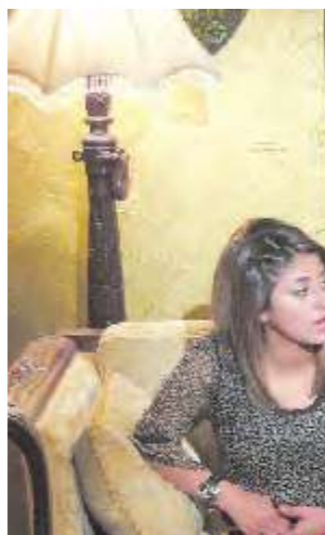
مشهد من «فضة قلبها ابيض»

إعداد وتقديم د. طارق سويدان، يتناول أحداثاً تاريخية لها الأثر الكبير في تغيير مجرى التاريخ باعتبارها نقطة بداية لعهد جديد كان للمسلمين فيه دور كبير. «هنا وقف الحبيب»