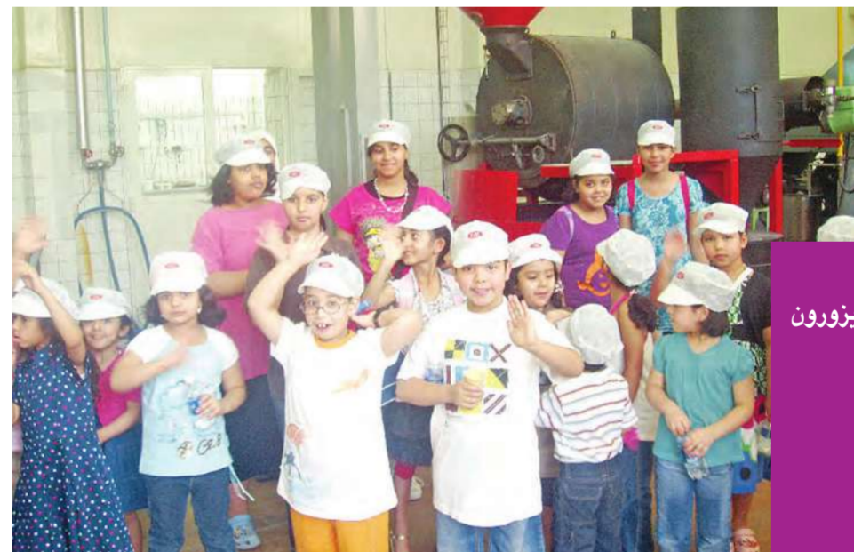
الأطفال أثناء زيارة مصنع الأيس كريم

نظمت إدارة نادي «عالمي الممتع» زيارة لمصنع الأيس كريم التابع لشركة كي دي دي، وذلك للتعرف على كيفية صناعة هذه المنتجات، ومشاهدة المصنع على الطبيعة، وخلال الرحلة اطلع الأطفال على مراحل صناعة الأيس كريم، وتم تقديم العديد من منتجات المصنع من الأيس كريم للأطفال، مما زاد من فرحتهم واستمتاعهم بزيارة أحد المصانع الوطنية، وتعتبر هذه الزيارة ضمن الفعاليات الصيفية المتعددة لنادي «عالمي الممتع» خلال الصيف.