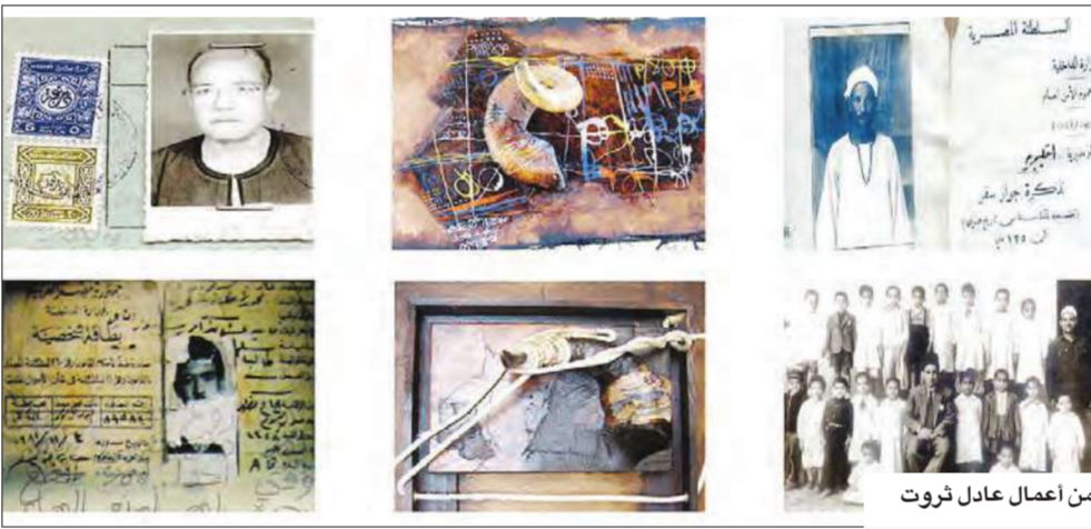
من أعمال عادل ثروت