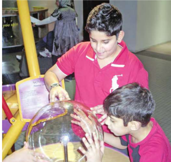
استكشاف الحركة البلازمية

نظمت الجمعية الكويتية لحماية البيئة رحلة إلى قاعة الاستكشاف في المركز العلمي لأطفال النادي، وذلك ضمن فعاليات فكرة «تدوير النفايات» وكيفية إعادة الاستفادة منها مرة أخرى. وفي أثناء وجودهم داخل القاعة حضر الأطفال عدة عروض ثقافية منها «رحلة في أعماق الأرض» للتعرف على طبقات الأرض، وعرض لفيلم وثائقي بعنوان «قطرة قطيرة» لترشيد استخدام الماء، كما قضى الأطفال يوماً ممتعاً في الاستكشاف وتجربة الأفكار العلمية المرحبة والمنتشرة داخل أركان القاعة.