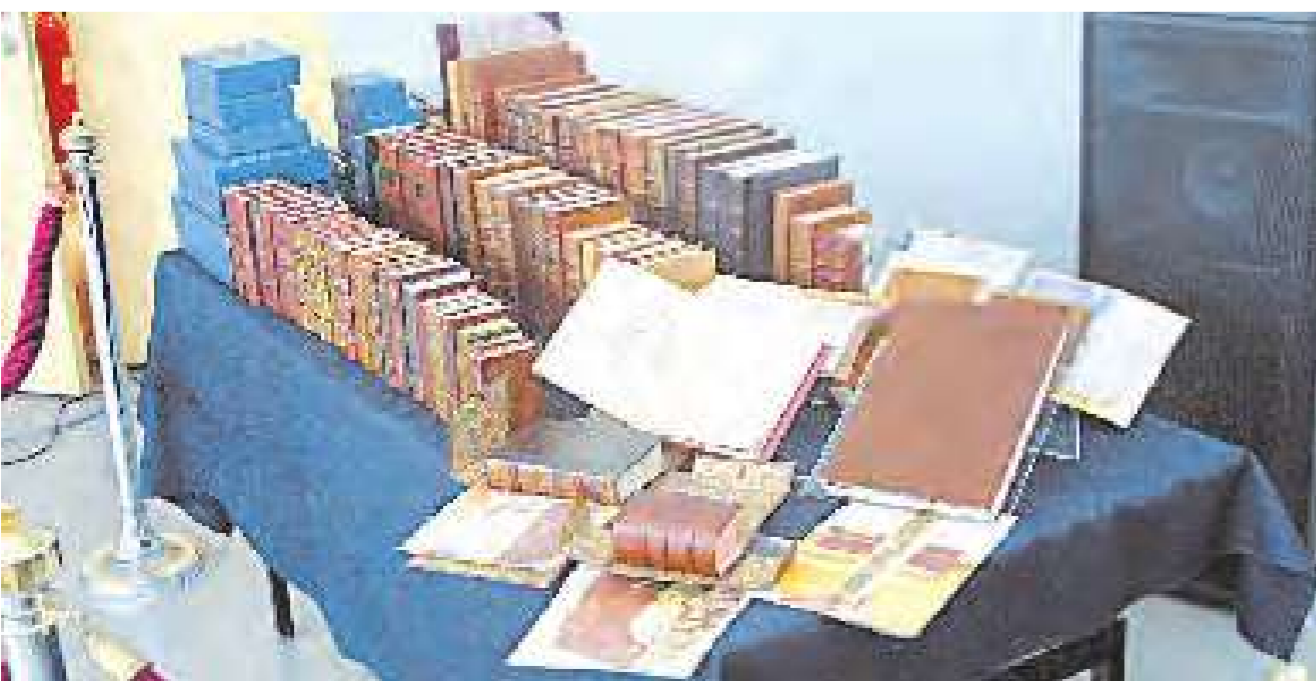
من أعمال عادل ثروت

يتابع د. زيدان: «يكفي أن تلقى نظرة سريعة على نماذج من هذه المجموعة المرممة، لتعرف أهميتها البالغة لها من بينها: كتاب عن ملحمة الحروب اليونانية الثانية، بعد أقدم كتب المجموعة صدر عام 1512 في باريس، وآخر عن معجم وفهرس لأعلام الكتاب المقدس بمعهد القديم والجديد، وآخر بعنوان «تاريخ الحبشة» كتبه المستشرق الألماني الكبير هيو بلودولف وهو الأكبر في الدراسات الحبشية إبان القرن السابع عشر، عرف عن مؤلفه أنه كان يجيد ما يقرب من 25 لغة قديمة وحديثة، ويعد «تاريخ الحبشة» أشهر أعماله وأهمها، تضم هذه الطبيعة نص الكتاب كاملاً بالشروح والإضافات