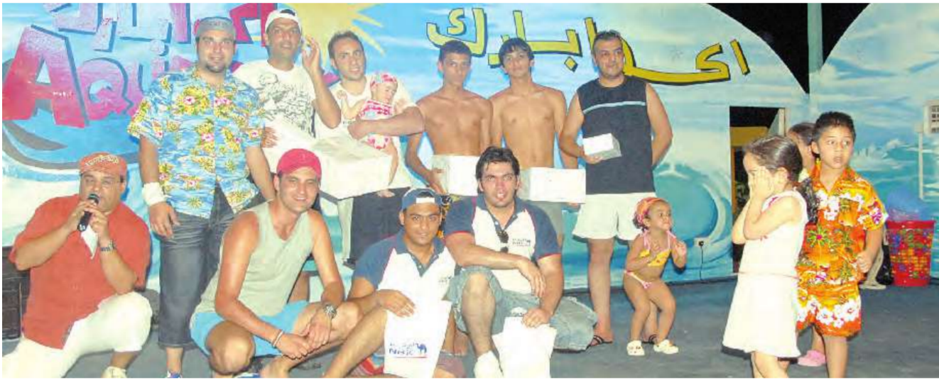
جانب من إحدى المسابقات