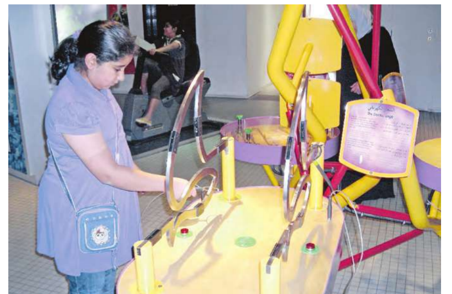
التوازن العصبي على الشعار الكهربائي