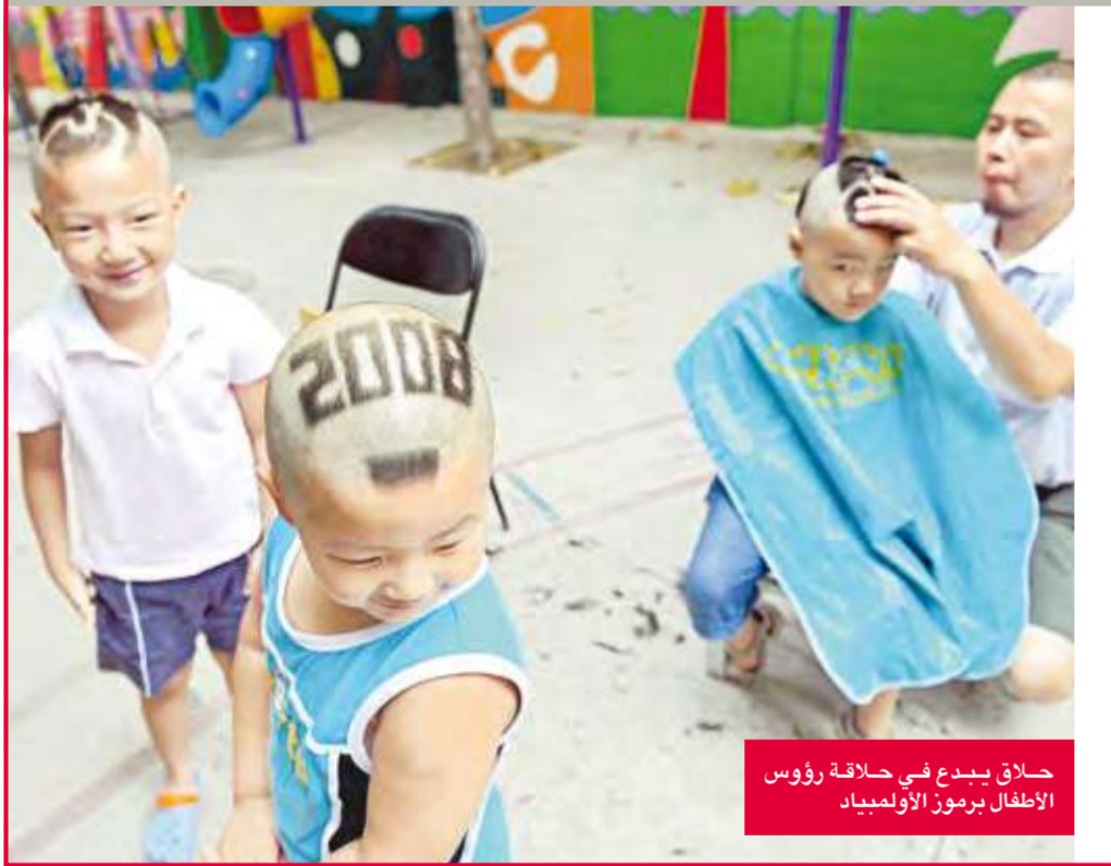
حلاق يبدع في حلاقة رؤوس الأطفال بمرور الأولمبياد

ذكرت مصادر إعلامية أن بولندا أنفقت رقما قياسيا 274 مليون زولتي (134 مليون دولار) في إطار التحضير لدورة الألعاب الأولمبية التي تستضيفها بكين هذا العام، وهو مبلغ يعادل تقريبا ما أنفقته على التحضير لدورتين أولمبيتين سابقتين. وأضافت صحيفة رزيكزبوسوليتا أن اللجنة الأولمبية البولندية ستمنح ستة ملايين زولتي إضافية للاعبين الفائزين بميداليات في الدورة. وأشارت الصحيفة إلى أن حجم المبلغ المنفق (على هذه الدورة) يرجع إلى الدرس القاسي الذي تلقته بولندا في دورة أثينا عام 2004، بعد أن أهملت بولندا الإنفاق على الرياضة وخرجت من الدورة بأقل عدد من الميداليات منذ عقود. كما سترسل بولندا هذا العام عددا قياسيا من اللاعبين 261 لاعبا للمشاركة في دورة بكين، وهو أكبر عدد ترسله منذ ما يقرب من ثلاثين عاما.