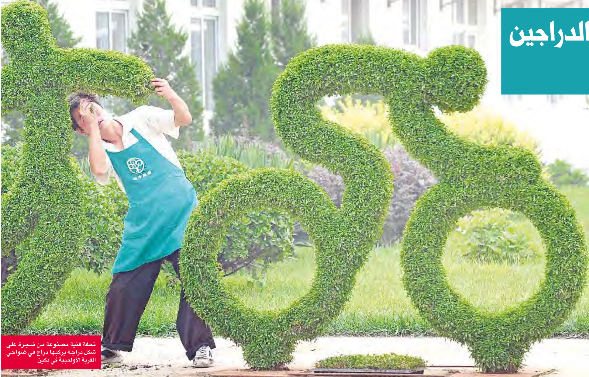
تحفة فنية مصنوعة من شجرة على شكل دراجة تركيها دراج في ضواحي القرية الأولمبية في بكين