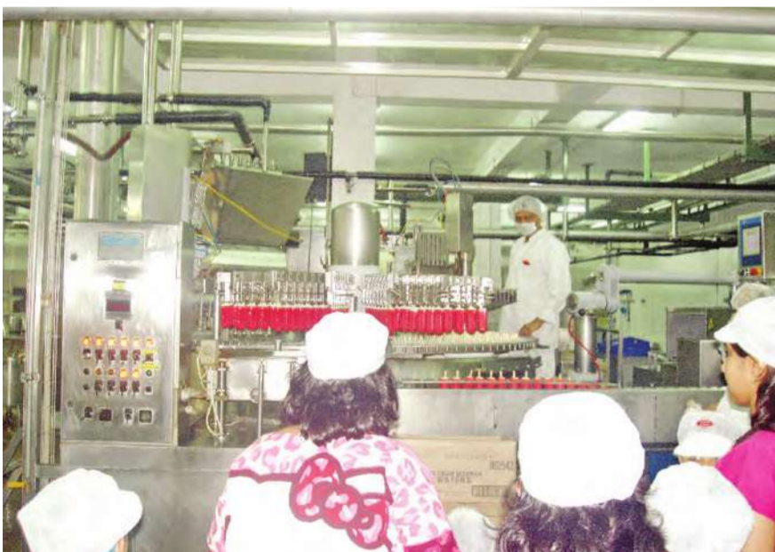
الأطفال خلال اطلاعهم على كيفية سريان العمل في المصنع

نظمت إدارة نادي «عالمي الممتع» زيارة لمصنع الأيس كريم التابع لشركة كي دي دي، وذلك للتعرف على كيفية صناعة هذه المنتجات، ومشاهدة المصنع على الطبيعة، وخلال الرحلة اطلع الأطفال على مراحل صناعة الأيس كريم، وتم تقديم العديد من منتجات المصنع من الأيس كريم للأطفال، مما زاد من فرحتهم واستمتاعهم بزيارة أحد المصانع الوطنية، وتعتبر هذه الزيارة ضمن الفعاليات الصيفية المتعددة لنادي «عالمي الممتع» خلال الصيف.