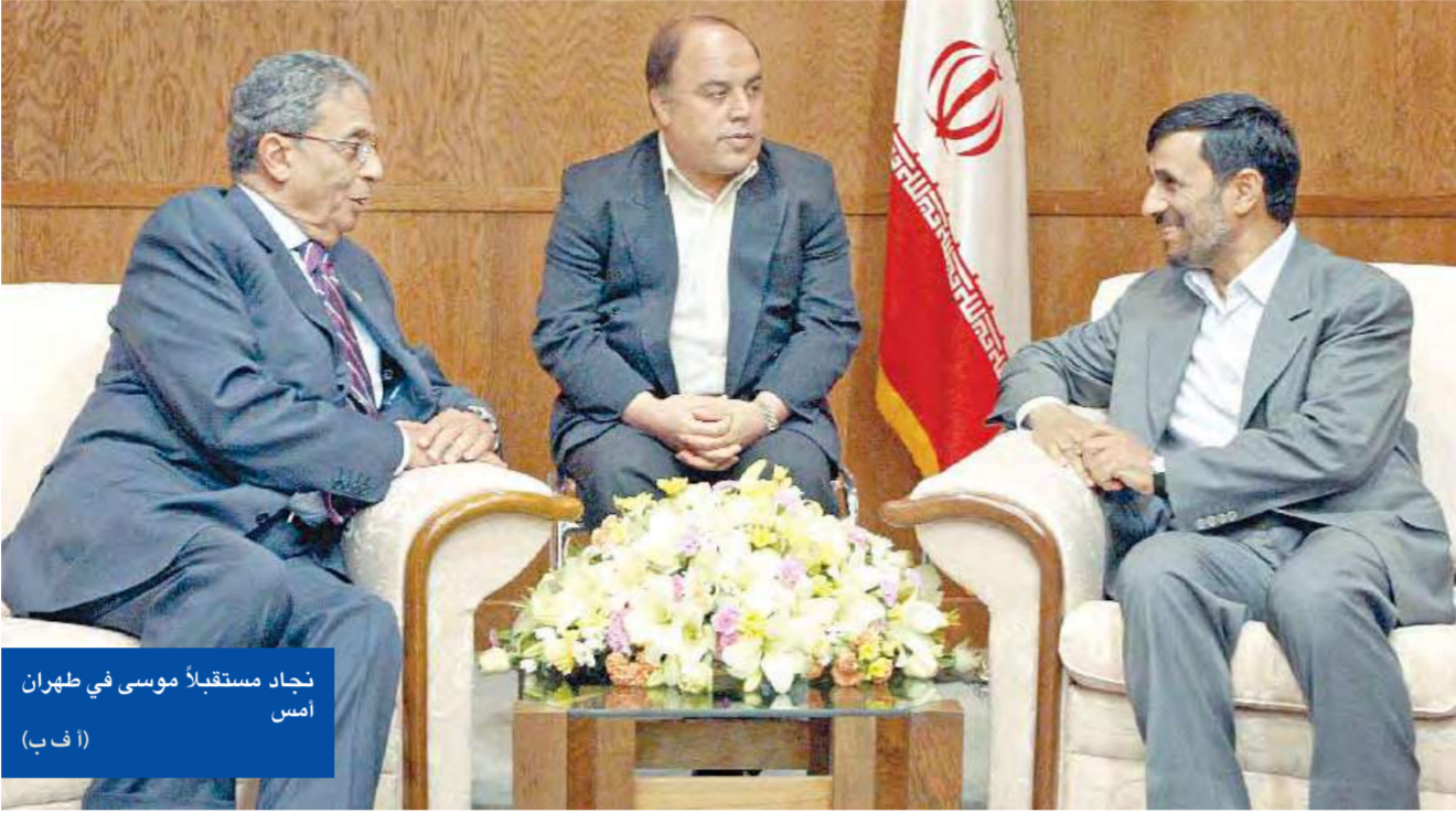
نجداد مستقبلاً موسى في طهران أمس (أ ب)

استغلت إيران استضافتها لمؤتمر دول عدم الانحياز أمس، للدفاع عن ملفها النووي المثير للجدل، في مواجهة الدول الكبرى، بينما حث الرئيس الإيراني على إنشاء اتحاد الدول النامية لمواجهة الأمم المتحدة «المتحيزة».