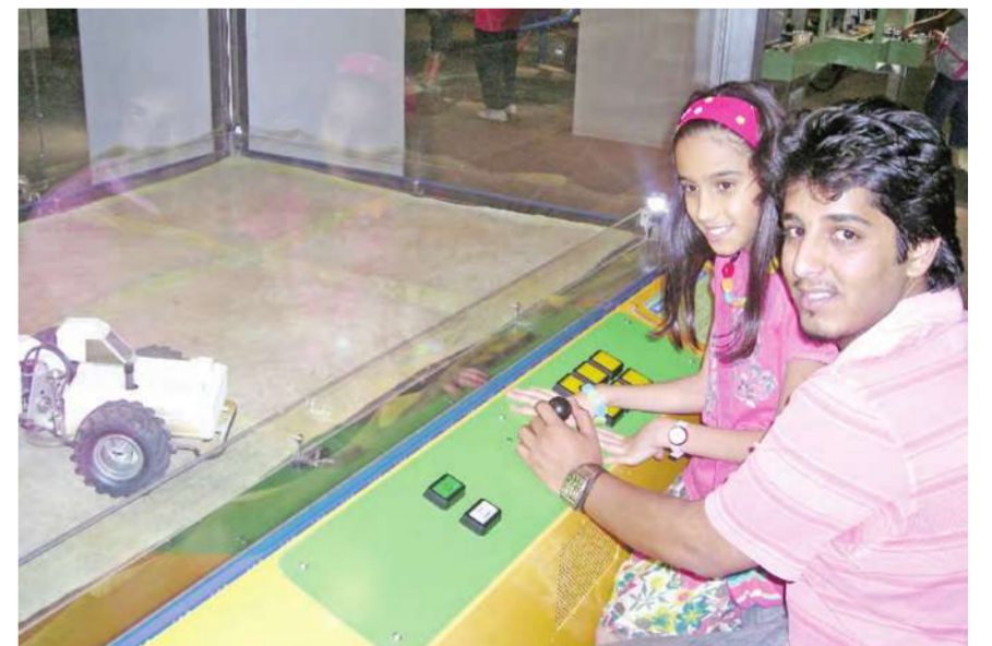
في ركن السيارات الكهربائية