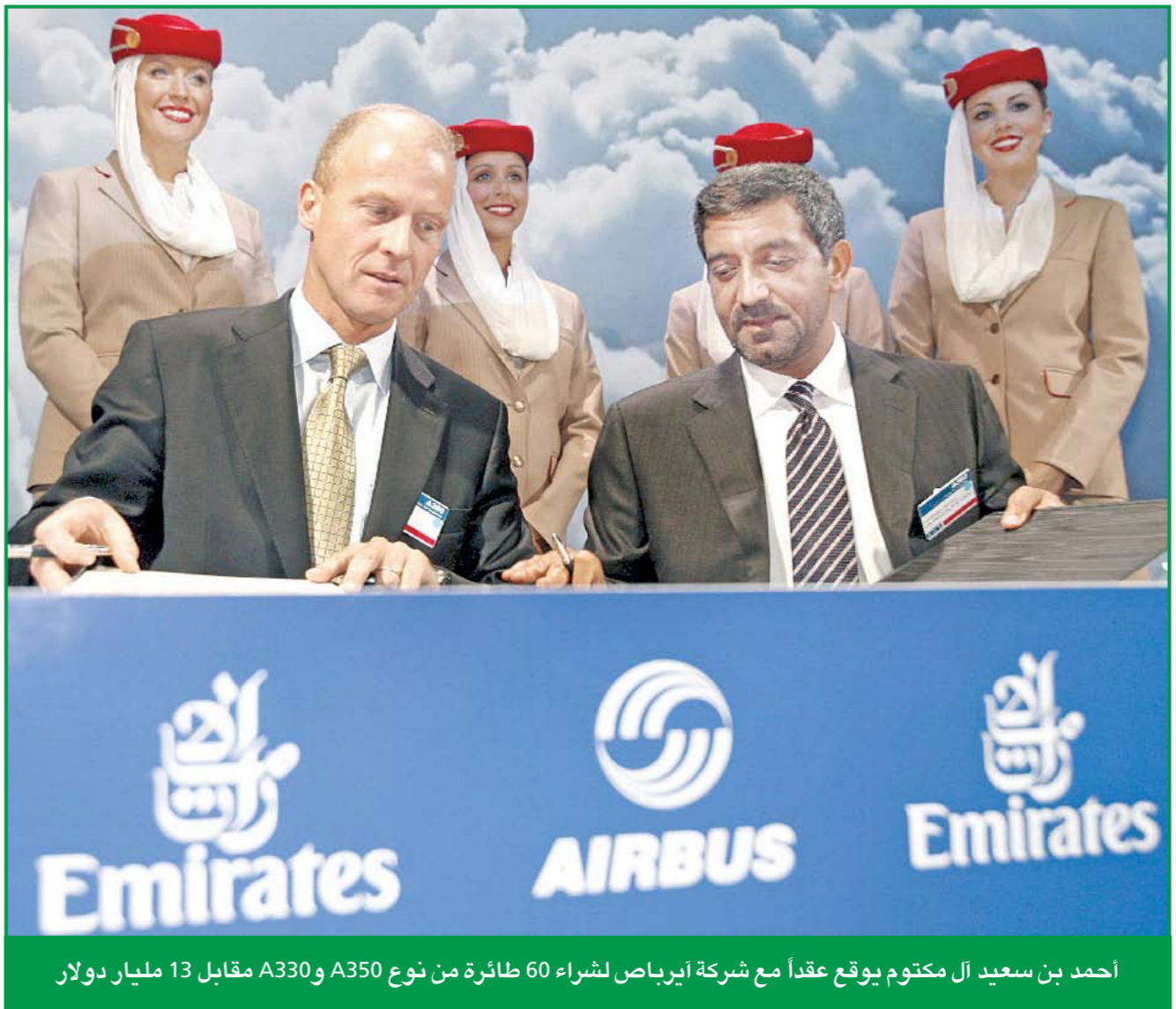
أحمد بن سعيد آل مكتوم يوقع عقداً مع شركة إيرباص لشراء 60 طائرة من نوع A350 وA330 مقابل 13 مليار دولار

وقال ميتشيل إن النسبة المتخفية والتي تتراوح بين 25 و30 في المئة تعود إلى ضعف الدولار الأميركي وارتفاع تكاليف الأسمدة والنقل.