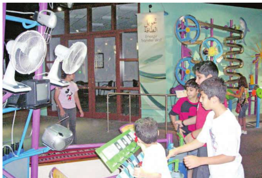
استمتاع الأطفال بتجربة الدائرة الكهربائية وتشغيلها