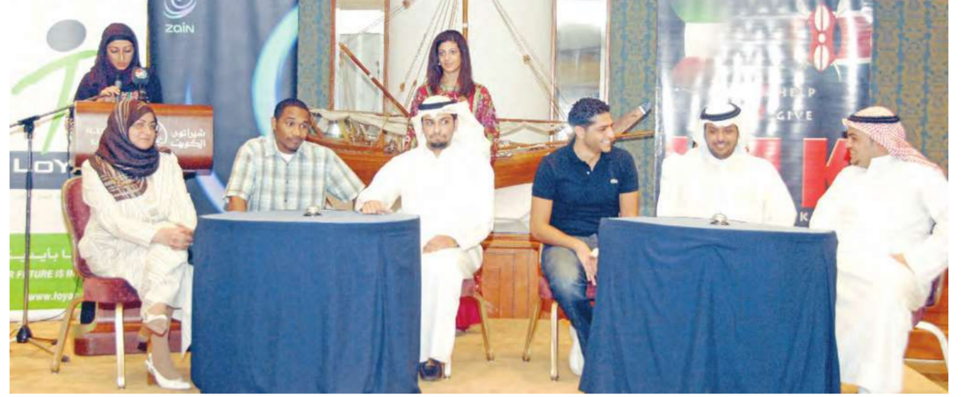
فريقا كويت وكينيا يتنافسان في المسابقة الثقافية