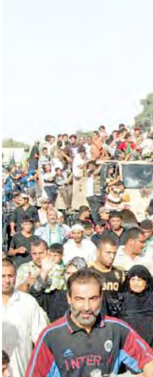
عراقيون في طريق العودة من زيارة الإمام الخاتم في بغداد أمس

بغداد أمس، في بيان مشترك لمسفير ريان كروكر وقائد القوة متعددة الجنسيات في العراق الجنرال ديفيد بترايوس، الهجمات الإرهابية الانتحارية التي وقعت في بغداد وكركوك أمس الأول.