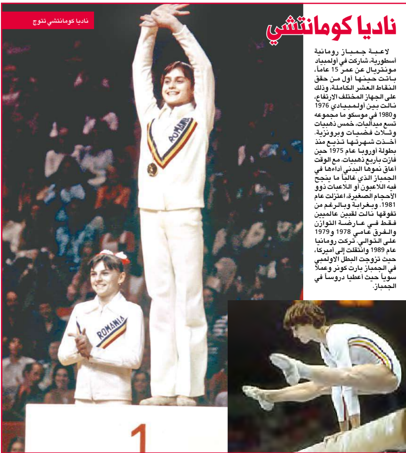
ناديا كوماننتشي تنوج