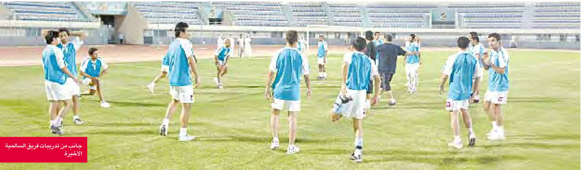
جانب من تدريبات فريق السالمية الأخيرة