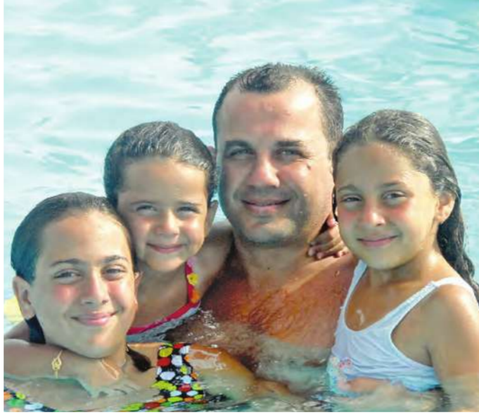
لقطة لعائلة مستمتعة ببرودة المياه

أقيم اليوم المفتوح الخاص بموظفي بنك الكويت الوطني وعائلاتهم في الأكوا بارك، وقد شارك في فعاليات هذا اليوم عدد من قيادات وموظفي البنك من مختلف إداراته وفروعه بصحبة عائلاتهم. وقد استمتع الحضور بأجواء المسابقات الترفيهية والرياضية المسلية والسحوبات القيمة التي قدمت حول أحواض السباحة بمشاركة الموظفين وأسرتهم، بالإضافة إلى الفعاليات الأخرى المستمرة طوال اليوم والتي تضمنت ملعب الماء والصابون، وأنغاماً موسيقية، والكرة الطائرة والكثير من المسابقات في جو بهيج سادته روح الأسرة الواحدة.