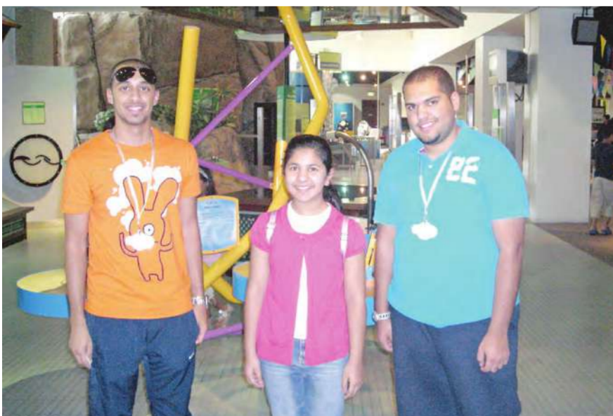
لقطة تذكارية داخل قاعة الاستكشاف