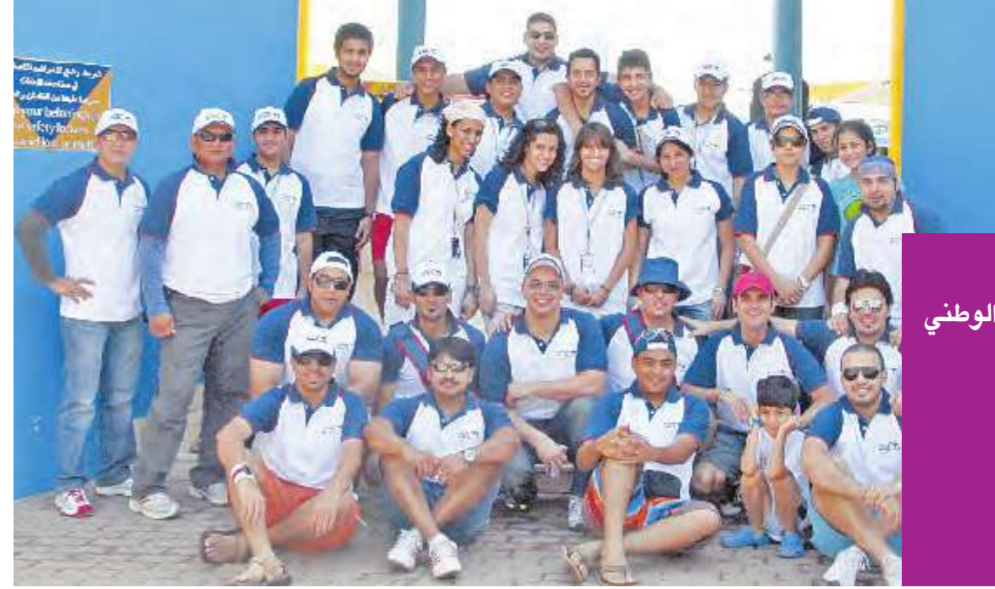
لقطة تذكارية لبعض موظفي الوطني

المناسبة يوم مفتوح لموظفي البنك الوطني وعائلاتهم