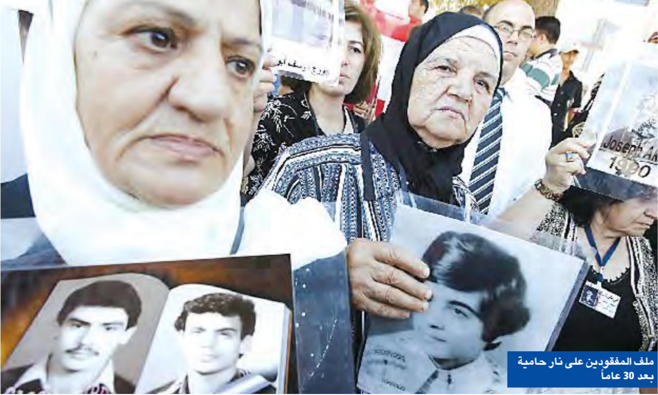
ملف المفقودين عن نار حامية بعد 30 عاماً

بعد نداء المطارنة الموارنة الشهير عام 2000 وتوتر العلاقة اللبنانية- السورية إثر الخلاف مع الرئيس الشهيد رفيق الحريري، بلغ التنازم ذروته مع اغتيال الحريري في فبراير 2005، واتهمته المعارضة اللبنانية، التي أصبحت في ما بعد أكثرية، النظام السوري بالتورط في اغتياله. في 26 أبريل 2005، انسحبت القوات السورية