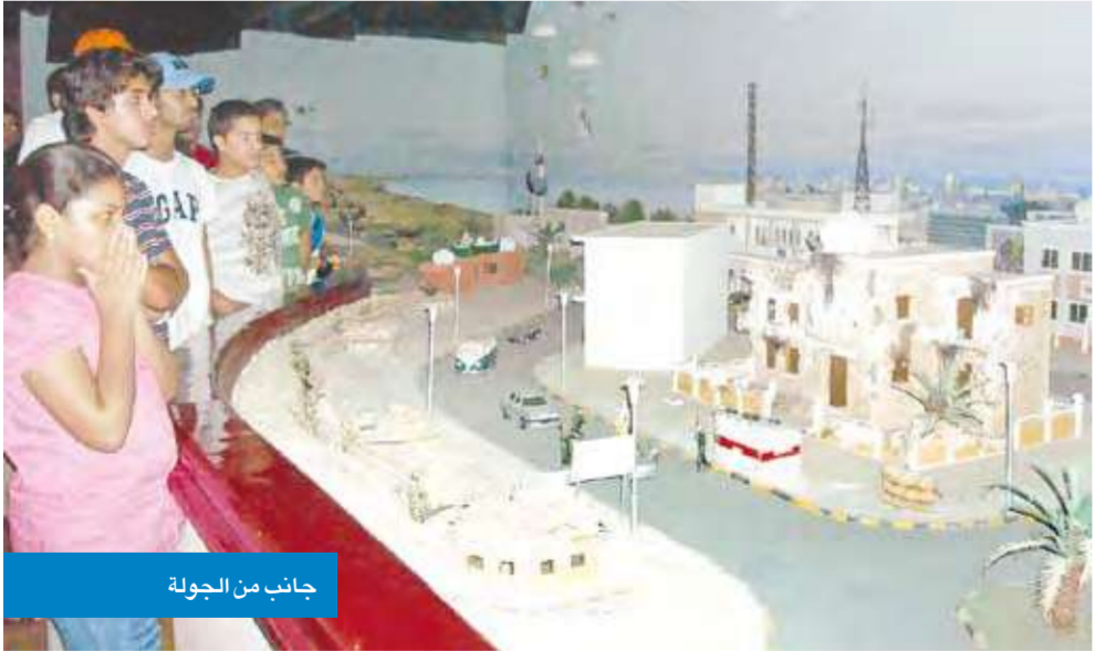
جانب من الجولة

كل ما هو في مصلحة الطالب أكاديميا وثقافياً. جدير بالذكر أن متحف «كي لا ننسى» في بيت الكويت للأعمال الوطنية عمل تطوعي بحث، وهو نتاج عمل شباب وشابات الكويت الطموحين، وأنه يشمل عدة قاعات توضح الأحداث التي مرت بها دولة الكويت منذ بداية نشأتها عبر الوثائق التاريخية والصور والخرائط، بالإضافة إلى توثيق جرائم النظام البائد خلال الغزو الغاشم على دولة الكويت في الثاني من أغسطس 1990.