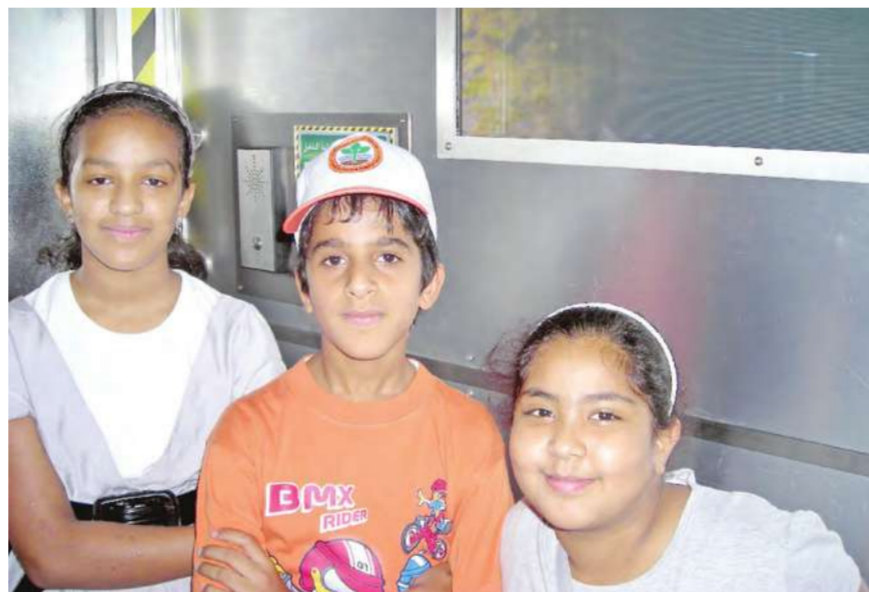
الاطفال داخل قاعة «رحلة في أعماق الأرض»