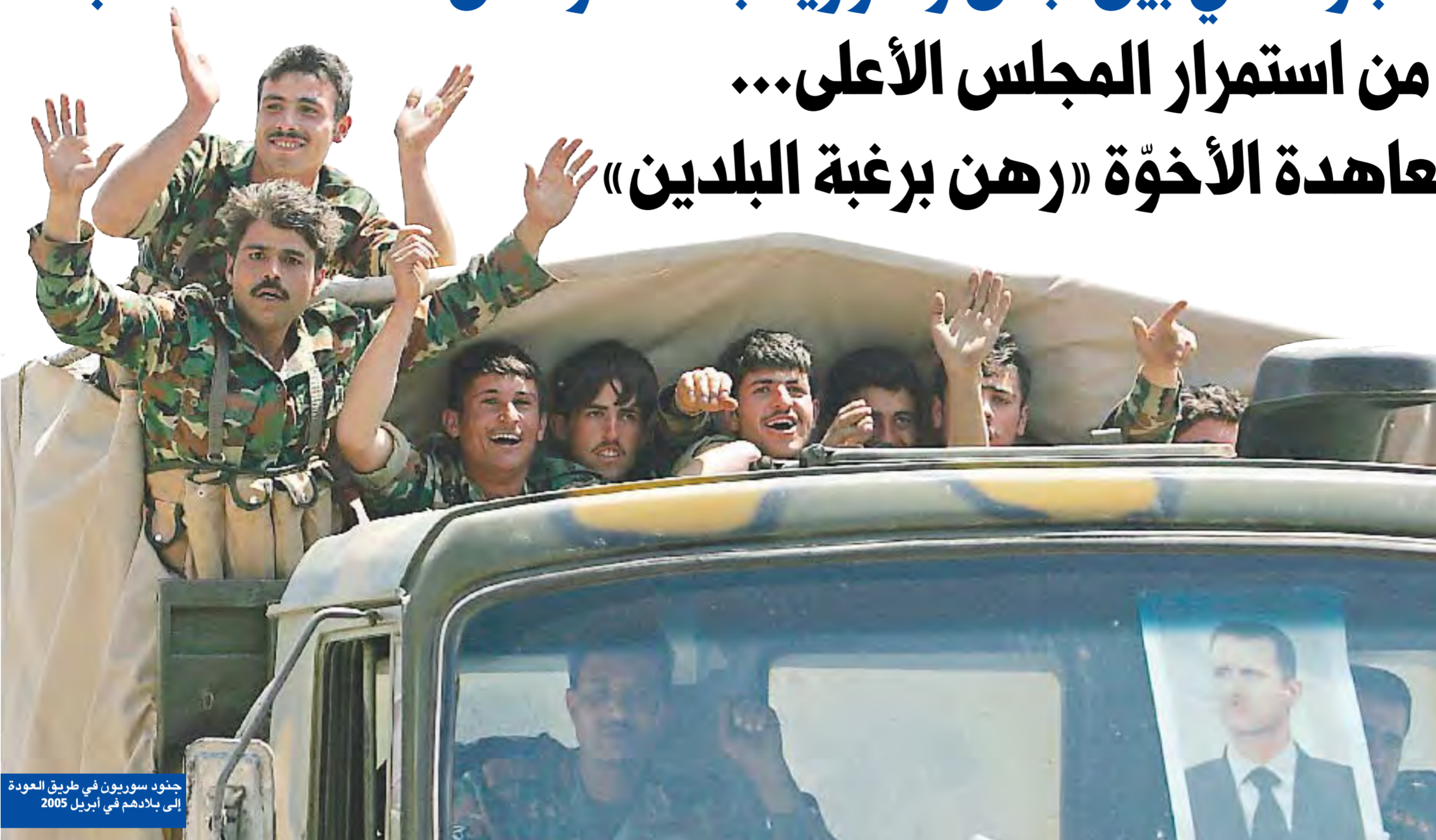
جنود سوريون في طريق العودة إلى بلادهم في أبريل 2005