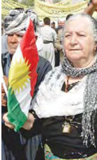
أكراد يتظاهرون دعماً للمادة 140 في أربيل أمس

توافقية بعيدا عن مبدأ الغالب والمغلوب». يذكر أن الأكراد يرفضون المادة 24 من قانون انتخابات مجالس المحافظات، والتي تنص على ضرورة تقاسم المناصب الإدارية في مدينة كركوك الغنية بالنفط، بنسبة 32 في المئة لكل من العرب والأكراد والتركان و 4% للمسيحيين، ويطالب الأكراد، عوضاً عن ذلك، بتطبيق المادة 140 من الدستور الخاصة بكروك، والتي ترمي إلى تطبيع الأوضاع في المدينة.