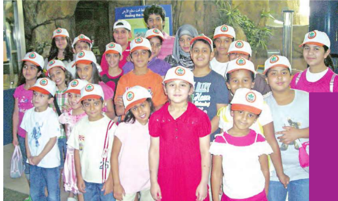
اطفال النادي الصيبي لحماية البيئة