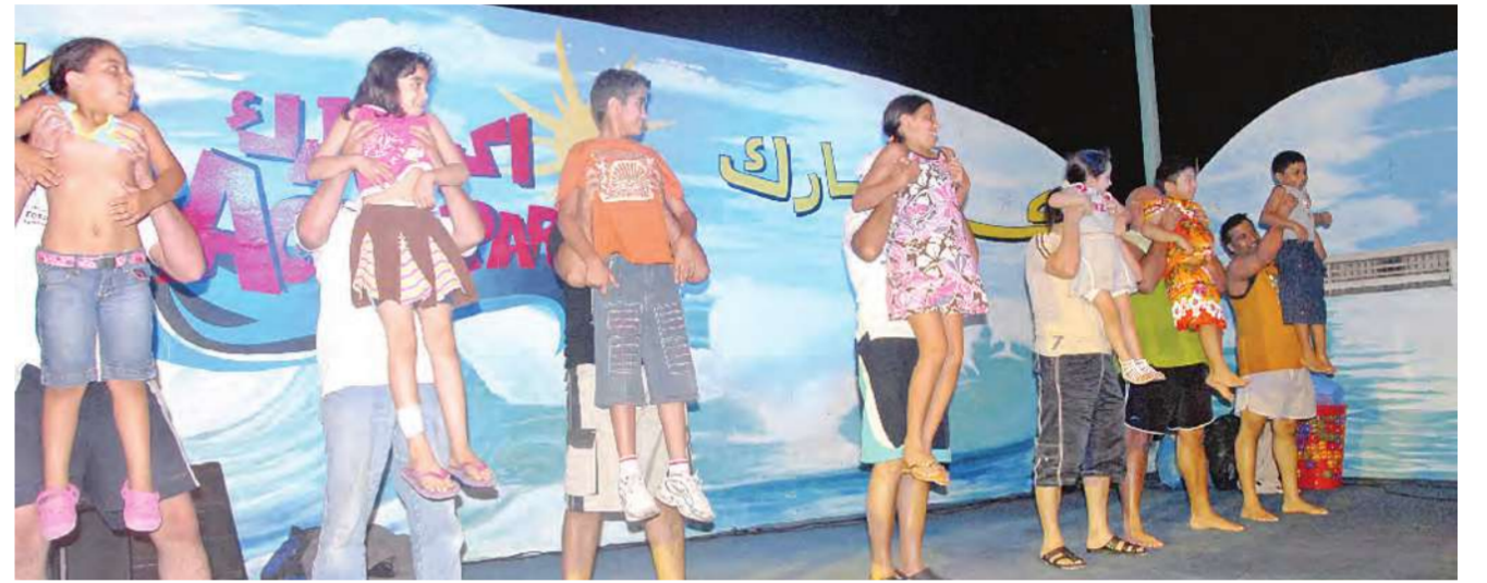
مسابقات وفعاليات مسلية امتعت الحضور