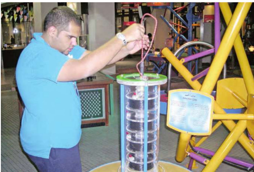
تجربة ملف الحث