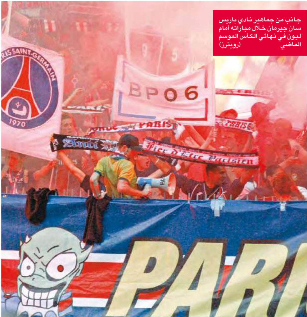
جانب من جماهير نادي باريس سان جيرمان خلال مباراته أمام لنس في نهائي الكأس الموسم الماضي