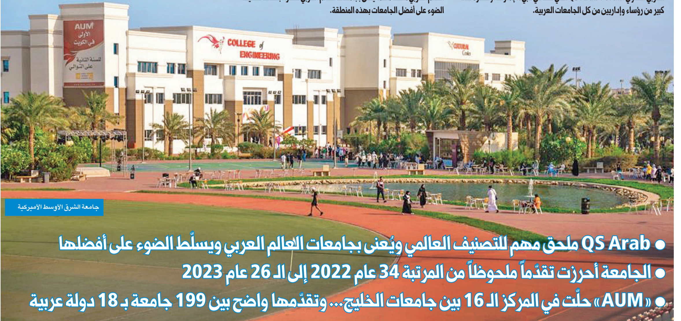
جامعة الشرق الأوسط الأميركية

أصدرت «Quacquarelli Symonds» (QS) تصنيفها السنوي الخاص بجامعات العالم العربي لعام 2023، الذي أُعلن في 19 الجاري، خلال الملتقى العربي السنوي QS Arab Forum الذي عقد في دبي/ الإمارات، وحضره عدد كبير من رؤساء وإداريين من كل الجامعات العربية.