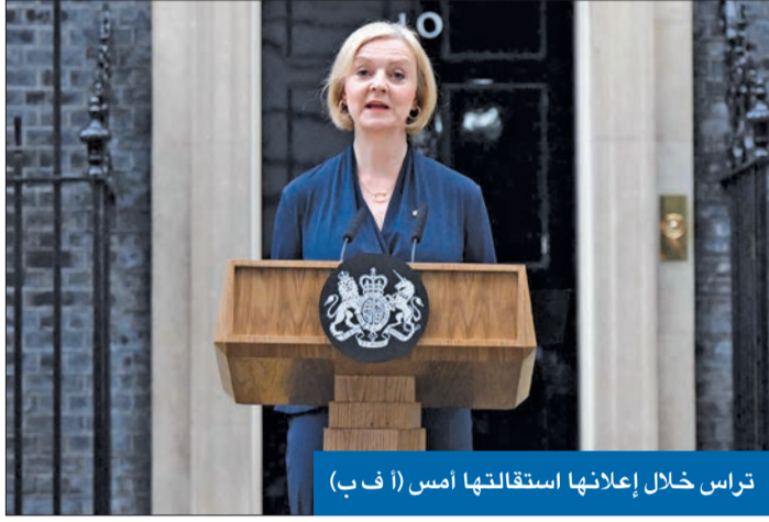
تراس خلال إعلانها استقالته أمس (أ ف ب)

أقصر ولاية حكومية منذ نحو 300 عام... وجونسون وسوناك يستعدان لخلافتهما ● موسكو تشمت وبايدن ينتظر الحكومة المقبلة وماكرون يتمنى «عودة الاستقرار»