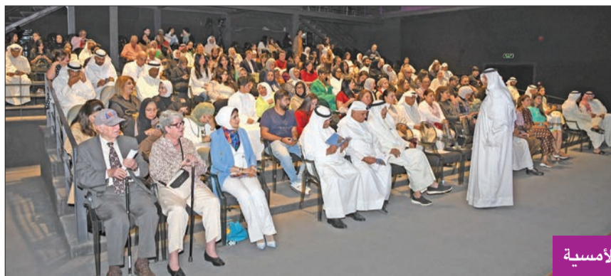
من أجواء الأمسية

خلال أمسية موسيقية على مسرح مركز اليرموك الثقافي