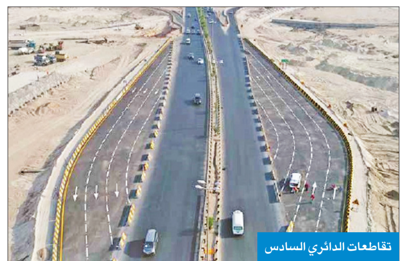
تقاطعات الدائري السادس

كشفت مصادر الهيئة العامة للطرق والنقل البري عن بلوغ مشروع إنشاء وإنجاز وصيانة تقاطعات على طريق الدائري السادس المؤدي إلى منطقة غرب جليب الشيوخ نسبة إنجاز 43.92 في المئة حتى سبتمبر الماضي، مبيّنة أن تاريخ الإنجاز التعاقدى للمشروع يعدّ التمهيد سيكون في 27 فبراير 2023. وأوضحت المصادر أن الهيئة حرصت على إنجاز المشروع، لما له من أهمية في تسهيل الحركة المرورية على الطرق الرئيسية على الدائري السادس والمؤدية