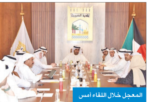
المعجل خلال اللقاء أمس

واستمع إلى بعض الملاحظات والتعديلات التي تم تقديمها لهيئة الفتوى والتشريع من قبل الإدارة القانونية والمكتب الفني التي لا تزال تحت الدراسة بشأن قانون البلدية وقانون العزّاب.