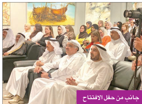
جانب من حفل الافتتاح

النتائج في منتصف نوفمبر المقبل خلال مؤتمر صحفي