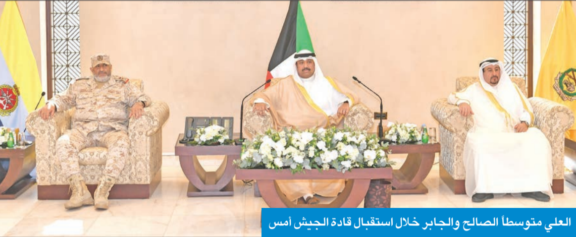
العلي متوسطاً الصالح والجابر خلال استقبال قادة الجيش أمس

بهم لخدمة الكويت والمحافظة على أمنها واستقرارها، سائلاً المولى عز وجل أن يديم على الجميع نعمة الأمن والأمان والرخاء، وأن يوفقه للمعمل لما فيه خير ورفعة وازدهار بلدنا الحبيب.