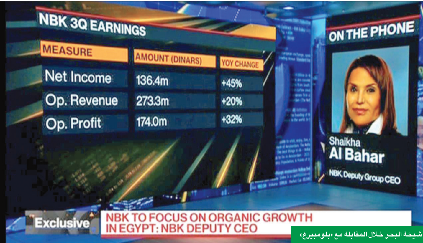
شيخة البحر خلال المقابلة مع «بلومبيرغ»

نائبة الرئيس التنفيذي لمجموعة البنك في مقابلة مع قناة بلومبيرغ العالمية