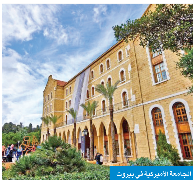
الجامعة الأميركية في بيروت