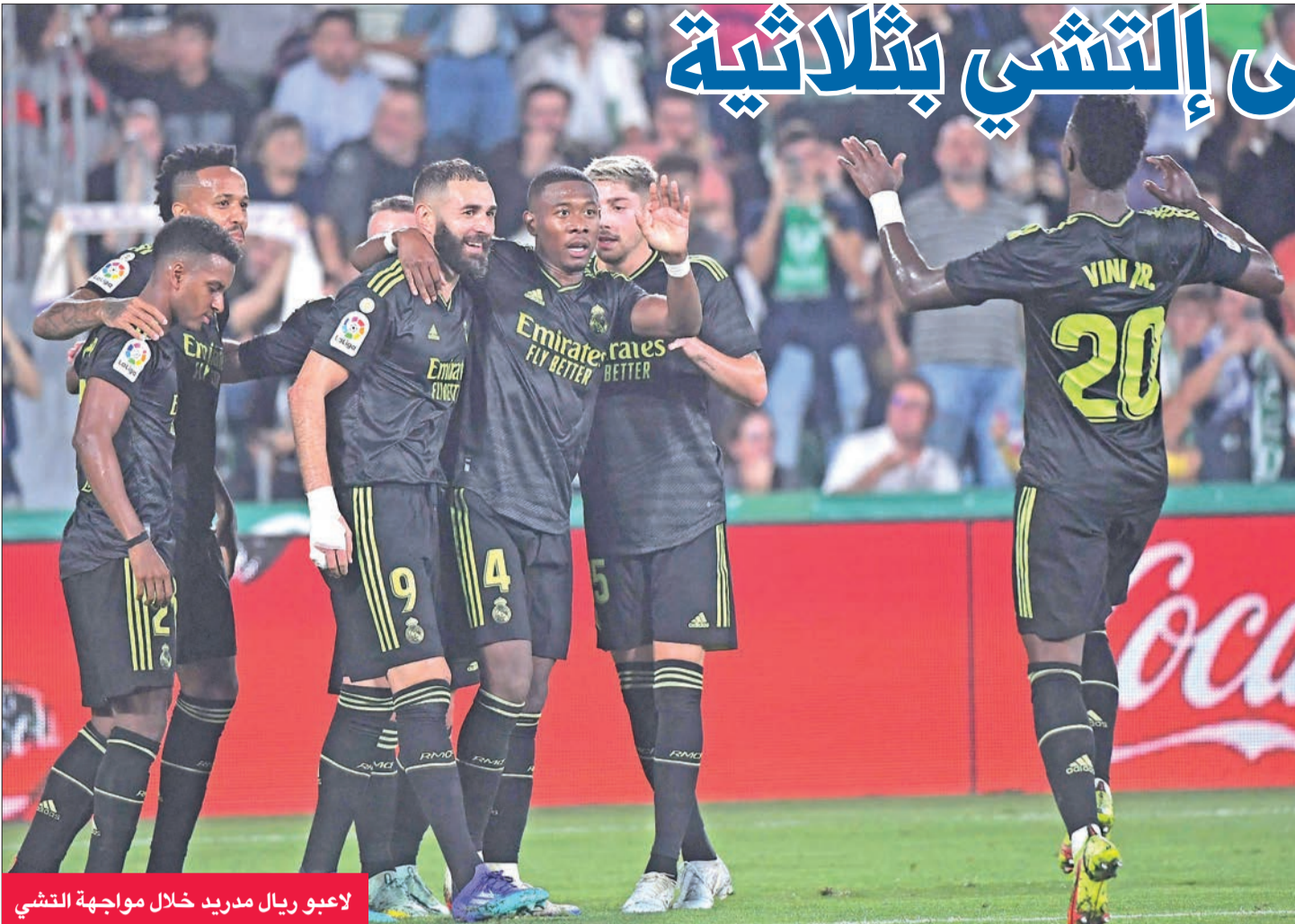
لاعبو ريال مدريد خلال مواجهة إلتشي

سحق ريال مدريد مضيفة إلتشي بثلاثية نظيفة، أمس الأول، في الجولة العاشرة بالدوري الإسباني لكرة القدم. احتفل المهاجم الفرنسي كريم بنزيمة بفوزه بالكرة الذهبية لأفضل لاعب في العالم، بقيادته ريال مدريد المتصدر للفوز على مضيفة إلتشي 3-0 صفر، ضمن المرحلة العاشرة من الدوري الإسباني التي شهدت تقدم ريال سوسيداد للمركز الثالث بفوزه الصعب على ضيفه ريال مايوركا 1- صفر. ويمر ريال مدريد بأفضل مرحلة بعدما زاد تقدمه في الصدارة إلى 28 نقطة، كما سيخوض النادي الملكي مباراة صعبة أمام ضيفه إشبيلية غدا (السبت) في المرحلة المقبلة. وأكد نادي الريال، الذي غاب عن صفوفه الحارس البلجيكي تيبو كورتوا وداني سيبايوس والدومينيكاني ماريانو دياس، تفوقه على إلتشي متذلل الترتيب الذي لم يفز بأي من المواجهات التسع في «لا ليغا»، إذ خسر في 7 مباريات وتعادل ثلاث مرات. وسجل بنزيمة الذي شارك أساسياً بعد يومين من فوزه بجائزة الكرة الذهبية، الهدف الثاني لفريقه بعد لعبة ساحرة مع البرازيلي رودريغو، أنهاها بتسديدة أرضية إلى يسار الحارس إدغار باديا (75)، في خامس أهدافه هذا الموسم وحقق سوسيداد فوزه الخامس توالياً في «لا ليغا» ضمن سلسلة من 8 انتصارات توالياً في مختلف المسابقات،