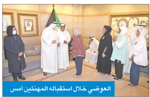
العوضي خلال استقباله المهنيين أمس

من جانب آخر، دعت وزارة الصحة إلى ضرورة اتباع الإرشادات الصحية الخاصة فيما يخص سبل الوقاية الخاصة خلال موسم الأمراض الفيروسية، وما يصاحبها من زيادة ظهور بعض الأعراض التنفسية. وقال المتحدث الرسمي باسم الوزارة، د. عبدالله السند، في بيان صحفي، إن هناك زيادة في ظهور الأعراض التنفسية مع بدايات موسم الأمراض الفيروسية الحالي، وتسجيل بعض الزيادة في حالات الإصابة الأولية، وأقسام الطوارئ في المستشفيات، إلا أنه طمأن بأن معظم الحالات لم تستدع التدخل إلى المستشفى، وليست هناك زيادة في حدوثها أو