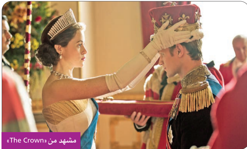
مشهد من «The Crown»

فافت النتائج التي حققتها «نتفليكس» توقعاتها، وحطمت الرقم القياسي، إذ كانت منصة البث التدفقي الرائدة تامل في استعادة مليون مشترك خلال العام الحالي، لكن عدد المنضمين الجدد إليها خلال الصيف وصل فعلياً إلى 2.4 مليون، ما يشكل إنجازاً لها، بعدما فقدت 1.2 مليون مشترك بداية العام. وتراهن «نتفليكس» خلال الموسم الجاري على عودة المسلسلات التي استقطبت سابقاً أعداداً كبيرة من المشاهدين، على غرار «Emily in Paris»، وهو مسلسل كوميدي درامي أميركي مؤلف من 10 حلقات تم عرضه على المنصة في 2 أكتوبر 2020، بطولة النجمة البريطانية ليلى كولينز، وأشلي بارك وكايت والش. كما تراهن «نتفليكس» أيضاً على مسلسلها الشهير «The Crown»، أو «التاج»، وهو مسلسل دراما وسيرة ذاتية تلفزيوني، إعداد وكتابة بيتر مورغان، والذي يتابع قصة وسيرة الملكة إليزابيث الثانية في المملكة المتحدة، ويتصدى لمطولته: كلير فوي، ومات سميث، وجون لينغو، وفانيسا كبري، والين أتكينز، وغيرهم من الفنانين. وتضمنت خطة «نتفليكس» لزيادة المتابعين بهذا الإنجاز الكبير، على صيغة جديدة للاشتراكات ستوفرها اعتباراً من نوفمبر المقبل في نحو 12 بلداً، تتيح الإعلانات على شاشتها مقابل بدل أرخص. وقال المؤسس المشارك لـ «نتفليكس»، ريد هاستينغز، خلال مؤتمر للمحللين الثلاثاء: «الحمى، لقد انتهينا من النتائج الربعية المتدهورة، وارتفع العدد الإجمالي لمشتركينا (نتفليكس) إلى أكثر من 223 مليوناً، محطمة بذلك الرقم القياسي الذي حققته في نهاية 2021، وهو 221.8 مليون مشترك، نتيجة انعكاسات جائحة (كوفيد-19) الإيجابية جداً على المنصات الترفيهية». وتوقع هاستينغز أن يصل عدد المشتركين إلى 227.6 مليوناً في نهاية السنة الحالية. ووصف