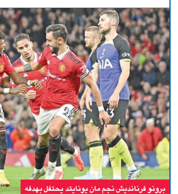
برونو فرنانديش نجم مان يونايتد يحتفل بهدفه

ومن هجمة مرتدة وتسديدة لفريد، وصلت الكرة إلى فرنانديش المتمرص على حافة المنطقة، فلعبها بهوء لولبية في الزاوية البعيدة للوريس، ليضاعف «الشياطين الحمر» تقدمهم (69). نونيسيس يسجل في أنفيلد وبعد تغلبه على مانشستر سيتي وصيف الترتيب 1-صفر، حقق ليفربول فوزه الثاني توالياً في الدوري والثالث في مختلف المسابقات، ليرتقي إلى المركز السابع مع مباراة مع مؤجلة. وتابع وست هام خضوعه للليفربول في السنوات الأخيرة، إذ لم يحقق سوى فوز يتخيم ضده في 13 مباراة في كل المسابقات. وأردك ليفربول الشباك منتصف الشوط الأول، عندما لعب اليوناني كوستاس تسيميكاس تمريرته الحاسمة الخامسة هذا الموسم، عكسها نونيسيس (23 عاماً) برأسه جميلة في الزاوية