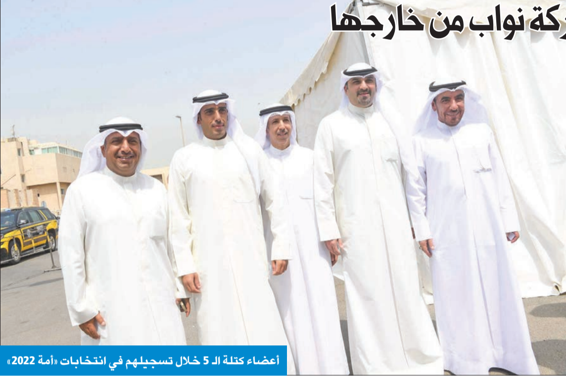
أعضاء كتلة الـ 5 خلال تسجيلهم في انتخابات «أمة 2022»