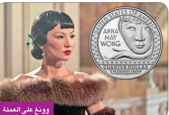
وونغ على العملة

ستضع دار سك العملة الأميركية شخصية أميركية آسيوية على عملتها للمرة الأولى عندما تصدر عملة معدنية الأسبوع المقبل عليها صورة الشهيرة وأظفارها الطويلة سيبدأ تداولها خلال أيام، في إطار برنامج يُطلق عليه اسم «أرباع النساء الأمريكيات». وقالت الدار، في بيان، إن عملة من فئة الربع دولار عليها صورة وونغ بغيرتها الشهيرة وأظفارها الطويلة سيبدأ تداولها خلال أيام، في إطار برنامج يُطلق عليه اسم «أرباع النساء الأمريكيات». ولدت وونغ عام 1905 في لوس أنجلوس باسم وونغ ليو تسونغ، وأظهرت في أكثر من 60 فيلماً، ورغم نجاحها، عانت وونغ التمييز ضد الآسيويين والعنصرية في هوليوود، حيث كانت تُعطى نوعية الأدوار نفسها، وتتقاضى أجراً أقل، ولم تُسند إليها أدوار البطولة، مما أجبرها على الذهاب إلى أوروبا للتمثيل، وتوفيت في عام 1961.