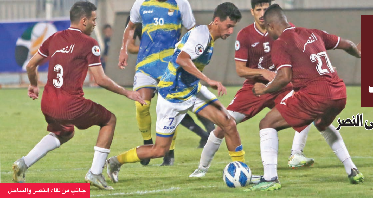
جانب من لقاء النصر والساحل

سهلة، وأنه لم يفقد الثقة في لاعبيه منذ بداية الموسم، رغم تراجع النتائج.