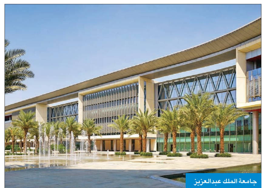
جامعة الملك عبدالعزيز