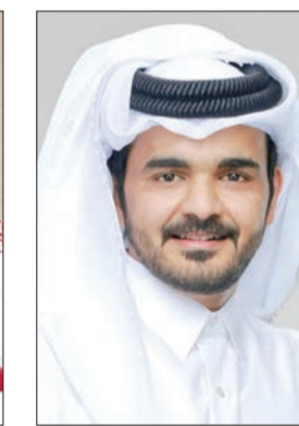
جوعان بن حمد