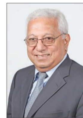
الفجيجي روبين ميتشل

ولم يواجه ميتشل وجوعان أي منافسة، إذ لم يترشح أحد مقابلهما. ومن مهام النائب الأول للرئيس ترؤس الجلسات في حال غياب الرئيس. ومنذ تنحى الفهد، تولى ميتشل، النائب الأول للرئيس ورئيس اللجان الأولمبية في أوقيانيا، قيادة «أنوك» حتى انتخابه رئيساً أصيلاً.