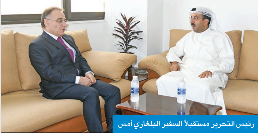
رئيس التحرير مستقبلاً السفير البلغاري أمس

وأعرب عن أمله أن تلعب الصحافة الكويتية دوراً في الإضاءة على بلاده، من حيث السياحة والاستثمار والاستشفاء، مشيداً بـ«صحافة الكويت الحرة»، معتبراً في الوقت نفسه أن موقف «الجريدة» يختلف أحياناً عن المواقف الرسمية للحكومة، «ونرى جراً كبيرة في مواقفها من أمور كثيرة، وتحديداً من خلال افتتاحياتها، وأنا شخصياً أستفيد منها لمعرفة التطورات المحلية والإقليمية».