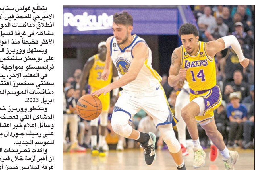
جانب من مباراة سابقة بين ليكرز ووريرز

ويخطو ووريرز خطواته الأولى في الدوري تحت وطأة المشاكل التي تعصف بغرف تبديل الملابس، بعدما نقلت وسائل إعلام خبر اعتداء نجم الدفاع درايموند غرين بالضرب على زميله جوردان بول خلال التمارين قبيل الاستعداد للموسم الجديد. وأكدت تصريحات المدرب ستيف كير ما حصل، إذ اعتبر أن أكبر أزمة خلال فترة توليه مهامه الفنية تكمن في توحيد غرفة الملابس ضمن أولوياته بعد الجدل الحاصل. ولم تكن حال سلتيكس الوصيف أفضل من حامل اللقب، إذ كان بدوره عرضة لزلزال رياضي تمثل في إيقاف مدربه الموهوب النيجيري الأصل إيمني أودوكا لكامل الموسم