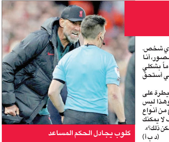
كلوب يجادل الحكم المساعد

خاض مارسيلو غياردو آخر مباراة له كمدرّب لفريق ريفر بليت بملعب مونتمتال، وانتهت بالهزيمة 2-1 أمام روساريو سنترال، في ليلة حافلة بالمشاعر والتقدير تجاه المدرب الذي حفر اسمه بأحرف من نور في تاريخ الريفر. وتجمع آلاف من مشجعي ريفر بليت في مدرجات الملعب، حيث رفعوا أعلاماً لافتات مخصصة لجياردو، الذي أعلن الخميس الماضي عدم تجديد عقده مع النادي لعام 2023، لتصبح مواجهة أمس هي الأخيرة في مسيرته مع ريفر بليت التي امتدت لثمانية أعوام ونصف حصد خلالها 14 لقباً محلياً وعالمياً. وطاف غياردو ولاعبوه أرجاء الملعب لتحية الجمهور وكل من التقوه من العاملين، وسط ألعاب نارية من المشجعين الذين لم يتوقفوا عن التلويح بالأعلام والقمصان لتوديع المدرب الأيقوني للفريق، والذي حقق معه إنجازات تاريخية.