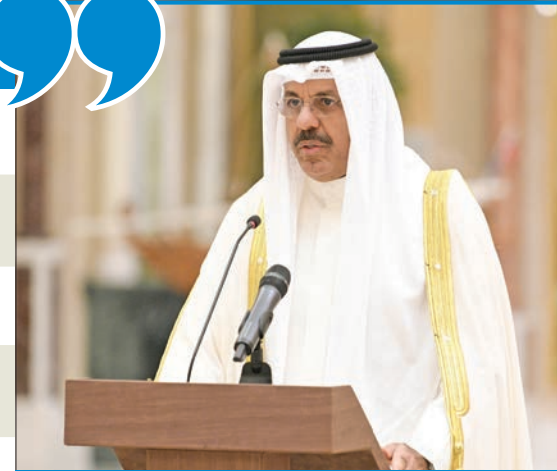
رئيس الوزراء يؤدي اليمين الدستورية أمام نائب الأمير

النصائح والتوجيهات السامية هي النبراس الذي ستخذه الحكومة هدياً لأداء مهامها