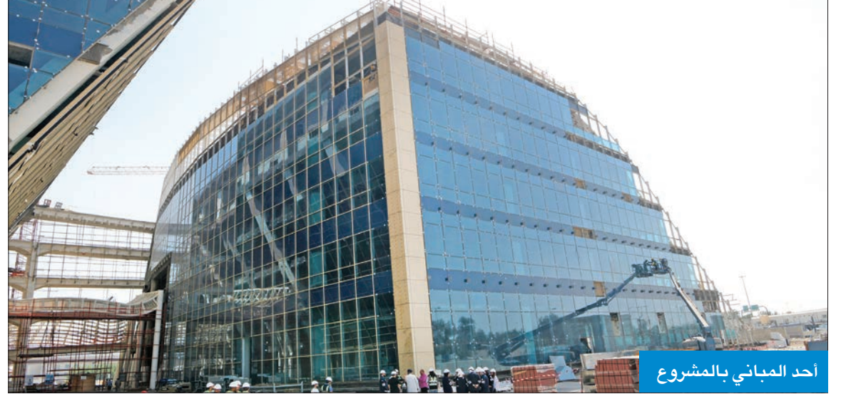
أحد المباني بالمشروع

الأولوية للمنتج الوطني، التزاماً بالعقد، وتشجيع المنتجات الوطنية. وأشارت إلى أن الاتفاقية الاستشارية للمشروع انتهت بتاريخ التعاقد من دون تمديد، وتمت الاستعانة بالكوادر الوطنية للإشراف المباشر عليه، حيث يوجد به ما يقارب 80 مهندسا تسعى الوزارة إلى تدريبهم وتأهيلهم للعمل في مثل هذه المشاريع وإكسابهم الخبرات اللازمة.