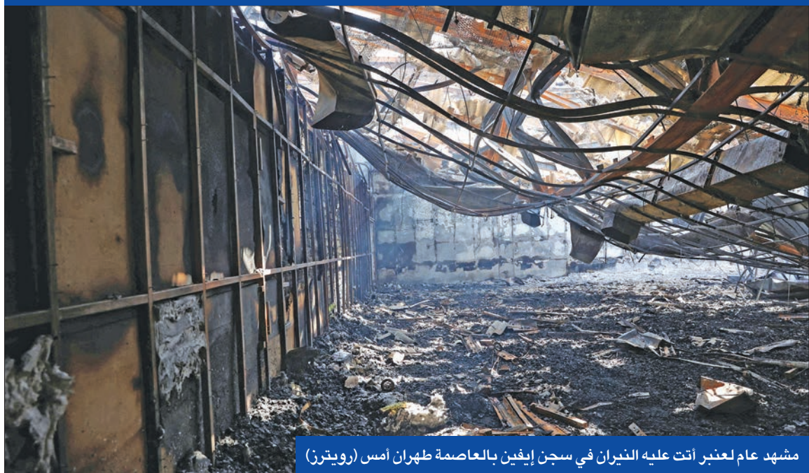
مشهد عام لعنبر اتت عليه النيران في سجن إيفين بالعاصمة طهران أمس (رويترز)

ويأتي التحرك الإيراني العسكري، بعد أيام من تصريحات للرئيس الفرنسي إيمانويل ماكرون اتهم فيها روسيا بزعزعة الاستقرار في جنوب القوقاز بهدف تقسيم الغرب، والتدخل في النزاع حول ناغورني كاراباخ لمصلحة أذربيجان بالتواطؤ مع تركيا العضو بحلف شمال الأطلسي «الناتو». وفي هذا السياق، كشف مصدر رافق الرئيس الإيراني إبراهيم رئيسي في زيارته الأخيرة لكازاخستان، أن اللقاء الذي جمع الأخير مع نظيره الأذربيجاني إلهام علييف على هامش قمة الأستانة لمنظمة «سيكا» الآسيوية الخمس الماضي، لم يكن