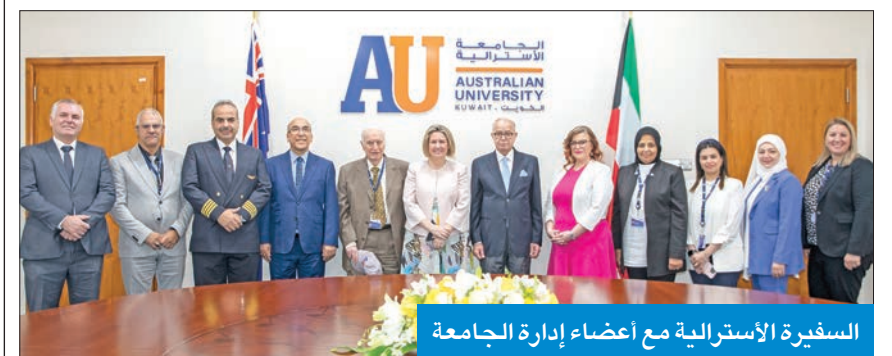
السفيرة الأسترالية مع أعضاء إدارة الجامعة

زارت السفيرة الأسترالية في الكويت ميليسا كيللي الجامعة الأسترالية، لمقابلة أعضاء إدارتها، والتعرف على برامجها التعليمية ومرافقها.