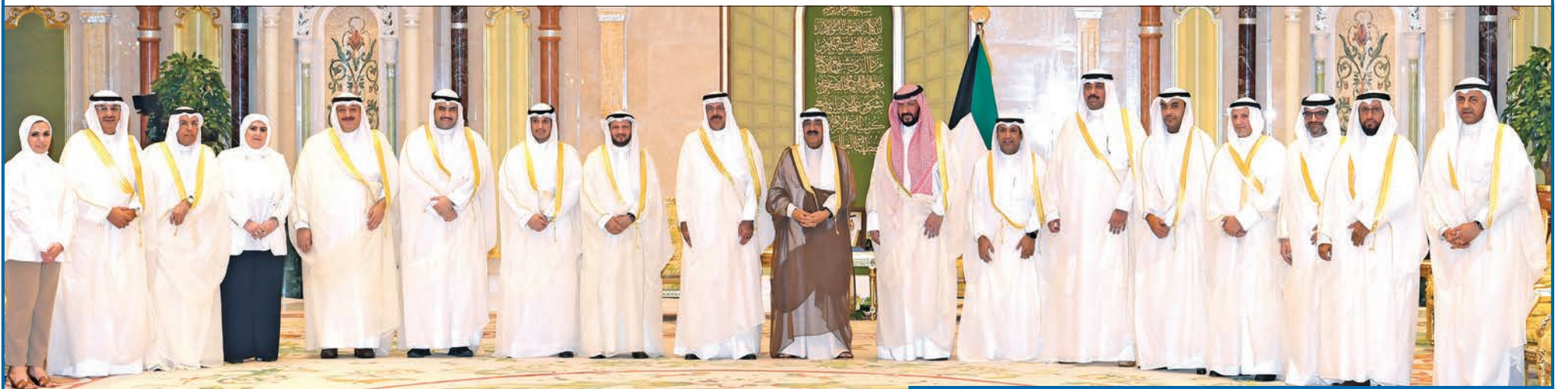
نائب الأمير متوسلاً رئيس الحكومة والوزراء عقب أداء اليمين الدستورية أمام سموه أمس

أحمد النواف والوزراء أدوا اليمين الدستورية أمام سموه