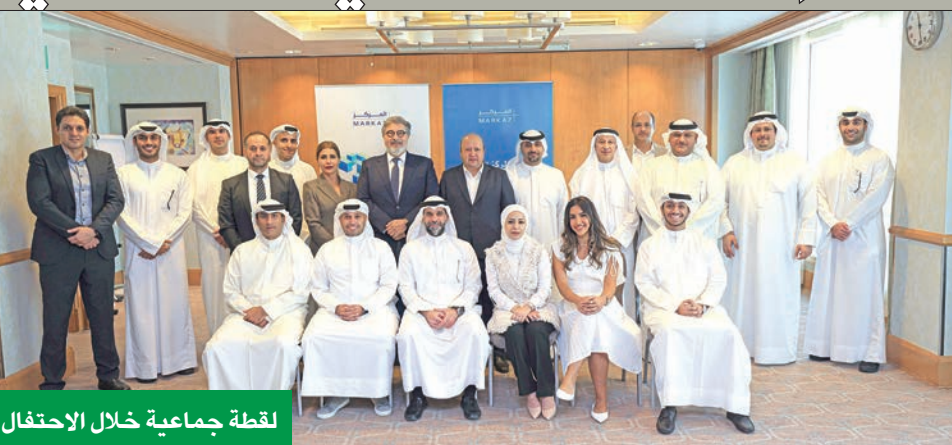
لقطة جماعية خلال الاحتفال