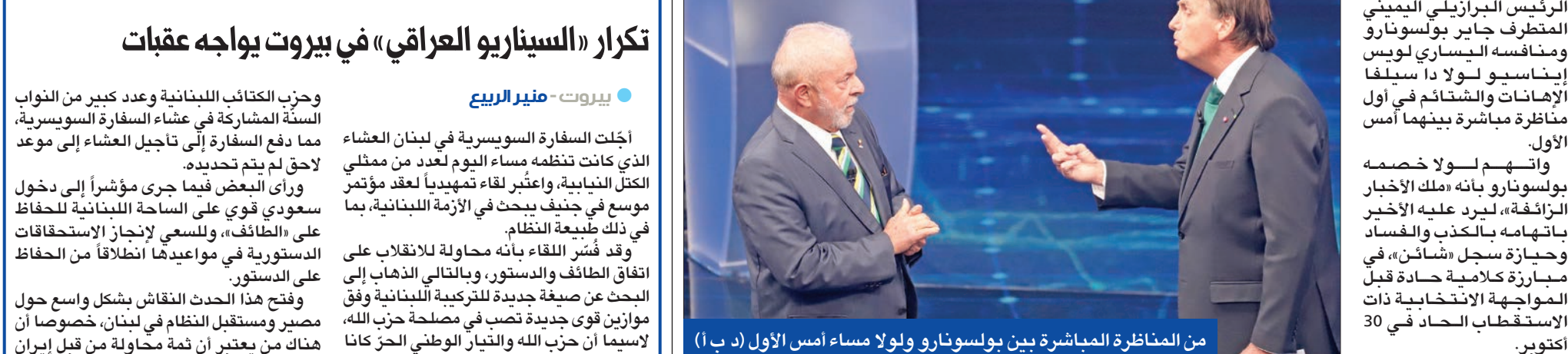
من المناظرة المباشرة بين بولسونارو ولولا مساء أمس الأول (د. ب. أ)

تكرار «السياريو العراقي» في بيروت يواجه عقبات