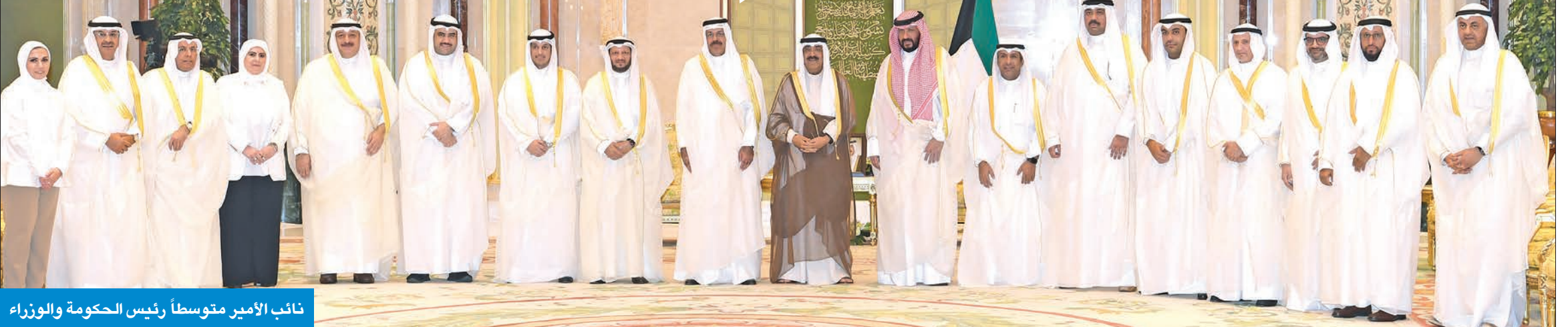
نائب الأمير متوسلاً رئيس الحكومة والوزراء

رئيس الحكومة وأعضاؤها أدوا اليمين الدستورية أمام سموه