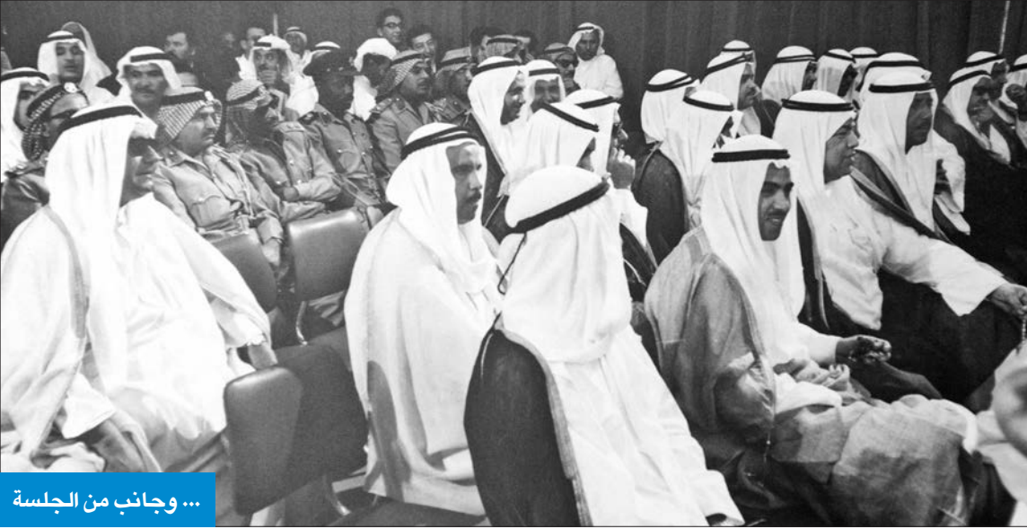
... وجانب من الجلسة

مناهج وطرق التربية والتعليم لمواكبة الدولة المتقدمة»، في مجلس 2012 (المبطل الأول)، وعاد خطاب مجلس 2016 ليؤكد ضرورة مراجعة مناهج وأساليب التعليم وتحديثها لمواكبة العالم، وفيما يلي الخطابات السامية وبعض الأفكار التي تضمنتها في مجالس الأمة منذ عام 1963.