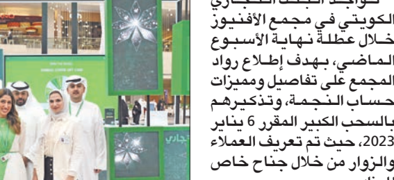
فريق البنك في المجمع

تواجد البنك التجاري الكويتي في مجمع الأفنيوز خلال عطلة نهاية الأسبوع الماضي، بهدف إطلاع رواد المجمع على تفاصيل ومميزات حساب النجمة، وتذكيرهم بالسحب الكبير المقرر 6 يناير 2023، حيث تم تعريف العملاء والزوار من خلال جناح خاص للبنك. إضافة إلى ذلك، تواجد موظفو إدارة المبيعات المباشرة، التابعة لقطاع الخدمات المصرفية لأفراد، لشرح وتدريب رواد الأفنيوز بمزايا حساب النجمة في سياق تفاعلي شرح فيه موظفو التجاري الخدمات والمزايا التي يوفرها الحساب، وأبدى الحضور تفاعلاً مع الموظفين بمشاركتهم العديد من المسابقات والفعاليات الترفيهية وتوزيع الجوائز على زوار الجناح، في إطار اهتمام البنك الدائم بعملائه وسعيه لإرضائهم بتقديم خدمات مصرفية مميزة. وشهد جناح البنك في الأفنيوز إقبالاً لافتاً من العملاء للتعرف على مزايا الحساب، وإمكانية فتحه بكل سهولة ويسر عن طريق تطبيق البنك التجاري على الهواتف الذكية، علماً أن الموعد الأخير لفتح الحساب هو 31 أكتوبر الجاري، للميلون ونصف المليون دينار، وفيما يخص السحوبات على حساب النجمة فهي تتيج فرصة الفوز بالعديد من الجوائز النقدية القيمة الأخرى على مدار العام، حيث يقدم الحساب جوائز أسبوعية بمبلغ