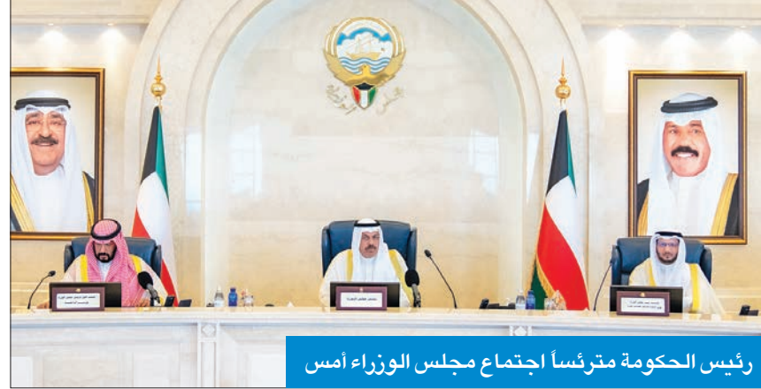
رئيس الحكومة مترئسا اجتماع مجلس الوزراء أمس

بعد أداء اليمين الدستورية أمام سمو نائب الأمير ولي العهد الشيخ مشعل الأحمد، عقد مجلس الوزراء، أمس، اجتماعه الأول في قصر السيف برئاسة رئيس مجلس الوزراء سمو الشيخ أحمد نواف الأحمد، حيث شدّد على الالتزام بتطبيق القانون ومحاربة الفساد والمحسوبية، والعمل على كل ما من شأنه تحقيق التنمية الشاملة المستدامة.