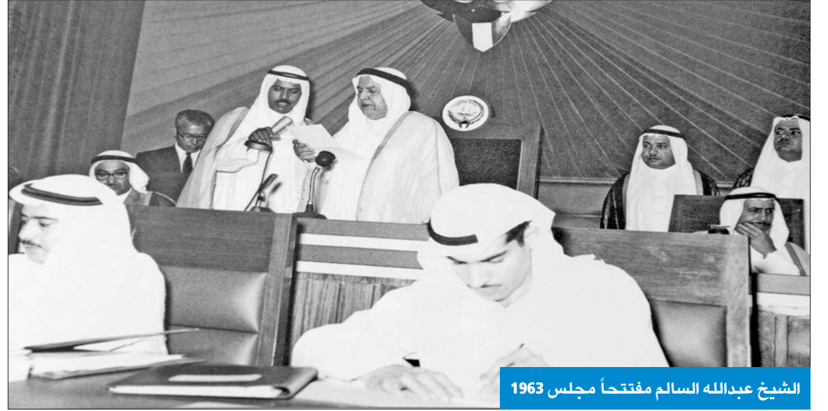
الشيخ عبدالله السالم مفتتحاً مجلس 1963

جاء في نص الخطاب السامي في المجلس الأول عام 1963 الذي تلاه الأمير الراحل الشيخ عبدالله السالم: «فتفتح دور الانعقاد الأول لمجلس الأمة الذي تبدأ بانعقاده مرحلة العهد الدستوري في دولة الكويت المستقلة، في هذه المرحلة التي تعتبر حلقة من حلقات سير دولتنا الصاعدة نحو هدفها الأعلى، يسعدني أن اهنئكم بثقة الشعب بكم حين اختاركم لتحملوا أمانة ثقيلة، وأن أكرر وصيتي لكم كوالد لأبنائه أن تحرصوا على وحدة الصف في هذه الدولة العربية المتمسكة بدينها وتقاليدها.