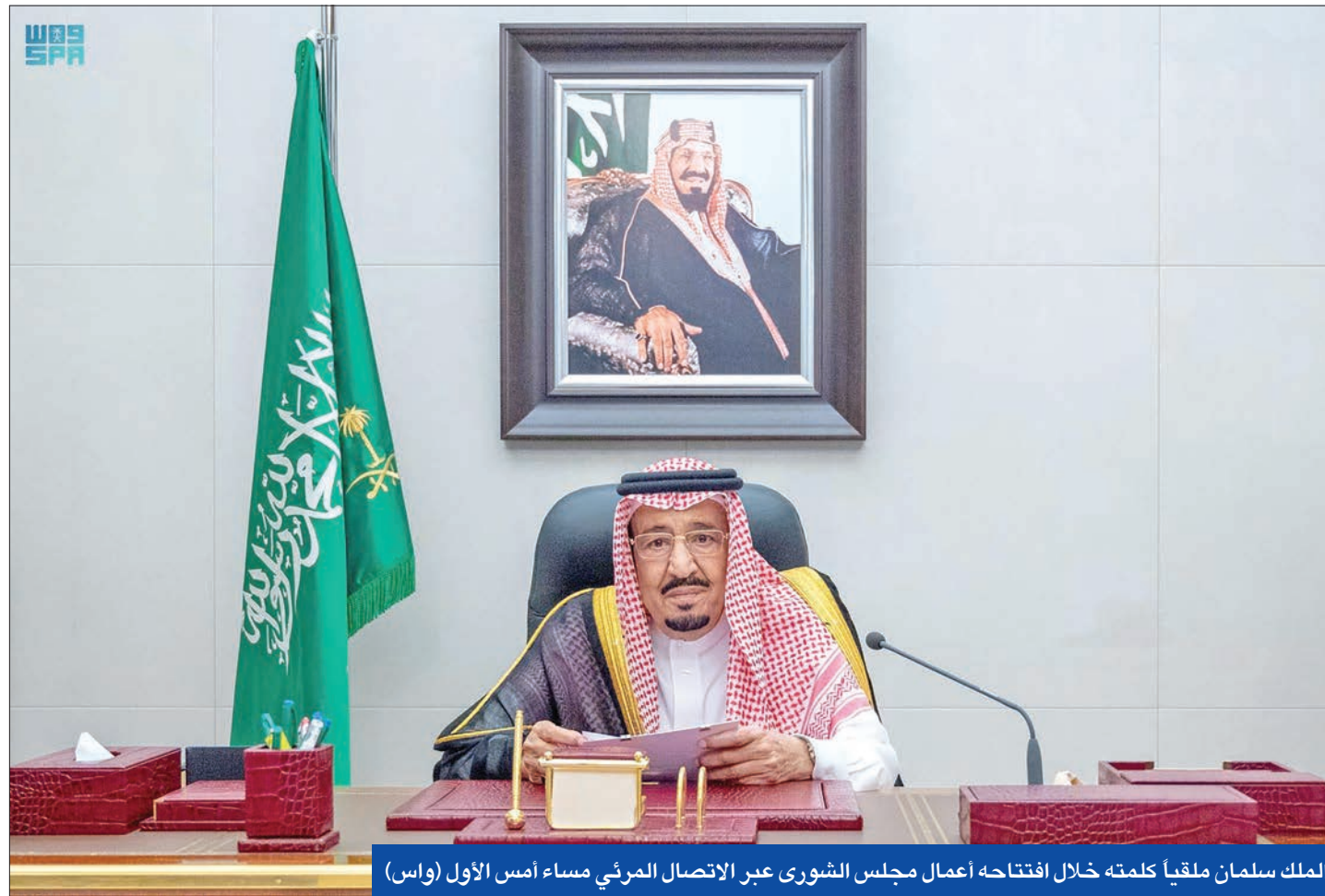
الملك سلمان ملقياً كلمته خلال افتتاحه أعمال مجلس الشورى عبر الاتصال المرئي مساء أمس الأول (واس)

دول عربية تدعم قرار «أوبك بلس»... وبن سلمان يُجري لقاءات في «قمة الـ 20» لا تشمل بايدن