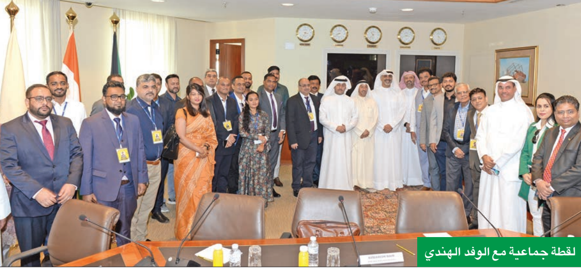
لقظة جماعية مع الوفد الهندي

خلال استقبالها وفداً هندياً لبحث آفاق جديدة للتعاون المشترك والفرص المتاحة