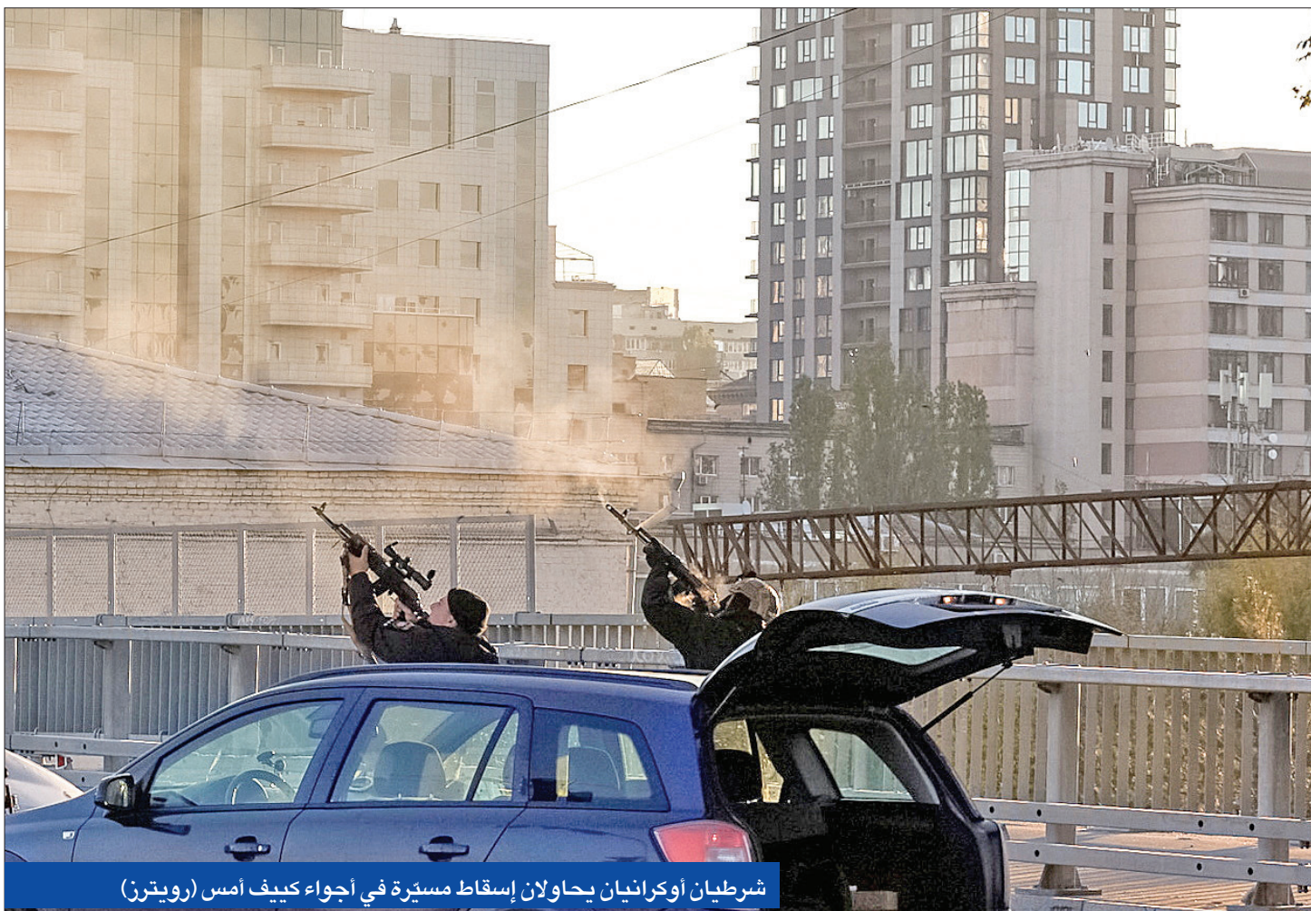
شريطان أوكرانيان يحاولان إسقاط مسيرة في أجواء كيف أمس

أوروبا تبحث عن «دليل دامغ» على تورط إيران بالحرب... وروسيا تحذر إسرائيل من إمداد أوكرانيا بالأسلحة