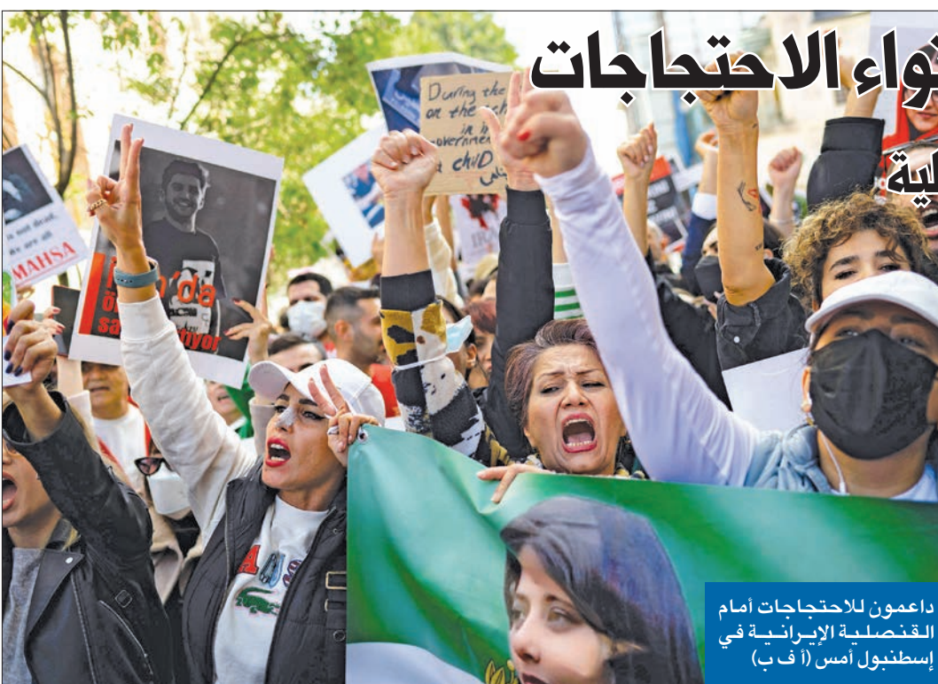
داعمون للاحتجاجات أمام القنصلية الإيرانية في إسطنبول أمس

مع استمرار الاحتجاجات في إيران للشهر الثاني على التوالي، بدأت السلطات الإيرانية تبحث عن حلول لاحتواء الحراك الذي شمل شرائح مجتمعية وعمرية متعددة، ويتمثل أحد هذه الحلول في حوار غير رسمي بين جناحي النظام؛ الأصوليين الذين يحكمون، والإصلاحيين الذين تعرضوا لضربات سياسية في السنوات القليلة الماضية إلا أنهم لا يزالون يعتبرون «احتياطاً استراتيجياً» لنظام الجمهورية الإسلامية. في هذا السياق، كشف مصدر لـ «الجريدة»، وهو أحد قادة الأحزاب