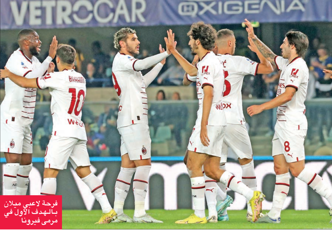
فرحة لاعبي ميلان بالهدف الأول في مرمى فيرونا

بالوصافة، يبدو نابولي على أتم الاستعداد لهذا الموسم لمحاولته الفوز بلقبه الأول في الدوري منذ أن توج به للمرة الثانية والأخيرة عام 1990 بقيادة الأرجنتيني الأسطوري الراحل دييغو مارادونا. وعلى الرغم من أنه لم يحقق سوى انتصار بريم هذا الموسم، كان بولونيا نذاً عنيداً لنابولي، أمس الأول، على ملعب «دييغو أرماندو مارادونا» وعانى الفريق الجنوبي لحسم النقاط الثلاث إذ وجد نفسه متخلفاً في الدقيقة 41 بهدف الهولندي جوشوا زيركزي بعد تمريرة من أندريا كامبياسو، إلا أنه أدرك التعادل قبل نهاية الشوط الأول بفضل البرازيلي جوان جيزوس إثر ركلة ركنية (45).