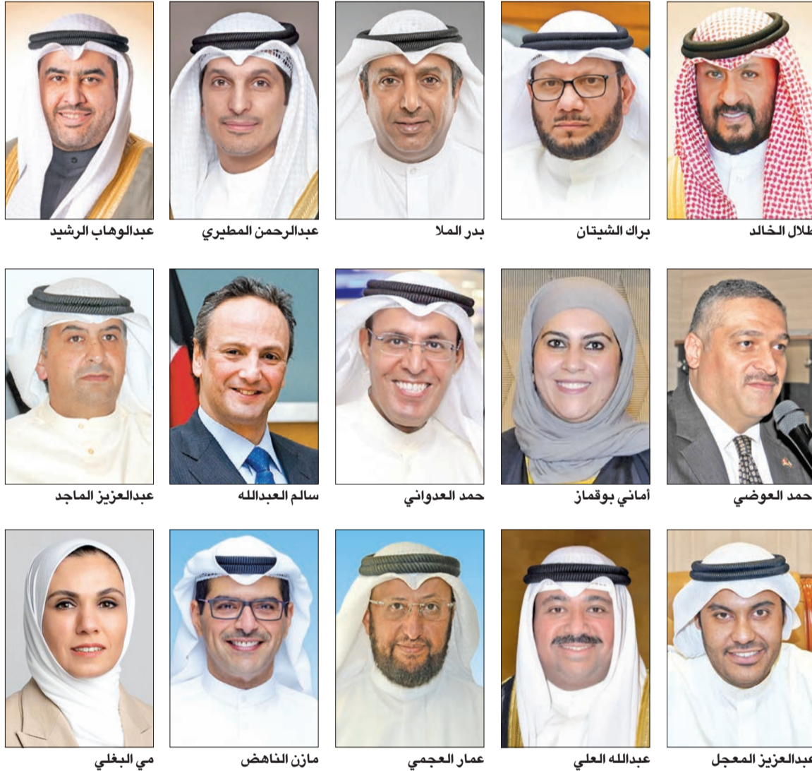
طلال خالد براك الشيتان بدر الملا عبد الوهاب الرشيدي عبد الرحمن المطيري عبد العزيز الماجد سالم عبدالله حمد العدواني أماني بوقماز أحمد العضوي عبد العزيز المعجل عبدالله العلي عمار العجمي مازن الناهض مي البغلي

للتعليم العالي والبحث العلمي، والشيخ سالم عبدالله وزيراً للخارجية، وعبد العزيز الماجد وزيراً للعدل، ووزيراً للأوقاف والشؤون الإسلامية، وزير دولة لشؤون تعزيز النزاهة، وعبد العزيز المعجل وزير دولة لشؤون البلدية، ومي البغلي وزيرة للشؤون الاجتماعية والتنمية المجتمعية، ووزيرة دولة لشؤون المرأة والطفولة.