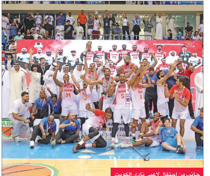
جانب من احتفال لاعبي نادي الكويت

إلى ذلك، أبدى مدرب الكويت الألماني بيتر شومرز سعادته من جانبه، هنا رئيس مجلس