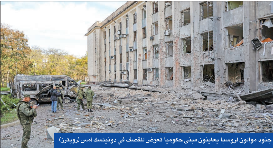
جنود مولون لروسيا يعاينون مبنى تعرض للقصف في دونيتسك أمس

مضيفاً أن «المهاجمين لقبوا حثفهما بالرصاص بعد الهجوم». يشار إلى أن الرئيس الروسي فلاديمير