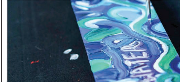
ساشا جفري، فنان

وتعزز الرياح شعورها بالحركة، بينما يدعم الماء قصادتنا العنابية ومؤلفاتنا وبشكل مماثل، تمنحنا الإنسانية الحب والدعم والتواصل بين النفوس.