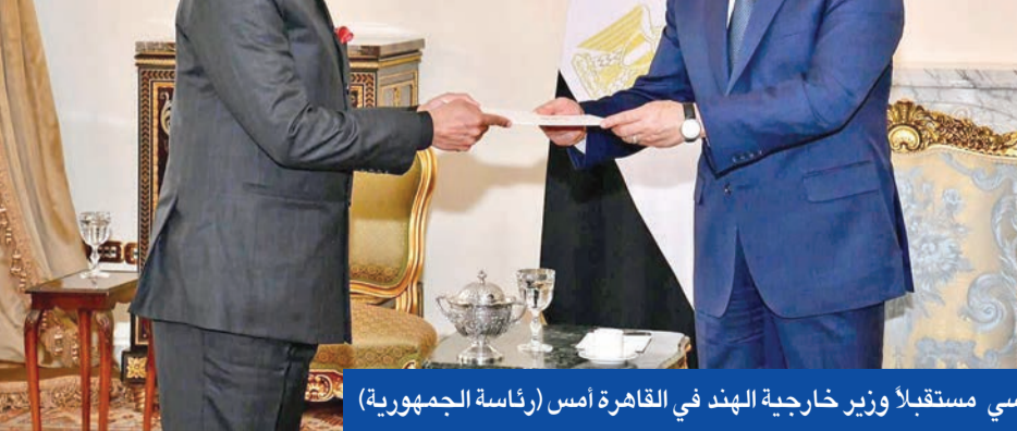
السياسي مستقبلاً وزير خارجية الهند في القاهرة أمس