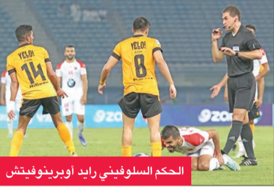
الحكم السلوفيني رايد أوبرينوفيتش

بالتوازي مع ارتفاع مستوى مباريات الجولة السابعة من منافسات دوري زين الممتاز، استعاد الحكام مستواهم المميز، الذي غاب بصورة كبيرة خلال الجولة الماضية.