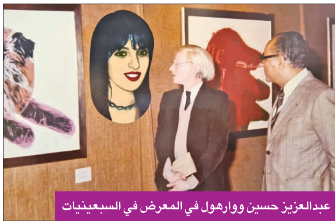
عبدالعزيز حسين ووارهول في المعرض في السبعينيات

جاليري وعضوا نشطا في المجلس الوطني للثقافة والفنون والآداب. ولفت إلى أنه كان هناك اهتمام بحضور الفنان وارهول للكويت، باعتباره فناً عالمياً، وخاصة بعد أن أقام معرضه في إيران، بدعوة من الإمبراطورة فرح ديبا، بعد أن تمت دعوته لعمل بورتريتها للعائلة الحاكمة. وذكر ياسين أنه أراد عرض أعماله في الكويت، خصوصاً معرض سلطان جاليري، من أجل إثناء القصة.