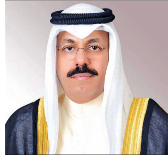
أحمد نواف الأحمد

وبموجب إعادة التشكيل، خرج من الحكومة الجديدة 8 وزراء، هم: نائب رئيس الوزراء وزير الدولة لشؤون مجلس الوزراء د. محمد الفارس، ووزيرة الدولة لشؤون البلدية ووزيرة الدولة لشؤون الاتصالات وتكنولوجيا المعلومات د. رنا الفارس، ووزير الخارجية الشيخ د. أحمد المنصور، ووزير الدولة لشؤون مجلس الأمة، وزير الدولة لشؤون الإسكان والتطوير العمراني د. خليفة الحميدة، ووزير التربية وزير التعليم العالي والبحث العلمي د. منى الرفاعي، ووزير العدل وزير الأوقاف والشؤون الإسلامية، وزير الدولة لشؤون تعزيز النزاهة د. محمد بووزير، ووزيرة الشؤون الاجتماعية والتنمية المجتمعية وزيرة الدولة لشؤون المرأة والطفولة المستشارة هدى الشايجي، ووزير النفط حسين إسمايل.