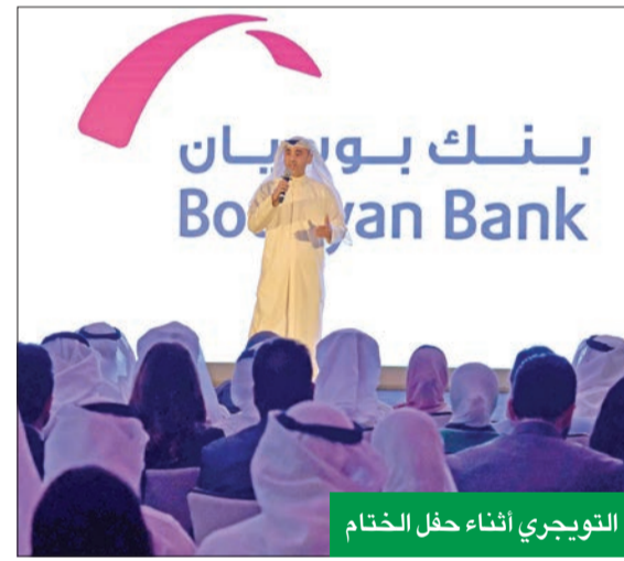
التوجيه أثناء حفل الختام

المالية الخاصة بها، بما يعزز ريادة الأعمال ضمن القطاع التكنولوجي الواعد. في سياق متصل، أعرب المشاركون في البرنامج من