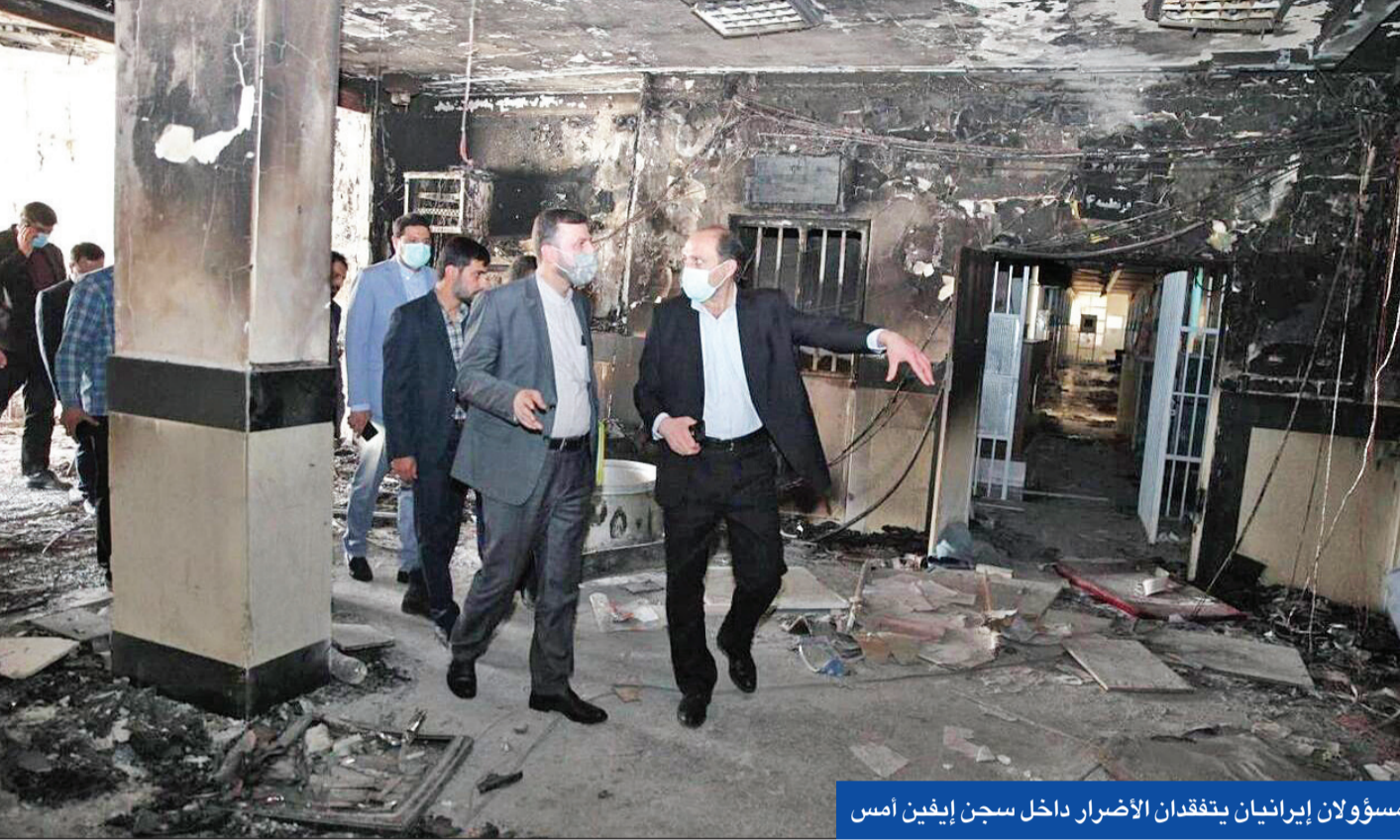
مسؤولان إيرانيان يتفقدان الأضرار داخل سجن إيفين أمس

الأمّن القومي قاسم الاعرجي، طهران، أمس الأول، لبحث القصف الذي يشنه «الحرس الثوري» على مواقع بإقليم كردستان والذي تكثف وسط اتهامات من قبل طهران للمعارضة الكردية الانفصالية بتأجيج الاحتجاجات بالمناطق الغربية من إيران.