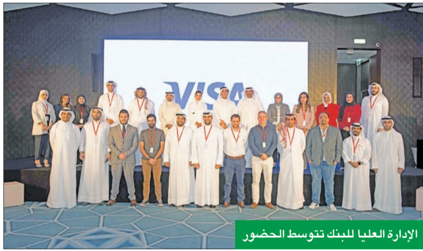
الإدارة العليا للبنك تتوسط الحضور

مختلف القطاعات والمجالات، موجهين الشكر والتقدير لكل القائمين على البرنامج في «بوبيان»، DIFC FinTech Hive بالتعاون مع Boubyan Accelerator، الذي أطلقه أخيراً التابع لمركز دبي المالي العالمي، والذي يهدف إلى تسريع نمو وتوسع الشركات الناشئة في مجال التكنولوجيا، بجميع أشكالها، وإطلاق أفكارهم، وتسريع تطبيقاتها بتميز ونجاح.