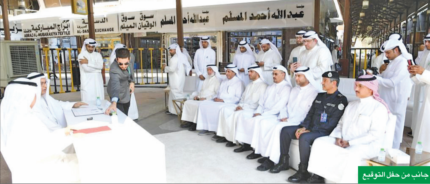
جانب من حفل التوقيع