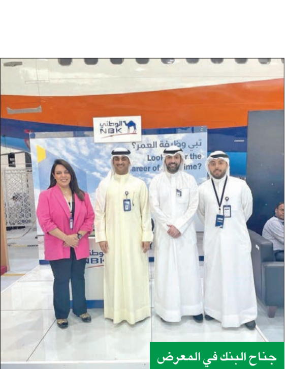
جناح البنك في المعرض