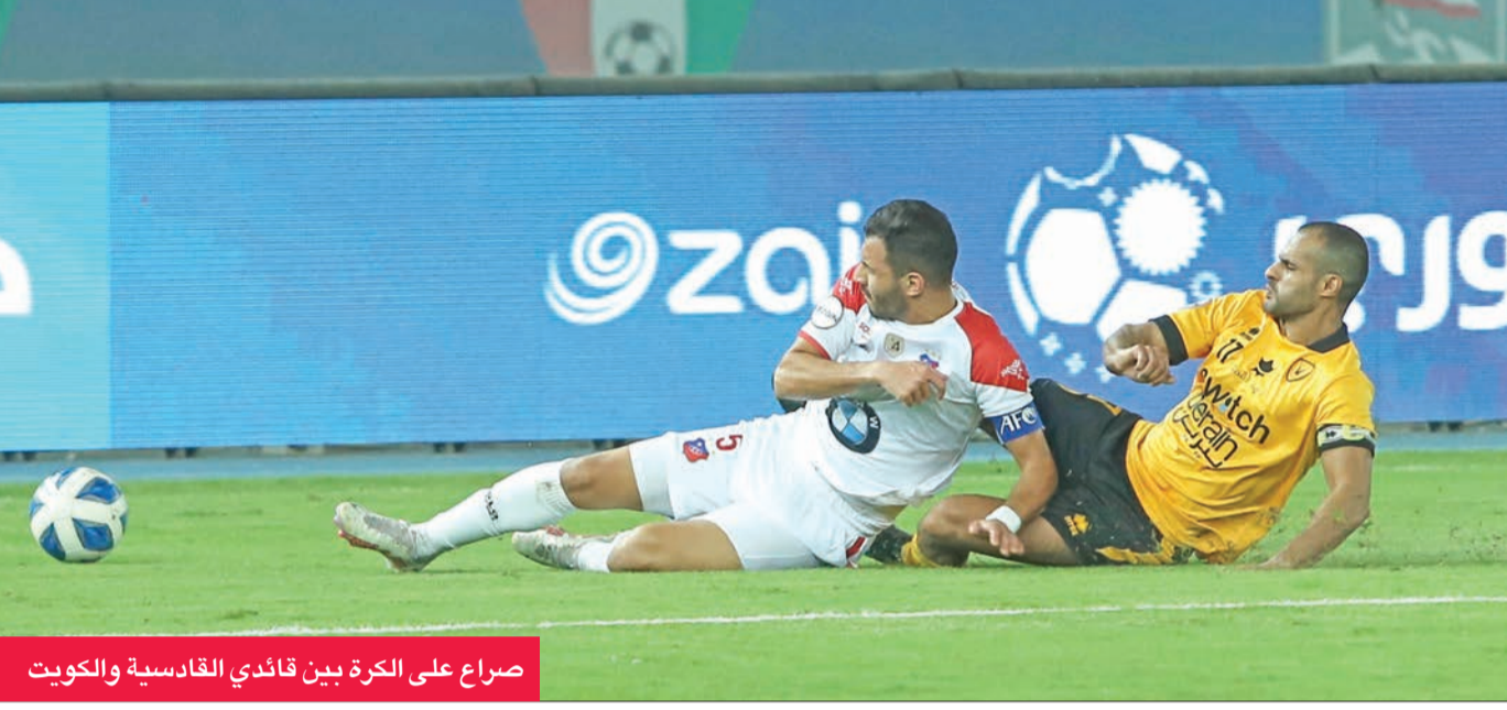
صراع على الكرة بين قائدي القادسية والكويت