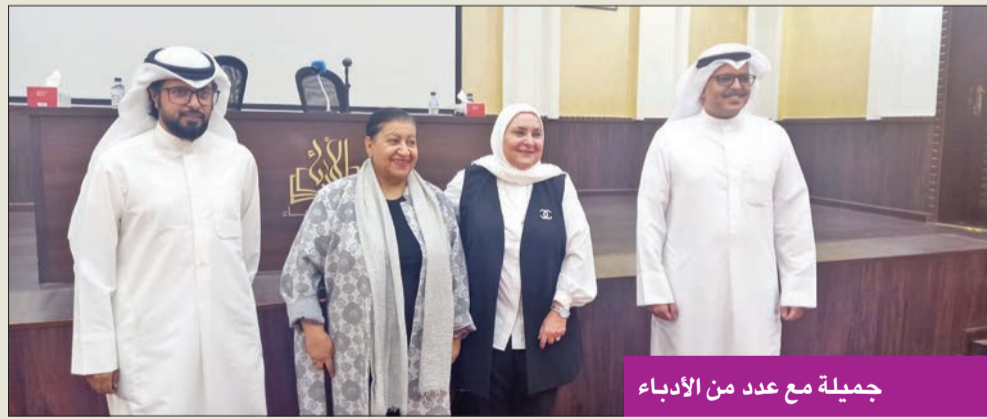
جميلة مع عدد من الأدباء

«نعيش هذا النوع من الآداب في تفاصيل حياتنا اليومية»