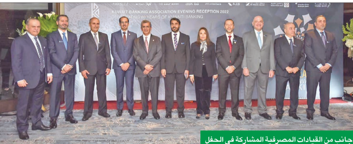
جانب من القيادات المصرفية المشاركة في الحفل

المصرفية من تمويل واستثمار ومجالات أخرى، وتسلط الضوء على التقدم الذي أحرزته الكويت على أكثر من صعيد، لاسيما فيما يتعلق بإجراءات الإصلاح المالي والاقتصادي وتحديث التشريعات نحو اقتصاد أكثر تنافسية ومناخ أعمال أفضل، فضلاً عما يشهده القطاع المصرفي من تطور هائل في مجال التكنولوجيا المالية، وتقديم أحدث الخدمات المصرفية والحلول المالية المتوافقة مع تلك التي تقدمها البنوك الرائدة حول العالم.