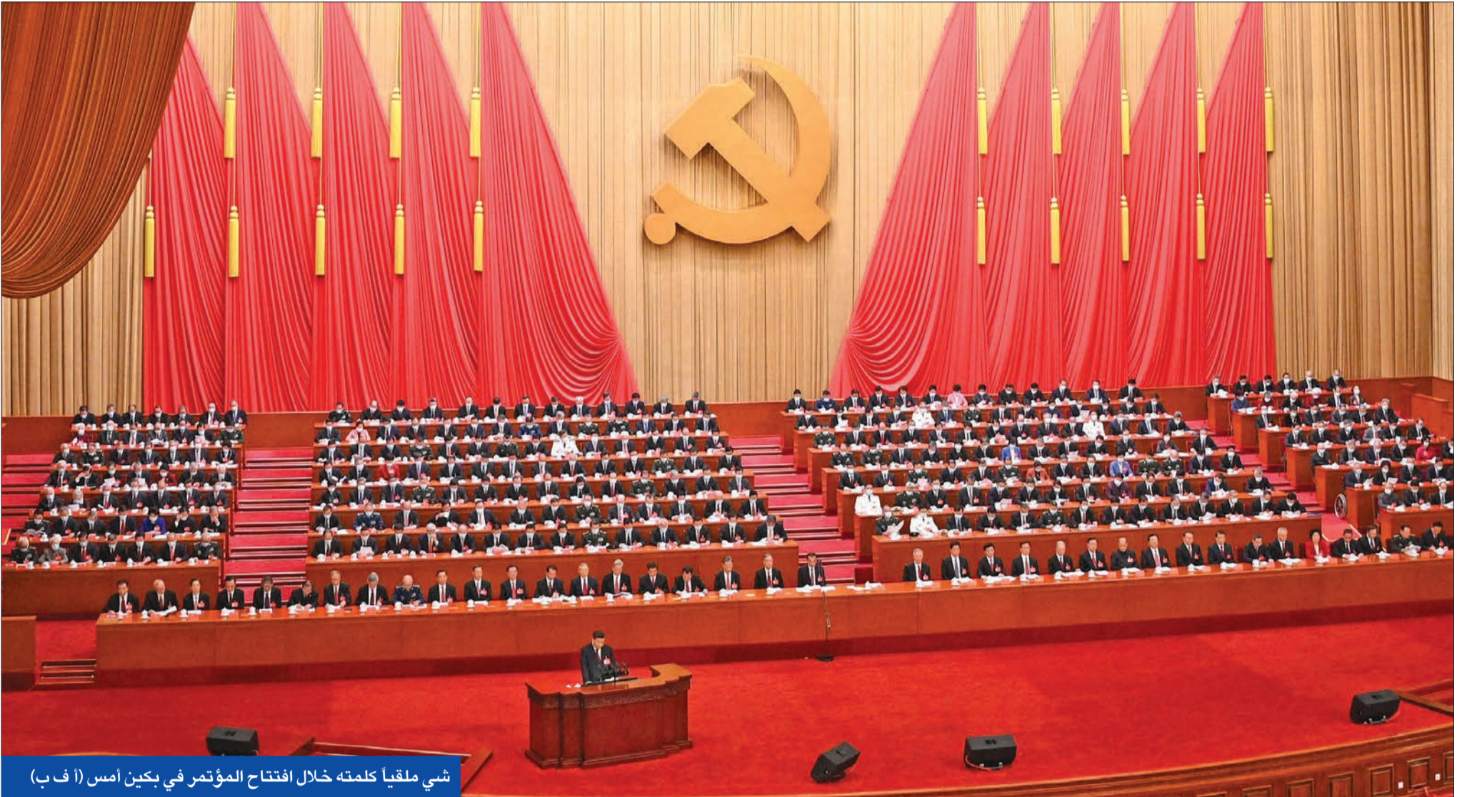
شي ملقيا كلمته خلال افتتاح المؤتمر في بكين أمس

حذر خلال افتتاح مؤتمر الحزب الشيوعي من «عواصف خطيرة» وتمسك بخيار القوة في تايوان