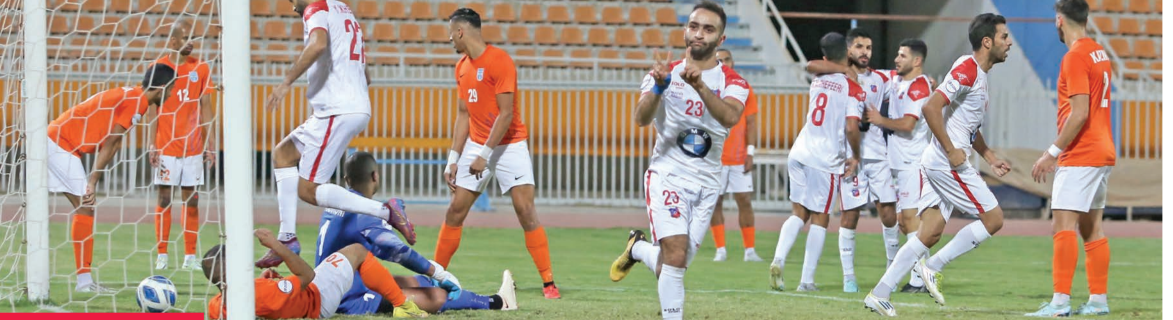
عموري يحتفل بهدفه في شبك ككتوني

كاظمة والكويت مستوى رائع... والنصر عاد والفحيحيل حقق هدفه