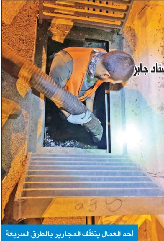
أحد العمال ينظف المجاري بالطرق السريعة

وأكدت أن كشوفات «ممتازة» معلمي الجهراء والفروانية