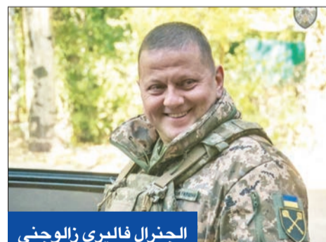
الجنرال فاليري زالوجني

الصحيفة، فكان أول قرار له أن القوات في دونباس لن تضطر إلى طلب إذن لإطلاق النار للرد على نيران العدو، في توسيع لحرية الجنود.