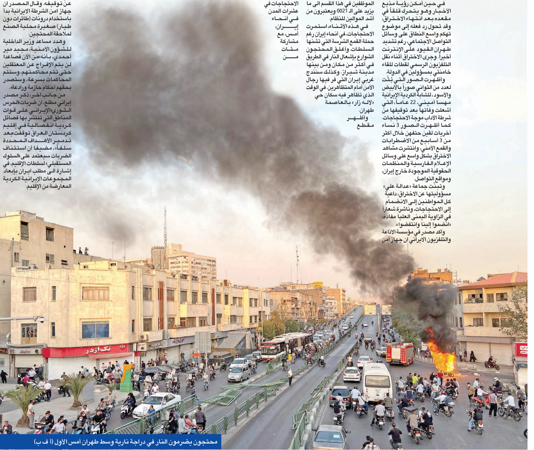
محتجون يضرمون النار في دراجة نارية وسط طهران أمس الأول

نشر رئيس وزراء الهند، ناريندرا مودي، أمس، تهنئة للمسلمين بذكرى المولد النبوي، في خطوة لاقت استحساناً من جانب مغربين حول العالم. وكتب مودي عبر «تويتر»: «أطيب الأمنيات بمناسبة المولد النبوي، أدعو أن تعزز هذه المناسبة روح السلام، والوحدة، والتعاطف في مجتمعنا، عيد مبارك، وعلق الداعية الإماراتي وسيم يوسف على تغريدة مودي: «تسامح رائع وجميل، تمنى لك الخير، ولايمحي الله بلدك، كنا سعداء جداً بالتغريدة، والتي تجسد العيش المشترك بين الأديان».