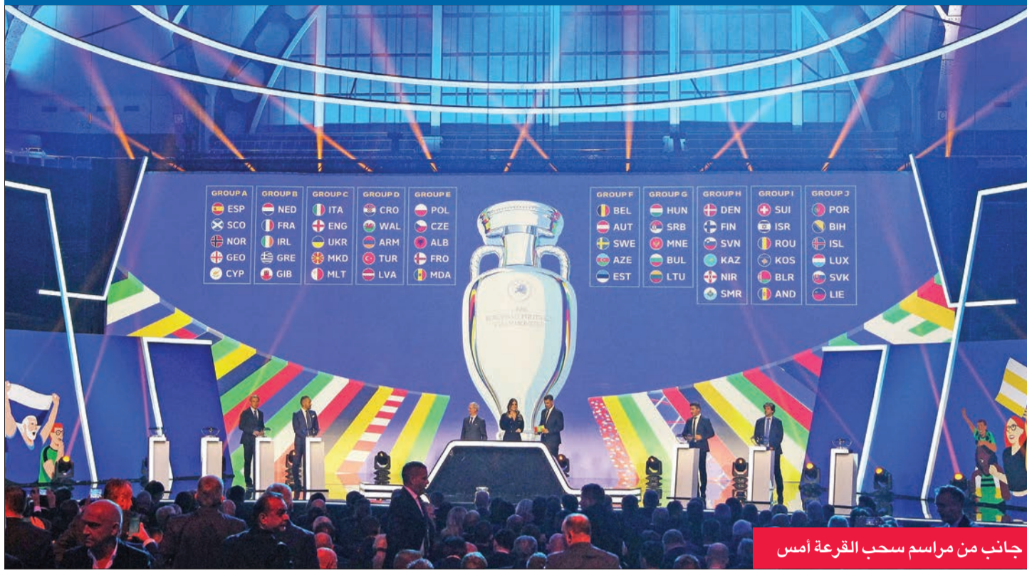
جانب من مراسم سحب القرعة أمس

تكون سهلة بطبيعة الحال، لكن الأجل بينها ستكون المواجهة ضد إنكلترا». وعلق مدرب فرنسا ديديه ديشان على القرعة، بقوله: «إنها مجموعة قوية، وذات نوعية. يتعين علينا الفوز، وأن نكون أفضل من منافسينا».