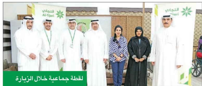
لقطة جماعية خلال الزيارة

نظم قطاع التواصل المؤسسي في البنك التجاري الكويتي زيارة خاصة لنزلاء دار رعاية المسنين التابعة لوزارة الشؤون الاجتماعية والعمل لمشاركتهم اليوم العالمي لكبار السن.