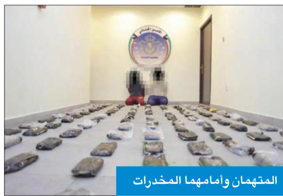
المتهمان وأمامهما المخدرات

مادة الحشيش المخدرة اعترف المهريان بنيتها إلقاءها في البحر وتحديد موقعها تهديداً لتسليمه والمخدرات إلى تاجر مخدرات في الكويت.