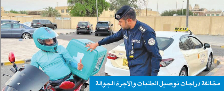
مخالفة درجات توصيل الطلاب والأجرة الجواله

مخالفة تظليل الزجاج، و101 مخالفة خروج أصوات من العادم، وتحجير 264 مخالفة شركات الأجرة والتوصيل، وتحجير 422 مخالفة سرعة. وذكر بوحسن أن الحملات أسفرت عن إحالة 10 وأفدين إلى جهات التخصص بتهمة انتهاك الإقامة، كما تمكنت من ضبط 6 أشخاص تبين أنهم مطلوبون لادارة العامة لتنفيذ الأحكام، وكذلك ضبط 7 أشخاص ارتكابهم مخالفات مرورية جسيمة وإحالتهم إلى نظارة المرور، فضلاً عن ضبط 6 مركبات مطلوبة لجهات أمنية وقضائية، وإحالة 18 حدثاً إلى نيابة الأحداث.