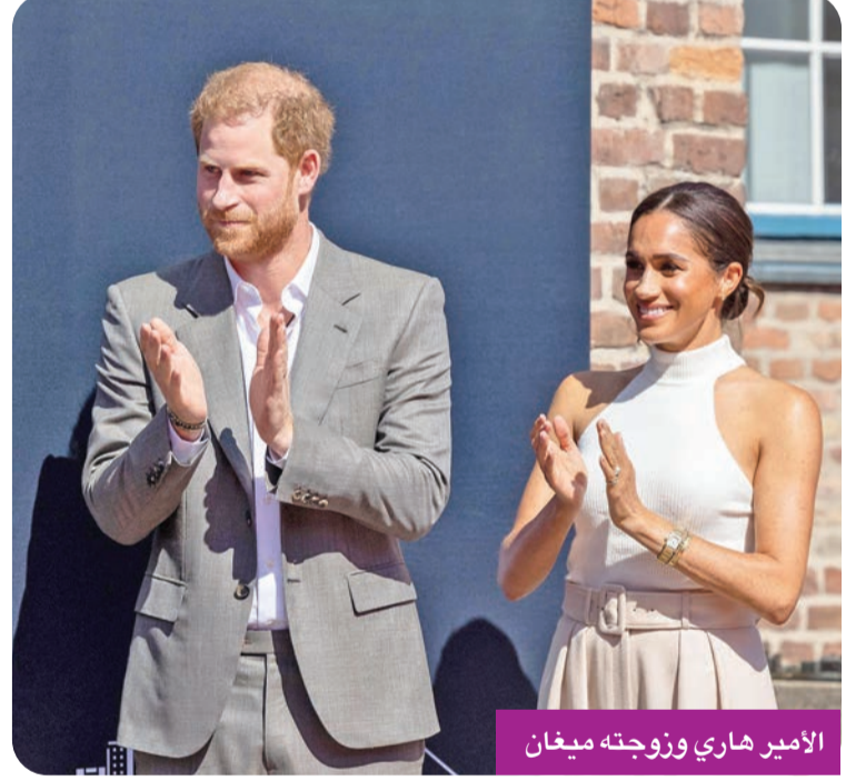
الأمير هاري وزوجته ميغان

وقال المتحدث باسم دار أسوشيتيد نيوزبيرس: «نفتد بشكل كلي لا ليس فيه هذا التشويه المنافي للمنطق الذي يبدو أنه لا يزيد على كونه محاولة مخطط لها مسبقاً لإقحام الصحف التي تحمل اسم ميل في فضيحة التجسس على الهواتف والمتعلقة بمقالات منشورة قبل ما يصل إلى 30 عاماً». كان هاري، دوق ساسكس، قد رفع بالفعل عدداً من الدعاوى القضائية على مطبوعات لاسوشيتيد نيوزبيرس، ويقاضي حالياً صحيفة ميل أون صنداي، بسبب مقال ذكر أنه حاول الاحتفاظ بتفاصيل سرية عن معركة قانونية لاستعادة حماية الشرطة، وحصل في العام الماضي على تعويضات من نفس الصحيفة، بسبب مزاعم بأنه أدار ظهره لمشاة البحرية الملكية. كما فازت زوجته ميغان بدعوى على دار النشر في ديسمبر تتعلق أيضاً بالخصوصية لنشرها رسائلها الخاصة، وتضمنت أجزاء من خطاب بخط يدها أرسلته لوالدها توماس ماركل في أغسطس 2018.