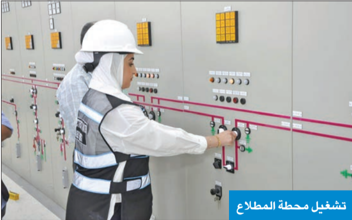
تشغيل محطة المطالع

وكانت الوزارة قد نجحت الأسبوع الماضي في إطلاق التيار في أولى المحطات جهد 400 كيلو فولت ضمن المرحلة الأولى لإطلاق التيار الكهربائي في مدينة المطالع.