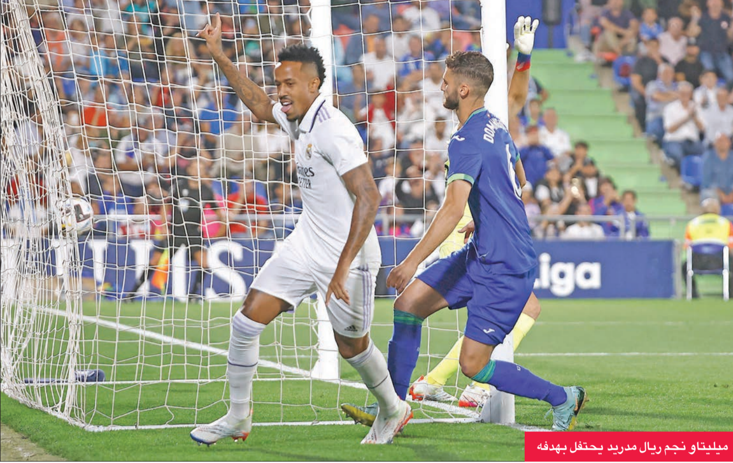
ميليتا و نجم ريال مدريد يحتفل بهدفه

حقق ريال مدريد فوزاً صعباً 1-0 على أرضه مع أوساسونا، في المرحلة السابعة، مشرعاً الباب أمام غريمه الكتالوني لاعتلاء الصدارة نهاية الأسبوع الماضي، للمرة الأولى منذ قرابة العامين، إثر فوزه على ريال مايوركا. و غاب عن صفوف فريق المدرب الإيطالي كارلو أنشيلوتي المهاجم الفرنسي كريم بنزيمة بسبب «مشكلة عضلية»، علماً أنه أهدر ركلة جزاء حاسمة ضد أوساسونا مع عودته إلى المنافسات بعد غيابه قرابة الشهر بسبب الإصابة. وشارك أيضاً في الفوز على شاخار دانييتسك 1-2 منتصف الأسبوع في دوري أبطال أوروبا، إلا أنه لم يتحضر مع الفريق الجمعة بعد انتكاسة جديدة.