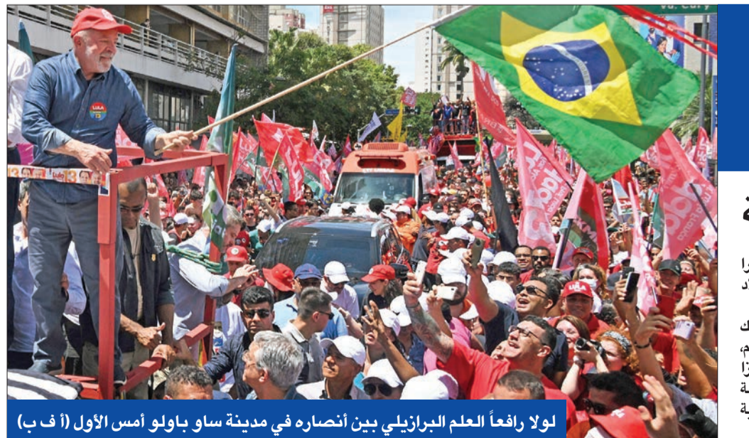
لولا رافعا العلم البرازيلي بين انتصاره في مدينة ساو باولو أمس الأول

طلب رئيس قرغيزستان، صابر جباروف، من برلمان بلاده، النظر بشكل مفتوح في اتفاق لترسيم الحدود ينهي الأزمة مع أوزبكستان، التي تؤدي إلى اشتباكات بين الحين والآخر والشهر الماضي دخل البلدان في هدنة هشة بعد اشتباكات أوقعت قتلى، وقال جباروف: «في القرى والجبال والسهول تم حل 99% من المناطق المتنازع عليها والاتفاق عليها لصالحنا»، مؤكداً أنه تم بذل جهود كبيرة من أجل التوصل إلى اتفاق، لكنه أضاف أن بعض التفاصيل سرية حتى لا يفيل الطرف الآخر رأيه قبل المصادقة على المعاهدة».