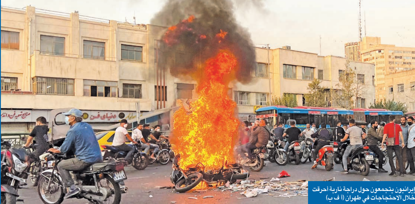
إيرانيون يتجمعون حول دراجة نارية أحرقت خلال الاحتجاجات في طهران