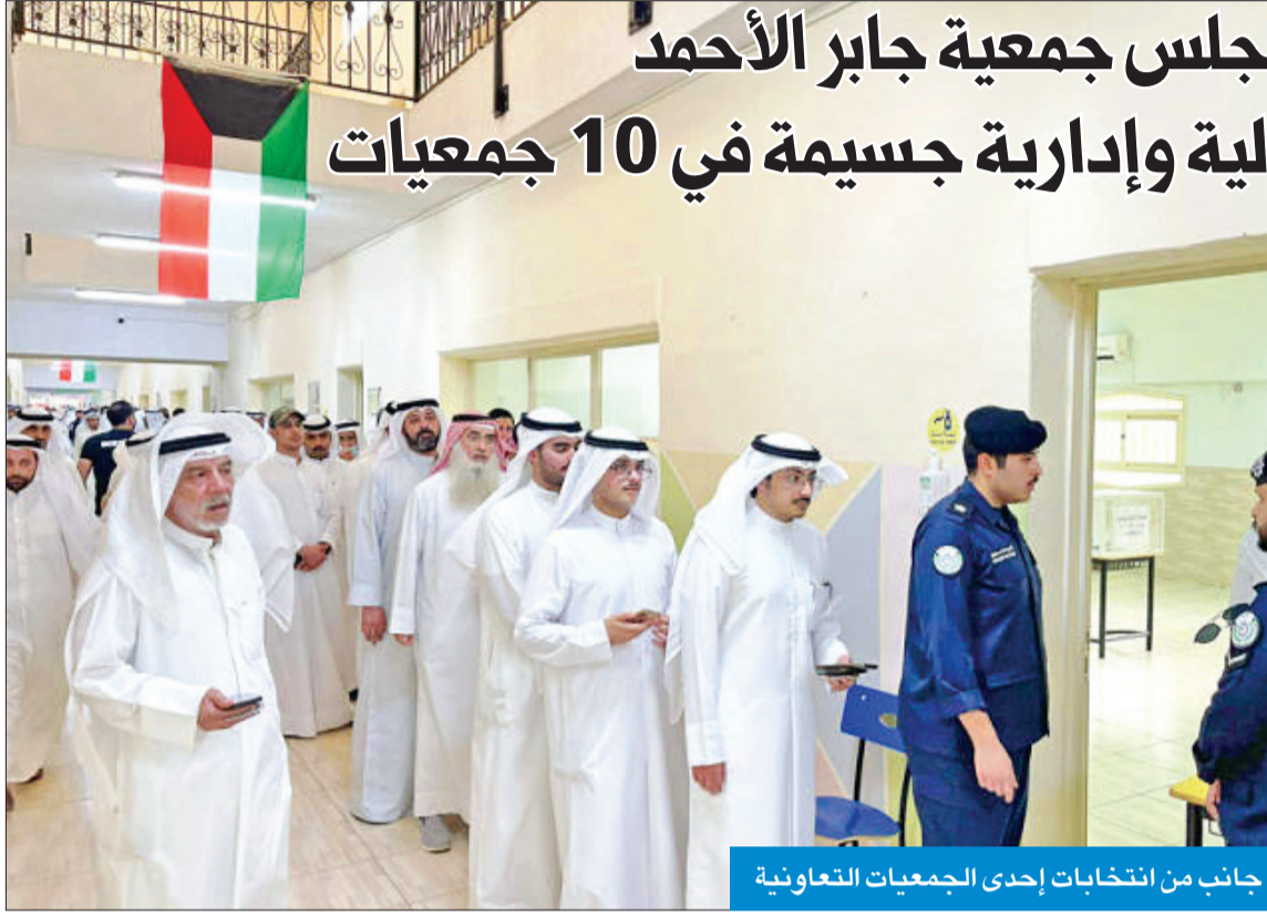
جانب من انتخابات إحدى الجمعيات التعاونية

ووفقاً لمصادر «الشؤون» فإنه من المتوقع أن تمدد اللجنة العليا أعمال هذه اللجان ليستنى لها استكمال عمليات المراجعة على هذه الجمعيات، من ثم ترفع تقاريرها النهائية التي تؤكد صحة المخالفات المرصودة مؤكدة بالأدلة والمستندات لكل مخالفة على حدة، موضحة أنه عقب ذلك ترفع اللجنة هذه التقارير إلى وزير الشؤون الذي يتخذ بدوره القرار المناسب حيال المخالفات.