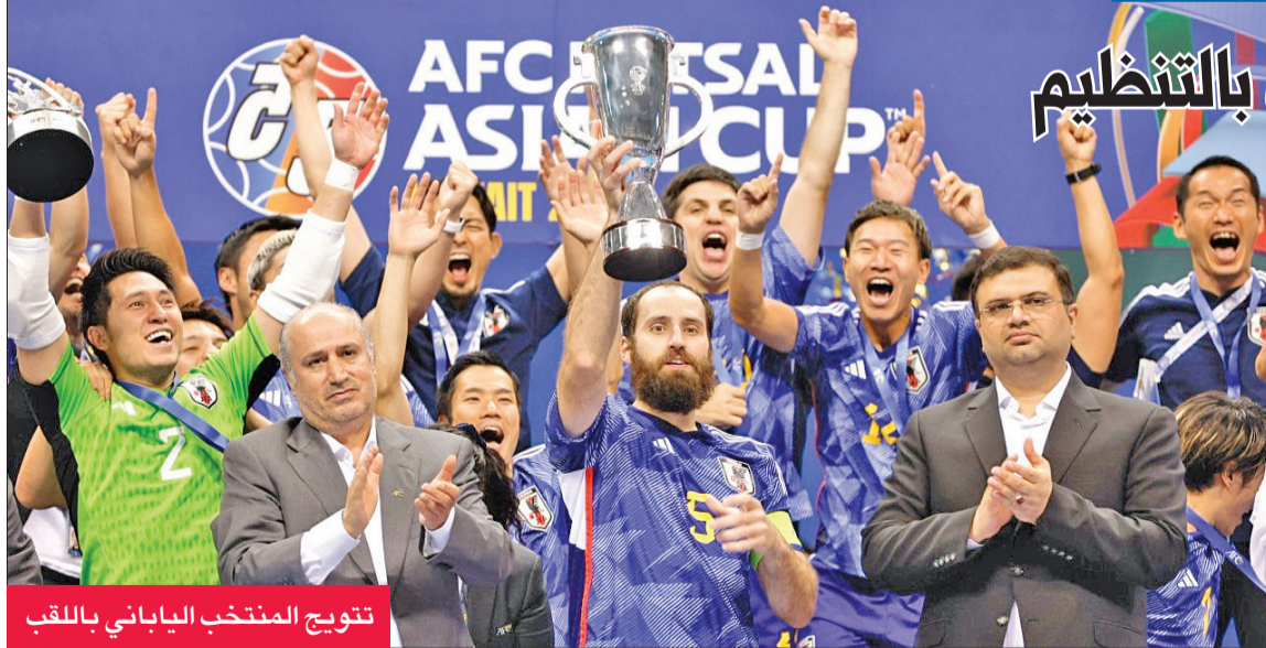
تتويج المنتخب الياباني باللقب