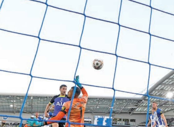
هاري كين نجم توتنهام يحرز هدفة

استعاد توتنهام هوتسبر توازنه في البريميرليج بانتصاره الصعب خارج قواعده على برايتون أند هوف البيون بهدف دون رد في اللقاء الذي جمعتهما السبت ضمن الجولة العاشرة من الدوري الإنجليزي الممتاز لكرة القدم. وبيدين «السبيرز» بالفضل في هذا الانتصار الثمين الذي تحقق على ملعب «فالمر»، لجنمه وهدافه هاري كين صاحب هدف النقاط الثلاث في الدقيقة 22.