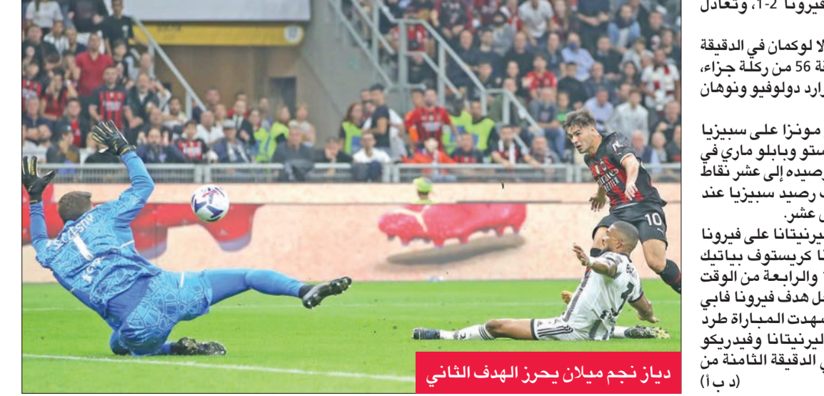
ديان نجم ميلان يحرز الهدف الثاني

66 انتصارا لميلان وانتهت 73 مواجهة بينهما بالتعادل. وفي الدقيقة الأولى من الوقت بدل الضائع للشوط الأول تقدم فيكاو توموري بهدف لميلان بعد ضربة ركنية من الناحية اليمنى قابلها المهاجم الفرنسي أولمبييه جيرو بتسديدة قوية لكن الكرة اصطدمت برمييه توموري الذي نجح في السيطرة على الكرة وسدد بشكل مباشر في شباك يوفنتوس.