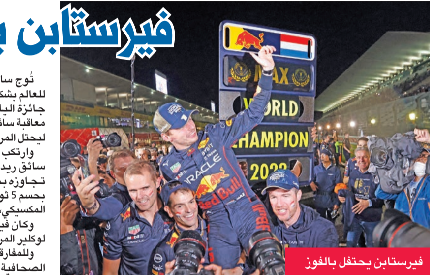
فيرستابن يحتفل بالفوز

الكبرى أنه توج بطلاً للعالم لسباقات للمرة الثانية توالياً. وتقدم فيرستابن بفارق 113 نقطة عن بيريس، و114 نقطة عن لوكلير، ولن يستطيع أحد من السائقين اللحاق به حسابياً، حيث تتبقى 112 نقطة فقط في السباقات الأربعة القادمة حتى نهاية الموسم. وتم تعليق السباق في اللفة الثالثة، بسبب الأمطار الغزيرة، قبل أن يستأنف بعد توقف أكثر من ساعتين. وكان فيرستابن أحرز باكورة القابيه الموسم الماضي بسباق ابوظبي في ظروف مثيرة للغاية أيضاً عدم حسمه في اللفة الأخيرة لدى تجاوزه البريطاني لويس هاميلتون سائق مرسيدس، ويحرم الأخير من الانفراد بالرقم القياسي في عدد الألقاب في بطولة العالم الذي يتقاسمه مع الأسطورة الألماني ميكاييل شوماخر (7 لكل منهما).