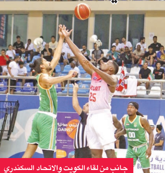
جانب من لقاء الكويت والاتحاد السكندري

تغلب على الاتحاد السكندري بنتيجة 74 - 72، فيما فاز الأهلي المصري على الرياضي اللبناني 88 - 71، وتخطى الأهلي البحريني نظيره البشائر العماني 68 - 62، وتفوق دجلة الجامعة العراقي على وداد بوفاريك الجزائري 86 - 66، وفاز الغرافة القطري على الميناء اليمني 78 - 73، فيما خسر الجهراء من بيروت اللبناني بنتيجة 84 - 88. ويبدو الأبيض الكويتي وصيف النسخة السابقة، الأقرب لعبور منافسه الميناء اليمني اليوم، والتأهل لدور الثمانية. نظراً للفارق الفني الكبير بين الفريقين، كما يبدو الاتحاد السكندري هو الآخر الأوفر حظاً للفوز على الغرافة القطري لذات السبب، وسيحاول كاظمة الذي سيلتقي الوداد الجزائري بدوره تحقيق الفوز والتأهل للدور ربع النهائي، غير أن محاولاته لن تكون سهلة نظراً للمستوى الفني لمنافسه، فيما تتساوى فرص الأهلي البحريني مع نظيره دجلة الجامعة العراقي لخطف بطاقة العبور لدور الثمانية لتقارب مستواهما.