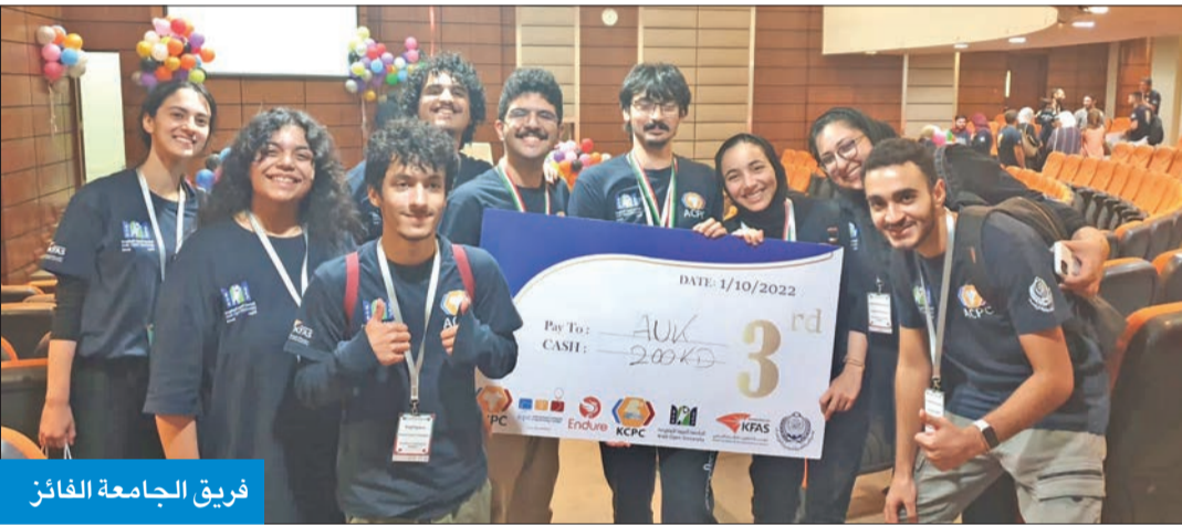
فريق الجامعة الفائز

بتنافس فيها مئات من الطلبة من عدة دول في الشرق الأوسط. وأضاف أن الجامعة حرصت على تشجيع الطلبة لخوض مسابقات تحثي تجربتهم الجامعية، وتؤهلهم للنجاح في الواقع العملي، حيث يتعلم الطلبة التعاون في بيئة مليئة بالتحديات.