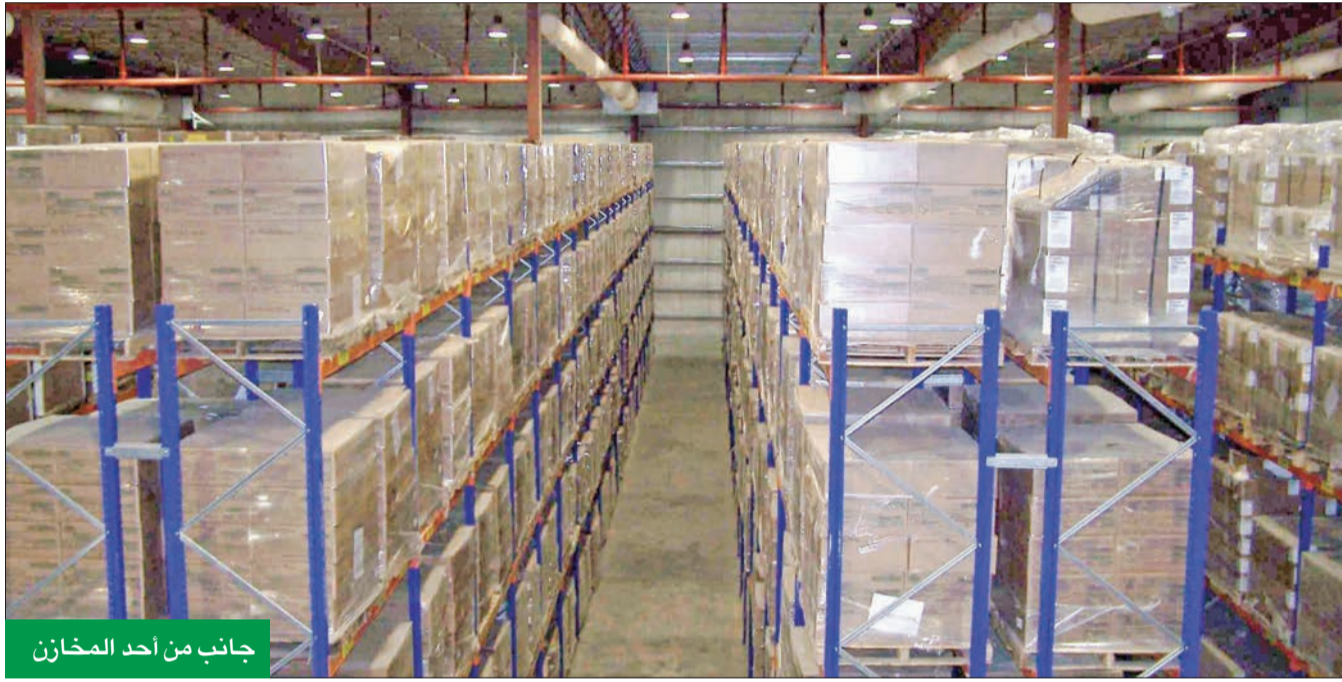
جانب من أحد المخازن

ويبين الشهران أن تكاليف التخزين تستقطع جزءاً كبيراً من إرسامال المشروع، وهذا يشكل عبئاً على أصحاب المشاريع، موضحاً أن الحملة التي أطلقتها بلدية الكويت إلى الآن لم يظهر تأثيرها على السوق، وإن كانت مستحقة. وأشار إلى أن السوق بحاجة إلى توفير مخازن بمساحات كبيرة وبمختلف مناطق الدولة، حيث إن هناك طلباً مرتفعاً ويجب تغطيته، حتى لا تتأخر، سواء بتقص المخازن أو بارتفاع أسعارها، مشيراً إلى أن هناك هجرة لدول الجوار، بسبب عدم توافر أساسيات المشروع، ومنها المخازن العمالة.