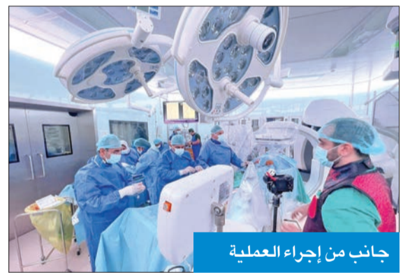
جانب من إجراء العملية

نجح استشاريو الجراحة بمستشفى جابر في إجراء عملية نادرة ومقدمة، عبارة عن «قسطرة الشريان الأورطي المتقدمة لعلاج امراض تمدد الشريان الأورطي البطني والصوري».