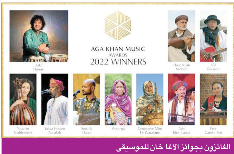
الفائزون بجوائز الآغا خان للموسيقى

جمع الموسيقى العمانية وتوثيقها وحفظها ونشرها. وغداة الإعلان عن أسماء الفائزين أعربت لجنة تحكيم الجوائز الرئيسية عن رغبتها في دعم أكبر عدد ممكن من المرشحين البارزين في تنوعهم الجغرافي والثقافي لما يقارب 400 ترشيح في وقت الحاجة الملحة للموسيقيين ومعلمي الموسيقى.