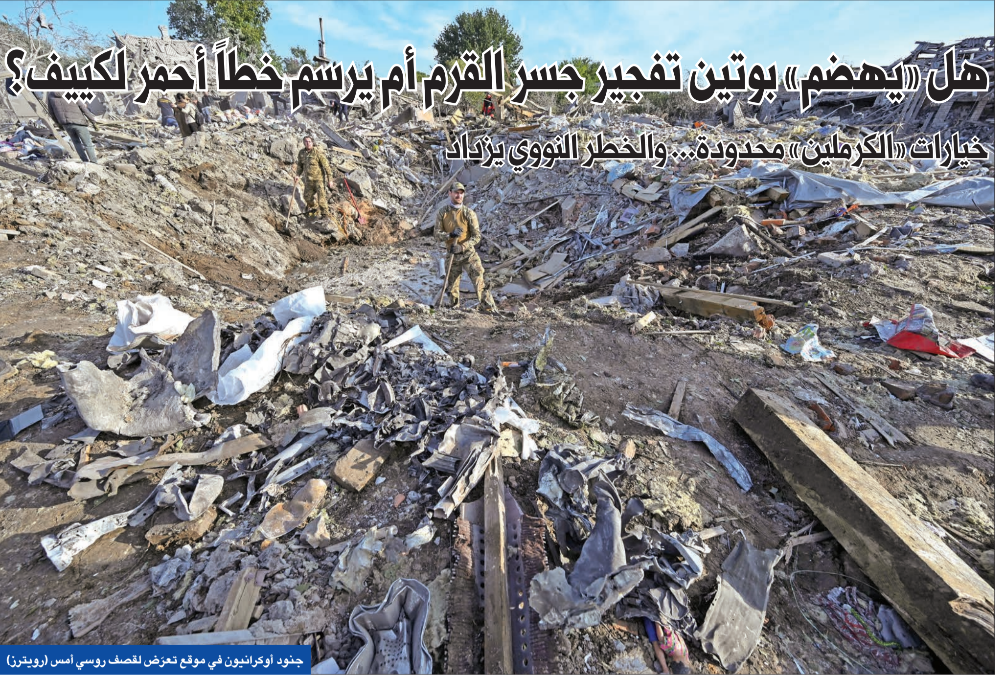
جنود أوكرانيون في موقع تعرض لقصف روسي أمس

خيارات «الكرملين» محدودة... والخطر النووي يزداد