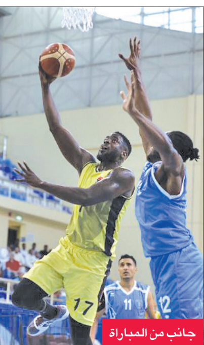
جانب من المباراة

الجهراء، والأهلي المصري، والميناء اليمني، ودجلة الجامعة العراقي للراحة، بعد أن خاضت منافسات اليوم الأول.