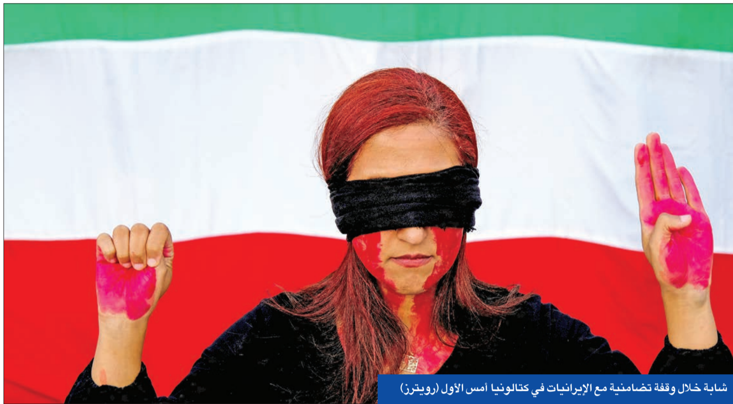
شابة خلال وقفة تضامنية مع الإيرانيات في كاتالونيا أمس الأول

تحولت الاحتجاجات في إيران التي بدأت بسبب الحجاب إلى تحرك أوسع يرفع مطالب اقتصادية واجتماعية يقودها الجيل الشاب الذي يعاني إحتباطاً، والطبقة الوسطى التي تعاني التآكل بسبب الأزمة الاقتصادية الناتجة عن الفساد وسوء الإدارة والعقوبات.