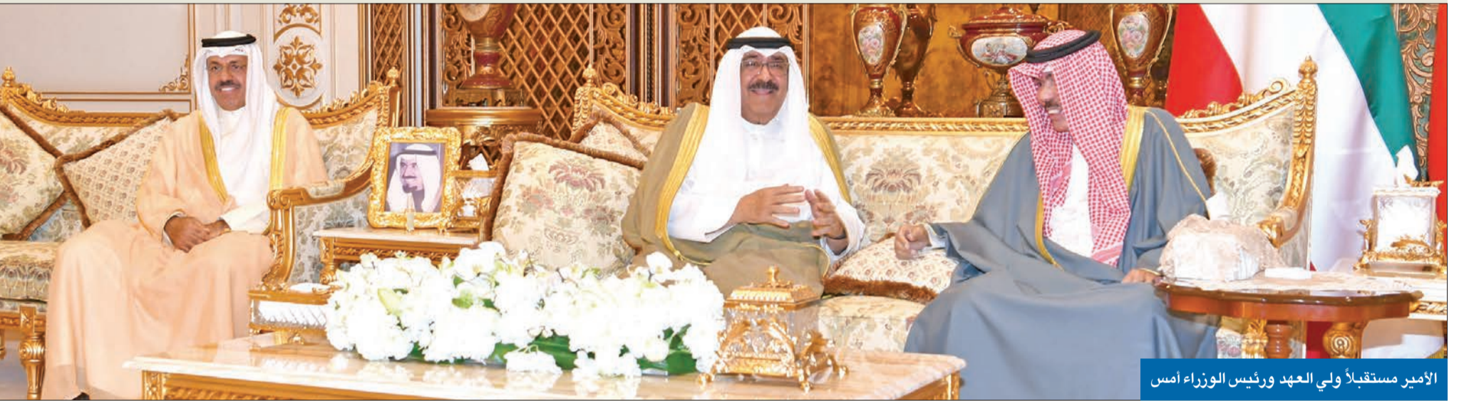
الأمير مستقبلاً ولي العهد ورئيس الوزراء أمس

خلال استقبال صاحب السمو له بمناسبة تعيين أحمد النواف رئيساً للحكومة الـ 41