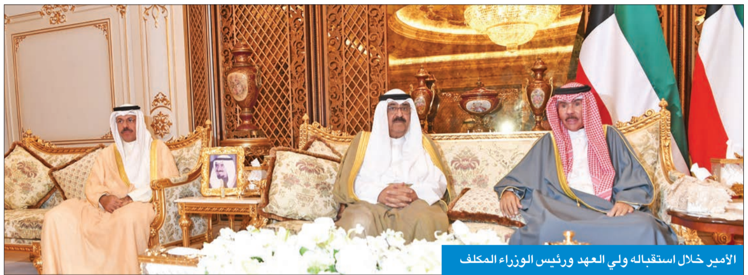
الأمير خلال استقباله ولي العهد ورئيس الوزراء المكلف

السوزراء وتكليفه بترشيح أعضاء الوزارة الجديدة. ونص الأمر الصادر عن الديوان الأميري، أمس، على أنه بعد الإطلاع على الدستور، وعلى الأمر الأميري الصادر بتاريخ 15 نوفمبر 2021 بالاستعانة بسمو ولي العهد لممارسة بعض اختصاصات الأمير الدستورية، وعلى الأمر الأميري الصادر بتاريخ 2 أكتوبر 2022 بقبول استقالة رئيس مجلس الوزراء، وبعد المشاورات التقليدية، أمرنا بالآتي: