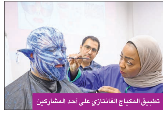
تطبيق المكياج الفانتازي على أحد المشاركين

ذكر الفنان البحريني ياسر سيف أن الهدف الأساسي لورشة التدريب يكمن في التركيز على أهمية المكياج المسرحي، باعتباره عنصراً مهماً من عناصر سينوغرافيا العرض المسرحي، ومن الضروري إتقانه ومعرفة كيفية وضعه وتوظيفه واستثماره.