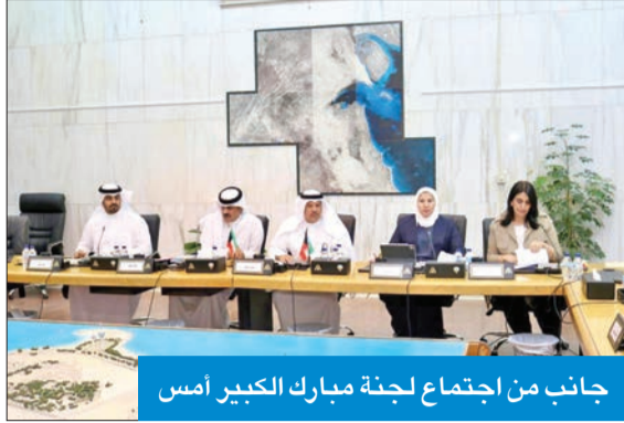
جانب من اجتماع لجنة مبارك الكبير أمس

وافقت لجنة مبارك الكبير في المجلس البلدي على إعادة النظر في مشروع تقسيم إحدى القسام بممنطقة الفينطيس، وحفظت اللجنة في اجتماعها أمس، برئاسة نصار العازمي، استعجال الرد بشأن طلب وزارة الدفاع استكمال إجراءات قرار التخصيص لموقع خاص بقيادة القوة الجوية بمنطقة صبحان، بينما أحالت اللجنة للجهاز التنفيذي طلب إقامة معرض ترفيهي للأطفال، لحين عرض الدراسة الفنية بالتوافق مع لائحة المعارض.