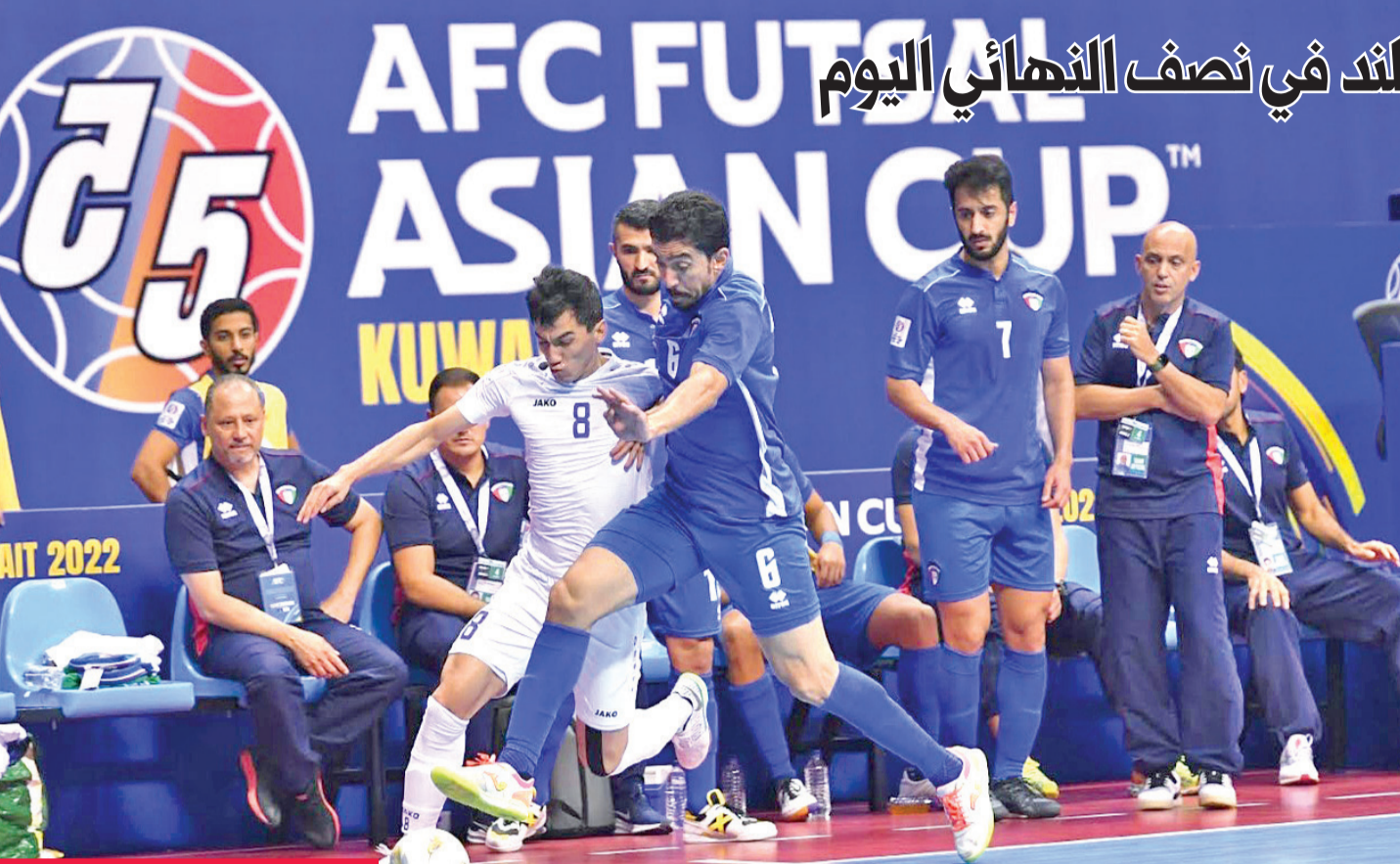
جانب من مباراة الكويت وأوزبكستان

خسر منتخبنا الوطني أمام نظيره الأوزبكي صفر-3 أمس الأول، ليودع بطولة كأس آسيا للصالات من دور الثمانية، في حين يقام نصف نهائي البطولة اليوم.