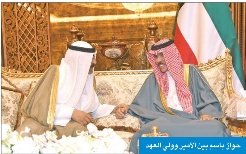
حوارٌ باسم بين الأمير وولي العهد