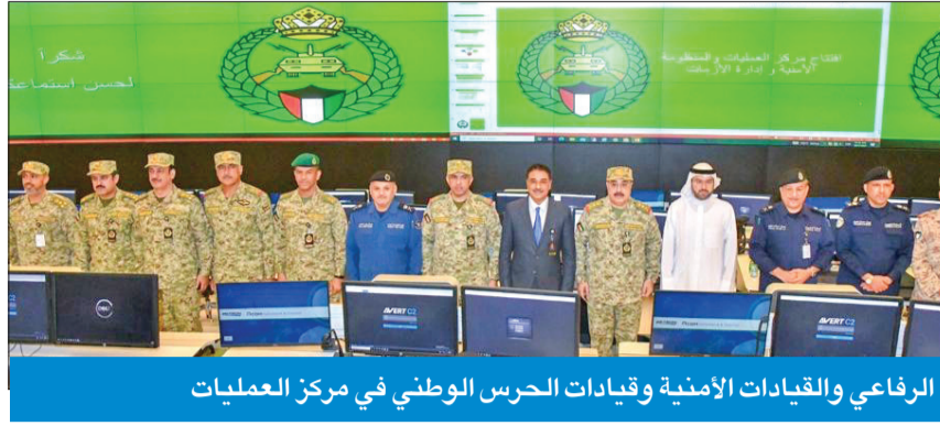
الرفاعي والقيادات الأمنية وقيادات الحرس الوطني في مركز العمليات

والمؤسسات، لاسيما الموقعة لبروتوكولات تعاون معه، وإدارة العمليات المشتركة وتنسيق الجهود في مواجهة الأزمات وحالات الطوارئ.