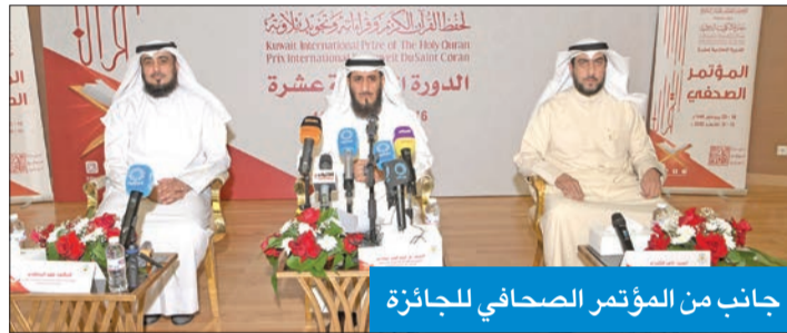
جانب من المؤتمر الصحافي للجائزة