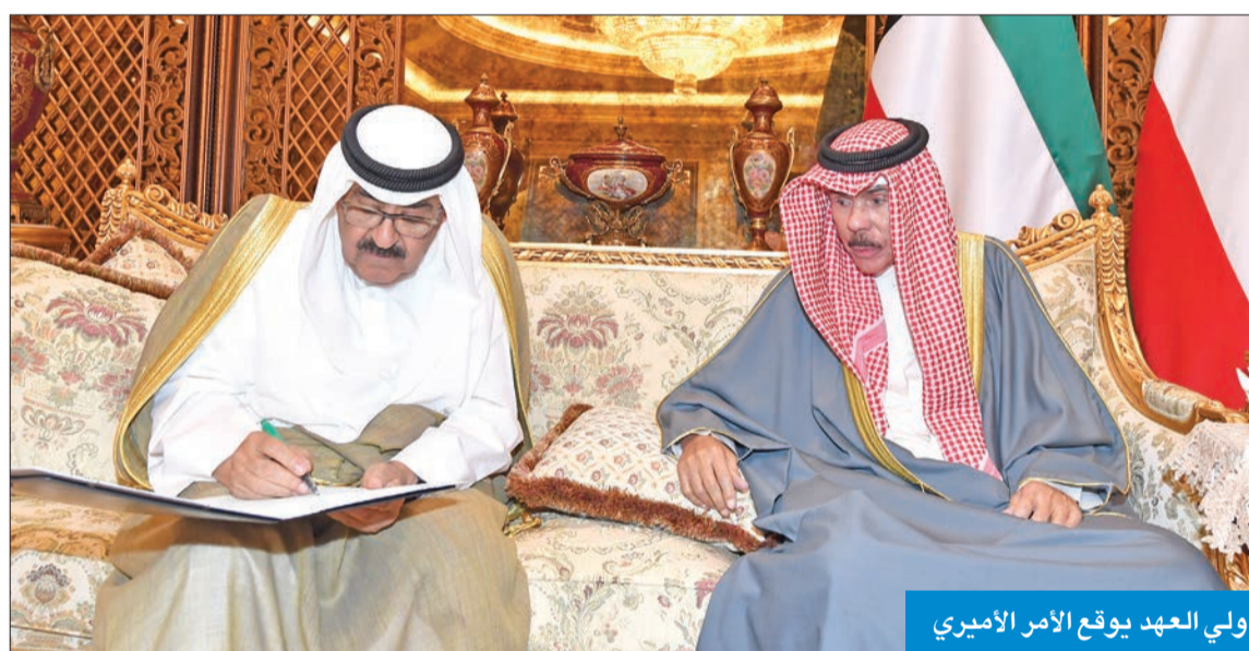
ولي العهد يوقع الأمر الأميري

وبالتزامن، صدر أمر أمير، عن سمو ولي العهد، بتعيين سمو الشيخ أحمد نواف الأحمد رئيساً لمجلس الوزراء، وبعد المشاورات التقليدية، أمرنا بالآتي: