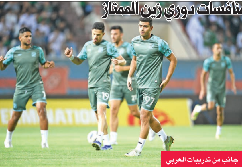
جانب من تدريبات العربي

يستضيف فريق الساحل لكرة القدم نظيره النادي العربي عند الساعة والربع من مساء اليوم على استاد نادي الشباب بالأحمدي، في افتتاح منافسات الجولة السادسة من منافسات دوري زين الممتاز. وكان العربي أنهى الجولة الخامسة في المركز السادس بـ 6 نقاط، بعد أن حقق فوزه الأول في المسابقة على الجهاد، بهدفين من دون رد، في حين تعادل الساحل مع التضامن بهدف لكل فريق، ليضع أول نقطة في رصيده بالمركز الأخير. ويتصدر الكويت المسابقة برصيد 12 نقطة، ويفارق نقطة واحدة عن كاظمة (الوصيف)، وفي المركز الثالث فريق السالمية بـ 8 نقاط، ومن ثم الجهاد والقادسية، ولكل منهما 7 نقاط، وفي المراكز السابع والثامن والتاسع يتواجد الفحيحيل والنصر والتضامن على الترتيب.