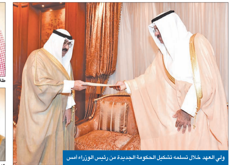
ولي العهد خلال تسلمه تشكيل الحكومة الجديدة من رئيس الوزراء أمس