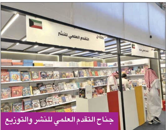
جناح التقدم العلمي للنشر والتوزيع