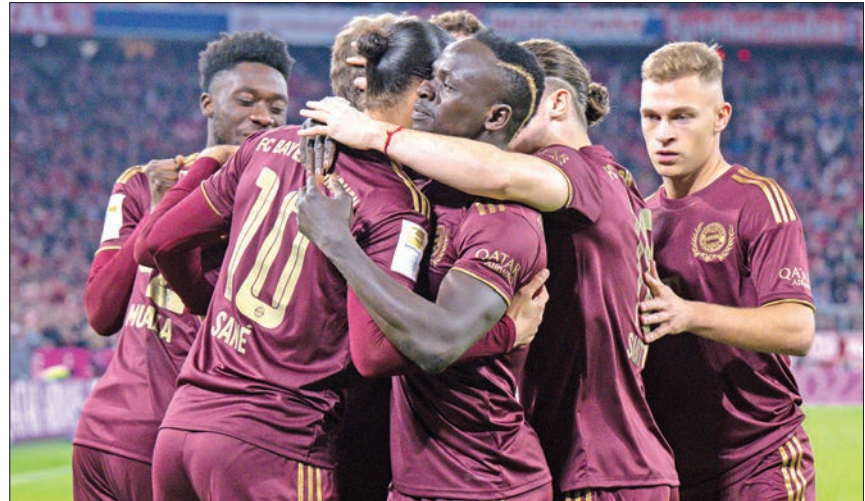
فرحة لاعبي بايرن ميونخ بالفوز

فرصة الابتعاد بصدارة الدوري الألماني لكرة القدم بخسارته على ملعب ضيفه كولن 2-3 أمس في المرحلة الثامنة من البطولة، والتي شهدت الخسارة الأولى ليونيون برلين هذا الموسم بسقوطه على ملعب اينتراخت فرانكفورت صفر - 2، وتقدم فرايبورغ للمركز الثالث بجدول الترتيب بفضل فوزه على ضيفه ماينز 2-1.