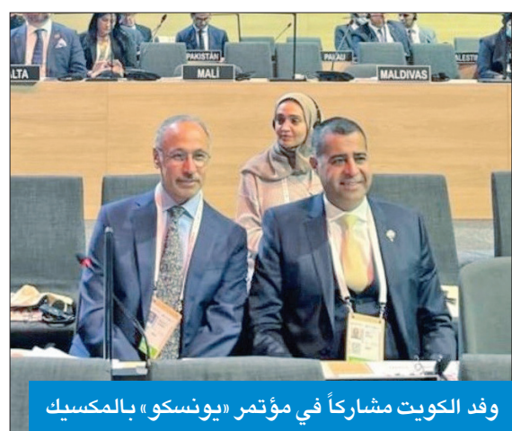
وفد الكويت مشاركاً في مؤتمر «يونسكو» بالمكسيك

القها الملا خلال مؤتمر «يونسكو» العالمي للسياسات الثقافية والتنمية المستدامة الذي عقد في المكسيك في الفترة بين 28 و30 سبتمبر الماضي.