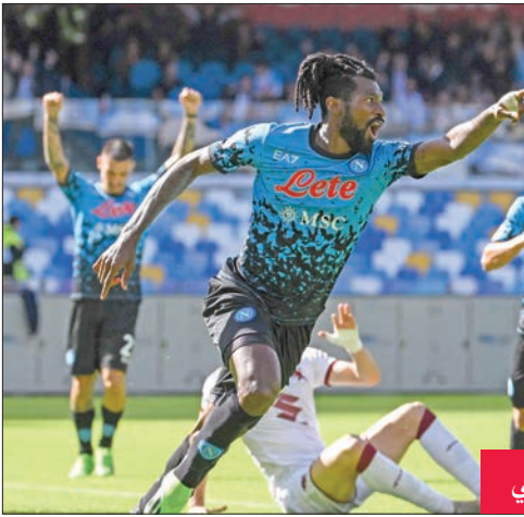
أنغوسا يحتفل بتسجيل هدفه الثاني

ومع بداية متألحة كلها بالعلامة الكاملة في الدوري بعد 6 مراحل و9 انتصارات من 9 مباريات في مختلف المسابقات هذا الموسم، يستعيد ريال جهوده مهاجمه الفرنسي كريم بنزيمة الذي عاد إلى التمارين، ومن المتوقع أن يشارك اليوم أمام أوساسونا. وقال مهاجم منتخب «الديوك»، في احتفال صحفية «ماركا»، تكريماً لأفضل اللاعبين «سأحاول أن أبذل المزيد، مضيئاً هذه يتضمن الفوز بالدوري، تسجيل الكثير من الأهداف والأهم، الاستمتاع داخل الملعب».