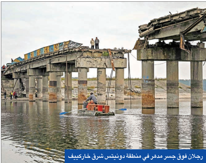
رجلان فوق جسر مدمر في منطقة دونيتس شرق خاركيف

البطريق، كثفت دول أوروبا الغربية الدوريات العسكرية لحماية إمدادات الطاقة في بحر الشمال وبقالة الساحل الإيطالي. ورخب رئيس وزراء النرويج غوناس غار ستور بمساعدة ألمانيا والمملكة المتحدة وفرنسا وأصبحت الدولة الاسكندنافية لزيادة الأمن، حيث قامت طائرات مقاتلة من طراز F35 بالتحليق فوق منصات النفط، وتم إرسال زوارق تحمل طوربيدات وفرقاطات للقيام بدوريات قرب مواقع إنتاج الطاقة في البحر. وأصبحت الدولة الاسكندنافية أكبر مورد للغاز الطبيعي لأوروبا منذ أن خفضت روسيا الإمدادات في أعقاب غزوها لأوكرانيا. وقالت إيطاليا إن أسطولها البحري سيضد الإجراءات لحماية خطوط أنابيب الغاز، التي تنقل الإمدادات من شمال أفريقيا إلى أوروبا، والموجودة أسفل البحر الأبيض المتوسط، محذرة من أنها تخشى أن تحاول روسيا استهداف البنية التحتية للطاقة، وصرحت وزيرة الداخلية الألمانية نانسي فيسر بأن الشرطة الألمانية تقوم بدوريات في بحري الشمال والبطريق «على مدار الساعة وبكل القوات التي لديها».