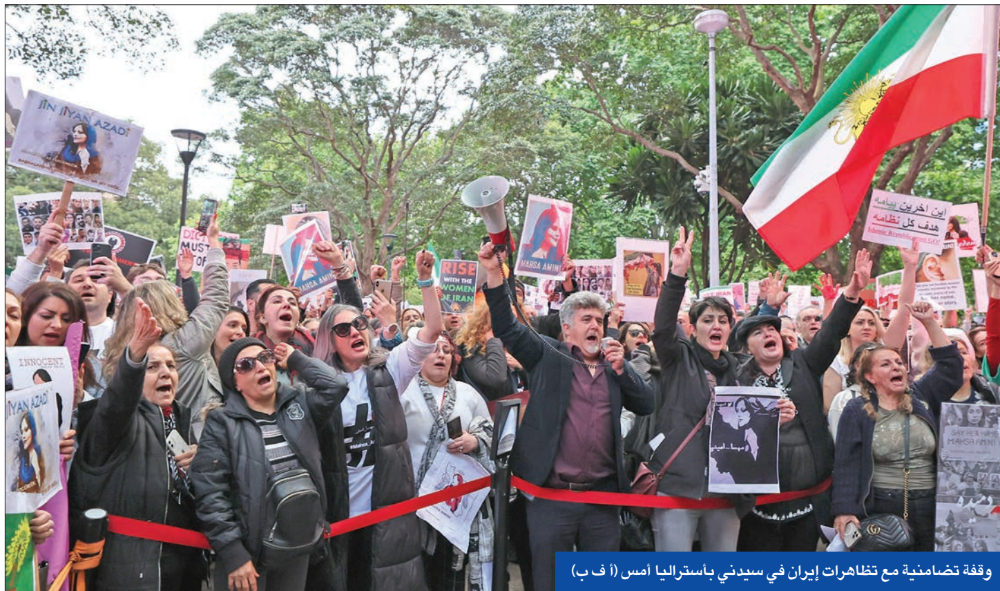
وقفة تضامنية مع تظاهرات إيران في سيدني بأستراليا أمس

في وقت دخلت التظاهرات تنديداً بمقتل الشابة الكردية، مهسا أميني، شهدت العديد من المدن الإيرانية، أمس، إضراباً شاملاً بالترزامن مع خروج احتجاجات جديدة بعدة مناطق رئيسية أبرزها العاصمة طهران واصفهان وخوزستان وكردستان ومشهد. ووفق مقاطع فيديو واردة من إيران، شهدت أسواق سنندج وماريوان وبانه في محافظة كردستان الإيرانية، وأرومية، وبوكان، ونقده، وبيرانشهر وأشنويه في محافظة أذربيجان الغربية، إضرابات عامة للتنديد بالهجمات الصاروخية التي بشنها «الحرس الثوري» على مواقع الأحزاب الكردية الإيرانية المعارضة في كردستان العراق. وأعلنت مجموعة من سائقي حافلات النقل العام والموظفين في شركة النقل بالعاصمة طهران في بيان لها انضمامها إلى الإضرابات العامة رداً على قمع السلطات الأمنية للمحتجين والمظاهرين ضد تقييد الحريات الشخصية.