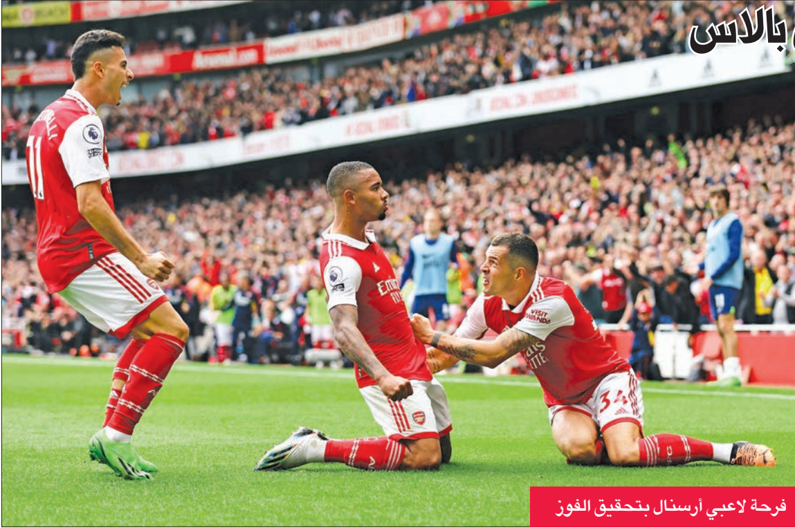
فرحة لاعبي أرسنال بتحقيق الفوز

بالخطأ في رمي فريقه في الدقيقة 64، إلا أن تروسارد سجل الهدف الثالث له (هاتريك) وفريقه في الدقيقة 84. ووقع ليفربول رصيده إلى عشر نقاط في المركز التاسع، وتوقف رصيد برايتون عند 14 نقطة في المركز الرابع.