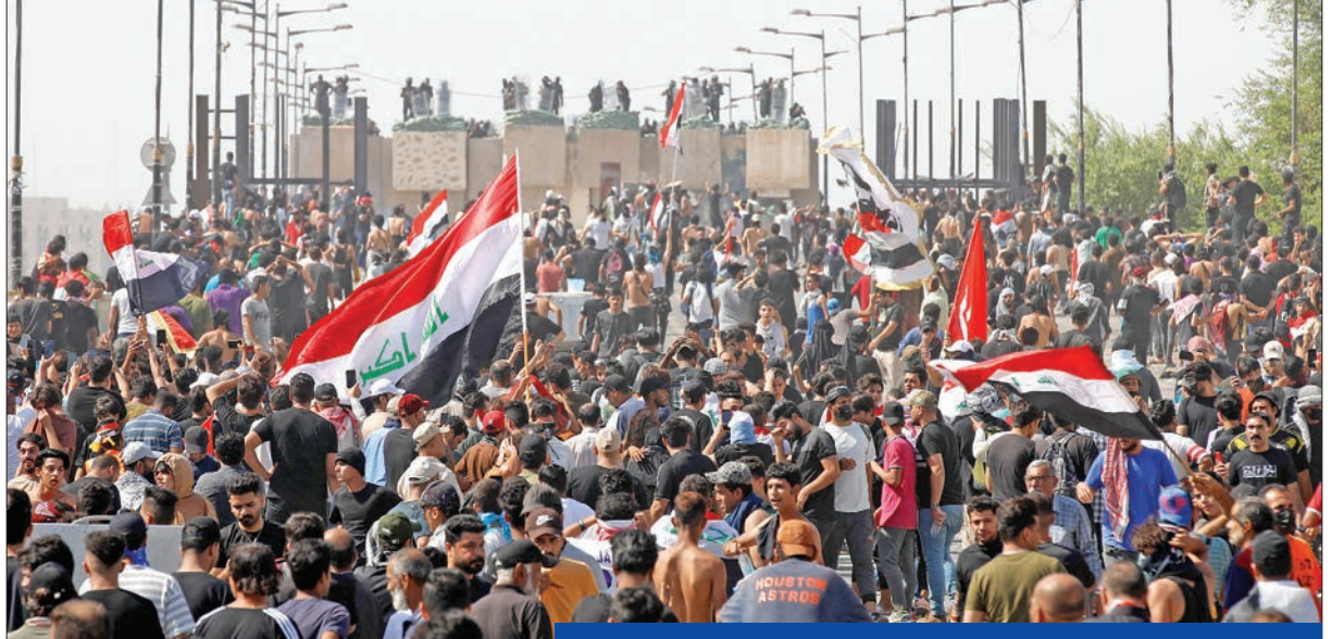
العراقيون على جسر الجمهورية المؤدي إلى المنطقة الخضراء أمس

في جميع أنحاء العراق، ولا سيما في الجنوب ذي الأغلبية الشيعية واستمرت عدة أشهر قبل أن يضعف زخمها تحت وطأة قمع تسبب في مقتل ما يقرب من 600 شخص وجرح 30 ألفاً آخرين وقيود جاحقة كورونا، وبعد ثلاث سنوات، لم يتغير شيء - أو لم يتغير شيء تقريباً.