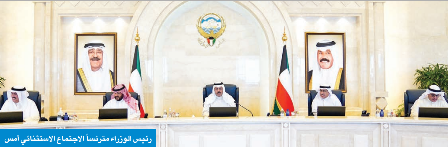
رئيس الوزراء مترأساً الاجتماع الاستثنائي أمس

المعنية، وفي مقدمتهم نائب رئيس مجلس الوزراء وزير الدفاع وزير الداخلية بالوكالة اللازم لتمكين المواطنين من أداء واجبهم الوطني وحسن تعاملهم الذي كان له دور كبير في تسهيل العملية الانتخابية. وفي مقدمتهم نائب رئيس مجلس الوزراء وزير الدفاع وزير الداخلية بالوكالة اللازم لتمكين المواطنين من أداء واجبهم الوطني وحسن تعاملهم الذي كان له دور كبير في تسهيل العملية الانتخابية. كما أبدى المجلس ارتياحه للروح الأخوية الطيبة والتعاون البناء بين السلطتين التشريعية والتنفيذية لبناء التنمية الشاملة وتعزيز الوحدة الوطنية بما يعود بالخير على المواطنين وتحقيق المصلحة العليا للوطن.