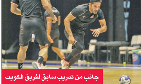
جانب من تدريب سابق لفريق الكويت

يباشر الفريق الأول لكرة اليد بنادي الكويت تدريباته المحلطة اليوم، على صالته بكيفان، تمهيداً للسفر الأربعاء المقبل إلى معسكره التدريبي الخارجي المقرر إقامته في القاهرة لمدة 12 يوماً، استعداداً للمشاركة في بطولة العالم للأندية «سوبر غلوب»، المزمع أن تستضيفها الدمام من 18 حتى 23 الجاري. وكان فريق الكويت عاد الخميس الماضي من تونس بعد انتهاء مشاركته في البطولة العربية للأندية الأبطال، والتي حصل فيها على المركز الثالث، بينما توج بلقبها نادي الترجي التونسي.