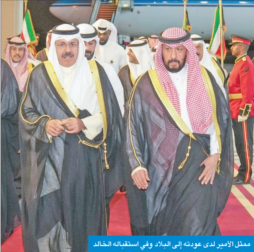
ممثل الأمير لدى عودته إلى البلاد وفي استقباله الخالد

عاد ممثل صاحب السمو أمير البلاد الشيخ نواف الأحمد، رئيس مجلس الوزراء سمو الشيخ أحمد نواف الأحمد والوفد المرافق له إلى البلاد، أمس الأول، بعد أن ترأس وفد الكويت المشارك في اجتماعات الدورة الـ 77 للجمعية العامة للأمم المتحدة.