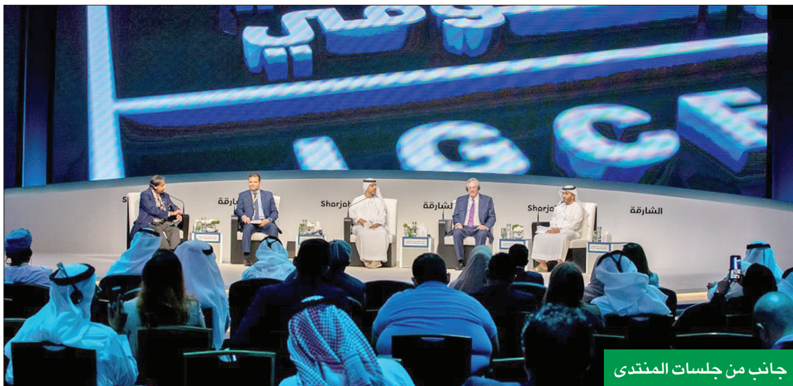
جانب من جلسات المنتدى

أكد المشاركون في جلسة «الأزمات الاقتصادية... بين الاحتواء الإيجابي والتكيف السلبي»، ضمن فعاليات اليوم الأول لـ «المنتدى الدولي للاتصال الحكومي 2022»، أن حكومات العالم تتعامل مع الأزمات الاقتصادية الأخيرة بسياسات خاطئة، وأن هذا النوع من التعامل قد ينسحب في دخول العالم في حالة ركود قوية.