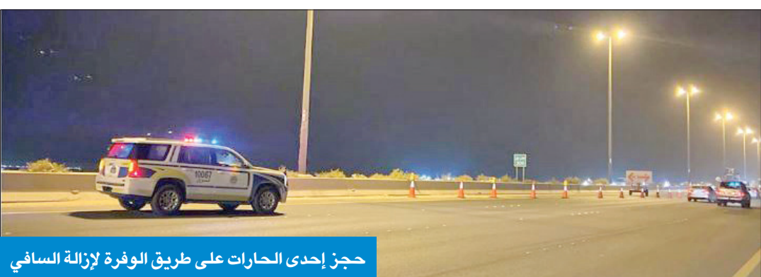
حجز إحدى الحارات على طريق الوفرة لإزالة السافي

ولفتت إلى أن أعمال تنظيف السافي على طريق أم صفق الوفرة مستمرة من قبل مقاولي الطرق، مؤكدة أنه لا توجد عقود لإزالة السافي، ويتم أعمال الإزالة لتسهيل الحركة المرورية على الطريق.