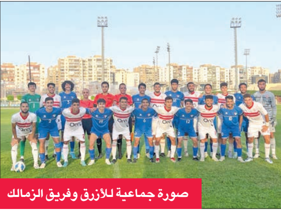
صورة جماعية للأزرق وفريق الزمالك