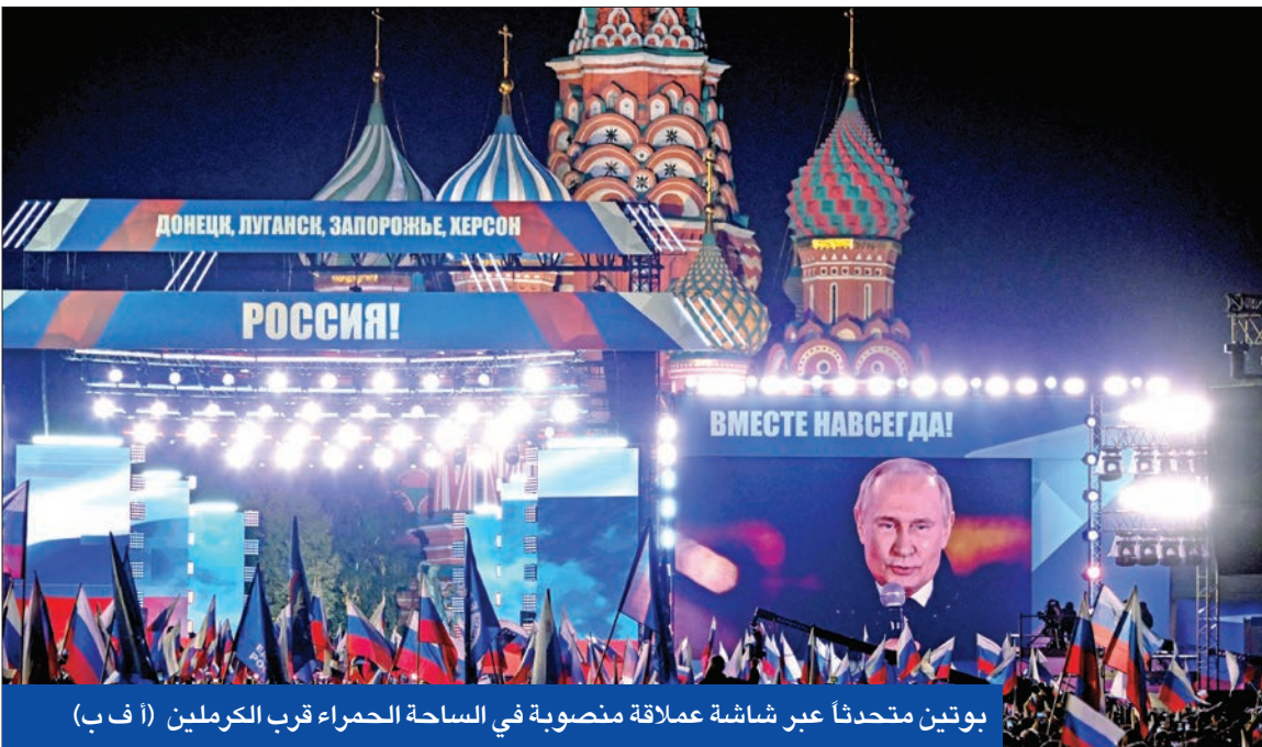
بوتين متحدثاً عبر شاشة عملاقة منصوبة في الساحة الحمراء قرب الكرملين