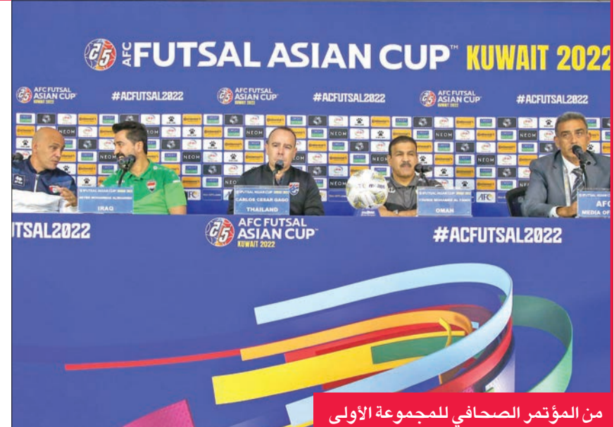
من المؤتمر الصحفي للمجموعة الأولى