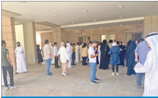
ازدحام طلابي في عمادة القبول والتسجيل