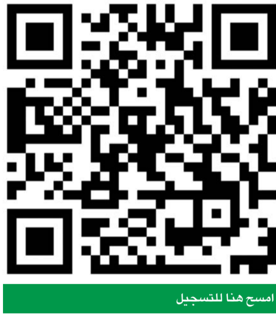
امسح هنا للتسجيل

وتابعت الروضان: «كما شهدت دورة العام الماضي أيضاً مشاركة 170 شركة ناشئة، انتقلت 25 منها إلى المحطة الأخيرة لتسريعها بصورتها النهائية، إضافة إلى أكبر عدد من رائدات الأعمال النساء في تاريخ البرنامج بأكمله، واللاتي