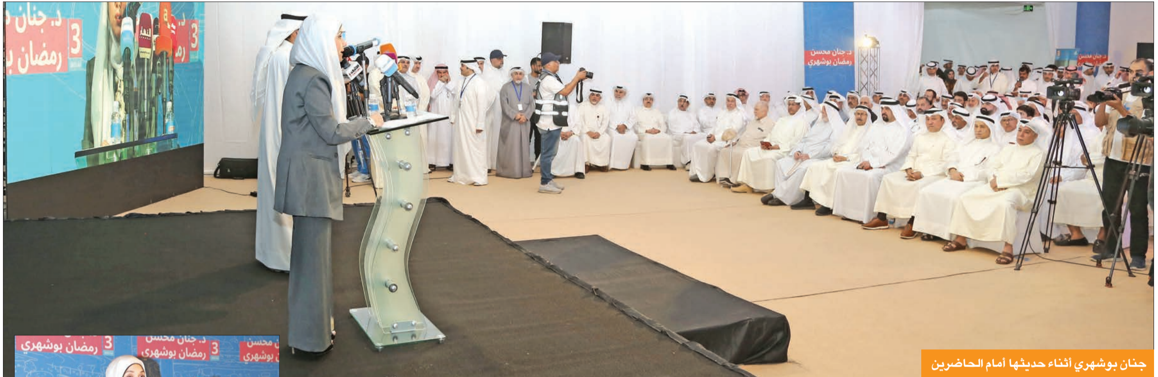
جنان بوشهري أثناء حديثها أمام الحاضرين

أكدت مرشحة الدائرة الانتخابية الثالثة الوزيرة السابقة د. جنان بوشهري، أنه لا سبيل للإصلاح دون إصلاح السلطات الثلاث، وأن النهج الذي تغير اليوم هو نهج الفساد، ونهج اختراق الدستور، والاعتداء عليه وكسر القوانين.