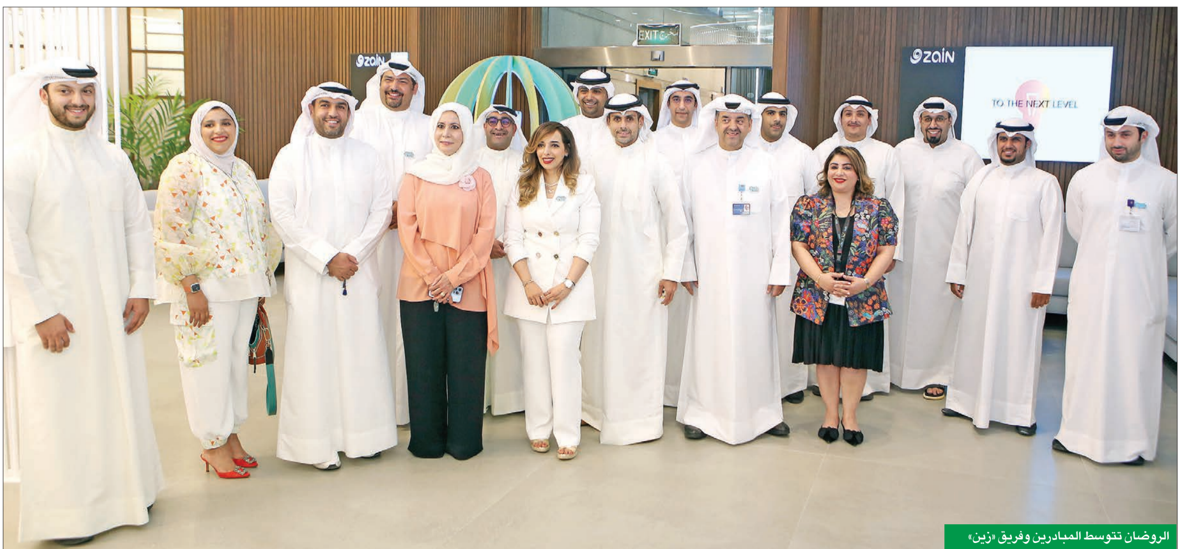
الروضان تتوسط المبادرين وفريق «زين»