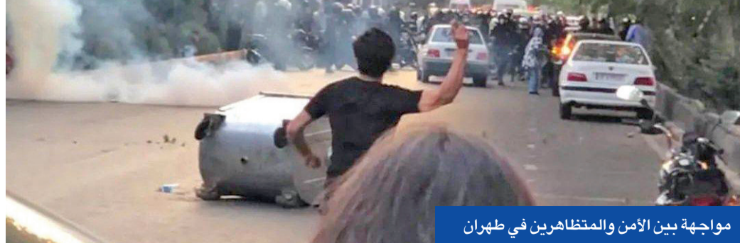
مواجهة بين الأمن والمتظاهرين في طهران

في إدامة الزخم، وسط انخراط كبير للمجتمع، خصوصاً النساء، في الحراك الذي جاء في توقيت محرج. وسعى المحتجون في اليومين الأخيرين إلى اعتماد تكتيكات جديدة خصوصاً في طهران. ففي وقت أحدث تقبيل الوصول إلى برامج التواصل عبر الإنترنت أثرا على تنظيم المسيرات الاحتجاجية لجا نشطاء إلى زيادة عدد نقاط التظاهر وتفريقها، لإرهاق القوات الأمنية، وتصعيب مهمتها 02