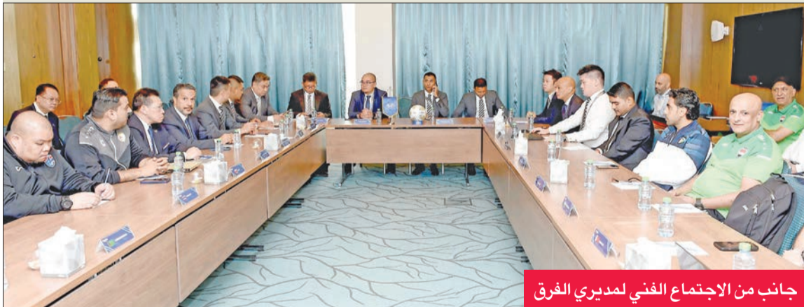
جانب من الاجتماع الفني لمديري الفرق

عقد ظهر أمس الأول الاجتماع الفني، بحضور ممثلين عن الاتحاد الآسيوي لكرة القدم ومديري المنتخبات المشاركة.