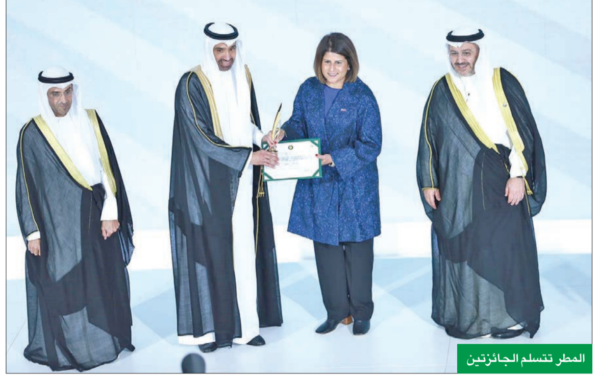
المطر تسلم الجائزتين

على قدر فخرنا بقدرتنا على إطلاق المشاريع الرائدة نعتز بشبابنا الذين يعدون قيمة مضافة في مختلف نسخ «تمكن»