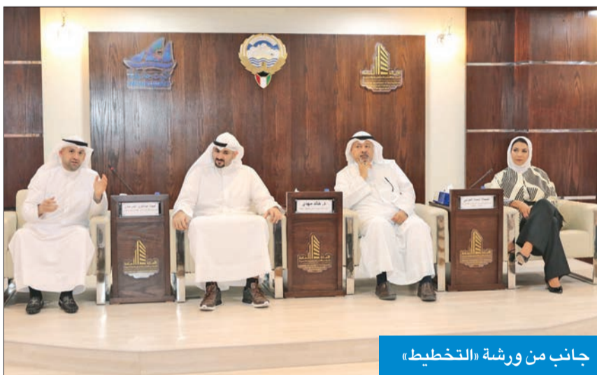
جانب من ورشة «التخطيط»

ووفقاً للمصادر، فإن الزيارة جاءت إيجابية، حيث قام ممثل الوفد بطرح العديد من الاستفسارات والأسئلة على مسؤولي المجلس والوزارة الذين قاموا بالإجابة عنها.