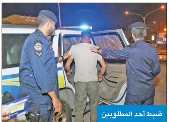
ضبط أحد المطلوبين

المناطق، وأسفرت تلك المهام عن تحرير 3363 مخالفة مرور، منها 10 مخالفات وقوف في أماكن المعاقين، إضافة إلى حجز 25 مركبة مخالفة، وإحالتها إلى كراج حجز الإدارة العامة للمرور. وأوضح أن رجال دوريات النجدة تمكنوا من ضبط شخصين صادر بحقهما أوامر