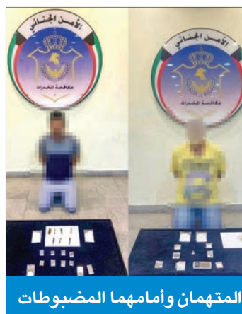
المتهمان وأمامهما المضبوطات

العمليات المركزية تلقت بلاغاً بشأن الحريق فتم تحريك مراكز إطفاء جلب الشيوخ والعازلة، وتبين أن الحريق في الدور الأرضي من المنزل المكون من ثلاثة ادوار وأمتد للدوار العلوية، لافتة إلى أن رجال الإطفاء باشرؤا إجلاء سكان المنزل ومكافحة الحريق، وتمكنوا من محاصرته وإخماده.