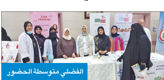
الفضلي متوسطة الحضور

دقيقة يوماً؛ حيث إن النشاط البدني يقلل من خطر الإصابة بأمراض القلب. وأضاف فضلي أن أمراض القلب تعد من أكثر أسباب الوفاة شيوعاً في العالم، حيث إن أمراض القلب تتسبب في وفاة 31% من عدد الوفيات عالمياً، مضيفة أن أمراض القلب غالباً ما تكون نتيجة تراكمات لأسباب عدة، مثل