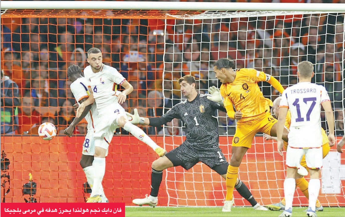
فان دايك نجم هولندا يحرز هدفه في مرمى بلجيكا

أكد المنتخب الهولندي جاهزيتته لخوض مونديال قطر، بعدما غاب عن الذي سبقه في روسيا عام 2018، بتأهله لنصف نهائي دوري الأمم الأوروبية بصحبة كرواتيا، فيما بدأ الشك يشق طريقه إلى المنتخب الفرنسي بطل العالم بسقوطه على يد الدنمارك مرة أخرى.