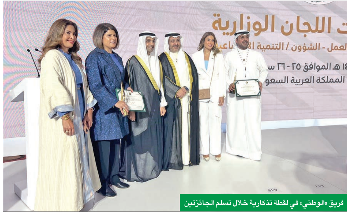
فريق «الوطني» في لحظة تذكارية خلال تسلم الجائزتين

البنك يتمتع بأعلى معدلات الاحتفاظ بالموظفين الكويتيين مما يعكس نجاحه في إدارة رأس المال البشري