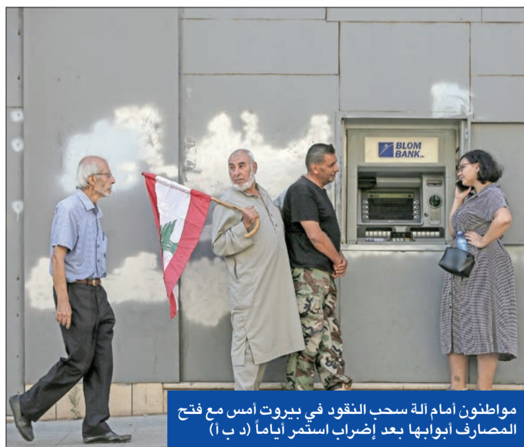
مواطنون أمام آلة سحب النقود في بيروت أمس مع فتح المصارف أبوابها بعد إضراب استمر أياماً

وصف مرجع سياسي النقاشات التي تخللتها جلسة إقرار الموازنة العامة في مجلس النواب اللبناني، أمس، بالعبثية، خصوصاً أن الأرقام لم تكن واضحة ولا حتى الالتزامات، وأكثر ما أثار اعتراض النواب هو إعادة توزيع أرقام جديدة عليهم قبل وقت قصير من انعقاد الجلسة مثل الأرقام التي ستعتمد لإقرار الدولار الجمركي على أساس 15 ألف ليرة لبنانية لسعر الدولار الواحد أي زيادة الرسوم الجمركية 15 ضعفاً.