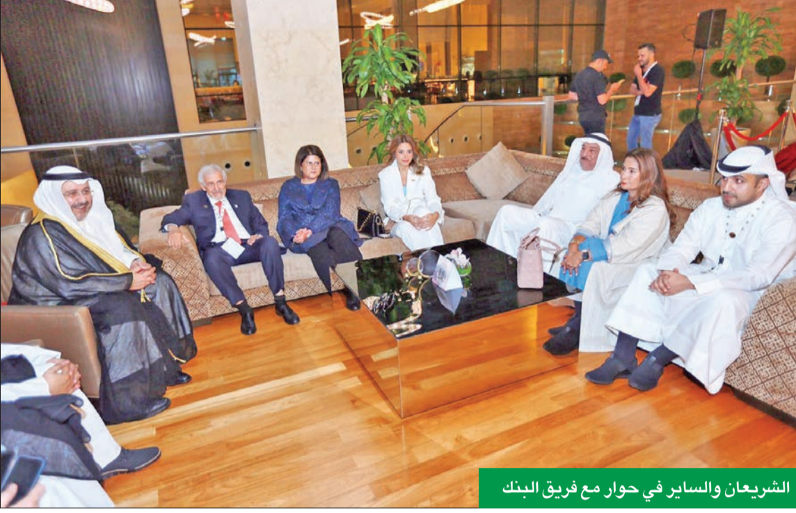
الشريعان والسايير في حوار مع فريق البنك