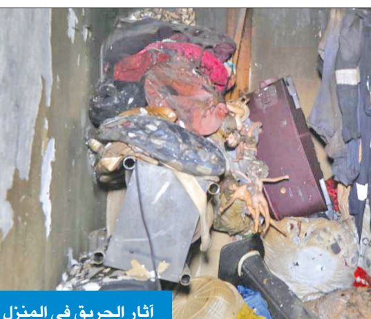
آثار الحريق في المنزل

العمليات المركزية تلقت بلاغاً بشأن الحريق فتم تحريك مراكز إطفاء جلب الشيوخ والعازلة، وتبين أن الحريق في الدور الأرضي من المنزل المكون من ثلاثة ادوار وأمتد للدوار العلوية، لافتة إلى أن رجال الإطفاء باشرؤا إجلاء سكان المنزل ومكافحة الحريق، وتمكنوا من محاصرته وإخماده.