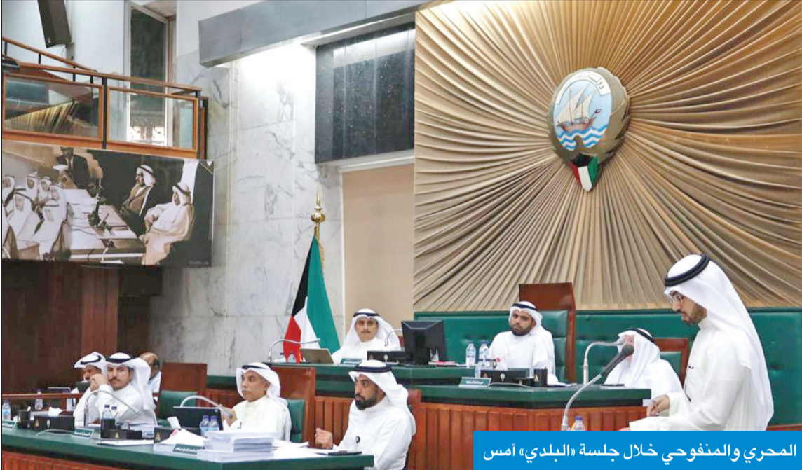
المحري والمنفوشي خلال جلسة «البلدي» أمس