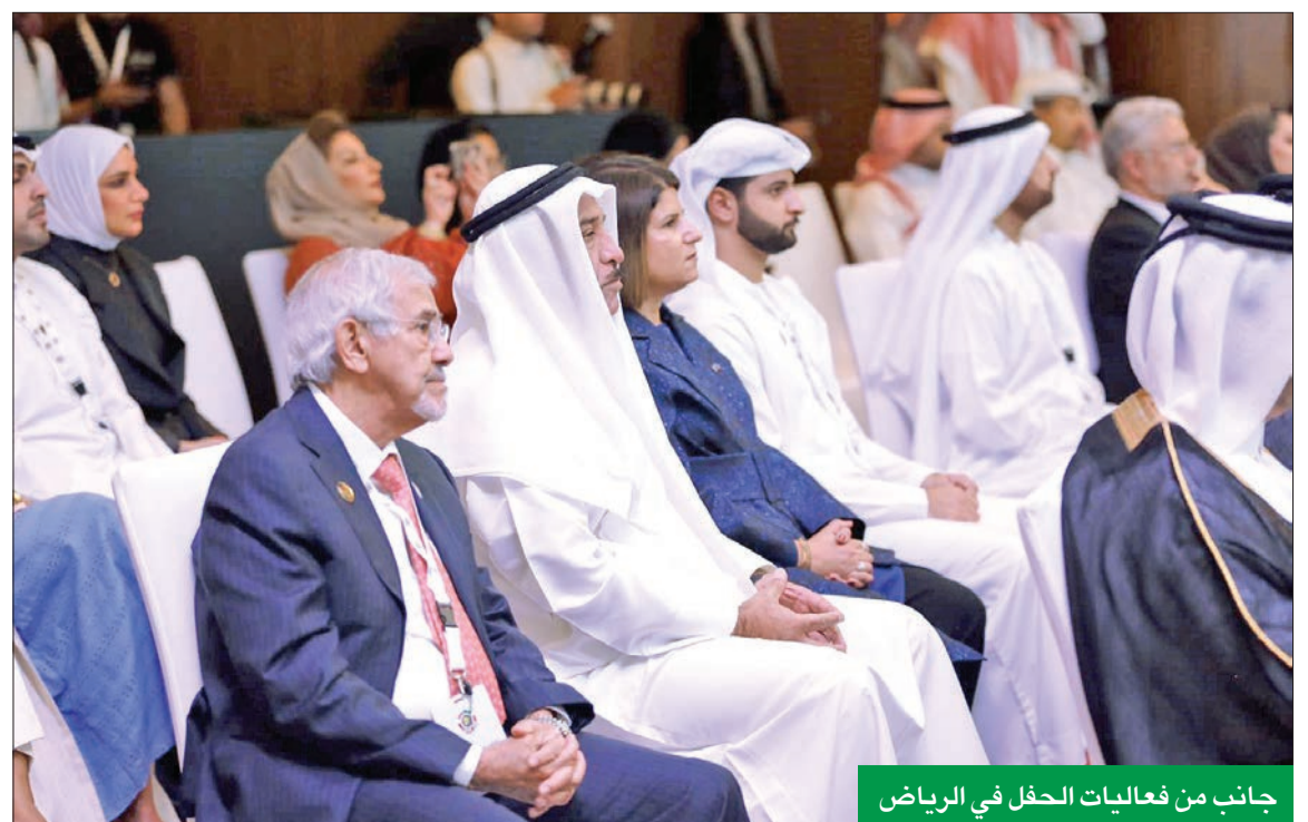
جانب من فعاليات الحفل في الرياض