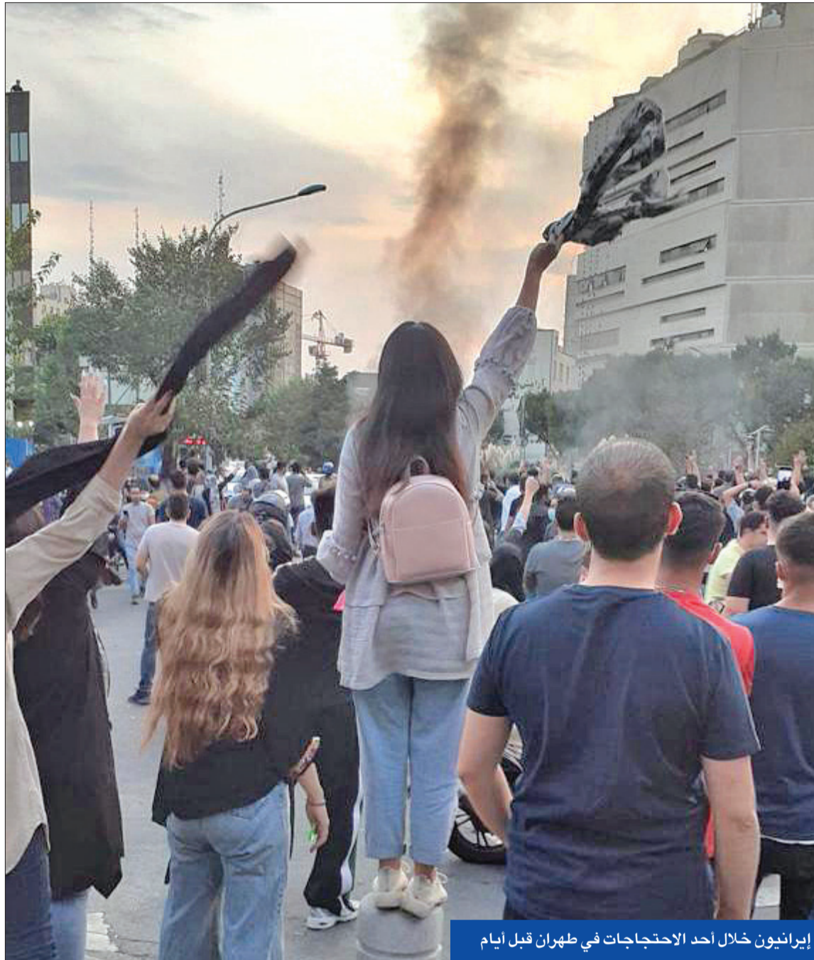
إيرانيون خلال أحد الاحتجاجات في طهران قبل أيام

المتظاهرون يعتمدون تكتيكات جديدة وطهران تهدد بالرد على تدخل واشنطن