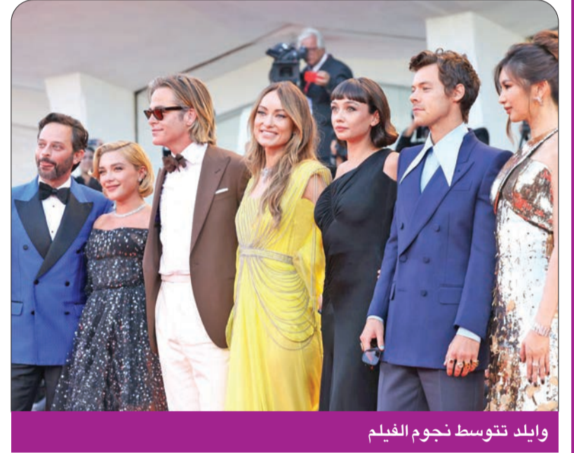
وايلد تتوسط نجوم الفيلم

تصدر فيلم «Dont Worry Darling» أو «لا تقلق حبيبي»، للمخرجة والممثلة أوليفيا وايلد، إيرادات شبكات التذاكر بأميركا الشمالية في نهاية الأسبوع الفائت، مع عائدات بلغت 19.2 مليون دولار، وفق موقع «إكزبيتر ريليشنز» المتخصص. ولم يكن من الواضح ما إذا كانت التقويمات والتقارير الإعلامية السلبية عن خلافات خارج الشاشة، بما في ذلك بين مخرجة العمل والممثلة فلورنس بيو، قد حفزت مبيعات شبكات التذاكر أو خففت من زخمها. لكن في مطلق الأحوال، حقق الفيلم الذي أنتجته شركة «ورنر براذرز» انطلاقة «جيدة جداً فوق المعدل المعتاد» لمثل هذه الأفلام الرومانسية، بحسب المحلل في شركة «فرانشايز إنترتاينمنت ريسرتش» ديفيدا غروس.