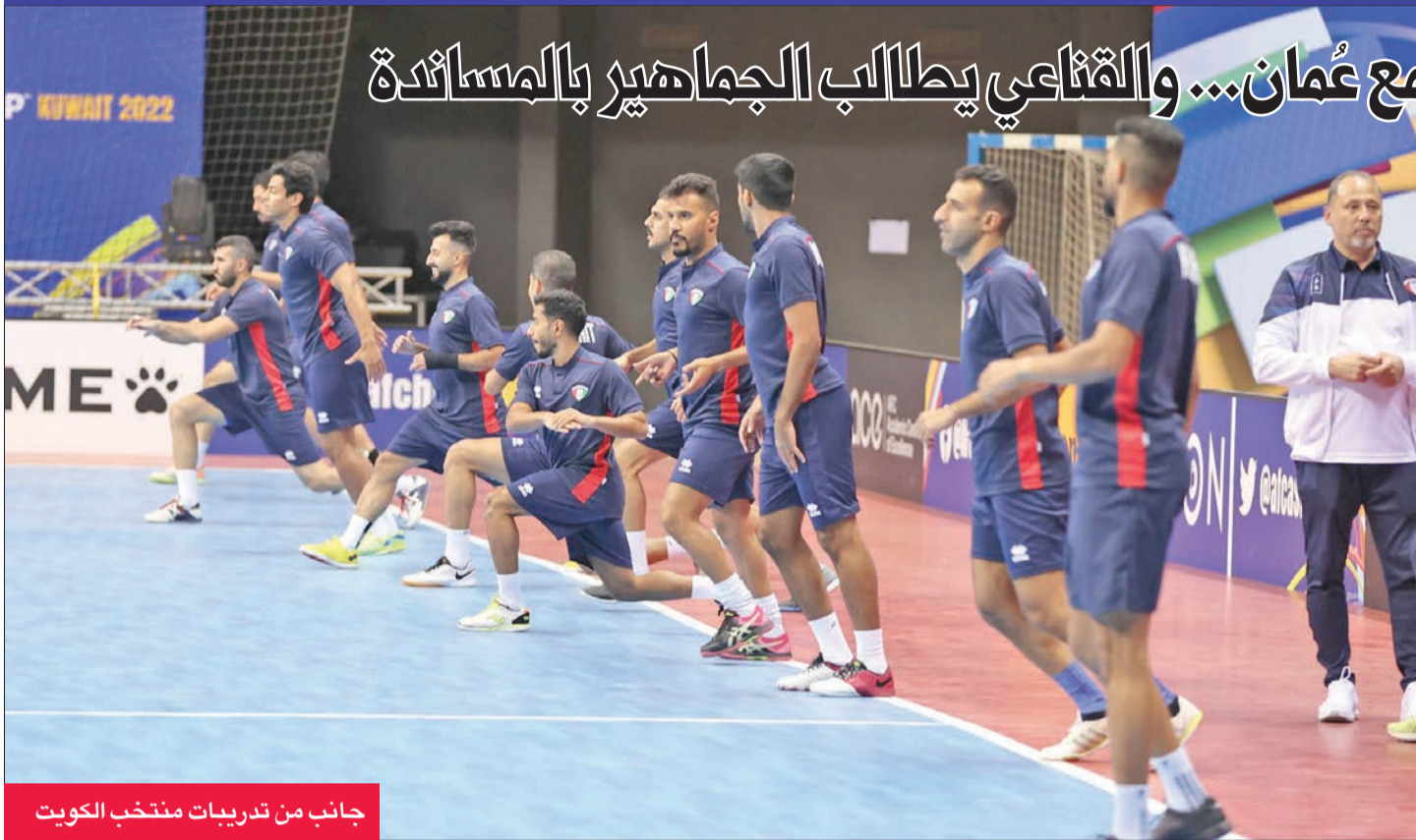
جانب من تدريبات منتخب الكويت

«الأزرق» يبدأ المشوار بمواجهة صعبة مع عُمان... والقناعي يطالب الجماهير بالمساندة