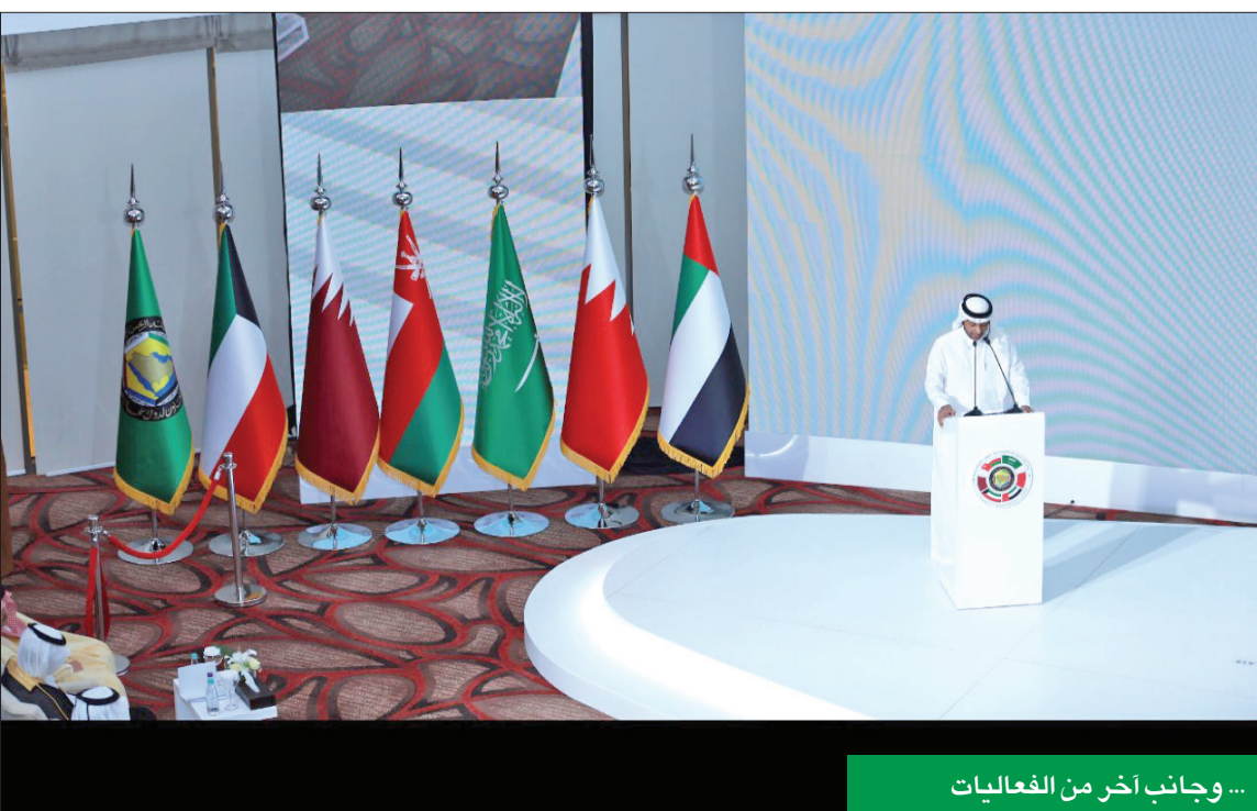
...وجانب آخر من الفعاليات

«الوطني» يرى في هذا المشروع نموذجاً يتبنى الشباب ويوقظ أحلامهم ويكتشف مواهبهم