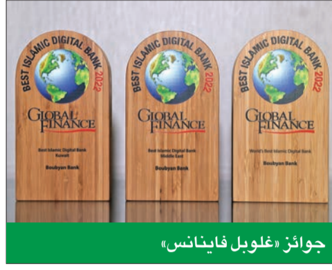
جوائز «غلوبل فاينانس»

غير مسبوقة في قاعدة عملاء «بويان» الذين يستخدمون الحلول المصرفية الرقمية، وهو ما ارتبط بالنمو الكبير في عدد العملاء وعدد العمليات المصرفية باستخدام القنوات كافة.