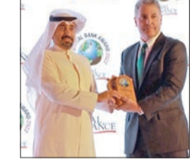
«بوبيان» أفضل بنك إسلامي بالعالم في الخدمات المصرفية الرقمية