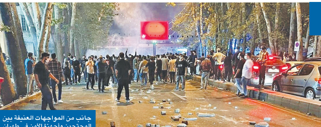
جانب من المواجهات العنيفة بين المحتجين واجهزة الامن في طهران

في وقت حافظت التظاهرات في إيران على زخمها نسبياً حتى أنها بدت مختلفة عن سابقاتها، لجأت السلطات الإيرانية إلى الأسلحة الثقيلة لإجهاض حركة الاحتجاج الواسعة المستمرة منذ أكثر من أسبوعين، التي اندلعت إثر مقتل الشابة الكردية مهسا أميني، بعد توقيفها من الشرطة بسبب «مخالفتها قواعد الحجاب». ورأى مراقبون ومحللون أن الاحتجاجات هذه