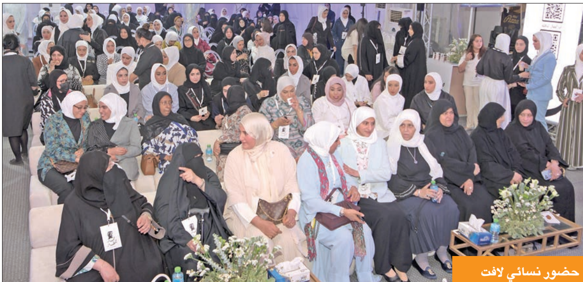
حضور نسائي لافت

في 2012 كان للشعب وقفة كبيرة بعد الحراك المستحق لمواجهة الفساد