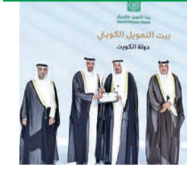
مجلس وزراء العمل الخليجي يكرم «بيتك»