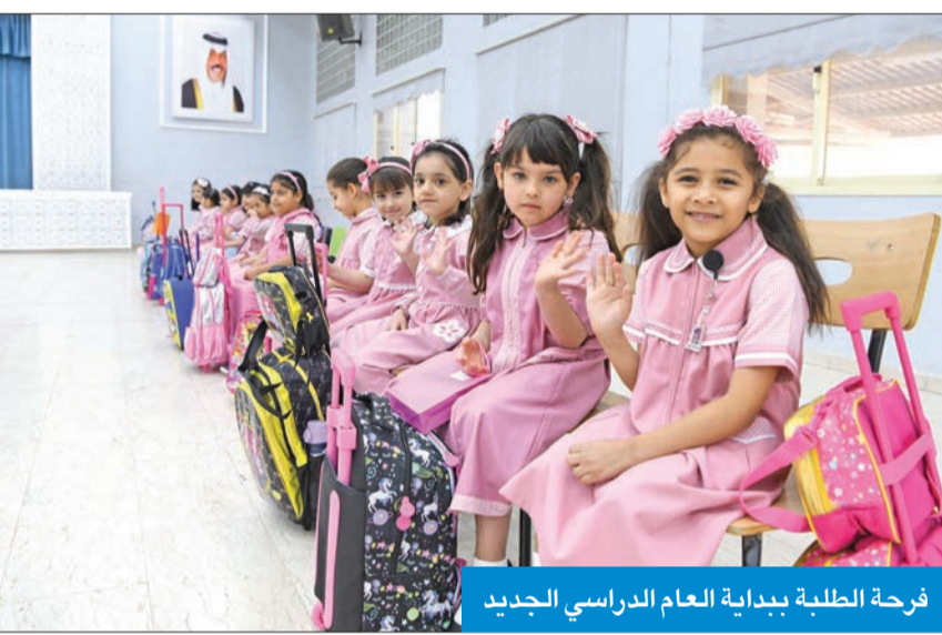
فرحة الطلبة ببدء العام الدراسي الجديد