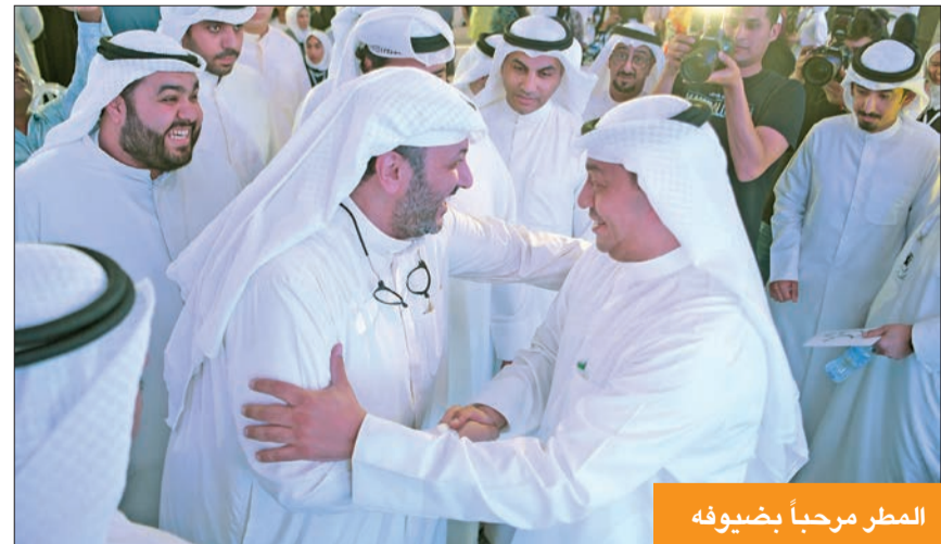
المطر مرحباً بضيوفه

«مخرجات «الصوت الواحد» محدودة ومزعجة لكن الشعب قادر على الاختيار الصحيح»