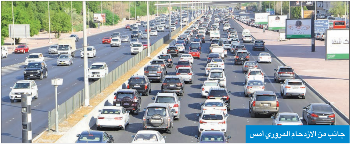
جانب من الازدحام المروري أمس