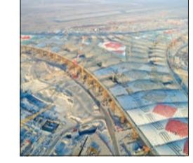
«الأشغال»: إنجاز 65% من مشروع المطار الجديد