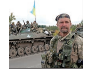
روسيا تواجه «غضب الأصدقاء» واحتجاجات ضد «التعبئة»