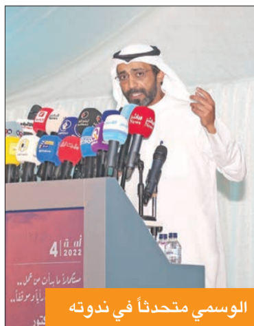
الوسمي متحدثاً في ندوته

كل الدوائر: عشان الكويت وأهل الكويت هناك نوعية سيئة لا تسحق تمثيلكم، وأحد النواب ينظر إليه حكومياً، وقال لي أي أشوفك، وهذا الموضوع ليس مفهوماً، وقلت له في صالح الدولة، وأنا لا أفهم تفاصيله الفنية، ولكن أنا معك، وهذا يختلف عن الذي معزبه يعطيه فلوس، وأنتم تعلمون من حصن رئيس الوزراء الذي حصلت في عهده أكبر قضايا فساد، وقلت مرحباً يا عبيد وأقولكم قاعد». وأضاف: «بطالون بحكومة برلمانية، وعندما اتفقنا على هذا الأمر في الحوار الوطني رفض البعض وأحبي روح الدين الذي تحمل الكثير لأنه قبل بالمنصب الوزاري من أجل الكويت، وأتعد بما قدمته بحضور القيادة السياسية، وهي ليست أمر شخصياً، وأنا متمسك بما جاء في وثيقة الكويت وأقول للشعب احسنوا الاختيار واختاروا من يدافع عن البلد، ولين أوجهكم لمرشحين محددين، وأتمنى وجود مجموعة نيابية مصلحة قادرة على استكمال ما قدمته من برنامج».