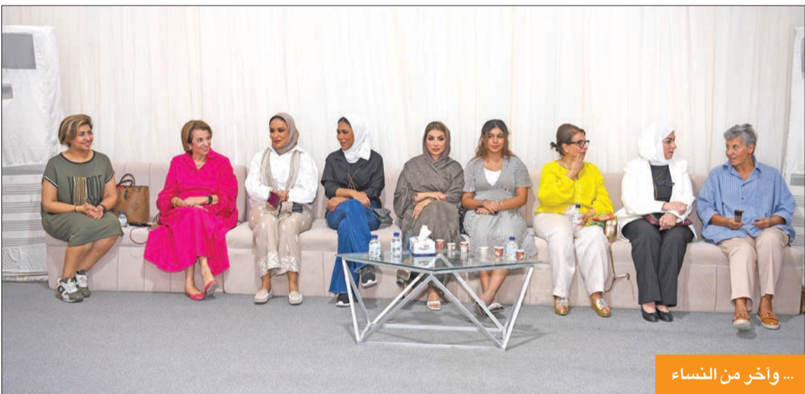
... وآخر من النساء