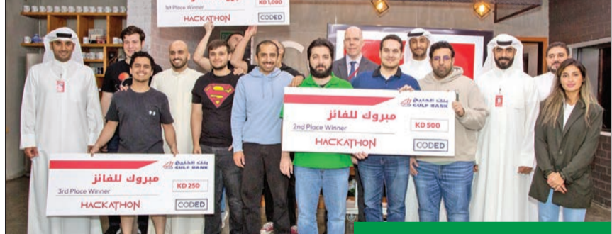
جانب من المشاركين في المسابقة

المجتمع، والتعرف على الأفكار الجديدة، ما يجعلها فرصة متميزة لجمع المبدعين من المبرمجين والمهندسين وذوي الخبرات التقنية والعلمية والهواة تحت سقف واحد، بهدف تبادل الخبرات وابتكار أفكار جديدة قابلة للتطبيق.