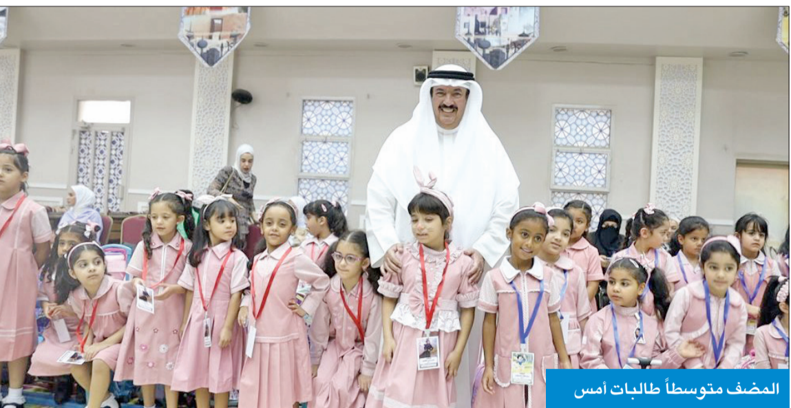
المضف متوسطا طالبات أمس

وأكد حرصه الشديد في الحفاظ على سلامة الطلاب والطالبات وأعضاء الهيئة التعليمية والهيأة الإدارية، وتسخير جميع الإمكانيات والسبل المتاحة التي تضمن لهم الراحة، وتوفر الأجواء المناسبة خلال الدوام المدرسي.