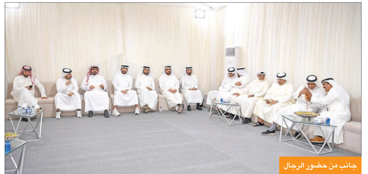
جانب من حضور الرجال