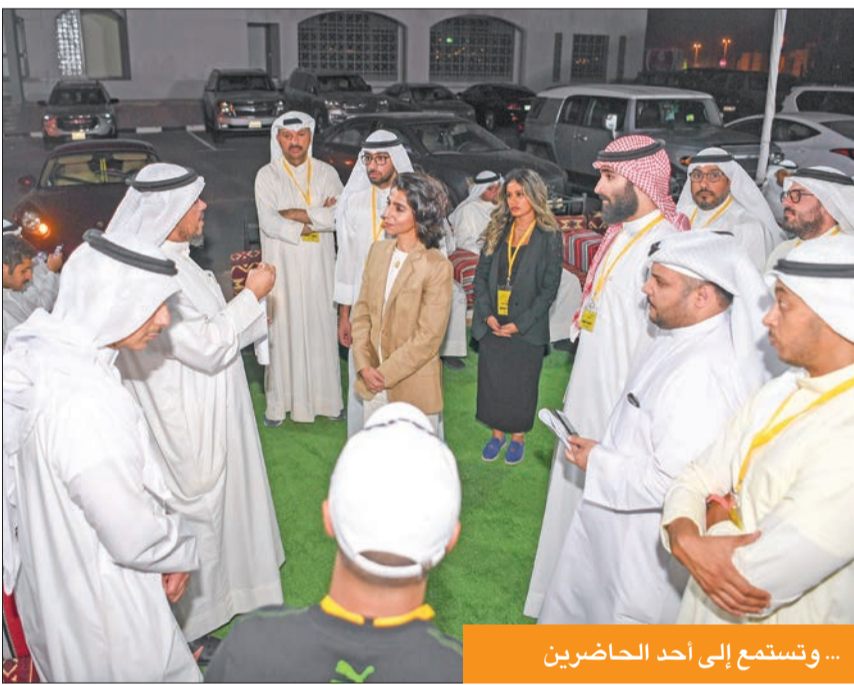
... وتستمع إلى أحد الحاضرين

خطه عمل متكاملة للنظر في المشاكل الحساسة والتي يعانها المواطن وهي الإسكان والتوظيف والصحة والتعليم، وهذا لن يكون إلا بجهود وتعاون من جميع الأطراف، سواء كانوا من قبل السلطتين أو أصحاب الخبرة والكفاءة.