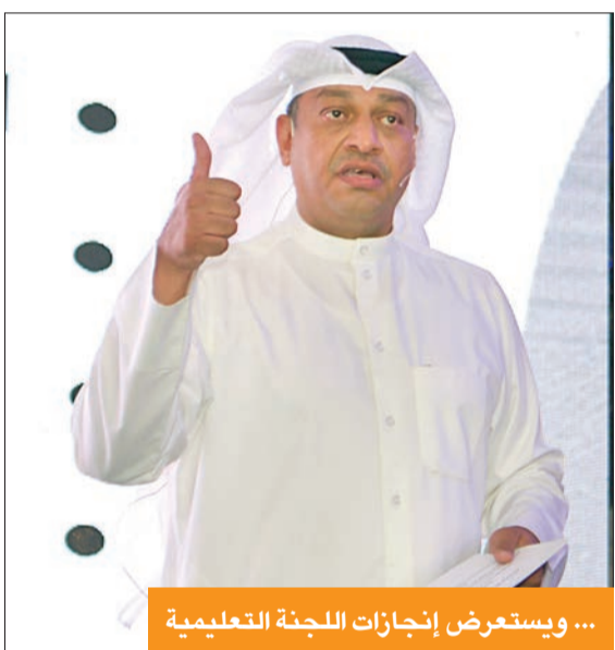
... ويستعرض إنجازات اللجنة التعليمية

لكن للأسف لم تكتمل بسبب عدم وجود جلسات بسبب الانتفاضة التي حصلت للحفاظ على الدستور لم تنته منها. وشدد على أن أي قضية تنموية بأي مشروع دولة إن لم يكن التعليم هو بوابة لها فلن تقوم لها قائمة، ولنا في تجربة ماليزيا وكيف نهضت بوزارة التعليم مثالاً، ولينا أن نستفيد من تجربتها، ونحن قارون إذا ما تعاوننا سوياً، كما فعلنا في المجلس الماضي، حيث تم تفعيل اللجنة التعليمية التي تعدها الهيئة العامة للبيئة على طموح الشعب وأولوياته، أوقفناهم عند ذمهم لكن للأسف حل المجلس رغم أنه استحقاق للعودة إلى الشعب لتصبح المسار، ونأمل أن يتم حل الملفات العالقة من خلال العمل الجماعي الذي يحقق طموح الشعب الكويتي. ووجه المطر رسالة للسلطة بأن «هناك أكثر من 900 ألف ناخب وناخبة سيختارون 50 نائباً يمثلونهم، وهذا خيار صعب لأشك، وهناك بعض المظاهر الإيجابية من وقف ظاهرة شراء الأصوات والفرعيات لكن تبقى مخرجات الصوت الواحد مزعجة وبالتالي الخيارات صعبة وفي انزعاج من الصوت الواحد ومخرجاته التي تؤدي إلى مجلس شبيه فردي وليس جمعياً، ومع ذلك نقول للسلطة إذا أحسن الشعب اختيار نوابه فليكم مسؤولية حسن اختيار الوزراء ولماذا لا تختارون الأفضل هو موضوع الإسكان، وواعقد اللجنة الإسكانية في مجلس وزراء في أول جلساته، وقد اصطلمنا بماфия العقار»، وعليه «وجه رسالة من هذه الندوة باننا