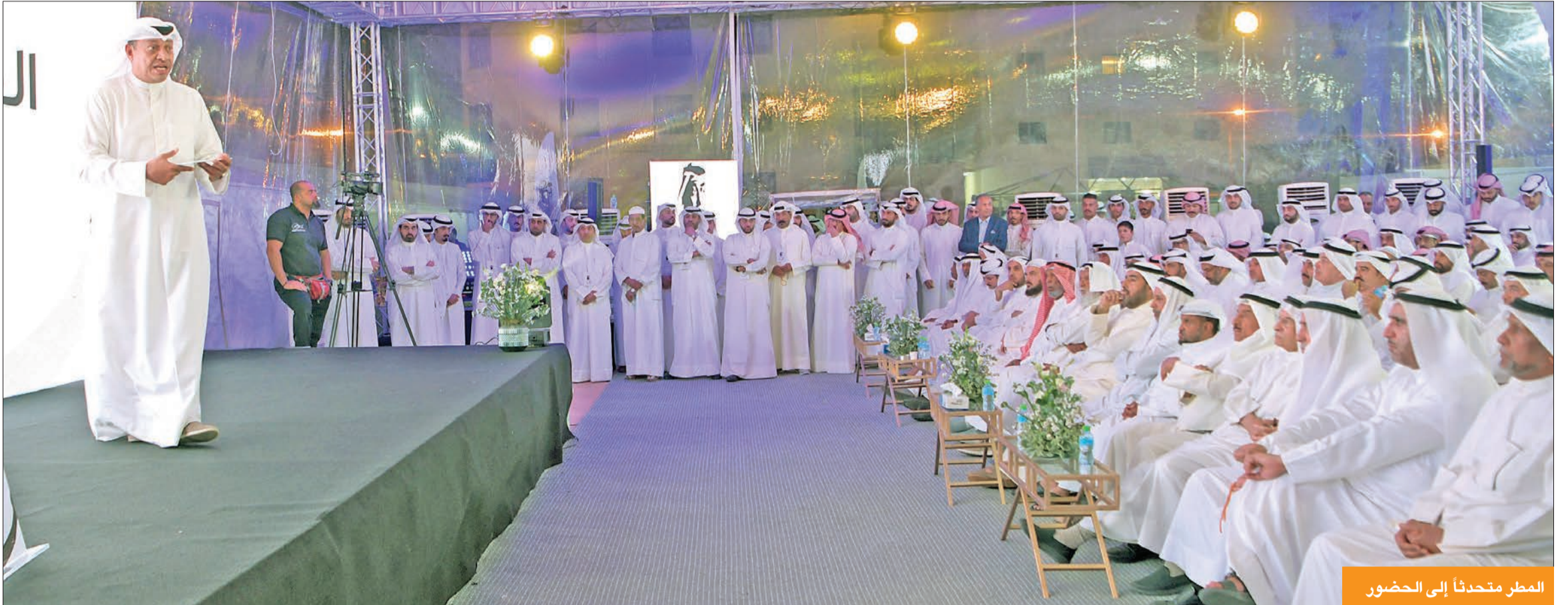
المطر متحدثاً إلى الحضور