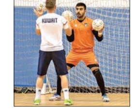
الكويت جاهزة لـ «أسبوعية الصالات»