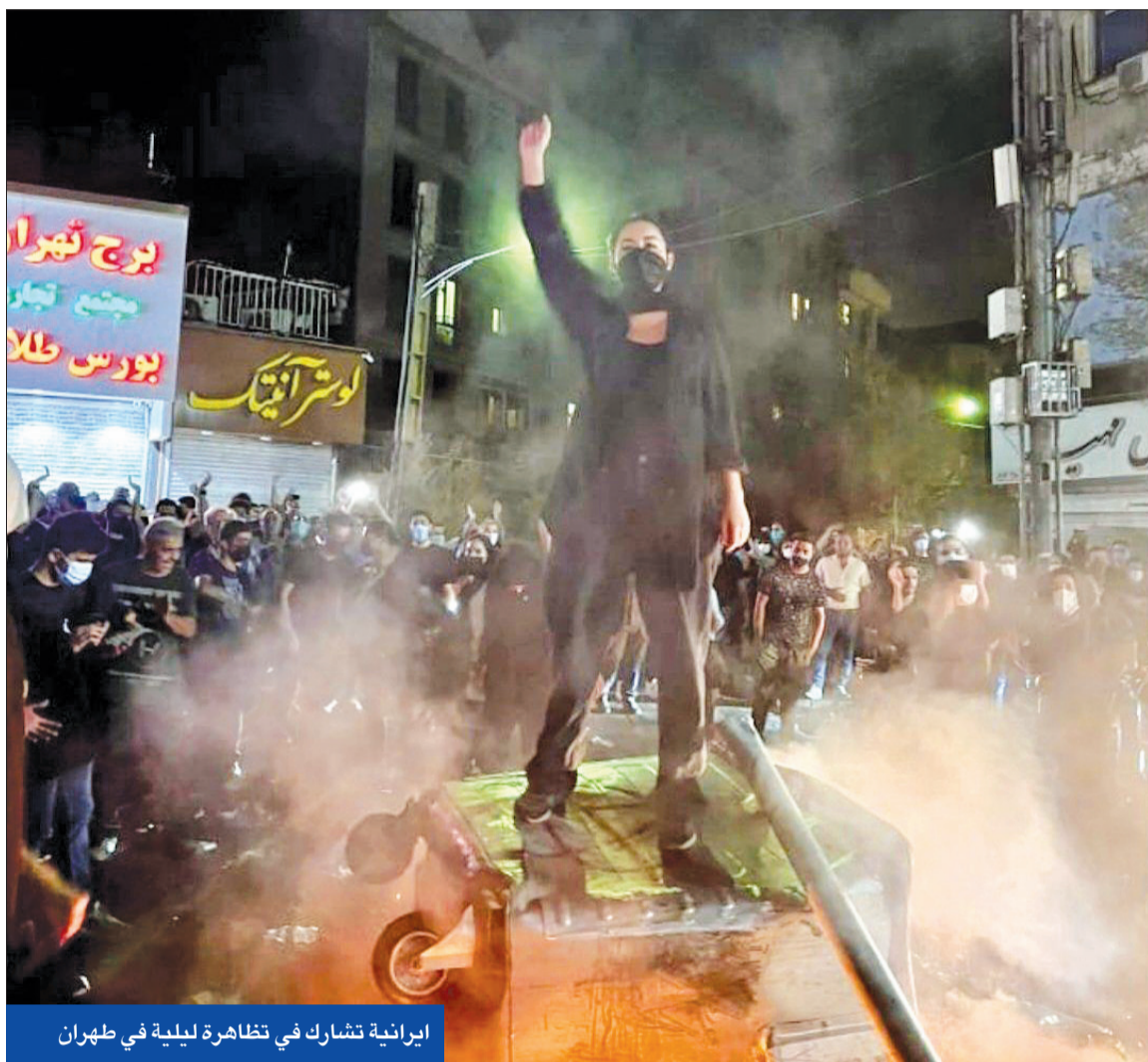
إيرانية تشارك في تظاهرة ليلية في طهران

تقارير عن ارتفاع قتل الاضطرابات إلى 140 والنظام يحرك تظاهرات مضادة