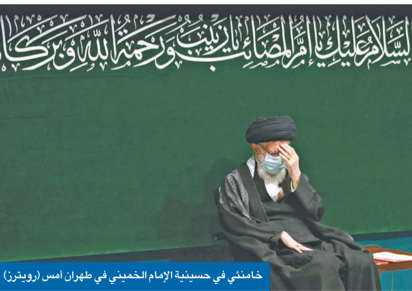
خامنئي في حسينية الإمام الخميني في طهران أمس