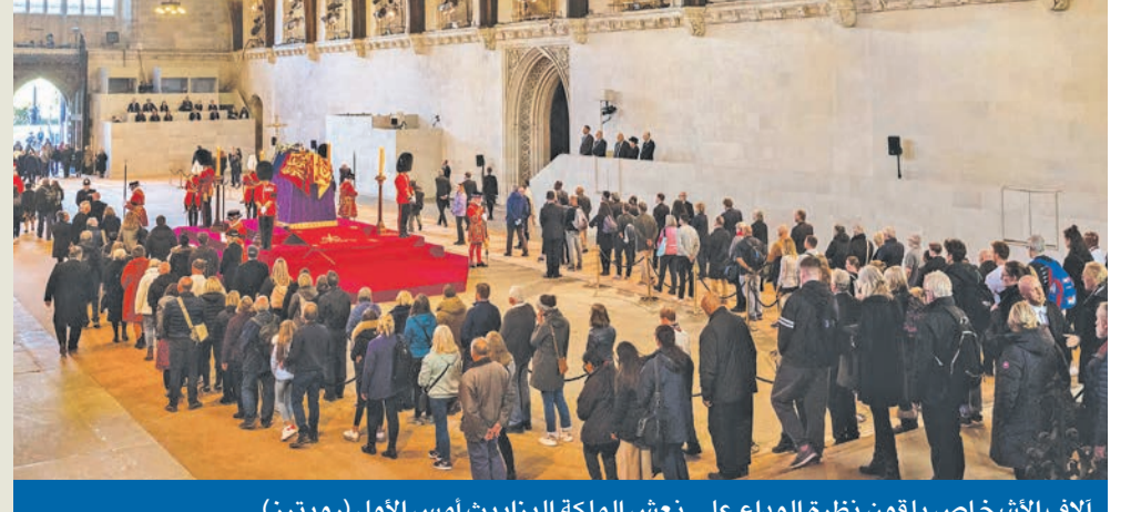
ألاف الأشخاص يلقون نظرة الوداع على نعش الملكة إليزابيث أمس الأول

بينما يحضر جنازة الملكة إليزابيث الثانية، غداً، أكثر من 70 زعيماً من جميع أنحاء العالم، وضعت بريطانيا خطة تشكّل «أكبر تحدٍّ أمني لمدينة لندن» منذ الحرب العالمية الثانية، وفقاً لصحيفة «أشنتون بوست». وقال مصدر بوزارة الخارجية البريطانية، إن الجنازة سيحضرها نحو 500 ضيف من 200 دولة ومنطقة تقريباً، بينهم ما يقرب من 100 رئيس دولة ورئيس حكومة وأكثر من 20 من أفراد عائلات مالكة، ومن المتوقع أن يصطف ما يصل إلى مليوني شخص في الشوارع. وفي حين تخطط العائلة المالكة للسفر خلف نعش الملكة، تحاول الشرطة تحقيق توازن بين السلامة والأمن والمراسم لإنجاح الحدث. ويقوم مسؤولون من وكالات الاستخبارات البريطانية (MI5 وMI6)، بمراجعة التهديدات، إلى جانب دعم الفريق الأمني الهائل الذي يعمل في الجنازة، وسيتمركز قناصة