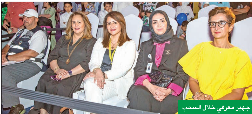
جهير معرفي خلال السحب

متمنياً أن تمكنه الجائزة من تحقيق أهدافه. وأضاف قائلاً: «نحرص كبنك على تزويد عملائنا بفرص لتوفير المال، وفي الوقت نفسه تقديم حوافز مجزية