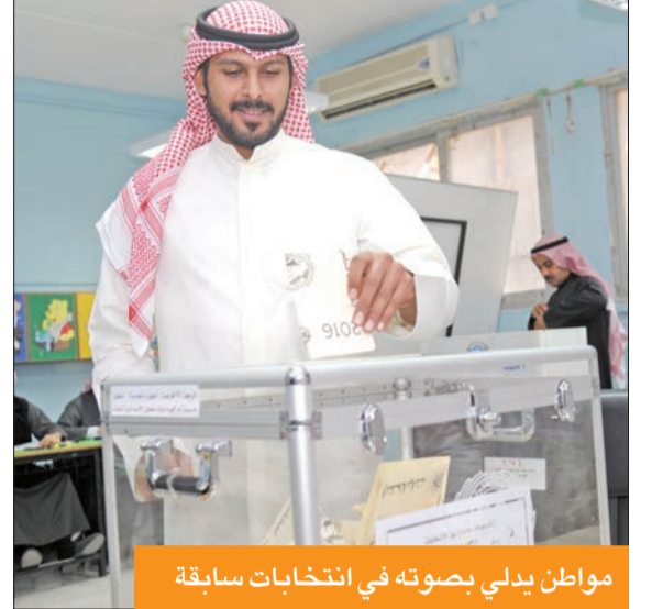
مواطن يبدلي بصوته في انتخابات سابقة