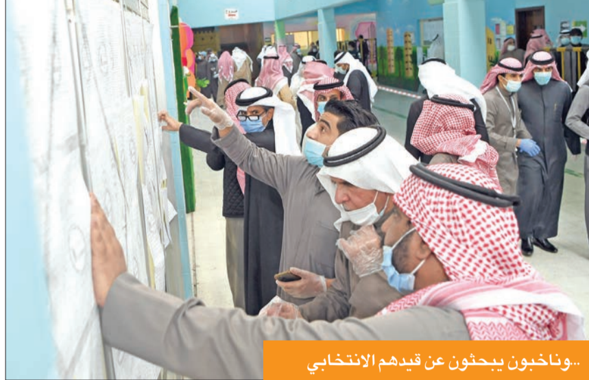
..وناخبون يبحثون عن قيدهم الانتخابي