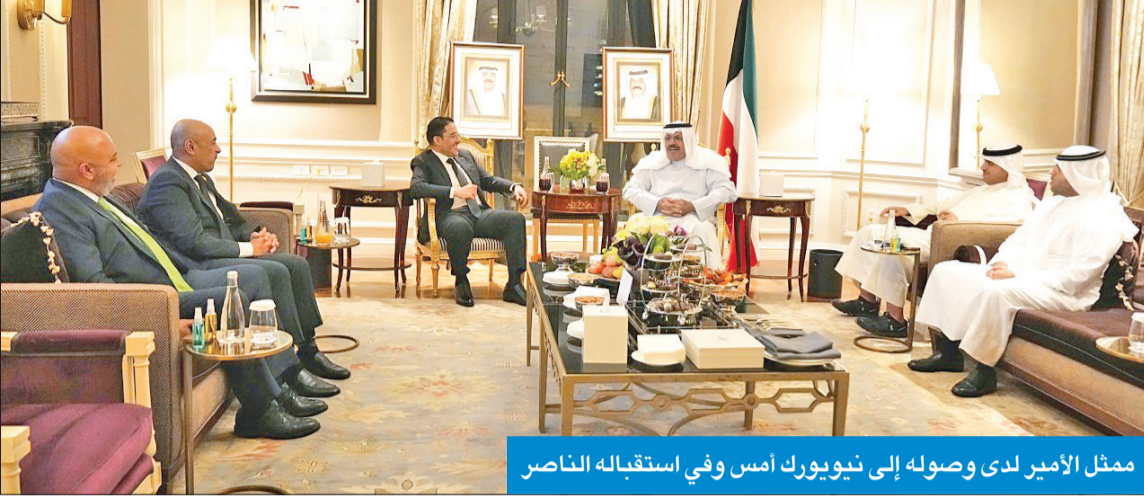
ممثل الأمير لدى وصوله إلى نيويورك أمس وفي استقباله الناصر

وأعرب سموه عن اعترازه بحضور اجتماعات الدورة الـ 77 للجمعية العامة للأمم المتحدة ممثلاً عن صاحب السمو أمير البلاد لترؤس وفد الكويت المشارك في اجتماعات الدورة الـ 77 للجمعية العامة للأمم المتحدة. وكان في مقدمة مستقبلي سموه، وزير الخارجية الشيخ الدكتور أحمد الناصر، وسفير الكويت لدى الولايات المتحدة الأميركية جاسم البديوي، ومندوب الكويت الدائم لدى منظمة الأمم المتحدة طارق البناي، وأعضاء السفارة.