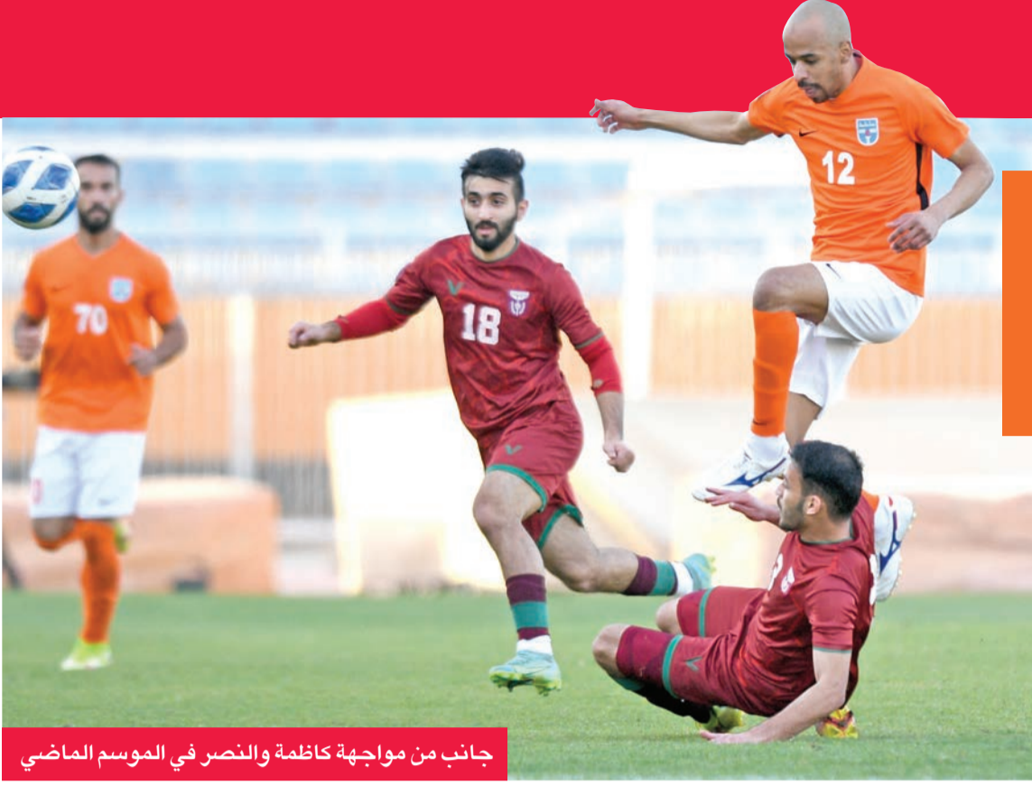
جانب من مواجهة كاظمة والنصر في الموسم الماضي

ضمن منافسات الجولة الرابعة من دوري زين الممتاز