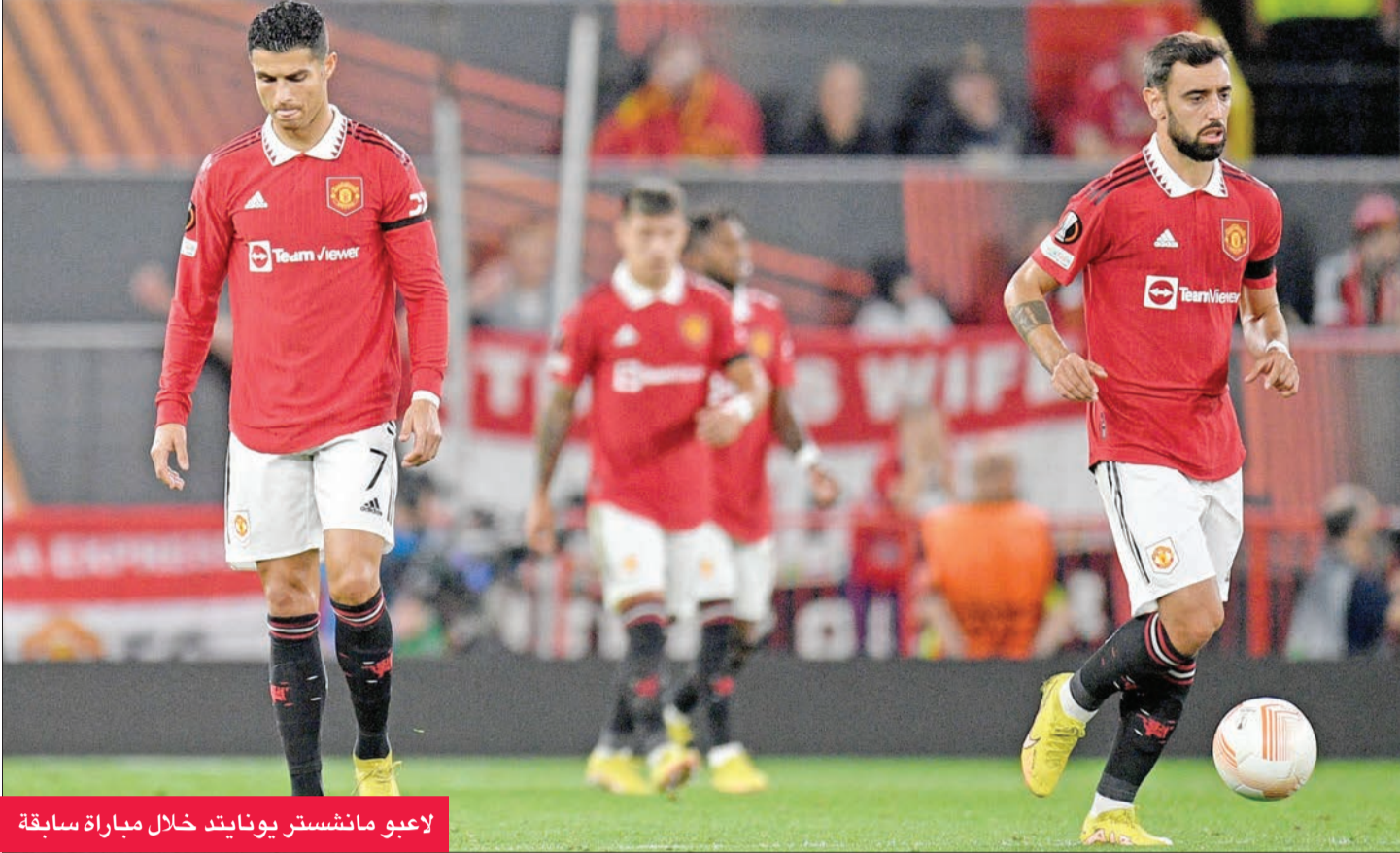
لاعبو مانشستر يونايتد خلال مباراة سابقة

على صعيد الدوري المحلي، إن فاز بخمس وتعادل في واحدة من مبارياته الست الأولى، ما جعله ثانياً بفارق نقطتين خلف بنفكا المتصدر وأمام العملاقين بورتو وسبورتنغ.