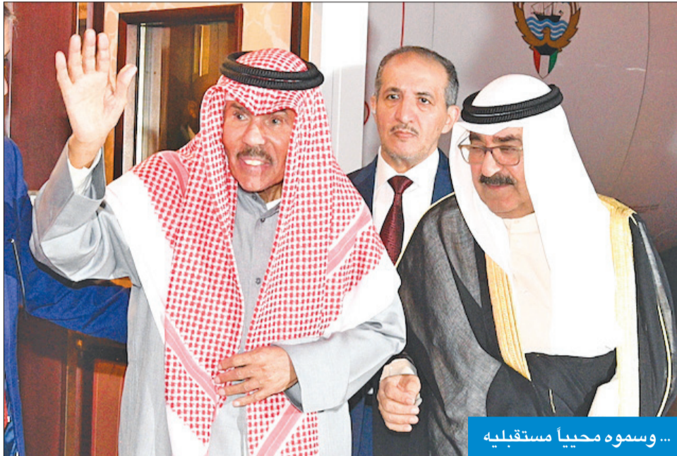
... وسموه محبياً مستقبليه