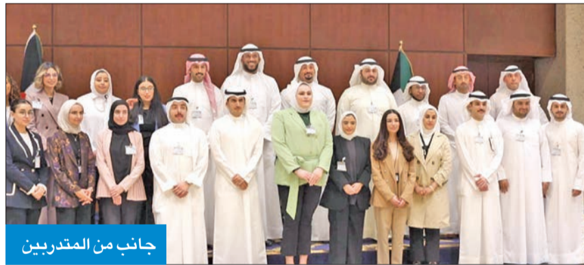
جانب من المتدربين

استفادته من معلومات المذكورة في المحاضرة ومعرفته عن قرب لإتيات الصندوق المتعددة ومساهماته الإنمائية، أملاً بتعاوناً أكبر مع الصندوق في المستقبل.