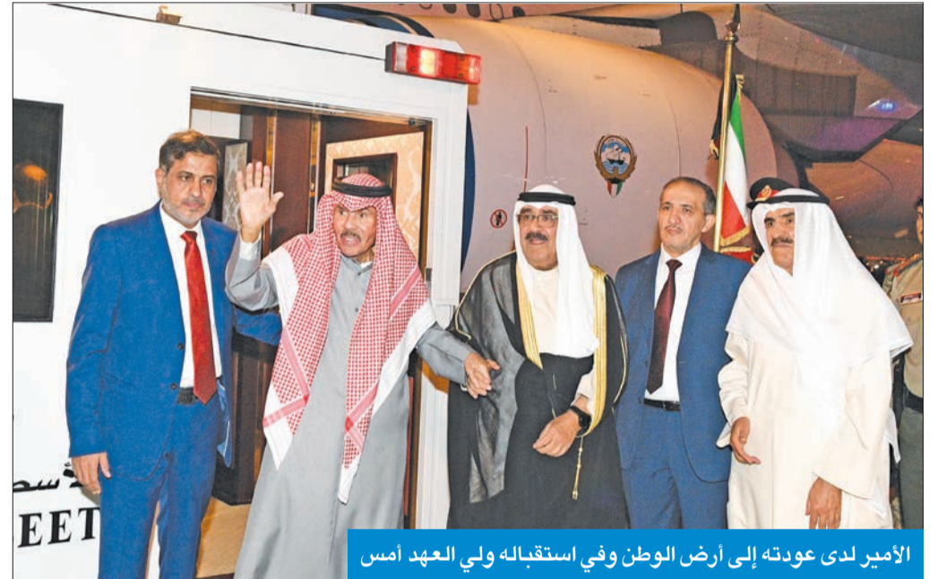
الأمير لدى عودته إلى أرض الوطن وفي استقباله ولي العهد أمس