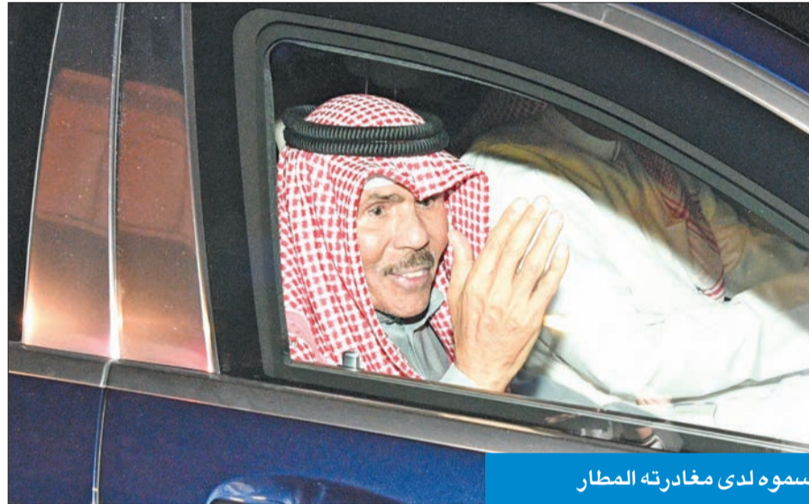
سموه لدى مغادرته المطار

بعث صاحب السمو أمير البلاد الشيخ نواف الأحمد ببرقية تهنئة إلى رئيس كوستاريكا الصديقة رودريغو روبلز، عبر فيها سموه عن خالص تهانئه بمناسبة العيد الوطني لبلاده، متمنيا سموه له موفقور الصحة والعافية وكوستاريكا وشعبها الصديق كل التقدم والازدهار. كما بعث سموه، ببرقية تهنئة إلى رئيس السلفادور الصديقة، نجيب بوكيلي، عبر فيها سموه عن خالص تهانئه بمناسبة العيد الوطني لبلاده، متمنيا سموه له موفقور الصحة والعافية وللسلفادور وشعبها الصديق كل التقدم والازدهار.