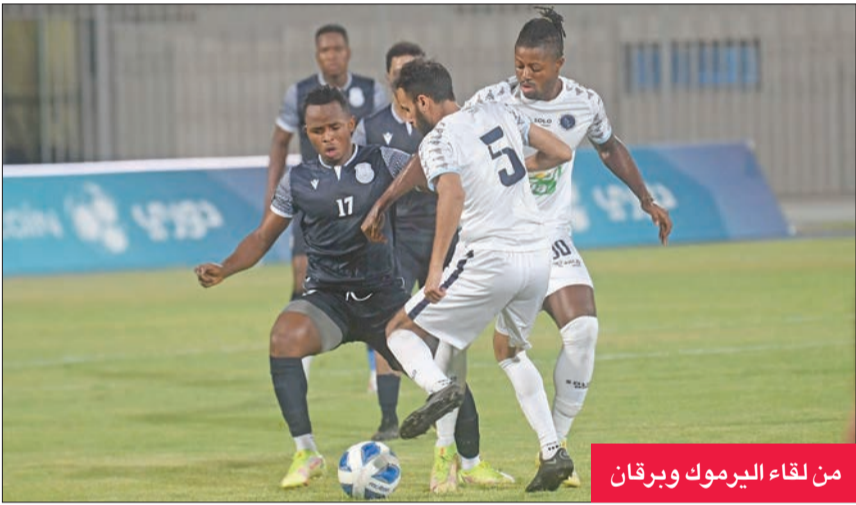
من لقاء اليرموك وبرقان

اليرموك، لكن تدخل العقلاء أنهى الواقعة سريعاً.