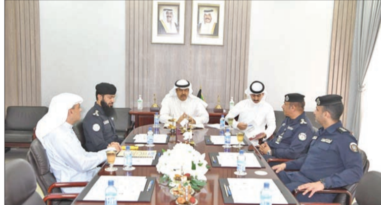
الأصفر مستقبلاً عدداً من القيادات الأمنية بمحافظة حولي أمس

وتقدم المحافظ بالشكر لرجال الأمن ومتنسبي وزارة الداخلية على تطبيقهم القانون وحفظ الأمن.