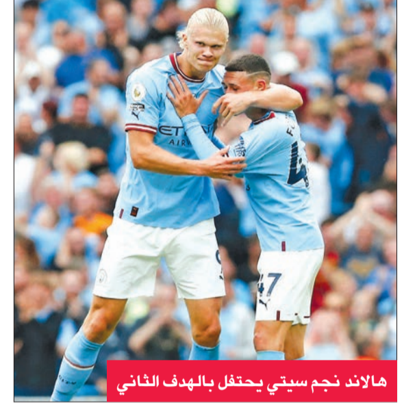
هالاند نجم سيتي يحتفل بالهدف الثاني

وبدأت ملاحح انتفاضة رجال الإسباني بيب غوارديولا تظهر في الدقيقة 53 بهدف تقليص الفارق عن طريق سيلفا من