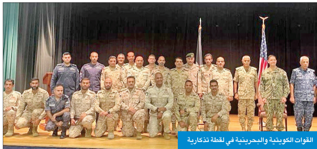
القوات الكويتية والبحرينية في لحظة تذكارية

سلمت القوة البحرية الكويتية سلاح البحرية الملكي البحريني مسؤولية قيادة قوة الواجب المختلطة (CTF 152) خلال حفل مراسم استلام وتسليم قيادة القوة، الذي أقيم في مقر مركز الإسناد البحري الأمريكي بالعاصمة البحرينية المنامة. وقالت وزارة الدفاع الكويتية، في بيان، أمس الأول، إن قائد القوات البحرية في القيادة المركزية الأميركية