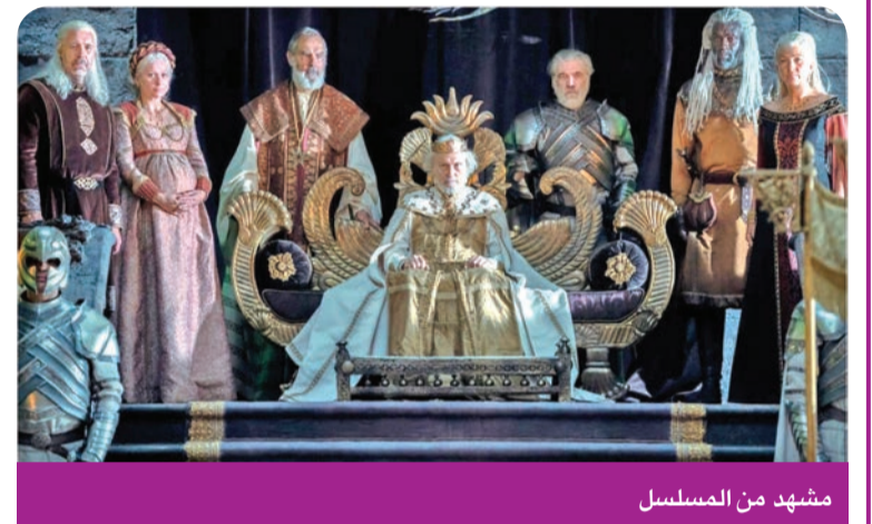
مشهد من المسلسل

ومن الآن، يمكن توقع منافسة قوية لـ «بيت التنين»، مع اقتراب طرح أولى حلقات مسلسل «Rings of Power» المرتبط بعالم «سيد الخواتم»، السلسلة الأدبية الخيالية التي ابتكرها ج. ر. ر. توكينين، في الثاني من سبتمبر. واستحوذت «أمازون برايم فيديو» قبل حوالي 5 سنوات على حقوق «The Lord of the Rings» مقابل 250 مليون دولار.