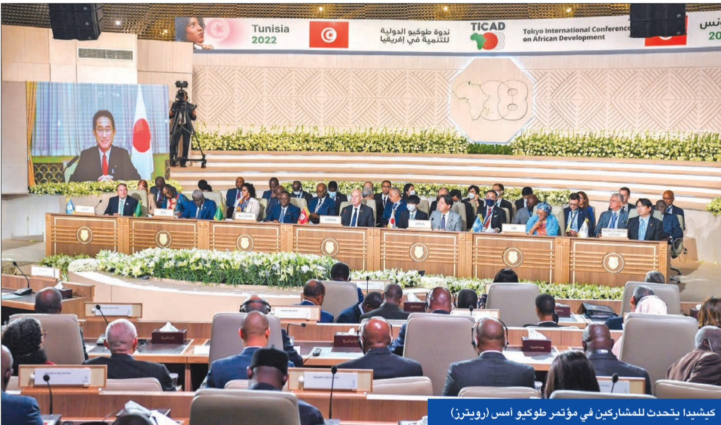
كيشيدا يتحدث للمشاركين في مؤتمر طوكيو أمس (رويترز)

تونس والمغرب يتبادلان استدعاء سفيريهما احتجاجاً على استقبال سعيد زعيم «البوليساريو»