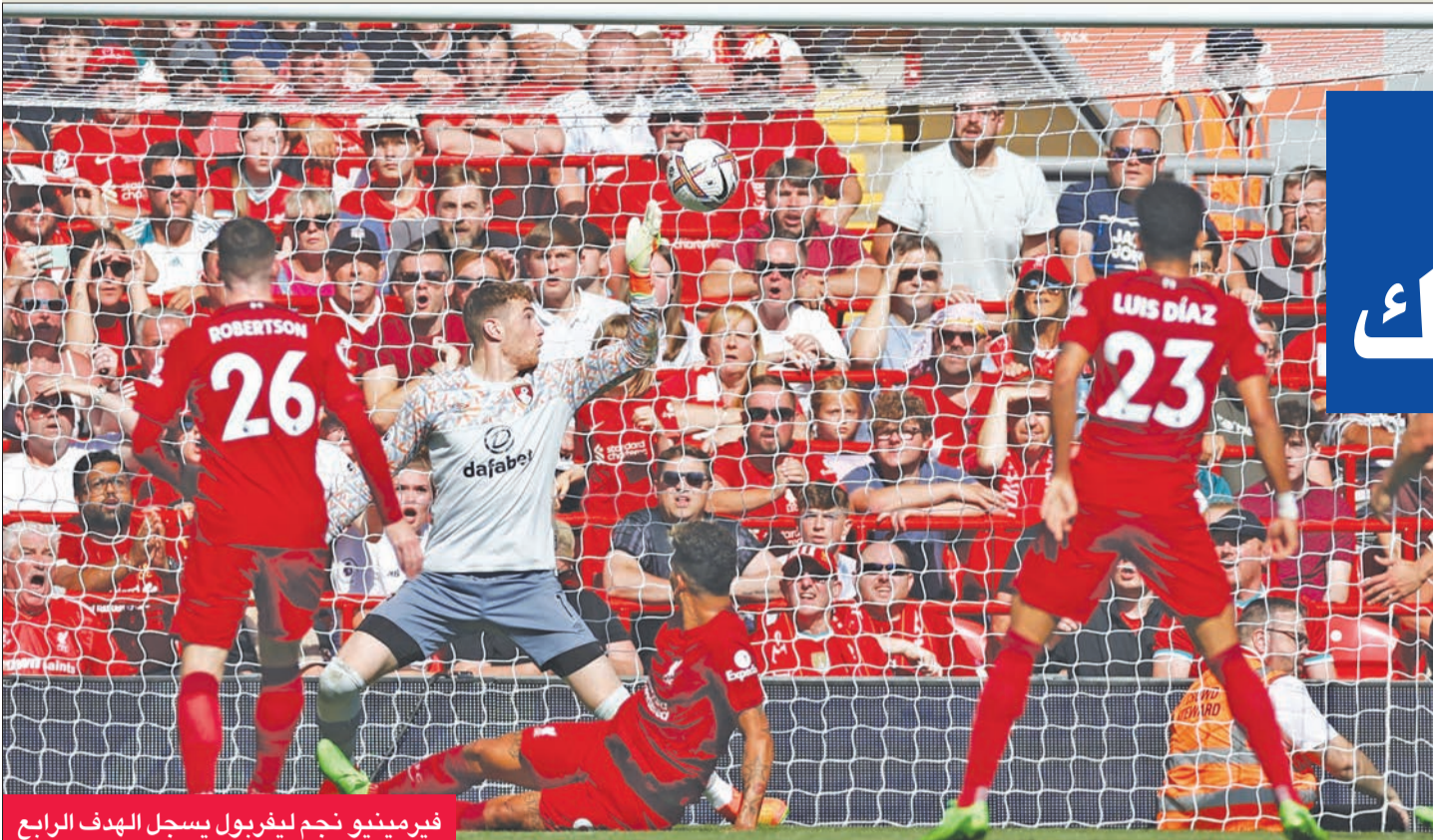
فيرمينيو نجم ليفربول يسجل الهدف الرابع

بينما واصل برايتون أند هوف البيون بدايته الموفقة بانتصار ثاني على التوالي، ثالث هذا الموسم، وهذه المرة بهدف في شباك ليدز يونايتد على ملعب (فالمر)، رافعا رصيده على 10 نقاط يجاور بها المن سبتي في الصدارة مؤقتا.