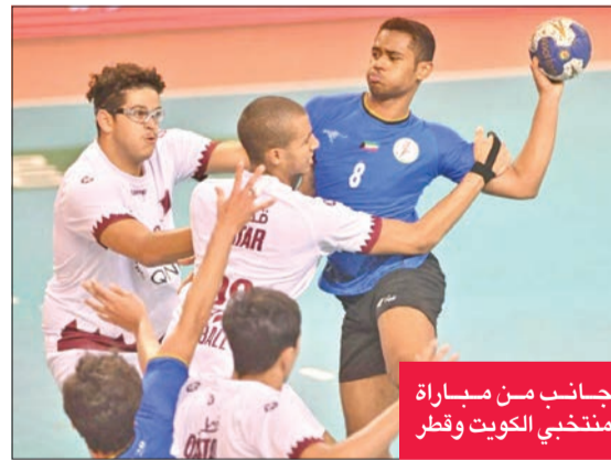
جانث من مباراة منتخب الكويت وقطر

وتوجه إدارة الفريق إلى التعاقد مع محترف آخر يلعب في مركز الارتكاز «السنتر» استعداداً لانطلاق منافسات الموسم الذي سينطلق بعد نهاية البطولة العربية للأندية التي يستضيفها نادي الكويت خلال الفترة من 5 إلى 15 أكتوبر المقبل ويشارك فيها 15 فريقاً من ضمنها الجهراء وكاظمة من الكويت إضافة إلى نادي الكويت المستضيف.