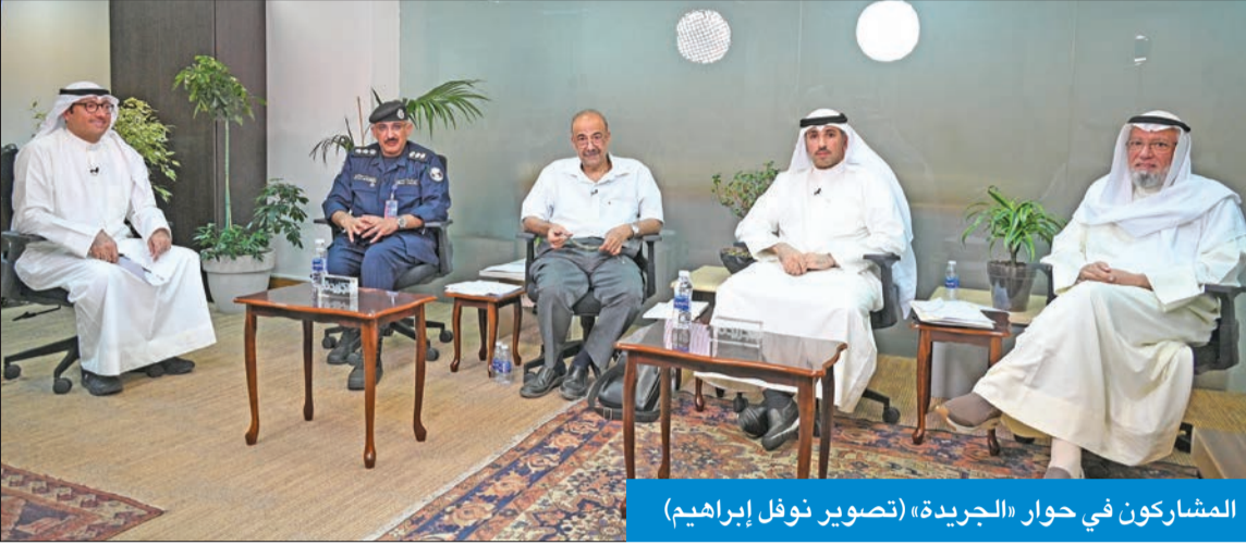
المشاركون في حوار «الجريدة»

الشطي: تصويت الناخب بـ «الجنسية»... ولا حاجة إلى «المدنية» يوم الاقتراع