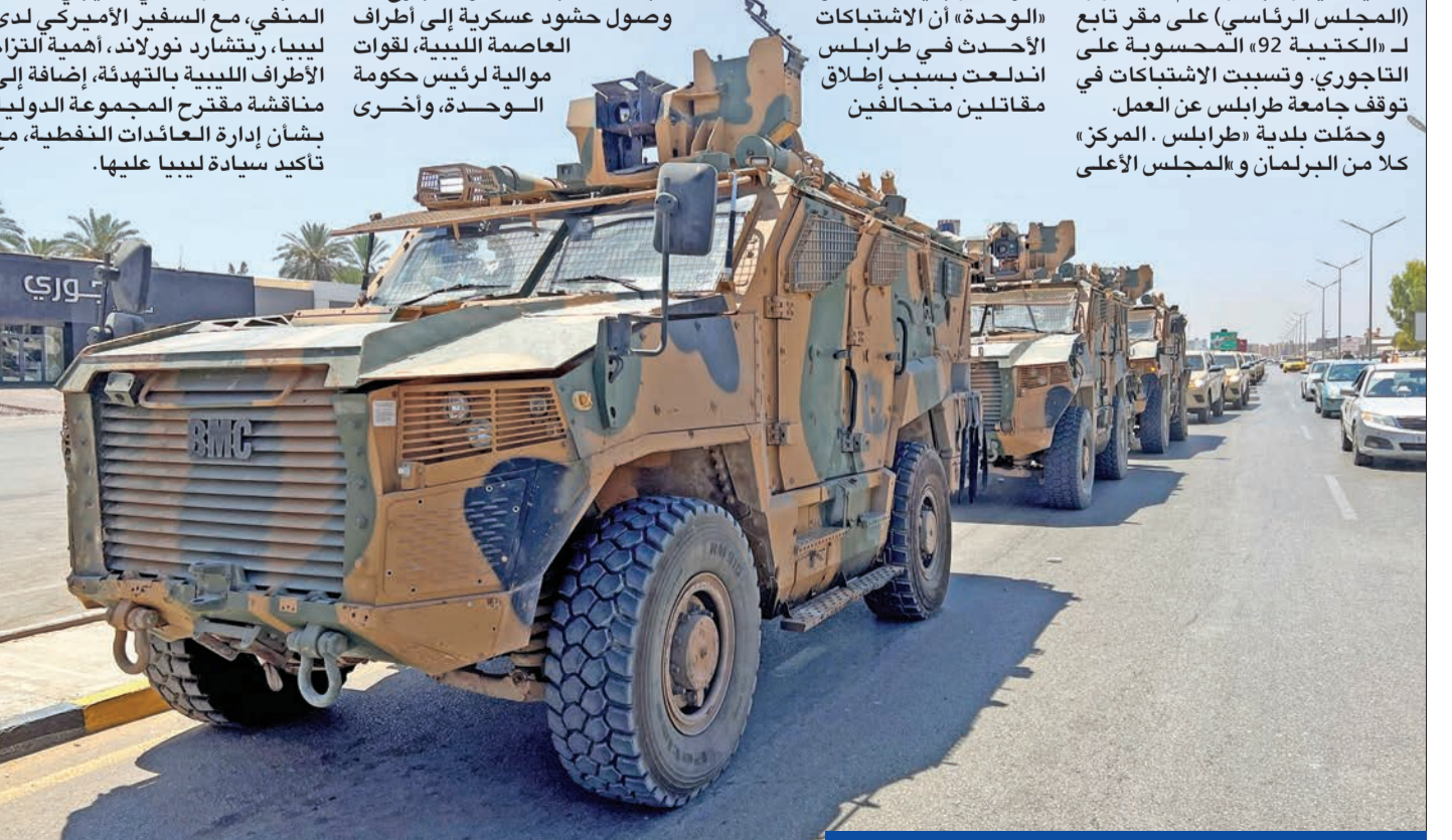
مدرعات الدببية تدخل منطقة الاشتباك في طرابلس أمس

فجر الصراع الدائر على السلطة بين حكومة الوحدة الليبية بزعامة عبد الحميد الدببية، وحكومة الاستقرار بزعامة فتحى باشاغا، مسلحة في طرابلس، أمس، خلفت العديد من القتلى، بينهم ممثل كوميدى يدعى مصطفى بركة، وعشرات الجرحى. وشهد وسط طرابلس في منطقتي باب بن عشير وشارع الزاوية، مواجهات بين قوات جهاز دعم الاستقرار وقوات «الكتيبة 777» (رئاسة الأركان)، بقيادة هيثم التاجوري، على خلفية سيطرة جهاز «دعم الاستقرار» (المجلس الرئاسي) على مقر تابع لـ «الكتيبة 92» المحسوبة على التاجوري. وتسببت الاشتباكات في توقف جامعة طرابلس عن العمل. وحملت بلدية «طرابلس . المركز» كلا من البرلمان و«المجلس الأعلى