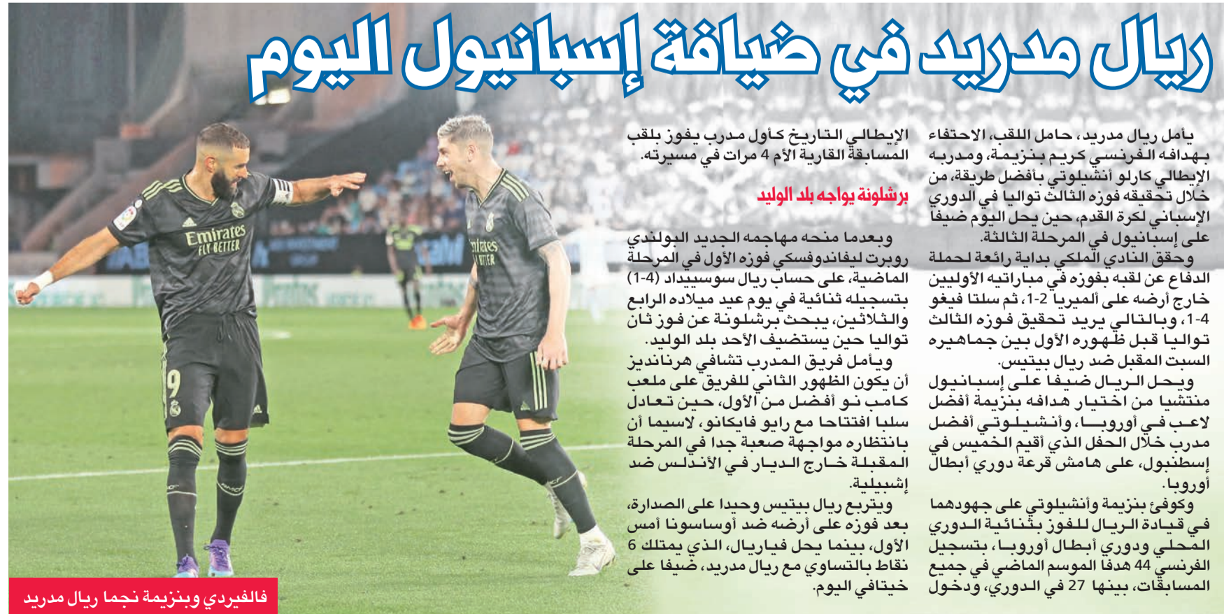
فالغيردي وبنزيمه نجما ريال مدريد