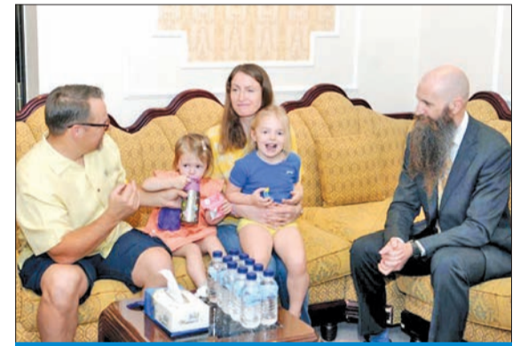
حديث بين القائم بالأعمال الأميركي وعائلة السفارة البريطانية

علينا الاستمرار بمساندة أوكرانيا من دون أن يؤثر أي شيء على هذا الدعم» ونهت لوييس إلى أنه «في حال تخلينا عن دعمنا لأوكرانيا، فإن الدور سيكون تالياً على مولدوفا وجورجيا، والرئيس الروسي فلاديمير بوتين لن يتوقف». وأشادت الوزيرة البريطانية بالموقف الكويتي، معتبرة أن «إدانة الكويت للحرب على أوكرانيا كانت واضحة جداً منذ بداية الأزمة في مجلس الأمن، من خلال معارضتها لهذا الغزو الروسي، على غرار بريطانيا». وفي نهاية الحفل، كرم السفير الأوكراني مجموعة من المواطنين الكويتيين الذين ساندوا القضية الأوكرانية منذ بدايتها.