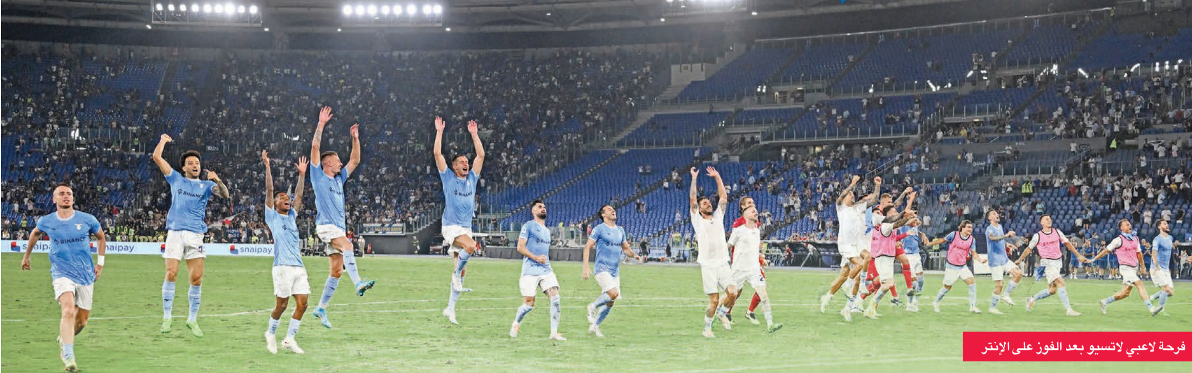
فرحة لاعبي لاتسيو بعد الفوز على الإنتر

فضل بديليه الاسبانيين لويستو وبيدرو، ألحق لاتسيو الهزيمة الأولى بإنتر هذا الموسم بتفوقه على ضيفه 3-1 في الملعب الأولمبي في روما، أمس الأول، ضمن افتتاح المرحلة الثالثة من الدوري الإيطالي لكرة القدم. وتقدم فريق العاصمة عبر البرازيلي فيليبي أندرسون (40)، في حين عادل الأرجنتيني لاوتارو مارتينيس لإنتر (51). إلا أن كلمة الحسم كانت للبدليين البرتو (75) وبيدرو (86) ليرتقي لاتسيو إلى الصدارة. وكرر فريق المدرب ماوريسيو ساري النتيجة ذاتها للموسم الماضي التي جمعت الفريقين في روما. وكان إنتر استهل موسمه بفوزين على كل من ليتشي وسبيتسيا، فيما تعادل لاتسيو سلباً مع تورينو في المباراة السابقة بعد فوز افتتاحي على بولونيا. وأجرى المدرب سيموني إنزاغي