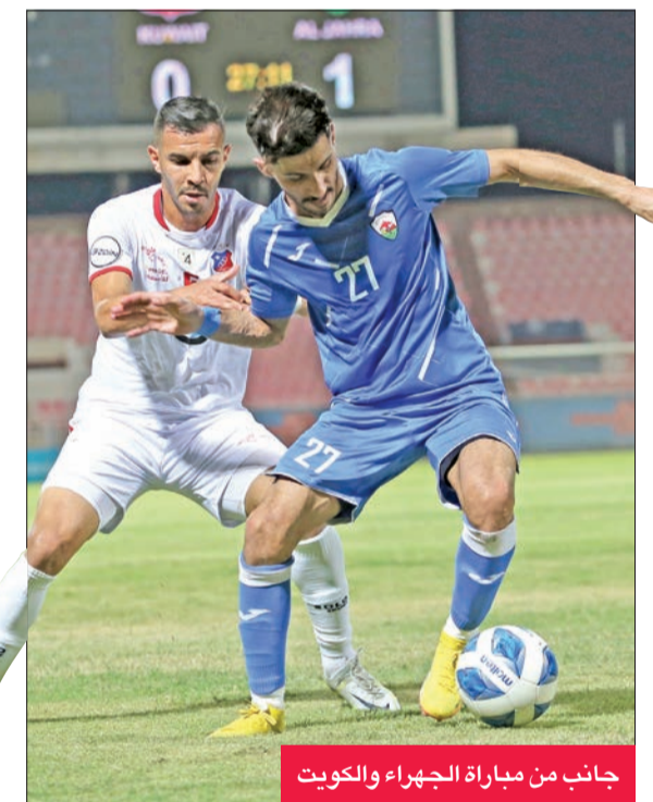
جانث من مباراة الجهراء والكويت

بدوره، أكد مدرب الكويت الكرواتي رادان أن غياب التركيز في استغلال الفرص المتاحة