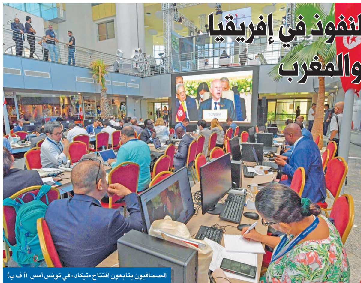
الصحافيون يتابعون افتتاح «تيكاد» في تونس أمس

على هامش النسخة الثانية لمؤتمر «تيكاد» الدولي، الذي أطلقت فيه اليابان العنان لصراع النفوذ الدائر في إفريقيا بين الكتلة الغربية بقيادة الولايات المتحدة والاتحاد الأوروبي والشرقية ممثلة في الصين وروسيا، انفجرت أزمة دبلوماسية إقليمية بين تونس والمغرب بسبب استقبال رسمي حظي به زعيم جبهة البوليساريو إبراهيم غالي من الرئيس التونسي قيس سعيد. وطغت الأزمة الدبلوماسية على أجواء افتتاح المؤتمر الذي راهنت عليه اليابان في تعزيز شراكاتها مع الدول الإفريقية استناداً إلى «نقاط قوتها المتمثلة في النمو المقترن بالجودة والتركيز على الإنسان». ووسط أمال تونس في إنقاذ اقتصادها المتعثر عبر جذب الاستثمارات اليابانية وتحقيق نتائج جيدة في مجالات الصحة وصناعة السيارات والطاقت المتجددة بأكثر من 80 مشروعاً بقيمة 2.7 مليار دولار، فوجئ رئيسها قيس سعيد ببرد صاحب من المغرب على