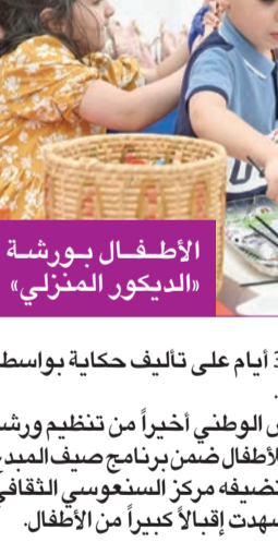
الأطفال بورشة الديكور المنزلي

عزة إبراهيم أطلق المجلس الوطني للثقافة والفنون والآداب ورش تدريب متنوعة تستهدف الأطفال في مجالات فنية مختلفة تواكئ مختلف الاهتمامات. وتم اليوم فتح باب الحجز لورشه العرف على البيانو للأطفال، وأخرى لصناعة الدمى ضمن فعاليات الموسم الثقافي الثاني لأنشطة ثقافة الطفل بمركز عبدالعزيز حسين الثقافي في مشرف، ويبلغ باب الحجز الخميس المقبل. وتنطلق فعاليات ورشة العرف على البيانو للأطفال في 11 سبتمبر 2022، ويتولى الفنان علي دشتي تدريب الأطفال من عمر بين 6 و 11 عاماً العرف على هذه الآلة الموسيقية من الساعة 9 صباحاً حتى 12 ظهراً. أما ورشة دمي في دارنا، فتقدمها الفنانة هدى الشوا، وتستهدف الأطفال في نفس الفئة العمرية من 6 إلى 11 عاماً، وتتولى تدريبهم يوم الأحد الموافق