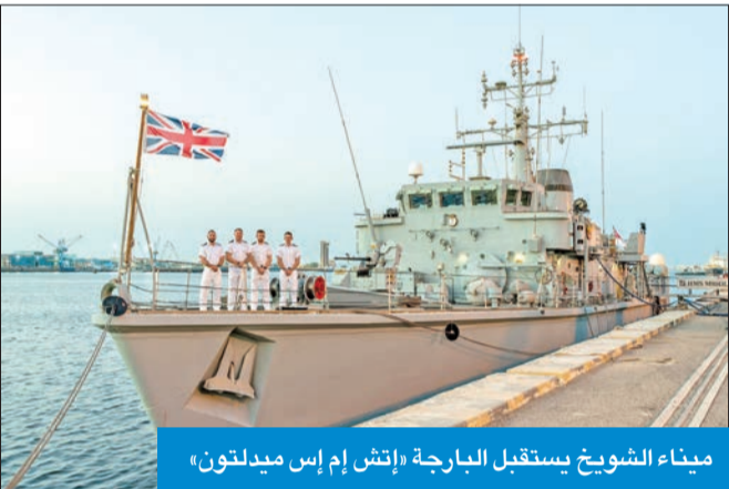
ميناء الشويخ يستقبل البارجة «إتش إم إس ميدلتون»

مشيراً إلى أن العديد من السفن التابعة لأسطول البحرية الكويتية يتم تدريبها من البحرية الملكية.