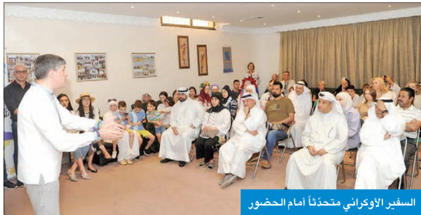
السفير الأوكراني متحدثاً أمام الحضور

علينا الاستمرار بمساندة أوكرانيا من دون أن يؤثر أي شيء على هذا الدعم» ونهت لوييس إلى أنه «في حال تخلينا عن دعمنا لأوكرانيا، فإن الدور سيكون تالياً على مولدوفا وجورجيا، والرئيس الروسي فلاديمير بوتين لن يتوقف». وأشادت الوزيرة البريطانية بالموقف الكويتي، معتبرة أن «إدانة الكويت للحرب على أوكرانيا كانت واضحة جداً منذ بداية الأزمة في مجلس الأمن، من خلال معارضتها لهذا الغزو الروسي، على غرار بريطانيا». وفي نهاية الحفل، كرم السفير الأوكراني مجموعة من المواطنين الكويتيين الذين ساندوا القضية الأوكرانية منذ بدايتها.