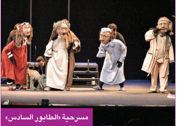
مسرحية «الطابور السادس»