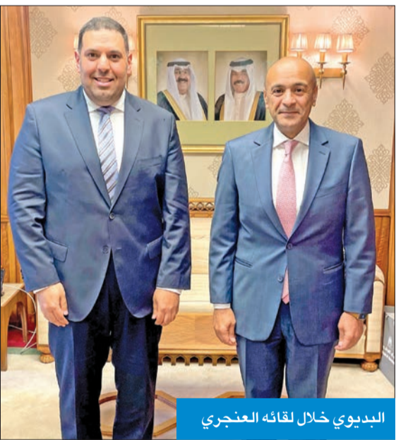
البديوي خلال لقائه العنجري

يقين بأن السفير سيدشن مرحلة متميزة من مراحل العمل الدبلوماسي بين الكويت والمقبل، وسيخلق رزماً جديداً لهذه العلاقات المتينة بما يحقق مصالح الشعبين الصديقين.