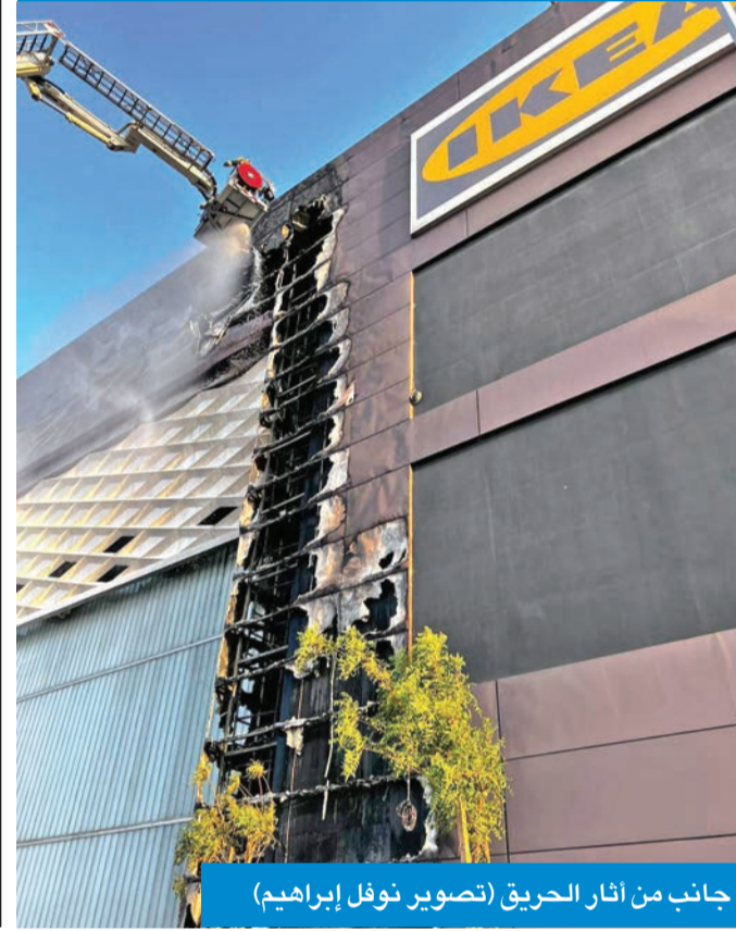
جانب من أثار الحريق