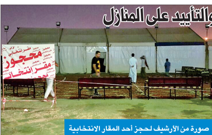
صورة من الأرشيف لحجز أحد المقار الانتخابية

بوضع إعلان من دون ترخيص، متابعة أن المخالفة ستصدر باسم صاحب العقار دون الحاجة إلى إخطار، ومؤكدة أن جميع الإعلانات غير المرخصة ستتم إزالتها، حيث ستقوم البلدية بحملات