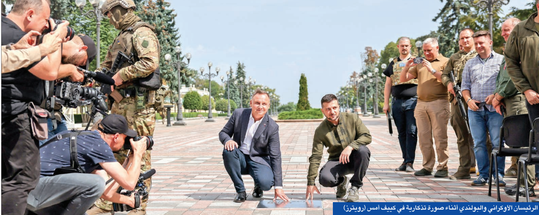
الرئيسان الأوكراني والبولندي أثناء صورة تذكارية في كيف أمس

تركيا تستثمر بأزمة الحبوب • واشنطن تدعو لمغادرة كيف • موسكو تربط خيرسون بالشرق