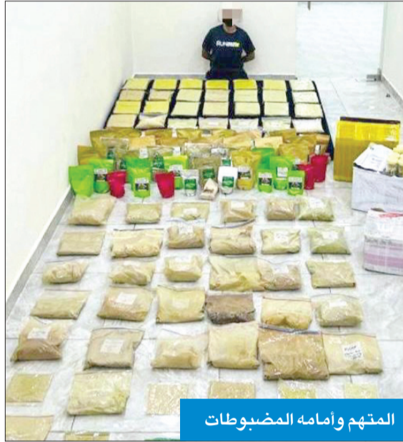
المتهم وأمامه المضبوطات

وأوضح المصدر أن رجال المباحث اصطحبوا المواطن الذي اعترف بأنه يخفي 70 كغم من نفس المادة داخل منزله في منطقة سلوى، وأنه كان يستوردها على دفعات عن طريق الشحن الجوي، لافتاً إلى أن رجال المباحث بعد استصدار إذن من النيابة العامة توجهوا إلى منزل المتهم، وتفتيشه عثروا على 70 كغم من القرطوم مخبأة في أماكن سرية.