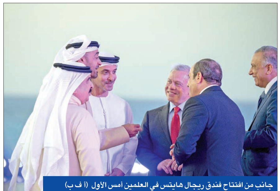
جانب من افتتاح فندق ريجال هايتس في العلمين أمس الأول

التجاري، هاكان أتاي، وعدد من أعضاء مجلس إدارة الجمعية. في غضون ذلك، تحدّث وزير الدفاع التركي عن احتمال تنفيذ عملية عسكرية جديدة في الشمال السوري، معتبراً أن من حق تركيا تنفيذ عمليات عسكرية بالخارج للدفاع عن مصالح البلدان وأجانب المنطقة. والتنظيمات الإرهابية. وقال أكار: «تركيا فعلت ما يلزم وستفعل ما يجب عندما يحين الأوان، بغض النظر عن يقف وراء التنظيمات الإرهابية أو أمامها. من المهم بالنسبة إلينا حماية حقوق ومصالح بلدنا». ورداً على سؤال عما إذا كانت المحادثات مع النظام السوري مستبداً أم لا، قال أكار إن الرئيس إردوغان والوزراء المعنيين أدلوا بتصريحات حول هذا الموضوع، مبيناً أن المحادثات مرتبطة بالظروف والأوضاع. وأضاف: «العملية العسكرية في الشمال السوري تجري فعلياً، كل شيء له مكان وزمان وله تكتيكات وتقنيات وهندسة».