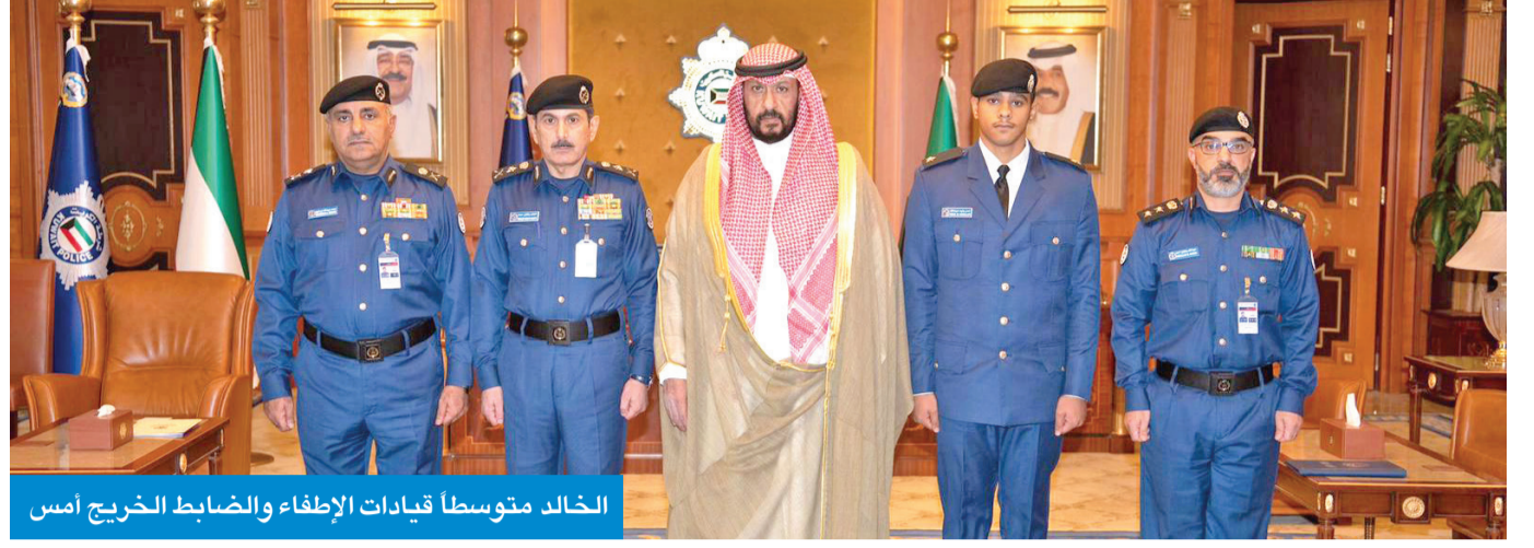
الخالد متوسلاً قيادات الإطفاء والضباط الخريج أمس

شهد نائب رئيس مجلس الوزراء وزير الدفاع وزير الداخلية بالوكالة الشيخ طلال الخالد، أمس، أداء قسم أحد الطلبة الضباط في قوة الإطفاء العام من الدفعة (26) من حملة شهادة دبلوم هندسة إطفاء وذلك في مكتبه