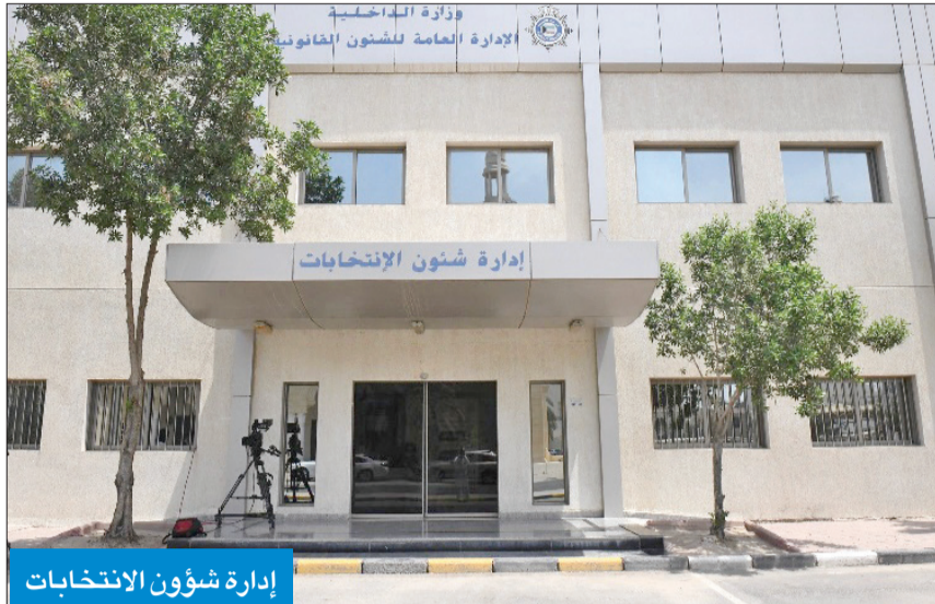
إدارة شؤون الانتخابات

«المدنية»: الوحدة السكنية لا تتجاوز 30 فرداً في رد لها على ما أثير بشأن عدد القيود الانتخابية في كشوف الناخبين للانتخابات البرلمانية القادمة «أمة 2022»، أكدت الهيئة العامة للمعلومات المدنية وفقاً لسجلاتها الرسمية، أن أكثر من 99 في المئة من القاطنين في المنازل ممن يحق لهم المشاركة في العملية الانتخابية لا تتجاوز أعدادهم 30 فرداً في الوحدة السكنية الواحدة. وأوضحت الهيئة في بيان صحافي ردأ على ما بثار بشأن أعداد القاطنين في المنازل أنه استناداً إلى سجلاتها الرسمية فإن من تمثل أعمارهم 21 سنة فأكثر يبلغ عددهم 798.244 ألف ناخب مضافة وفقاً لبياناتها أن عدد قاطني الوحدات السكنية يتراوح ما بين شخص إلى 30 شخصاً كحد أقصى في الوحدة الواحدة.