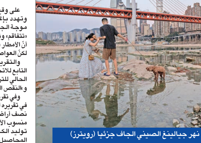
نهر جيالينغ الصيني الجاف جزئياً

على وقع موجات حر أسبوعية أشعلت غابات روسيا وتهدد بإغراق الصين في الظلام، حذر باحثون من أنّ موجة الجفاف الحاد التي تضرب أنحاء في أوروبا «تتفاقم» وتهدد ما يقرب من نصف القارة، مشيرين إلى أنّ الأمطار في بعض المناطق تساهم في تخفيف الوطأة لكن التوقعات العريضة المراقبة لا تحلو من المخاطر. والتقرير الشهري الأخير لمرصد الجفاف العالمي التابع للاتحاد الأوروبي سلط الضوء على مخاطر الجفاف الحالي للترية من جراء موجات الحر المتعاقبة منذ مايو والنقص المستمر» في الأمطار.