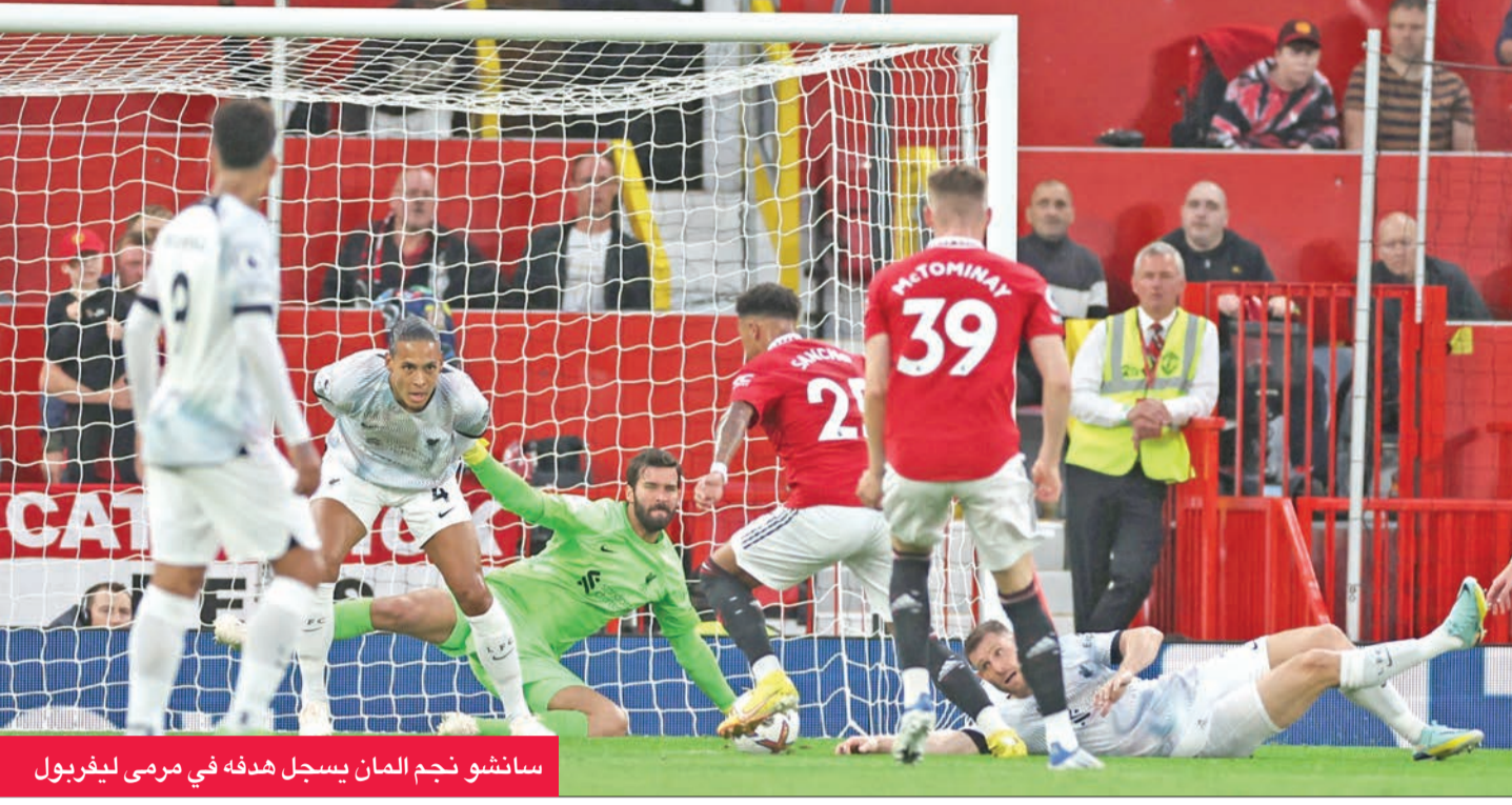
سانشو نجم المان يسجل هدفه في مرعى ليفربول

زارفة فكاء نحو القائم البعيد، لكن ليسون أنقذها بأعوجبة، وتمكن صلاح من تقليص النتيجة في الدقيقة 81، عندما تابع البرتغالي فابيو كارفاليو وأنقذها في الدقيقة 81، عندما تدخل رونالدو بدبلا دون أن يحدث أي فرق، لنتهي المباراة بفوز أول لليونائيد.