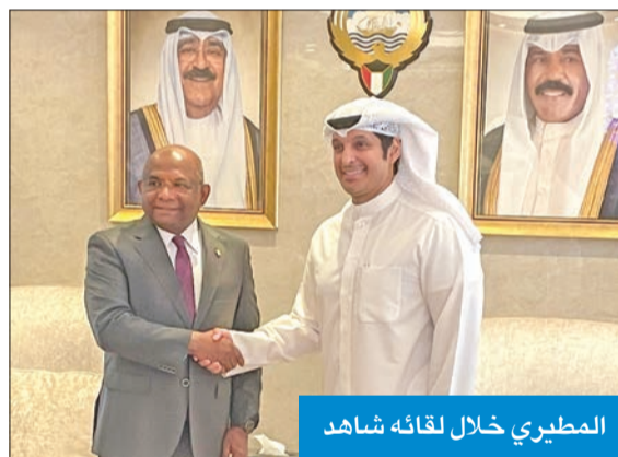
المطيري خلال لقائه شاهد

بحث وزير الإعلام والثقافة وزير الدولة لشؤون الشباب عبدالرحمن المطيري مع رئيس الدورة الـ 76 للجمعية العامة للأمم المتحدة وزير خارجية المالديف عبدالله شاهد عدداً من الموضوعات ذات الاهتمام المشترك المتعلقة بالقضايا الشبابية.