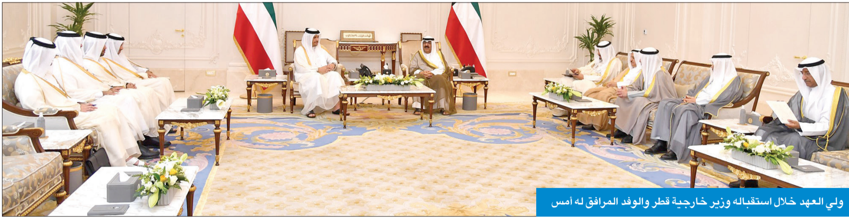
ولي العهد خلال استقبله وزير خارجية قطر والوفد المرافق له أمس

تسلّم سمو ولي العهد الشيخ مشعل الأحمد، بقصر بيان صباح أمس، رسالة خطية موجهة إلى صاحب السمو أمير البلاد الشيخ نواف الأحمد من أخيه أمير دولة قطر الشقيقة الشيخ تميم بن حمد، تتعلق بالعلاقات الأخوية الراسخة التي تجمع البلدين والشعبين الشقيقين، إضافة إلى القضايا ذات الاهتمام المشترك، وأخر المستجدات على الساحتين الإقليمية والدولية. وسلم الرسالة لسموه نائب رئيس مجلس الوزراء وزير الخارجية القطري الشيخ محمد بن عبد الرحمن، بحضور وزير الخارجية الشيخ د. أحمد الناصر. حضر المقابلة كبار المسؤولين بالديوان الأميري وديوان سمو ولي العهد والوفد القطري المرافق. من جانب آخر، استقبل سمو ولي العهد، نائب رئيس مجلس الوزراء وزير النفط وزير الدولة لشؤون مجلس الوزراء د. محمد الفارس والرئيس التنفيذي لمؤسسة البترول الكويتية الشيخ نواف الصباح.