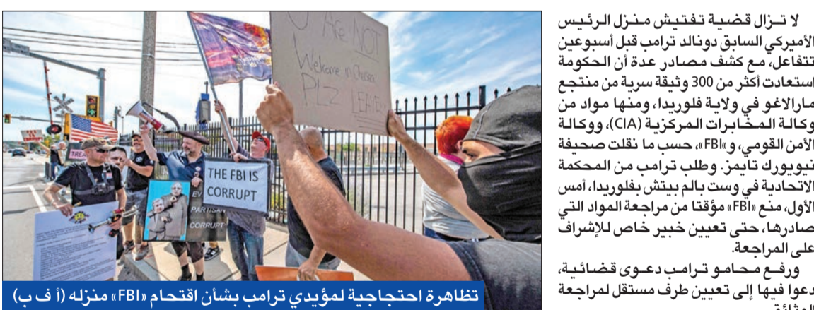
تظاهرة احتجاجية لمؤيدي ترامب بشأن اقتحام «FBI» منزله

محاومه يطالبون بتعيين طرف مستقل لمراجعة 300 مادة أخذت من منزله