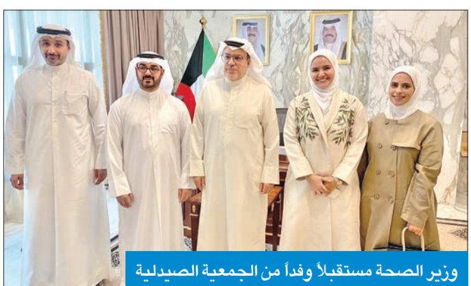
وزير الصحة مستقبلاً وفداً من الجمعية الصيدلية

«قائمة التطوير»: نرفض انتهاك مكانة الصيدلي بحجة غسيل الأموال