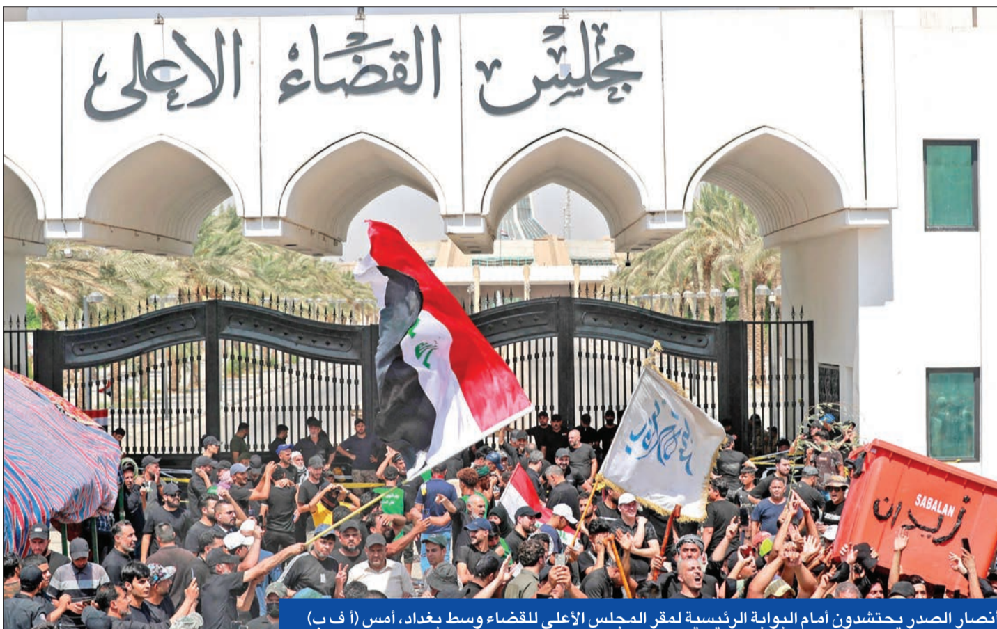
انصار الصدر يحتشدون أمام الجوابة الرئيسية لمقر المجلس الأعلى للقضاء وسط بغداد، أمس

الكاظمي يقطع زيارته للقاهرة ويجدد دعوته للحوار... والاضطرابات الأمنية تخلي مقر «المركزي» المحاكم تعلق عملها وتلاحق قياديين صديين... وتساؤلات عن موقفها من تسريبات المالكي