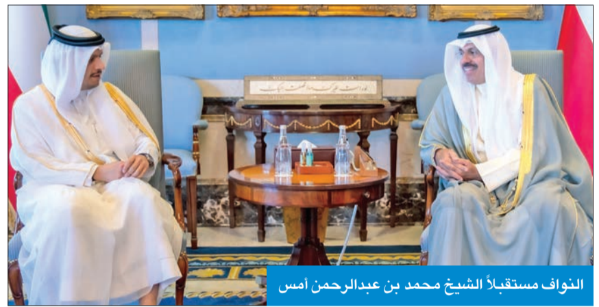
النواف مستقبلاً الشيخ محمد بن عبد الرحمن أمس

وأكد أن علاقات البلدين تنطلق من أرضية صلبة مبنية على العلاقات الاستراتيجية التاريخية الوثيقة المتجددة، مؤكداً عزمه بذل الجهود كافة لتعزيز علاقات التعاون ورفعها.