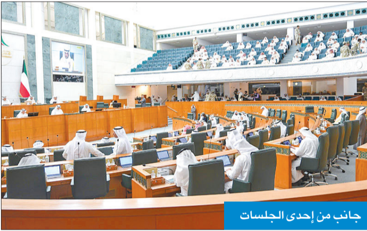
جانب من إحدى الجلسات

قدم 44 نائباً 1322 اقتراحاً برغبة خلال الفصل التشريعي السادس عشر، منها 930 اقتراحاً في دور الانعقاد الأول، بمعدل 70 في المئة، و392 اقتراحاً في دور الانعقاد الثاني بمعدل 30 في المئة من إجمالي الاقتراحات. ومن بين تلك الرغبات قدم النواب 1227 اقتراحاً برغبة قدمت بشكل فردي بمعدل 93 في المئة، و95 رغبة مشتركة بين أكثر من نائب بمعدل 7 في المئة، من إجمالي الاقتراحات برغبة.