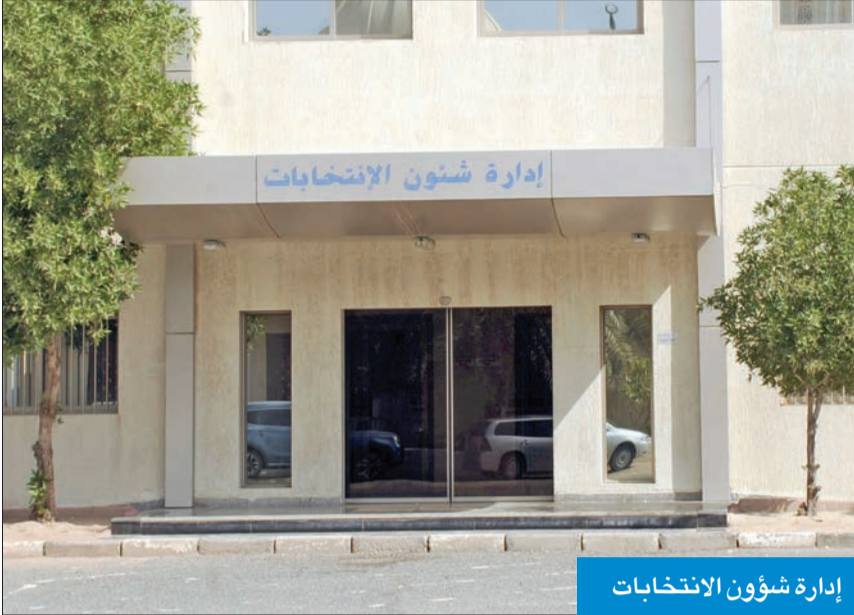
إدارة شؤون الانتخابات

الهاجري: كل كويتي يبلغ 21 عاماً يقيد تلقائياً بكشف الناخبين ويحق له التصويت في «أمة 2022»