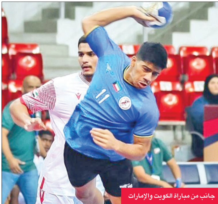
جانب من مباراة الكويت والإمارات

يلتقي منتخب الكويت للناشئين لكرة اليد في الواحدة من ظهر اليوم مع نظيره السعودي في الجولة الثالثة من المجموعة الثانية في البطولة الآسيوية التاسعة لمواليد 2004 التي تستضيفها البحرين حالياً.