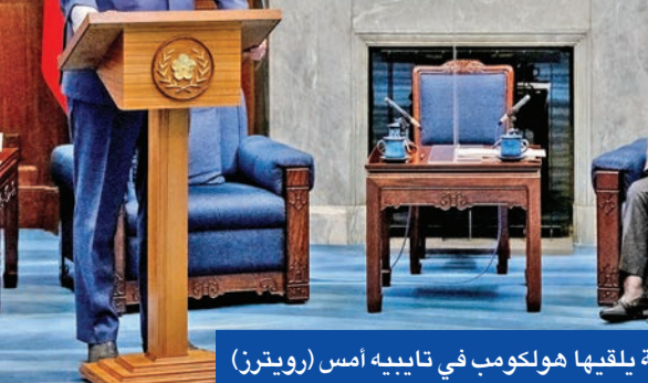
تساي تستمع إلى كلمة بلقيها هولكوب في تايبيه أمس

وأضافت: «في هذه اللحظة يجب على الحلفاء الديموقراطيين الوقوف معاً وتعزيز التعاون في جميع المجالات».