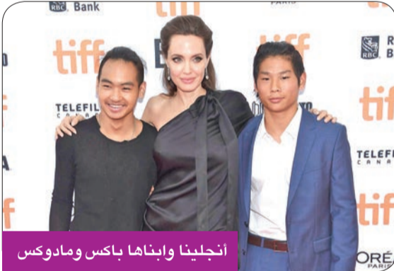
انجلينا وابناها باكس ومادوكس

كشفت النجمة العالمية أنجلينا جولي عن مشاركة اثنين من أبنائها في فيلمها الجديد «Without Blood»، المبني على رواية كتبها اليساندرو باريكو، والصادرة عام 2002، وفقاً لما نشرته صحيفة ديلي ميل البريطانية. وكشفت جولي أن باكس، 18 عاماً، ومادوكس، 21 عاماً، انضموا إلى طاقم العمل كمساعد مخرج في الفيلم الذي تتولى هي مهمة إخراجها، وتم تصوير أحداث الفيلم في إيطاليا. بذكر أن باكس سبق أن عمل مع والدته في دراما First They Killed My Father، وفيلم By The Sea. وفيلم «Without Blood»، هو دراما تروي حكاية لا تنسى في أعقاب نزاع مجهول، وتستكشف أحداثه الحقائق العالمية حول الحرب والصدمات والذاكرة والشقاء.