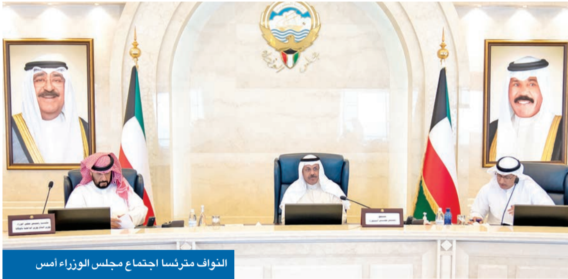
الثواب مترئسا اجتماع مجلس الوزراء أمس

الطعون على قرارات «الانتخابات» تحال إلى «الكلية» لبتها خلال يومين... ومرسوم الدعوة الأحد