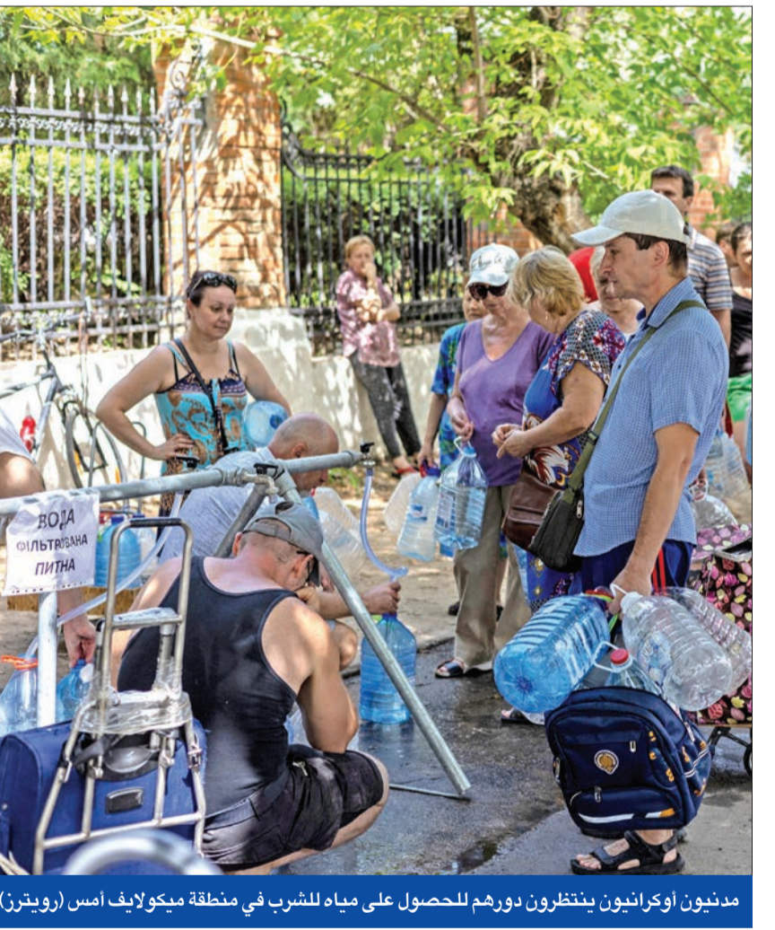
مديون أوكرانيون ينتظرون دورهم للحصول على مياه للشرب في منطقة ميكولايف أمس

ميدانياً، نقل موقع «بيزنس إنسايدر» عن مجموعة الاستخبارات البيلاروسية «هاجون»، أن موسكو تكدس صواريخ في بيلاروسيا، استعداداً لنش هجوم كبير على أوكرانيا. وأضافت «هاجون» إنها لاحظت تراكم الأسلحة في قاعدة زابروفكا الجوية في بيلاروسيا من خلال مراقبة صور أقمار اصطناعية. وبينما أعلن قائد الجيش فاليري زالوغني،