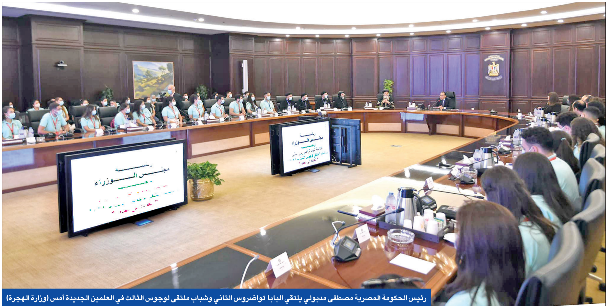
رئيس الحكومة المصرية مصطفى مدبولي يلتقي البابا تواضروس الثاني وشباب ملتقى لوجوس الثالث في العلمين الجديدة أمس

● تهدئة غزة توتر العلاقات المصرية - الإسرائيلية ● انطلاق مناورات «هرقل 2» العربية - اليونانية