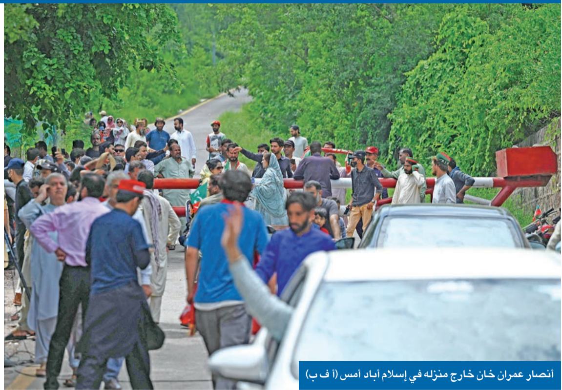
انصار عمران خان خارج منزله في إسلام آباد أمس

وتتعلق تهمة الشرطة الموجهة لخان بخطاب الفقه السبب الماضي في إسلام آباد تعهد فيه بمقاومة قائد شرطة العاصمة والقاضية المسؤولة عن ملف اعتقال وتعذيب أحد مساعديه المقربين المتهم بتعدي الخط الأحمر المتمثل في التحريض على التمرد بالجيش، الذي حكم باكستان على مدى نصف تاريخها 02