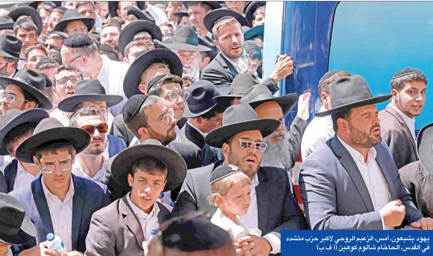
يهود بيشعون، أمس، الزعيم الروحي لأكثر حزب متشدد في القدس، الحاخام شالوم كوهين

شنت «الخارجية» الإيرانية هجوماً على القوى الأوروبية والولايات المتحدة، متهمّة إياها بمحاولة استنزافها في المفاوضات الرامية لإحياء الاتفاق النووي ببغينا، فيما جددت إسرائيل تلويحها بشنّ عمل عسكري ضد الجمهورية الإسلامية إذا اقتربت من تصنيع سلاح ذري، وبخوض حرب على خلفية نزاعها البحري مع لبنان وتهديدات «حزب الله».