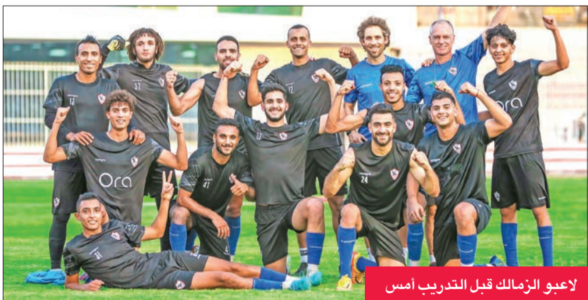
لاعبو الزمالك قبل التدريب أمس

أسد و«الجريدة» ماثلة للطبع، ويكفي الأبيض الفوز أمام الاتحاد الليلة، حيث سيظل الفارق كما هو، وتتبقى مواجهتان فقط على نهاية المسابقة.