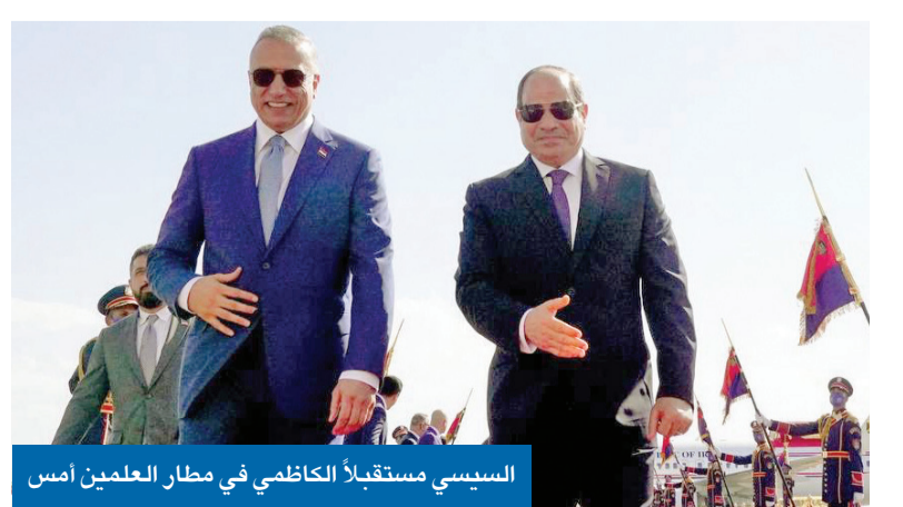
السيسي مستقبلاً الكاظمي في مطار العلمين أمس

اتفق زعماء مصر عبدالفتاح السيسي، والإمارات الشيخ محمد بن زايد، والأردن عبدالله الثاني، والبحرين حمد بن عيسى، ورئيس وزراء العراق مصطفى الكاظمي، أمس، على ضرورة تعزيز التضامن العربي، ووحدة الصف في مواجهة التحديات الأمنية التي تشهدها المنطقة العربية، فضلاً عن التركيز على ملف التعاون الاقتصادي. وكرّزت القمة الخماسية، التي شهدت للمرة الأولى مدينة العلمين الجديدة «المقر الصيفي للحكومة المصرية»، على التكامل الاقتصادي والمشاريع المشتركة في عدة مجالات في مقدمتها تشكيل لجنة لمواجهة الأزمات الاقتصادية الطارئة وإنشاء ممر تجاري عربي، وتأمين 02