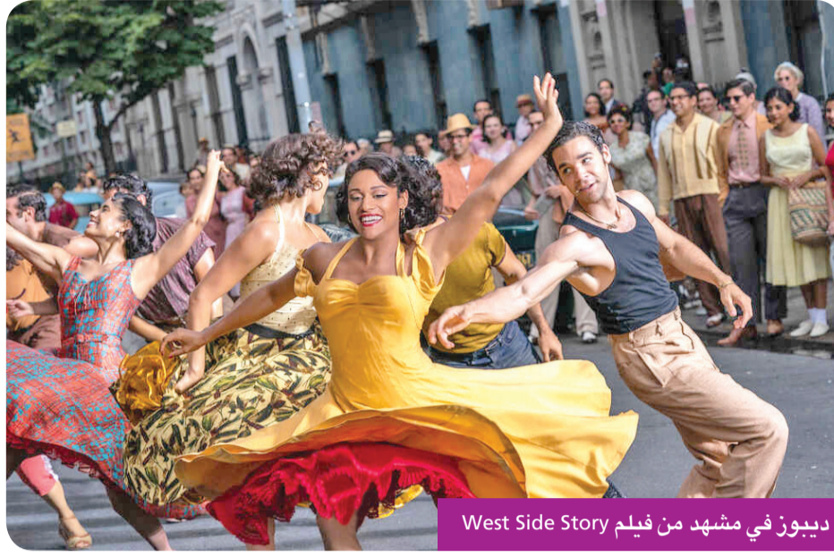
ديوز في مشهد من فيلم West Side Story

تشارك النجمة أريانا ديوز في بطولة فيلم الرعب النفسي House Of Spoils، الذي سيتم طرح العمل عبر إحدى المنصات الرقمية. وتجسد أريانا في الفيلم المذكور شخصية طاهية طموحة تفتتح أول مطعم لها، لكن يتحتم عليها أن تتعامل مع الروح القوية لمالك العقار السابق الذي يهدد بتخريب مطعمها الجديد، في إطار من الإثارة والتشويق. حازت ديوز جائزة أوسكار عن دورها في فيلم West Side Story بشخصية أيتها وهي أول ممثلة من أصول إفريقية لاتينية تقوم بتجسيد هذا الدور بشكل علني وحازت عنه جائزة غولدن غلوب أيضاً، كما أنها مثلت في مسلسل موسيقي عرض على إحدى المنصات تحت عنوان «Schmigadoon»، ولديها عمل مقبل بدور بطلة خارقة في فيلم Kraven the Hunter وفيلم آخر بعنوان Argyle. وكانت آخر أعمال أريانا ديوز هو الموسم الرابع من سلسلة Westworld، الذي انطلق عرضه على شبكة HBO في 7 أغسطس الجاري. وكان قد بدأ عرض الموسم الرابع من سلسلة Westworld يوم 26 يونيو الماضي، قبل أن يأتي الموسم الرابع من Westworld من 8 حلقات، تطرح بشكل أسبوعي، على أن يعود الممثل العالمي جيمس مارسدن، إلى الموسم الرابع من سلسلة Westworld. بعد أن لعب دور البطولة في الموسم الأول والثاني من السلسلة على شبكة HBO. ودار الموسم الثالث بعد 3 أشهر من أحداث الموسم الثاني، حيث هربت Dolores من Evan