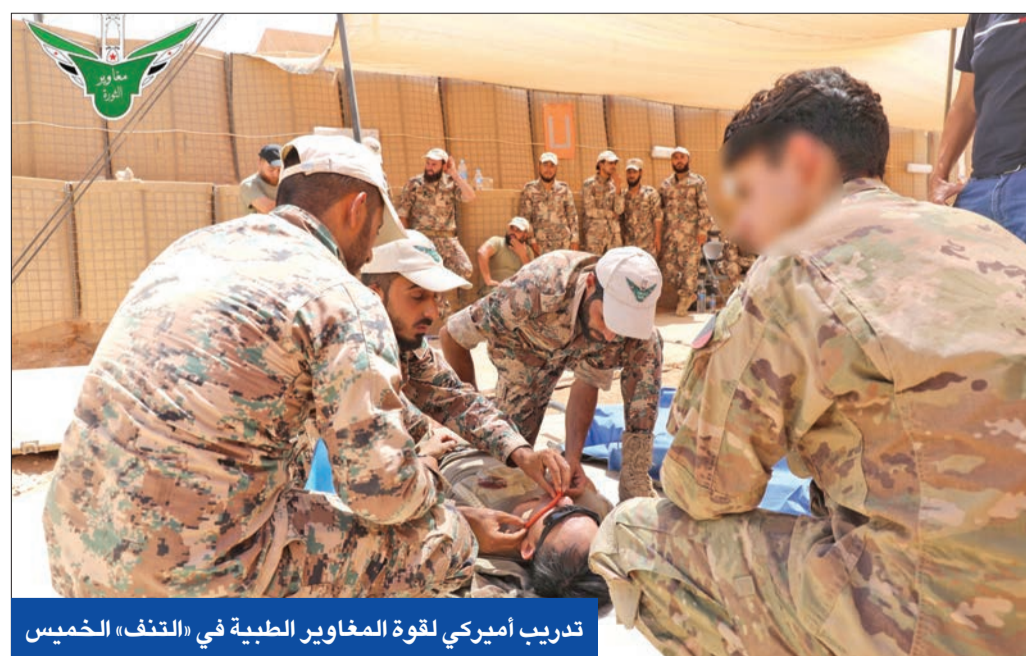
تدريب أميركي لقوة المغاوير الطبية في «التنف» الخميس

غارات روسية تقطع الكهرباء عن إدلب... وقصف تركي على «قسد»