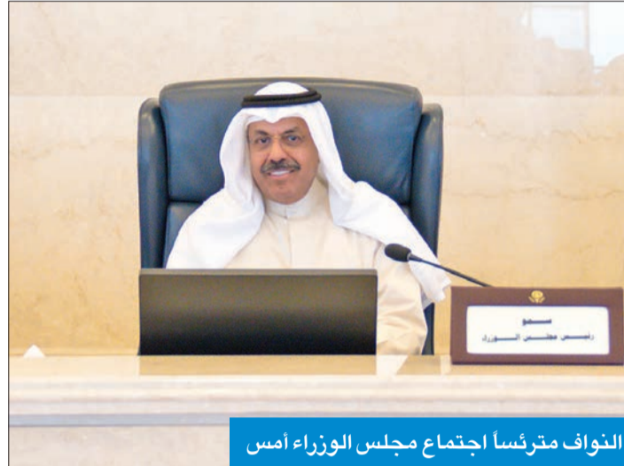
النواف مترئساً اجتماع مجلس الوزراء أمس

اعتمد مجلس الوزراء مشروع مرسوم بتشكيل مجلس إدارة الهيئة العامة للاتصالات وتقنية المعلومات مدة 4 سنوات، وينص على تعيين م. عمر سعود العمر رئيساً، وم. عبدالله العجمي نائباً للرئيس، ود. وليد الحساوي، وم. محمد الموسى عضوين متفرغين، وم. رنا الرشيد، وم. شيماء التركيت، ود. فهد الزميع أعضاء غير متفرغين.