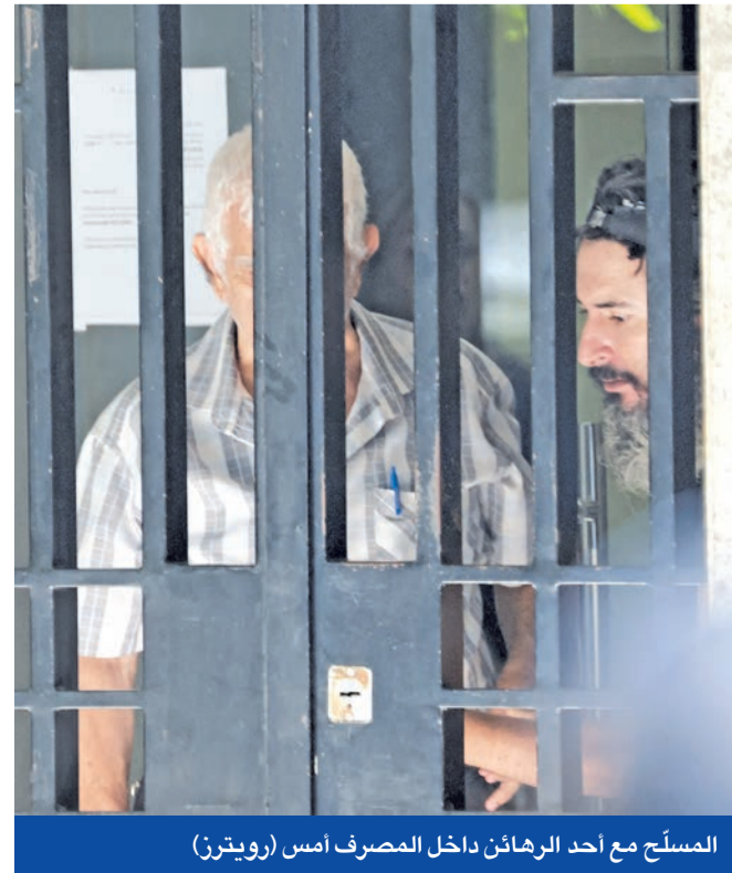
المسلح مع أحد الرهائن داخل المصرف أمس

بوصعب لعون: ترسيم الحدود قبل شهر سبتمبر حفاظاً على الاستقرار