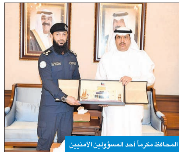
المحافظ مكرماً أحد المسؤولين الأمنيين

أكد محافظ حولي علي الأصغر أن مكافحة الآفة المخدرات تعتبر واجباً وطنياً على كل محب لهذا الوطن، مشيراً إلى أضرارها الكبيرة على عقول الشباب، والتي تؤثر سلباً على أسرهم.