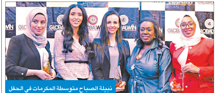
نبيلة الصباح متوسطة المكرمات في الحفل

شاركت في حوار مفتوح نظمته «جلوبال ون» بجامعة لندن