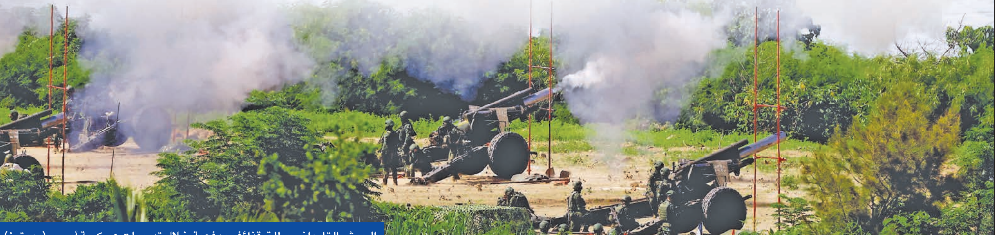
الجيش التايواني يطلق قذائف مدفعية خلال تدريبات عسكرية أمس

وذكرت «غارديان» أمس، أن «السعودية تخطط لإقامة حفل استقبال لشي»، من دون