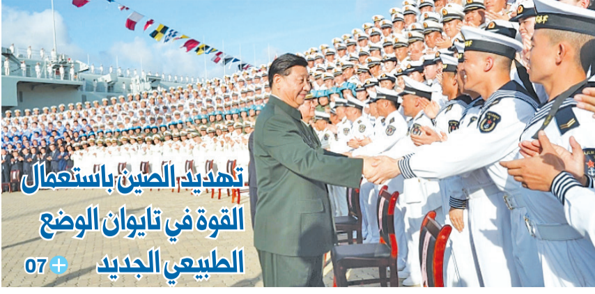
تهديد الصين باستخدام القوة في تايوان الوضع الطبيعي الجديد