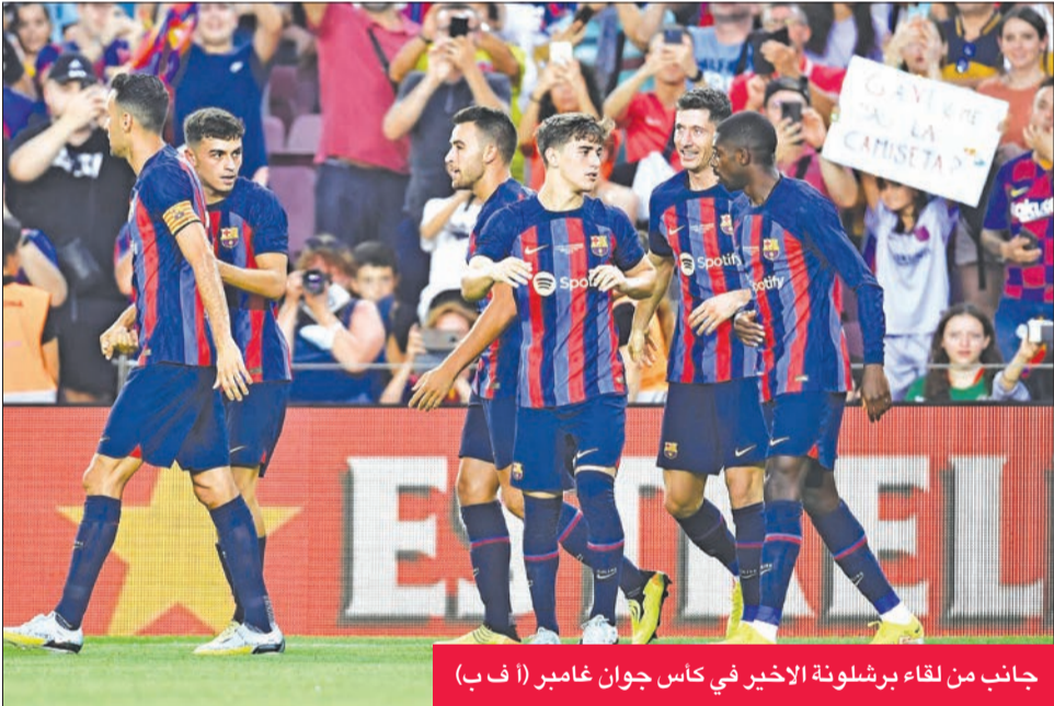
جانب من لقاء برشلونة الأخير في كأس جوان غامبر