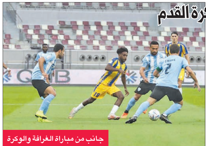
جانب من مباراة الغرافة والوكرة

في الجولة الثانية من الدوري القطري لكرة القدم