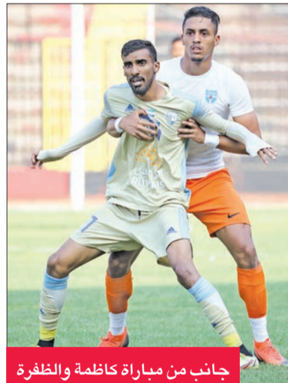
جانب من مباراة كاظمة والظفرة

تمكن الفريق الأول لكرة القدم بنادي الساحل من الفوز على الخليج السعودي بنتيجة 1-2 في المباراة التجريبية، التي جمعتهم أمس في معسكر كارتيني بتركيا.