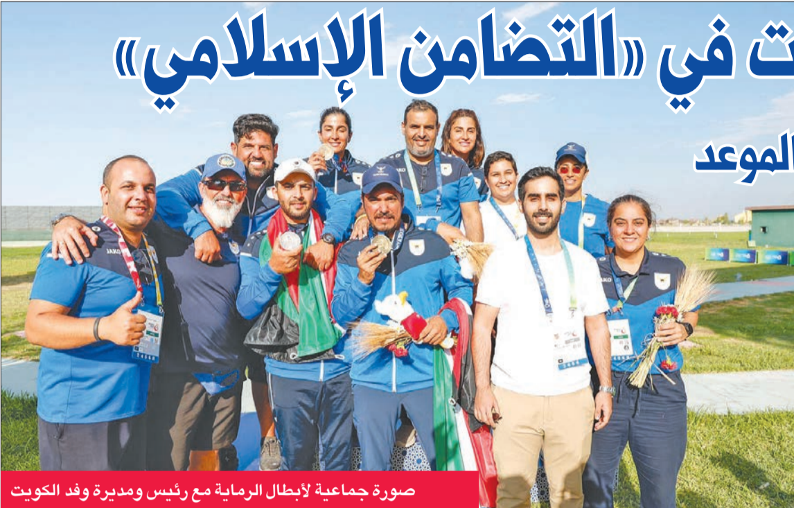
صورة جماعية لإبطال الرماية مع رئيس ومديرة وفد الكويت

«الرمية» تواصل تألقها و«الدراجات الهوائية» على الموعد