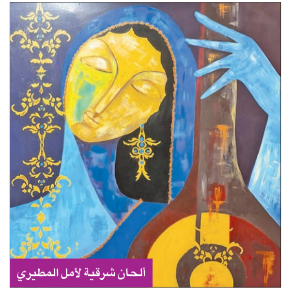
الحان شرقية لأمل المطيري