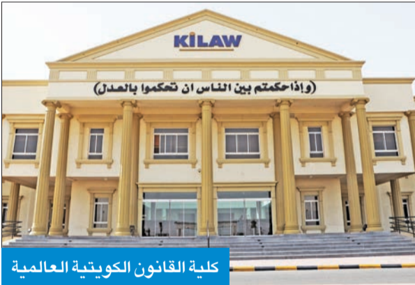
كلية القانون الكويتية العالمية

الشهاب: المعدل واختبار القدرات والمقابلة الشخصية شروط القبول بالكلية