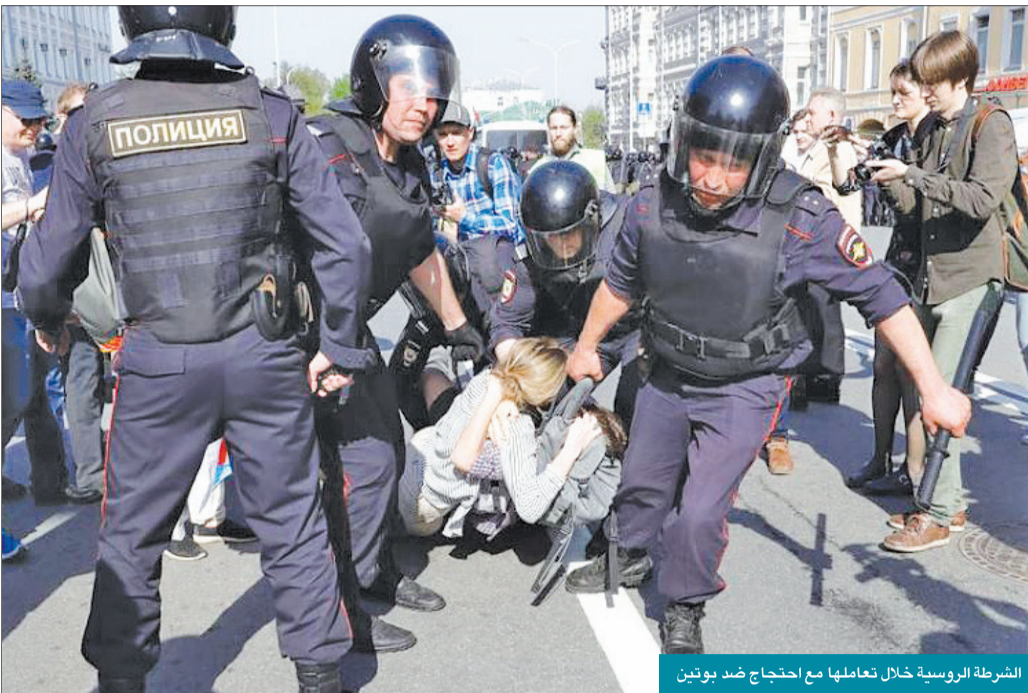
الشرطة الروسية خلال تعاملها مع احتجاج ضد بوتين

هربوا من روسيا السوفياتية، واقنع عدد كبير منهم بالعودة إلى بلده، لكن انتهى بهم الأمر في معسكرات ستالين. لهذه الأسباب وسواها، كانت المفوضية الشعبية للشؤون الداخلية مُصممة لخدمة نظام يخوض حرباً متواصلة ضد أعدائه السياسيين، وضد رفاقه القدامى داخلياً وخارجياً، وضد الغرب، بدت المفوضية قوية ومرعية لهذه الدرجة لأنها كانت تطعج أوامر ستالين وحده، لا الحزب الشيوعي أو الحكومة السوفياتية.