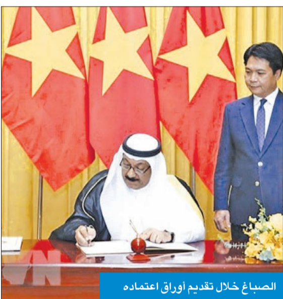
الصباغ خلال تقديم أوراق اعتماده

قدم سفير الكويت لدى فيتنام يوسف الصباغ أوراق اعتماده إلى رئيس جمهورية فيتنام الاشتراكية نغيون شوان فوك، خلال المراسم التي جرت في القصر الرئاسي بالعاصمة هانوي.