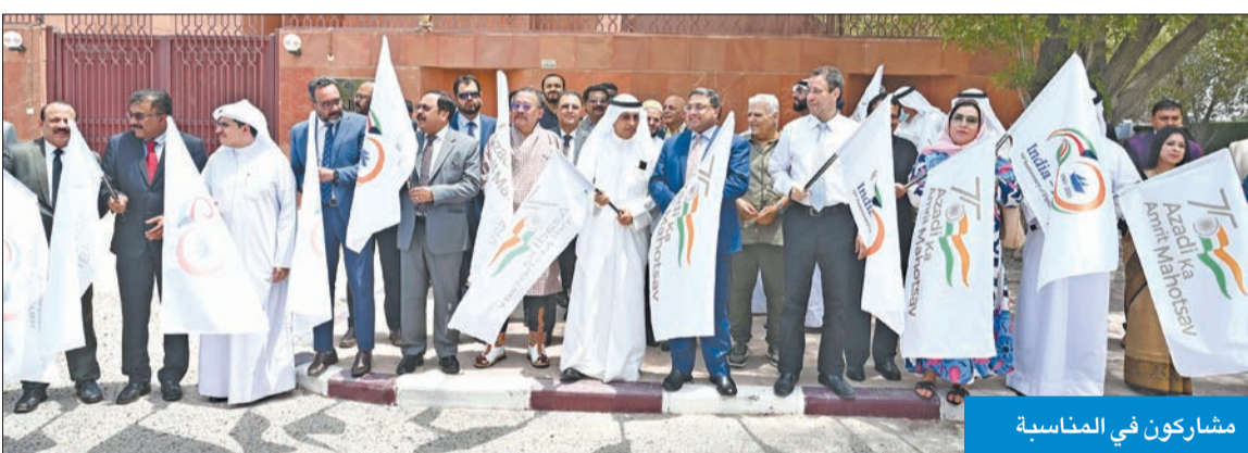
مشاركون في المناسبة