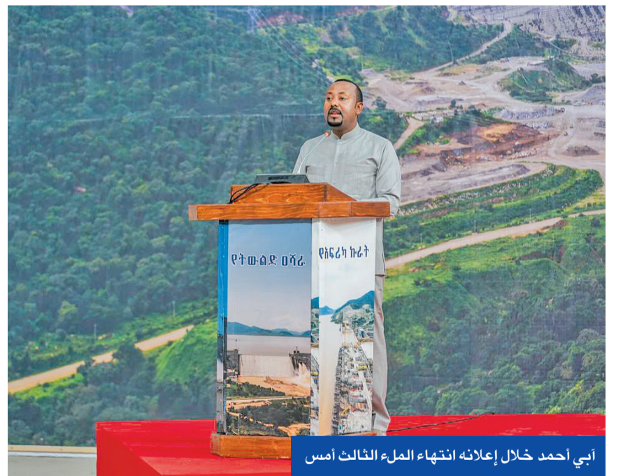
أبي أحمد خلال إعلانه انتهاء الملء الثالث أمس

وهنا أحمد مواطنيه على الإنجاز الكبير وعلى إسهاماتهم المستمرة في المشروع، وقال في كلمة من موقع السد، إن الملء الثالث لبحيرة السد انتهى، بتعبئة 22 مليار متر مكعب وأن المياه لم تتوقف يوماً واحداً أثناء الملء، لافتاً إلى أن «النجاحات تثبت أن ازدهار إثيوبيا سيحقق حتماً».