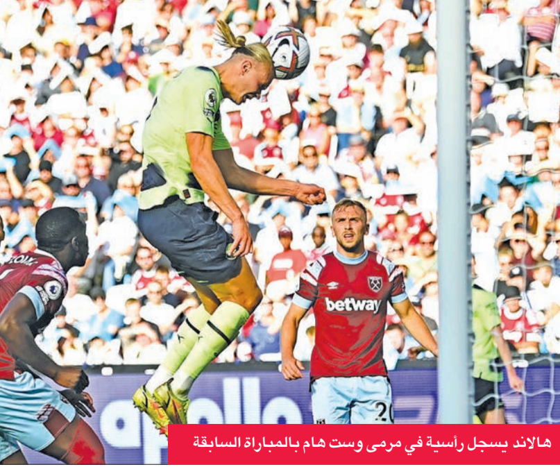
هالاند يسجل راسية في مرمى وست هام بالمباراة السابقة

يتطلع فريق مانشستر سيتي لتحقيق فوزه الثاني على التوالي في حملة دفاعه عن لقبه في الدوري الإنجليزي لكرة القدم؛ عندما يواجه بورنموث غداً ضمن الجولة الثانية من المسابقة.