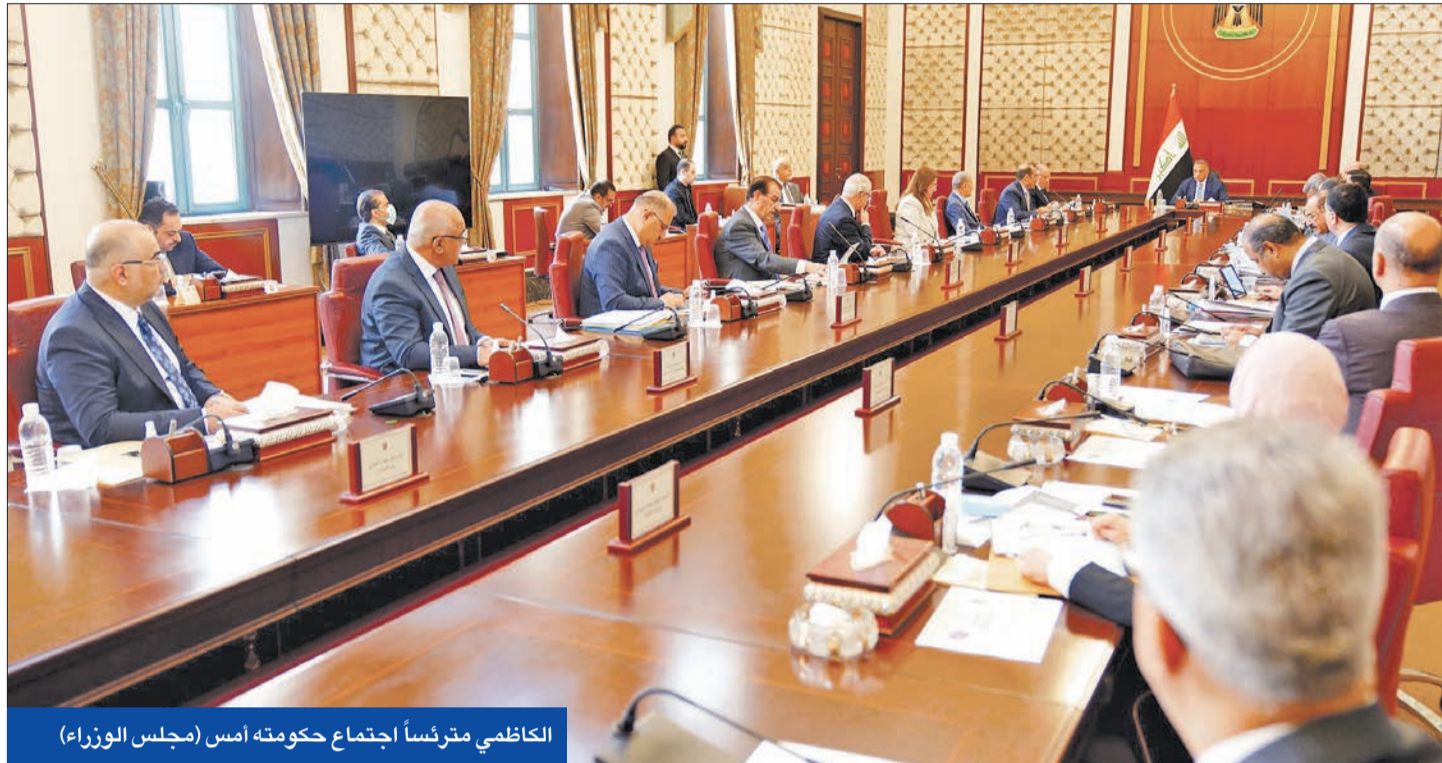
الكاظمي مترسماً اجتماع حكومته أمس (مجلس الوزراء)

الكاظمي يشكو غياب الموازنة ومستعد لتسليم السلطة ووزير الدفاع يحذر الجيش من الانجرار للفتنة