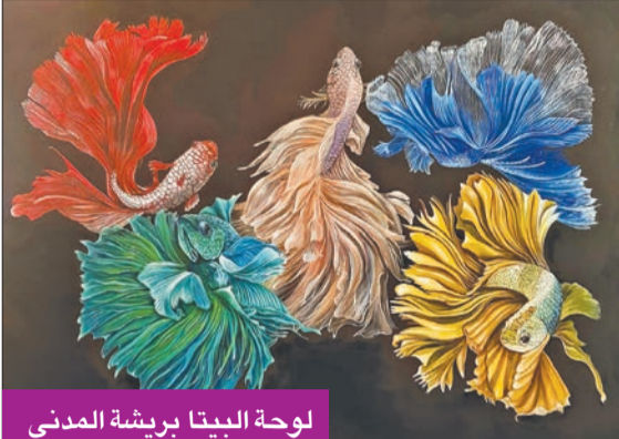
لوحة البيتا بريشة المدني

البورتريه بأدق التفاصيل وإبراز كل جزء فيه، مثل الانعكاس بالعين والتفاصيل، فأصبحت محل تقدير من الفنانين العالميين ومحبي الفن من خلال منصات التواصل المتعددة. وأكد أن الفريق يهدف إلى تنمية مهارات الرسامين، ووضع خطط مستقبلية لتحقيق أهدافهم وإيصالهم وإرشادهم إلى طريق تحقيق أحلامهم الفنية ونجاحاتهم،