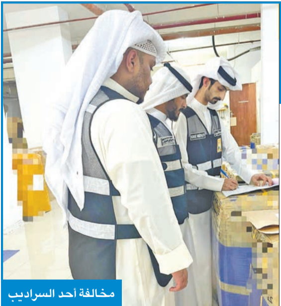
مخالفة أحد السراديب

مع انطلاق فترة التسجيل المبكر للطلبة المستمرين في جامعة الكويت للفصل الدراسي الأول، استعان العديد منهم بتطبيق VPN خلال تسجيل مقرراتهم الدراسية، بسبب فشلهم في الدخول على صفحة التسجيل الخاصة بالعمادة لاستكمال جداولهم الدراسية. وفي هذا الصدد، كشفت مصادر طلابية في الجامعة لـ«الجريدة»، أن اللجوء إلى هذه الألية ليس جديداً، حيث تم استخدامها بالتسجيل في الفصول الدراسية الماضية، نظراً لمعالجتها مشاكل الإنترنت وتحديث صفحات الدخول لدى الطلبة حتى يتمكنوا من التسجيل فور تفعيلها والدخول لأكثر من مرة إلى موقع التسجيل، لتستنى لهم الدخول مباشرة أثناء موعد الطالب. وتابعت المصادر: إن تطبيق الـ«VPN» من التطبيقات التي تقوم بتشفير المعلومات الخاصة على الهواتف الذكية للمستخدم عن طريق إخفاء هويته الإلكترونية والربط السريع