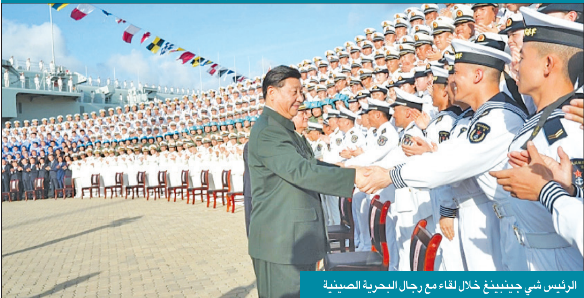
الرئيس شي جينبينغ خلال لقاء مع رجال البحرية الصينية

المقبل، من المتوقع أن يبدأ شي جينبينغ ولاية ثالثة وغير مسبوقة كرئيس للصين ويحصل على صلاحية اختيار رئيس الوزراء الجديد ومستشار الدولة ووزير الخارجية، ويتوقع الخبراء أن تكون الشخصيات التي يختارها متشدة في مواقفها تجاه تايوان.