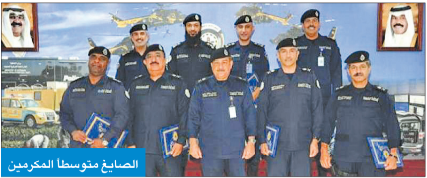
الصايغ متوسطا المكرمين

كرم وكيل وزارة الداخلية المساعد لشؤون المرور والعمليات والوكيل المساعد لشؤون الأمن العام بالتكليف اللواء جمال الصايغ، مديري الأمن لإشرافهم المباشر على تنفيذ خطة تأمين الحسينيات.