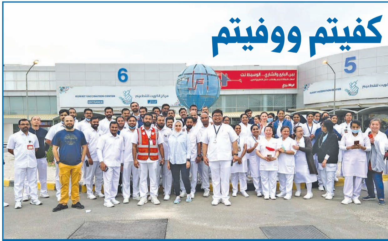
أعلنت وزارة الصحة إغلاق مركز الكويت لتطعيم كوفيد 19، بمشرف، على أن يتم البدء بتقديم الخدمة من خلال 16 مركزاً صحياً موزعة على مختلف محافظات البلاد، ويبدو في الصورة كادر المركز الطبي بعد إغلاقه أمس.