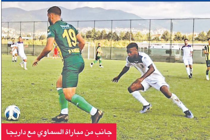
جانب من مباراة السماوي مع داريجا