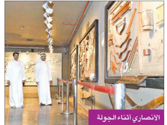
الأنصاري أثناء الجولة

قام الأمين العام للمجلس الوطني للثقافة والفنون والآداب بالإجابة، الأمين العام المساعد لقطاع الآثار والمتاحف بالتكليف، د. عيسى الأنصاري، أمس الأول وأمس، بجولة تفقدية للفن المتاحف والمباني التاريخية التابعة للمجلس، للاطلاع على جاهزيتها للأنشطة والفعاليات القادمة.