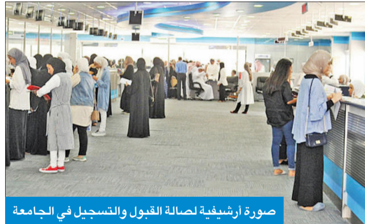
صورة أرشيفية لصالة القبول والتسجيل في الجامعة