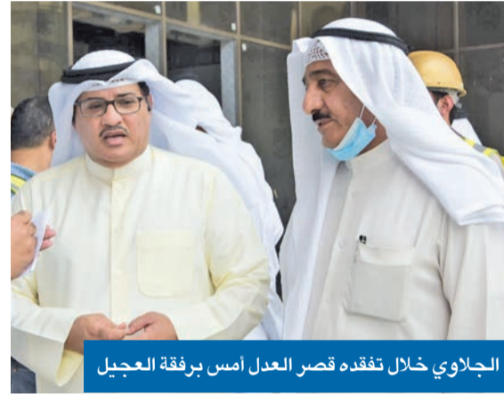
الجلالوي خلال تفقده قصر العدل أمس برفقة العجيل

محدداً بعضاً من ملامح سياسته في وزارة العدل خلال ولايته الجديدة، أكد وزير العدل ونائب وزير الدولة لشؤون النزاهة المستشار جمال الجلاوي، أنه يعمل على إنجاز ملف «تكوين القضاء»، عبر الاستغناء تدريجياً عن الوافدين في هذا المرفق المهم، بالتوازي مع زيادة أعداد المقبولين في النيابة العامة من الكوادر الوطنية كل عام. وقال الجلاوي لـ «الجريدة» عقب تفقده برفقة رئيس المجلس الأعلى للقضاء رئيس محكمة التمييز المستشار أحمد العجيل، مبنى قصر العدل الجديد أمس، إنه سيرعى الأسبوع المقبل مرسوماً بتعيين 41 قاضياً مستشارين في محكمة الاستئناف، مشيراً إلى أن الإحصائيات الأخيرة كشفت أن دوائر المحكمة فصلت فيما يزيد على 95 في المئة من القضايا المتداولة. وسعيًا إلى مواجهة الطعون المتراكمة في محكمة التمييز والبالغة نحو 60 ألفاً، ذكر أن العمل جارٍ مع مستشاريها لزيادة عدد