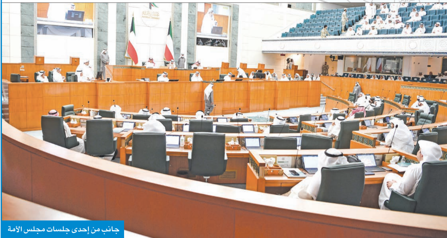
جانب من إحدى جلسات مجلس الأمة

يشهد مجلس الأمة انتخابات جديدة قريبا، ولا يزال عدد من المناطق المأهولة خارج جداول الدوائر الانتخابية، والتي تقدر بـ 10 مناطق، ورغم حساسية ضمّ وتقل المناطق الجديدة إلى الدوائر الانتخابية لدى بعض أعضاء مجلس الأمة، لما قد يشكل فارقاً في أرقام النجاح لدى بعضهم، وهو ما تظهره وثقته مضايقات الجلسات، مع إضافة ضم المناطق في الجداول الانتخابية في أكثر من مجلس، وكذلك تحركات النواب، الأمر الذي كان يسبب حرجا للحكومات السابقة من التدخل فيه، فإنها دائما ما تتخذ موقفاً محايداً بشكل أو باخر، وتعلن أن مسألة توزيع المناطق على الدوائر الانتخابية متروكة لما يراه أعضاء مجلس الأمة. وبرغم تقدّم الحكومة في يوليو 2018 بمشروع قانون لضمّ عدد من المناطق إلى الدوائر الانتخابية وإنجاز لجنة الداخلية والدفاع البرلمانية، بعد مضي نحو 3 سنوات على تقديم الحكومة مشروعها في مارس 2021، فإن مجلس الأمة 2020 طلب سحب تقرير اللجنة من جدول أعمال المجلس بناء على طلب اللجنة في يناير الماضي، مما جعل هذه المناطق خارج جداول الدوائر الانتخابية في انتخابات المجلس المقبل (مجلس 2022). ورغم إمكانية إضافة هذه المناطق إلى الدوائر الانتخابية بمرسوم ضروري، فإنه من المتصور عدم إدراجها في جداول الانتخابات لضيق الوقت، مما قد يسبب حرجا