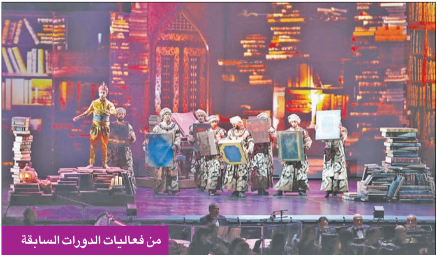
من فعاليات الدورات السابقة

تحتفي فعاليات النسخة التاسعة من مهرجان الشارقة السينمائي الدولي للأطفال والشباب، بمركز الجواهر للمناسبات والمؤتمرات من 10 حتى 15 أكتوبر القادم، بمجموعة واسعة من الأفلام يبلغ عددها 100 فيلم تم إنتاجها في 43 دولة حول العالم.