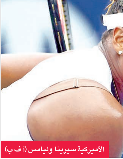
الأميركية سيرينا وليامس (أ ب)

أعلنت أسطورة كرة المضرب الأميركية سيرينا وليامس، أمس الأول، أن «العد التنازلي قد بدأ لاعتزاليها اللعبة». وقالت حاملة لقباً 23 لقباً في البطولات الأربع الكبرى والبالغة 40 عاماً في منشور عبر حسابها على إنستغرام، إنه «باتي وقت في الحياة يتعين علينا فيه أن نقرر التحرك في اتجاه مختلف». وأضافت أن «هذا الوقت يكون دائماً صعباً عندما تحب شيئاً ما كثيراً. يا إلهي، أنا استمتع بالتنس. ولكن الآن، بدأ العد التنازلي». وتابعت «يجب أن أركز على كوتي