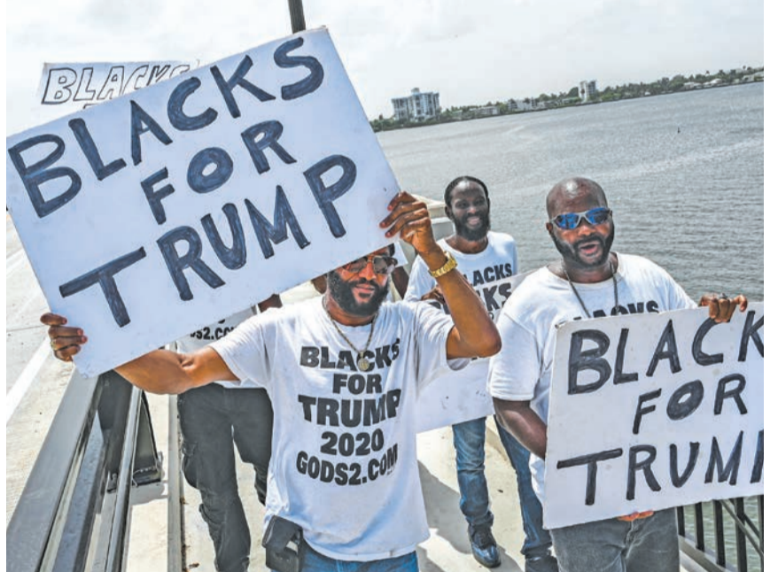
مؤيدون لترامب قرب مقر إقامته في بالم بيتش أمس الأول

أثارت مداهمة مكتب التحقيقات الفدرالي الأميركي (FBI) لمقر إقامة الرئيس السابق دونالد ترامب في فلوريدا، عاصفة سياسية في بلد منقسم ويعاني الاستقطاب الحاد، وأعرب كبار مسؤولي الحزب الجمهوري عن دعمهم للرئيس السابق، الذي توسعت ملاحقته القضائية لتشمل مصادرة هاتف حليفه النائب سكوت بييري. وفاقت عملية الدهم المباغثة الإثنين الماضي، الضغوط القضائية التي يتعرض لها رئيس الولايات المتحدة الـ 45، وسط ترحيب من خصومه السياسيين وإدانة من أنصاره. ويُندد ترامب بـ «سوء سلوك من جانب الادعاء العام واستخدام لنظام العدالة سلاح من جانب الديموقراطيين من اليسار المتطرف، الذين يحاولون بشكل يائس منعي من الترشح للرئاسة في 2024»، وقال