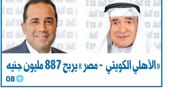
«الأهلي الكويتي - مصر» يريح 887 مليون جنيه