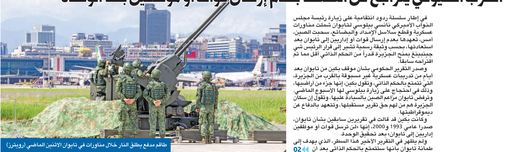
طاقم مدفع يطلق النار خلال مناورات في تايوان الاثنين الماضي

الحزب الشيوعي يتراجع عن التعهد بعدم إرسال قوات أو موظفين بعد الوحدة