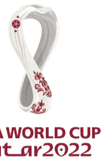
FIFA WORLD CUP Qatar 2022

في خطوة ترمي إلى اتباع التقليد الذي يقضي بمشاركة حامل اللقب أو البلد المضيف في المباراة الافتتاحية، قرر منظمو مونديال قطر 2022، وفقاً لما كشفتته مصادر وكالة «فرانس برس»، تقديم المباراة الافتتاحية 24 ساعة فقط، لتكون انطلاقته 20 نوفمبر المقبل، وهو ما قوبل بعدم تعليق من الاتحاد الدولي لكرة القدم (الفيفا) واللجنة المنظمة المحلية حتى الآن.