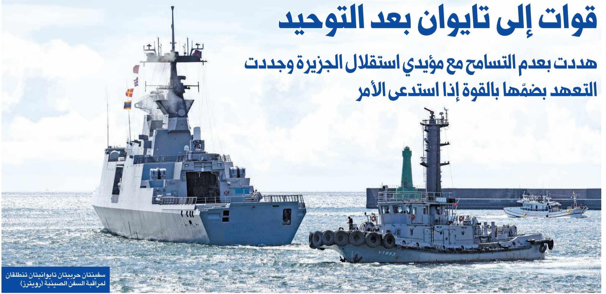
سفينتان حربيّتان تايوانيتان تنطلقان لمراقبة السفن الصينية

هددت بعدم التسامح مع مؤيدي استقلال الجزيرة وهددت التعهد بضمها بالقوة إذا استدعى الأمر