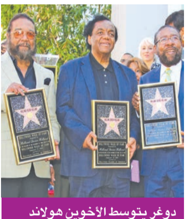
دوغر يتوسط الأخوين هولاند

رحل الموسيقي لامونت دوغر عن 81 عاماً، وهو مؤلف الأغنيات وملحنها، الذي كان أحد أبرز من تعاونوا في مجال موسيقى السول، والذي ألف أعمالاً لفرقتي «ذي سيريمز» و«ذي إيزلي براذرز»، وللمغني مارفين غاي. وحقق دوغر نجاحاً كبيراً خلال ستينيات القرن الفائت، بعدما انضم إلى الأخوين براين وإدي هولاند، وكوفئ الثلاثي في التسعينيات بإدراج أسمائهم على رصيف الشهرة والفن بهوليوود وفي متحف روك أند رول هال أوف فايم الشهير. في ذات السياق، توفي عن 72 عاماً عازف غيتار البياس داريل هانت، أحد أعضاء «ذي بوجس». ووجه قائد الفرقة شاين ماکفاون تحية إلى الراحل، واصفاً إياه ب«الصديق العظيم»، وكتب على «تويتر» «أنا أسف جداً لوفاة داريل، لقد كان شخصاً طيباً حقاً، وصديقاً كبيراً وعازف غيتار باس كبيراً».