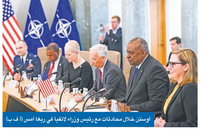
أوستن خلال محادثات مع رئيس وزراء لاتفيا في ريبغا أمس