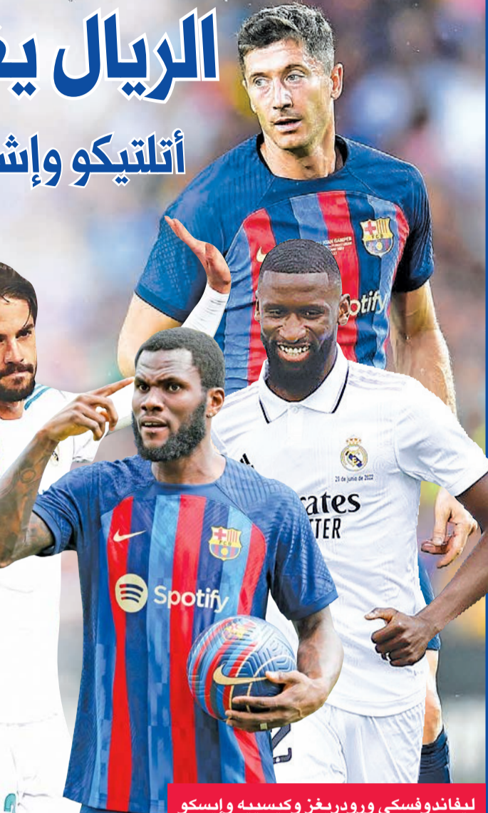
ليفاندوفسكي وروديفر وكيسييه وإيسكو

يأمل ريال مدريد أن يتيح له الصيف المستقر، الذي عاشه فرصة بدء حملة لقلبه بنجاح، مع انطلاق الموسم الجديد من الدوري الإسباني في كرة القدم نهاية الأسبوع الجاري، رغم مساعي برشلونة للعودة بقوة بصفقات انتقال لافتة. وبدأ النادي الملكي مشواره الكروي الجديد أمس، أمام ابتراخت فرانكفورت الألماني في مباراة الكأس السوبر الأوروبية، واضعاً نصب عينه هدف موسم مليء بقيادة الإيطالي كارلو أنشيلوتي،