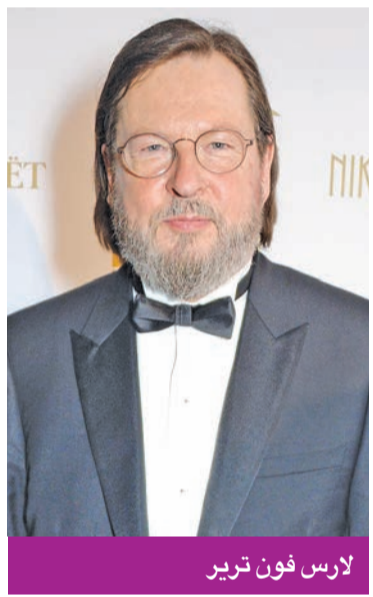
لارس فون تريز