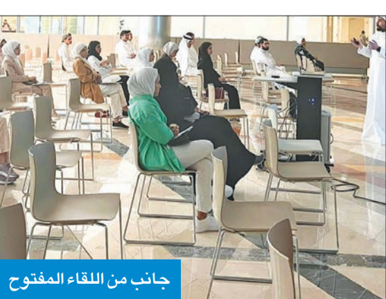
جانب من اللقاء المفتوح

تختلف بكل المقاييس، فهي رحلة تعليمية وثقافية وبناء هوية جديدة، وأن المستجدين سوف يتذكرون هذا اليوم في حفل تخرجهم بعد 4 سنوات حافلة بالتميز والتعلم والفائدة.