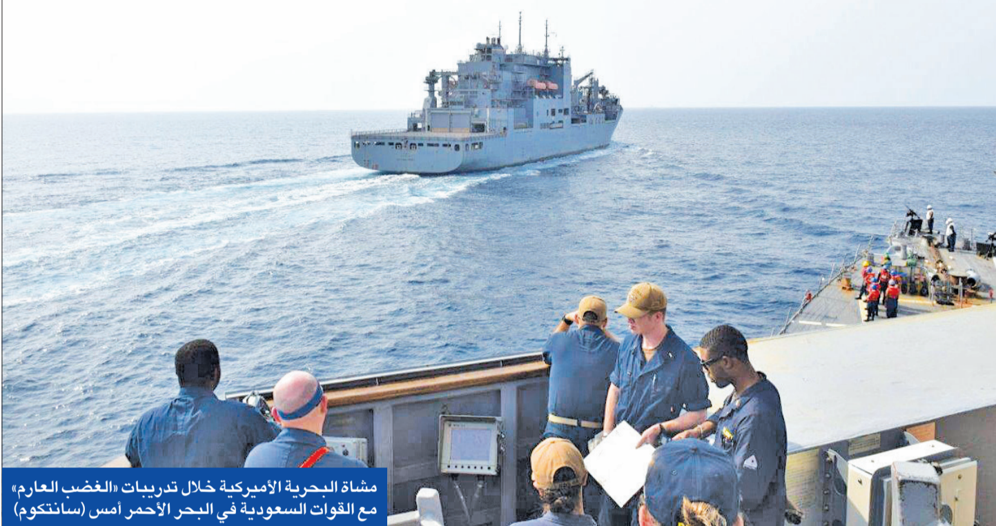
مشاة البحرية الأميركية خلال تدريبات «الغضب العارم» مع القوات السعودية في البحر الأحمر أمس

عرض 300 ألف دولار لأشخاص لقتله انتقاماً لاغتيال قائد فيلق القدس قاسم سليماني في يناير 2020.