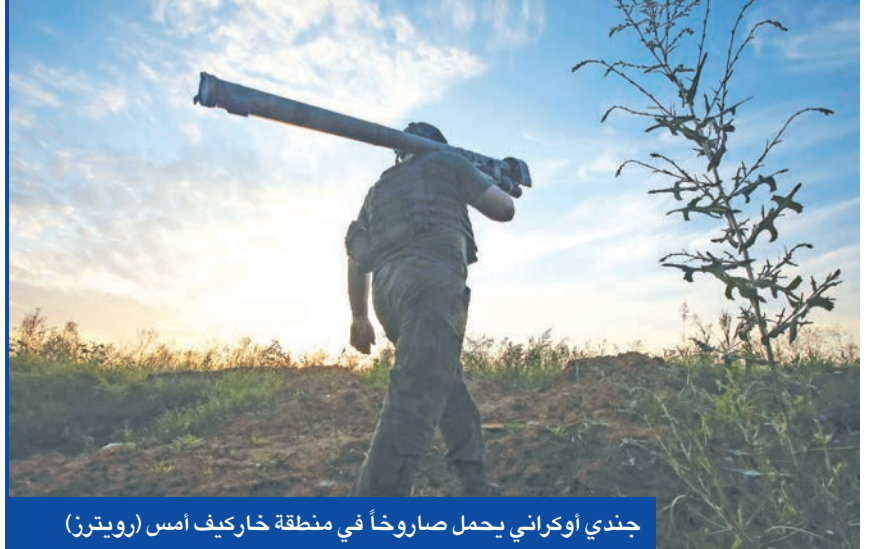
جندي اوكراني يحمل صاروخاً في منطقة خاركيف أمس

كيف تتهم موسكو بالتجهيز لإعادة توجيه إنتاج أكبر محطة في أوروبا إلى «كهرباء القرم»