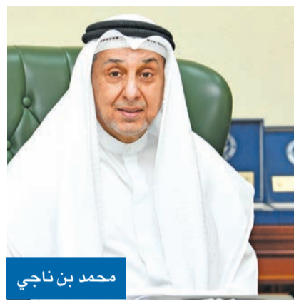
محمد بن ناجي

أكد رئيس المحكمة الدستورية، رئيس محكمة الاستئناف، عضو المجلس الأعلى للقضاء المستشار محمد بن ناجي أن ما أثير مؤخراً عن إحالة قضاة إلى النيابة العامة بوقائع رشوة جديدة، «خبر جاء عاماً وغير منسوب لأحد بعينه ويخشي عدم دقته، مما قد يمثل طعناً بالقضاء ورجاله، كما يخشي من تأثيره على الانتخابات المقبلة والإشراف عليها». وأضاف بن ناجي لـ «الجريدة» أن «ذلك الأمر لم يعرض على المجلس الأعلى للقضاء ولم يتخذ به أي قرار»، معقياً بأن «القضاء الكويتي جهاز منضبط وموزون تحرص قيادته وأعضاؤه على أن يظهر نفسه بنفسه، وتنفقته من أية شوائب، فضلاً عن حرص رجاله على أداء رسالتهم وأمانتهم المعهودة وهم تحت القسم، وشدد على أن «القضاء الكويتي ضد الفساد»