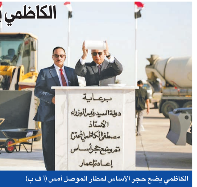
الكاظمي يضع حجر الأساس لمطار الموصل أمس

وطلب من «الثوار جميعاً ومن الكتلة الصردية النيابية المستقبلية ونواب آخرين وكل محني الوطن تقديم دعاوى رسمية للمحكمة الاتحادية وبطرق قانونية، ومن خلال مركزية اللجنة المشرفة على الاعتصامات، لتقديمها إلى الجهات القضائية المختصة، فمن الواضح أن القضاء على المحك، ونأمل منه أن يراعي مصلحة الشعب، وألا يهاب الضغوط، مؤكداً أنه على يقين بأن «الكثير من القضاء مع الشعب ومع الإصلاح». وجاءت آخر خطوات الصدر الراض للدخول في حوار مع خصومه، بعد ساعات من تأكيد رئيس الوزراء المؤقت مصطفى الكاظمي أن على الكتل السياسية تحلّ مسؤولياتها لإنهاء الانسداد السياسي، وقال الكاظمي، عبر «تويتر»، «ليس لدينا خيار غير الحوار. الحوار آلاف سنة، أفضل من لحظة تصطدم بها كعراقيين».