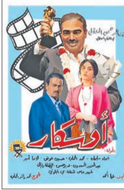
ملصق فيلم «أوسكار»

وقال السويلم إن المنصة عرضت في الثاني من أغسطس في ذكرى الاحتفال الغاشم