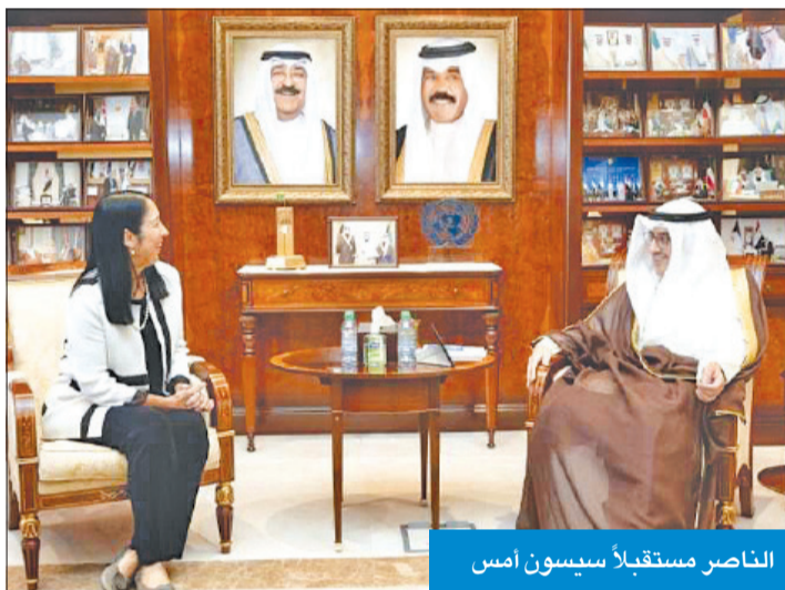
الناصر مستقبلاً سيسون أمس

الدولي القائم على القواعد، من ناحيته، كتب القائم بالأعمال الأميركي لدى البلاد، جيمس هولتسنبايدر، على «تويتر»، أمس: يشرفني أن أرحب بمساعدة وزير الخارجية لشؤون المنظمات الدولية، السفيرة سيسون، في الكويت، حيث التقت ببعض من شركائنا الكويتيين، وتم تسليط الضوء على العلاقات القوية بين البلدين، بما في ذلك الأولويات المتعددة الطرف، من ناحيتها، عززت السفارة الأميركية في حسابها على «تويتر»، قائلة: «تشرف موظفونا الدبلوماسيون الجدد بمقابلة السفيرة سيسون، وسماع المزيد عن خبرتها الطويلة بوزارة الخارجية».