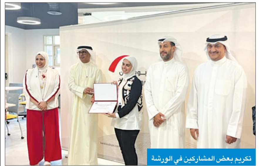
تكريم بعض المشاركين في الورشة

وذلك سعياً لتقديم أفضل الخدمات لمراجعي الإدارة من المرشحين للعمل في الجامعة أو موظفيها (المرشحين للوظائف الإشرافية - الموظفين المنتهية خدماتهم)، حيث إن جامعة الكويت تسعى دائماً إلى رفع كفاءة جميع منتسبيها من أعضاء هيئة تدريس وموظفين وطلبة.