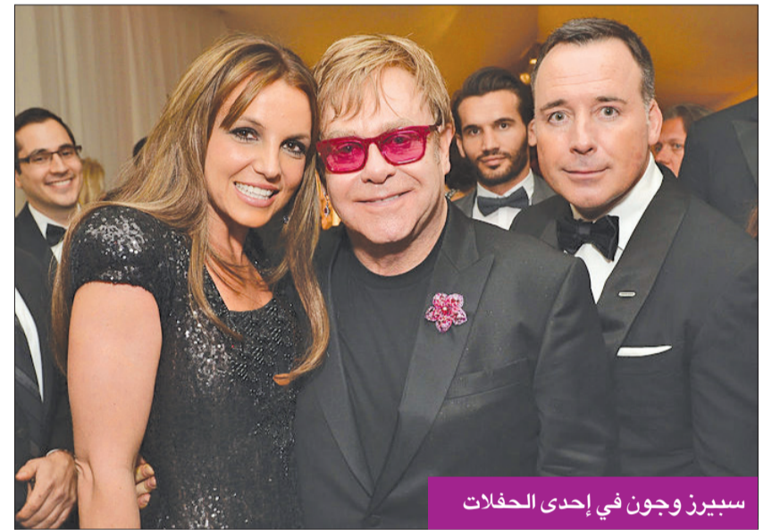
سبيرز وجون في إحدى الحفلات

ومنذ فترة وجيزة، شاركت بريتني فيديو عبر حسابها في «انستغرام» بينما تغني مقطعاً من أغنيتهما المنفردة «aby One More Time» عام 1998، وكشفت أنها تحاول منذ أعوام إعادة تسجيل الأغنية، ما لم يكن ممكناً خلال فترة الوصاية عليها. علقت قائلة: «لم أشارك صوتي منذ وقت طويل للغاية، ربما منذ وقت طويل جداً». وفقدت بريتني أخيراً جنبها بسبب حالة إجهاض تلقائي، بحسب ما أعلنت مع شريك حياتها سام أصغري.