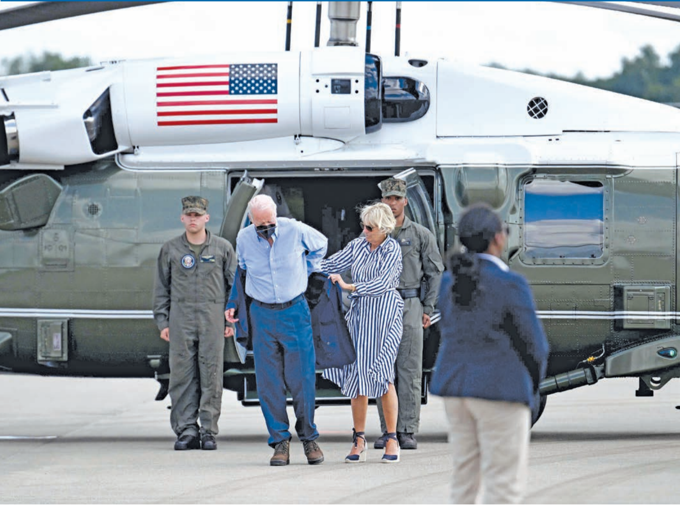
رصد شريط فيديو موقفاً طريفاً للرئيس الأميركي جو بايدن، لدى نزوله من مروحية الرئاسة في ولاية كنتاكي، التي وصل إليها قادماً من واشنطن.

وقال موقع سكاي نيوز أمس، إن بايدن كان يحاول ارتداء السترة الزرقاء اللون، لكنه فشل في إتمام الأمر، مما حدا بالسيدة الأولى جيل بايدن إلى التدخل، حيث ساعدته في ارتدائها.