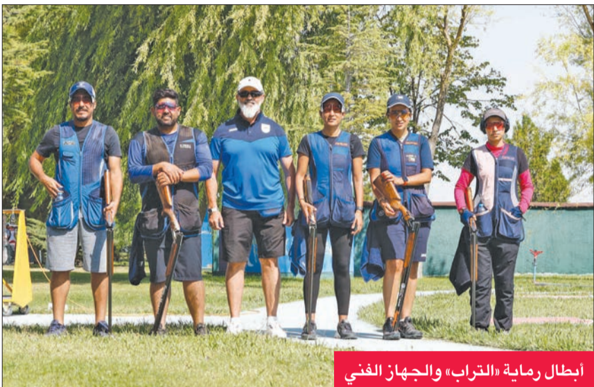
أبطال رمية «التراب» والجهاز الفني