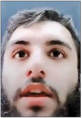
المتهم أثناء بثه المقطع

وكان يشارك في موقع للبت المباشر. وأضاف المصدر أن رجال المباحث تمكنوا من ضبط الإيراني ومواجهته بالتصوير المتداول، واعترف بما نسب إليه، وأكد أنه كان يمزج مع أصدقائه عبر أحد برامج البث المباشر، ولم يعتقد أن المقطع سينتشر. وأشار المصدر إلى أن رجال المباحث اتخذوا الإجراءات القانونية اللازمة بحق الوافد المذكور. بدورها، أكدت الإدارة العامة للعلاقات العامة والإعلام الأمني بوزارة الداخلية أن رجال الأمن يقفون بالمرصاد لكل من تسوّّل له نفسه العبث بأمن واستقرار البلاد وزرع الفتنة، مشددة على أنه سيتم اتخاذ كل الإجراءات القانونية لكل من يخالف قوانين وأنظمة البلاد.