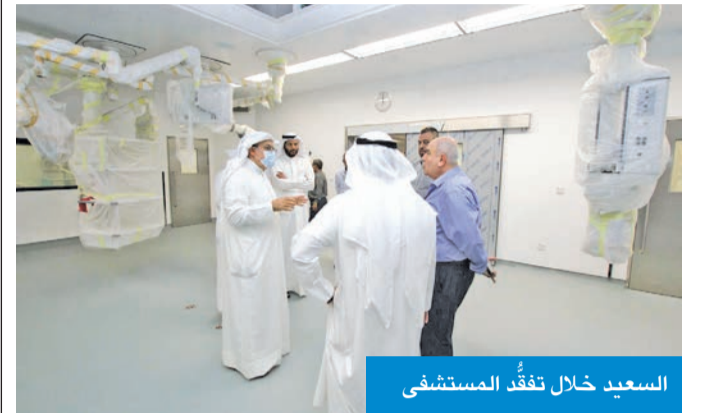
السعيد خلال تفقد المستشفى

تفقد وزير الصحة، د. خالد السعيد، الاستعدادات والتحضيرات النهائية لخطة افتتاح وتشغيل مستشفى الفروانية الجديد، بحضور وكيل الوزارة د. مصطفى رضا، والوكيل المساعد لشؤون الخدمات عبدالعزیز الطشة، والوكيل المساعد للشؤون الهندسية والمشاريع إبراهيم النهام، واستمع الوزير إلى شرح مفصل حول آخر الاستعدادات بهذا الشأن من أعضاء اللجنة المشرفة على خطة افتتاح وتشغيل المشروع، الذي سيكون وفق مراحل محددة. وفي إطار خطة الوزارة لرفع مستوى وكفاءة تقديم أفضل الخدمات الصحية للمواطنين، سيكون المشروع، وفق خطة الوزارة، مستشفى متكاملًا، يضم مختلف التخصصات الطبية، للارتقاء بنوعية الخدمات الصحية المقدمة والمخصصة للمواطنين. في إطار صحي آخر، عقدت وزارتنا الصحة والتجارة اجتماعاً أمس، بحضور الوزيرين السعيد وفهد الشريعان، ووكيلي الوزارتين، لبحث تنظيم وضع الصيدليات الخاصة، وانتهى الاجتماع إلى تشكيل لجنة رباعية تضم وزارات التجارة والصحة والبلدية، والهيئة العامة للغذاء والدواء، وللتأكد من تطبيق الإجراءات المرتبطة بالترخيص، وصرف الأدوية، وتطبيق إلزام الصيدليات بتلقي الاموال عن طريق البطاقات البنكية.