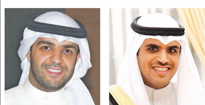
صدر مرسوم أميري أمس بتعيين الشيخ خالد طلال خالد الأحمد الصباح وكيلاً لديوان سمو رئيس مجلس الوزراء بالدرجة الممتازة، فضلاً عن مرسوم أميري آخر بتعيين حمد العامر مديراً لمكتب سمو رئيس الوزراء بدرجة «وكيل».