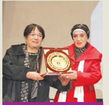
رجاء فائزة في إحدى المناسبات

رحلت عن عالمنا، أمس الأول، الفنانة رجاء حسين، عن 84 عاماً، وشيعت في مقابر الأسرة. وُلدت رجاء حسين في 7 نوفمبر 1937، بمحافظة القطيف. انضمت لفرقة الرحمان سنة 1958، واشتغلت في الإذاعة والتلفزيون كممثلة في المسلسلات الإذاعية والتلفزيونية. كما لمعت في أعمال يوسف شاهين، وهي متزوجة من الممثل سيف عبد الرحمن. الراحلة اسمها عايشة رجاء حسين زكي إسماعيل، عملت في السينما والتلفزيون منذ مطلع ستينيات القرن العشرين، من أفلامها: أفواه وأرانب،