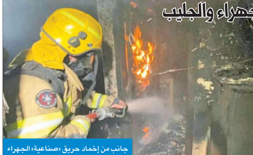
جانب من إخماد حريق «صناعية» الجهراء

وأضافت الإدارة أن رجال الإطفاء عملوا على إنقاذ 7 أشخاص كانوا محشورين داخل المركبتين، وهم مواطن و6 وافدين، وقد وصفت إصاباتهم بين الحرجة والمستقرة. وذكرت أنهم عملوا على إخراج الأشخاص المحشورين وتسليم المصابين للإسعاف الجوي وسيارات الإسعاف التابعة لإدارة الطوارئ الطبية، وتم نقلهم إلى المستشفى.