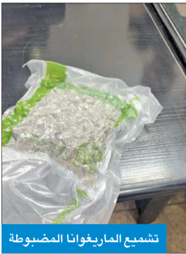
تشميع الماريغوانا المضبوطة