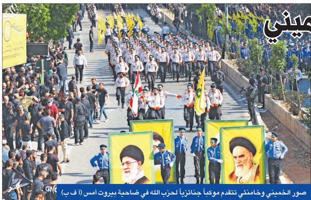
صور الخميني وخامنئي تتقدم موكباً جنازياً لحزب الله في ضاحية بيروت أمس

جدد الأمين العام لـ «حزب الله» اللبناني حسن نصرالله، التلويح باستخدام القوة ضد إسرائيل، رغم استمرار الجهود الدبلوماسية، التي تقودها الولايات المتحدة، بهدف التوصل إلى تفاهم بين الدولة اللبنانية والدولة العبرية، بشأن ترسيم الحدود البحرية واستخراج الغاز الطبيعي من حقل «كاريش» المتنازع عليه شرق المتوسط. واستنق نصرالله عودة الوسيط الأميركي عاموس هوكشتاين، المنتظرة إلى بيروت ومعه الأجوبة الإسرائيلية على مطالب بيروت، مؤكداً أن «اليوم الذي ستمتد إلى