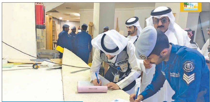
تحرير مخالفات لأحد السردابيين المخالفة بالمهولة

طواعية من قبل مالك العقار، مبيناً أن عدم الامتثال لقوانين البلدية و«الإطفاء» سيشيخ في إعطاء المالك عدة مخالفات منها الغلق الإداري وعمل «بولك» لصاحب العقار. ولفت إلى أن الفريق الرقابي في بلدية الأحمدية قام بإجراءاته القانونية بتحرير مخالفة وغلقت إداري فوري لسرداب في منطقة المهولة مستقل للنجارة، مما يسبب خطورة عالية لسكان العقار. وكانت بلدية الكويت بدأت الخميس الماضي حملة بالتعاون مع الإدارة العامة للإطفاء للكشف على المخازن المخالفة في العقارات الاستثمارية بالمحافظات الست، والتأكد من إلزام أصحابها بالاشتراطات الإدارية العامة للإطفاء.