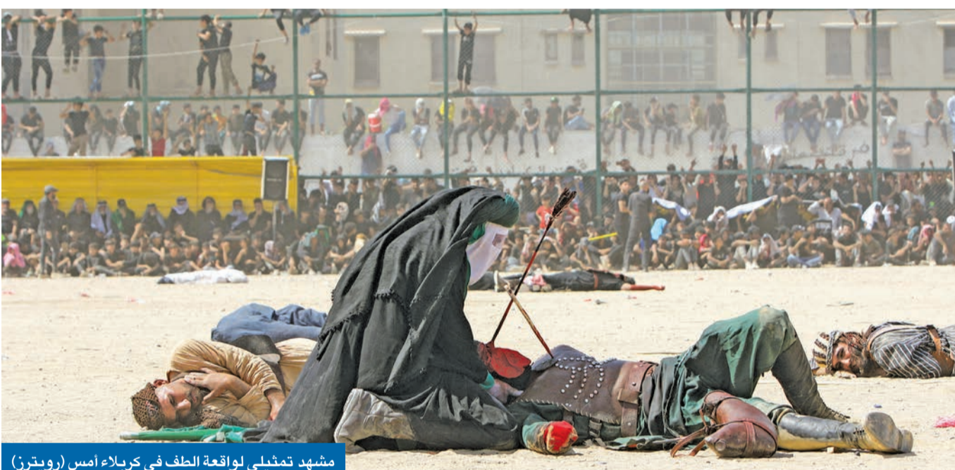
مشهد تمثيلي لواقعة الطف في كربلاء أمس

ثوار النجف يطردون رئيس «الحشد الشعبي» من صحن الإمام