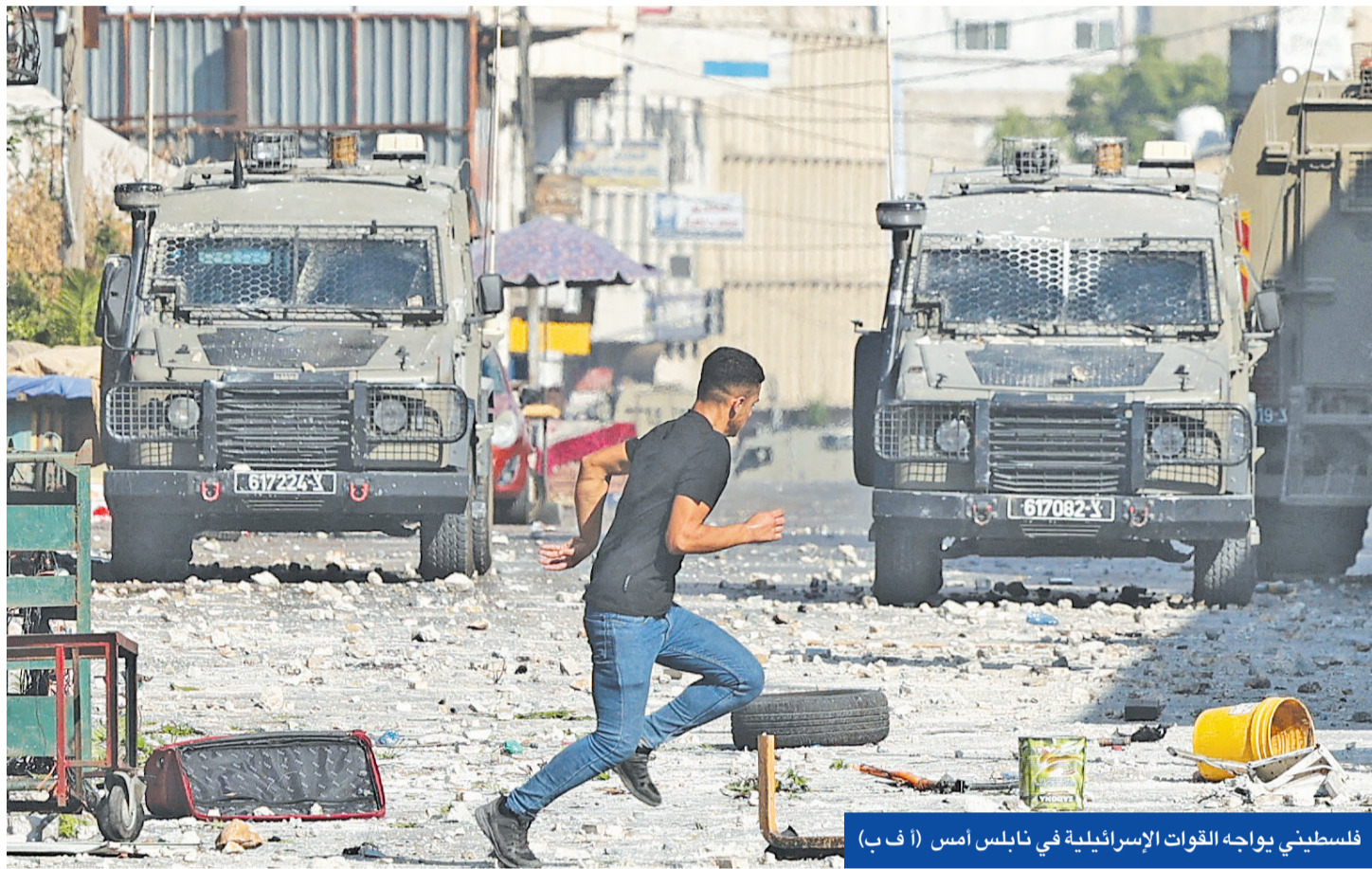
فلسطيني يواجه القوات الإسرائيلية في نابلس أمس

اشتباكات ومسيرات ودعوات للإضراب دعماً لنابلس... وتضاؤل احتمالات تبادل الأسرى