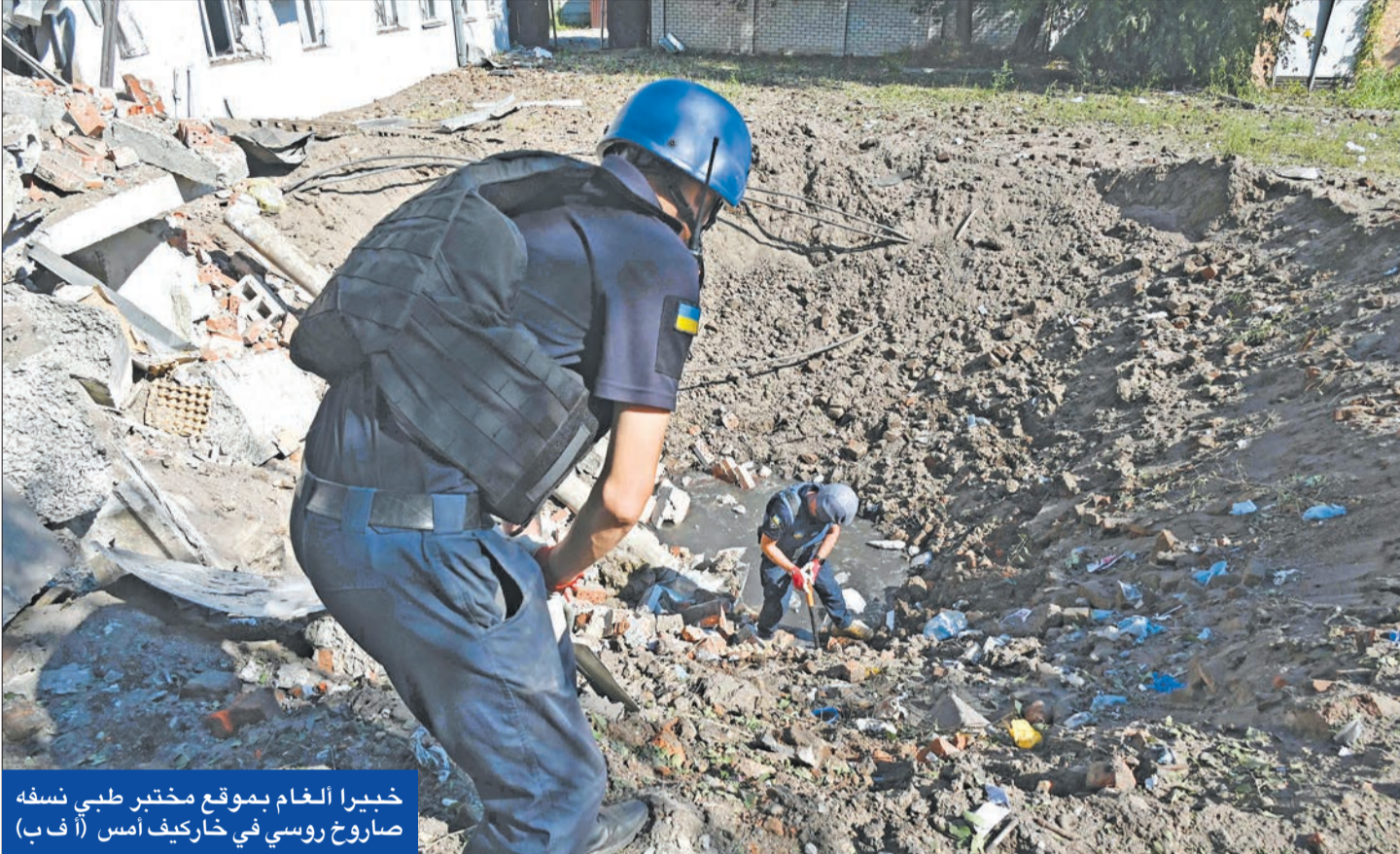
خبيرا الغام بموقع مختبر طبي نفسه صاروخ روسي في خاركيف أمس

واشنطن تؤكد خسارة روسيا 80 ألف جندي في أوكرانيا... وزيلينسكي يستفزها بحظر السفر