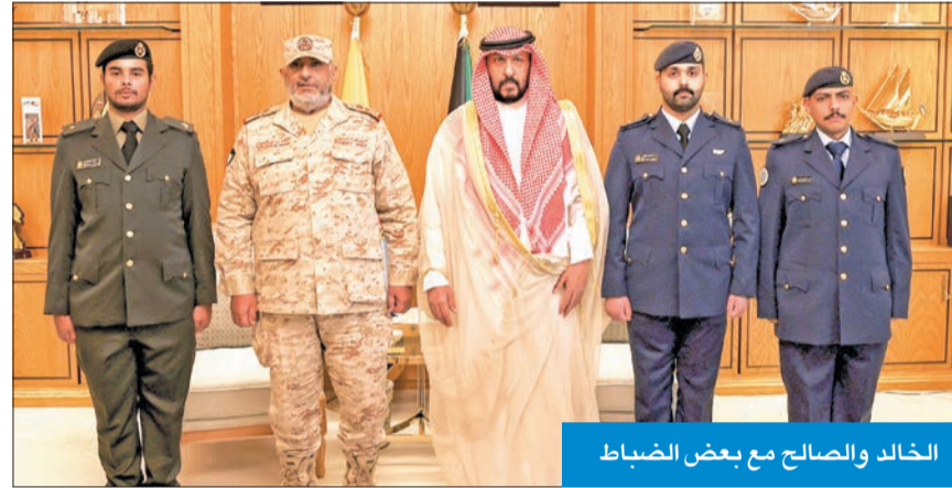
الخالد والصالح مع بعض الضباط

رعى مراسم تقليدهم الرتب بحضور رئيس الأركان