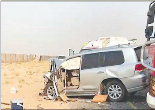
المركبة بعد الحادث

أصيب 7 أشخاص بجروح خطيرة جراء حادث مرور مروى على طريق كبد مساء أمس الأول، وقد أسفرت شدة الحادث عن تعطل حركة السير لفترة.