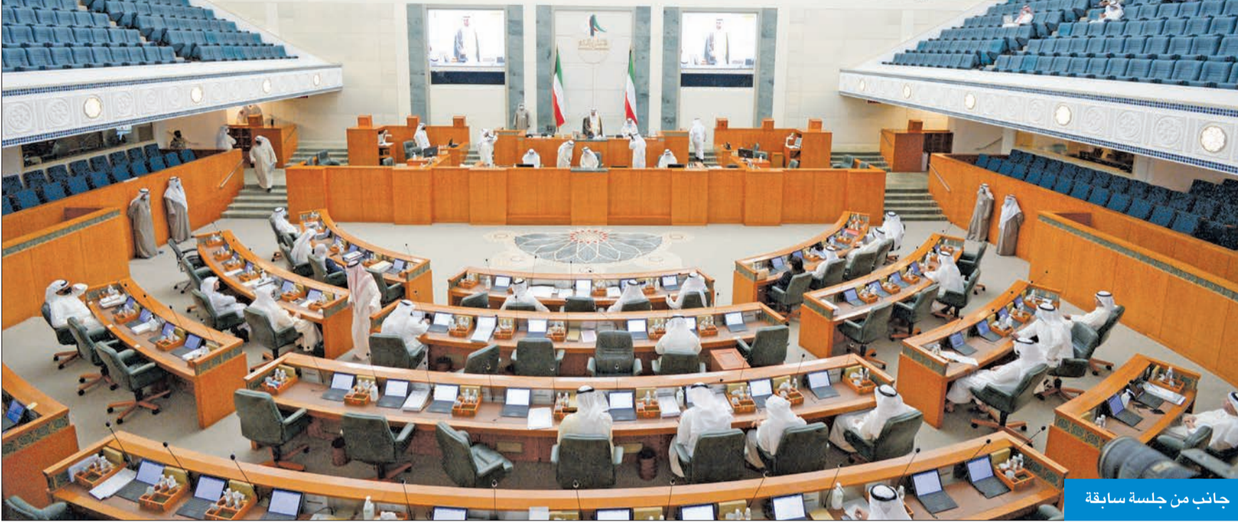
جانب من جلسة سابقة