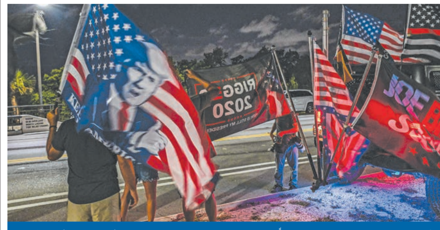
مؤيدون لترامب يتظاهرون احتجاجاً على مداومة منزلته في فلوريدا مساء أمس الأول

البحث تركز على صناديق من المستندات السرية أخذها ترامب من البيت الأبيض الرئيس السابق: الهجوم اضطهاد سياسي والادعاء العام يستخدم العدالة سلاحاً