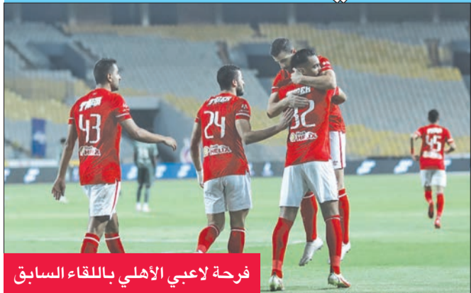
فرحة لاعبي الأهلي باللقاء السابق