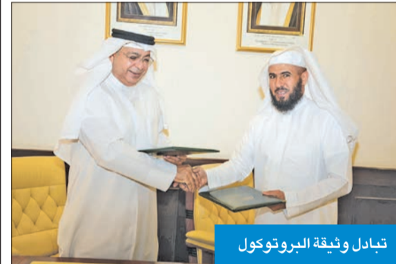
تبادل وثيقة البروتوكول

وقعت الأمانة العامة للأوقاف، في مقرها بالدسمة، بروتوكول تعاون مشترك في مجال الوقف مع مؤسسة ساعي لتطوير الأوقاف (أحدى مؤسسات وقف الشيخ سليمان بن عبدالعزيز الراجحي) بالرياض، يتم من خلاله تيسير وتطوير التعاون بين الأمانة ومؤسسة ساعي في المجالات ذات الاهتمام المشترك، وبصفة خاصة دعم وتنمية الدراسات والبحوث في مجال الوقف، واستقطاب الباحثين وتحكيم الأبحاث بغرض النشر في مجلتها «أوقاف» ووقف، وإصدارات إدارة الدراسات والأبحاث الخارجية بالأمانة، وإصدارات مؤسسة ساعي، بما يساهم في تطوير البحث العلمي الوقفي والنهوض به ومواجهة القضايا الوقفية المعاصرة.