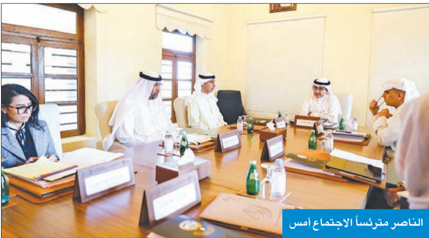
الناصر مترئساً الاجتماع أمس

ترأس وزير الخارجية رئيس مجلس إدارة معهد سعود الناصر الصباح الدبلوماسي الشيخ د. أحمد الناصر، صباح أمس، اجتماع مجلس إدارة المعهد، وتم خلال الاجتماع بحث البرامج والخطط التدريبية التي يضطلع بها المعهد للعام الجاري، بما يسهم في تمكينه من رفع كفاءة كوادر وزارة الخارجية وإنجاز مهامه المنوطة به، ومناقشة آليات تطوير أعماله، وتنوع نشاطاته في هذا المجال.