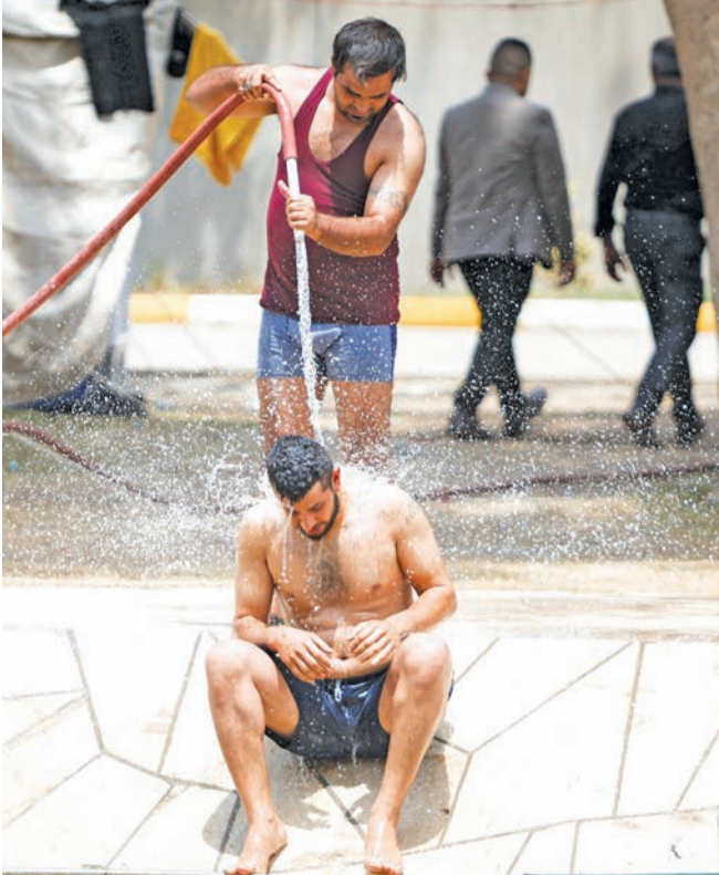
أحد المعتصمين يخفف عن زميله وطأة الحرارة بزخات الماء أمام البرلمان أمس

تثبت عدم شرعية استيلاء خصوم الصدر على مركزه في البرلمان، كما أعلن استعداده لتأويلات أخرى تسمح بعودة نواب التيار المستقلين. لكن إجابة الصدر على الوسطاء حاسمة، إذ يقول إن احتجاجات النصار قامت عملياً بحل البرلمان، ولا قيمة اليوم لفكرة العودة إليه، ورغم ذلك تتوقع الأوساط السياسية صدور قرار من المحكمة العليا، في أي لحظة، يلغي عضوية النواب البدلاء المعارضين للصدر، ويسلب الأكثرية العديدة التي حصل عليها حلفاء طهران في البرلمان، بعد استقالة الكتلة الصدرية. وكان خطيب الصدر، قال في صلاة جمعة موحدة حضرها مئات الآلاف من العراقيين، إن الاعتصام متواصل ويحتاج إلى تضحية «بالوقت والأففس». ووقف الخطيب الصدرى تحت قوس النصر في ساحة الاحتفالات الكبرى بدمشق، في واقعة هي الأولى من نوعها، إذ يحظر على المواطنين دخول هذا المكان الحساس جداً، سواء في عهد الدكتاتور السابق صدام حسين، أو العهد الجديد، وهو مخصص للاستعراضات العسكرية فقط.