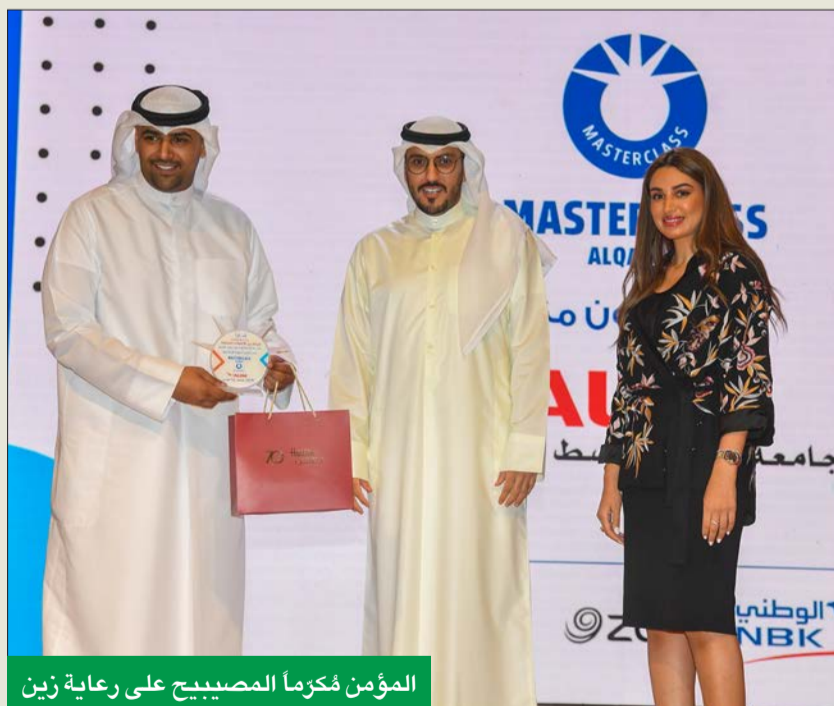
المؤمن فؤكزا المصبيح على رعاية زين

عزمت المتدربين على تجربتها الرائدة في مجال العلاقات العامة والإعلام