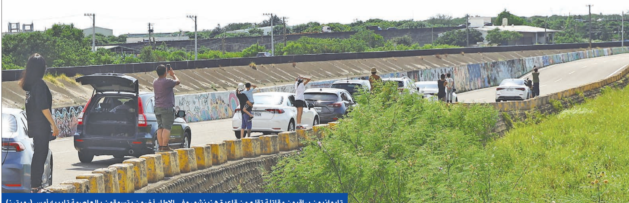
تايوانيون يراقبون مقاتلة تتلعب من قاعدة هزينشو، وفي الإطار آخرون يتسوقون بالعاصمة تايبيه أمس (رويترز)

الوضع في أوكرانيا قائلاً: «في كل مرة هدد فيها (الرئيس الروسي فلاديمير) بوتين أوكرانيا كنا ضعفاء، وبدلاً من فرض عقوبات عليه عندما كدس جيشه على الحدود، لم نرغب في استفزاز». وبدلاً من تدفق الأسلحة إلى أوكرانيا قبل الغزو، لم تكن نريد استفزاز بوتين». وتساءل: «إذاً ماذا تفعل في تايوان الآن؟» لدى اقتراح قانون مع السيناتور الديموقراطي رئيس لجنة العلاقات الخارجية بوب مينيندين، لتقديم المزيد من المساعدات الاقتصادية والعسكرية لتايوان، لكن الإدارة تعمل على إفساح مشروع القانون. وأكد العديد من المرشحين في الصين ترافق الوضع في أوكرانيا، حيث شنت روسيا عملية عسكرية في 24 فبراير، لمعرفة ما ستكون العواقب في حال قررت هي الأخرى فرض سيطرتها على تايوان التي لا تعترف باستقلالها، وتعتبرها جزءاً من أراضيها. (عواصم وكالات)