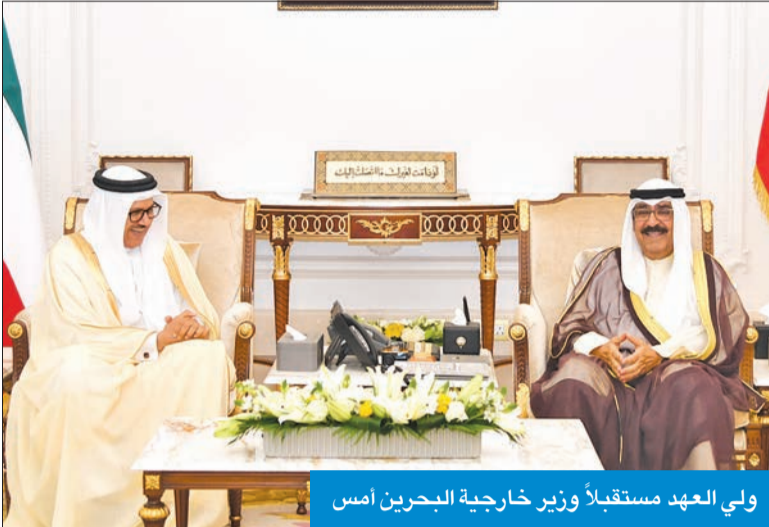
ولي العهد مستقبلاً وزير خارجية البحرين أمس

مجلس الوزراء بمملكة البحرين الشقيقة الأمير سلمان بن حمد، تتعلّق بالعلاقات الأخوية الطيبة التي تربط البلدين والشعبين الشقيقين، إضافة إلى القضايا ذات الاهتمام المشترك، وآخر المستجدات على الساحتين الإقليمية والدولية. حضر المقابلة رئيس ديوان سمو ولي العهد الشيخ أحمد العبدالله، ومدير مكتب سمو ولي العهد الفريق المتقاعد جمال الذباب، وسفير البحرين لدى الكويت صلاح المالكي. من جهة أخرى، بعث سموه ببرقية تهنئة إلى رئيس كوت ديفوار، الحسن وإتارار، ضمنها سموه خالص تهنائه بمناسبة العيد الوطني لبلاده، راجياً له وافر الصحة والعافية.