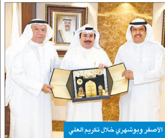
الأصفر وبوشهري خلال تكريم العلي

استقبل محافظ حولي علي الأصفر، في مكتبه بديوان عام المحافظة، وبحضور محافظ مبارك الكبير محمود بوشهري، المدير العام لأمّن حولي السابق الفريق مقاعد عبدالله العلي. الجليل للعلي على ما قدمه من جهود مخلصه وتفانيه في فترة عمله لخدمة الكويت بشكل عام ومحافظه حولي بشكل خاص. وفي هذا الإطار، قام محافظ حولي بتكريم الفريق العلي، بمناسبة انتهاء فترة عمله، متمنياً له كل التوفيق والنجاح في حياته الخاصة.