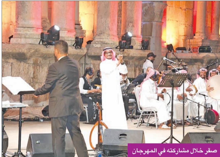
صقر خلال مشاركته في المهرجان

شدا بأجمل أغانيه في الحفل وشارك فرقة العزف على العود