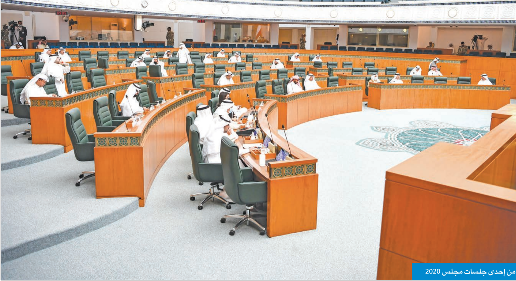
من إحدى جلسات مجلس 2020

28 عقدت في الفصل التشريعي الـ 16 تضمنت 17 استجواباً