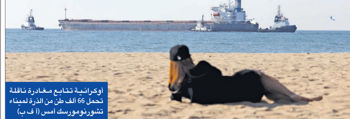
أوكرانية تتابع مغادرة ناقلة تحمل 66 ألف طن من الذرة لميناء تشورنومورسك أمس (أ ف ب)

تكنولوجيا الأسلحة تنتقل لبيلاروسيا... وزيلينسكي يريد رداً على الإرهاب النووي