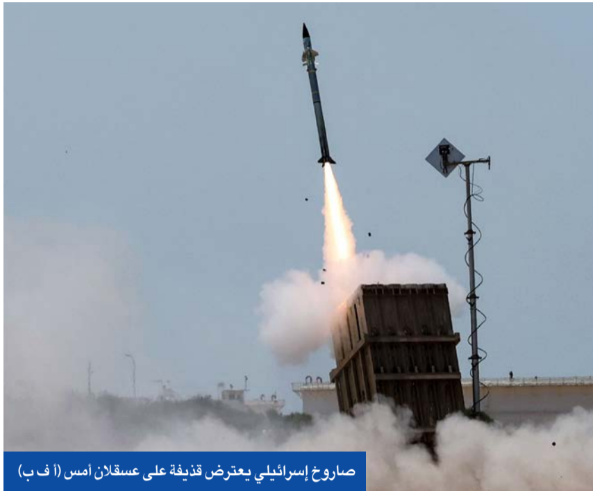
صاروخ إسرائيلي يعترض قذيفة على عسقلان أمس

إسرائيل تعلن تحييد قيادة «الجهاد» و«الكابيت» لوقف النار • والسلطة تطالب بتدخل دولي وأميركي