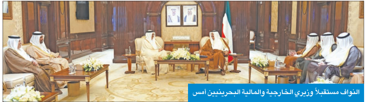
النواف مستقبلاً وزير الخارجية والمالية البحرينيين أمس

في مجال آخر، بعث رئيس مجلس الوزراء ببرقية تهنئة إلى رئيس كوت ديفوار الصديقة، الحسن وإتارار، بمناسبة العيد الوطني لبلاده.