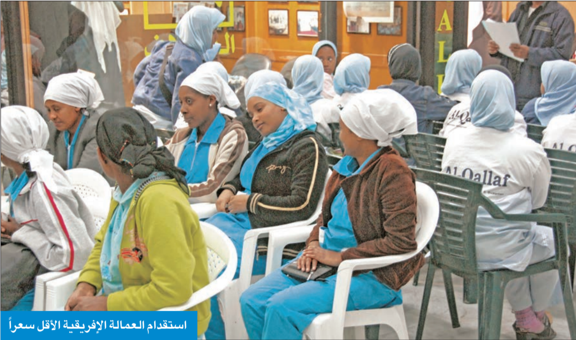
استقدام العمالة الإفريقية الأقل سعراً

● 850 ديناراً للفلبين و700 للهند وسريلانكا ونيبال... وتذاكر الطيران يتحملها الكفيل ● 500 ديناراً للجنسيات الإفريقية و350 لأصحاب الجوازات الخاصة