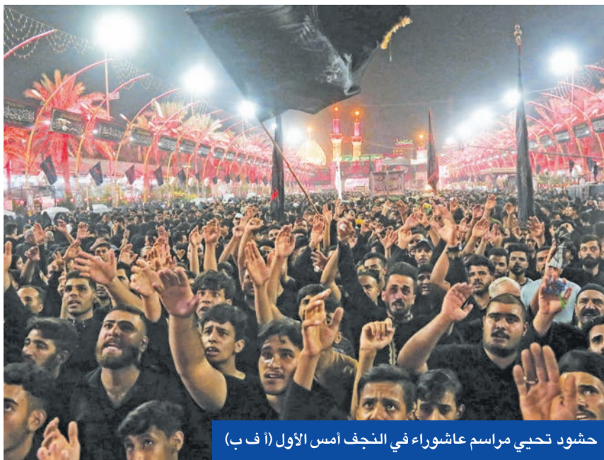
حشود تحيي مراسم عاشوراء في النجف أمس الأول

الصدر: الثورة مستمرة ولا بديل عن حل البرلمان • الحكيم للكاظمي: إصلاح النظام ومكافحة الفساد