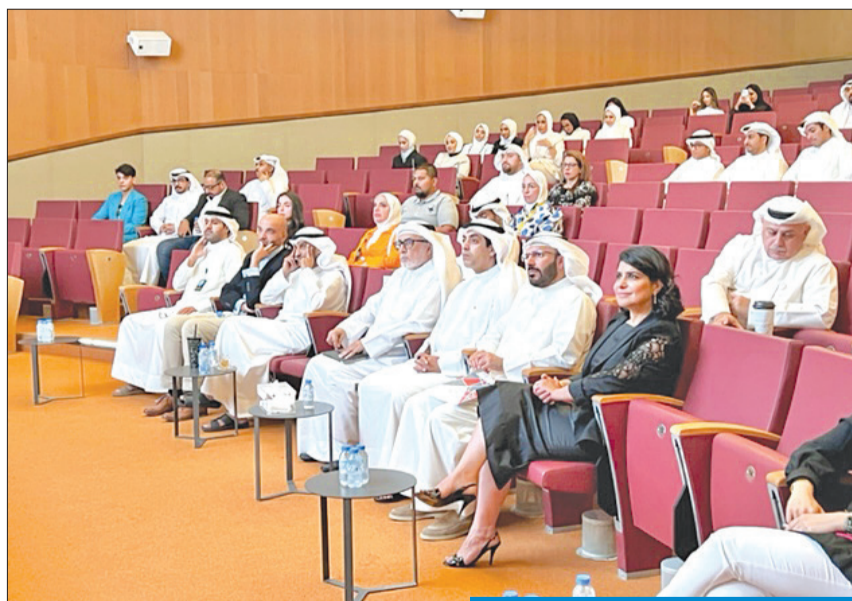
جانب من فعاليات برنامج التدريب