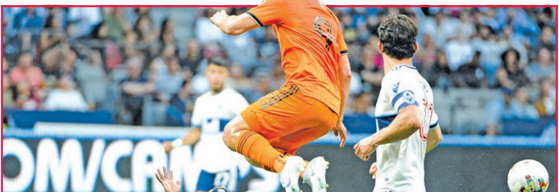
جانب من مواجهة ليون واجاكسيو

وقّع مدرب نيوكاسل يونايتد الإنكليزي إيدي هاو عقداً «طويل الأمد» مع النادي، بعد تسعة أشهر من وصوله إلى ملعب «سانت جيمس بارك»، وكان هاو، الذي انضم إلى النادي بعد فترة وجيزة من الاستحواد عليه من تحالف بقيادة صندوق الاستثمارات العامة السعودي، أبقى على «ماغين» في