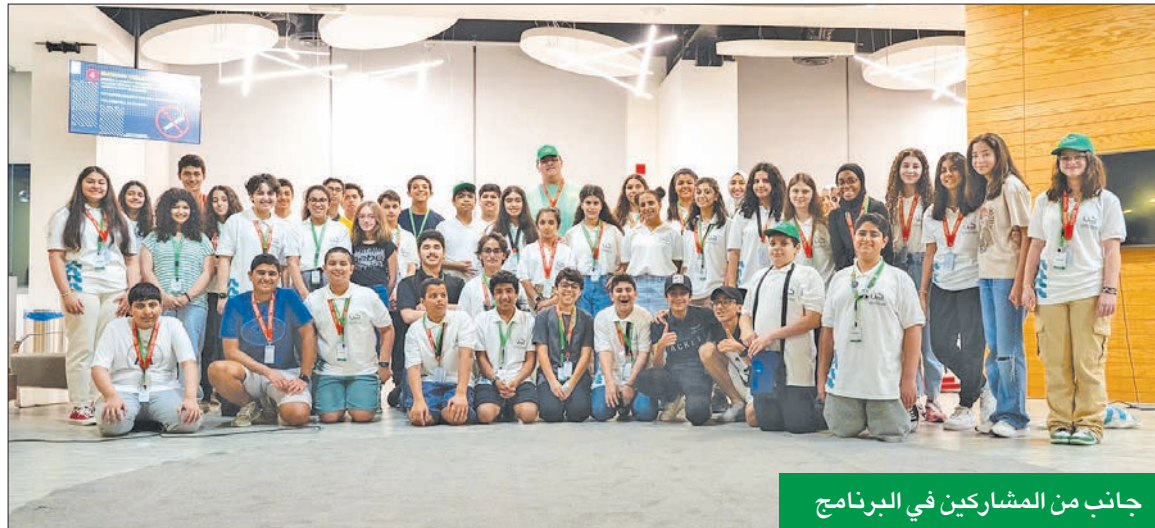
جانب من المشاركين في البرنامج

انطلق برنامج «كن» لريادة الأعمال الاجتماعية، برعاية بلاتينية لبنك الكويت الوطني، وذلك في إطار الشراكة الاستراتيجية للبنك مع مؤسسة لويك التطوعية، وتنظم «لويك» هذا البرنامج للعام السابع على التوالي، بالتعاون مع جامعة بابسون، بهدف دعم الطلاب من خلال تحفيزهم على القيادة والابتكار بمشاريع تخدم نفع المجتمع. ويشهد البرنامج مشاركة واسعة من الطالبات والطالبات أعمارهم بين 12 و16 عاماً ويستمر 3 أسابيع، ويتخلله جلسات تدريب وندوات ومحاضرات وورش عمل تهدف إلى نشأة وتعزيز برامج اجتماعية رائدة في الكويت.