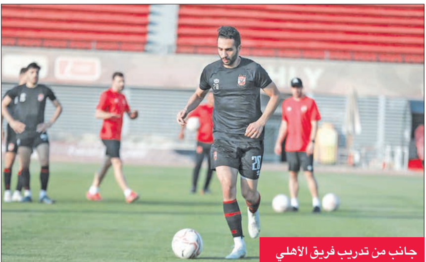
جانب من تدريب فريق الأهلي

وتعديل موقفه في ترتيب المسابقة، حيث إنه يحتل المركز الحادي عشر برصيد 33 نقطة.