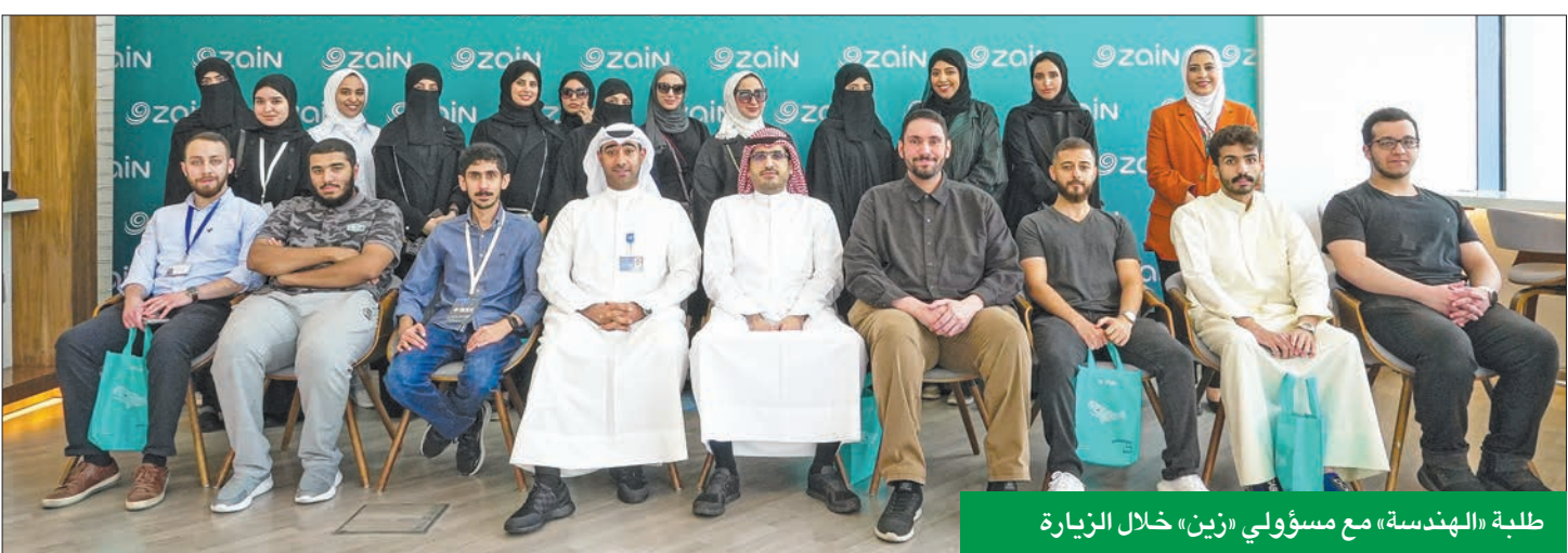
طلبة «الهندسة» مع مسؤولي «زين» خلال الزيارة

الزيارة شملت جولات ميدانية في مركزَي البيانات والاتصال 107