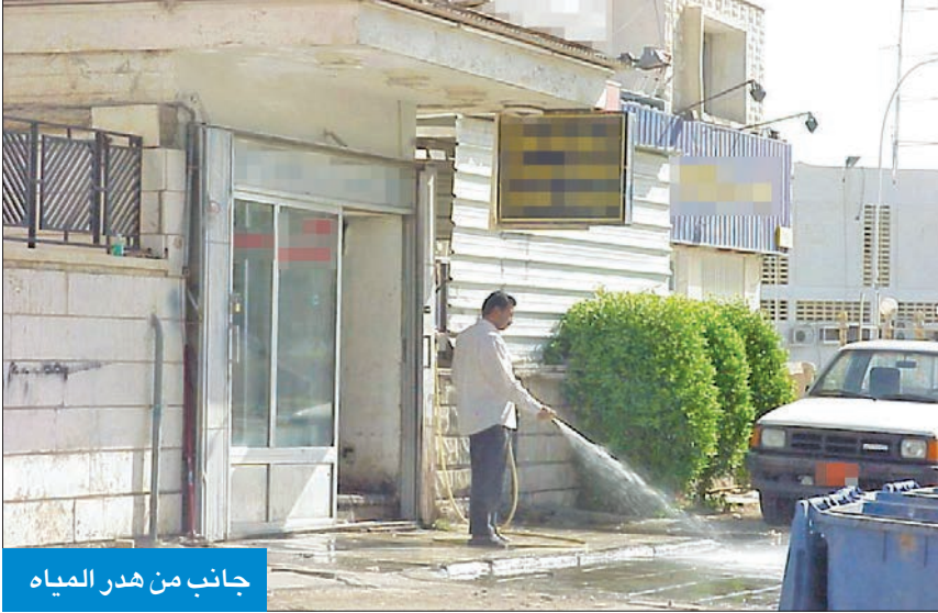
جانب من هدر المياه

● خبراء لـ الجريدة : زيادة الاستهلاك تتراوح بين 7 و8% سنوياً ● «حرب المياه والطاقة العالمية تدقّ طبولها في بعض الدول وعلينا الاستعداد لها»