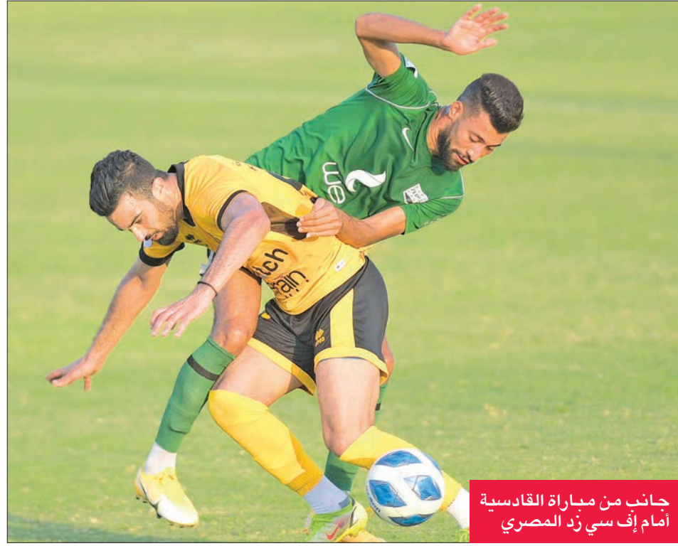
جانب من مباراة القادسية أمام إف سي زد المصري