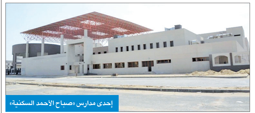
إحدى مدارس «صباح الأحمد السكنية»

تأجيل تشغيل مدارس «غرب عبدالله المبارك» بالفصل الثاني