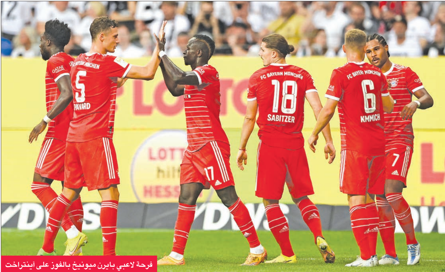
فرحة لاعبي بايرن ميونخ بالفوز على اينتراخت

مونشنغلا دباخ يتغلب على ضيفه هوفنهايم... وأونيون يحسم دربي العاصمة