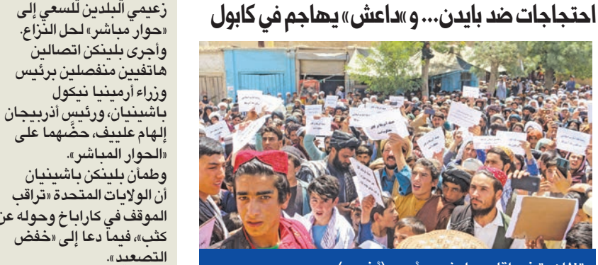
تظاهرة في إقليم بادغيس امس

أعلن المتحدث باسم حركة طالبان الأفغانية، ذبيح الله مجاهد، أمس، أنه لم يعثر على أي جثة في موقع مقتل زعيم تنظيم القاعدة، أيمن الظواهري، الذي أعلن الرئيس الأميركي جو بايدين الأسبوع الماضي، مقتله في غارة وسط كابول. وقال مجاهد: «هذا الأمر برفته لا يزال قيد التحقيق، ولم نعثر على أي جثة بعد، والمواد المستخدمة في الهجوم دمرت كل شيء بالكامل». والخميس الماضي، أعلنت حركة طالبان، في بيان، أنها لم تكن على دراية بوجود الظواهري بأفغانستان، مشددة على أن عملية واشنطن تعد انتهاكاً لاتفاق الدوحة.