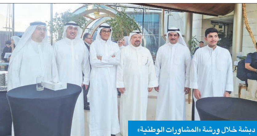
دبشة خلال ورشة «المشاورة الوطنية»