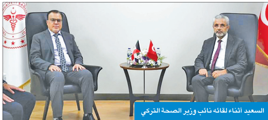
السعيد أثناء لقائه نائب وزير الصحة التركي

خاجة لـ الجريدة : الجرعة الرابعة لكبار السن وأصحاب ضعف المناعة