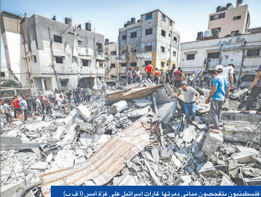
فلسطينيون يتفحصون مبانى دمرتها غارات إسرائيل على غزة أمس (أ ف ب)

وقالت الخارجية المصرية، في بيان أمس الأول، إن مصر «تجري اتصالات مكثفة على مدار الساعة بغية احتواء الوضع في غزة، والعمل على التهدئة والحفاظ على الأرواح والممتلكات»، بينما ذكرت مصادر رفيعة المستوى أن وفداً من «الجهاد الإسلامي» قد يزور القاهرة خلال ساعات لمناقشة الأوضاع في غزة مع مسؤولين مصريين.