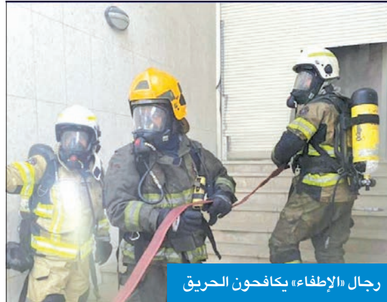
رجال «الإطفاء» يكافحون الحريق

بالحالات اختناق وإجهاد حراري، وتم علاجهما في موقع الحادث من قبل فني الطوارئ الطبية، لافتة إلى أن ضباط إدارة التحقيق في حوادث الحريق انتقلوا إلى موقع البلاغ للمعاينة والتحقيق في أسباب اندلاع النيران.