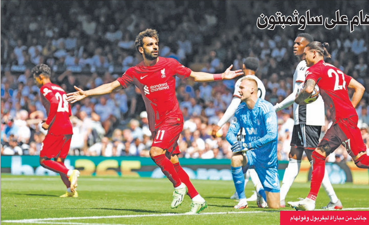
جانب من مباراة ليفربول وفولهام