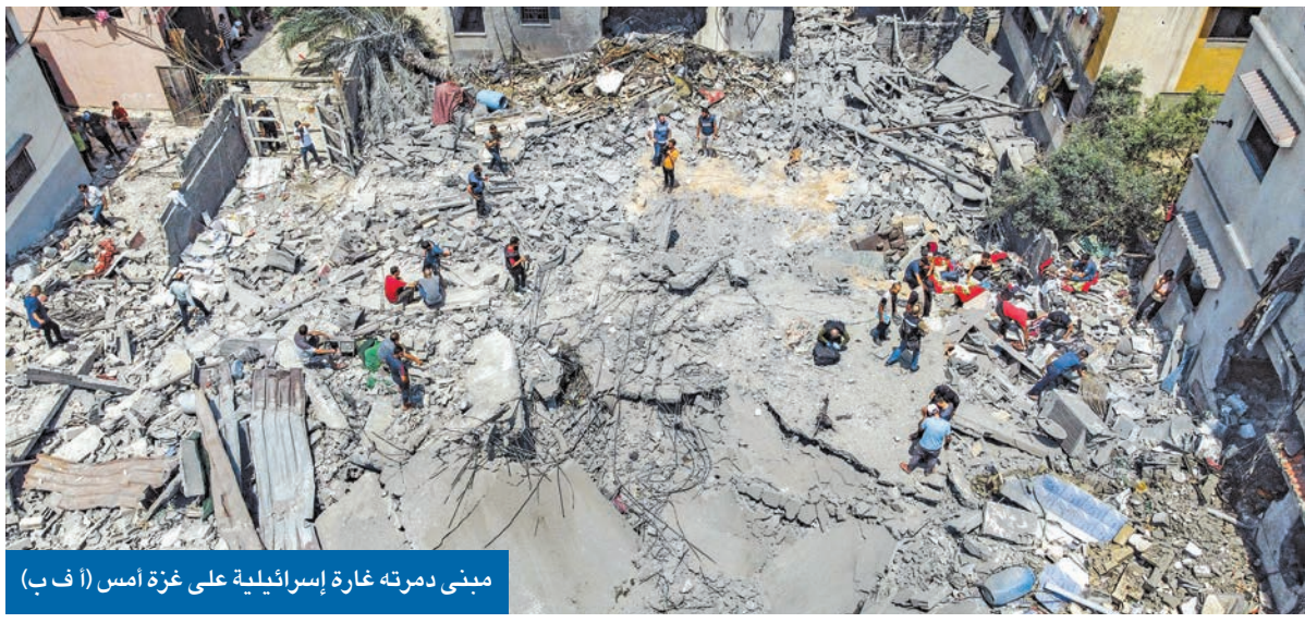
مبنى دمرته غارة إسرائيلية على غزة أمس

استعدادات لمواجهة أوسع تشمل «حماس» و«حزب الله» لايبذ يتدرب بدعم طهران للفصائل ويمد الهجوم أسبوعاً • 15 شهيداً وعشرات الجرحى في 24 ساعة