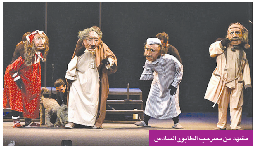
مشهد من مسرحية الطابور السادس

«الطابور السادس» ستشارك في مهرجان القاهرة الدولي للمسرح التجريبي في سبتمبر المقبل، وسيشارك فيها كمثل. ولغيت إلى أنه تم عرض المسرحية بمهرجان الكويت المسرحي في دورته الـ 21، وحصدت أفضل عرض مسرحي متكامل، إضافة إلى فوزها بجائزة الفنان منصور المنصور، لأفضل إخراج