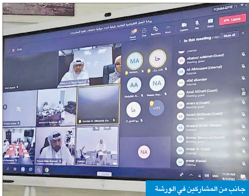
جانب من المشاركين في الورشة

● الودعاني: تنفيذ البرامج المعززة للنمو الاقتصادي والتنمية ● الحسيني: ندعم الجهات الحكومية في مسيرتها للتحويل الرقمي