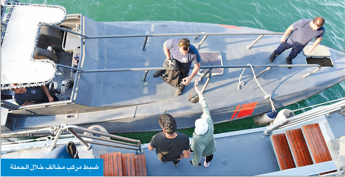
ضبط مركب مخالف خلال الحملة

182 مخالفة وضبط 18 حدثاً يقودون مركبات دون الحصول على رخص قيادة، وكذلك إحالة 25 مركبة إلى كراج الحجز للإدارة العامة للمرور، فضلاً عن ضبط شخصين بحوزتهما مواد مخدرة، وتمت إحالتهم إلى الإدارة العامة لمكافحة المخدرات.