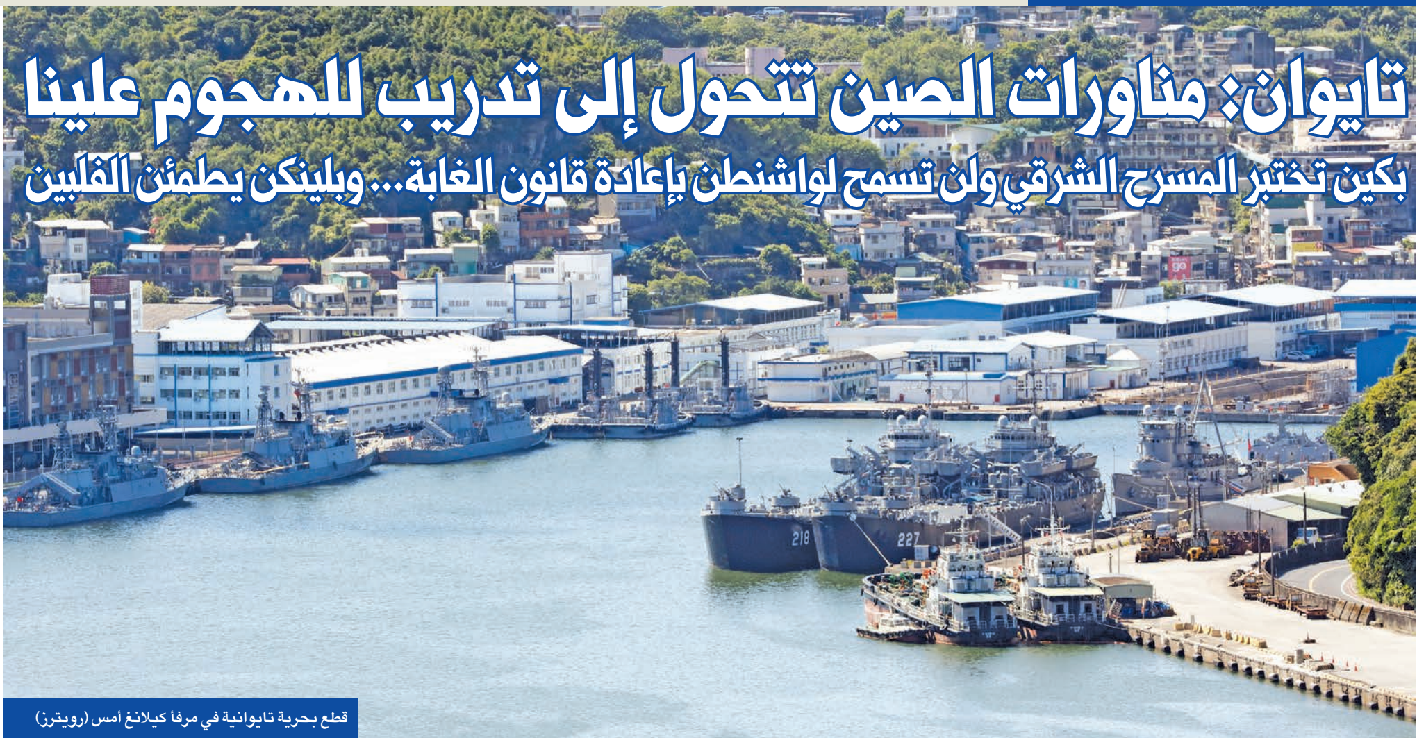
قطع بحرية تايوانية في مرفأ كيلانغ امس