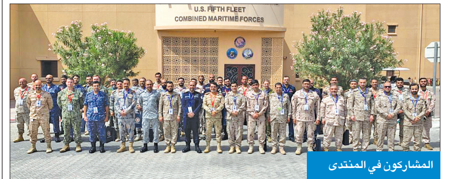
المشاركون في المنتدى

استضافت قوة الواجب المختلطة 152 بمقر القوات البحرية المشتركة في مملكة البحرين، وقيادة وتنظيم القوة البحرية الكويتية، منتدى الأمن البحري في الخليج العربي تحت عنوان «سبل تعزيز وتطوير العمليات البحرية في الخليج العربي»، بمشاركة وحضور نخبة من كبار ضباط الدول الأعضاء في القوات البحرية المختلطة (CMF). واشتمل البيان الختامي للمنتدى على ركائز أساسية تسهم في رسم خريطة الطريق المستقبلية لقوة الواجب المختلطة (152).