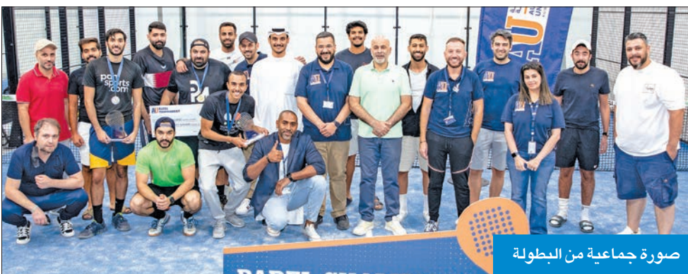
صورة جماعية من البطولة

البطولة حرصاً من الجامعة الأسترالية الدائم على تشجيع الشباب لممارسة الرياضة وإشغال وقتهم بما يعود عليهم بالفائدة.