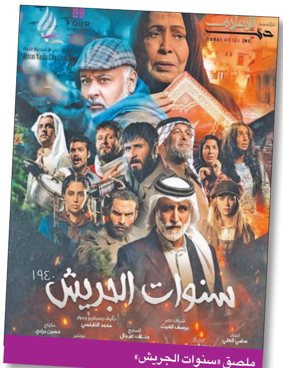
ملصق «سنوات الجريش»