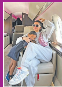
كيلي واينتها بالطائرة

رحلة بالطائرة أجرتها منذ بداية السنة. ورد بعض النجوم على مواقع التواصل، ومنهم تايلور سويت ومغني الراب دريك وغيرهم من المشاهير.