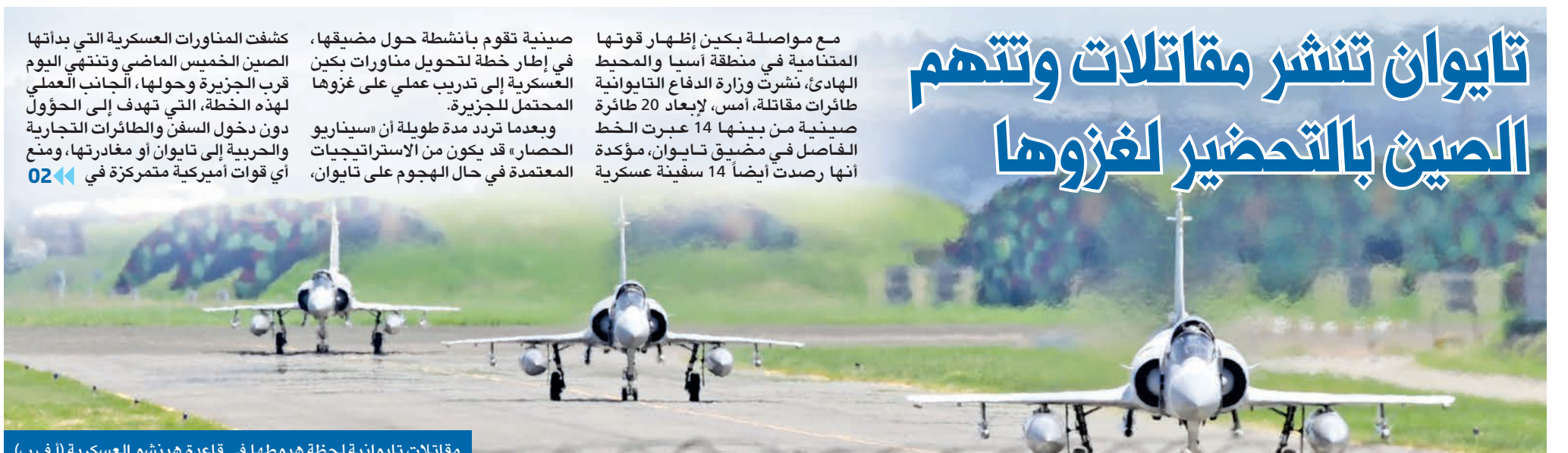
مقاتلات تايوانية لحظة هبوطها في قاعدة هينشو العسكرية