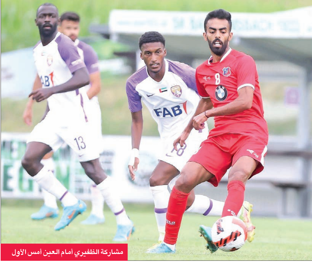
مشاركة الظفيري أمام العين أمس الأول