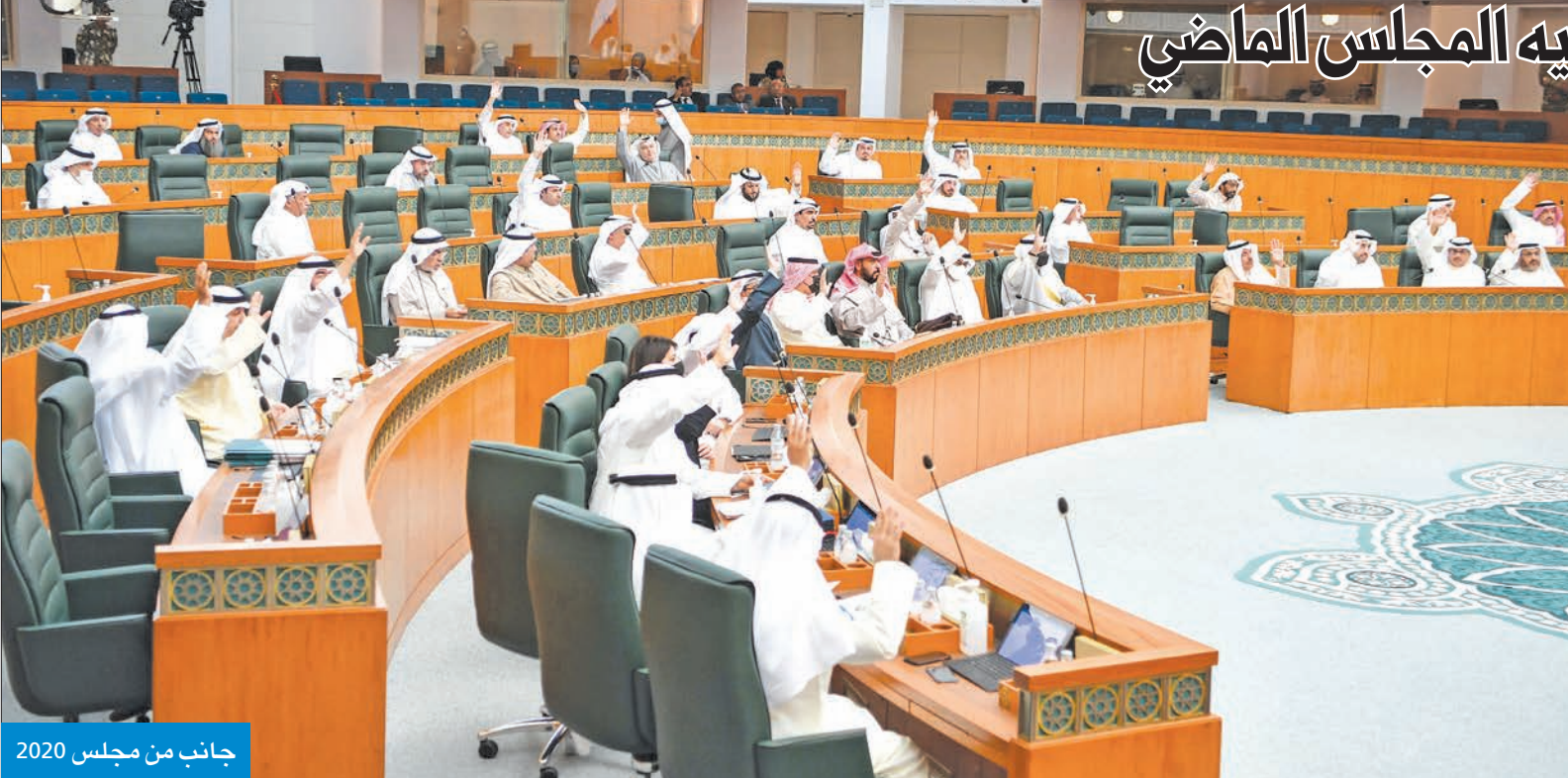
جانب من مجلس 2020