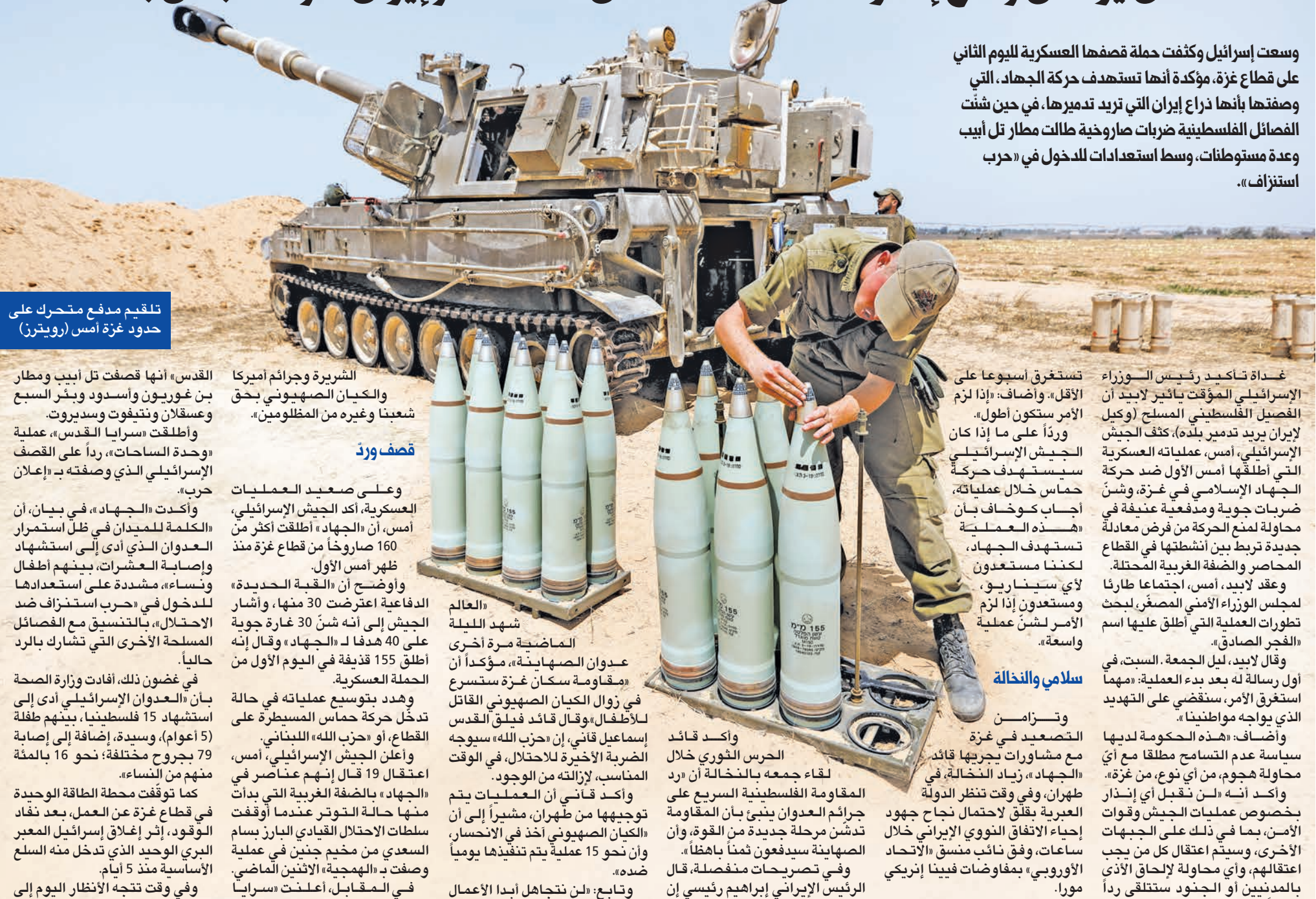
تلقيم مدفع متحرك على حدود غزة أمس

وسعت إسرائيل وكثفت حملة قصفها العسكرية لليوم الثاني على قطاع غزة، مؤكدة أنها تستهدف حركة الجهاد، التي وصفها بأنها ذراع إيران التي تزيد تدميرها، في حين شنت الفصائل الفلسطينية ضربات صاروخية طالت مطار تل أبيب وعدة مستوطنات، وسط استعدادات للدخول في «حرب استنزاف».