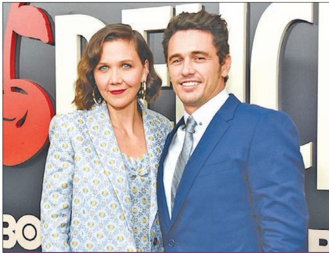
فرانكو وماغي جيلنهال في حفل انطلاق مسلسل «The Deuce»

ينطلق تصوير فيلم «ألينا دي كوبا»، الذي يشارك في بطولته النجوم جيمس فرانكو وأنا فيلافينييه وميا مايسترو، منتصف أغسطس الجاري، ومن المتوقع أن يحقق الفيلم انتشاراً كبيراً، خاصة أنه يتحدث عن فيدل كاسترو رئيس كوبا منذ عام 1959، بعد إطاحته بحكومة فولغينسيو باتيستا بثورة عسكرية، وما حدث في فترة حكمه من صراعات أثارت الأحداث في كوبا وحول العالم.