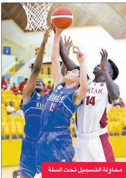
محاولة التسجيل تحت السلة

يلتقي المنتخب الوطني لكرة السلة للشباب تحت 18 سنة في 7:30 مساءً اليوم مع نظيره العماني، في منافسات الجولة الثالثة لبطولة الخليج للشباب المؤهلة لنهائيات آسيا، التي تستضيفها الإمارات حالياً على صالة نادي الوصل بدبي، وتستمر حتى 6 أغسطس، وتشهد الجولة اليوم أيضاً مباراتين، حيث يلتقي منتخب البحرين مع شقيقه القطري في الثالثة عصرًا، تليها مواجهة الإمارات مع السعودية. وكان الأزرق التقى في وقت متأخر من مساء أمس نظيره السعودي في منافسات الجولة الثانية التي شهدت أيضاً مواجهة عمان مع البحرين والإمارات مع قطر. وكانت منافسات اليوم الأول من البطولة أسفرت عن خسارة المنتخب الوطني أمام نظيره القطري بنتيجة 51-64، وفوز السعودية على عمان 63-33، والبحرين على الإمارات 68-48. وتقام البطولة بنظام الدوري من دور واحد، على أن يلتقي بعد نهاية الدور التمهيدي «الأول مع الرابع، والثاني مع الثالث» في الدور قبل النهائي، وستاهل الفائزان للدور النهائي. يذكر أن الأول والثاني في هذه البطولة سيتاهلان معاً لنهائيات آسيا التي تقام الشهر المقبل في طهران ممثلين عن الزون الخليجي.