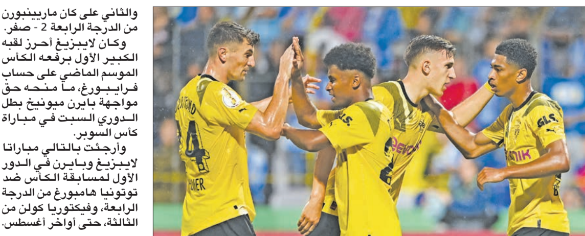
فرحة لاعبي دورتموند بالفوز

والثاني على كان مارينغورن من الدرجة الرابعة 2 - صفر. وكان لايبزيغ أحرز لقبه الكبير لأول برافحه الكاس الموسم الماضي على حساب فرايبورغ، ما منحه حق مواجهة بايرن ميونيخ بطل الدوري السبت في مباراة كأس السوبر. وإرجنت بالتالي مباراتا لايبزيغ وبايرن في الدور الأول لمسابقة الكأس ضد تونونيا هامبورغ من الدرجة الرابعة، وفكتوريا كولن من الثالثة، حتى أواخر أغسطس.