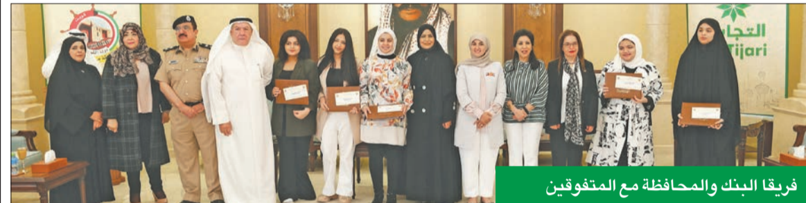
فريقا البنك والمحافظة مع المتفوقين