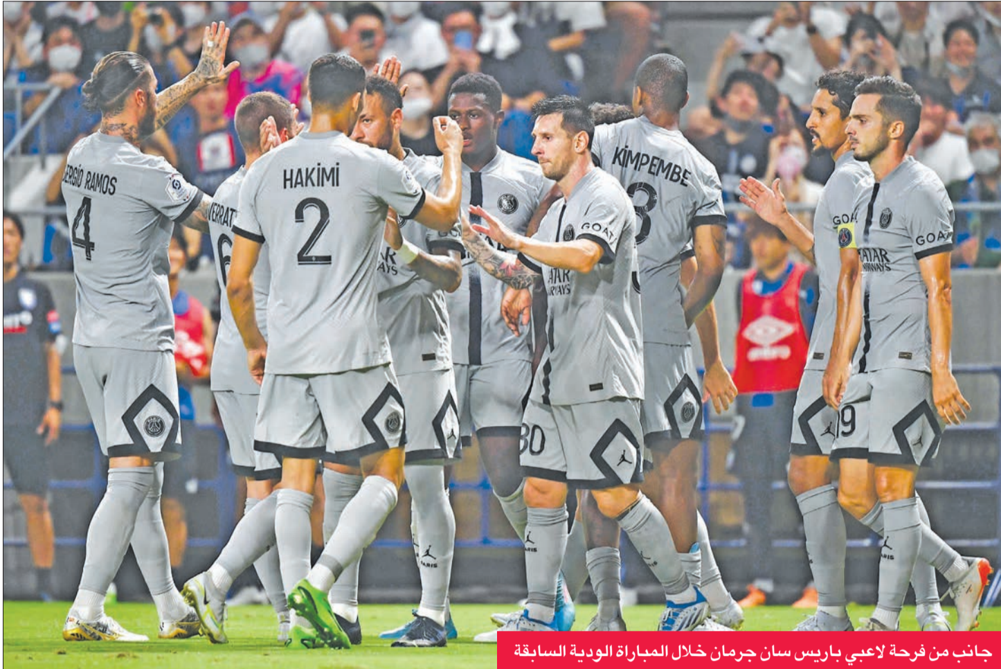
جانبا من فرحة لاعبي باريس سان جرمان خلال المباراة الودية السابقة

بعد جولة صيفية ناجحة في اليابان، يستهل باريس سان جرمان حامل لقب الدوري الفرنسي في كرة القدم موسمهم المحلي، بمواجهة نانت بطل الكأس اليوم في مباراة كأس الأبطال في تل أبيب. وتعد هذه المباراة مناسبة تقليدية لافتتاح الموسم، وتقام للمرة الثالثة على ملعب بلومفيلد في تل أبيب، بعد الأخيرة التي أحرزها ليل على حساب سان جرمان بالذات 1 - 0. ويحمل سان جرمان الرقم القياسي بعدد مرات إحراز اللقب (10)، متقدماً على ليون (8) وبرنيس وسانت اتيان (5). فيما يملك نانت ثلاثة الألقاب في 1965 و 1999 و 2001. وتميل الأرقام في السنوات الأخيرة لمصلحة نانت في المواجهات المباشرة، علماً بأن الفريقين تبادل الفوز في الموسم المنصرم، ففاز سان جرمان 3-1 ليرد له «الكاناري» التحية بالنتيجة عينها. لكن المواجهات الـ 24 في السنوات الـ 12 الأخيرة بين الفريقين انتهت بفائز، منها 21 مرة لسان جرمان مقابل 3 مرات فقط لنانت، حققها في الأعوام الثلاثة الأخيرة.