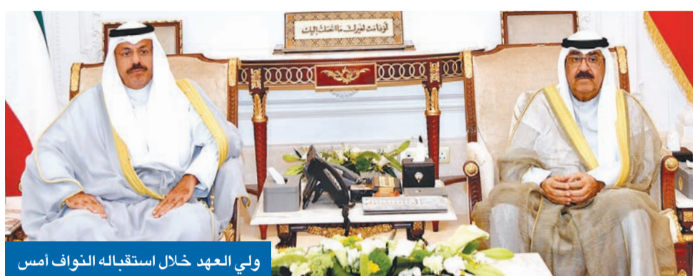
ولي العهد خلال استقباله النواف أمس

رئيس الوزراء المكلف أكد في رسالة لصاحب السمو عزمه على تحقيق الرخاء والنهضة الشاملة