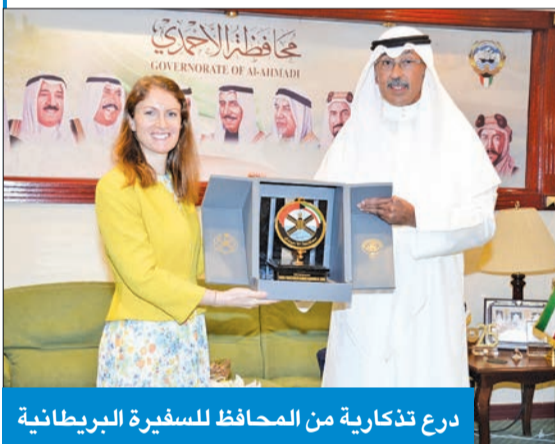
درع تذكارية من المحافظ للسفيرة البريطانية

استقبل محافظ الأحمدية الشيخ فواز الخالد، في مكتبه بديوان عام المحافظة، سفيرة المملكة المتحدة لدى الكويت بليندا لويس، حيث جرى التعارف وبحث العلاقات الوثيقة التي تربط قيادتي وشعبي البلدين الصديقين وسبل تعزيزها في جميع المجالات.