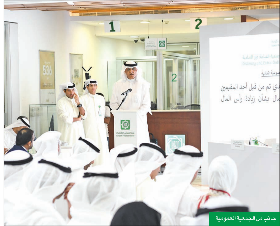
جانب من الجمعية العمومية

وحول انعكاسات أداء الأسهم بالبورصة، أوضح أن محفظة مؤسسة التأمينات الاجتماعية في «بيتك» مثلا سجلت عوائد سوقية بنحو 69 مليون