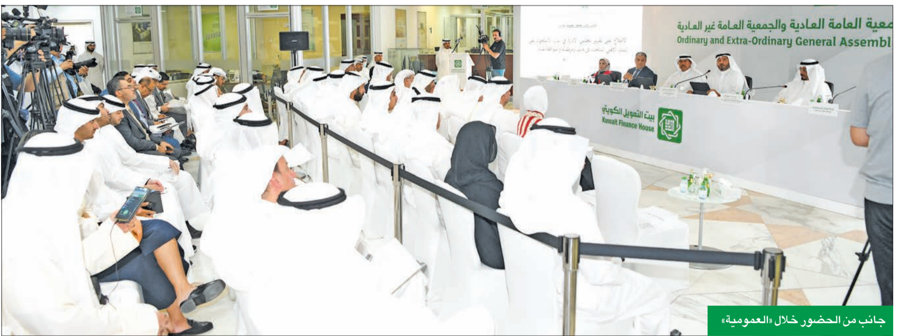
جانب من الحضور خلال «العمومية»

زيادة القاعدة الرأسمالية للبنك تقلص الاعتماد على المصارف العالمية في التمويل وقيادة الصفقات والاستشارات