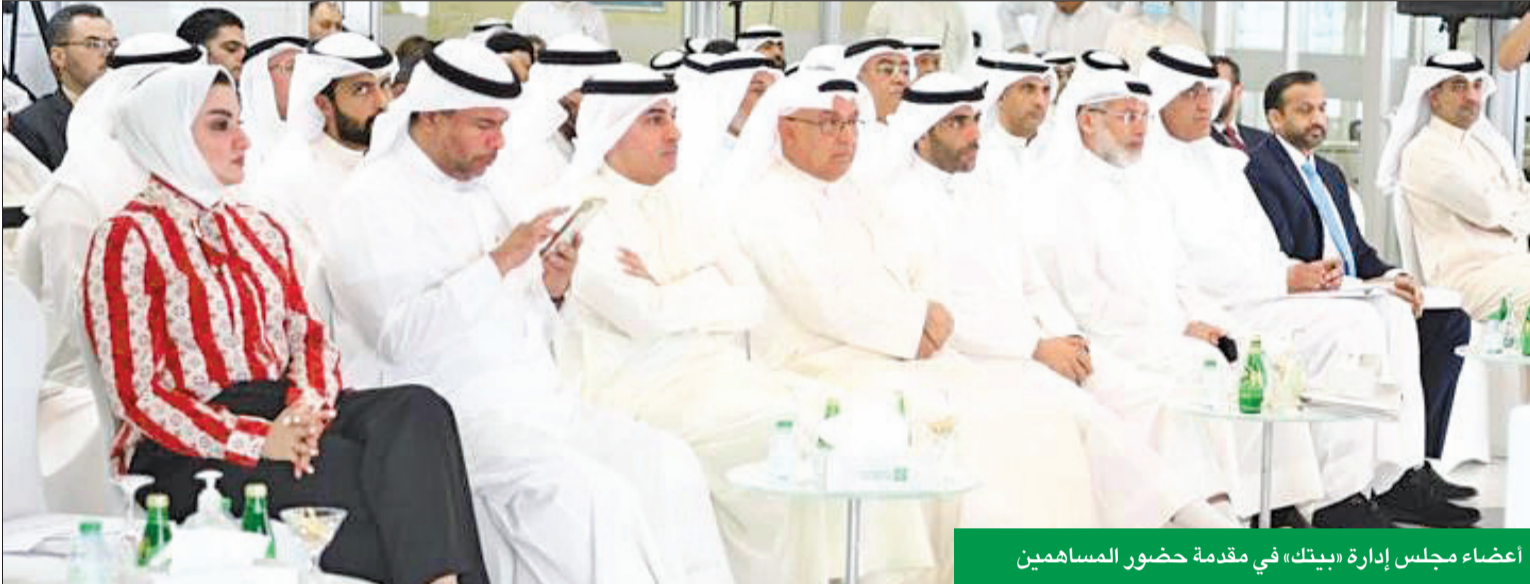
أعضاء مجلس إدارة «بيتك» في مقدمة حضور المساهمين

«يجمع بين ثقافتنا بنكين ناجحين ويعمل في 12 دولة ومنافعه لكل المساهمين»