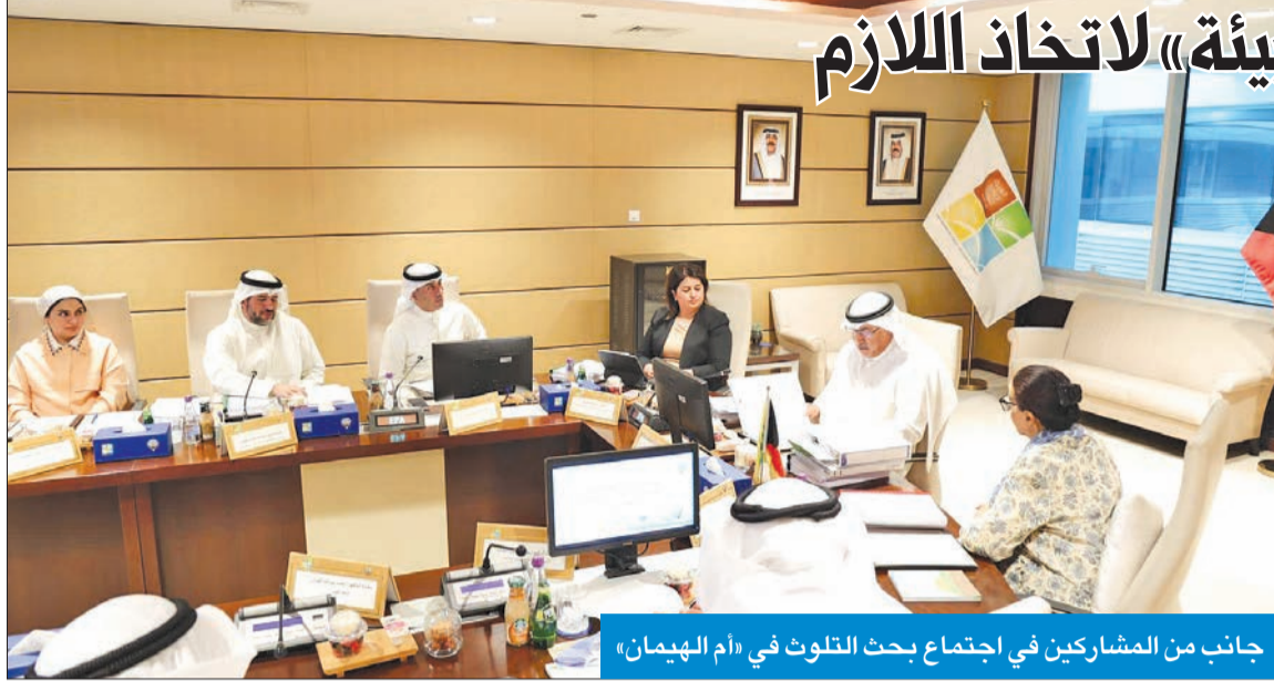
جانب من المشاركين في اجتماع بحث التلوث في «أم الهيمن»

شكّلها الفارس وترفع توصياتها سريعا لـ «الأعلى للبيئة» لاتخاذ اللازم