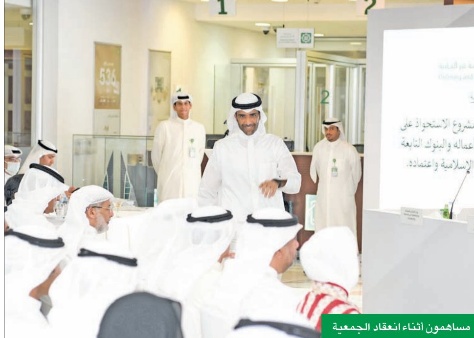
مساهمون أثناء انعقاد الجمعية

وذكر أن هناك خطة قصيرة المدى لتحويل جزء كبير من أصول البنك، متوقفاً لإنجاز الجزء