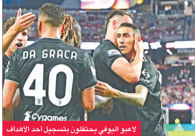
لاعبو اليوفي يحتفلون بتسجيل أحد الأهداف

أحرز الأميركي مايكل نورمان أمس الأول ذهبية سباق 400م، وقطع نورمان (24 عاماً) مسافة السباق بزمن