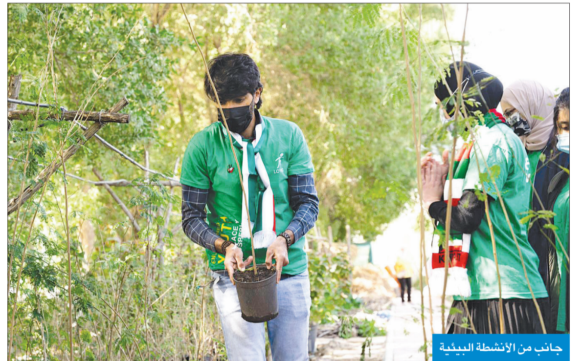
جانب من الأنشطة البيئية