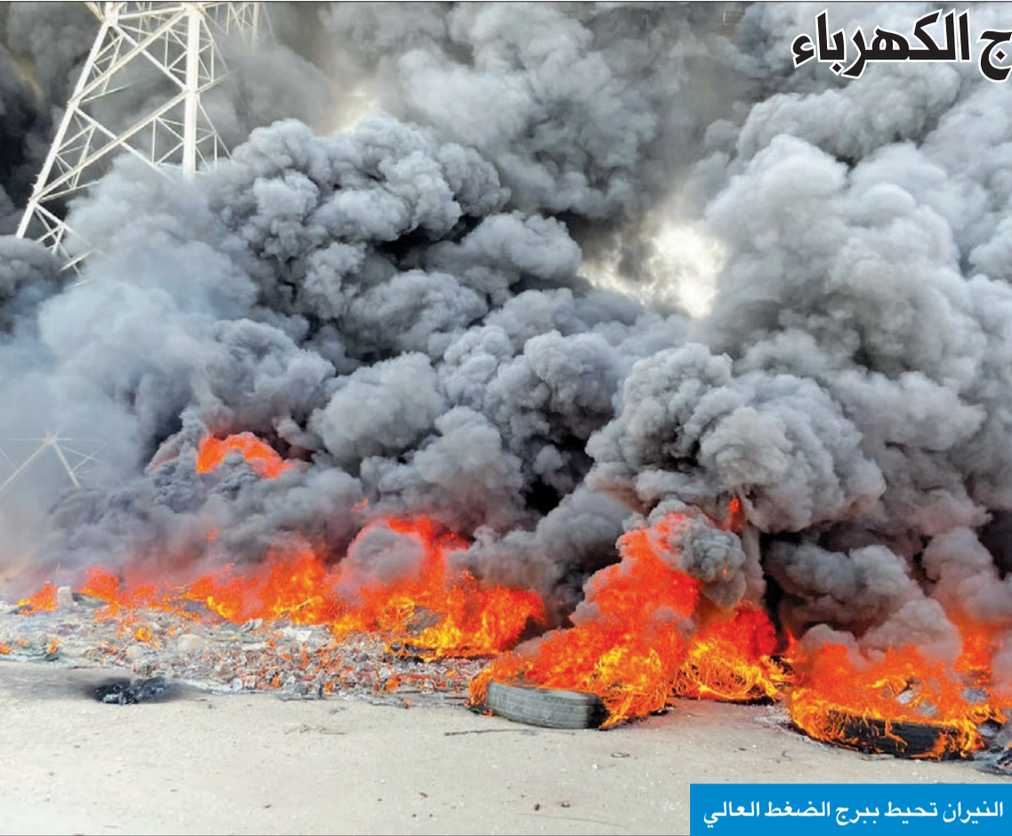
النيران تحيط ببرج الضغط العالي