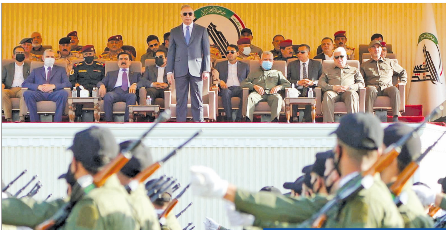
الكازمي خلال حضوره عرض «الحشد» في ديالي أمس

طالبت السلطات العراقية مجلس الأمن الدولي بعقد جلسة طارئة لبحث «الانتهاكات التركية»، بعد سقوط قتلى وجرحى في قصف استهدف متجمعاً سياحياً في دهوك بإقليم كردستان، في حين كشف وزير الخارجية العراقي أن بغداد تحضر لعقد اجتماع علني بين وزير الخارجية السعودي ونظيره الإيراني، يطلب من الرياض.