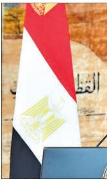
السيسي يلقي كلمته أمس (الرئاسة)

عقود طويلة بالتلاحم والثقة العميقة المتبادلة، إنها علاقة فريدة من نوعها بين شعب أبي عظيم، وجيش يمثل نموذجاً للمؤسسة الوطنية التي تدرك مهمتها وتؤديها على الوجه الأكمل، ولا تحيد عنها». وانطلق السيسي من حديثه عن الجمهورية الأولى إلى الجديدة، قائلاً: «إنني على يقين من قوة عزمنا معاً في الاستمرار بخطى ثابتة واثقة بالطريق الذي اخترناه جميعاً من أجل الانطلاق للجمهورية الجديدة، جمهورية التنمية والبناء والتطوير وتغيير الواقع، زتؤسس نسفاً فكرياً واجتماعياً وإنسانياً شاملاً متطوراً تسوده قيم رفيعة».