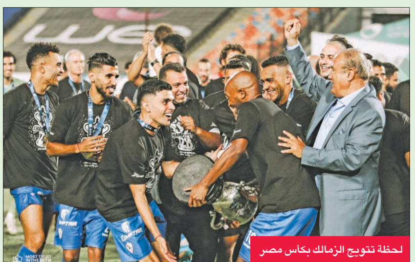
لحظة تتويج الزمالك بكأس مصر

ويحل بيراميدز ضيفاً ثقيلًا على الإسماعيلي في السابعة مساءً، على استاد الإسماعيلية، في مواجهة يسعى خلالها الفريق السماوي إلى حسم نقاط اللقاء للحفاظ على حظوظه في المنافسة على اللقب، حيث إنه يحتل الوصافة حالياً، بينما يخطط الدراويش للفوز من أجل الابتعاد أكثر عن منطقة الصراع مع الهبوط، في ظل احتلاله المركز الثالث عشر برصيد 26 نقطة.