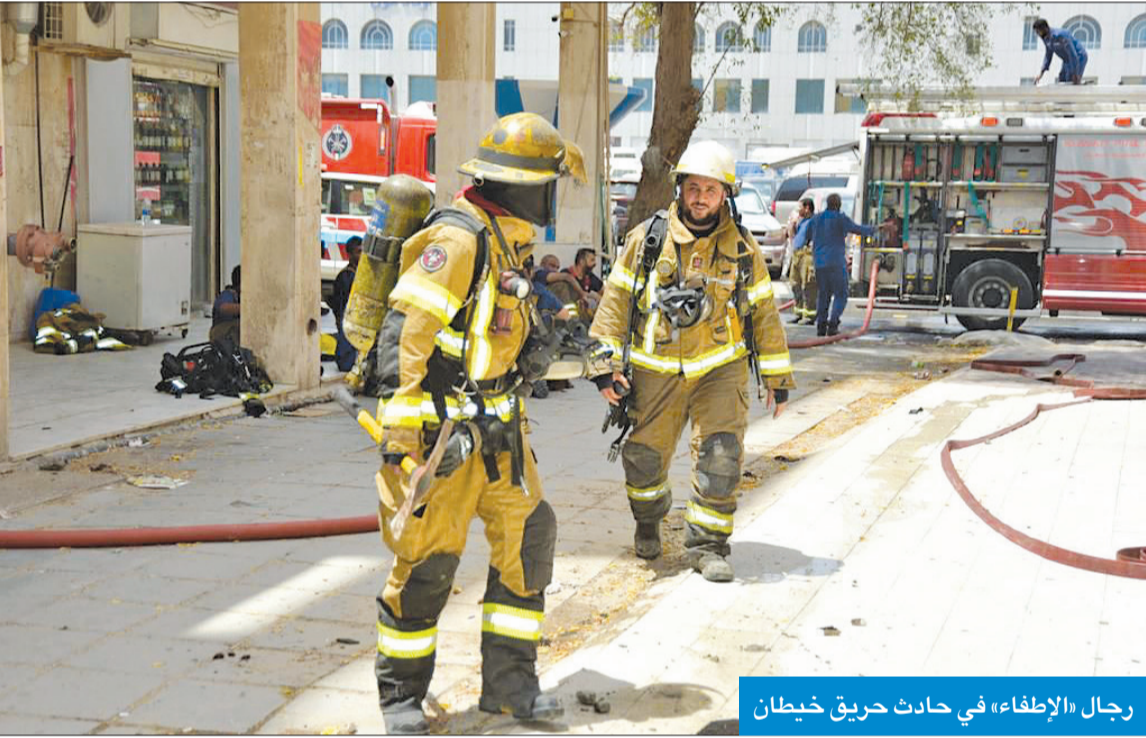
رجال «الإطفاء» في حادث حريق خيطان

وقاية محافظة الفروانية انتقلوا إلى موقع البلاغ للمعاينة والتحقيق في أسباب الحادث. وفي تفاصيل الحادث الأخر، قال الغريب إن إدارة العمليات تلقت بلاغاً، مساء أمس الأول، باندلاع حريق في نهاية بمنطقة خيطان، وأن هناك أشخاصاً محتجزين جراء الحادث، فتم تحريك مراكز إطفاء الفروانية وصحان إلى الموقع. وأضاف أنه تبين لرجال الإطفاء أن الحريق في شقة بالدور الخامس، وهناك 4 أشخاص محتجزون، فشرعوا في إنقاذهم باستخدام سلال الإطفاء، ومن ثم في مكافحة الحريق ومنع وصوله إلى بقية أرجاء البناية. وذكر الغريب أن الحادث أسفر عن إصابة وافد بحروق في القدم، وتم تسليمه إلى فني الطوارئ الطبية، حيث نقل إلى المستشفى لتلقي العلاج، وقد انتقل ضباط إدارة وقاية محافظة الفروانية إلى موقع البلاغ للمعاينة وإعداد تقرير حول الحادث.