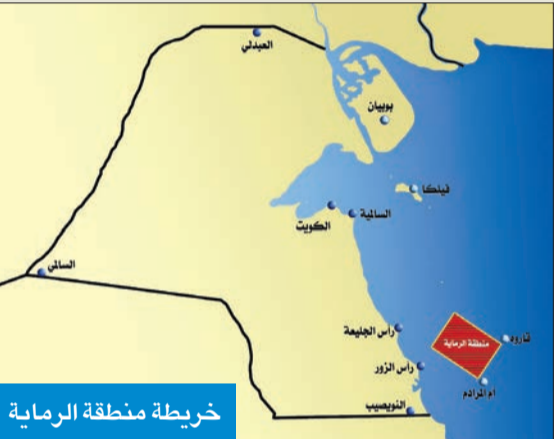
خريطة منطقة الرماية