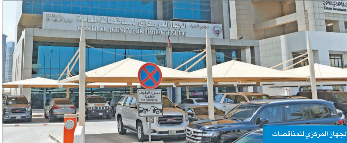
الجهاز المركزي للمناقصات

الجهاز رفض العقد لعدم تضمّنه «الإعاقه»... و«الديوان» يؤكد ضرورة فصله!