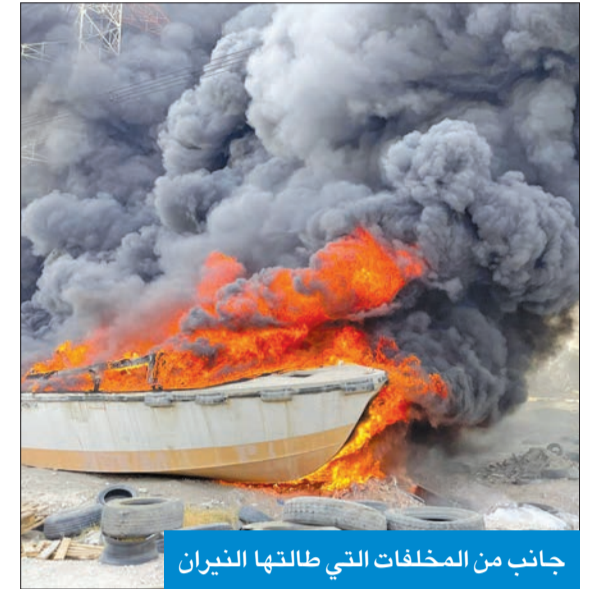
جانب من المخلفات التي طالتها النيران