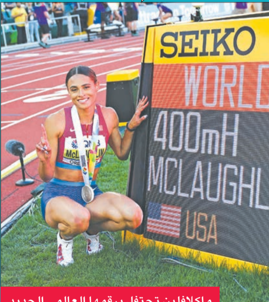
ماكلافلين تحتفل برقمها العالمي الجديد

حطمت البطلة الأولمبية الأميركية سيدني ماكلافلين الرقم القياسي العالمي لسباق 400م حواجز في طريقها إلى نيل الذهبية، على ملعب هايوارد فيلد في نسخة الـ 18 من بطولة العالم للالعاب القوى في مدينة بوجين الأميركية. وقطعت ماكلافلين (22 عاماً) المسافة بزمن 50.68 ثانية، ما حية رقمها السابق 51.41، الذي سجلته على الملعب ذاته في التجارب الأميركية للعرس العالمي في 25 يونيو الماضي، وعادت الفضية للهولندية فيمكي بول (52.27 ث)، والبرونزية للأميركية الأخرى ديلية محمد (53.13 ث)، وهي المرة الرابعة التي تتمكن فيها ماكلافلين من تحطيم الرقم القياسي العالمي للسباق في أكثر من عام واحد بقليل، وباتت أول امرأة تنزل تحت حاجز 51 ثانية في هذه المسافة، ونالت جائزة مالية بقيمة 100 ألف دولار.