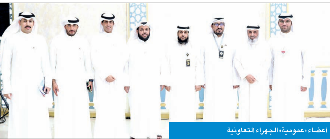
أعضاء «عمومية» الجهراء التعاونية

سيعمل خلال الفترة المقبلة على توفير كل احتياجات المساهمين، من خلال تنظيم المهرجانات لتخفيض الأسعار.