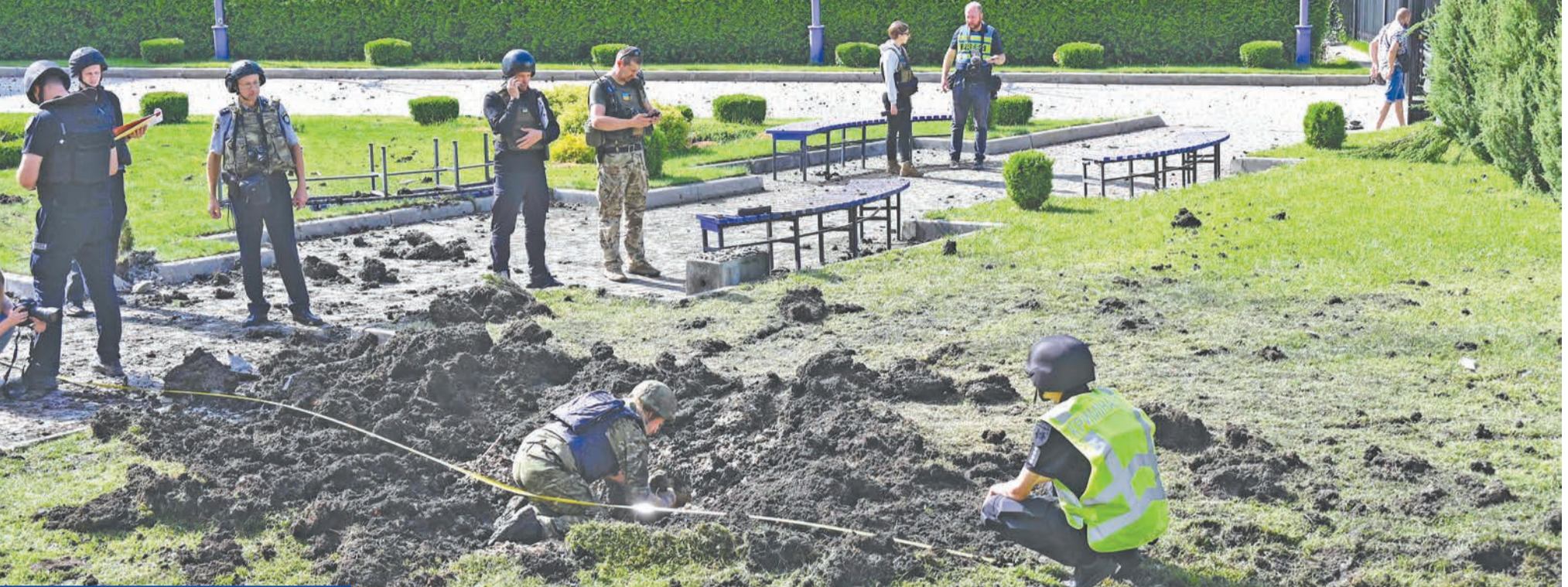
خبراء من الشرطة الأوكرانية يتفقدون حفرة تحتج عن انفجار قذيفة في خاريفكف أمس

كيف تستخدم مسيرات انتحارية في «زابورجيا» النووية... وواشنطن تزودها بـ4 منظومات «هيما رس»