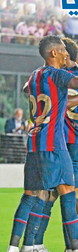
جانب من فرحة لاعبي برشلونة خلال المباراة

استهل برشلونة الإسباني جولته التحضيرية في الولايات المتحدة الأميركية، تمهيداً لانطلاق الموسم الجديد، بسداسية نظيفة أمام إنتر ميلان، لمايكه نجم كرة القدم السابق الإنكليزي ديفيد بيكهام على ملعب «درايف بنك ستادיום»، في ميامي، في ودية تآلق خلالها النوافذ الجديد إلى صفوف النادي الكاتالوني المهاجم البرازيلي رافينيا.