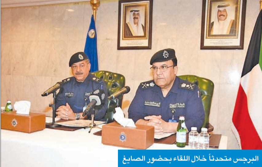
البرجس متحدثاً خلال اللقاء بحضور الصايغ

التقى وكيل وزارة الداخلية، الفريق أنور البرجس، صباح أمس، مع مسؤولي وممثلي الحسنيات ودور العبادة، بحضور الوكيل المساعد لشؤون المرور والعمليات، الوكيل المساعد لشؤون الأمن العام بالتكليف، اللواء جمال الصايغ، وعدد من القيادات الأمنية المعنية.