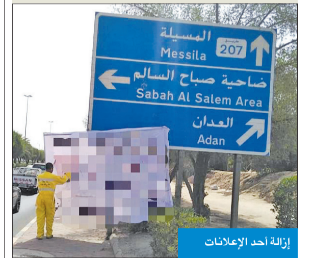
إزالة أحد الإعلانات

بلدية «مبارك»: 12 مخالفة و6 إنذارات في أسبوع