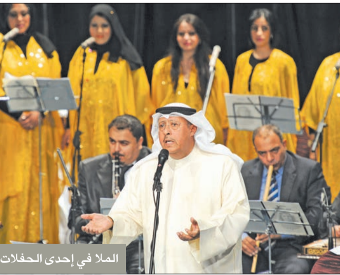
الملا في إحدى الحفلات

نعت وزارة الإعلام الملحن والمطرب سليمان الملا الذي وافته المنية بعد رحلة عطاء طويلة قدّم خلالها إسهامات بارزة للأعمال الفنية والأغنية الكويتية والخليجية. ونقلت الناطقة الرسمية لوزارة الإعلام، أنوار مراد، تعازي ومواساة وزير الإعلام والثقافة د. حمد روح الدين إلى أسرة الفقيد الفنانين الكويتيين، ونقابة الفنانين والإعلاميين.