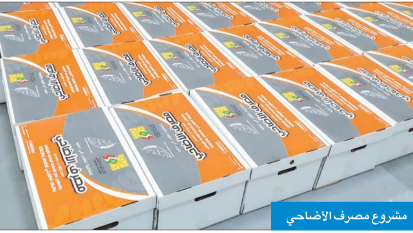
مشروع مصرف الأضاحي

الأفراد ودعم مسيرة العمل الخيري والإنساني في الكويت.