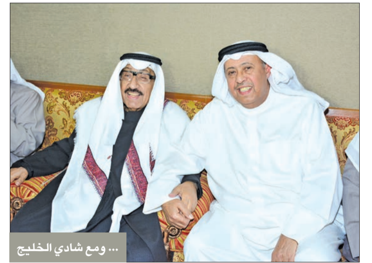
... ومع شادي الخليج