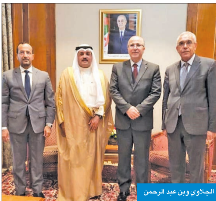
الجلالوي وبين عبد الرحمن

وأوضح البيان أن اللقاء شكل فرصة لتبادل واسع لوجهات النظر حول واقع وأفاق تطوير العلاقات الجزائرية - الكويتية في العديد من المجالات، بما في ذلك التعاون القانوني والقضائي، وفي مجال تعزيز النزاهة والشفافية، ودعم السلوكيات الأخلاقية في الحياة العامة. وأضاف أن الطرفين نوها «بعمق العلاقات الأخوية التي تربط البلدين والشعبين الشقيقين، وأهمية تنشيط