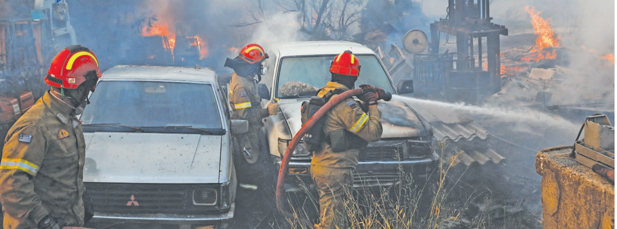
رجال الإطفاء يحاولون إخماد حريق هائل في البني قرب اثينا أمس

حطمت موجة الحر في القارة الأوروبية الأرقام القياسية لدرجات الحرارة المسجلة في دول مثل فرنسا وبريطانيا، وإيطاليا، واليونان وتركيا، وتسببت في وفاة المئات بإسبانيا والبرتغال، وصارت الحرائق الكاسحة، التي كانت نادرة الحدوث، أكثر تواتراً ويستمر اشتعالها وقتاً أطول في أنحاء العالم، وساعد في اندلاعها تغير المناخ، الذي أدى لزيادة ضخمة في أحجامها وشدها حتى في فصل الشتاء.