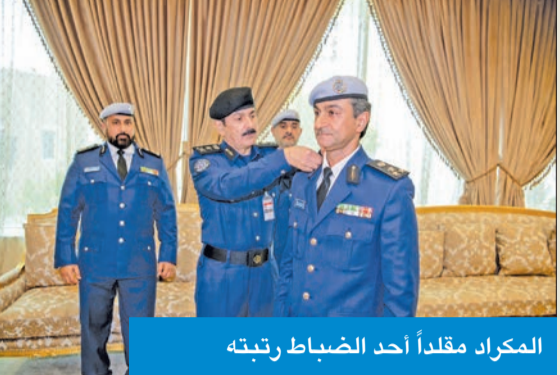
المكراذ مقلداً أحد الضباط رتبته

قلد رئيس قوة الإطفاء العام الفريق خالد المكراذ، صباح أمس، بالإناحية عن النائب الأول لرئيس مجلس الوزراء وزير الداخلية الشيخ الفريق أول م. أحمد النواف، الرتبة الجديدة لعدد من الضباط في «الإطفاء العام» من رتبة عقيد إلى عميد، وفقاً للمرسوم الأميري لصاحب السمو أمير البلاد الشيخ نواف الأحمد، بناء على عرض النائب الأول لرئيس مجلس الوزراء وزير الداخلية، وبعد موافقة مجلس الوزراء بترقية عدد 6 ضباط من رتبة عقيد إلى رتبة عميد.