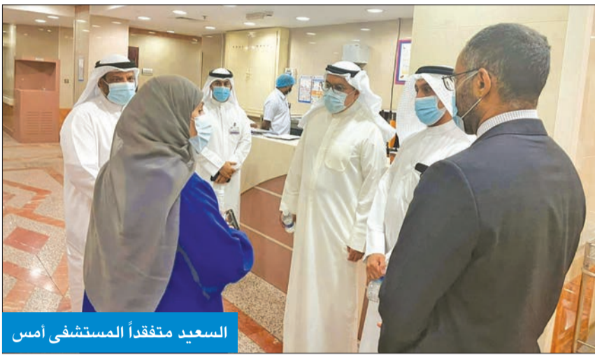
السعيد متفقدًا المستشفى أمس

الصحة من الكوادر الطبية إلى شرح حول آليات توفير الاستجابة السريعة والرعاية الفورية للأمراض، والإصابات الحادة والمهددة للحياة، بما يضمن تقديم الرعاية الفعالة في الوقت المناسب. وأكدت الوزارة أن الزيارة شملت كذلك الاطلاع على سير العمل في وحدات العناية المركزة، والقواعد الصارمة فيها، والأدوار والمسؤوليات المحددة للفرق الطبية فيها، كما تضمنت أيضاً متابعة سير العمل في قسم المختبرات الهندسية في المستشفى.