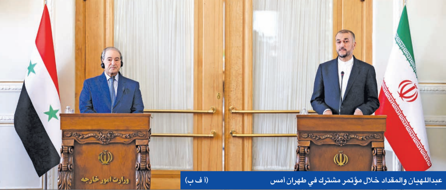
عبدالهيهان والمقداد خلال مؤتمر مشترك في طهران أمس

ذكرت صحيفة «يسرائيل هيويم» و«قناة 12» العبرية، أن إسرائيل تضغط على الولايات المتحدة لتكثيف جهودها لضمان التوصل إلى اتفاق مع لبنان بشأن ترسيم الحدود البحرية بأسرع وقت؛ لتفادي مواجهة «حزب الله»، الذي هدد، أمس الأول، بالدخول في حرب إذا لم يُسمح لليهود بالوصول إلى حقولها باستخراج الغاز من منطقة متنازع عليها. وجاء تلويع الحزب بالتصعيد بعد ساعات من تهديد وزير الدفاع الإسرائيلي بيني غانتس بـ «حرق لبنان».