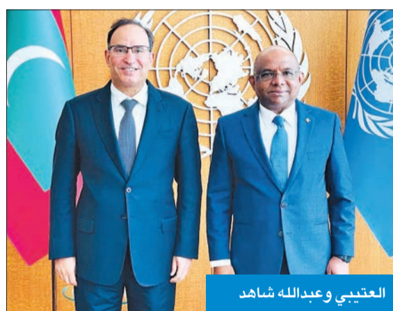
العقبي و عبدالله شاهد

جدد مندوب دولة الكويت الدائم لدى الأمم المتحدة، السفير منصور العتيبي، دعم دولة الكويت لرئيس الجمعية العامة للمنظمة الدولية عبدالله شاهد في أعمال الدورة الحالية للجمعية، والتي تحمل شعار «رسالة الأمل».