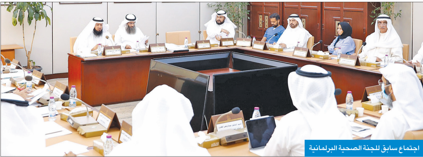
اجتماع سابق للجنة الصحية البرلمانية

انتهت من 8 اقتراحات برغبة من أصل 175 موضوعاً