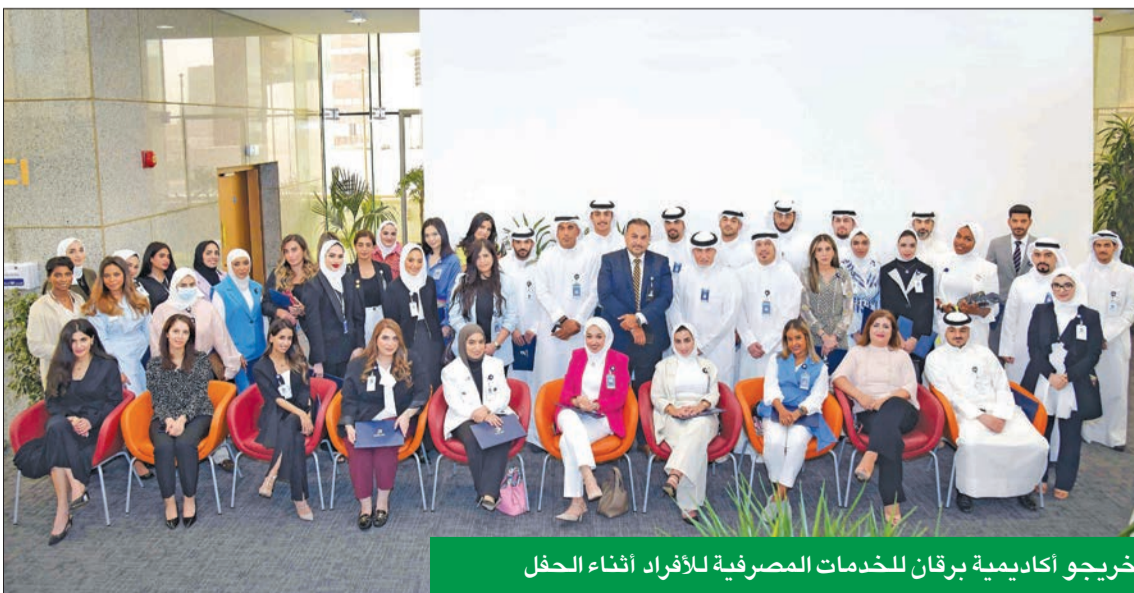
خريجو أكاديمية برقان للخدمات المصرفية للأفراد أثناء الحفل

احتفل بنك برقان، أخيراً، بتخريج دفعة من المتدربين في أكاديميته للخدمات المصرفية للأفراد، حيث تلقى 39 فرداً من موظفيه تدريباً على مجموعة من المهارات والخبرات العملية بأحدث الأساليب التدريبية، اجتاز 28 منهم التدريب في برنامج «انطلاقة» للبحريين الجدد أكثر من شهر تدريبي، فيما أتم 11 موظفاً آخرين تدريبهم ببرنامج مسؤولي علاقات العملاء لـ 3 أسابيع من المتدربين بجوائز قيمة على أنقى لموظفهم الاستثنائي لقيم برقان (الالتزام، والتطوير، والثقة، والتميز).