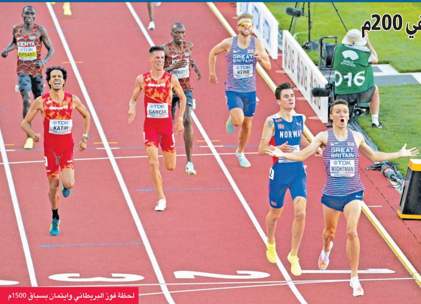
لحظة فوز البريطاني وايتمان بسباق 1500م