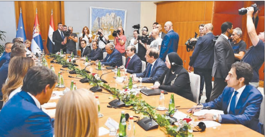
مباحثات السيسى وفوتشيتش في بلغراد أمس

عقب ساعات من فتح القضاء العراقي تحقيقاً بشأن تسريبات صوتية، منسوبة لزعم ائتلاف دولة القانون، رئيس الحكومة الأسبق نوري المالكي، تضمنت اتهامات لقلندي الصدر وتهديداً بمهاجمة مدينة النجف. أعلنت كتل الإطار التنسيقي الشيعي، في بيان، ليل الثلاثاء الأربعاء، أن الأول، وزعيم تحالف الفتح، هادي العامري، انسحب من السباق لرئاسة الوزراء في البلاد، وقالت إنهما أكد «دورهما الأبوي وأبديا تفهما كبيراً ومرونة عالية في ضرورة التعجيل بحسم اسم المرشح المناسب للمنصب». وأكدت الكتلة الشيعية، في بيانها، أن «قادة الإطار أكدوا، بالإجماع، أن المرشح لن يكون محسوباً على جهة معينة، بل هو مرشح كل قوى الإطار»، مضيفاً: «لن نحسب نقاط المرشح على أي جهة لكيلا يكون مديناً لها، بل هو من كل الإطار ولكل العراق».