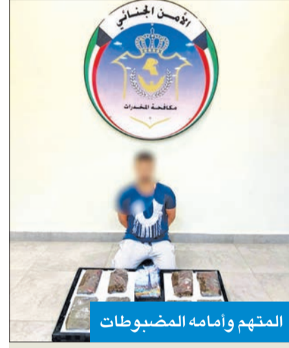
المتهم وأمامه المضبوطات

واصل قطاع الأمن الجنائي بوزارة الداخلية، ممثلاً بالإدارة العامة لمكافحة المخدرات، عملية ملاحقة تجار المخدرات ومروجيها، حيث تمكنوا مساء أمس الأول من ضبط مواطن خليجي بتهمة الاتجار بالمواد المخدرة، وعثر بحوزته على 6 كيلوغرامات من مادة الحشيش، و10 غرامات من الشبو المخدرة.