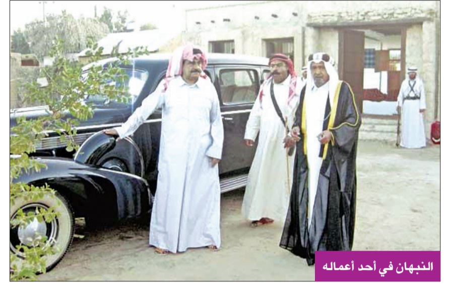
النبهان في أحد أعماله

وفيما يتعلق بالأعمال التراثية التلفزيونية، قال: «يشوب هذا الجانب المهم بعض النقص، حيث إن الأعمال التي أنتجت