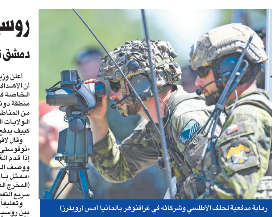
رماية مدفعية لحلف الأطلسي وشركائه في غرافنور بالمانيا أمس

النوية ليس بها منتصر، لذلك فلا يمكن أن تشب. إلى ذلك، أكد الرئيس فلاديمير بوتين بعد لقائه نظيره الإيراني إبراهيم رئيسي والتركي رجب طيب إردوغان، أمس الأول، أنه لا يرى أي رغبة من أوكرانيا في التمسك ببنود اتفاق جرى التوصل إليه في مارس الماضي بعد جولات من المحادثات في بيلاروسيا. وقال بوتين: «فيما يتعلق بجهود تركيا، وكذلك مقترحات الدول الأخرى، مثل السعودية التي تعرض وساطتها، وكذلك الإمارات، وهم يمتلكون القدرة على ذلك، فنحن نشكر جميع أصدقائنا الذين يعرضون إمكانياتهم، حتى مجرد الرغبة في المساهمة بشكل ما بعد أمرأ نبيلاً». من ناحية أخرى، عبر بوتين عن استعداد