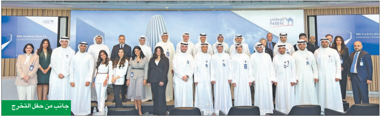
جانب من حفل التخرج

النصرالله: مبادرات البنك التدريبي تتبوأ مكانة مهمة في صميم خطته الاستراتيجية