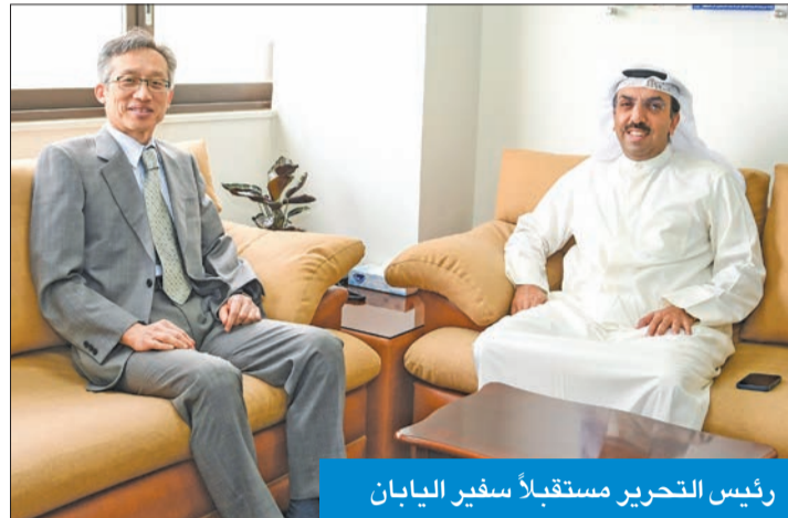
رئيس التحرير مستقبلاً سفير اليابان

إلى أن سفارته أصدرت منذ بداية هذا العام نحو 800 فيزاً للكويتيين، ومشيراً إلى أن «الفيزا القبرصية لا تتحول حاملها إلا الدخول إلى بلغاريا وكرواتيا ورومانيا».