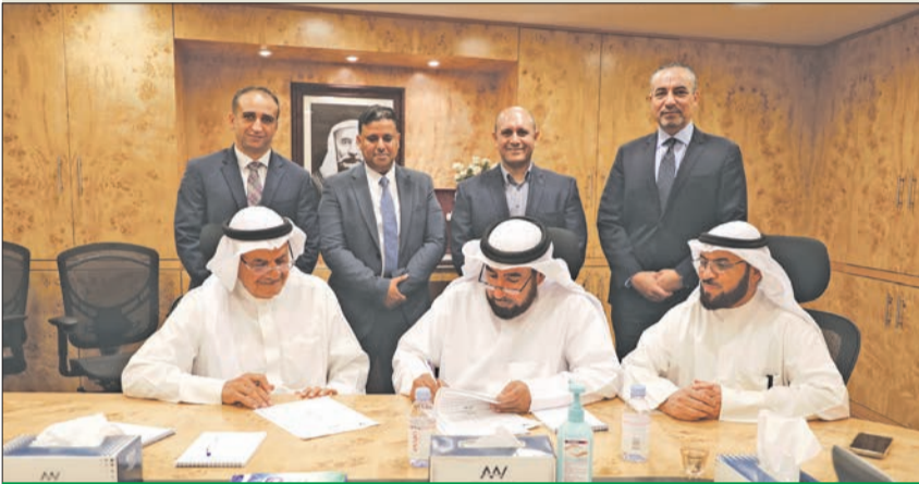
جانب من توقيع عقد اتفاقية دعم لجمعية مبرة الدعم الإيجابي

أعلنت شركة علي عبدالوهاب المطوع التجارية وشركة هوفمان لا روش لنادوية الكويت تجديد دعم ما لمرضى السرطان عبر عقد اتفاقية مع مبرة الدعم الإيجابي لمرضى السرطان لعلاج أكبر عدد من المرضى المحتاجين في الكويت.