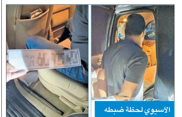
الآسيوي لحظة ضبطه