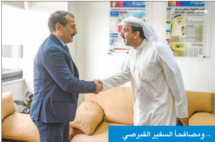
... ومصافحاً السفير القبرصي