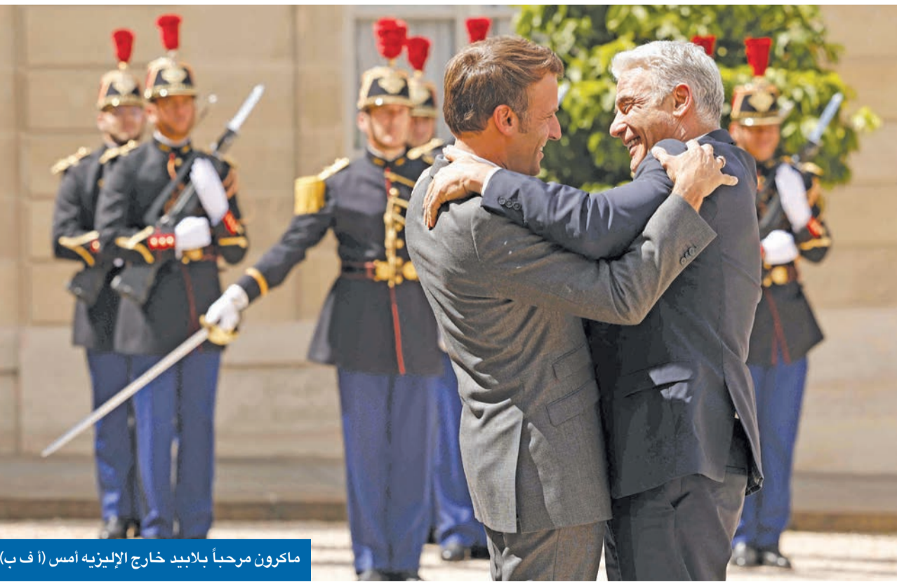
ماكرون مرحباً بلابيد خارج الإنليزية أمس

ماكرون يدعو إلى تجنب تخريب مفاوضات ترسيم الحدود بين بيروت وتل أبيب