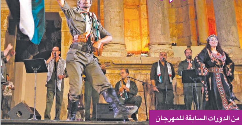
من الدورات السابقة للمهرجان

يستقطب مهرجان جرش للثقافة والفنون في دورته السادسة والثلاثين مجموعة كبيرة من نجوم الوطن العربي، ويحشد مجموعة واسعة من الأنشطة ليستعيد الحدث الثقافي السياحي البارز في الأردن كامل رونقه وبريقه. وقالت وزيرة الثقافة الأردنية رئيسة اللجنة العليا للمهرجان هيفاء النجار، في مؤتمر صحفي أمس الأول بالمركز الثقافي الملكي، إن دورة هذا العام تقام من 28 يوليو إلى 6 أغسطس، تحت شعار «نور لبنا» مضيفاً أن المهرجان سيكون منصة تجمع شعراء وكتاب وفنانين وحرفيين وصناع أفلام على كل المستويات، كما أنه في الوقت ذاته مساحة مهمة لتعزيز السياحة. وتشارك في المهرجان 20 دولة هي: الأردن والسعودية وقطر والبحرين وعمان والكويت والإمارات ومصر وليبنان وفلسطين واليمن وسورية والعراق والمغرب والجزائر وتونس والمكسيك وكوريا الجنوبية والهند والسويد.