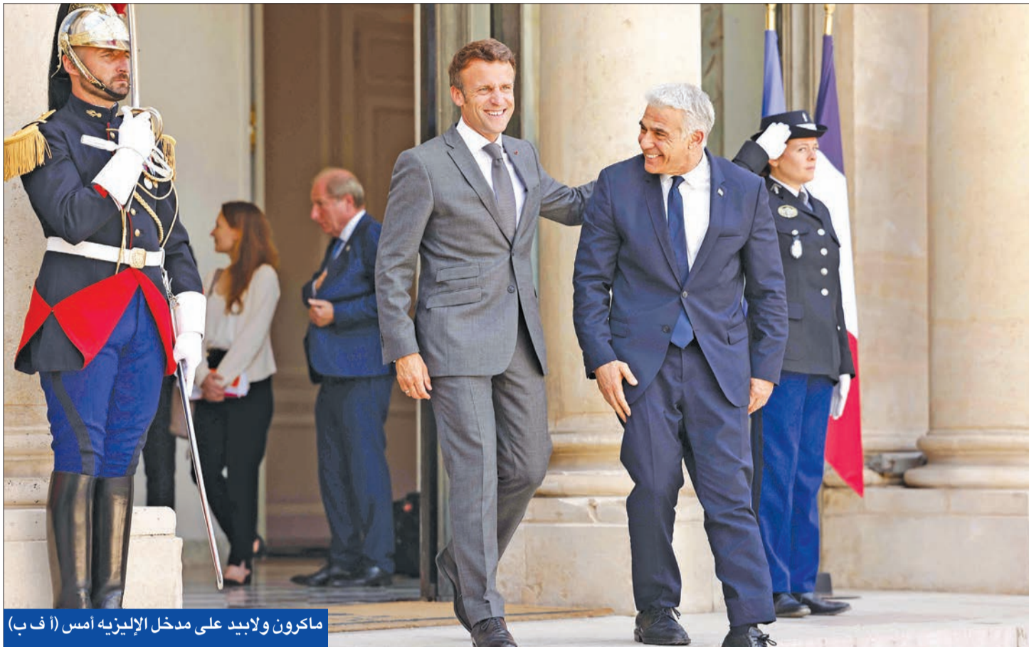
ماكرون ولايبيد على مدخل الإليزيه أمس (أ ف ب)

● غانتس: دوريات إيرانية في البحر الأحمر ● لايب يد ضغط على ماكرون لتحديد جدول زمني للمفاوضات