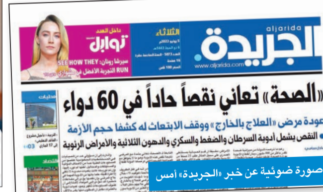
صورة ضوئية عن خبر «الجريدة» أمس

«الاعتقاد بأن انتظار حل المجلس يعفي من المسؤولية... أمر خطير»