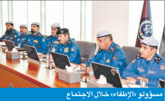
مسؤولو «الإطفاء» خلال الاجتماع