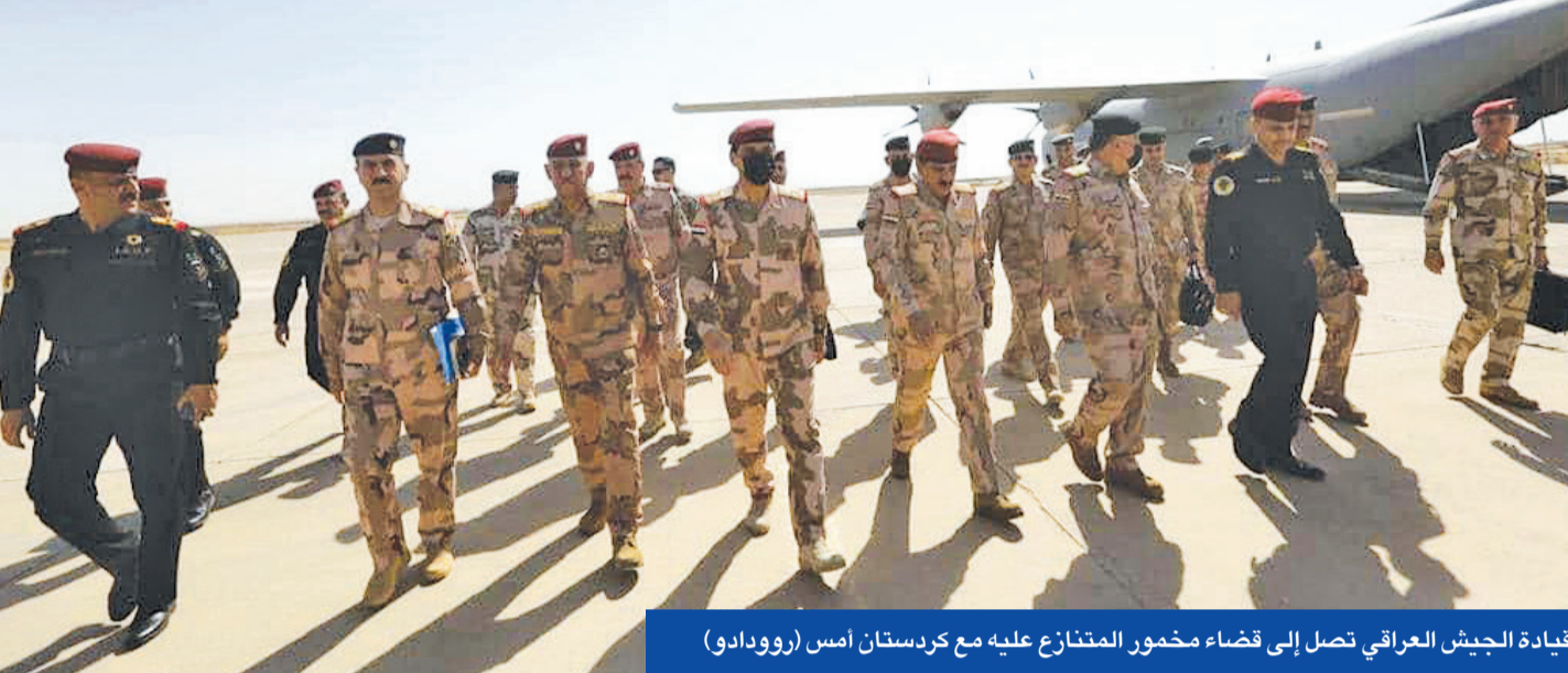
قيادة الجيش العراقي تصل إلى قضاء مخمور المتنازع عليه مع كردستان أمس (روودادو)

اختبار قوة بين تحالف «السيادة» و«الحشد الشعبي» بعد سجال على إخراجهم من المحافظات السنية