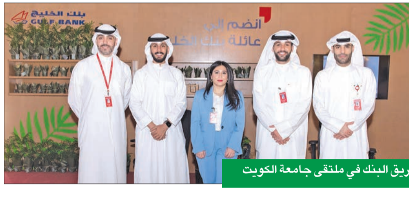
فريق البنك في ملتقى جامعة الكويت

الحجاج: دعم الاقتصاد المستدام عبر توظيف الشباب وتأهيلهم