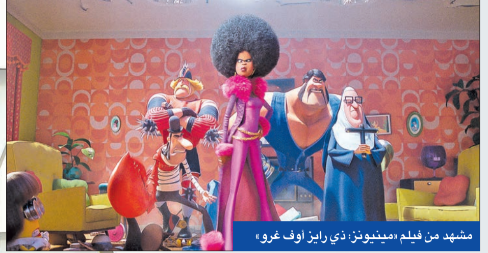
مشهد من فيلم «مينيونز: ذي رايز أوف غرو»

حقق رقماً قياسياً أكبر افتتاح في عطلة نهاية الأسبوع