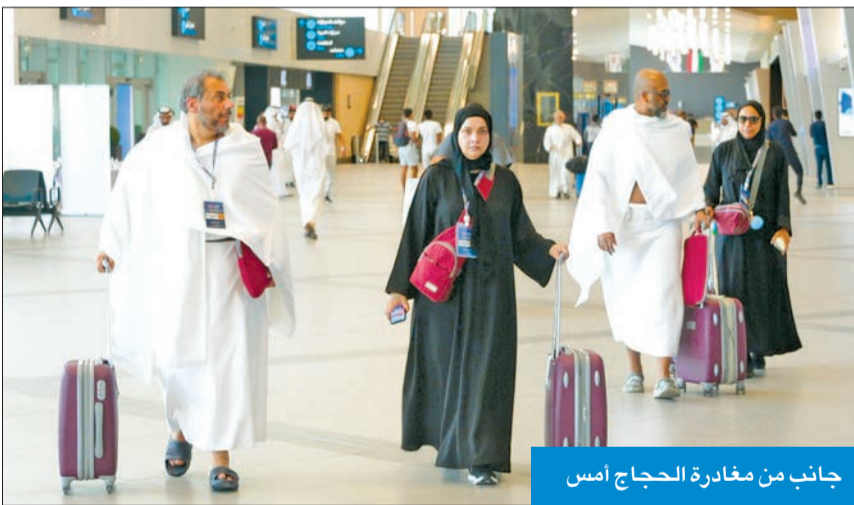
جانب من مغادرة الحجاج أمس

2000 حاج تقريباً، مقسمين على 7 رحلات يتم تسييرها على مطار T4.