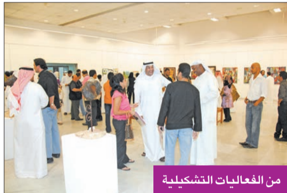
من الفعاليات التثقيفية

دعا المجلس الوطني للثقافة والفنون والآداب الفنانين والرسامين، عبر وسائل التواصل الاجتماعي، إلى المشاركة بأعمالهم في مبادرة «IN Kuwait» التي جاءت بعنوان «إلى أين يأخذ خيالك». وذكر المجلس أن المبادرة تهدف إلى دعم الفنانين والرسامين «الستريترز»، وخلق مجتمع فني لهم، عن طريق تسليط الضوء عليهم بعرض أعمالهم المميزة على وسائل التواصل الاجتماعي التابعة للمجلس. وأوضح أن شروط المشاركة هي: المشاركة للرسامين الكويتيين والمقيمين في الكويت «ابتداءً من عمر 18 عاماً»، المشاركة في مجالات الرسم التالية: الرسم الرقمي، الرسم التقليدي، تكون فكرة المشارك من نسج الخيال وضمن الموضوع المذكور وهو «الخيال الكوني»، لكل مشارك عمل فني واحد بحد أقصى، مراعاة الجودة العالية