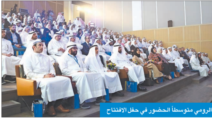
الرومي متوسطاً الحضور في حفل الافتتاح

كشف مدير جامعة الكويت، د. يوسف الرومي، عن حصول الجامعة على دعم غير مسبوق لميزانيتها، مشيراً إلى أن وزارة المالية والجهات المعنية في الحكومة لم يقصروا هذا العام مع الجامعة، خاصة في دعم ميزانية الأبحاث، لافتاً إلى أن هذا الدعم سيسخر لخدمة المجتمع والبحث العلمي.