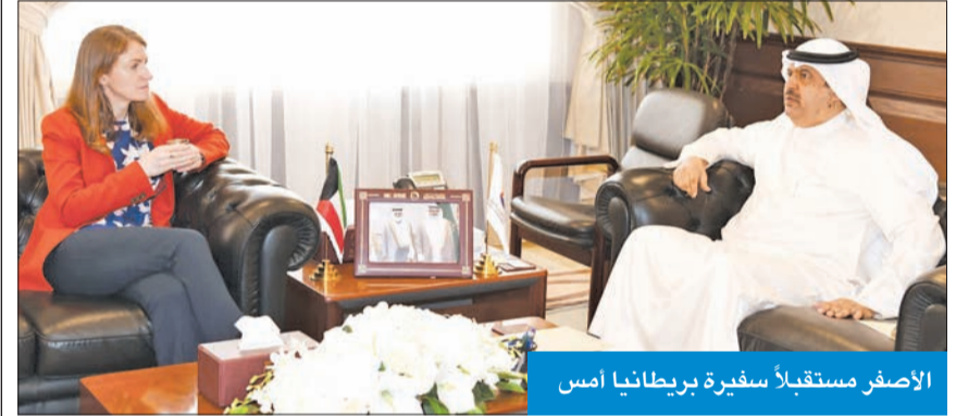
الأصفر يستقبل سفيراً بريطانيا أمس

وأفاد بأن الغاية من تكريم الفائقين هو الاحتفال بهم وتهنئتهم وأولياء أمورهم، معرباً عن ثقته بقدراتهم وإمكاناتهم في تحقيق ما يحلمون به