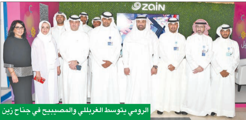
الرومي يتوسط الغريلي والمصبيح في جناح زين

الشركة عرّفت حديثي التخرج على طبيعة العمل في قطاع الاتصالات