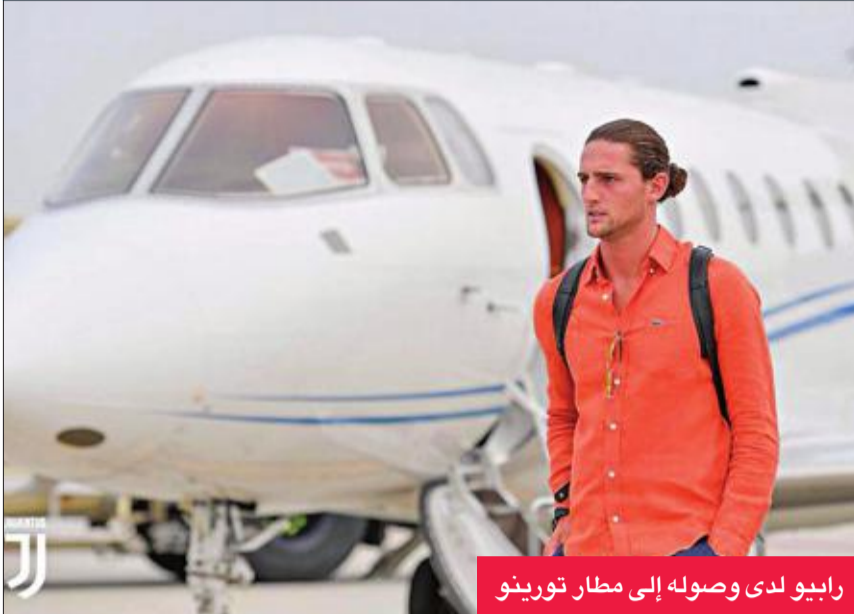
رايو لدى وصوله إلى مطار تورينو