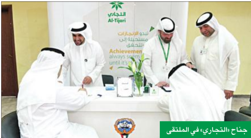
جناب «التجاري» في الملتقى

بالتعاون مع الهيئة العامة لشؤون ذوي الإعاقة