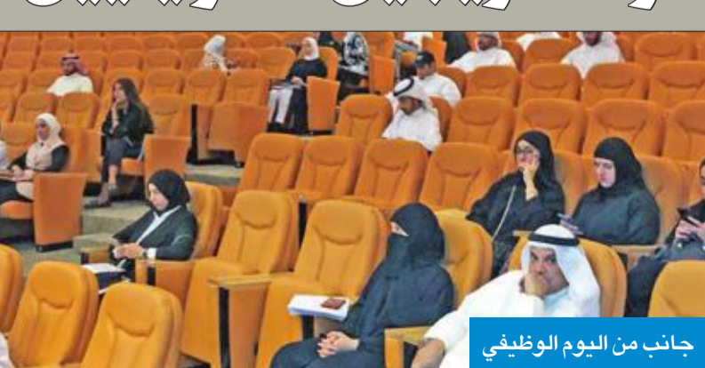
جانب من اليوم الوظيفي

الطرفين يتم توقيع العقود، مبيناً أن الهيئة بصدد وضع خطة عمل مع القطاع المصرفي لتوفير مطالباتهم الوظيفية، إلى جانب الدخول إلى القطاعات الأخرى لبحث متطلباتهم وإيجاد فرص عمل للكويتيين.