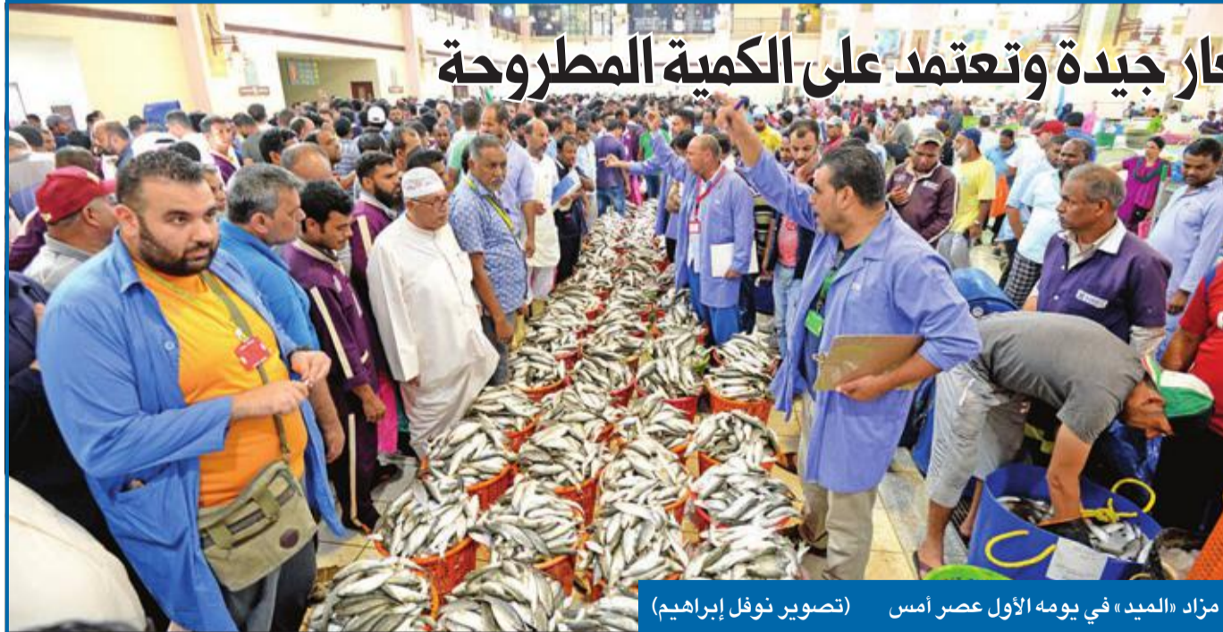
مزار «الميد» في يومه الأول عصر أمس

على تغطية السوق وسد الحاجة والطلبات المتزايدة لأسماك الميد من قبل المستهلكين، متمنياً المساهمة في توفير كميات كبيرة طوال فترة السماح بصيد «الميد»، والتسهيل على الصيادين لما في ذلك من مشقة وتعب أيضاً.