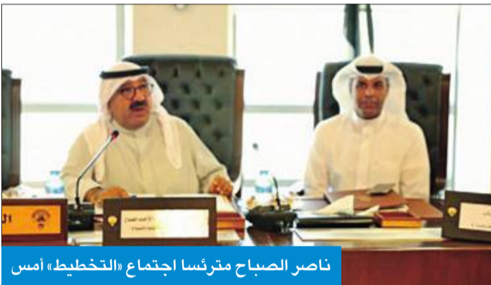
ناصر الصباح مترنسا اجتماع «التخطيط» أمس

عقد المجلس الأعلى للتخطيط والتنمية أمس اجتماعاً مشتركاً لأعضاء لجان المجلس الأعلى للتخطيط والتنمية برئاسة النائب الأول لرئيس مجلس الوزراء وزير الدفاع رئيس المجلس الأعلى للتخطيط والتنمية ناصر الصباح، بحضور وزير النفط وزير الكهرباء والماء خالد الفاضل. واستضيف ممثلو مؤسسة البترول الكويتية لمناقشة الملامح الرئيسية للتوجهات العامة لاستراتيجية مؤسسة البترول الكويتية وشركاتها التابعة حتى 2040، بما يتماشى مع آخر المستجدات والتطورات العالمية والصناعة النفطية الكويتية وبما يتوافق مع تحقيق رؤية الكويت.