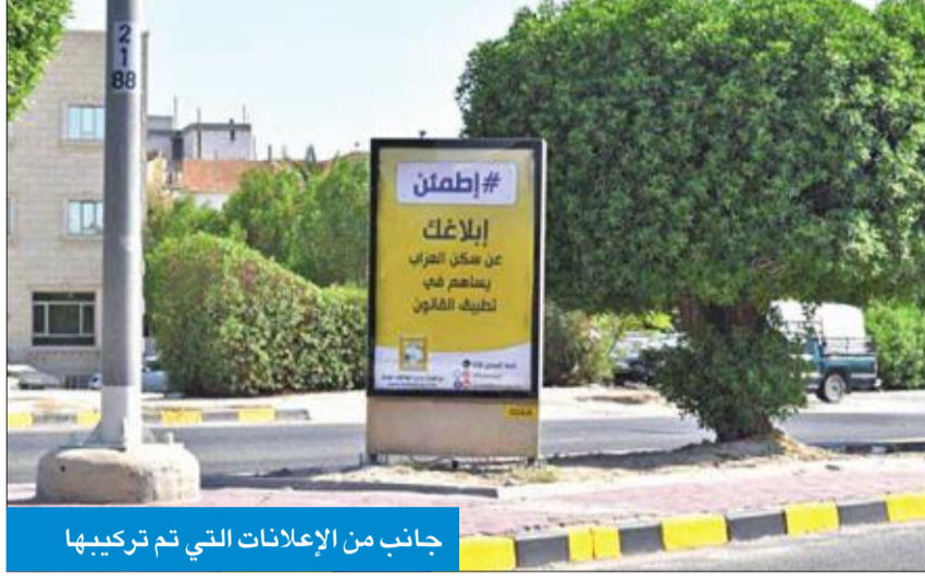
جانب من الإعلانات التي تم تركيبها