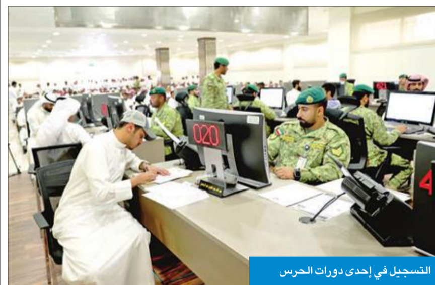
التسجيل في إحدى دورات الحرس

المعنوي أن الحرس الوطني يعمل وفق نهج الشفافية والمصادقية بوضع آلية تضمن العدالة للجميع في عملية القبول بعد استيفاء الشروط التي لا بد من توافرها في المتقدمين، ومن خلال استخدام