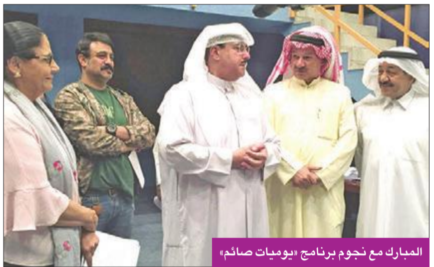
المبارك مع نجوم برنامج «يوميات صائم»

وما هي مزايا نظام البث الرقمي DAB التي يلمسها المستمع مستقبلاً؟ بالنسبة لبث FM أو الموجة القصيرة، يحتاج كل برنامج إلى شبكة بث كاملة وأبراج هوائيات كثيرة، مما يعني تداخل للموجات وضعف نقاء وجودة الصوت والبث، أما بالنسبة لنظام DAB فإننا نحتاج فقط إلى شبكة واحدة وهوائي واحد وتردد واحد ولذلك فالوجود للتداخلات.