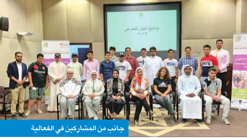
جانب من المشاركين في الفعالية