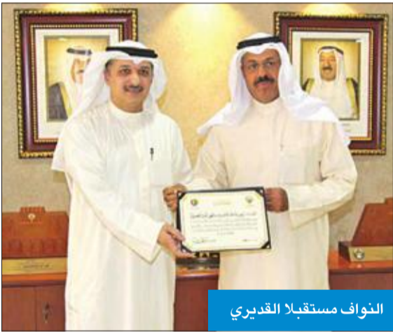
النواف مستقبلاً القديري

التعاوني، مضيفاً: «جمعية مشرف مميزة في كل شيء، تتفوق على البقية في التواجد على وسائل التواصل الاجتماعي بطريقة دائمة، وعروضها على مرأى الجميع وبشكل مستمر». ووصف النواف هذه الجهود بأنها «متميزة وفعالة»، وتأتي ضمن المسؤولية الملقاة على عاتق مجلس الإدارة، معتبراً أن هذه الجهود هي نتاج ثقة الناخبين. من جهته، وجه رئيس جمعية مشرف عبد الرحمن القديري الشكر إلى النواف على دعمه واهتمامه بالقطاع التعاوني، مؤكداً أن هذه اللقاءات تفتح الباب أمام تعاون مشترك مع المحافظة لخدمة الأهالي والمساهمين. وأوضح القديري أن استقبال المحافظ يعبر عن حرصه على الاهتمام بالعمل التعاوني وتذليل المعوقات التي قد تقف أمامه.