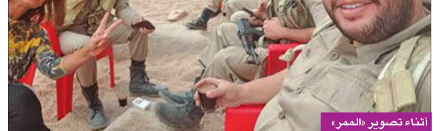
أثناء تصوير «الممر»

* لكل عمل كواليس... حدثنا عن علاقتك بالمجموعة الكبيرة من الفنانين المشاركين بالفيلم؟ - كانت الظروف في البداية صعبة، نظرا للوجود في الصحراء والجبال، ولكن سرعان ما أدركنا أننا كلنا في خندق واحد، فكنا نجلس معا، ولم تكن هناك فرصة للوجود في الكرفانات أو غيرها، فتقربنا من بعضنا بشدة، وتوطدت العلاقات بشكل كبير، وكانت الروح الخفيفة هي السائدة بيننا، ولا مفر من وجودها،