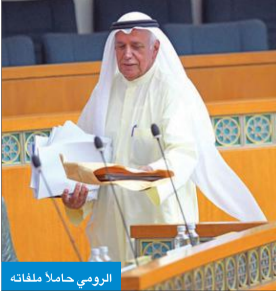
الرومي حاملاً ملفاته