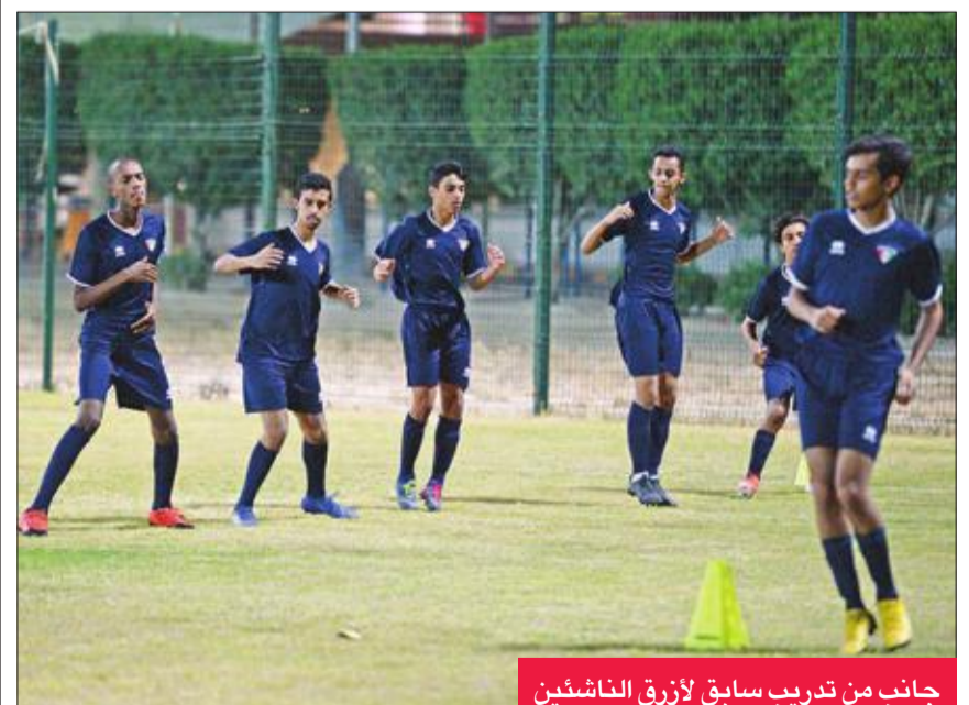
جانب من تدريب سابق لأزرق الناشئين

يختم منتخبنا الوطني للناشئين تحت 16 سنة لكرة القدم استعداداته اليوم لمواجهة نظيره العراقي في الجولة الثانية من منافسات المجموعة الثالثة لبطولة غرب آسيا، التي يستضيفها الأردن، وتختتم في 11 الجاري، والمقرر لها في الثامنة مساء على استاد الأمير محمد.