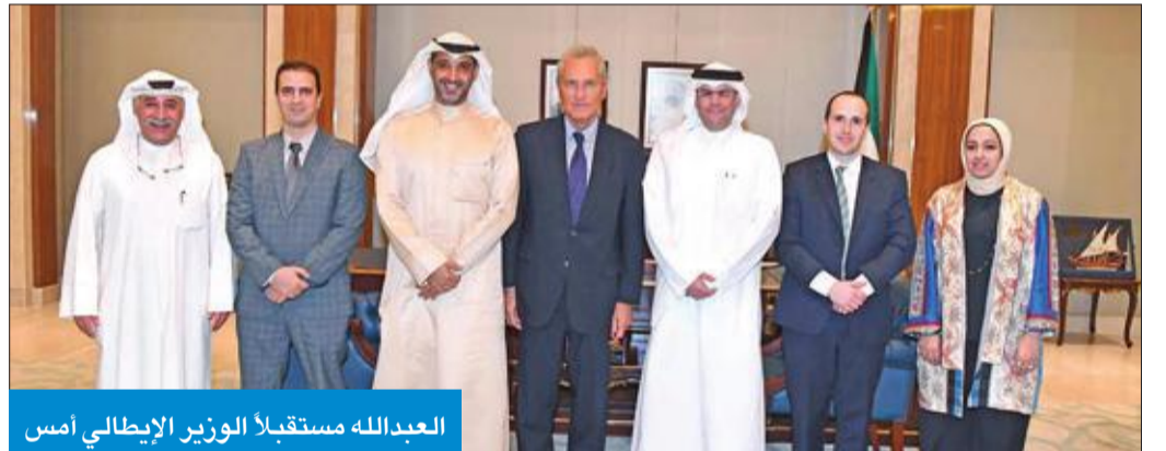
العبدالله مستقبلاً الوزير الإيطالي أمس

استقبل وزير شؤون الديوان الأميري بالإنابة الشيخ محمد العبدالله في مكتبه بقصر بيان، أمس، وزير الثقافة الأسبق بجمهورية إيطاليا الصديقة ورئيس الجمعية الوطنية لشركات السينما