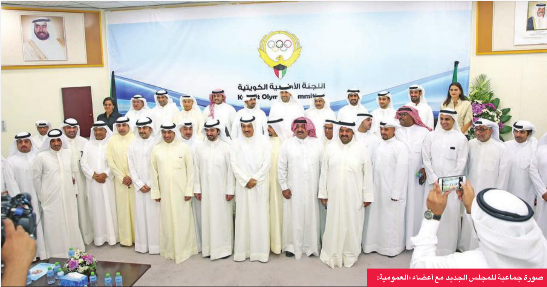
صورة جماعية للمجلس الجديد مع أعضاء «العمومية»

اللجنة تعقد «عمومية غير عادية» بعد غدا لاعتماد هيئة التحكيم