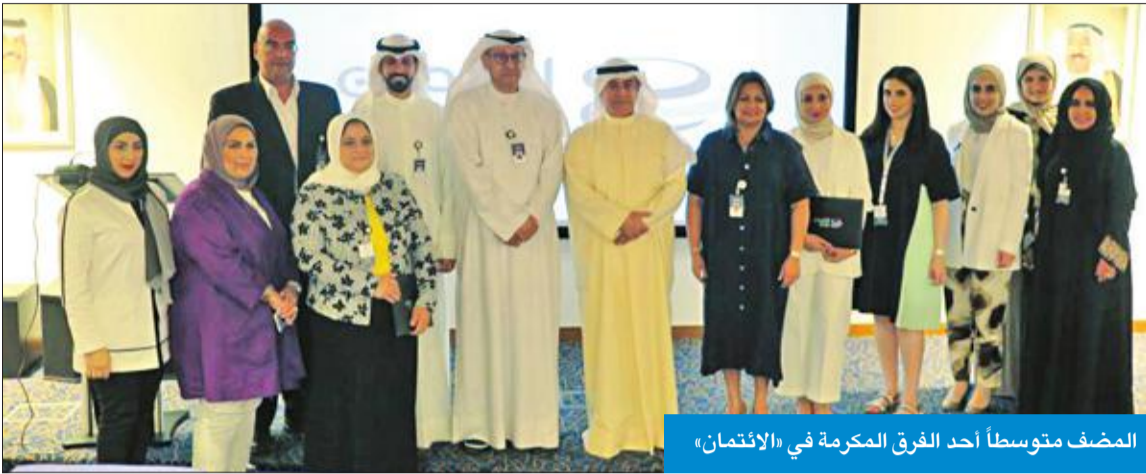
المضف متوسطاً أحد الفرق المكرمة في الايمان

وذكر البنك أن المكالمات المتسلمة عبر مركز الاتصال بلغت 22449 مكاملة، مفيداً بأن عدد دورات مركز التدريب الذي أجراها خلال النصف الأول هو 62 دورة بإجمالي عدد الموظفين المتدربين 590 متدرباً، وأن الطلبات التي تمت من خلال بوابة البنك 4009 طلبات.