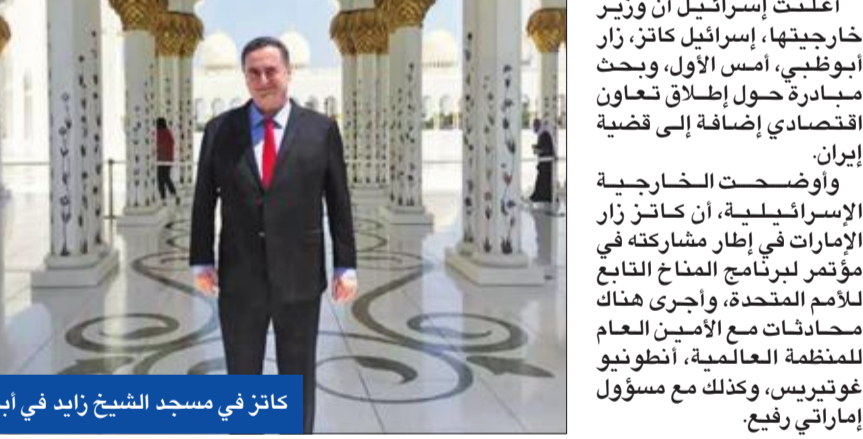
كاتز في مسجد الشيخ زايد في أبوظبي

تل أبيب: التقى مسؤولاً رفيعاً وبحث قضية إيران والاقتصاد