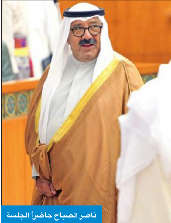
ناصر الصباح حاضراً الجلسة

الغانم: سنقدم قانوناً لاكتشاف «التزوير» ونتمنى من الحكومة دعمه