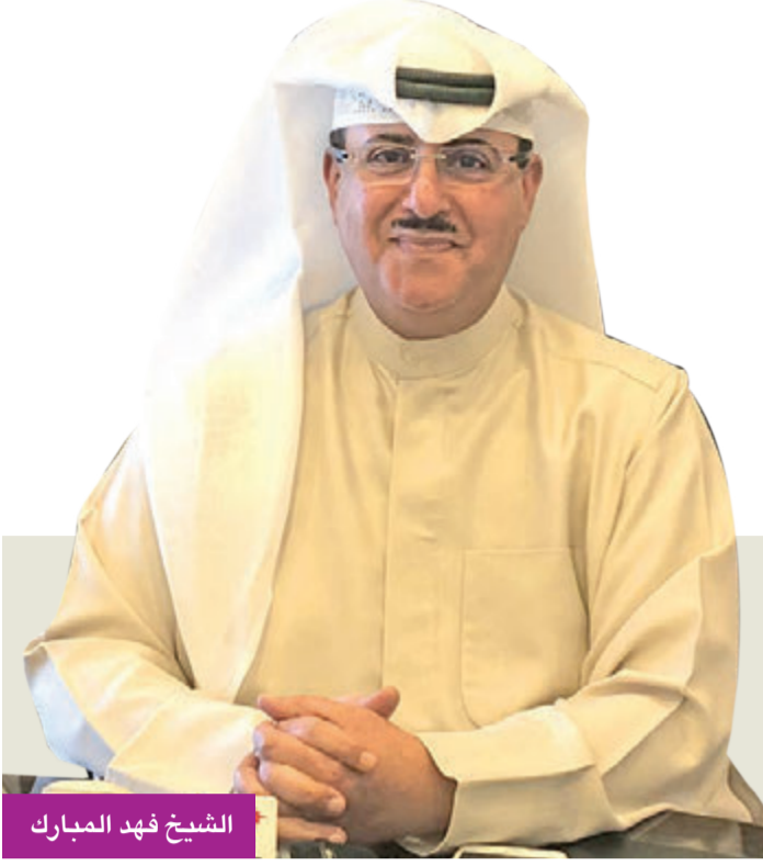
الشيخ فهد المبارك

«تقنية جديدة ستغير تجربة قيادة السيارة وتضاعف جمهور الراديو»