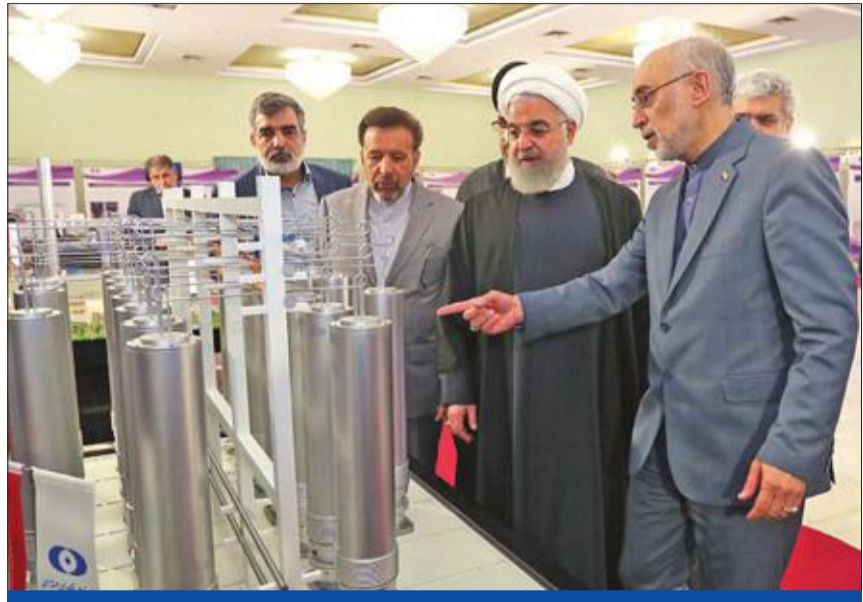
روحاني واكير صالحى خلال جولة تفقدية مايو الماضى

وقال وزير الخارجية البريطاني جيريمي كوربين، في مقابلة، إن «الاتفاق النووي» الذي أبرمته إيران مع القوى العظمى في عام 2015، لم يمنع إيران من تخصيب اليورانيوم إلى مستويات أعلى من تلك المسموح بها في الاتفاق. وأضاف كوربين: «لقد رأينا إيران تتخطى الحدود المحددة في الاتفاق النووي، وهذا أمر مقلق للغاية». وقال كوربين: «إننا نرى إيران تتجه نحو امتلاك سلاح نووي، وهذا أمر خطير للغاية». وأضاف كوربين: «نحن نرى إيران تتجه نحو امتلاك سلاح نووي، وهذا أمر خطير للغاية». وأضاف كوربين: «نحن نرى إيران تتجه نحو امتلاك سلاح نووي، وهذا أمر خطير للغاية».