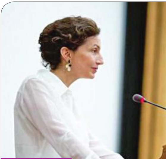
أزولي ملقبة كلمتها