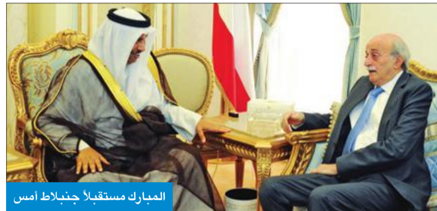
المبارك مستقبلاً جنبلاط أمس

عقد المجلس الأعلى للتخطيط والتنمية أمس اجتماعاً مشتركاً لأعضاء لجان المجلس الأعلى للتخطيط والتنمية برئاسة النائب الأول لرئيس مجلس الوزراء وزير الدفاع رئيس المجلس الأعلى للتخطيط والتنمية ناصر الصباح، بحضور وزير النفط وزير الكهرباء والماء خالد الفاضل. واستضيف ممثلو مؤسسة البترول الكويتية لمناقشة الملامح الرئيسية للتوجهات العامة لاستراتيجية مؤسسة البترول الكويتية وشركاتها التابعة حتى 2040، بما يتماشى مع آخر المستجدات والتطورات العالمية والصناعة النفطية الكويتية وبما يتوافق مع تحقيق رؤية الكويت.