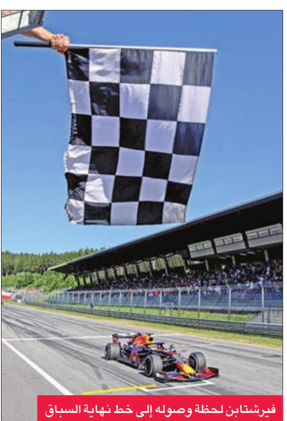
فيرشتابن لحظة وصوله إلى خط نهاية السباق

عما حصل وبالتالي تعتبر بانها حادثة تسابق. وفي أول تعليق له بعد القرار قال فيرشتابن: "كما قلت، إنها حادثة تسابق. أفضل دائماً المحاولة على الأسف لاحقاً. طبيعياً الحال، الخسارة في اللغات الأخيرة مخيب لكن شارل سيذهب بعيداً. أعتقد أنه أمامنا 10 أو 15 سنة للتحنافس فيما بيننا". أما لوميلر فقال "في المجمل، لم يكن السباق سيئاً. كانت سيارة ريد بول سريعة عل العموم، وأفضل منا في المحافظة على الإطارات. هل أعتقد بأن تجاوز فيرشتابن لي لم يتخط الحدود؟ أعتقد ذلك لكنني في المقابل أعتقد أن النتيجة كانت ستبقى ذاتها. كل ما في الأمر أنني أعتقد بأنه لا يمكن التجاوز بهذه الطريقة ليس إلا".