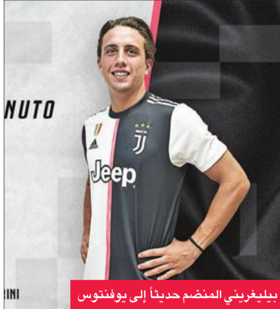
بيلغريني المنضم حديثاً إلى يوفنتوس

الملاعب وهو خاض 7 مباريات دولية. بعدما لعب موسمين على سبيل الإعارة مع أتلانتا، لعب سبيناتزولا عدة مباريات في الموسم الماضي مع يوفنتوس، وتلقى على الخصوص في مباراة إياب الدور ثمن النهائي لمسابقة دوري أبطال أوروبا التي فاز فيها يوفنتوس على أتلتيكو مدريد الإسباني بثلاثية نظيفة.