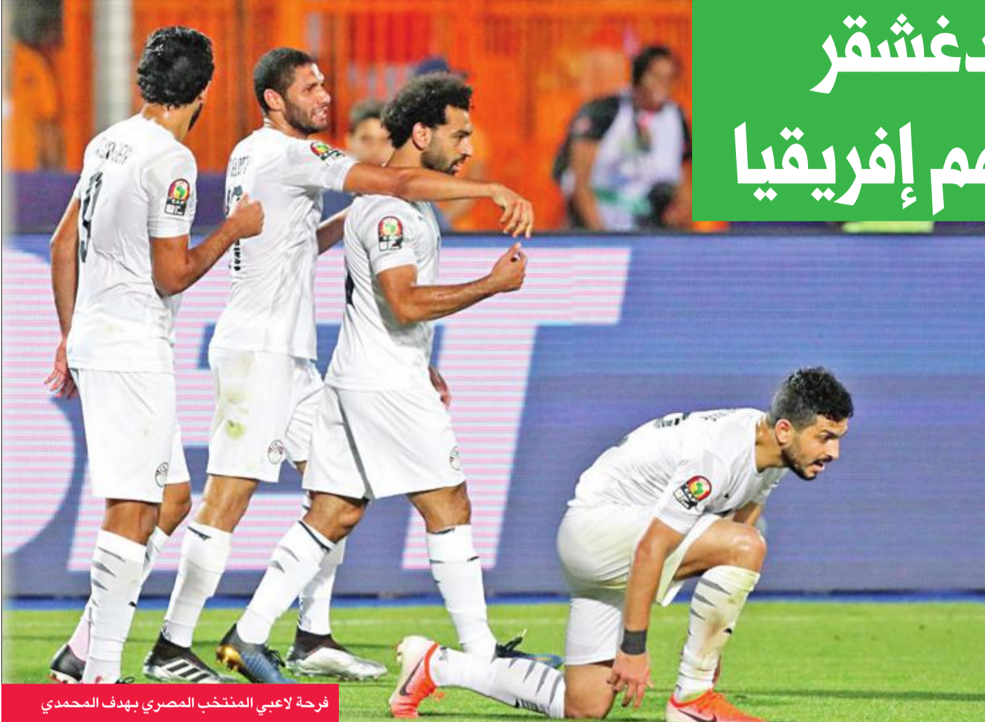
فرحة لاعبي المنتخب المصري بهدف المحمدي

وفاز المنتخب الغيني على بوروندي بهدفين لثلاثي، سجلهما محمد ياتارا في الدقيقة 25، ثم أضاف نفس اللاعب الهدف الثاني في الدقيقة 52، ورفع المنتخب الغيني رصيده إلى 4 نقاط في المركز الثالث، في حين ظل منتخب بوروندي بلا نقاط في قاع الترتيب.