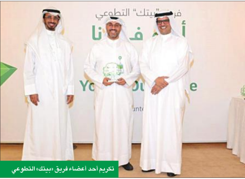
تكريم أحد أعضاء فريق «بيتك» التطوعي