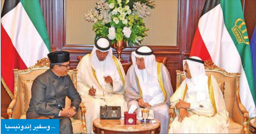
... وسفير إندونيسيا

سموه بعث ببرقيات تهنئة لقادة كندا والصومال وبوروندي ورواندا