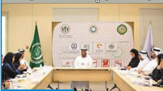
اجتماع برلمان الطفل

تشارك الكويت في الجلسة البرلمانية الثانية للبرلمان العربي للطفل، المقرر عقدها في مقر البرلمان بإمارة الشارقة في الفترة بين 18 و 27 يوليو الجاري، وتشهد انتخاب رئيس للبرلمان، ونائين للرئيس، بالإضافة إلى اللجان الدائمة.