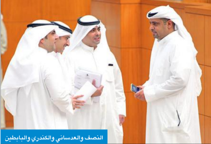
النصف والعديسي والكندري والباطين