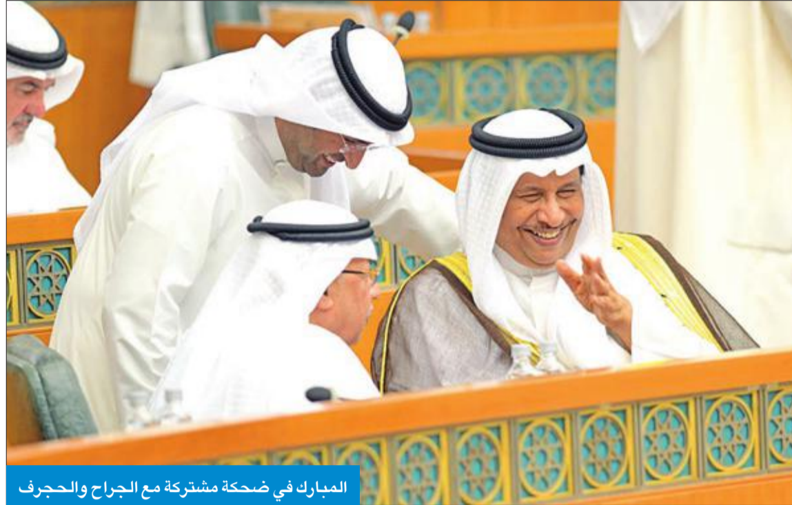
المبارك في ضحكة مشتركة مع الجراح والحجرف