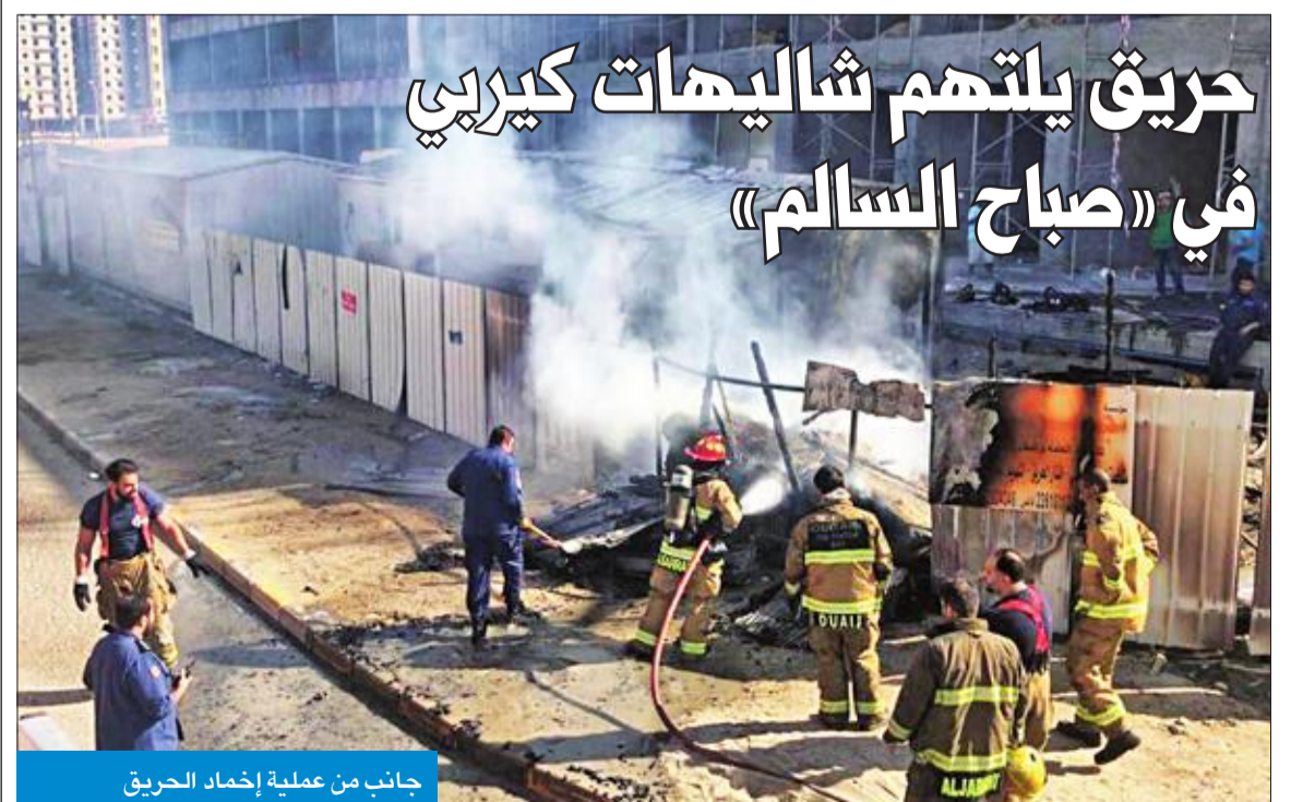
جانب من عملية إخماد الحريق

وأعلن الحرس أن هذه الخطوة جاءت بتوجيهات من القيادة العليا وتطبيقاً لبنود وثيقة الأهداف الاستراتيجية للحرس الوطني 2020 «الأمن أولاً»، المعنية بالاهتمام بالشباب الكويتيين وتوفير الوظائف لهم، وتفعيل مبدأ المسؤولية الاجتماعية عبر توفير الفرص الوظيفية لهم، مضيفاً أنه يستمر استقبال طلبات المتقدمين حتى 11 يوليو الجاري، وذلك في مبنى