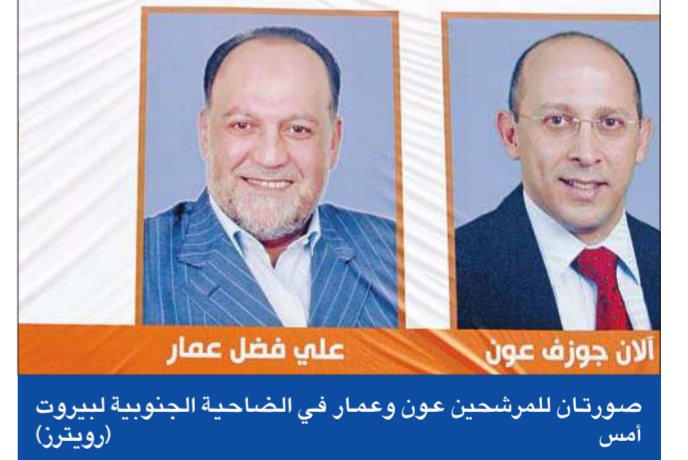
صورتان للمرشحين عون وعمار في الضاحية الجنوبية لبيروت