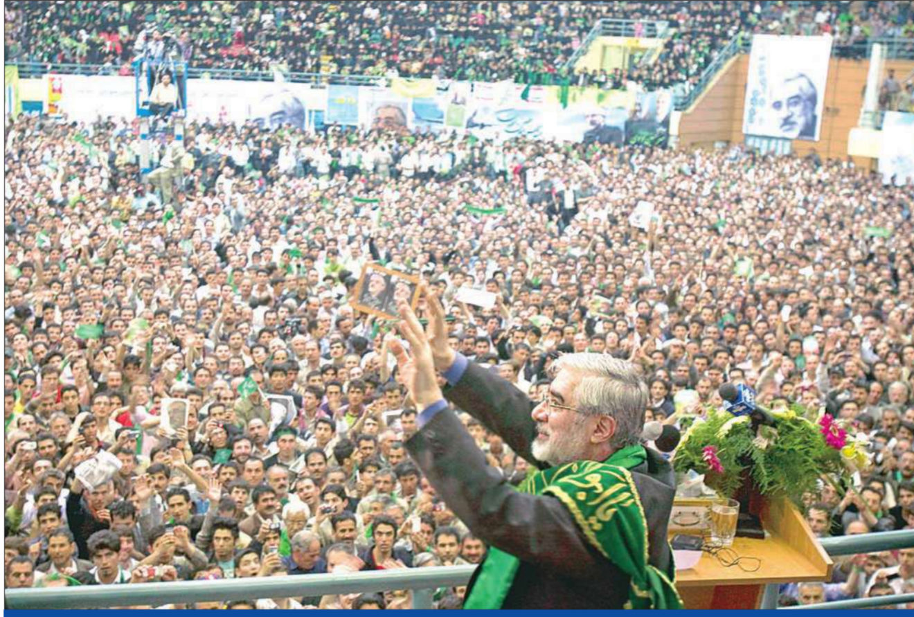
المرشح مير حسين موسوي يحيي مناصريه في تجمّع حاشد في مدينة اريدبيل أمس الأول

تتكاثر في الآونة الأخيرة الخطوات والمؤشرات الإيجابية الدولية تجاه إيران، سعياً باتجاه كسر الجمود الذي يسيطر على الملف النووي الإيراني، وحالة العداء المستمرة منذ عام 1979، تاريخ بداية الثورة الإسلامية، بين طهران وواشنطن. ولاقى معظم المرشحين الرئاسيين الإيرانيين دعوات الحوار بإيجابية، متعهدين بالتخلي عن العدائية وانتهاج سياسة أكثر انفتاحاً تجاه المجتمع الدولي.