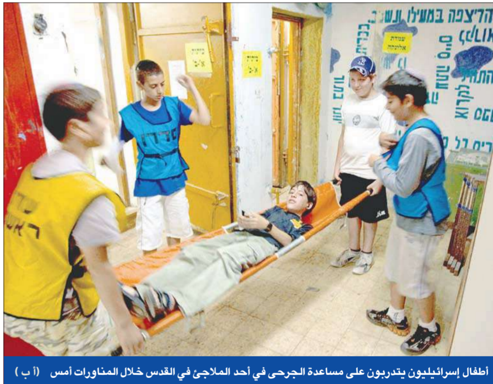
أطفال إسرائيليون يتدربون على مساعدة الجرحى في أحد الملاجئ في القدس خلال المناورات أمس

وقد دوت قرابة 2300 صفارة إنذار في جميع أنحاء إسرائيل تدعو السكان إلى الدخول للملاجئ والغرف الأمانة للاحتواء من هجمات صاروخية وهمية، وتم التدريب على مواجهة سقوط صاروخ كيميائي في منطقة خليج حيفا وآخر في بلدة عومر في جنوب إسرائيل، القريبة من المفاعل النووي في