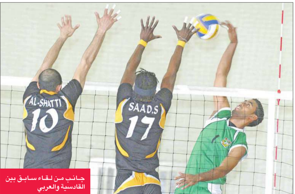
جانبا من لقاء سابق بين القادسية والعربي