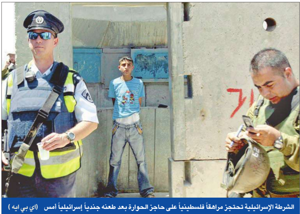
الشرطة الإسرائيلية تحتجز مراهقاً فلسطينياً على حاجز الحوارة بعد طعنه جندياً إسرائيلياً أمس

أعلن الجيش الباكستاني أمس، أنه حرق 71 طالباً و9 من الموظفين والمدرسين في كلية «زاماك» العسكرية، كان عناصر من حركة «طالبان» خطفهم أمس الأول، في منطقة قبليية غرب باكستان. وقال المتحدث باسم الجيش أنه تم إنقاذ الرهائن بعد «مركة ضارية» في منطقة جاريوم التي تبعد حوالي 20 كيلومتراً شرق بلدة زاماك في إقليم شمال وزيرستان، وهو معقل لتنظيم «القاعدة» وحركة «طالبان»، وأضاف أن الخاطفين كانوا ينقلون الطلبة من إقليم شمال وزيرستان إلى إقليم جنوب وزيرستان المجاور عندما اشتبكت القوات معهم، مشيراً إلى أن السلطات مازالت تبحث عن 20 طالباً مازالوا مفقودين. (إسلام آباد - أ ف ب)