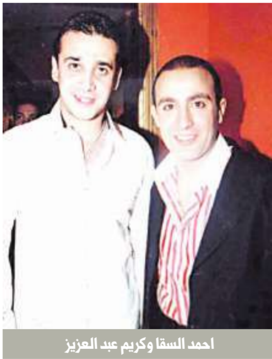
أحمد السقا وكريم عبد العزيز