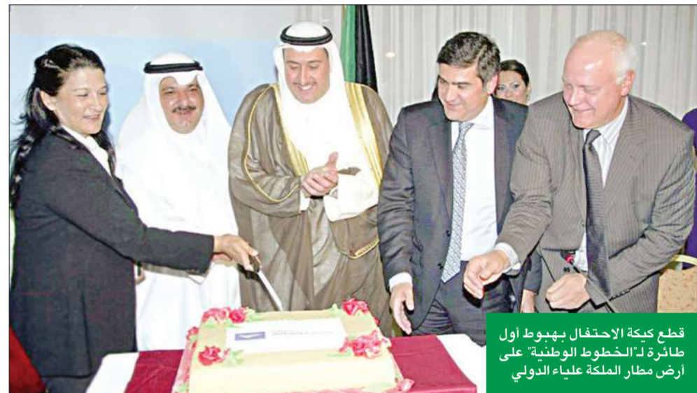
قطع كعكة الاحتفال بهبوط أول طائرة لـ الخطوط الوطنية على أرض مطار الملكة علياء الدولي

في الكويت، ويعتزمون السفر إلى بلادهم ل قضاء عطلتهم الصيفية، موجهاً شكره إلى السلطات والجهات الأردنية التي ساهمت بجهود هائلة في تحويل هذه الرحلة إلى واقع ملموس. وأضاف البحر: «تعد مدينة عمان خامس وجهات سفر الخطوط الوطنية منذ إنطلاقها الأولى في يناير 2009، إذ تقدم الخطوط الوطنية تجربتها الفريدة في السفر لضيوفها في كل من دبي، والبحرين، والقاهرة، وبيروت، وستعاشر قريباً تسير رحلاتها إلى دمشق وشرم الشيخ، والعمان، والتي تعكس الاهتمام كبير لدى المسافرين من وإلى الكويت بما يعكس العلاقة الوثيقة الجامعة بين البلدين».