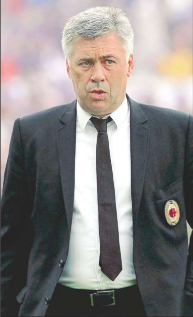
(أي بي إيه)