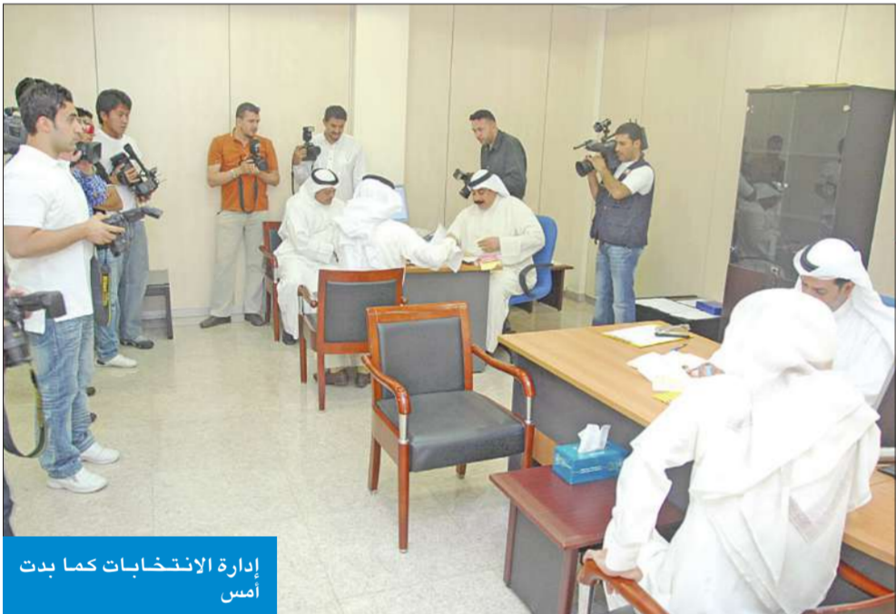
إدارة الانتخابات كما بدت أمس

وانتقد القضاة قانون (2005/5) الذي سلب حقوق المجلس البلدي التشريعية وأصبحت كلمة استشاري ملغاة في قاموس القانون، مشيراً إلى أنه يلح من السلطة التشريعية ممثلة في مجلس الأمة أن تعيد صلاحيات المجلس البلدي التي كانت موجودة لديه سابقاً، إذ أنها تعتبر الدائرة الحكومية الأولى التي تأسست سنة 1928 إلى يومنا هذا.