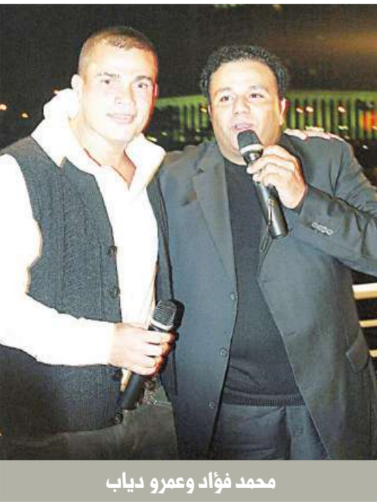
محمد فؤاد وعمرو دياب