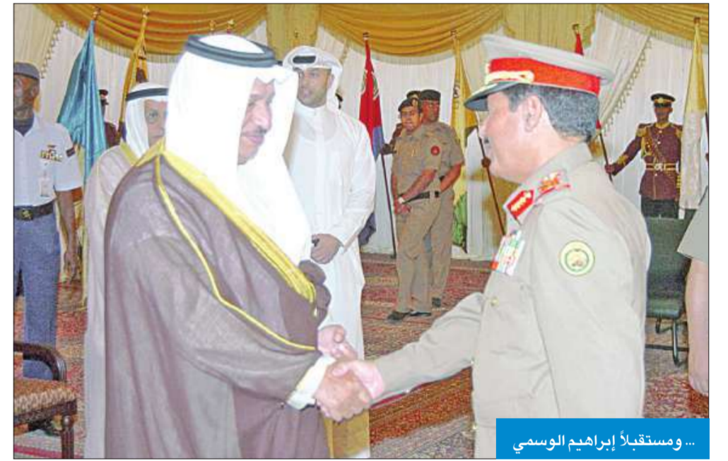
... ومستقبلاً إبراهيم الوسمي

وقال المبارك في تصريح صحفي عقب حفل الاستقبال الذي اقامته وزارة الدفاع بمناسبة تجديد الثقة فيه بتعيينه نائباً اول لرئيس مجلس الوزراء ووزيراً للدفاع ان العرض العسكري الفرنسي المتعلق بشراء طائرات مقاتلة من نوع رافال ما زال قيد الدراسة، لافتاً الى ان هذا النوع من الطائرات يعد من الانواع الحديثة