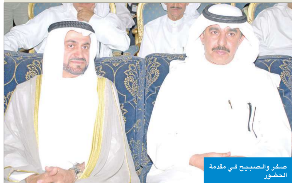
صفر والصبيح في مقابلة الحضور

البيئة الكويتية خلال العقدين ما أصابها سواء في البر أو البحر أو الجو.