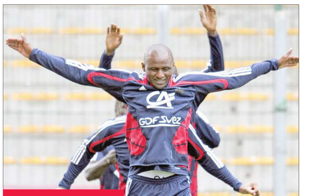
باتريك فييرا نجم الإنتر والمنتخب الفرنسي