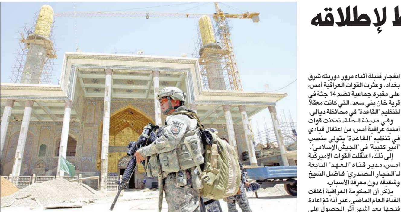
جندي أميركي يقف عند مدخل "الإمامين العسكريين" في سامراء شمال بغداد أمس

ويبدو المراقبون اعتقادهم أن معارضي العمد عون تمكثوا من خلال استغلال هاتين المسالتين أساسياً من تأكيد الاتهامات، التي سبق أن نبأ حملتهم الانتخابية على أساسها والتي تختصر أن العمد عون يريد الخروج من الانتخابات بكتلة نيابية تسمح له بتقصير ولاية العمد سليمان للحلول مكانه في رئاسة الجمهورية، وهو من أجل