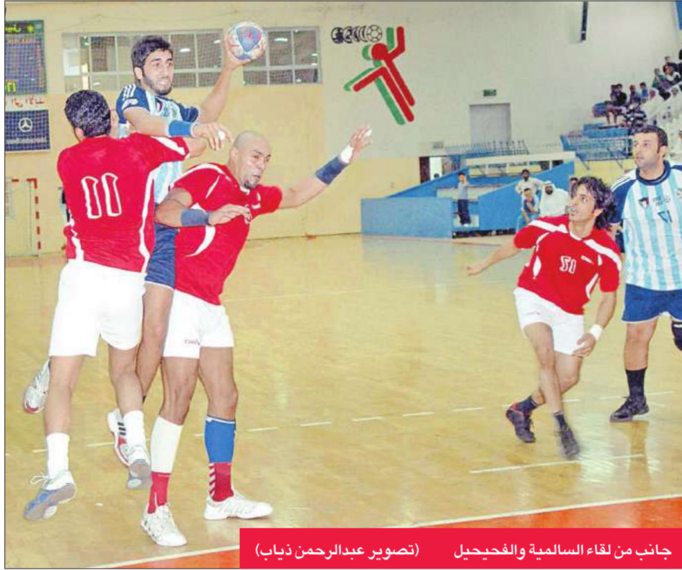
جانبا من لقاء السالمية والفحيحيل

وأضاف "ما يتعلق بالتعديلات الخاصة ببعض مواد القانون، الموضوع عند الحكومة وسيتم عرضه على مجلس الأمة، وكما هو معروف فإن اللجان الدولية ليس لها علاقة بالقوانين المحلية، والرياضة