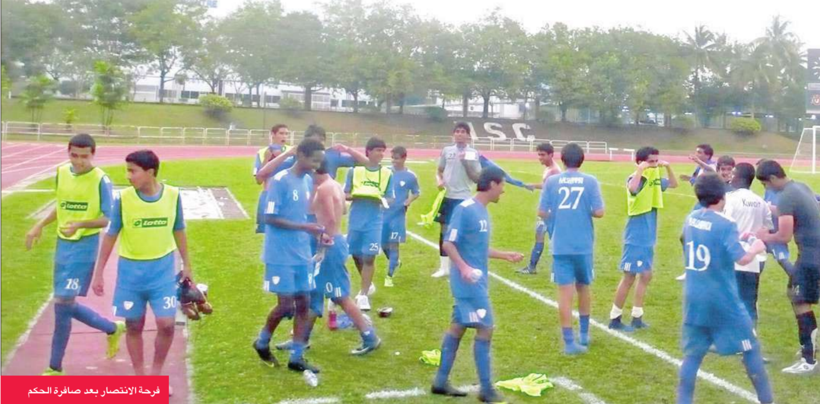
فرحة الانتصار بعد صافرة الحكم