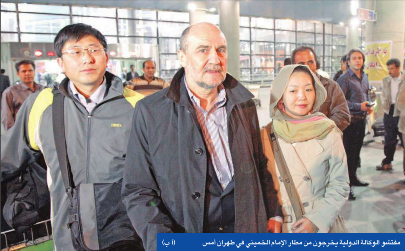
مفتشو الوكالة الدولية يخرجون من مطار الإمام الخميني في طهران أمس

من ناحية أخرى، أعلن الرئيس الباكستاني آصف علي زرداري أن المتورطين في الهجوم الانتحاري