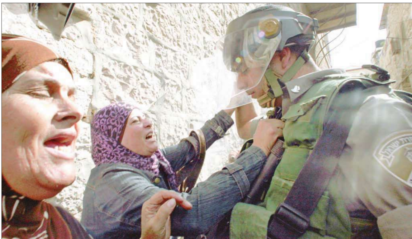
امرأة فلسطينية تواجه شرطياً إسرائيلياً في أحد الشوارع المحيطة بالحرم القدسي بالبلدة المقدسة في القدس أمس

● «منظمة التحرير» تحذر من دخول المنطقة في حروب دينية مدمرة ● «حماس»: معركة القدس بدأت