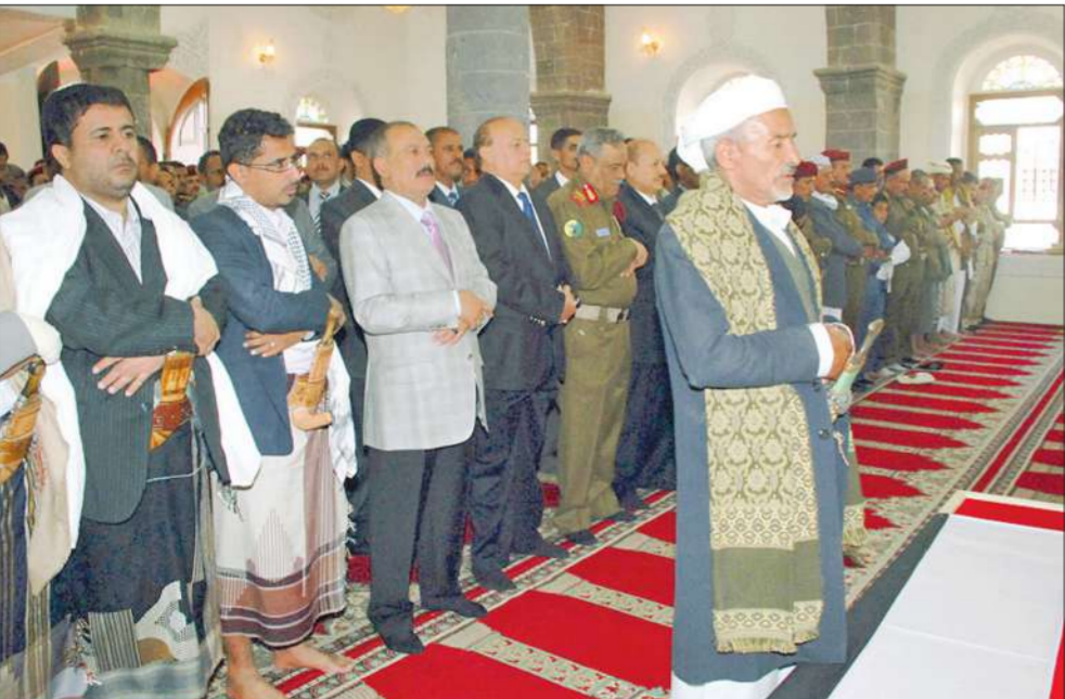
الرئيس اليمني علي عبدالله صالح متوسطاً المصلين أمس، في جنازة الجنرال عمر العيسي الذي قتل يوم الجمعة الماضي خلال معركة مع الحوثيين في صعدة

باريس تلتزم الصمت بشأن تقارير عن سقوط «طائرة جزر القمر» بصاروخ فرنسي