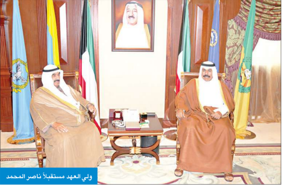
ولي العهد مستقبلاً ناصر المحمد

استقبل سمو ولي العهد الشيخ نواف الأحمد بقصر بيان صباح أمس رئيس مجلس الأمة جاسم الخرافي. كما استقبل سموه وزير الشيخ ناصر المحمد رئيس مجلس الوزراء، واستقبل سموه النائب الأول لرئيس