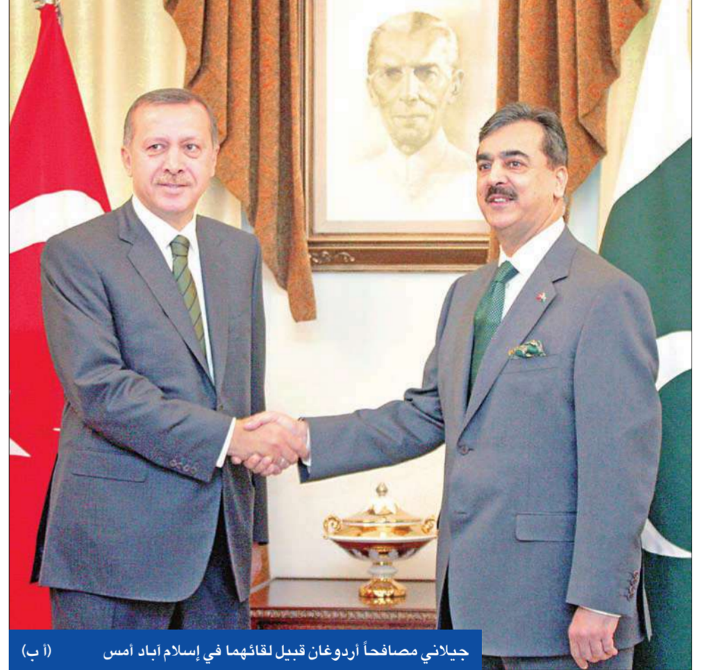
جيلاني مصافحاً أردوغان قبيل لقائهما في إسلام اباد أمس

إلى ذلك، اغتيل وزير التربية في إقليم بلوشستان الباكستاني شفيق أحمد رمية بالرصاص في مدينة كويتا. وكرت محطة «جيو تي في» الباكستانية أن الحادث وقع قرب منزل الوزير خلال ترجله من سيارته متوجهاً إلى منزله، وأضافت أن مسلحين على دراجة نارية قاموا بإطلاق النار على أحمد. وأصيب الوزير وأصابته بالغة. من جهة أخرى، تعهدت تركيا وباكستان بالتعاون في محاربة خطر الإرهاب وتعزيز التعاون في المجالات السياسية والدبلوماسية والأمنية والعسكرية. وكرت وكالة الأنباء الباكستانية أن رئيس الوزراء التركي رجب طيب أردوغان الذي وصل إلى إسلام اباد أمس، عقد محادثات مع نظيره الباكستاني يوسف رضا جيلاني بمشاركة كبار مسؤولي البلدين. (إسلام اباد، أ ب، يو بي آي، أ ب)