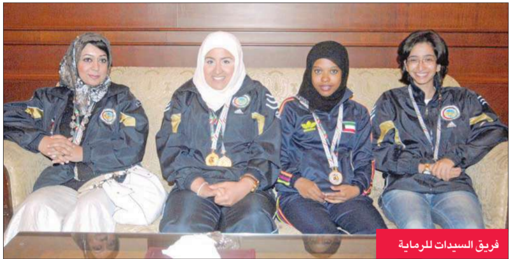
فريق السيدات للرماية

عاد ظهر أمس وفد منتخبنا الوطني للرماية، بعد تحقيقه 20 ميدالية (8 ذهبيات و 7 فضيات و 5 برونزيات)، في بطولة غرب آسيا لرماية الأطلاق الطائرة وأسلمة الرصاص، التي اختتمت منافساتها أمس في طهران.