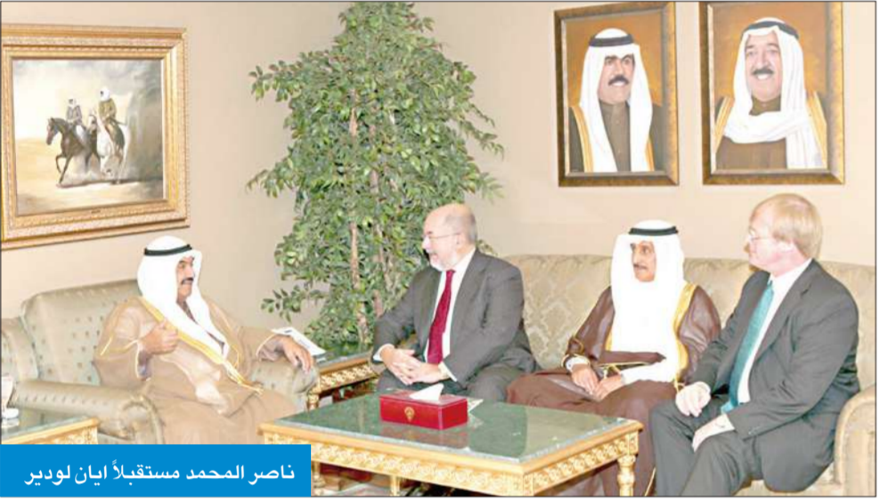
ناصر المحمد مستقبلاً إيان لودير

حضر المقابلة محافظ الأحمدى الشيخ الدكتور إبراهيم الدعيح وسفير المملكة المتحدة لدى دولة الكويت مايكل ارون.