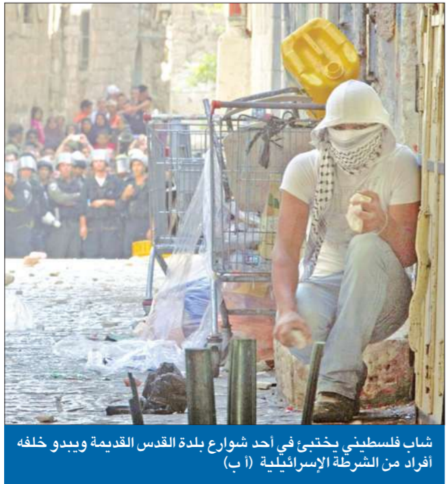
شاب فلسطيني يختفي في أحد شوارع بلدة القدس القديمة ويبدو خلفه أفراد من الشرطة الإسرائيلية (أ. ب.)

(القدس. أ. ب. رويترز، أ. ب. كونا، د. ب. يو بي آي) 26+