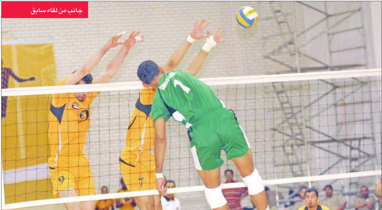
جانب من لقاء سابق

تقام اليوم في الساعة مساء خمس مباريات ضمن منافسات المرحلة الخامسة من بطولة الاتحاد لكرة الطائرة، إذ يلتقي القادسية مع العربي، والساحل مع الفحيحيل، والصلبيخات مع اليرموك في المجموعة الأولى، بينما يلعب كاظمة مع الكويت، والسالمية مع الجهراء في المجموعة الثانية.