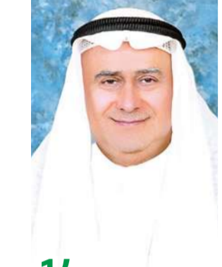
14 «الأهلي» يحقق 24 مليون دينار وربحية السهم 21 فلساً