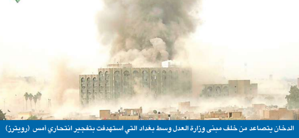
الدخان يتصاعد من خلف مبنى وزارة العدل وسط بغداد التي استهدفت بتفجير انتحاري أمس

عاشت بغداد أمس يوماً دامياً، بعد انفجار شاحنتين مفخختين استهدفتا مبنى وزارتي العدل والبلديات ومجلس محافظة العاصمة، أوقعتا أكثر من 136 قتيلاً وأكثر من 700 جريح في عملية تشبه إلى حد بعيد تفجيرات «الأربعاء الدامي»، التي استهدفت وزارتي الخارجية والمالية في 19 أغسطس الماضي وأوقعتا حوالي 100 قتيل. وتفقد رئيس الوزراء نوري المالكي موقع الأنجاريين، معتبراً أن الاعتداءات الإرهابية 02