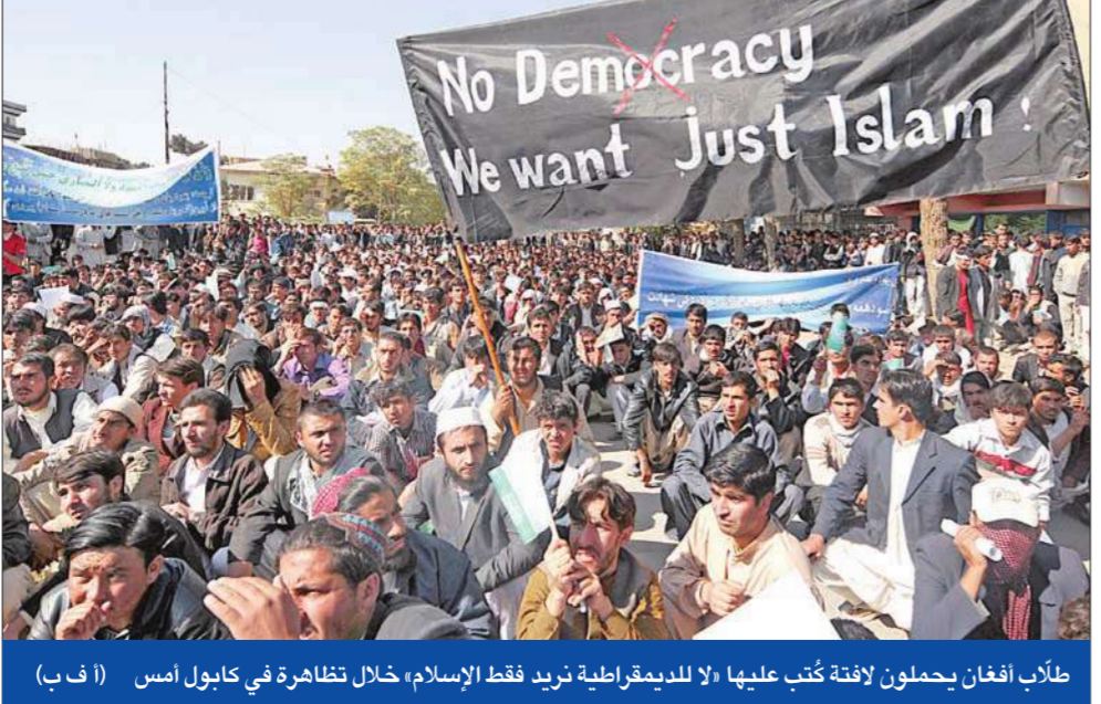
طلاب أفغان يحملون لافتة كتب عليها «لا للديمقراطية تريد فقط الإسلام» خلال تظاهرة في كابول أمس

والولايات المتحدة، بحسب ما أوردته الصحيفة. وقال عبدالله: «أريد أن أكون دقيقاً جداً، وهذا لا يعني تقاسم السلطة ولا إقامة حكومة وحدة وطنية، بل إيجاد حل لتحريك الوضع مسافة أبعد من