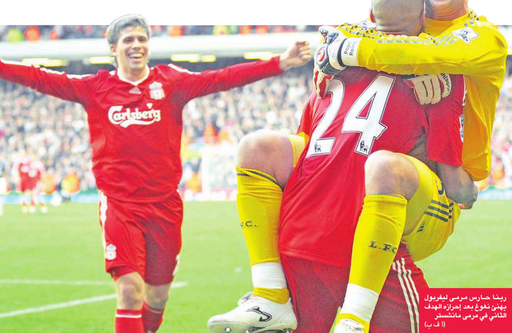
رينا حارس مرمى ليفربول يهتئ نغوغ بعد إحرازه الهدف الثاني في مرمى مانشستر يونايتد