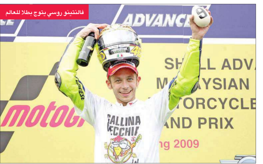
فالنتينو روسي يتوج بطلا للعالم

وأحرز الأسترالي كايسي ستونر دراج دوكلاتي لقب السباق، متقدماً على الإسباني داني بديروسا دراج هوندا وروسي دراج ياماها الذي امن اللقب، بعد تقدمه على أبرز منافسيه الإسباني خورخي لورنزو رابع الترتيب في ماليزيا. ورفع روسي رصيده إلى 286 نقطة، بفارق 41 نقطة أمام لورنزو، في حين عزز ستونر رصيده في المركز الثالث مع 220 نقطة أمام