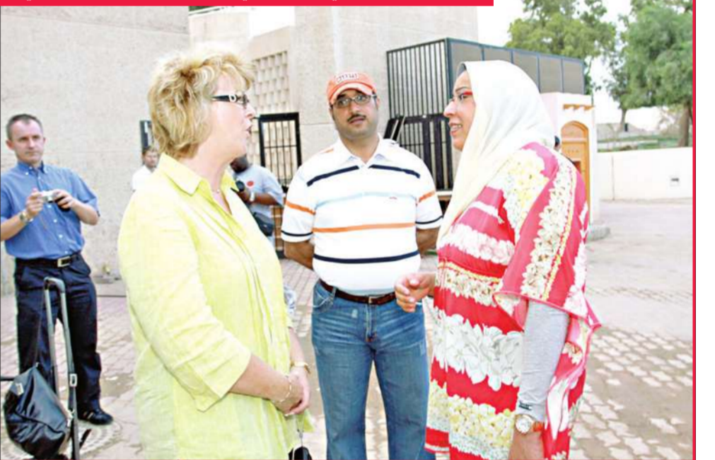
الشيخة فادية السعد في حديث جانبي مع المشرفة على الملعب الرجاعي

أبدت الشيخة فادية السعد ارتياحها للاستعدادات الأولية لبطولة العالم للإسكواش رجال 2009. كما أشادت بدعم القيادة السياسية وتعاون الاتحاد الكويتي للعبة مع اللجنة.