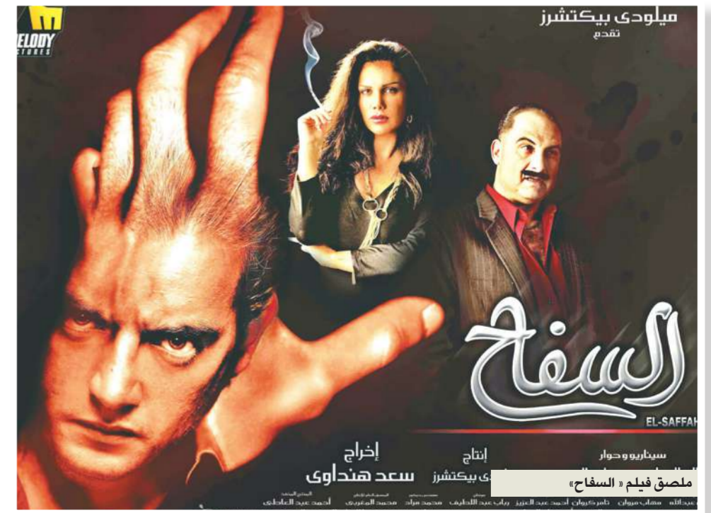
سيلودي بيكتشرز تقدم

فراج، إضافة إلى أنه ممثل، يجيد الرقص، وقدم مع فرقته عرضاً راقصاً بعنوان «عتبر رقم واحد».