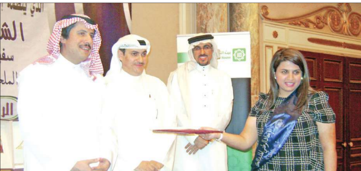
الصباح يكزّم إحدى الخريجات