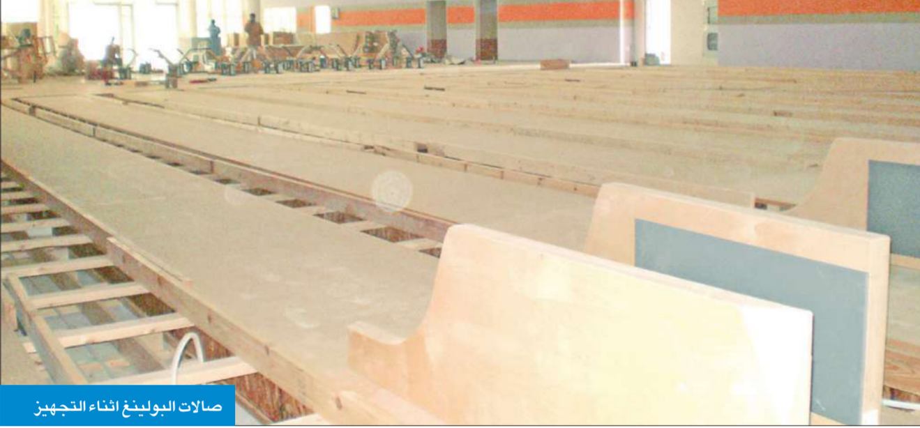
صالات البولينغ أثناء التجهيز

إلكترونية ومعدات وفق مواصفات محددة. وذكر أن القطاع بدأ تنفيذ 36 صالة تربية بدنية في مدارس مختلف المراحل التعليمية في المناطق التعليمية الست، التي خصصت لها ميزانية 17 مليون دينار، على أن يتم الانتهاء منها مطلع الفصل الثاني من العام الدراسي الحالي، لافتاً إلى أن القطاع وضع خطة لبناء 36 صالة تربية بدنية أخرى خلال العام الدراسي 2010-2011.