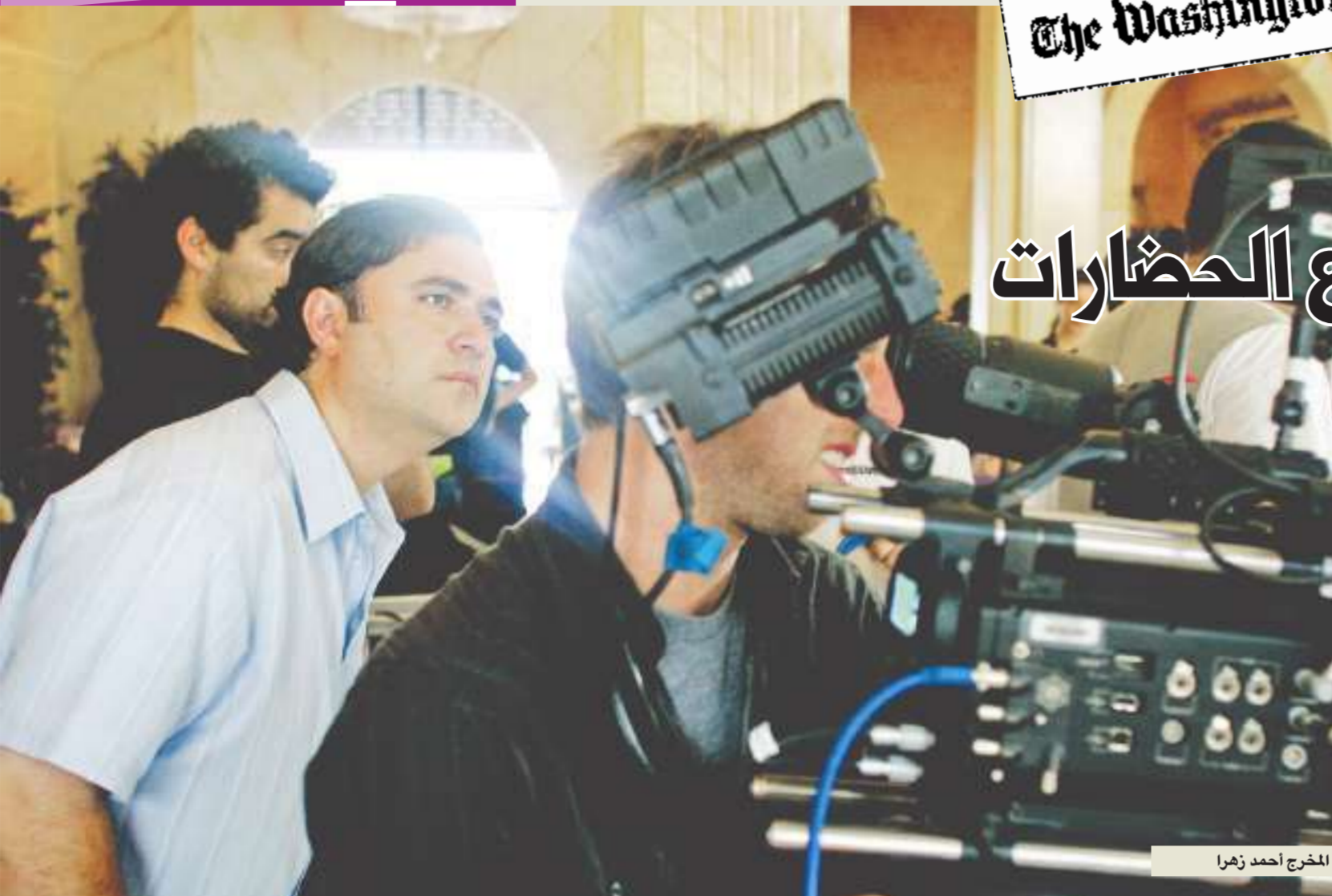
المخرج أحمد زهرا