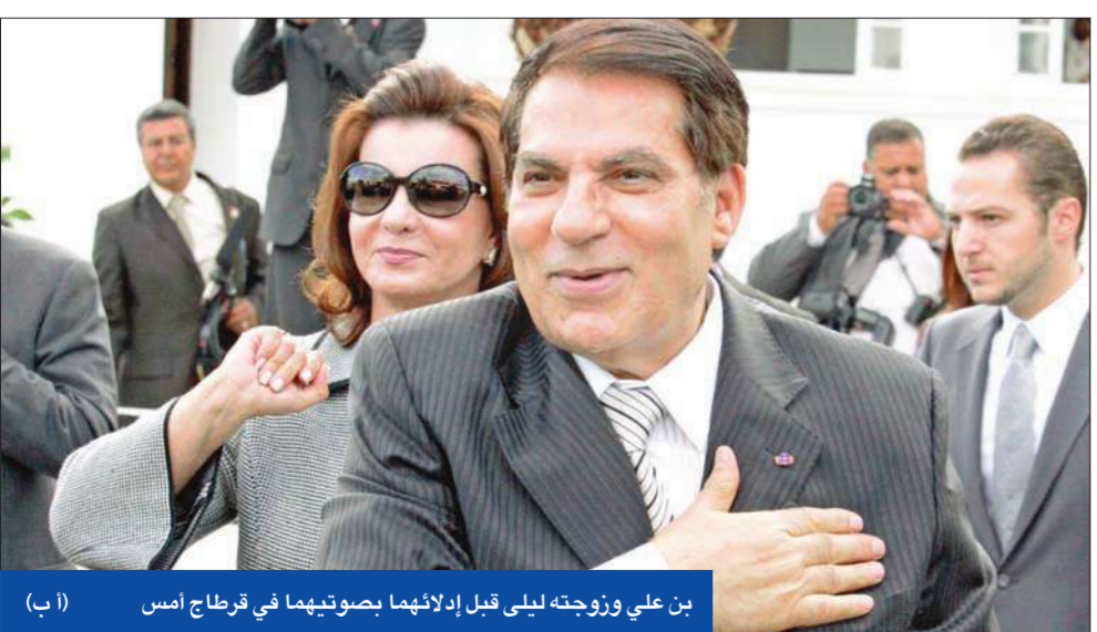
بن علي وزوجته ليلي قبل إزلامها بصوتيهما في قرقاج أمس

أدلى الناخبون التونسيون بأصواتهم أمس، لإختيار رئيس الجمهورية ومجلس نواب لولايتين لتمتدان إلى خمس سنوات، في ثالث انتخابات رئاسية تعددية منذ استقلال تونس في عام 1956. وجرت العملية الانتخابية بلا مفاجآت تذكر، وبلغت نسبة التصويت قبل ساعة من إقفال الصناديق 80 في المئة، التي تعتبر نسبة مشاركة عالية. ولم يتغير النهار الانتخابي الطويل من التوقعات «المؤكدة» بفوز الرئيس زين العابدين بن علي بولاية رئاسية خامسة، ويفوز حزبه «التجمع الدستوري الديمقراطي» بـ 75 في المئة من مقاعد المجلس النيابي الـ 214، بحسب أول النتائج الجزئية. ويبدأ الناخبون في التوافد على مراكز الاقتراع بنسق بطيء صباحاً، قبل أن يتكثف أقبالهم مع تقدم ساعات يوم الأحد، وهو يوم العطلة الأسبوعية في تونس. وأدلى بن علي (73 عاماً) بصوته في ضاحية قرقاج شمال العاصمة، في حين صوت المرشح عن حزب «التجديد» (الشوعي سابقاً) أحمد إبراهيم في المنزه، ومحمد بوشنيحة