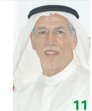
11 «بيتك» 106,4 ملايين دينار صافي أرباح 9 أشهر