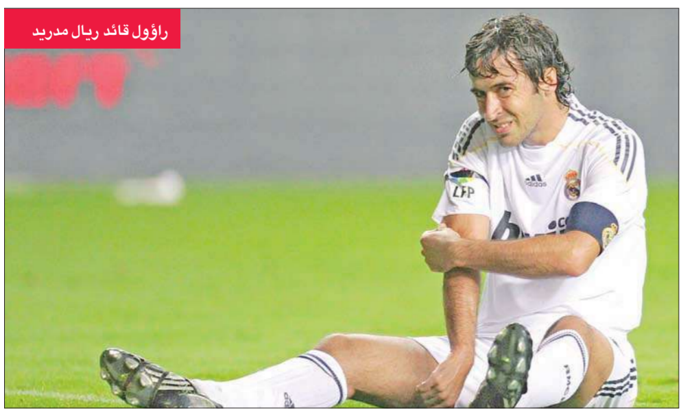
راؤول قائد ريال مدريد