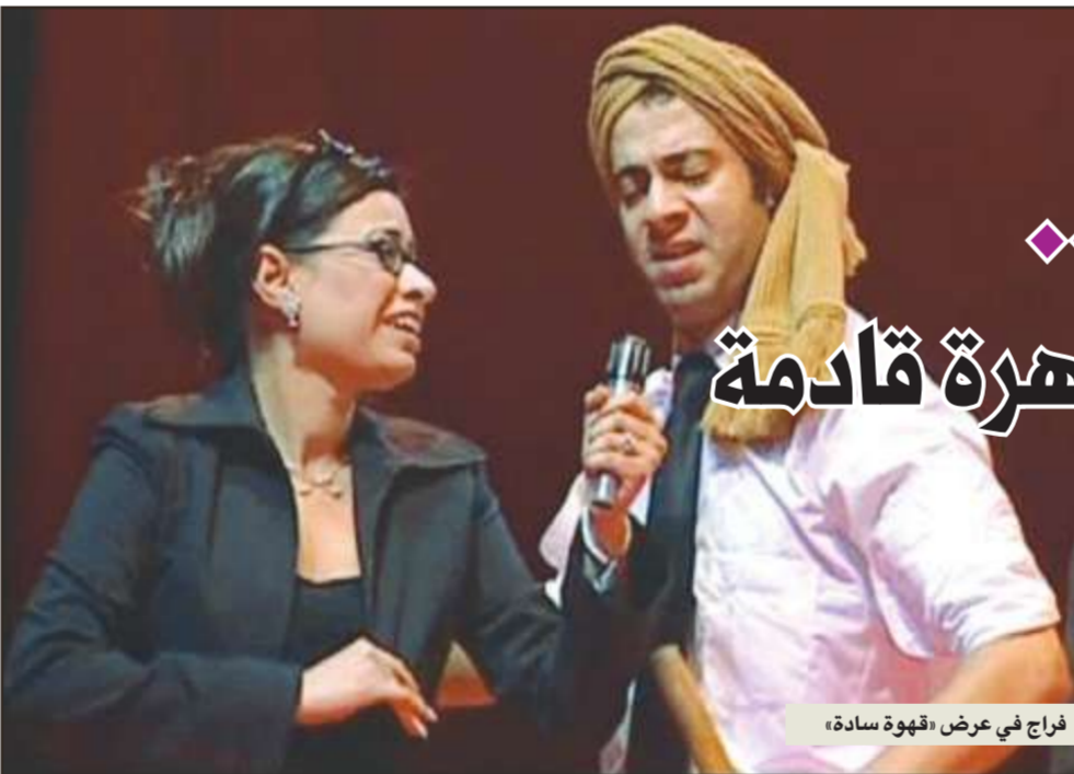
فراج في عرض «قهوة سادة»

الفيلم لم يتحدد اسمه النهائي بعد وشروط فواخرجي ما زالت محل بحث من السبكي.