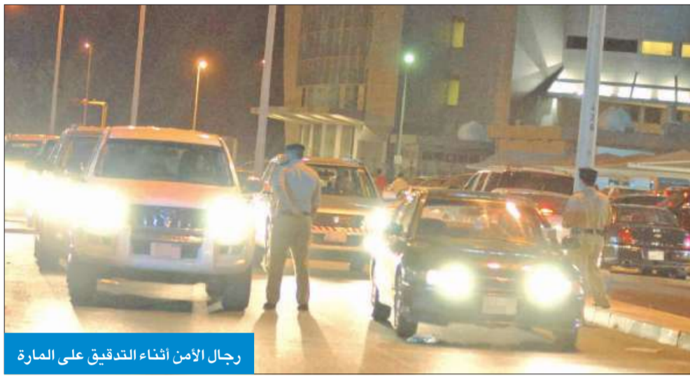
رجال الأمن أثناء التدقيق على المارة

في حملتين شملتا مناطق المحافظتين... ووقع في شباكهما بهلوانيون ومطلوبون