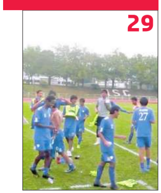
29 فوز مستحق لآزرق الناشئين على السعودية