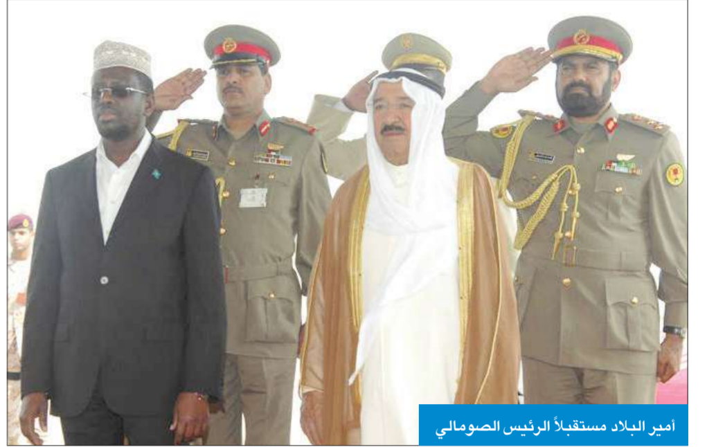
أمير البلاد مستقبلاً الرئيس الصومالي

وصل إلى مطار الكويت الدولي أمس رئيس الصومال شريف الشيخ أحمد والوفد الرسمي المرافق له في زيارة رسمية للبلاد تستغرق يومين يجري خلالها مباحثات رسمية مع سمو أمير البلاد الشيخ صباح على رأس مستقبلي الرئيس على أرض المطار سمو أمير البلاد الشيخ صباح الأحمد وسمو ولي العهد الشيخ نواف الأحمد ورئيس مجلس الأمة جاسم الخرافي ونائب رئيس الحرس الوطني الشيخ مشعل الأحمد وسمو الشيخ ناصر المحمد رئيس مجلس الوزراء والنائب الأول لرئيس مجلس الوزراء وزير الدفاع الشيخ جابر المبارك ووزير شؤون الديوان الأميري الشيخ ناصر صباح الأحمد والوزراء والمستشارون والمحافظون وكبار المسؤولين بالدولة وكبار القادة في الجيش والشرطة والحرس الوطني.