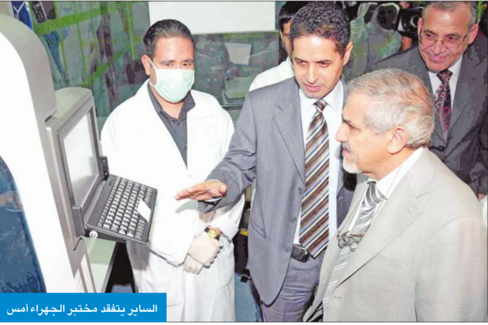
الساير يتفقد مختبر الجهراء أمس

كما افتتح وزير الصحة ظهر أمس أيضاً الجناح الرابع بقسم الباطنية في مستشفى الصباح، مشيداً بتبرع وربة المرحوم إبراهيم المعجل في صيانة وتجديد هذا الجناح، ممثناً هذه المبادرة الطبية التي أكد أنها نص في مصلحة الوطن والمواطنين. من جانبه، أشاد عضو مجلس الأمة د. علي العمير بالجهود التي يبذلها وزير الصحة د. هلال الساير في تطوير الخدمات الصحية بالبلاد، مؤكداً أن أداء الوزير وتعامله مع أزمة إنفلونزا الخنازير وما أعقبها من انطلاق العام الدراسي تميزاً بالإيجابية، لافتاً إلى أن الوزارة تحمّلت عبئاً كبيراً في هذا الجانب، مشيراً إلى أن القطاع الصحي في البلاد يحتاج إلى اهتمام أكبر، لافتاً إلى