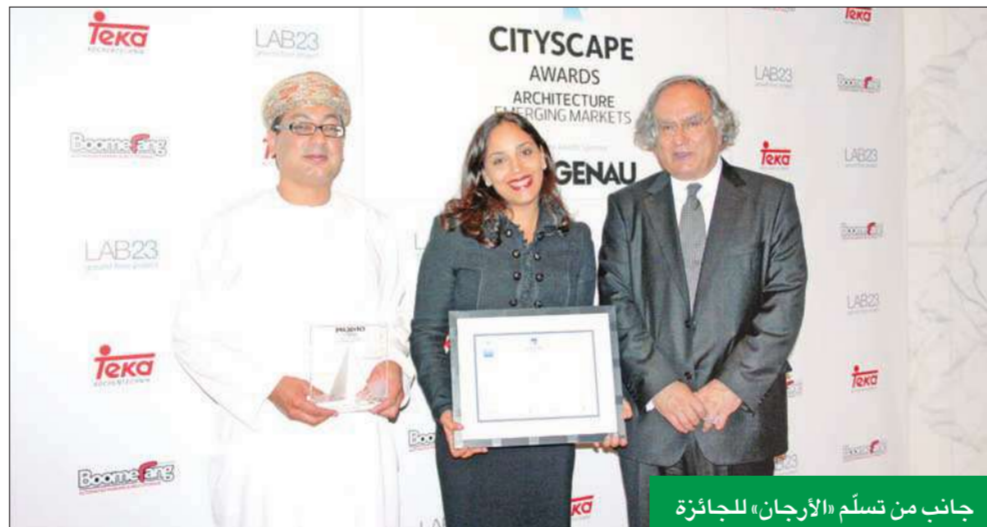
جانب من تسلّم «الأرجان» للجائزة

سها أوزكان، وهي معمارية ومخططة ومؤرخة وصاحبة نظريات معمارية عديدة، بالإضافة كونها الرئيس المؤسس لجنة المعمارية العالمية.