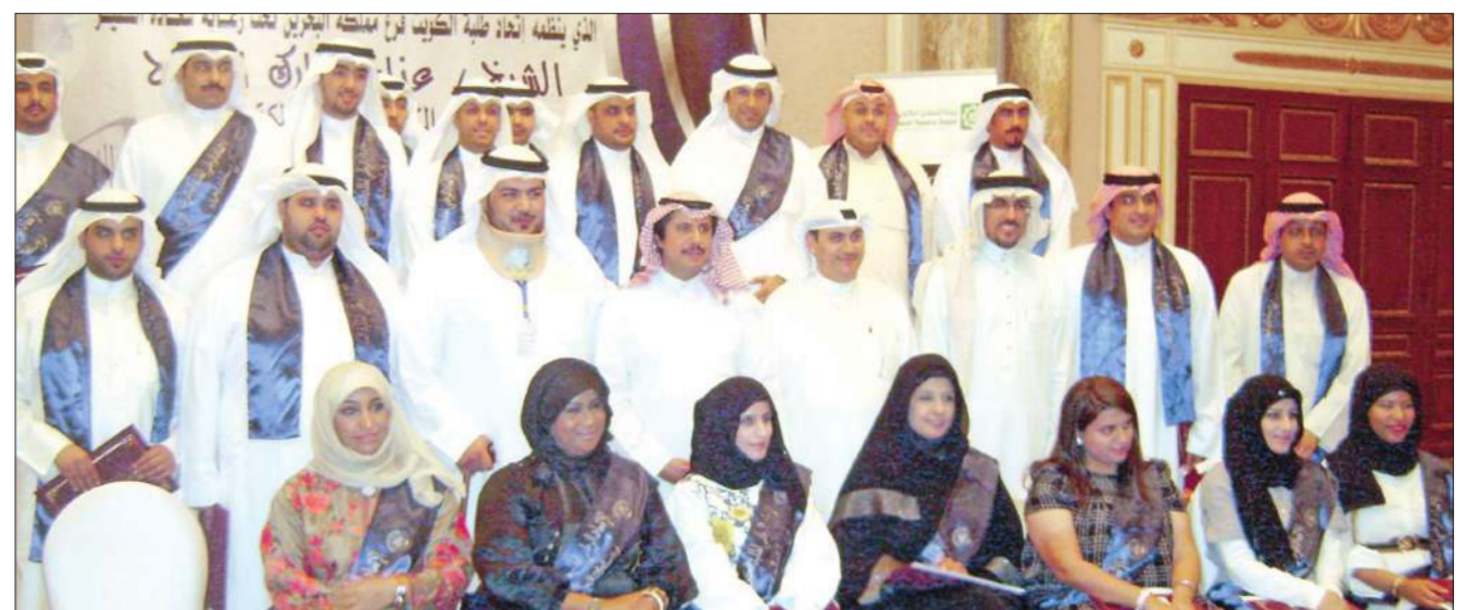
صورة جماعية للطلبة