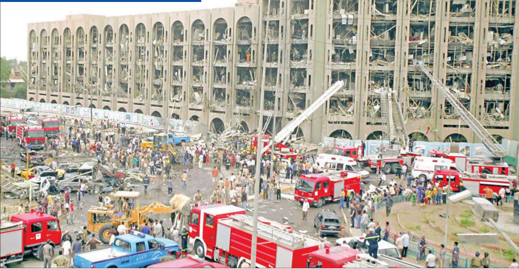
موقع التفجير الذي استهدف وزارة العدل العراقية وسط بغداد أمس

وكان التيار الصدري أعلن بوضوح رفضه المشاركة في اجتماع المجلس السياسي للأمن الوطني، بينما تباينت ردة أفعال عدد من النواب بين مقاتل ومتشائم بشأن نتائج اجتماع المجلس. يُذكر أن البرلمان العراقي فشل الأسبوع الماضي بعد عدة جلسات في حسم نقاط الخلاف بشأن مصير كركوك وكيفية مشاركتها في الانتخابات المقبلة. (بغداد - أ ب، أ ب، رويترز، كونا)