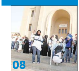
08 انتخابات «الحقوق»: «المستقلة» تدخلها جناح الطلاب و«المتحذون» تعتمد على الطالبات