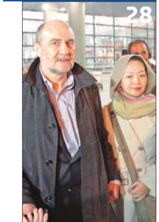
28 مفتشو الوكالة الذرية يتابعون تفتيش موقع «قم» اليوم