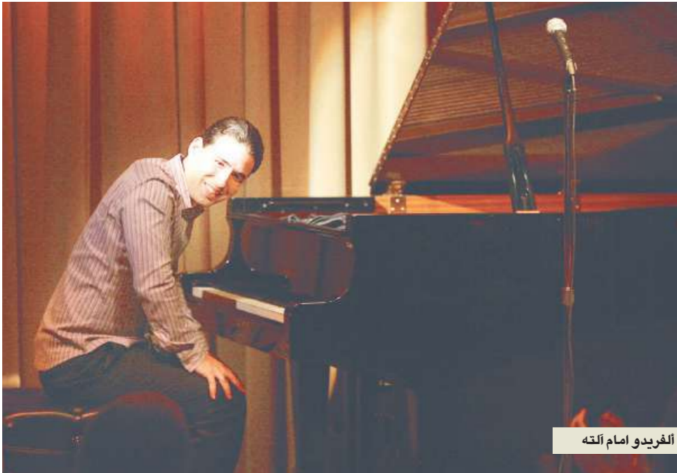
الفيديو امام الله