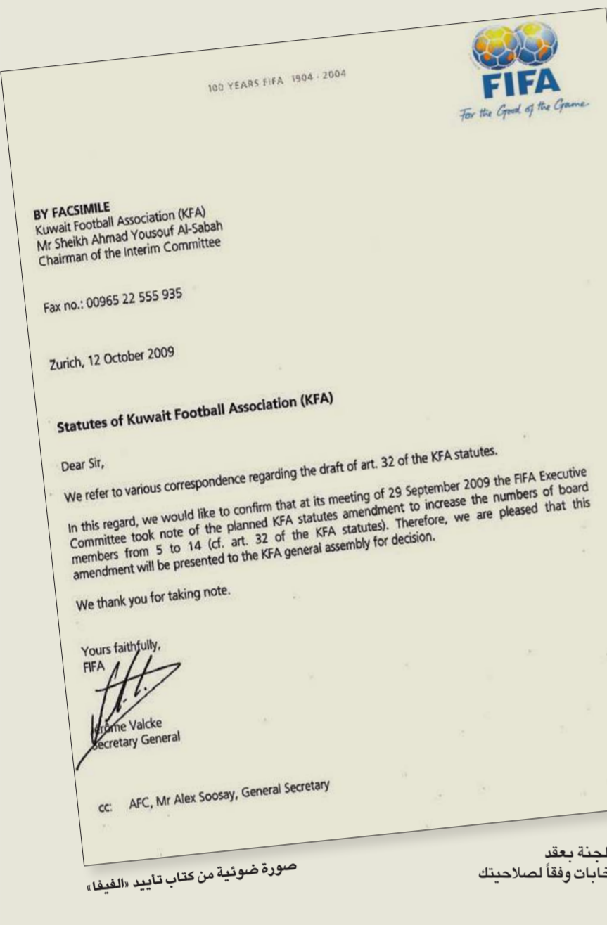
صورة ضوئية من كتاب تأييد «الفيفا»

ما يحاول البعض تسويقه خلال هذه الأيام بعيد أن ينسوا من فرض رغباتهم والحصول على ما كانوا ياملونه من الاتحاد الدولي بعدما أوصد الباب أمام محاولاتهم للانتقاف على القانون وخداع الناس، والتي استمرت مدة 3 سنوات بكتابه الذي أرسله في 6 أكتوبر إلى اللجنة الانتقالية بالموافقة على نص المادة 32 من النظام الأساسي، نجدهم وفي محاولة بائسة يحاولون تحويل الأنظار والاهتمام إلى اللجنة الانتقالية لإدارة شؤون اتحاد كرة القدم باتهامها بالتزوير والمستغرب أن من يتباكي على رفض التزوير المدعى اليوم هو من سكت عن التزوير الموثق والمشهود عليه في محضر الاجتماع التشاوري الشهير في 16 أبريل الماضي، والذي تحول بقدرته قادر إلى محضر اجتماع لجمعية عمومية وانتخابات لم تقم ولم تتم الدعوة إليها أصلاً. نحن نعلم كغيرنا أن أندية التكتل لن تستسلم بسهولة، لأنها حتى ولو أراد بعض المنقابين منها والمغلوبين على أمرهم ذلك فلن يتسنى لهم، فالأمر والنهي عند "سي السيد" المتضرر الأول من تطبيق رغبة صاحب السمو والقوانين الإصلاحية، لذلك قد يكون من الجيد أن نسال من يحاول أن يوهمنا أنه يريد وضع حد لمسلسل اللجان الانتقالية التي تدير شؤون الكرة في الكويت، لماذا إذا أرسلت طلباً إلى الاتحاد الدولي في نهاية مايو الماضي للتمديد للجنة المؤقتة برئاسة أحمد الفهد؟ ولماذا لم تطالب تلك اللجنة بعقد جمعية عمومية مستعجلة للنظر في التعديلات وإجراء انتخابات وفقاً لصلاحياتك التي لا تمتلكها والقانون الذي لا تطبقة؟