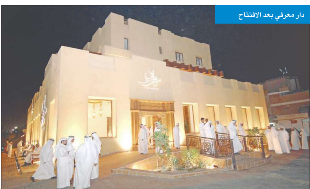
دار معرفي بعد الافتتاح

«الدار» تستمد دعمها من أبناء وبنات العائلة ويعود ريعها إلى جمعيات النفع العام