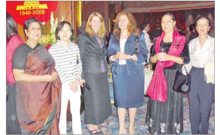
زوجات سفراء ودبلوماسيين في لحظة تذكارية

افتتح متجر 'أوشي نيبون'، وهو الأول من نوعه في الكويت الذي يختص ببيع وتوزيع الفواكه والخضراوات اليابانية عالية الجودة، في مجمع الصالحية الدور الأرضي، وتنتوي إدارة المتجر شركة فود سبلاي (مطعم كي الياباني). حضر الافتتاح الشيفخة فريال الصباح والسفير الياباني لدى الكويت ماساتوشي موتو، بالإضافة إلى عدد من كبار الشخصيات، كما تضمنت الحفل دعوة الحضور إلى جلسة تذوق الفواكه اليابانية الفاخرة.