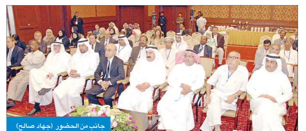
جانب من الحضور

انطلقت أمس الندوة الإقليمية للانفجار العدي للطحالب الضارة، التي تستمر ثلاثة أيام، من أجل وضع الحلول ورفع توصية من شأنها السيطرة على مصادر التلوث وعدم تفاقم الوضع.