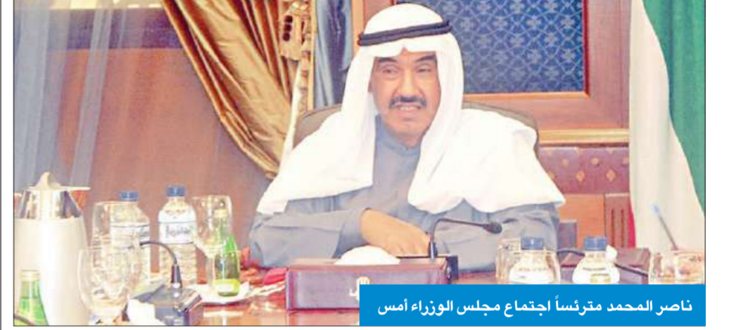
ناصر المحمد مترئساً اجتماع مجلس الوزراء أمس