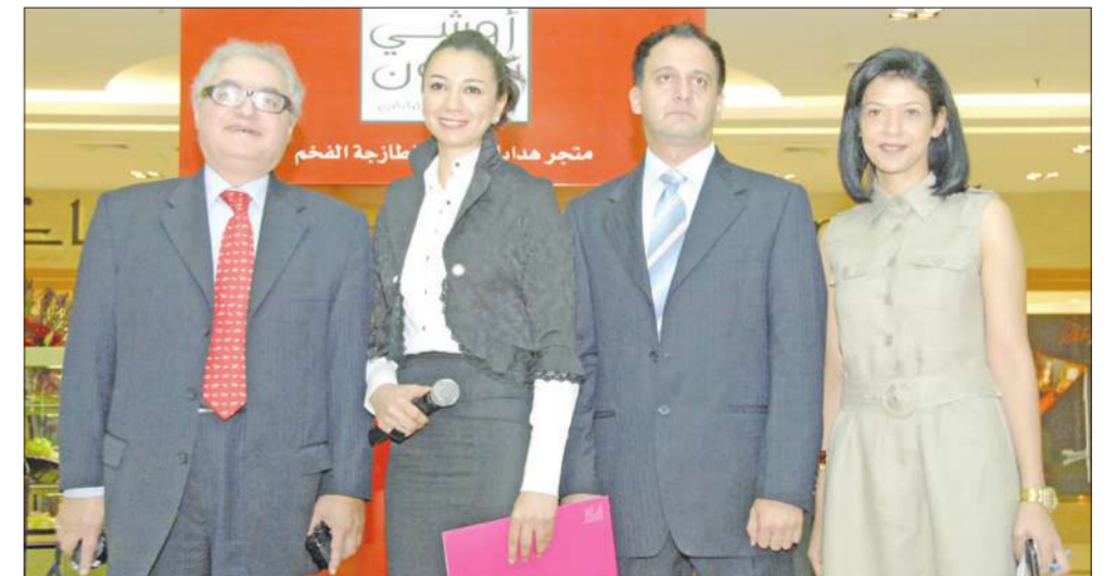
ممنو الافتتاح في لحظة تذكارية