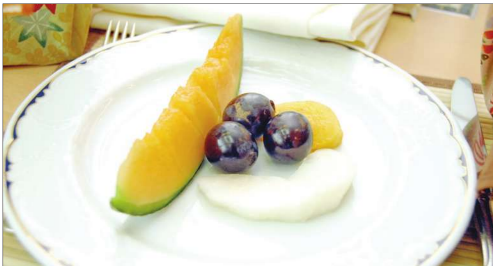
طبق فاكهة ياباني للتذوق