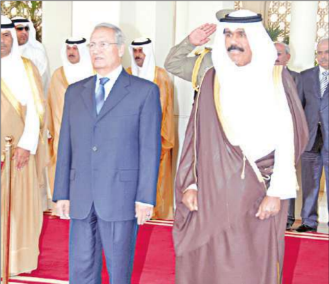
ولي العهد لدى استقباله الشرع في مطار الكويت الدولي