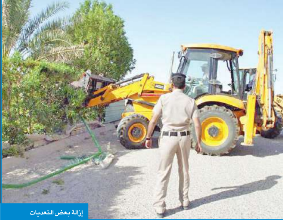
إزالة بعض التعدييات

من جهة أخرى أزيلت فرق العود التعدييات في السكن الاستثماري والتجاري حيث بلغ عدد الإزالةات في محافظة حولي 64 تعديا، بينما أزال الفريق في محافظة العاصمة منطقة شرق 42 تعديا واشتملت الإزالةات على أسوار حديدية ومظلات للسيارات شيدت على املاك الدولة في الاستثماري.