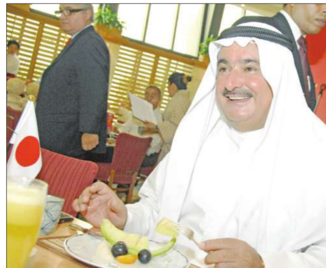
رئيس اللجنة الكويتية اليابانية لرجال الأعمال وأهل الصقر