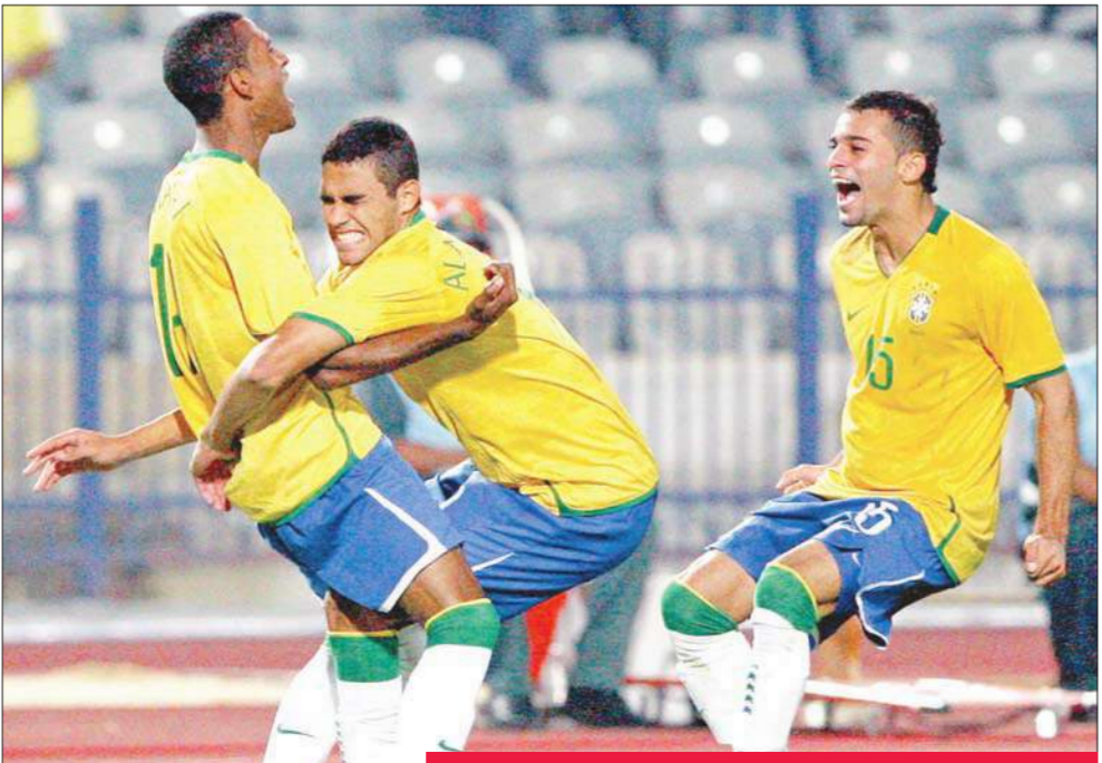
لاعبو المنتخب البرازيلي خلال مباراتهم أمام المنتخب الألماني