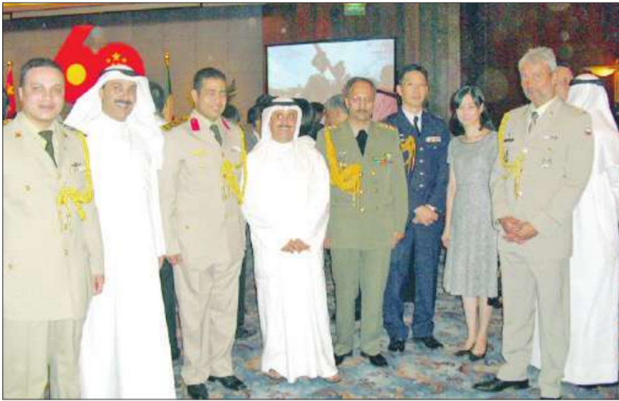
عسكريون ورؤساء مكاتب عسكرية عرب واجانب