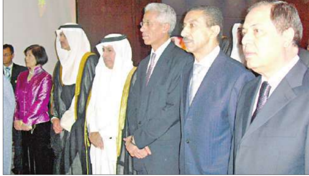
بعض الحضور من السفراء والدبلوماسيين