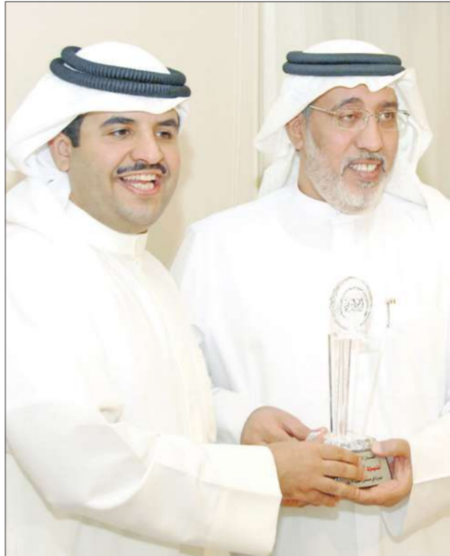
أحمد الجسمي ودعيج الخليفة

أقيم مساء أمس الأول في فندق الريميديان، حفل تكريم لبعض نجوم الدراما العربية تحت رعاية الشيخ دعيج الخليفة الصباح، بالتعاون مع اتحاد المنتجين لدول الخليج العربية للإنتاج الفني والإعلامي. وتم التكريم بحضور رئيس اتحاد المنتجين يوسف العميري، ومن الفنانين الذين تم تكريمهم: غانم الصالح عن دوره في مسلسل "أم البنات"، عبدالرحمن العقل عن دوره في مسلسل "سدرة البيت" والمنتج باسم عبدالأمير، بالإضافة إلى الفنانين غادة عبدالرازق، خالد صالح، خالد يوسف، أمل رزق، إسمايل كتكت وأحمد الجسمي.