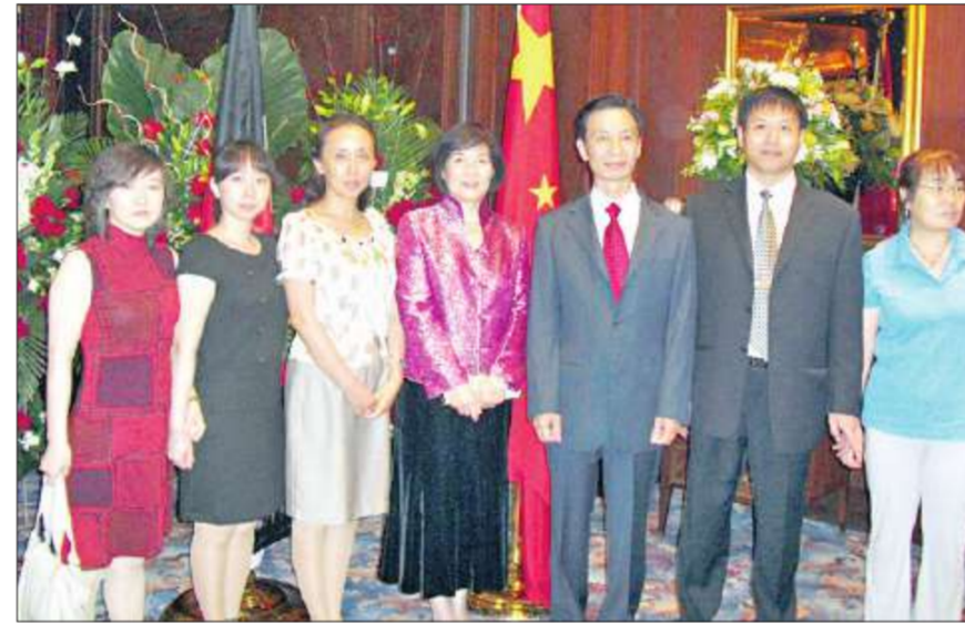
السفير الصيني وعقبته بتوسطان بعضا من أبناء الجالية الصينية