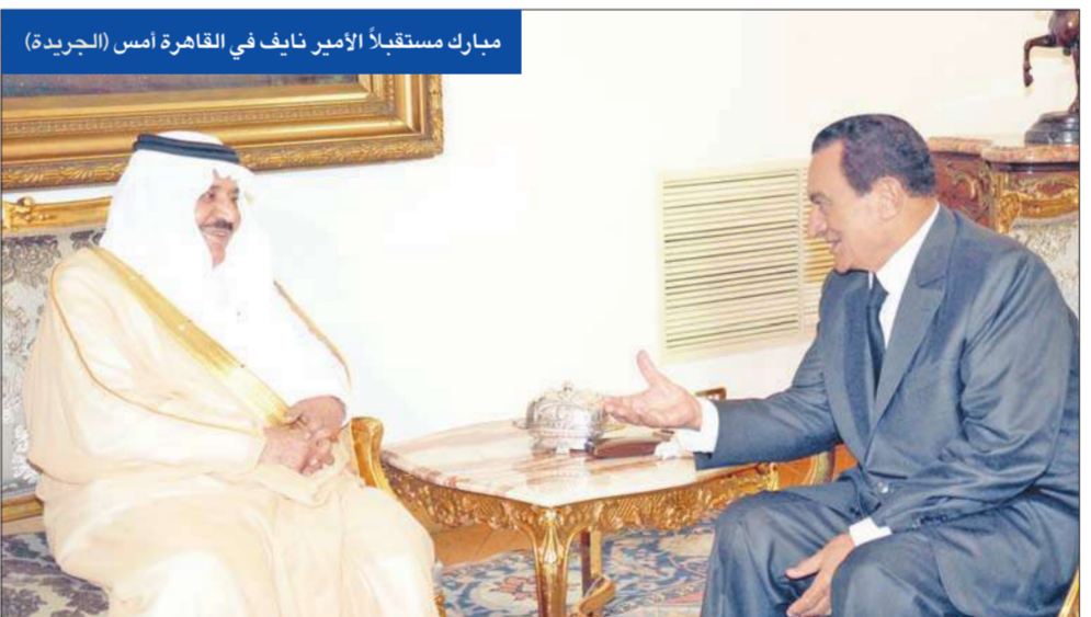
مبارك مستقبلاً الأمير نايف في القاهرة أمس

وأجرى مبارك في القاهرة أمس، مباحثات مع الأمير نايف، تناولت الأوضاع الإقليمية والدولية ذات