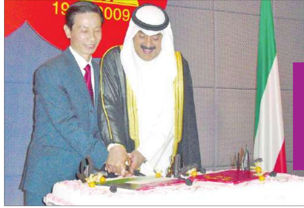
وكيل وزارة الخارجية والسفير الصيني لحظة قطع كعكة الاحتفال

المناسبة الاحتفال بالذكرى الـ 60 لتأسيس الصين الشعبية المكان فندق جي دبليو ماريوت