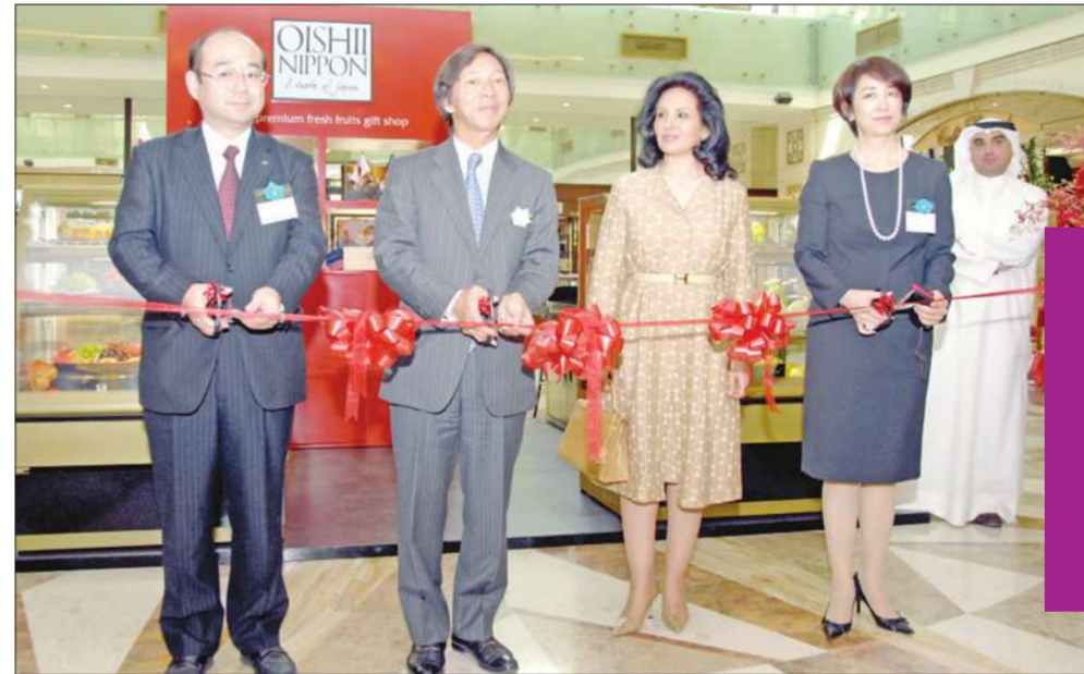
لحظة قص شريط الافتتاح

المناسبة افتتاح متجر 'أوشي نيبون' المكان مجمع الصالحية - الدور الأرضي