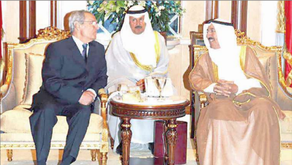
الأمير مستقبلاً الشرع