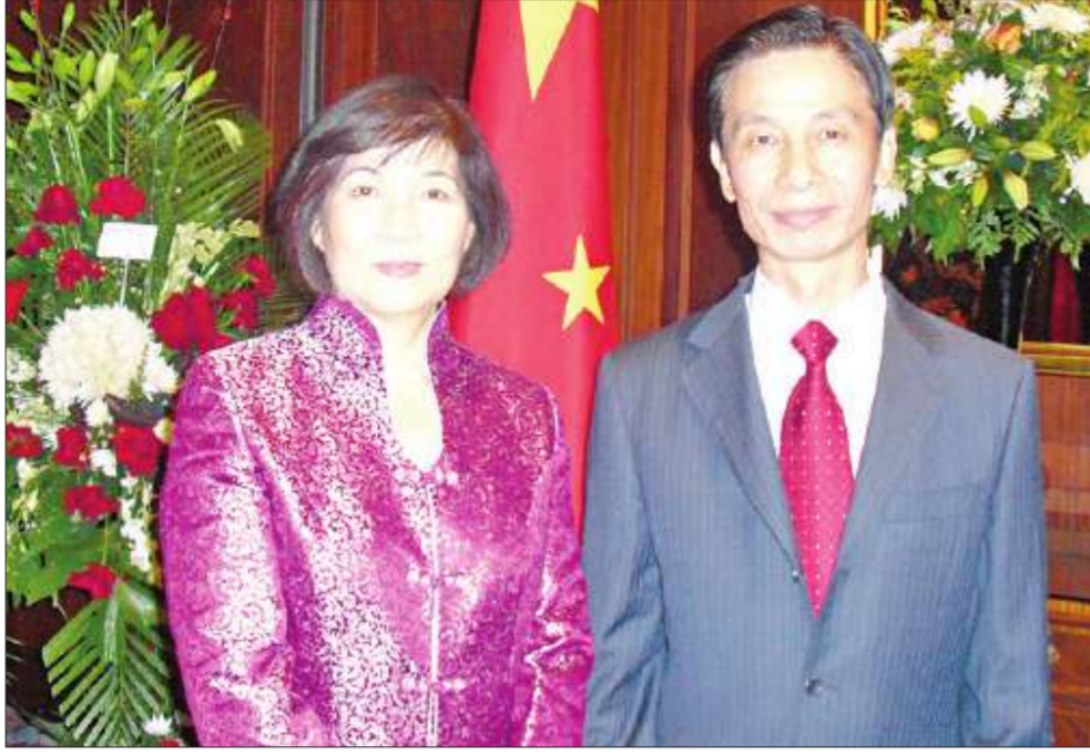
السفير الصيني وعقبته

أقام سفير جمهورية الصين الشعبية لدى الكويت هوانج جيمين، وعقبته، حفل استقبال في فندق جي دبليو ماريوت، بمناسبة الذكرى الـ 60 لتأسيس الجمهورية. وحضر الحفل عدد من السفراء والدبلوماسيين ورؤساء المكاتب العسكرية للدول العربية والأجنبية المعتمدين لدى الكويت، كما حضر عدد من كبار الشخصيات ونخبة من رجال الأعمال، بالإضافة إلى أبناء الجالية الصينية. وخلال الحفل تم عرض بانوراما تاريخية وسياحية للوطن، وفي الختام، هنا الحضور السفير والجالية الصينية بالمناسبة السعيدة.