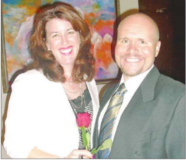
دبلوماسيان من السفارة الأميركية

المناسبة الاحتفال بالذكرى الـ 60 لتأسيس الصين الشعبية المكان فندق جي دبليو ماريوت