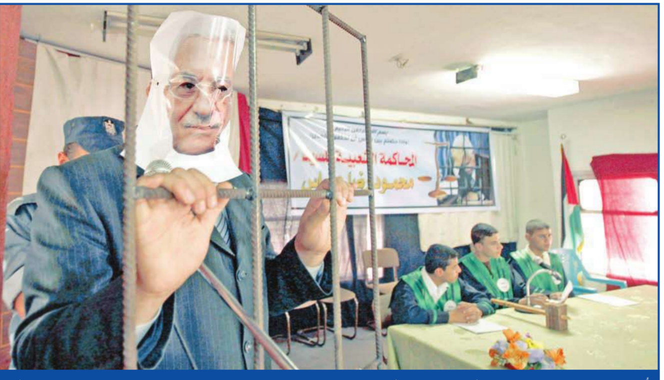
عُقدت في قاعة بلدية رفح جنوب قطاع غزة أمس، محكمة هزلية أبطالها من الأطفال، انتهت بإدانة الرئيس الفلسطيني محمود عباس والحكم عليه بالسجن المؤبد وتجريده من أهليته للحكم، لـ«ارتكابه جريمة عظمى بعد ثبوت تقديمه بطلب سحب قرار غولدستون». ووصف قيادي في «فتح» من غزة ما جرى بأنه «استغلال مؤسف للأطفال في مثل هذا التبريح الذي يزيد الضغائن والأحقاد». وفي الصورة جانب من المحاكمة أمس

والأمنية في وزارة الدفاع الإسرائيلية عاموس جلعاد أمس، محادثات مع عدد من المسؤولين المصريين، أولهم رئيس جهاز الاستخبارات المصرية العامة الوزير عمر سليمان.