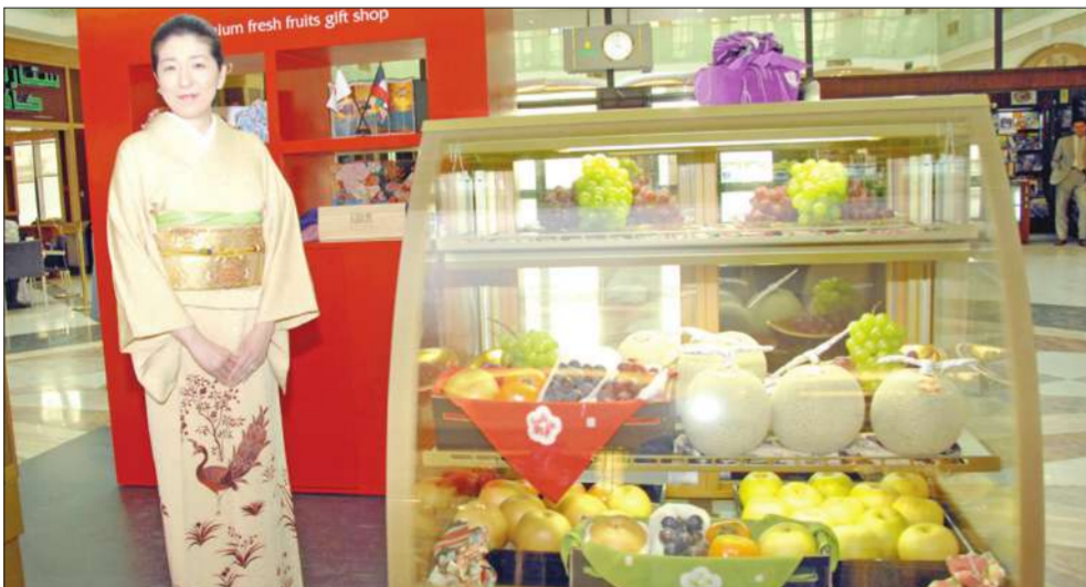
متجر 'أوشي نيبون' لبيع الخضراوات والفواكه اليابانية

المناسبة افتتاح متجر 'أوشي نيبون' المكان مجمع الصالحية - الدور الأرضي