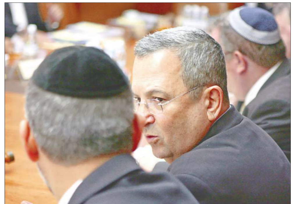
(أي بي آيه)

وقال باراك: «رغم التوتر فإن تركيا تشكل عاملاً مركزياً في منطقتنا، ولا مكان للانجرار والتجهّم من خلال التصريحات». وقال وزير البنى التحتية بنيامين بين اليغازز: «إنني غير راضٍ عن الانتقادات التي