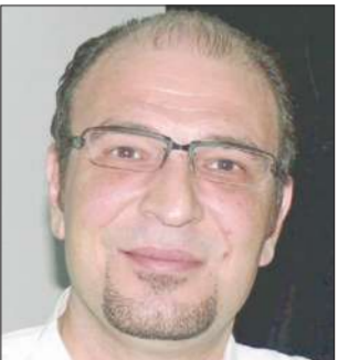
المبايسترو عزيز المصري

فعاليات معهد الموسيقى الخليجية تُعرض على الهواء