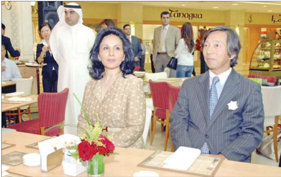
السفير الياباني وفريال الصباح أثناء المؤتمر الصحفي

افتتح متجر 'أوشي نيبون'، وهو الأول من نوعه في الكويت الذي يختص ببيع وتوزيع الفواكه والخضراوات اليابانية عالية الجودة، في مجمع الصالحية الدور الأرضي، وتنتوي إدارة المتجر شركة فود سبلاي (مطعم كي الياباني). حضر الافتتاح الشيفخة فريال الصباح والسفير الياباني لدى الكويت ماساتوشي موتو، بالإضافة إلى عدد من كبار الشخصيات، كما تضمنت الحفل دعوة الحضور إلى جلسة تذوق الفواكه اليابانية الفاخرة.