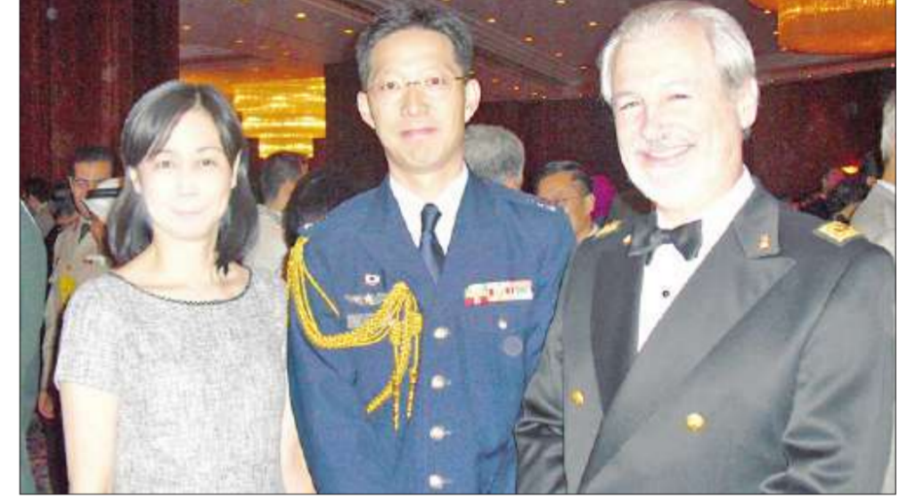
الخلق العسكري الإيطالي ونظيره الصيني وعقبته