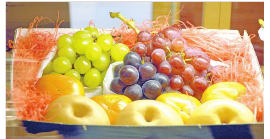
بعض الفواكه اليابانية الفاخرة