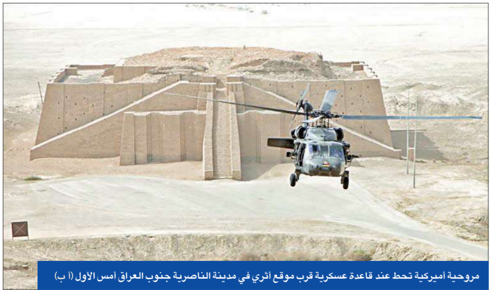
مروحية أميركية تحط عند قاعدة عسكرية قرب موقع أثري في مدينة الناصرية جنوب العراق (مس الأول أ ب)

المالكي، يجري خلالها مباحثات مع المسؤولين العراقيين تتناول سبل تفعيل اتفاقية المجلس الأعلى للتعاون الاستراتيجي المبرمة بين البلدين، فضلاً عن إبرام اتفاقيات تعاون في مختلف المجالات. ومن المتوقع أن يتم خلال المباحثات التركيز على مشكلة المياه