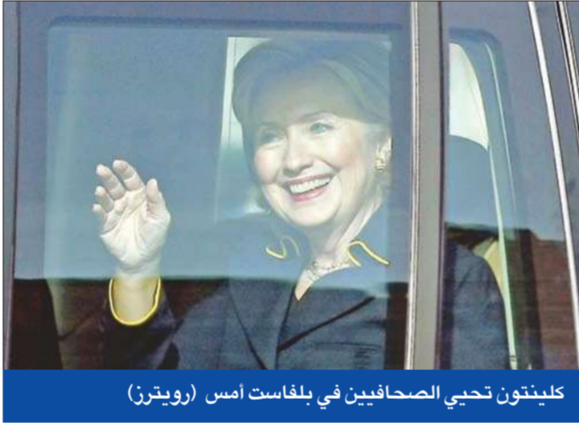
كلينتون تحيي الصحافيين في بلفاست أمس

القيم الأفغانية والإسلامية. وأني كنت أصغر على مقاربة تتماشى مع الدستور الأفغاني. وأضاف أن "معظم القرارات اتخذت في غيابي". وفي سياق متصل، أعلن الأمين العام لـ"حلف شمال الأطلسي أندريس فوغ راسموسن دعمه الكامل لمبعوث الأمم المتحدة الخاص في أفغانستان كاي إيدي، الذي أتهم بالتستر على التزوير الذي حدث في الانتخابات الرئاسية الأفغانية. وقال راسموسن: "إن الحلف وأنا شخصياً نثق ثقة كاملة في المبعوث الخاص للأمم المتحدة في أفغانستان ونشيد بجهوده والالتزام الذين أظهرهما في مساعدة أفغانستان على بناء مستقبل أفضل".