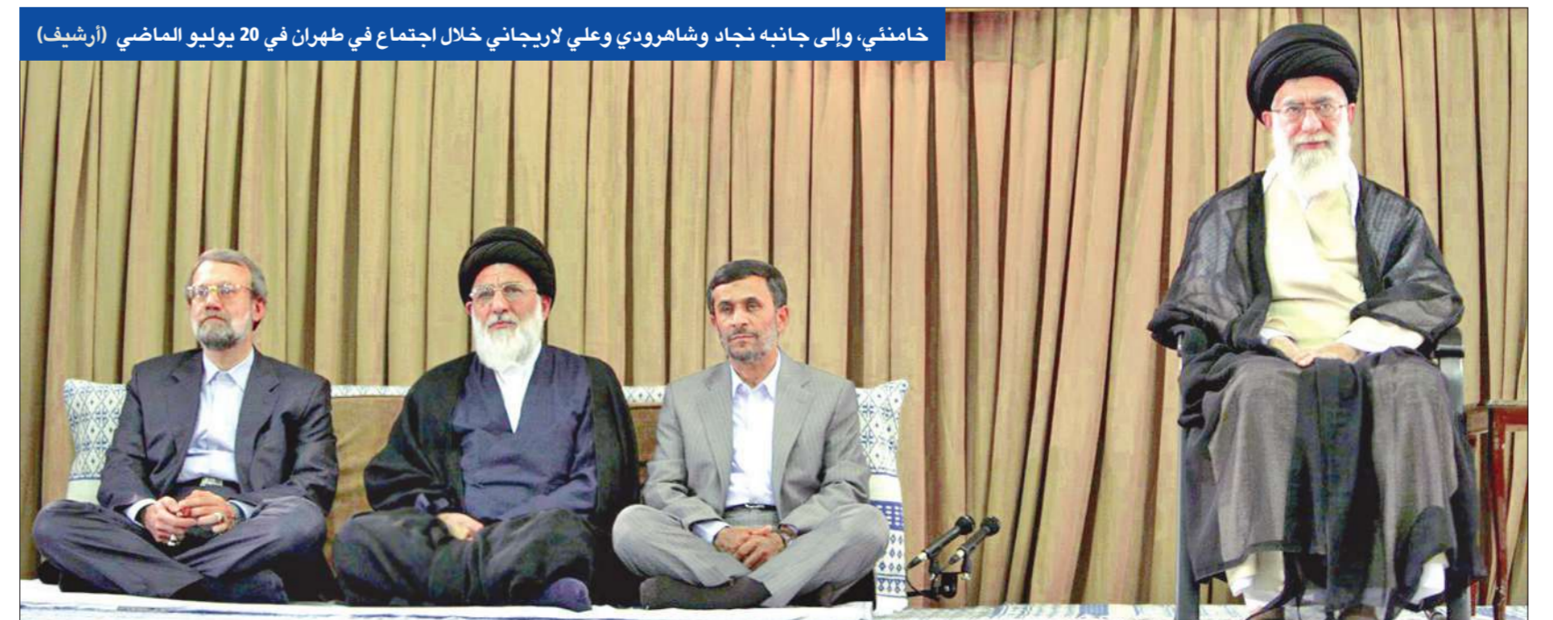
خامنئي، وإلى جانبه نجاد وشاهرودي وعلي لاريجاني خلال اجتماع في طهران في 20 يوليو الماضي (أرشيف)