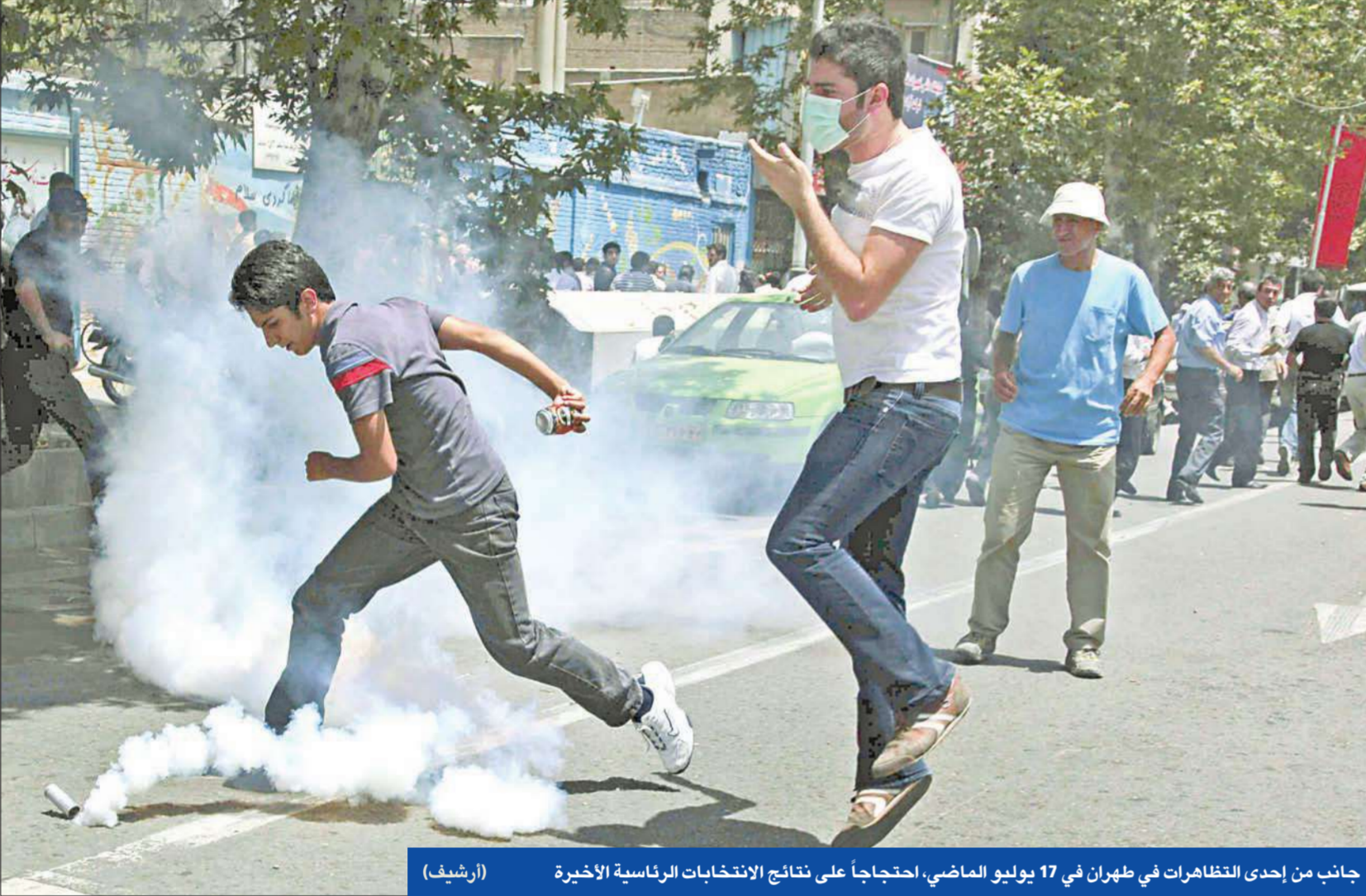
جانب من إحدى التظاهرات في طهران في 17 يوليو الماضي، احتجاجاً على نتائج الانتخابات الرئاسية الأخيرة (أرشيف)

أخذ الاعتراف بعمالة أميركا من أي شخص يقضي يومين في زنتانته. وما من شك في أن نجاح نقدي وزميله أزه في إرغام إصلاحيين بارزين مثل الدكتور سعيد حجابان مستشار خاتمي، والمتنظر الإصلاحي المعروف حجة الإسلام محمد علي أبطحي مساعد رئيس الجمهورية السابق، على قراءة الاعتراضات المعدة لهم أمام كاميرا التلفزيون الإيراني كان أهم أسباب تعيينه قائداً لقوات الباسيج، وتسليم أزمته مسؤولية رفيعة في وزارة الانتخابات. واعتبر الإصلاحيون تسليم محمد رضا نقدي مسؤولية قيادة قوات الباسيج من قبل المرشد، دليلاً آخر على أن المرشد ليس بصدد مراجعة مواقفه وسحب دعمه لمحمود أحدي نجاد، بل هو مؤشر خطير على أن السلطة ناضية في خطواتها الشاملة لقمع انتفاضة الانتخابات. والعميد نصف العراقي محمد رضا نقدي، مكلف بذلك ولديه «كارت بلانش» لاعتقال كل من يعتبرونه خطراً على ولاية الفقيه والإسلام الثوري الولائي الخالص.