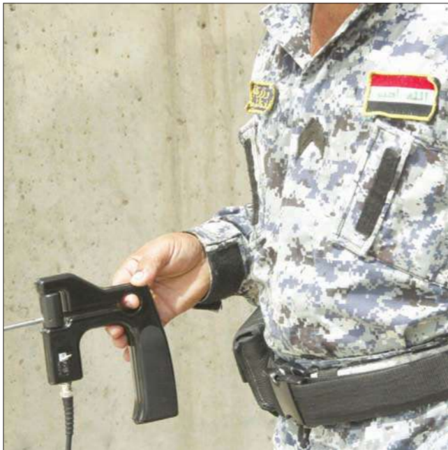
شرطي عراقي يتفحص إحدى المركبات عند نقطة تفتيش في بغداد

وأدين المقرحي عام 2001 بالمشاركة في تفجير طائرة تابعة لشركة «بان أميركان» في الحادي والعشرين من ديسمبر عام 1988. وانفجرت