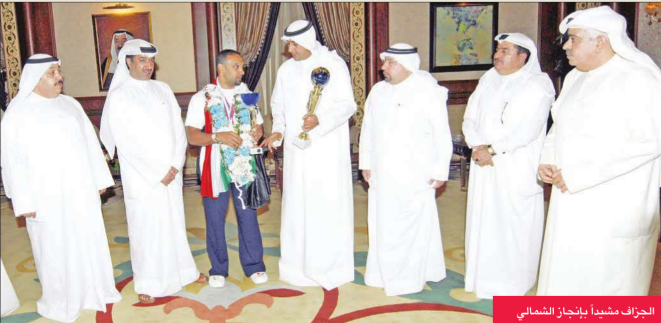
الجزاف مشيدا بإنجاز الشمالي

الفودري: علي يستحق بجدارة لقب سفير «الجت سكي»