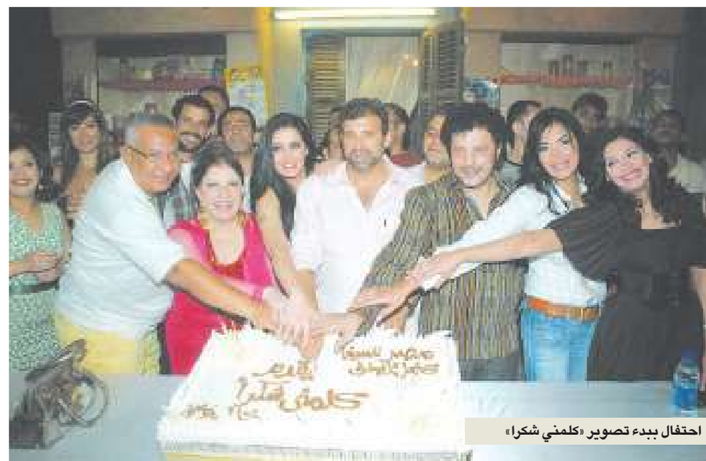
احتفال ببدا تصوير «كلمني شكراً»