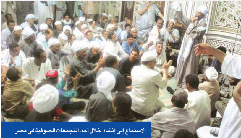
الاستماع إلى إرشاد خلال أحد التجمعات الصوفية في مصر

من الطرق الصوفية احتفالاتها الخاصة في يوم محدد من أيام شهر رمضان»، مشيراً إلى أن «كل طريقة باتي لها ممثلون من كل محافظات مصر للاحتفال بشهر رمضان وإقامة شعائريهم، والتي تتمثل في قراءة الأوراد والأعية وإقامة حلقات الذكر، وانتقد بعض الذين ينتقدون حلقات الذكر التي يعقدها المتصوفة قائلاً: «نحن نقبل النقد لكن لا نقبل التجريح الذي يقودونه بعض الدعاة المتشددين». يذكر أن السلطات الأمنية قامت في الفترة الأخيرة بمنع الاحتفالات الصوفية بمولد السيدة زينب لأول مرة بسبب انتشار فيروس «إنفلونزا الخنازير»، مما أثار استياء بعض مشايخ الطرق الصوفية الذين اعتبروا أن القرار صدر لأسباب سياسية.