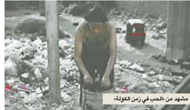
مشهد من «الحب في زمن الكولة»

العمل في السينما التجارية ليس صعباً إطلاقاً، ولكنه لا يستهويني