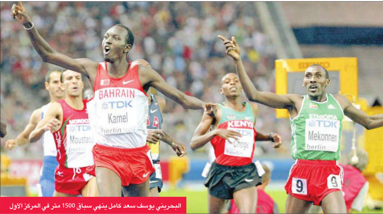
البحريني يوسف سعد كامل يهني سباق 1500 متر في المركز الأول

أما بطل العالم مرتين (2003 و2005) واللاعب الأولمبية مرتين (2000 و2004) اللتواني فيرجيلوس الكينا (37 عاماً) فحل رابعاً (66.36م).