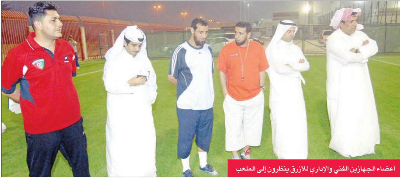
أعضاء الجهازين الفني والإداري للأزرق ينظرون إلى الملعب

يبحث الجهاز الفني للأزرق ناشئي الكرة تحت 16 سنة عن ملعب من أجل مباشرة التدريبات عليه، استعداداً للبطولة الخليجية التي تستضيفها الإمارات في الخامس من سبتمبر المقبل.