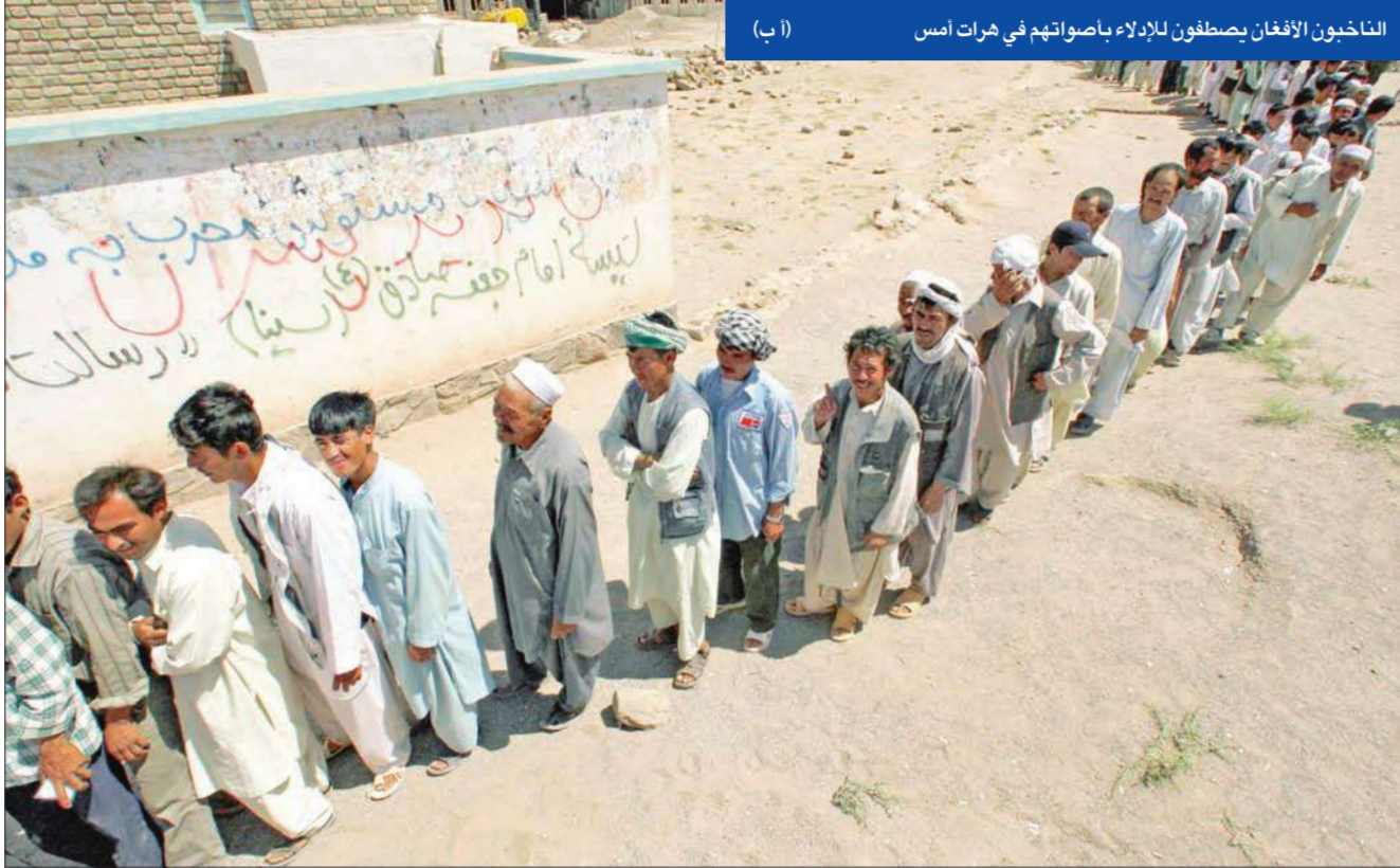
التابعون الأفغان يصطفون للإدلاء بصوتهم في هرات أمس

بدأت القوات الجوية الباكستانية أمس، رسمياً إنتاج طائرات استطلاع من دون طيار من نوع «فالكو» بالتعاون مع شركة «سيليكس غاليليو» الإيطالية. وستستخدم الطائرة بشكل خاص لأغراض الاستطلاع الجوي وجمع المعلومات، إلا أن سلاح الجو الباكستاني سيجرب الطائرات بأنظمة سلاح لتتخذ عمليات هجومية. من ناحية أخرى، أعلن فقير محمد نائب زعيم حركة «طالبان الباكستانية» أنه تولى قيادة الحركة بصفة مؤقتة، في خطوة من المرجح أن توسع هوة الشقاق بين الفصائل المتشددة في باكستان بعد نجا مقتل زعيمها بيت الله محسود. (إسلام آباد. يو بي أي)