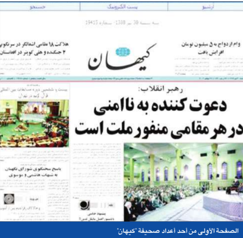
الصفحة الأولى من أحد أعداد صحيفة «كيهان»

وقال الدبلوماسيون، الذين رفضوا الإفصاح عن هويتهم، أن مفتشي الهيئة الدولية للطاقة الذرية زاروا مفاعل «آراك» الذي يعمل بالماء الثقيل الأسبوع المنصرم بعد حظر