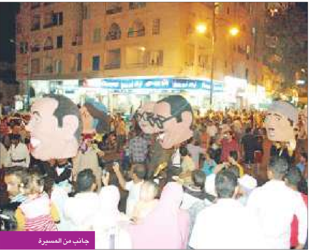
جانب من المسيرة

لـ«الجريدة»: كان الهدف من هذه الفكرة هو الخروج بالاحتفالية من أجواء الحدران والمكاتب والوصول بها إلى الناس وتوصيل الضحكة إليهم بأسلوب مبتكر.