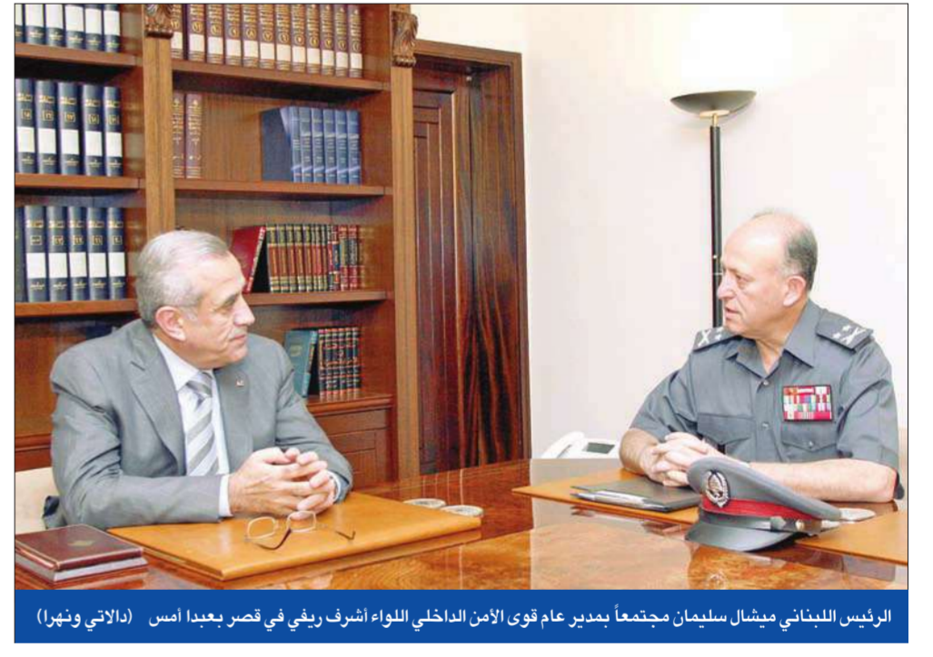
الرئيس اللبناني ميشال سليمان مجتمعاً بمدير عام قوى الأمن الداخلي اللواء أشرف ريفي في قصر بعبداً أمس

يكون تجهيز الجيش اللبناني متلائماً مع متطلبات المهام التي يقوم بها في الحدود للدفاع عن الوطن وفي الداخل لضبط الأمن، لا سيما أنه لا يزال يواجه حالات إرهابية». في الشأن الحكومي، وفي حين تابع الرئيس المكلف سعد الحريري لقاءاته مع أركان في المعارضة، فالنقى الرئيس عمر كرامي، بعد لقائه الوزير طلال أرسلان أمس الأول، وعرض معه الشأن الحكومي، برز موقف سعودي لافت، إذ دحض مصدر سعودي مسؤول وجود خلاف بين بلاده ومصر بشأن تشكيل الحكومة، مشدداً على أن سياسة المملكة قائمة على عدم التدخل في الشؤون الداخلية لأي بلد كان، ونفى المصدر تلقي المملكة بصانح من بعض الدول التي أتمت إجراءاتها مع مصر، بعد الاستعجال في الذهاب إلى دمشق، مؤكداً أن «العلاقات السعودية السورية، والسعودية - المصرية لا تشوبها أي شائبة». وبالتزامن مع درس مجلس الأمن الدولي إمكان التمديد لقوات