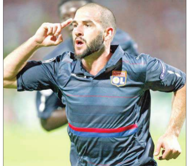
ليساندرو لوبيز نجم ليون يحتفل بهدفه في مرمى اندرلخت

أصبح ليون الفرنسي على بعد خطوة واحدة من التأهل للدور الأول بدوري أبطال أوروبا لكرة القدم، بعدما حقق فوزاً كبيراً على اندرلخت البلجيكي في الثالث الأخير من التصفيات.