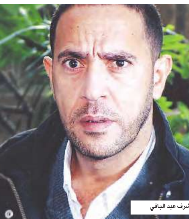
أشرف عبد الباقي

من ناحيته يرفض الفنان شريف منير اتهام النجوم بأنهم يروجون بأنفسهم الشائعات التي تطالهم.