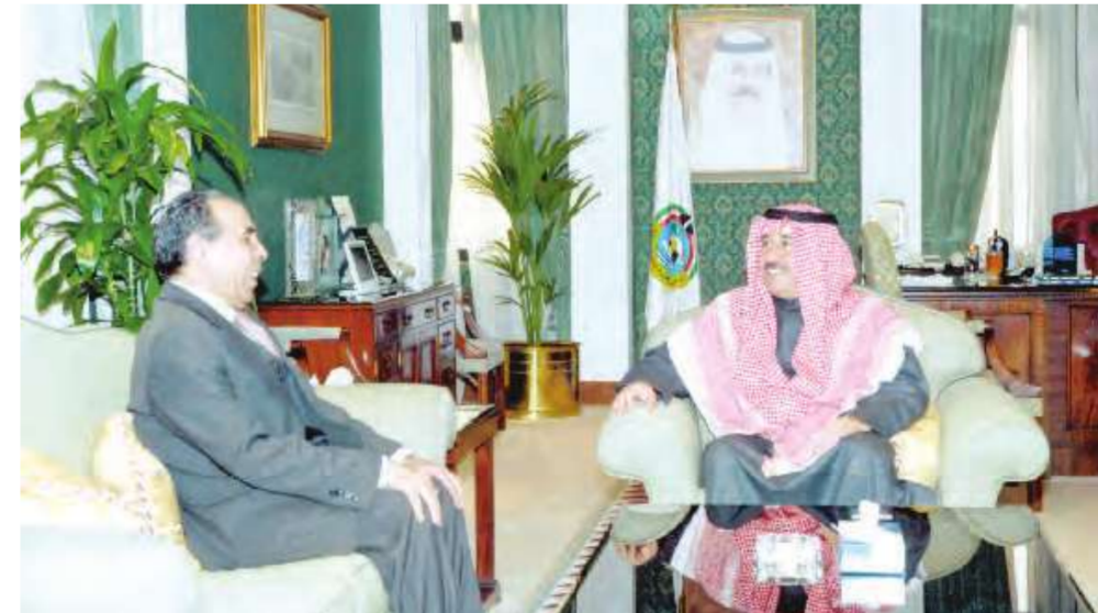
محافظ الجهراء مستقبلاً السفير البوسني