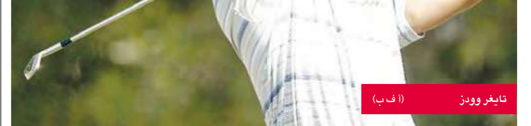
تايغر وودز