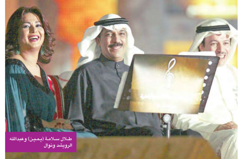
طلال سلامة (يمين) وعبدالله الرويشد ونوال

الرويشد ونوال غنيا له «الأمر بيدك» في تناغم وإحساس عاليين