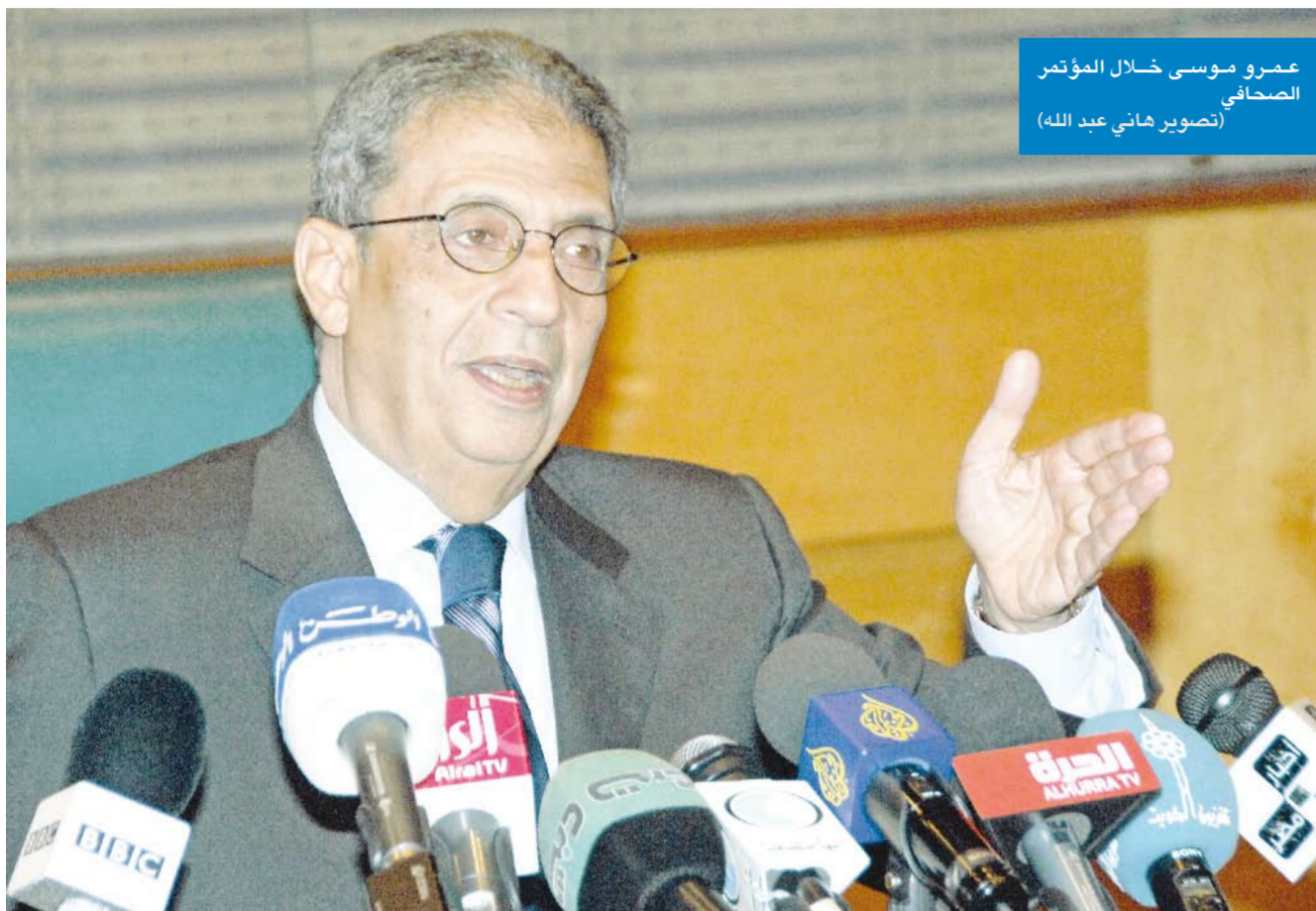
عمرو موسى خلال المؤتمر الصحفي

المصارف ورجال الأعمال والغرف التجارية العربية لتساهم في تصور التوصل إلى قمة اقتصادية تنموية ناجحة، مشيراً إلى أنه تمت مناقشة الإطار الزمني الذي من المرجح أن يكون أواخر العام الجاري أو بداية العام المقبل، معرباً عن أمله أن يحظى هذا المؤتمر بتنظيم جيد خصوصاً مع لجنة أعداد وتحضير في الكويت يقابلها لجنة من الجامعة العربية.