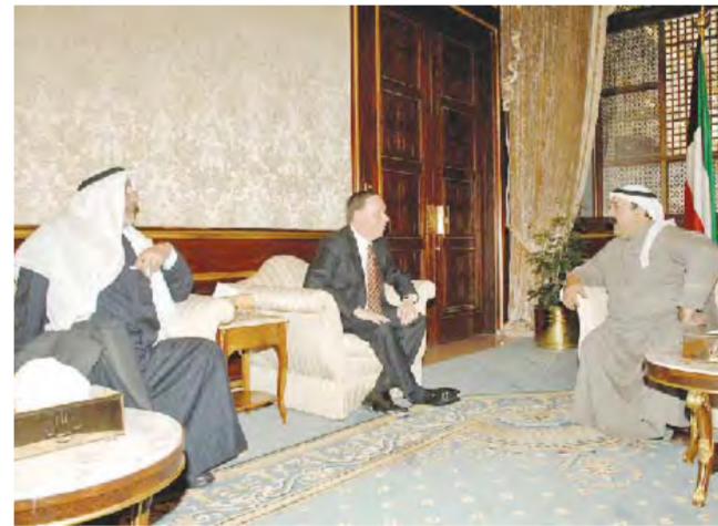
وزير الديوان الأميري مستقبلا رئيس مركز جون كينيدي

استقبل وزير شؤون الديوان الأميري الشيخ ناصر صباح الاحمد في مكتبه بقصر بيان صباح امس وزير النقل والطرق والجسور في الجمهورية السودانية الشقيقة الدكتور ميرك مبروك سليمان برفقه نائب ولاية كسلا وزير الثروة الحيوانية محمد صالح عابد. كما استقبل في مكتبه بقصر بيان صباح امس رئيس مركز جون كينيدي للفنون مايكل كايزر برفقه نائب رئيس مجلس انماء المراكز الثقافية ابراهيم حمود بورسلي.