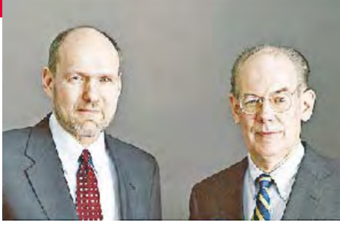
تأليف: جون ميرشامير وستيفن والت

ويخلص الجزء في نهايته إلى محصلة السجال بين الجانبين، التي جسدها عبارة الصحافي