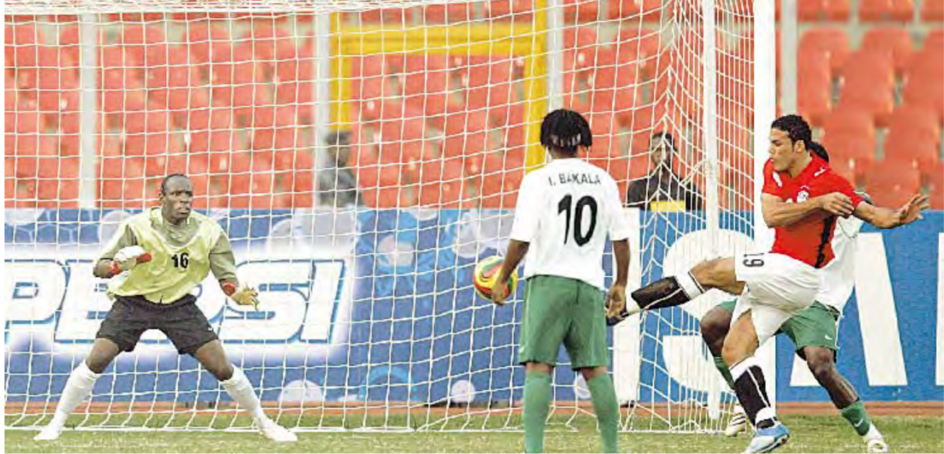
كوماسي - الجريدة

تأهلت مصر والكاميرون ونيجيريا وساحل العاج إلى الدور ربع النهائي من نهائيات كأس أمم إفريقيا في كرة القدم المقامة في غانا حتى 10 فبراير. في الجولة الثالثة الأخيرة من منافسات المجموعة الثانية والثالثة.