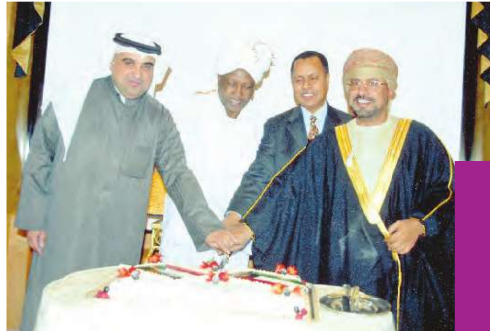
مشاركة دبلوماسية بقطع كعكة حفل الوداع