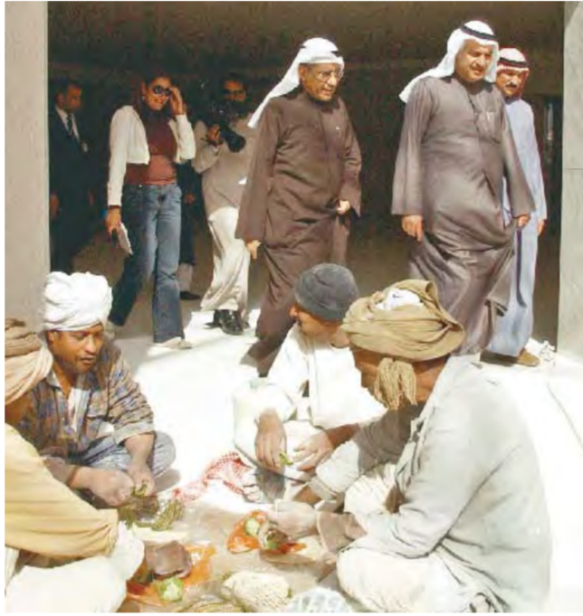
العوضي أثناء الجولة وعمل المشروع ياكلون

وأضاف أن أعضاء مجلس الأمة «متعاونون مع المؤسسة وأقولها