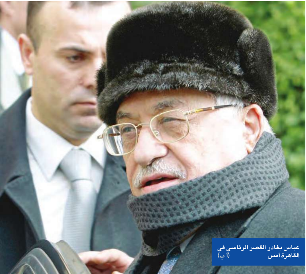
عباس يغادر القصر الرئاسي في القاهرة أمس