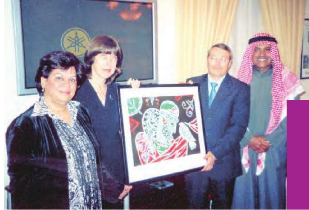
القديري والبقصمي يقدمان هدية الى السفير الروسي وعقبته