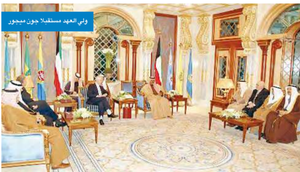
ولي العهد مستقبلا جون ميجور

حضر المقابلة وزير المالية مصطفى الشمالي ووكيل ديوان سمو رئيس مجلس الوزراء الشيخة اعتماد الخالد والسفير احمد الكليب ومدير ادارة مكتب نائب رئيس مجلس الوزراء وزير الخارجية الشيخ الدكتور احمد ناصر المحمد ومدير ادارة