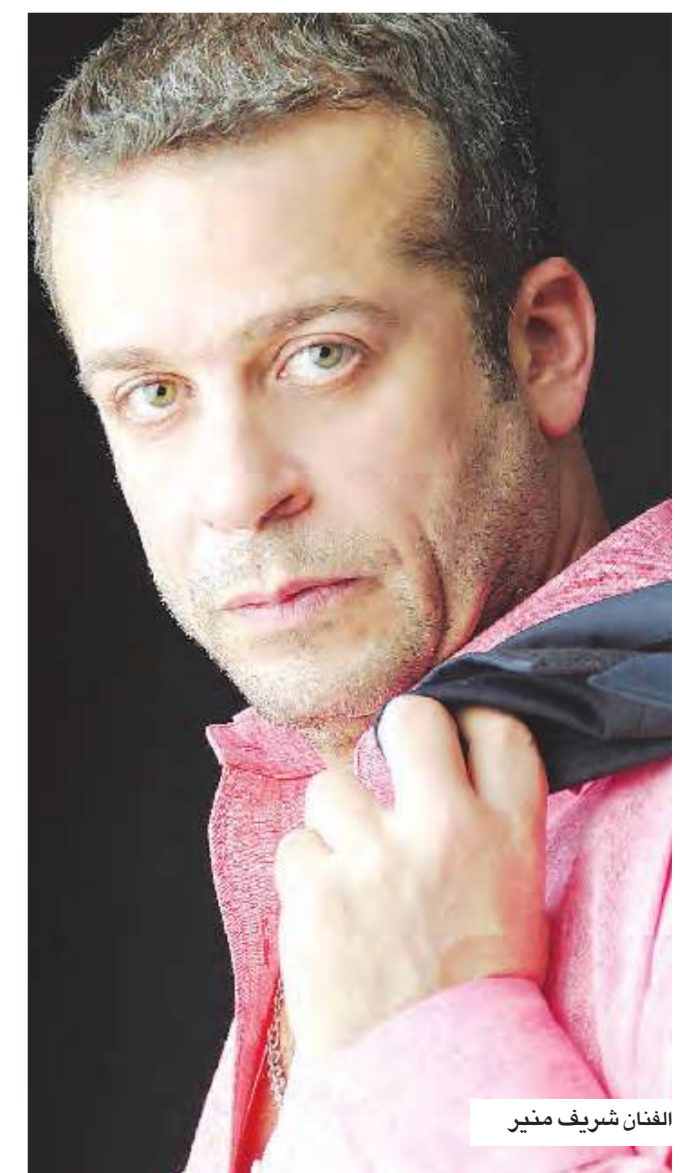
الفنان شريف منير

يرفض الفنان شريف منير اتهام النجوم بأنهم يروجون بأنفسهم الشائعات التي تطالهم