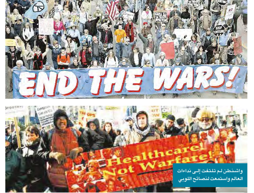
واشنطن لم تلتفت إلى نداءات العالم واستمعت لتصانح اللوبي

كان المحافظون الجدد مصممين على إسقاط صدام، حتى قبل أن يصبح بوش