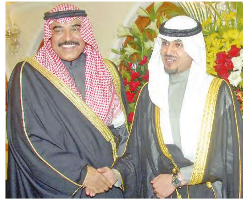
صباح الخالد الصباح مهنئاً

أقام ديوان القديري حفل وداع على شرف السفير الروسي عظمة كول محمودوف، وذلك بمناسبة انتهاء مهام عمله سفيراً لجمهورية روسيا الاتحادية، وكان في استقبال السفير محمودوف محمد القديري وعقبته الفنانة التشكيلية نريا البقصمي. حضر حفل الوداع المطربة الأميركية جينا لورنغ، وفريق التلفزيون الروسي، ووفد من سلاح الجو الأميركي برئاسة الكولونيل بوب سويتشر.