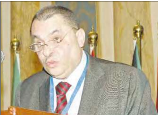
محمد الصقر يلقي كلمته

في كلمته في افتتاح المؤتمر البرلماني الإسلامي