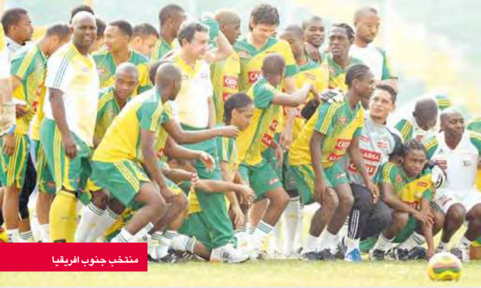
منتخب جنوب إفريقيا