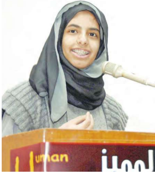
طالبة تلقي كلمتها

افتتحت رئيسة اللجنة العليا لجائزة الأم المثالية الشبيخة فريحة الأحمد، مخيم مركز للمسة الإنسانية للفتيات في جمعية الخريجين، الذي يستمر ستة أيام، ويحتضن المخيم مجموعة من الفتيات اللاتي حرصن على المشاركة في جميع فعاليات المركز، ونهاقن التسجيل في المخيم منذ بداية فتح باب التسجيل.