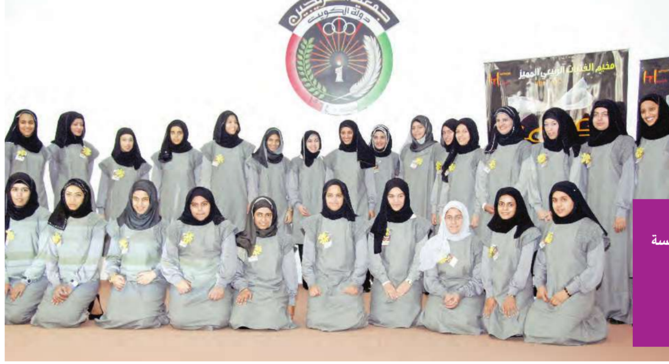
الفتيات المشاركات في المخيم

المناسبة افتتاح مخيم مركز للمسة الإنسانية للفتيات