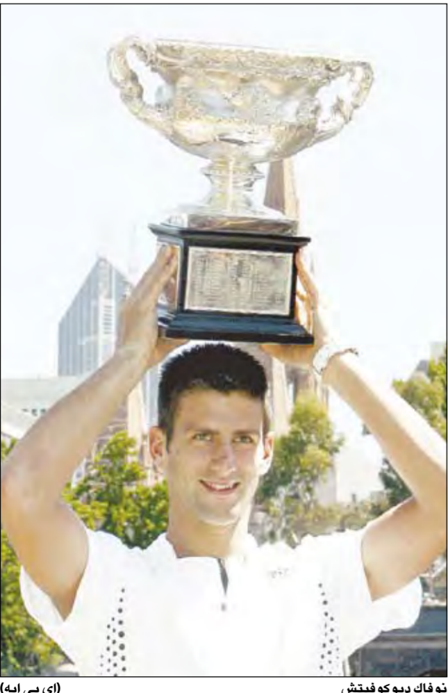
نوكاف ديوكوفيتش