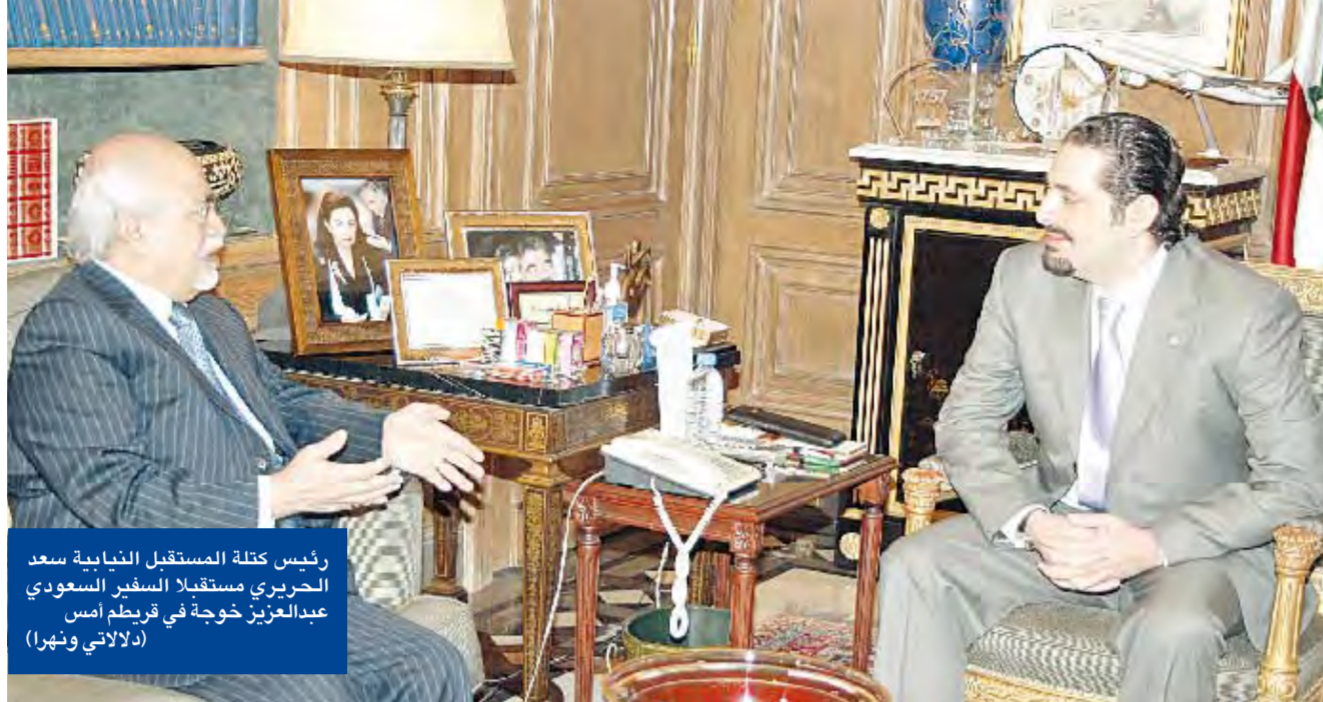
رئيس كتلة المستقبل اللبنانية سعد الحريري مستقبلاً السفير السعودي عبدالعزيز خوجة في قريضة إس (دلاياتي ونهرا)

وتم الاستماع أمس، إلى إفادات عدد من الموقوفين والشهود والجرحى والجنود ومراسلي المحطات التلفزيونية الذين وُجِدوا في مكان الحادث.