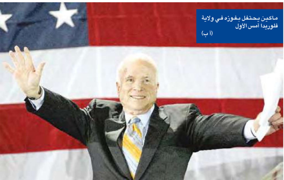
ماكين يحتفل بفوزه في ولاية فلوريدا، أمس الأول

أوباما يتعهد بعقد قمة مع الرؤساء المسلمين في حال انتخابه