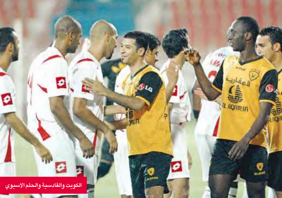
الكويت والقادسية والحلم الآسيوي

وأشار إلى أن الاجتماع هذا يأتي امتدادا للاجتماع البناء الذي عقد في الكويت قبل أيام لاتحاد منطقة غرب آسيا للسلة على الكراسي المتحركة، التي تقام بطولتها مطلع 2009.