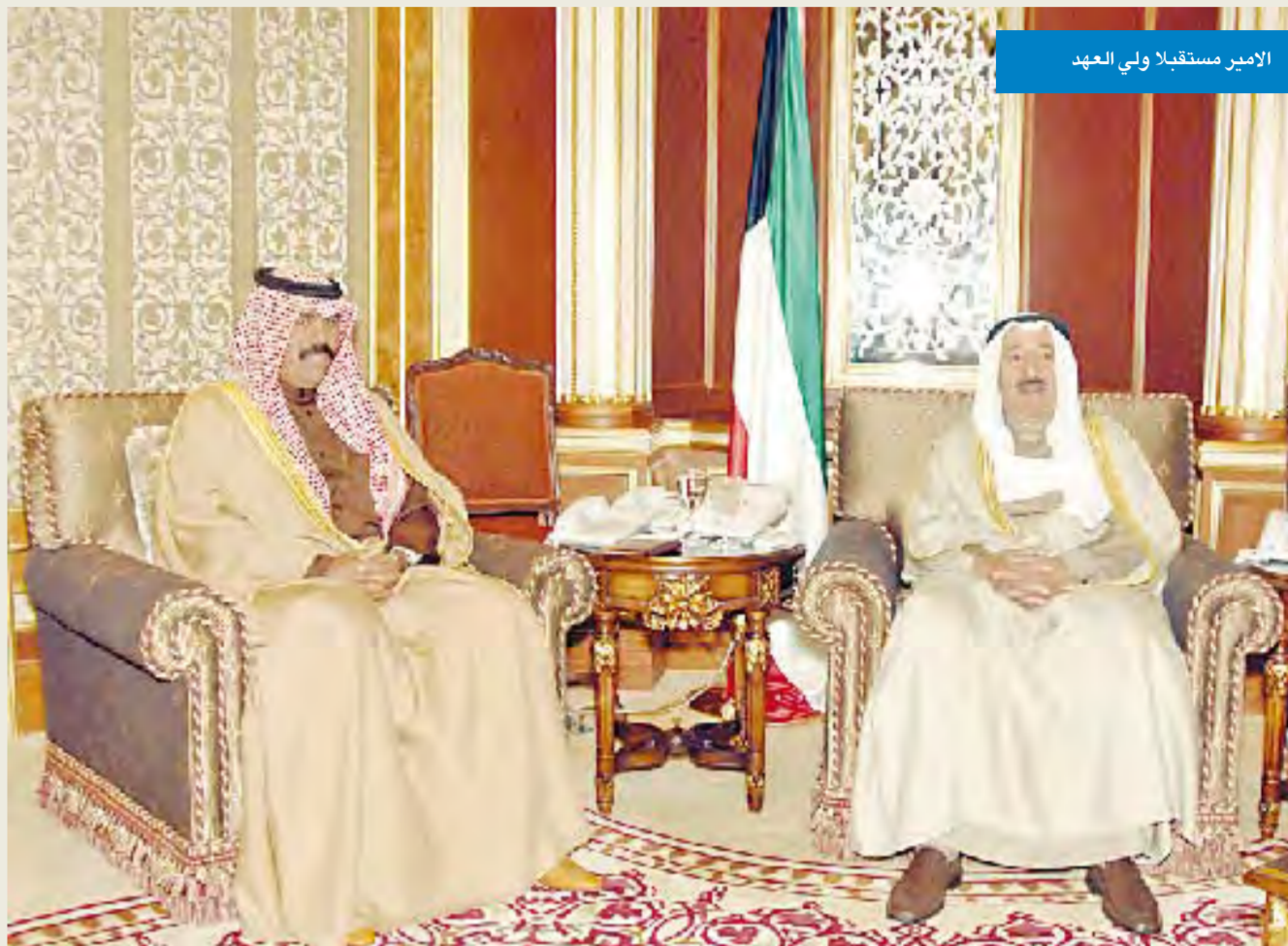
الأمير مستقبلا ولي العهد

الصباح ونائب وزير شؤون الديوان الأميري الشيخ علي الجراح ومدير مكتب سمو أمير البلاد أحمد فهد الفهد والسفير أحمد خالد الكليب ومدير مكتب نائب رئيس مجلس الوزراء وزير الخارجية الشيخ الدكتور أحمد ناصر المحمد الاحمد الصباح.