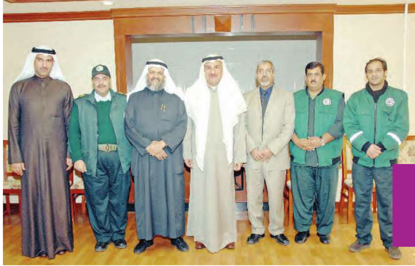
لقطة تضم فريق الطوارئ وأعضاء الكلية