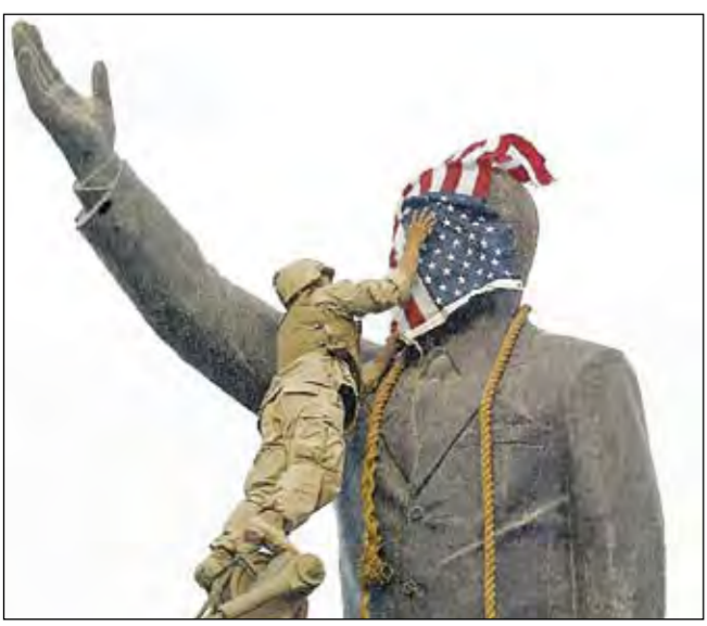
صدام... تمثالا سرعان ما سقط أمام الأميركيين

أخيرا، تجدر الإشارة إلى دعم المحافظين الجدد قبل الحرب لأحمد الجلبى، المنفي العراقي العديم الضمير الذي ترأس المؤتمر الوطني العراقي، لقد دعموا الجلبى لأنه أسس صلات وثيقة مع المجموعات الأميركية - اليهودية وتعهد بتعزيز العلاقات الجديدة مع إسرائيل عندما يمتلك زمام السلطة، كان هذا بالضبط ما أراد إسرائيل، منحتة لقب «رجل العام» في 2003.