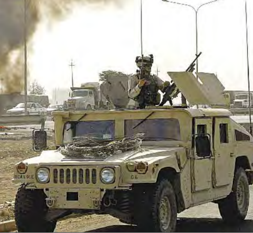
سقوط بغداد كان أول مشاهد حلم بوش لتغيير الشرق الأوسط