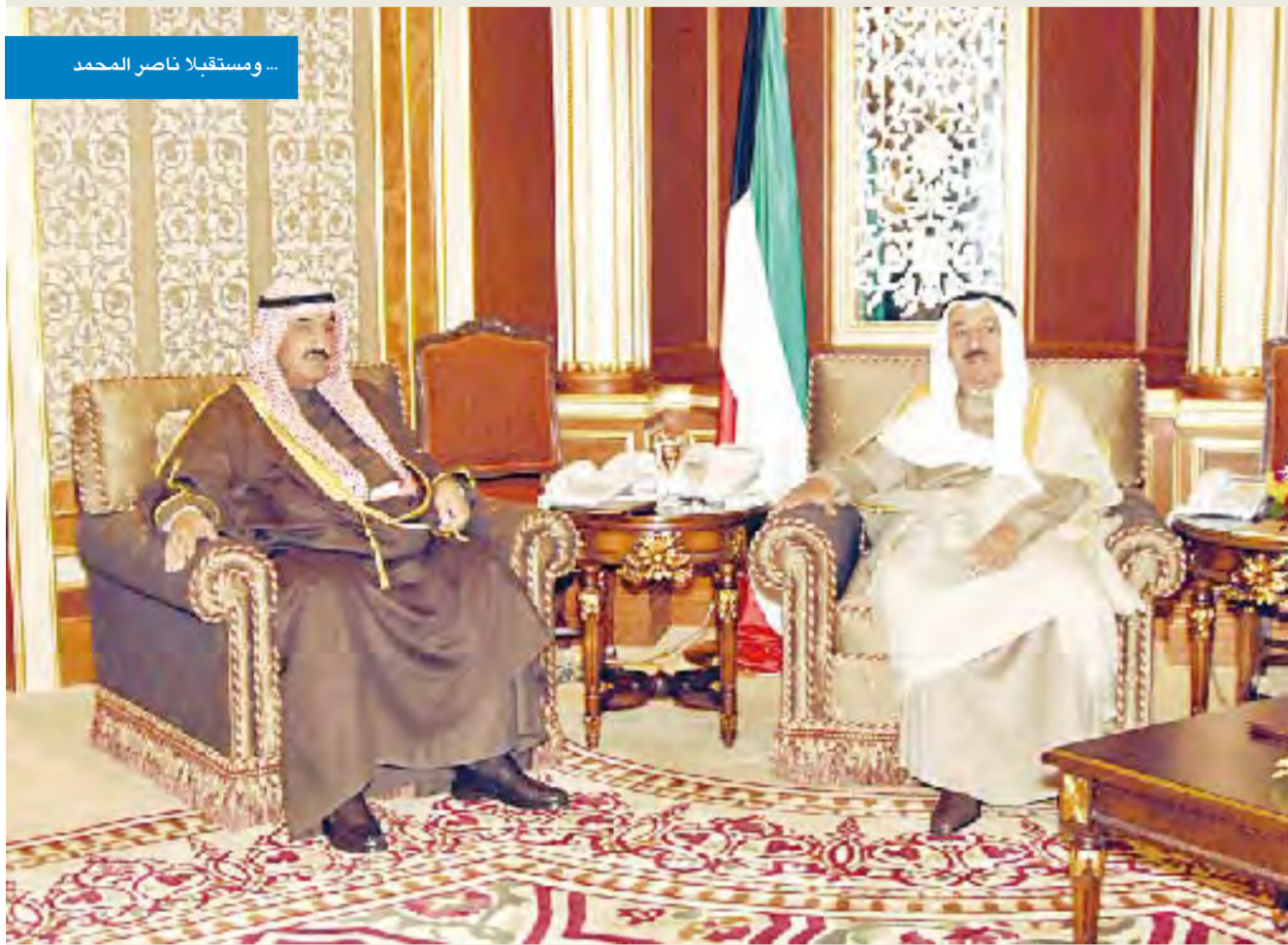
... واستقبلا ناصر المحمد

سموه استقبل ولي العهد ورئيس الوزراء وعمرو موسى