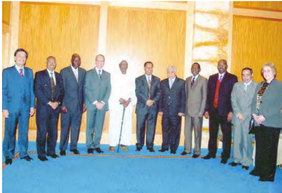
السفير السوداني يتوسط المدعوين

أقام عميد السلك الدبلوماسي بالإنابة عبدالقادر أمين حفل عشاء على شرف سفير جمهورية السودان يوسف فضل احمد، في فندق جي دبليو ماريوت، وذلك بمناسبة انتهاء مهام عمله في دولة الكويت. حضر الحفل مندوب عن المراسم في وزارة الخارجية والبعثات الدبلوماسية والسلك الدبلوماسي. وفي ختام الحفل قدم عبدالقادر أمين هدية تذكارية باسم الدبلوماسيين، للسفير السوداني يوسف فضل احمد.