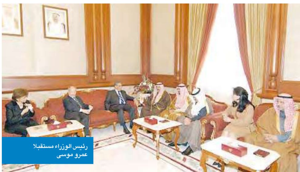
رئيس الوزراء مستقبلا عمرو موسى