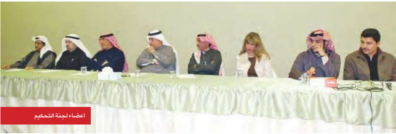
أعضاء لجنة التحكيم

أعلن مدير مهرجان محمد عبدالمحسن الخرافي للإبداع المسرحي الدكتور نبيل الفيكاوي المكرمين في الدورة الخامسة وهم: الرائد المسرحي الراحل محمد النشئي، والرائد المسرحي صقر الرشود، والفنانة الرائدة المرحومة مريم الغضبان، والفنانة القديرة سعاد عبدالله، والفنان الكبير علي البريكي، والفنان الكبير جاسم الصالح.