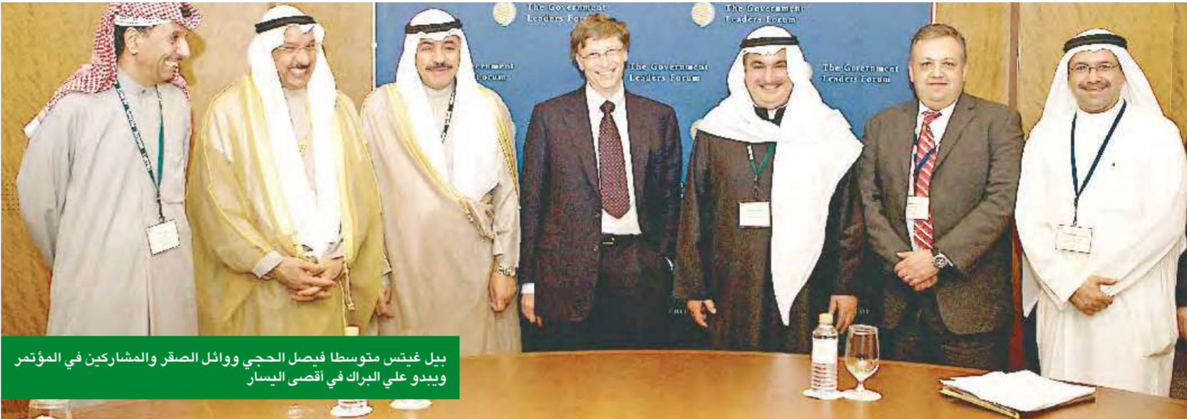
بيل غيتس متوسلاً فيصل الحجى ووائل الصقر والمشاركين في المؤتمر ويبدو علي البراك في أقصى اليسار

الصقر: التعاون بين الحكومة و«مايكروسوفت» يدفع عجلة التطور الاقتصادي والمعرفي ويعزز تنافسية الكويت في المنطقة